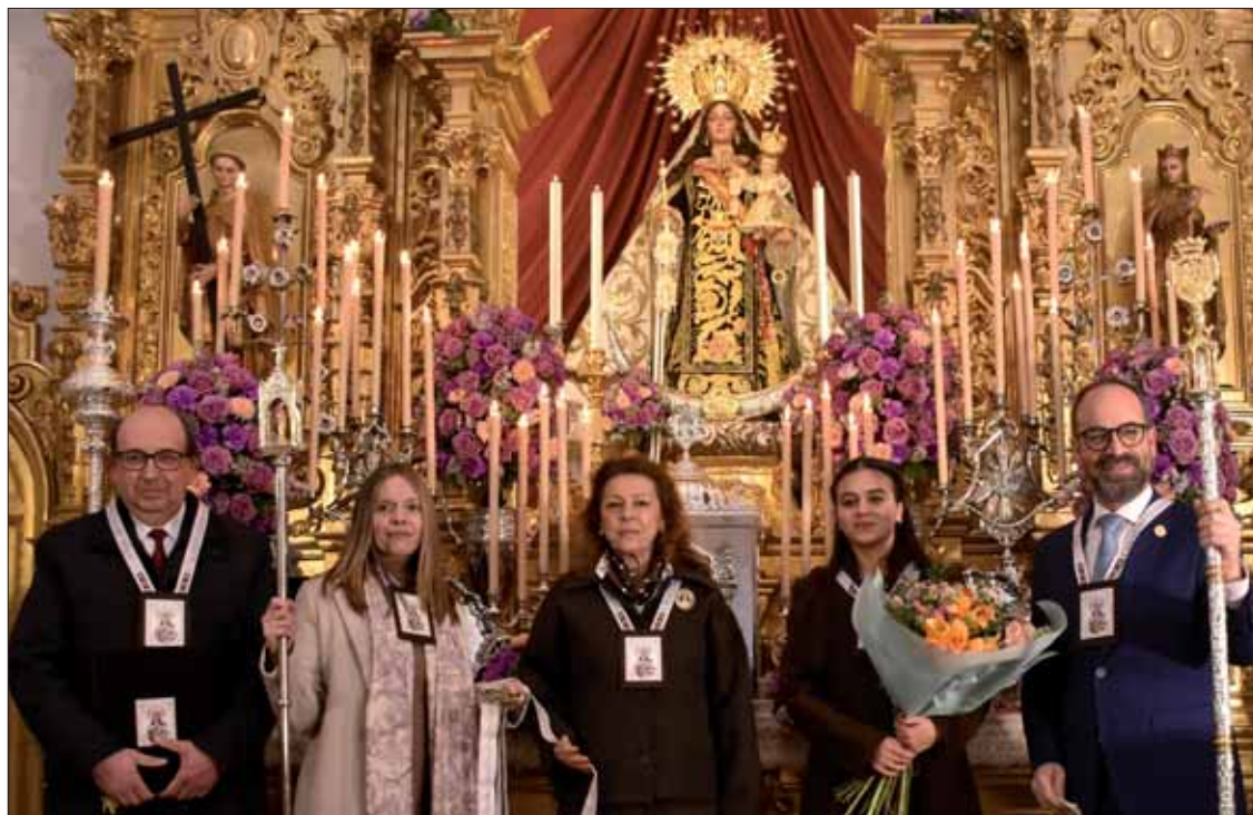
La presidenta de la archicofradía, junto a los protagonistas de las fiestas ante la Virgen

Todas las personas elegidas son conocidas por su gran devoción carmelitana