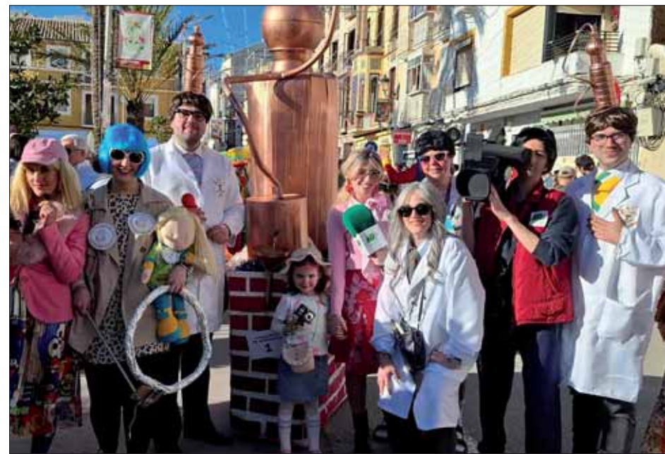
La destilería de “Anís el Rayente” logró el premio al mejor difraz de grupo/MM

Caída ya la noche, en complicidad con el luto sugerido para la ocasión, el sepelio recorrería las estaciones de Penitencia repartidas en forma de bares por la carretera oficial en dirección al