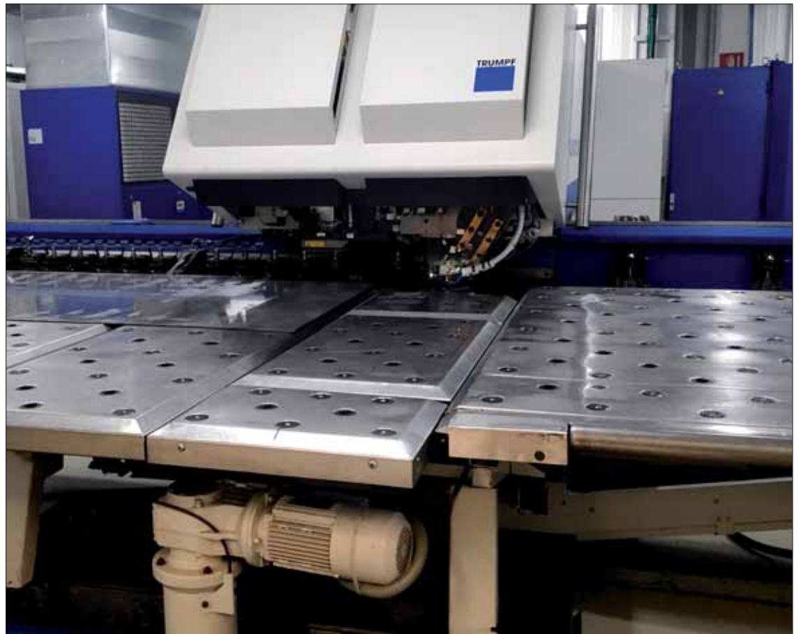
Cruzber cuenta con una tecnología de corte por láser para mejorar la eficiencia energética/EC

En cuanto a las líneas de producto, la categoría de Vehículos Comerciales Ligeros (LCV) ha vuelto a imponerse a la de turismos, representando el 56% de la facturación total tras crecer un 10% en el último año. No obstante, la categoría de turismos (PC) también mostró un desempeño positivo con un aumento del 6%. Por productos específicos, las barras de techo siguen siendo la principal fuente de ingresos con un 33%, aunque la categoría de cofres y maletas registró el mayor repunte de ventas con un crecimiento superior al 15%. Además, la apuesta por la venta directa al consumidor (DTC) a través de sus marcas CRUZ y FIRRAK ya supone el