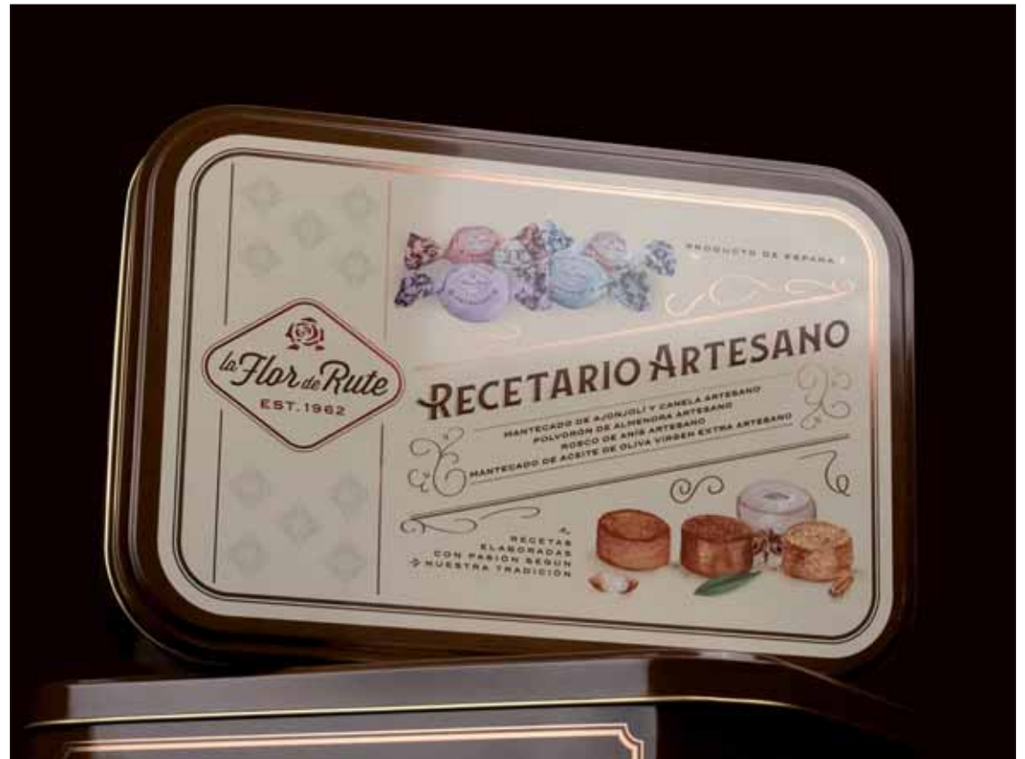
El diseño final aúna la calidad tradicional de estos dulces con una presentación atractiva

pleta con un logotipo de inspiración antigua, de trazo elegante, enriquecido con detalles en grabado metalizado color cobre. Estos elementos, presentes tanto en el papel como en el metal aportan sofisticación y a la vez invitan al consumidor a reutilizar el envase en casa. De esta