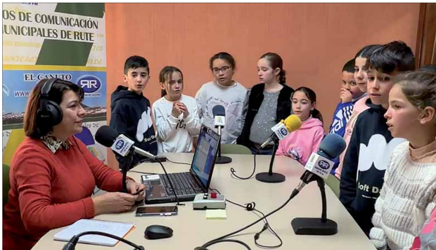
Todo el alumnado de cuarto de Primaria participó en el programa y la canción conjunta/FP

La iniciativa se enmarca en el proyecto curricular FuturPinos, para apoyarse en otros formatos de aprendizaje