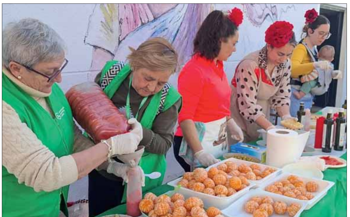
La AECC han agradecido la colaboración de las madres y los colegios/MM

seguir un patrón de desayuno saludable tiene un impacto significativo en la salud a largo plazo, pudiendo prevenir casi una quinta parte (18%) de los diagnósticos de cáncer, lo que equivale a la prevención de