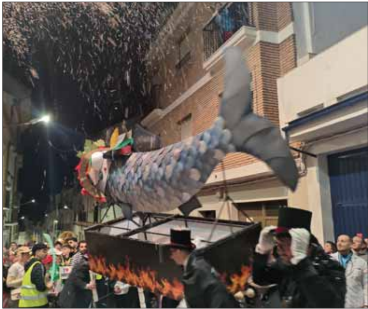
La sardina ha sobresalido por el diseño de Víctor Pacheco/F. Aroca