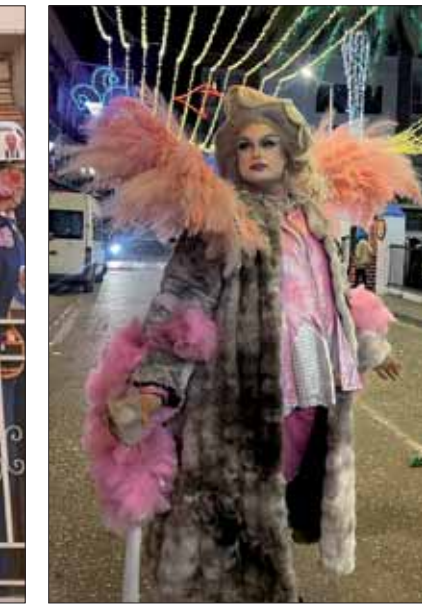
La reina del Carnaval/EC