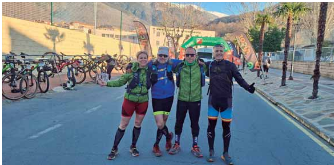
La compenetración entre los miembros del equipo ha sido clave para revalidar el subcampeonato/EC

El centro neurálgico de la prueba estaba en en Jarandilla de la Vera, aunque también se recorrieron otros términos municipales como Guijo de Santa Bárbara, Losar de la Vera y la zona de Cuacos de Yuste. Como en todo raid, los deportistas gozaban de "completa autonomía" para gestionar su propia ruta, eso sí, va-