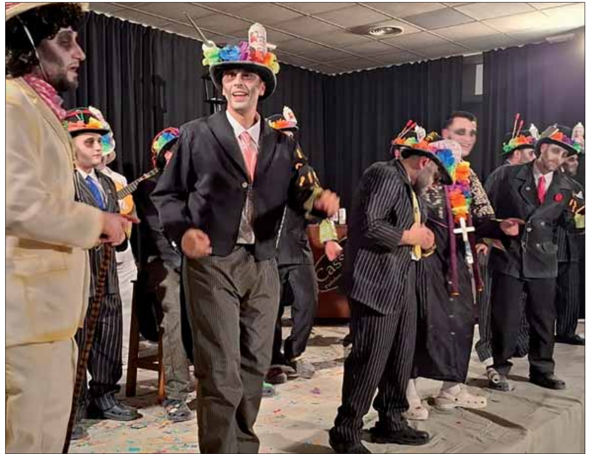
La murga "Hasta aquí hemos llegao" durante su actuación

En el certamen de agrupaciones, como teloneros actuó una de las murgas callejeras destacadas del carnaval de este año, "Dojo Kai Cobra"