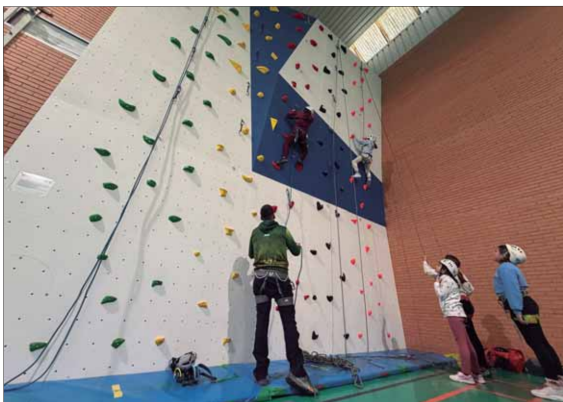
La instalación cuenta con un sistema de presas intercambiables para adaptar la exigencia física y técnica/FP

A diferencia del rocódromo de parque, que destaca por su "imitación" de la roca, éste es más versátil al disponer de numerosos puntos de anclaje que facilitan ese cambio de las presas. Es así como se juega con el tamaño de los agarres para crear diferentes grados de dificultad. Esta configuración resulta ideal para las sesiones de las escuelas deportivas, donde entrenan varios alum-