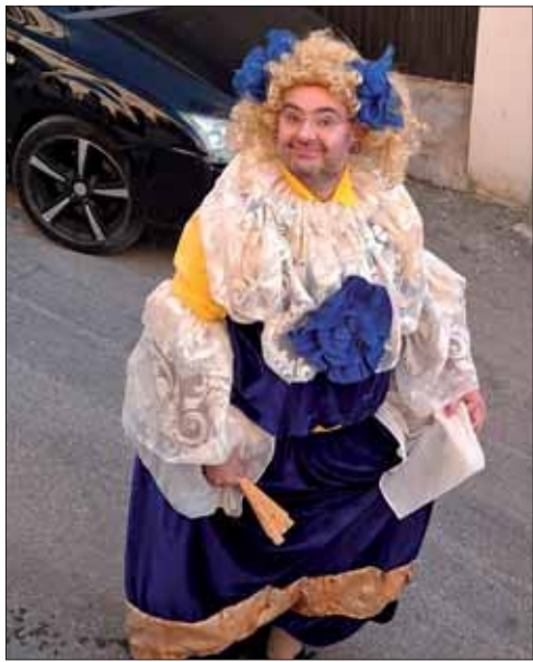
Una "menina" hallada en Rute/MM

mente limitada, la capacidad crítica y creativa de la ciudadanía dio para repasar la inmensa cantidad de guerras, conflictos e invasiones que hay por todo el planeta. En las calles de Rute se pidió desde el fin del genocidio contra el pueblo palestino a la cancelación de los aranceles de Estados Unidos. Incluso hubo quien aguzó ese ingenio para extrapolar la temática militar a la actualidad más reciente, con unidades del ejército dedicadas expresamente a incentivar o detener la lluvia. Y para dar cuenta de todo, no faltaron corresponsales de guerra que respaldaron el trabajo de los medios locales.