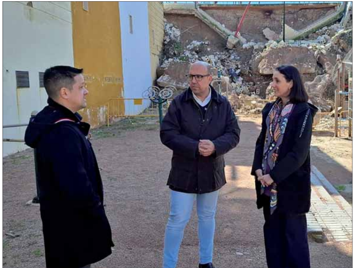
La representante de la Diputación junto al alcalde y teniente de alcalde en en uno de los puntos afectados

El alcalde, asegura que "el ayuntamiento no dispone de re-