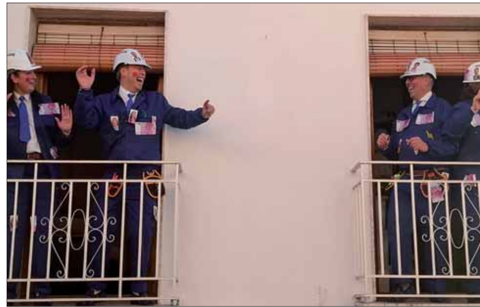
La chirigota virtual de “Los currantes” se hizo real el Domingo de Piñata/MM

crematorio de la calle Málaga. Por medio, un pregón y una petalada de confeti al ritmo de las marchas procesionales de la charanga “Los Pinonos”, que habían dado el relevo a “Silosé Novengo”. Y acompañando, decenas de dolientes que, parece que definitivamente, han dejado atrás las planideras de antaño para hacer los coros a las charangas con las saetas de sus cantos y coros.