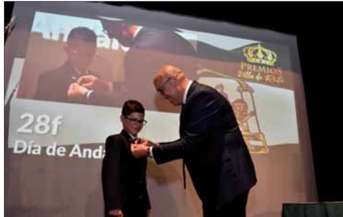
El alcalde impone la insignia al nuevo miembro de la banda/FP

El alcalde habló del "sentimiento colectivo" y del espíritu de "un pueblo que no olvida de donde viene". Igualmente, aprovechó para felicitar a los premiados asegurando que son "los que hacen grande nuestra tierra, y nuestro pueblo". Tras su intervención final, el acto concluyó con una interpretación a guitarra del Himno de Andalucía, cerrando el acto bajo el grito de "¡Viva Rute y Viva Andalucía!". La jornada continuó en fuera del centro cultural con las actividades lúdicas y festivas programadas, en el Paseo Francisco Salto y un tren turístico que recorrió las calles del pueblo.