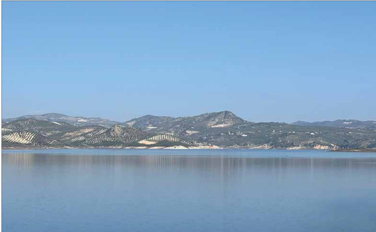
La acumulación de precipitaciones se nota más si cabe en los niveles del Pantano de Iznájar/Diego Román

Antes de llegar a la mitad del año agrícola se ha superado con creces la media histórica de precipitaciones en Rute