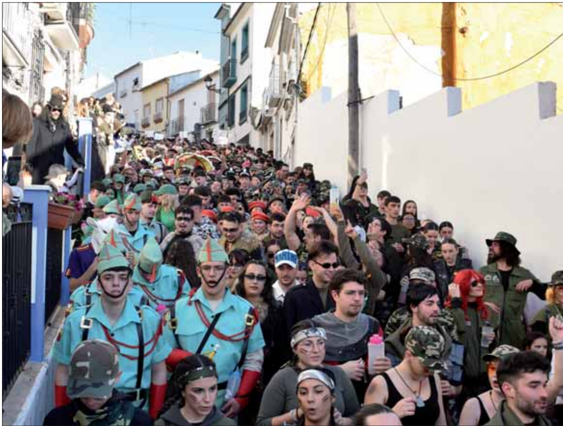
Junto a las parodias del ejército proliferaron los disfraces reivindicativos del pacifismo/FP

La imaginación del público a la hora de disfrazarse no sólo quedó de manifiesto en uno de los tres pasacalles, el temático de las Fuerzas Armadas, sino en el previo del Entierro de la Sardina y en el colofón del Domingo de Piñata. Ingenio, humor, crítica y un punto de irreverencia han marcado la puesta en escena en las calles ruteñas de una de las manifestaciones culturales y sociales más identificativas de la localidad