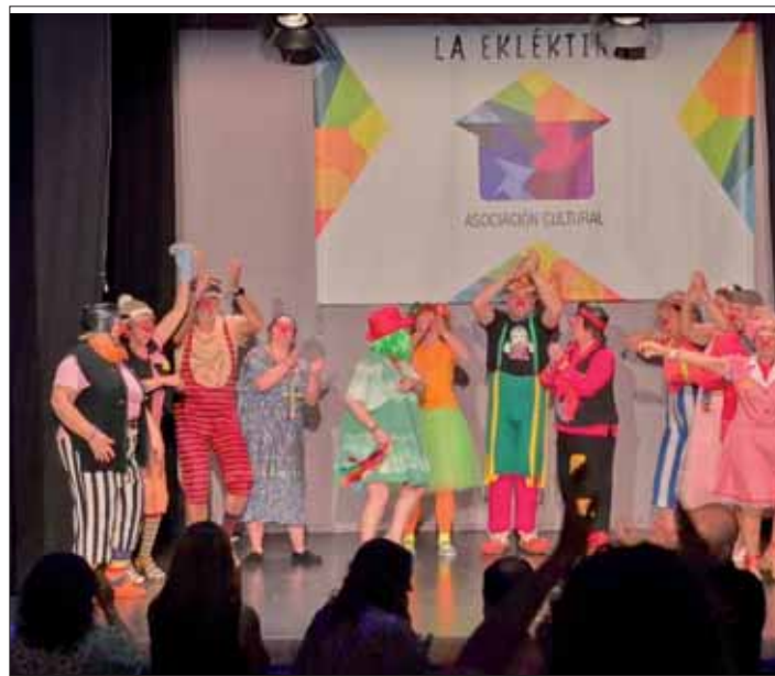
Durante la celebración del aniversario hubo actuaciones teatrales