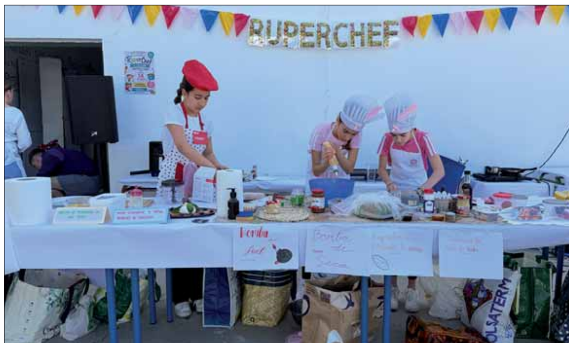
el alumnado demostró su creatividad para innovar a partir de una cocina sana y tradicional/FP

Como de costumbre, el jurado encargado de evaluar los platos estaba formado por cocineros locales. Asimismo, en esta ocasión