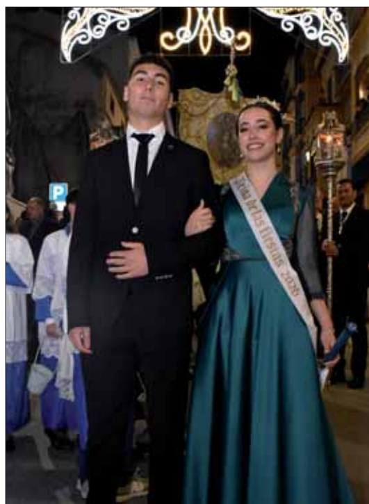
Reina juvenil durante la noche