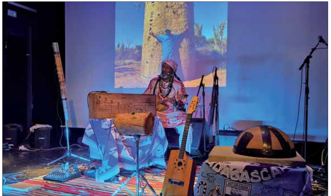
Kilema fue una de las actuaciones destacadas del fin de semana