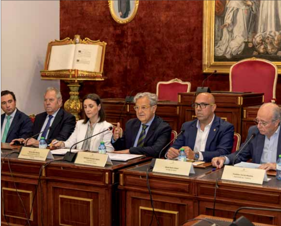
La firma del acuerdo de compra-venta tuvo lugar en el Palacio de la Merced

Proquisur incorpora dos mil quinientos metros, mientras que los tres mil cien de Indusmetal Torres facilitarán su expansión