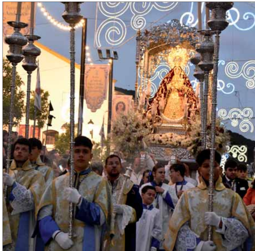
La procesión de la noche tuvo el habitual tono solemne que la caracteriza/FP