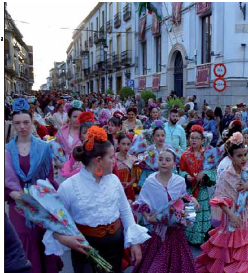
La ofrenda de flores convirtió de nuevo las calles de Rute en una riada humana

truenos. En mayo en Rute se escuchan atronar los cohetes y los vivas a la Morenita, los coros romeros que rezan cantando, que cantan rezando, desde la bajada del altar, cuando la Virgen de la Cabeza se entrega al pueblo. Y, cómo no, se escuchan los himnos atemporales de la Banda Municipal, la música hecha memoria colectiva.