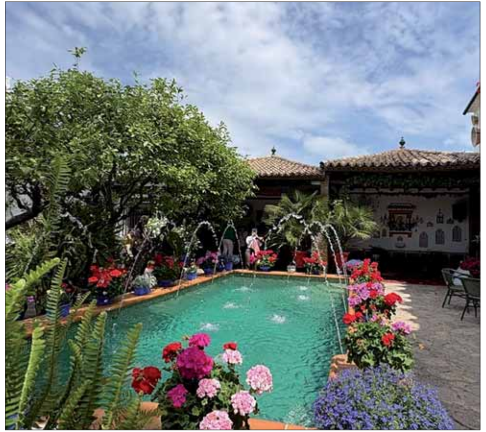
El Patio con Duende se encuentra en la calle Teresa Córdoba de Rute/EC