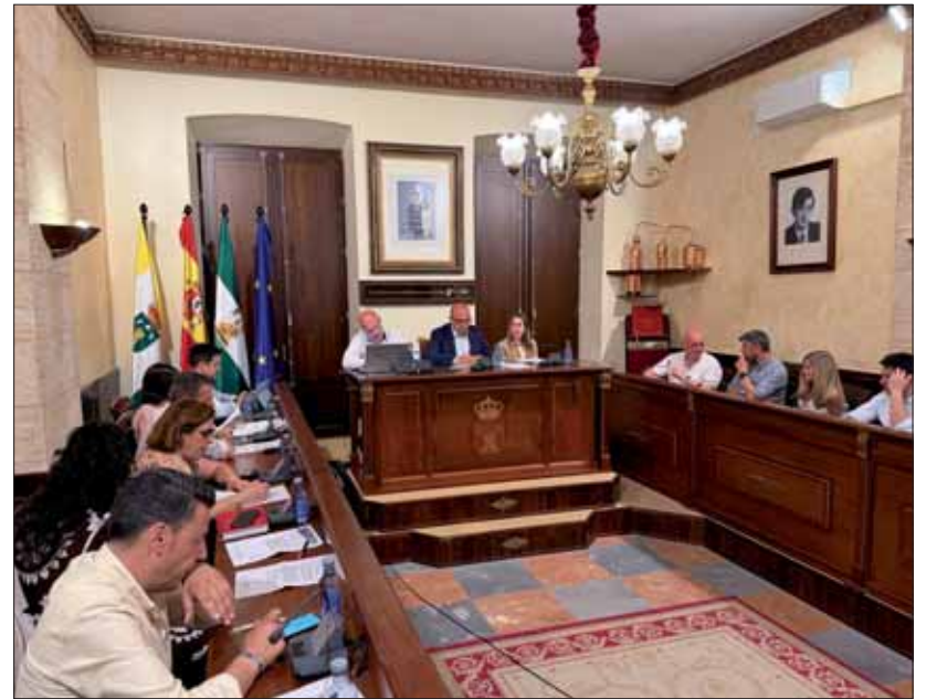
Dado su carácter ordinario, la sesión incluyó un turno de ruegos y preguntas/FP

adelantó que dicha fase ya está adjudicada a una empresa de Rute y comenzará presumiblemente en el segundo semestre de este año.