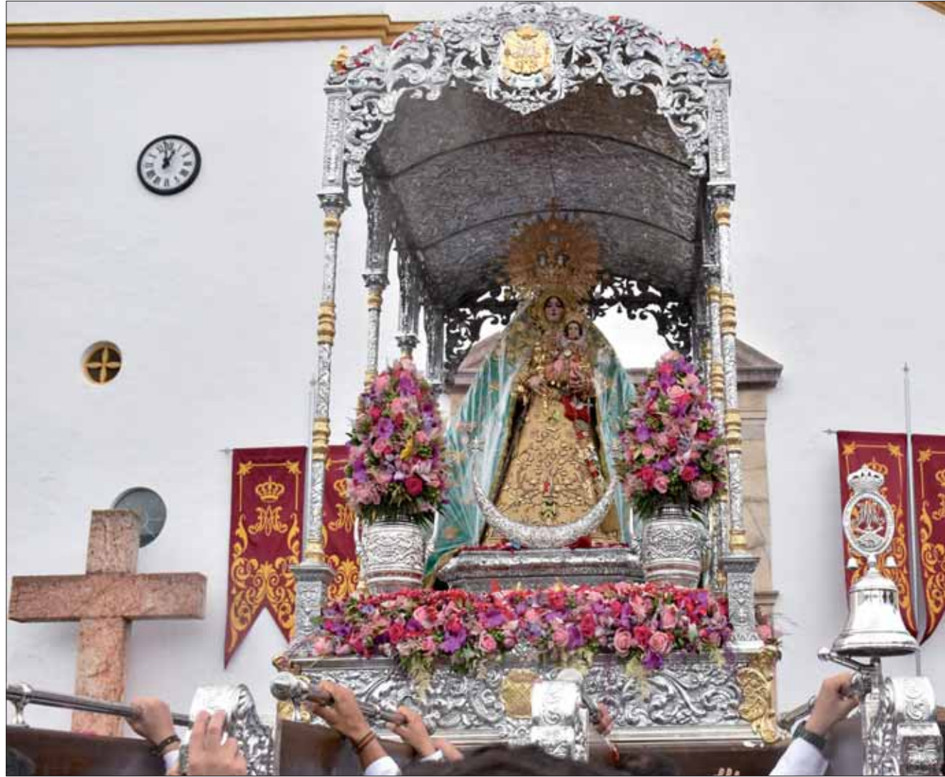
La lluvia obligó a recortar la romería urbana para cantar a la Virgen de la Cabeza en San Francisco

Y además, en Rute siempre llueve en mayo. A veces, sólo a veces, es agua de la lluvia. El resto, eternamente, son petaladas de fervor, sobre todo en la romería urbana de la mañana. A veces, sólo a veces, las tormentas traen