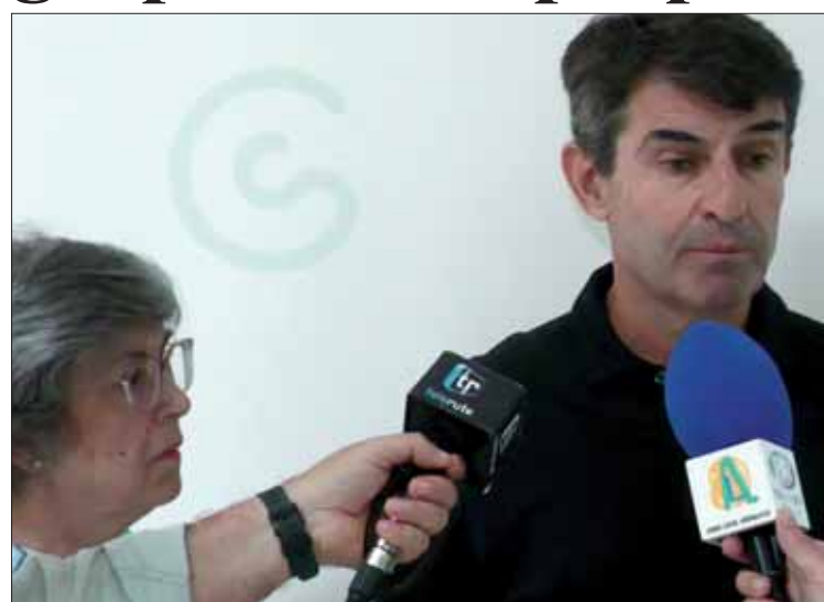
La presidenta y uno de los psicólogos presentando los grupos de terapia/MM