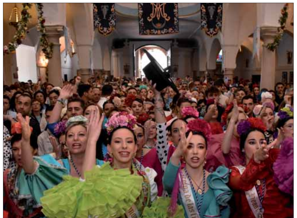
Máximo fervor y expectación justo antes de la bajada de la Morenita/FP