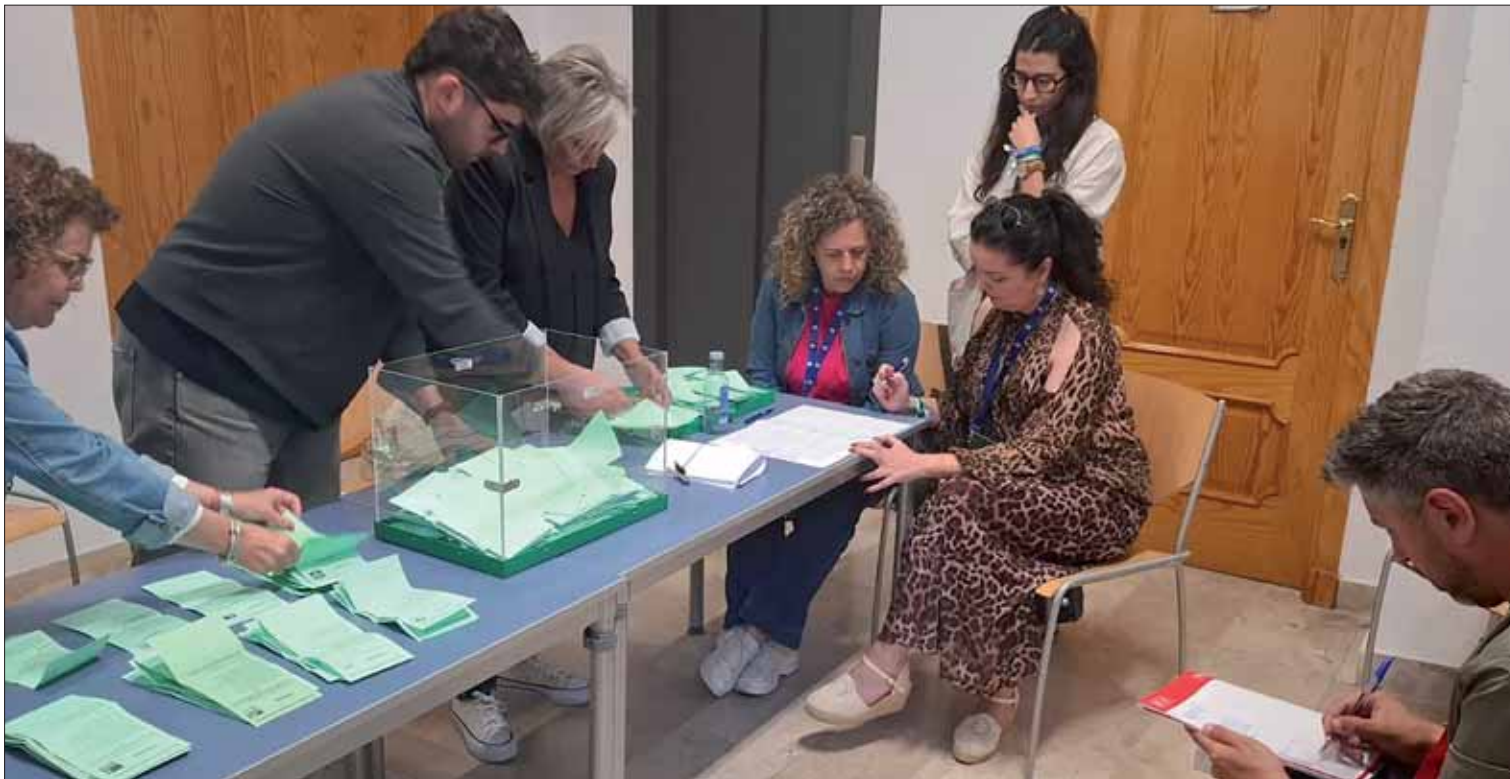
El PP ha sumado más de la mitad de los votos totales tras ganar en las doce mesas del municipio

Los populares obtienen 2.578 votos, un 50,25% de los emitidos, y amplían la brecha con el PSOE, segunda fuerza más votada, respecto a los comicios de 2022