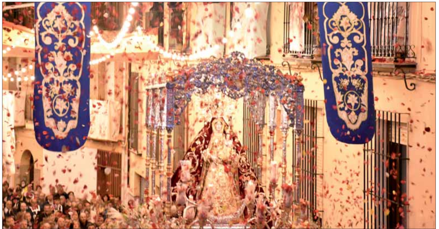
Monumental petalada por la noche en la calle Colón