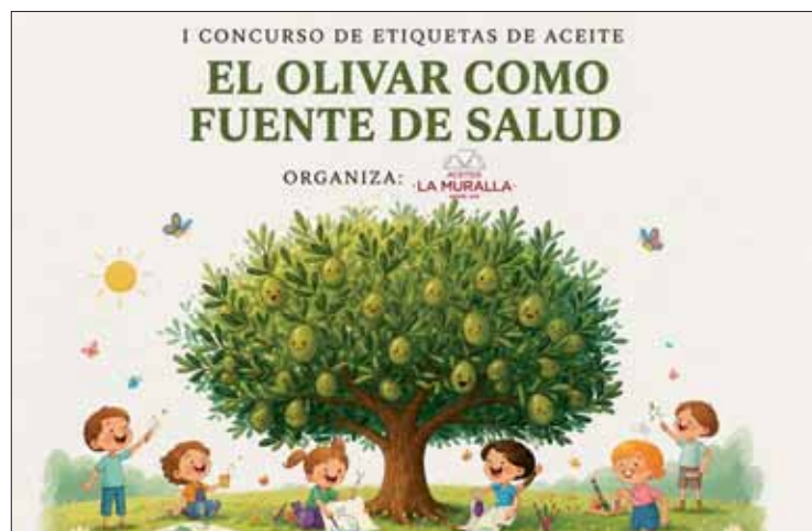
La convocatoria estaba dirigida a escolares de Rute y sus aldeas

El dibujo ganador será adaptado posteriormente a la etiqueta real, que incluirá el logo de la marca, el de la AECC y el nombre del autor. Este nombre se dará a conocer el 9 de junio, coincidiendo con la segunda edición de las jornadas Gastro Rute. Allí se presentará el diseño. Asimismo, el ganador recibirá un cheque de