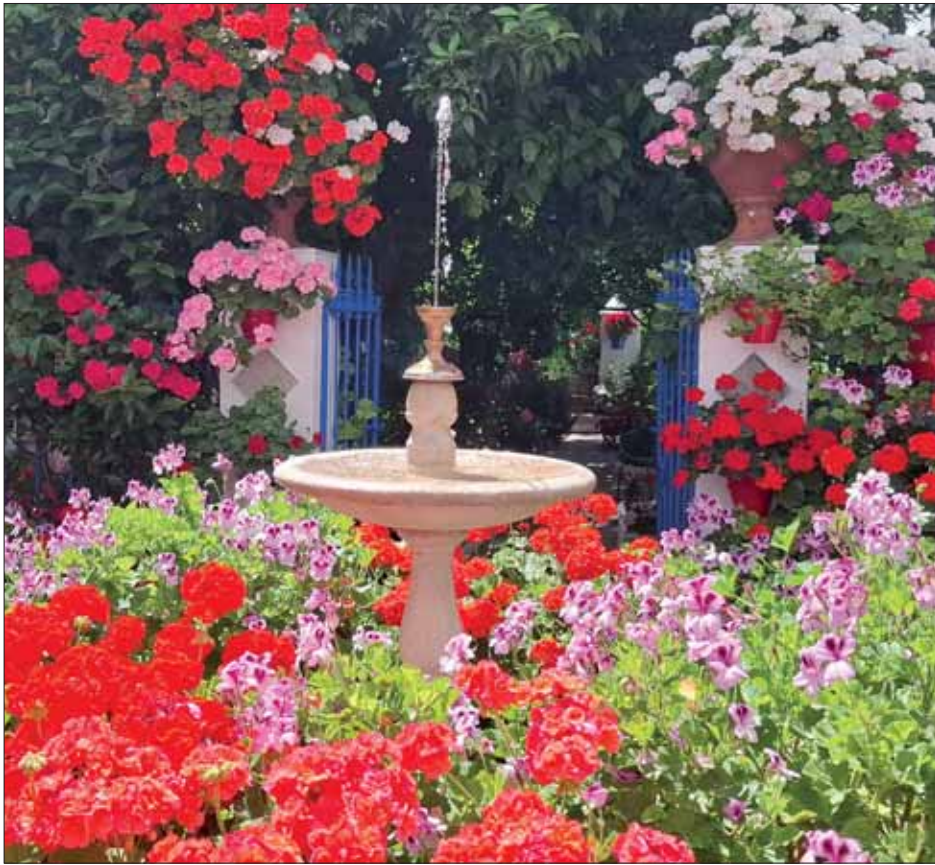
El Patio de Aurora Sánchez incluye un patio tradicional y un jardín nazari/MM

El Patio de Aurora Sánchez se corona con el primer premio del concurso provincial y el Patio con Duende obtiene un reconocimiento especial y el oro en el comarcal