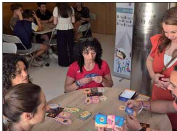
Las jornadas conmemorativas incluyeron juegos de mesa/EC