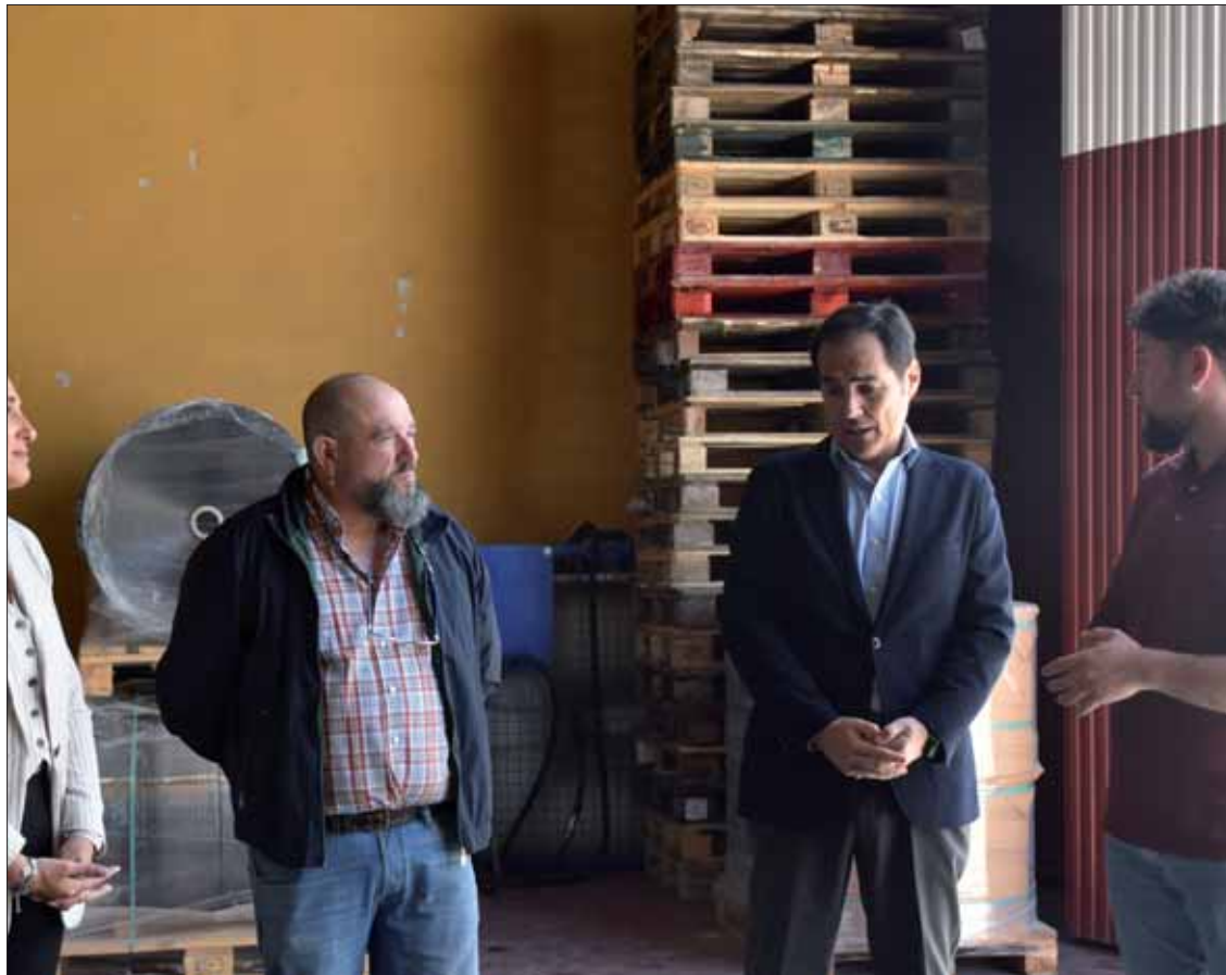
El consejero andaluz visitó las instalaciones acompañado de las autoridades locales y de miembros de la plantilla/MM

Para el consejero es una satisfacción comprobar como este tipo de empresas familiares no dejan de crecer, generan empleo y se convierten en referentes en su sector