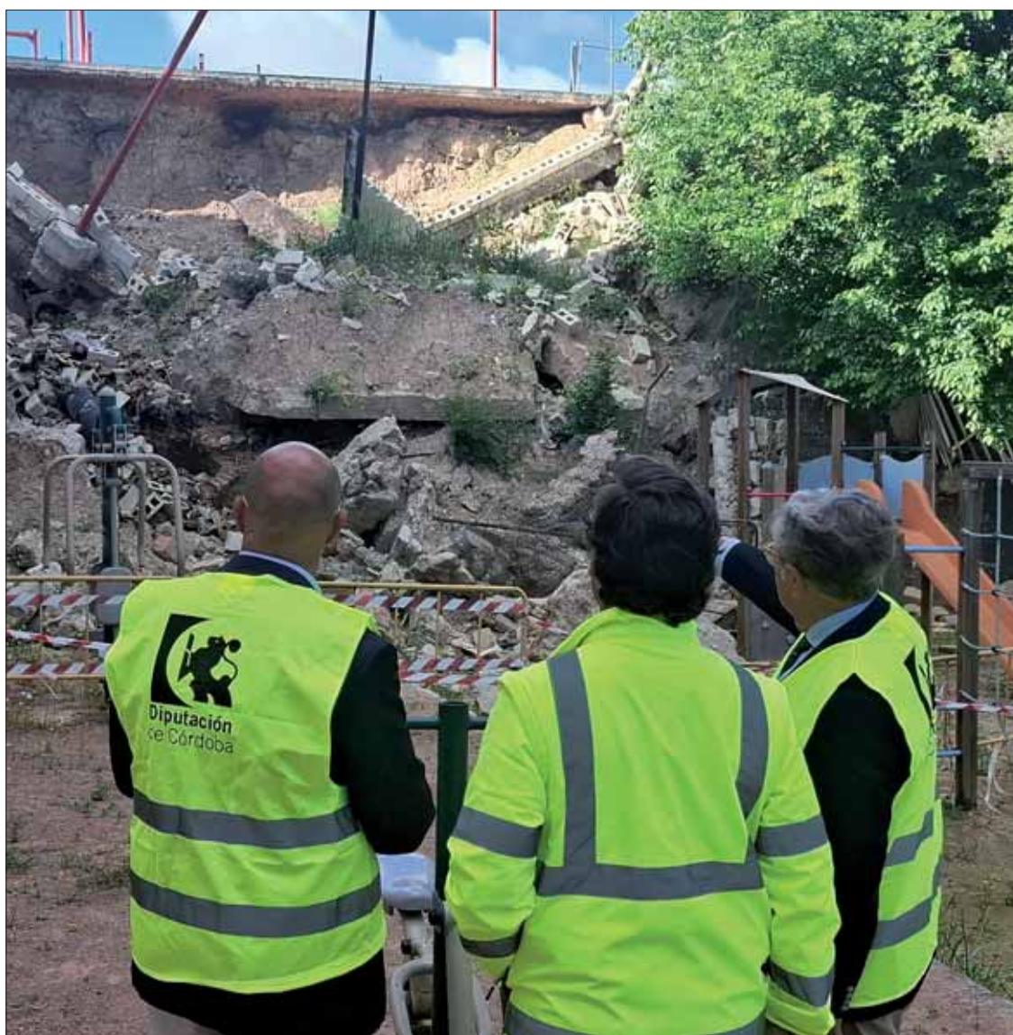
El presidente de la Diputación, el alcalde y el ingeniero junto al muro

yecto definitivo se ultimará durante el mes de junio tras descartarse la necesidad de realizar pilotajes, ya que la obra podrá anclarse de forma segura a unos tres metros de profundidad. Al tramitarse por la vía de urgencia, los periodos de licitación se reducirán al mínimo, permitiendo que las obras arranquen a finales de junio o principios de julio. Con un plazo de ejecución de entre dos y tres meses, se prevé que para septiembre el muro esté completamente terminado y el parque totalmente restaurado empleando técnicas de fijación de última generación. No obstante, la prioridad absoluta e inmediata es desviar y atajar las filtraciones de agua actuales mediante un bypass o la solución técnica más