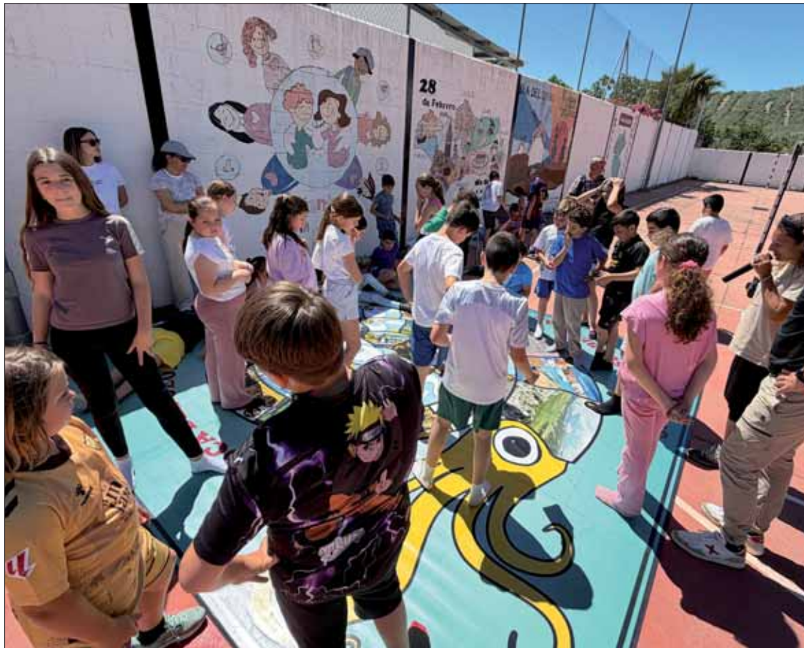
Los pequeños disfrutaron de una versión del juego de la oca tematizada en torno al geoparque/FP

Además de difundir el patrimonio geológico de la comarca, se ha elegido entre los escolares la mascota del proyecto