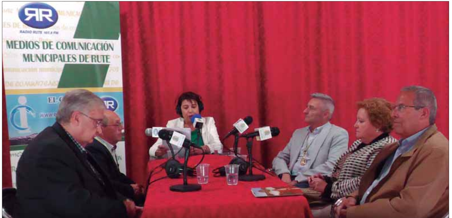
El espacio se estructuró en varias tertulias con diferentes invitados en cada una/FP

El programa abordó de modo más profundo la evolución de las fiestas en los últimos cuarenta años. No obstante, el primer blo-