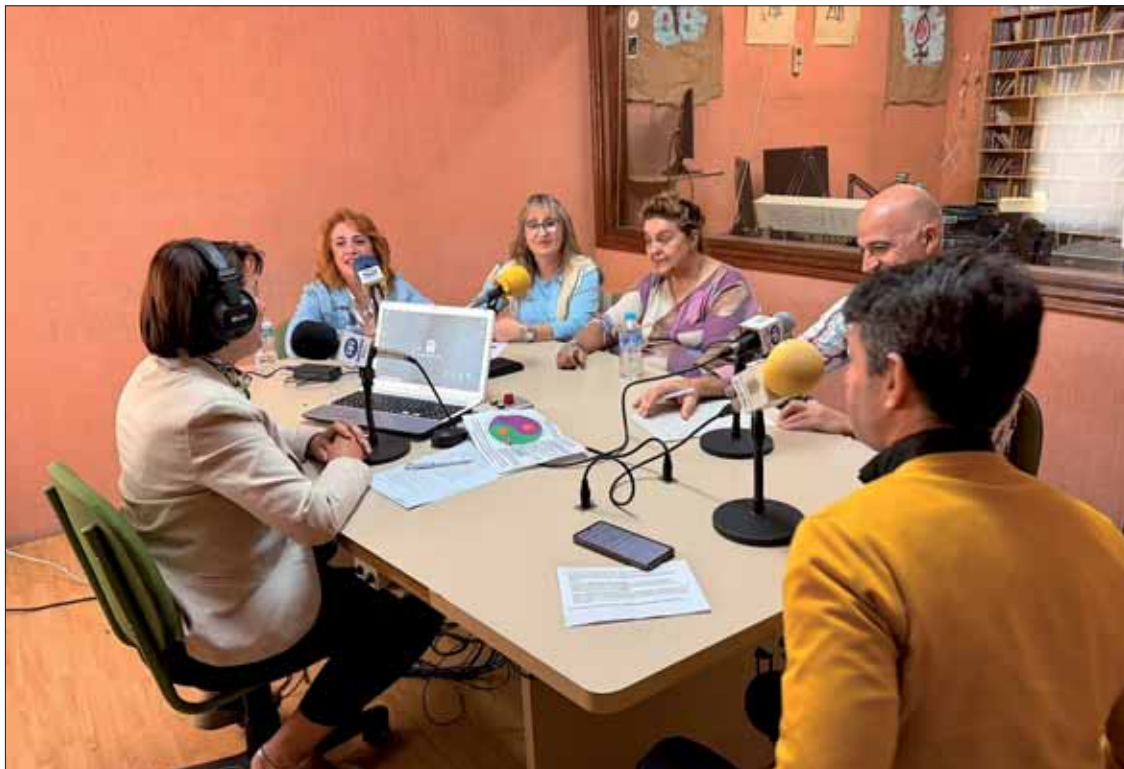
Las mujeres y los profesionales que participaron en el programa sobre la fibromialgia en Radio Rute/EC

Tres mujeres hablaron de su lucha contra el dolor, el cansancio y la incomprensión