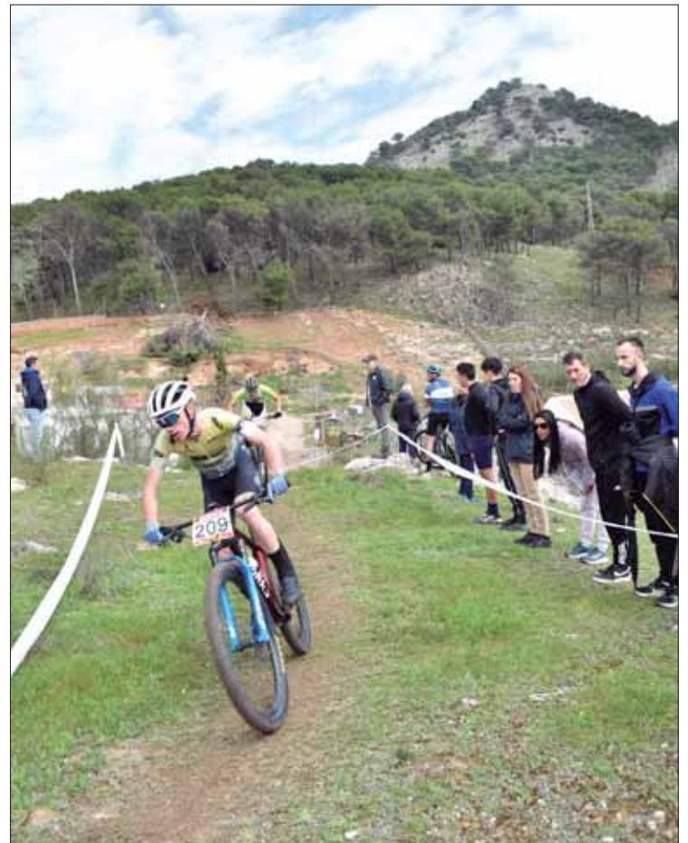
Aun con zonas restringidas, el circuito sigue siendo espectacular

Entre la participación destacaron las categorías inferiores, con unos noventa menores, donde estaban los integrantes locales de las Escuelas Deportivas Municipales. No en vano, uno de