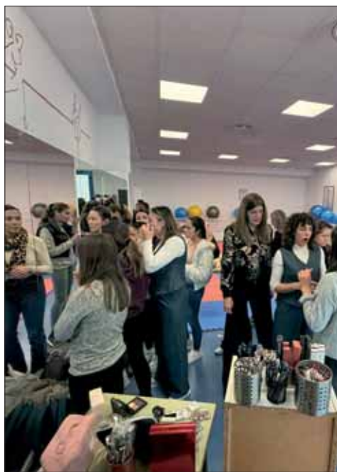
Las responsables del taller de autocuidado/FP