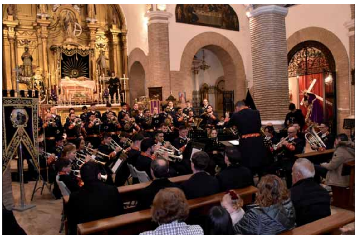
Junto a las tres marchas propias, la formación ha incorporado dos novedades/FP

La agrupación ha cerrado una agenda de contratos que los llevará a tocar en parte de la geografía andaluza. Además de sus actuaciones en Rute, el Viernes Santo y el Domingo de Resurrección, se desplazarán a localidades como San Fernando, Vélez-Málaga o Casariche. La presidenta mostró su confianza en que la meteorología sea favorable para que los pasos puedan lucirse donde les gusta, “en la calle”.