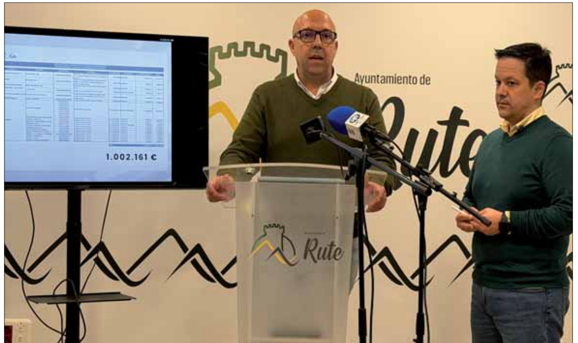
Los representantes públicos destacaron el trabajo técnico para canalizar todas las subvenciones/FP

García señaló que entre los daños más notorios está el desprendimiento de la cubierta del CEMAC Pintor Pedro Roldán, en la zona de los camerinos. También mencionó el deterioro del paramento de hormigón en la tubería de La Hoz. Asimismo, la presión del agua ha afectado al