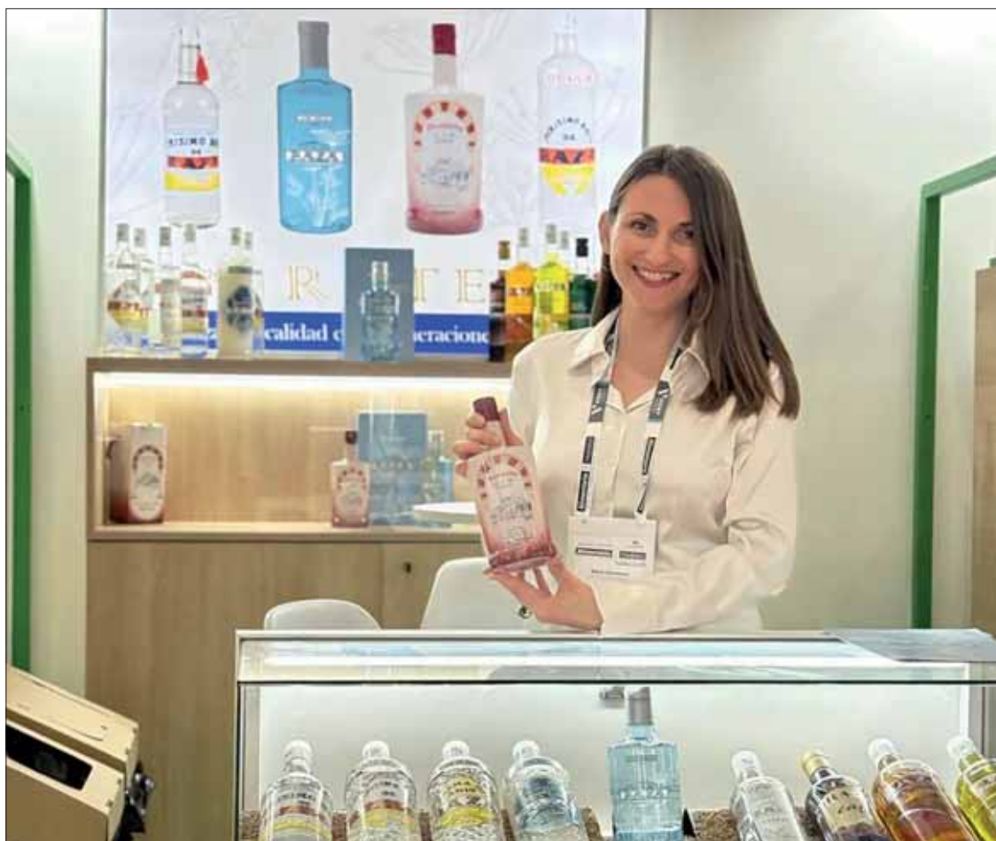
Empresas como Destilerías Raza llevan tiempo proyectándose más allá de nuestras fronteras

ción trasciende lo estrictamente comercial. La presencia de Galleros y Raza en un foro de estas dimensiones actúa como un potente motor de promoción para