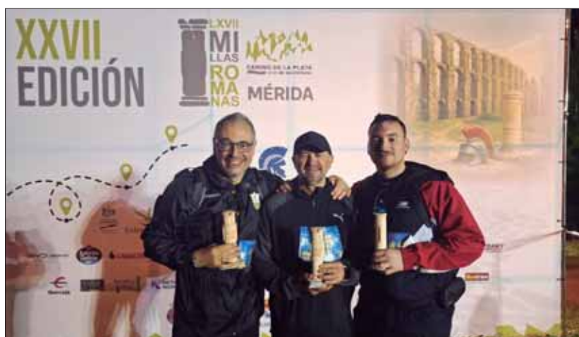
Los tres ruteños con la reproducción del miliario romano por haber terminado/EC

Por fortuna, pudo resistir hasta el kilómetro 60. En ese punto la organización había dispuesto una “bolsa de vida”, donde los participantes disponían