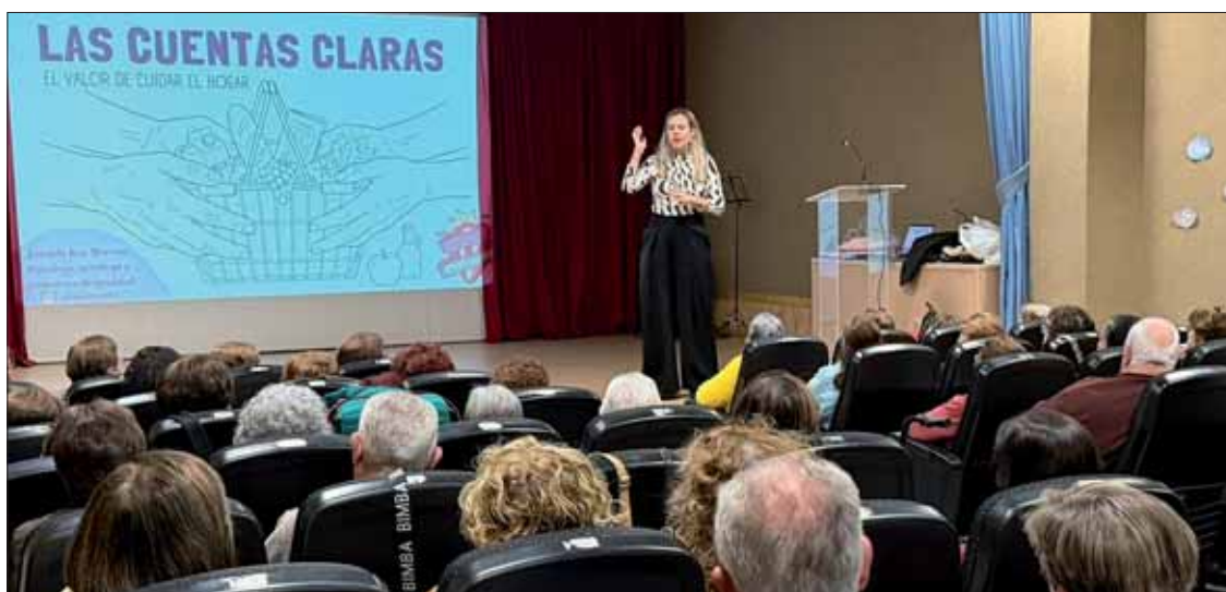
El alumnado del centro de adultos durante su bingo feminista