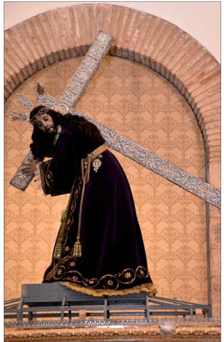
El Nazareno ya está sobre el trono para su salida del Viernes Santo

De igual modo, desde principios de la pasada década nuestra Semana Mayor se completa con la salida de Jesús Resucitado. En este tiempo, se ha consolidado