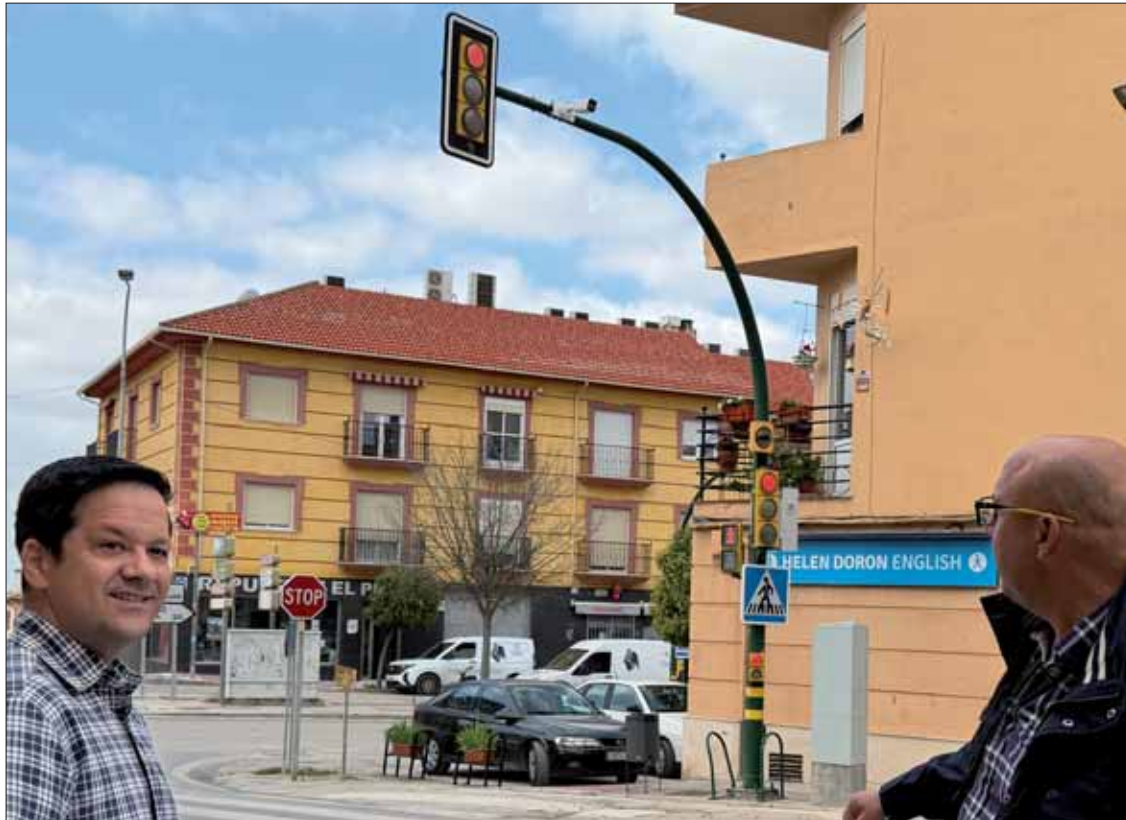
En cruces como el de Fuente del Moral con la travesía ya están las cámaras instaladas

El diseño del mapa de vigilancia ha contado con el asesoramiento técnico de la Policía Local para cubrir las zonas de mayor afluencia y los accesos.