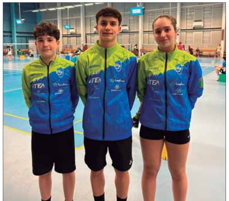
El club contó con tres representantes en este internacional/EC