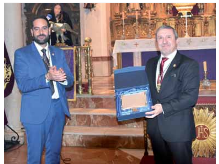
El presidente de la cofradía entregó un placa al presentador de la exaltadora

La exaltadora agradeció las “hermosas palabras” de su presentador y añadió que, a ambos, también les une su amor por la “Morenita” y su pasión por la música. Pues, según dijo “entre cuerdas y compases han ido afinando sus vidas”. De igual modo, entre peregrinaciones y ensayos, la pregonera y su presentador construyeron su historia dentro del mundo cofrade y recorrieron “cantando” caminos que “no se olvidan”. Fue, en esos momentos, cuando ella recordó a Soledad