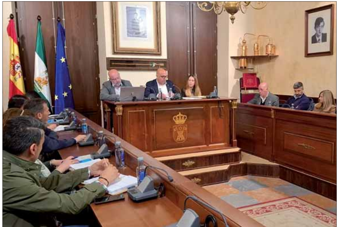
Un momento del pleno ordinario celebrado en el mes de marzo

Además, uno de los puntos de mayor preocupación para IU ha sido la situación medioambiental de la Sierra de Rute. La formación ha alertado sobre la caída masiva de pinos tras el temporal, lo que supone un grave peligro de cara a la temporada de incendios. En este sentido, han instado al In-