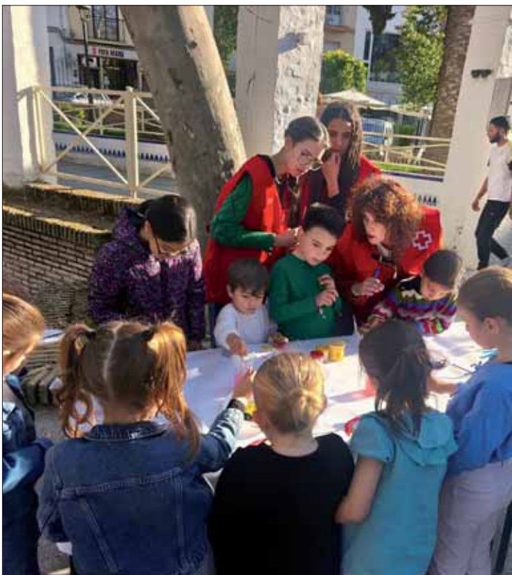
Las actividades de Cruz Roja cierran el marzo de las mujeres/EC

Finalmente, bajo el lema “Que lo haga no significa que quiera”, la Asamblea Local de Cruz Roja Rute, organizó el viernes 27 de marzo, en el Paseo Francisco Salto, una actividad con la que busco concienciar de la sobrecarga doméstica y familiar que padecen las mujeres. De esta forma durante todo el mes de marzo se han ido intercalando actividades lúcidas, de encuentro y culturales con otras de concienciación, formativas y más reivindicativas.