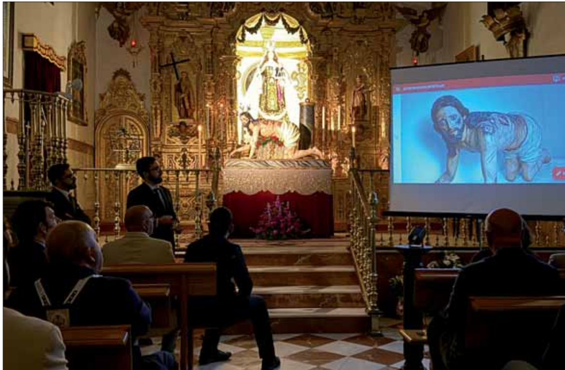
Los restauradores mostraron comparativas de la evolución de su trabajo

A esta fragilidad se sumaban antiguas intervenciones que ha-