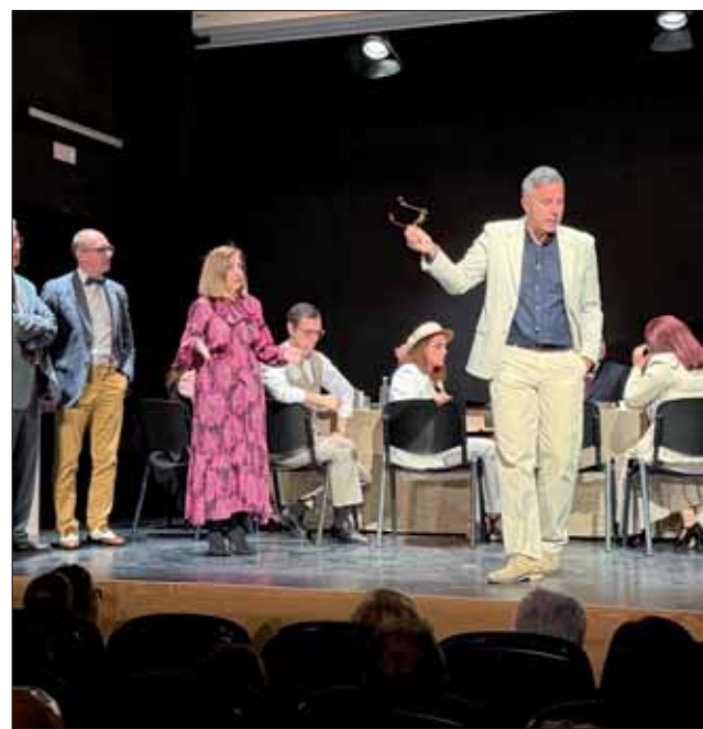
La obra del teatro "12 sin Piedad"/FP