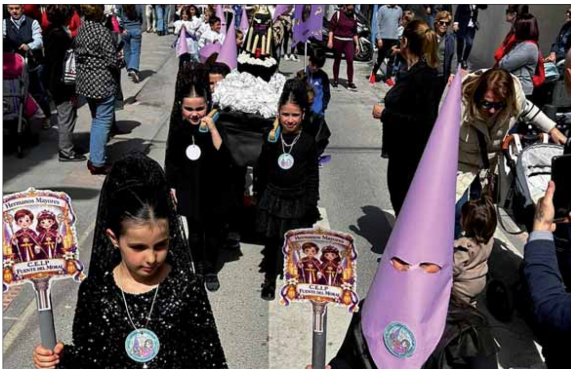
La iniciativa ha contado con la implicación de toda la comunidad educativa