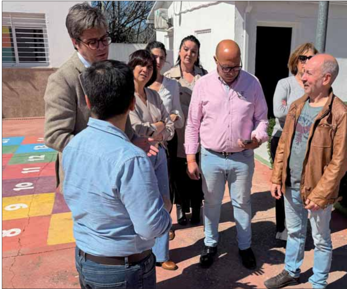
Con esta actuación, se facilita la movilidad del alumnado de Blas Infante/FP

La eliminación de barreras arquitectónicas ha costado sesenta mil euros financiados por la Consejería de Desarrollo Educativo