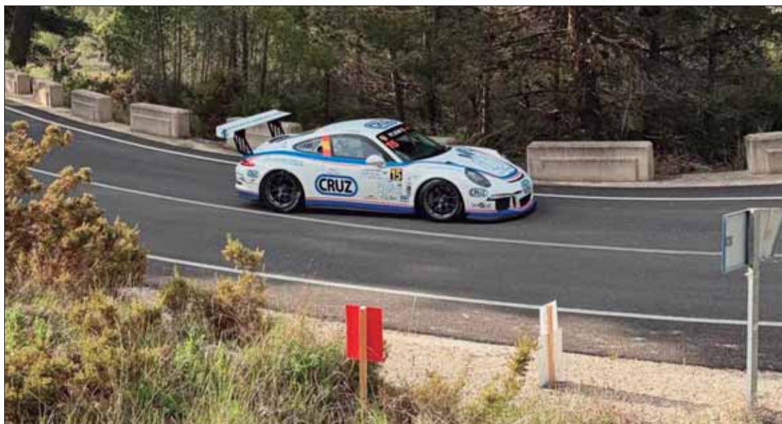
La prueba valenciana ha servido al piloto ruteño para la puesta a punto de su Porsche/EC