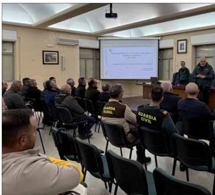
Los agentes aportaron datos sobre cómo ha aumentado los robos esclarecidos/FP

El capitán apeló a la colaboración de los agricultores para identificar movimientos inusuales en las fincas y actuar con celeridad. Bote hizo hincapié en que la vigilancia es una labor "colectiva". De ahí la importancia de adoptar medidas preventivas. Entre ellas, no se debe dejar materiales ni herramientas en el campo sin supervisión. También se debe tener marcado el material