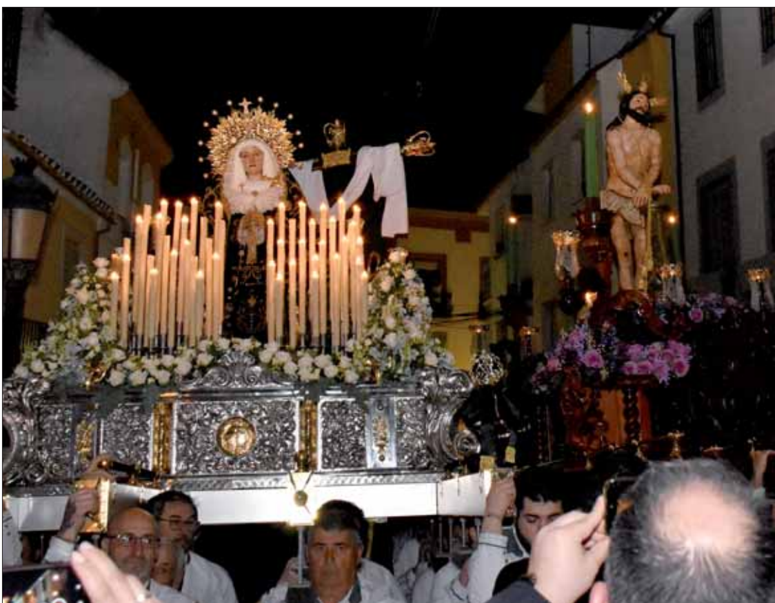
La Virgen de la Sangre y Jesús volvieron a subir en paralelo a su ermita con el alumbrado público apagado

nada llegó, como es costumbre, con el regreso de las imágenes a su templo. Alrededor de las diez de la noche, el alumbrado público se apagó por completo para dejar paso a la luz vacilante de las an-