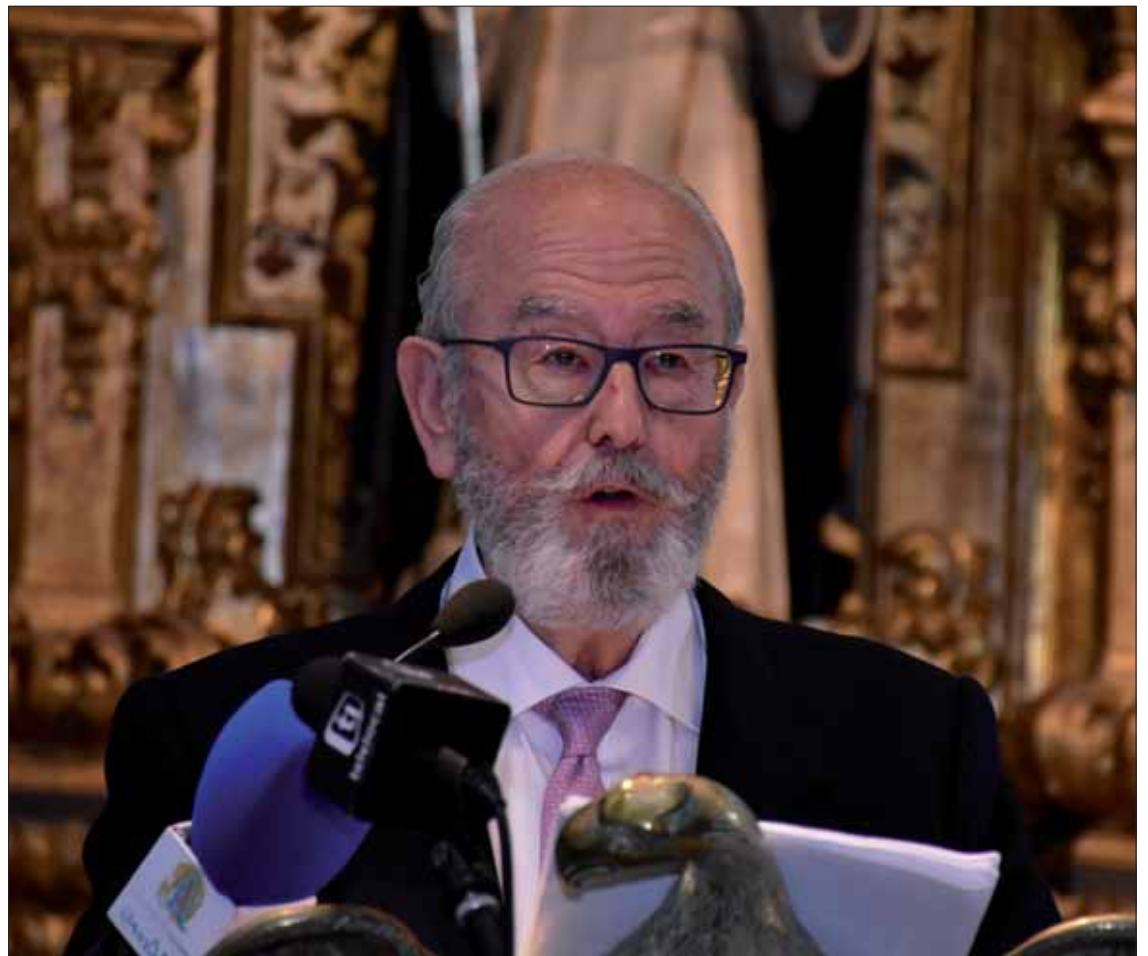
El pregonero combinó la puesta en valor de las imágenes ruteñas con un análisis científico de la Pasión/FP

Tras esa introducción inicial, repasó las imágenes que salen en procesión en Rute, la mayoría procedentes de la escuela granadina. De Jesús Amarrado a la Co-