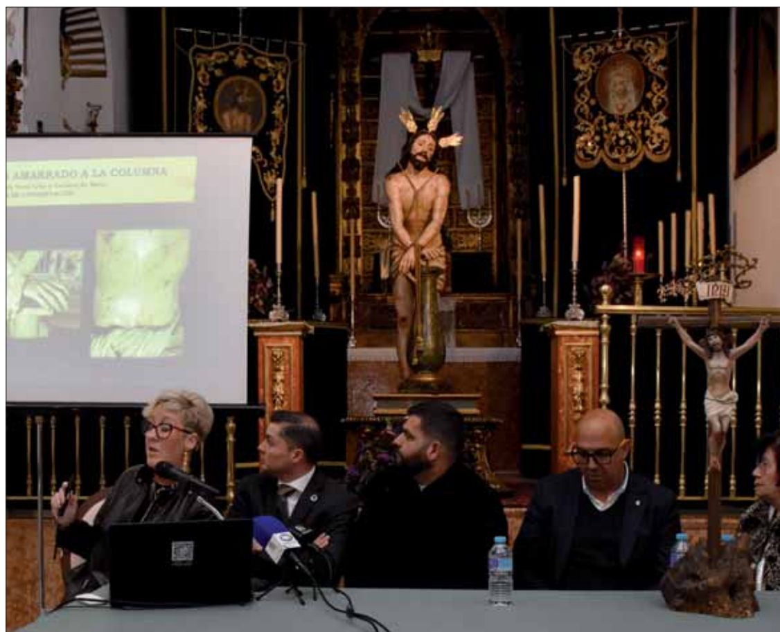
La restauradora explicó los pasos dados para devolver a la imagen su fisonomía original

La intervención se centró en “la consolidación estructural” del conjunto. Infante hizo hincapié en el grave deterioro de la zona inferior, especialmente donde los pies se unen a la peana. Para evitar riesgos durante la estación de Penitencia, se reforzaron las sujeciones internas, solventando los problemas de “balanceo” que ponían en peligro la integridad de una madera del siglo XVII ya