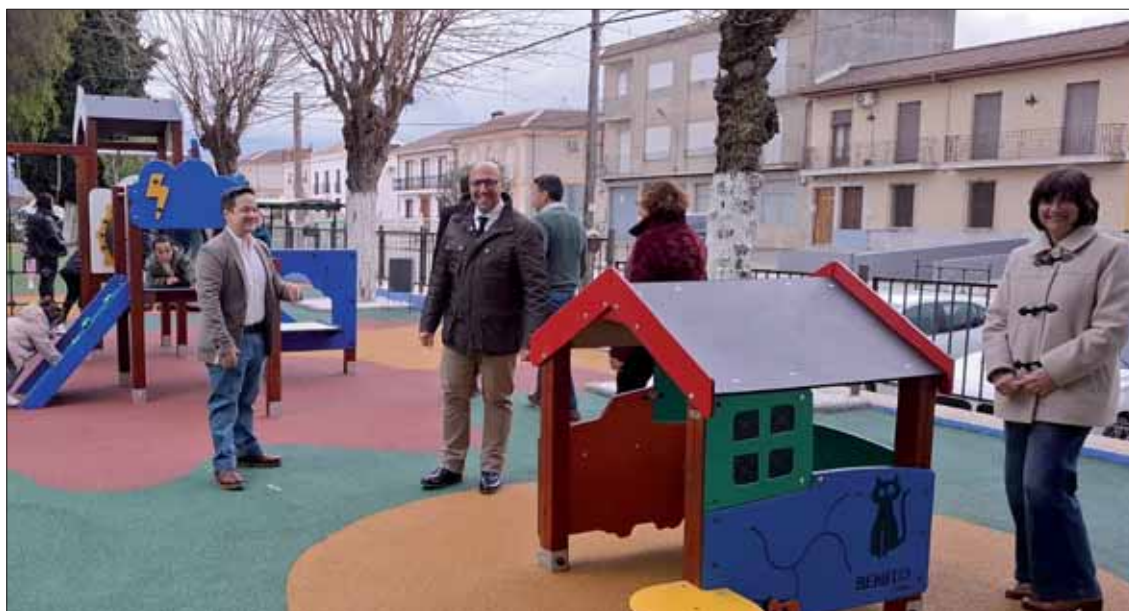
Las autoridades locales durante su visita al nuevo parque infantil tras su remodelación