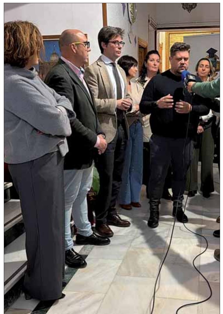
El delegado durante su visita a la Escuela Hogar

Finalmente, el alcalde de Rute, David Ruiz, agradeció la presencia constante de los delegados territoriales en el municipio y, una vez más, puso en valor la trayectoria histórica de la Escuela Hogar. Por eso, Ruiz ha incidido en que todas las administraciones deben caminar de la mano para apoyar a instituciones que, como esta fundación, son fundamentales para la formación humana y profesional de las futuras generaciones de nuestro pueblo y la comarca.