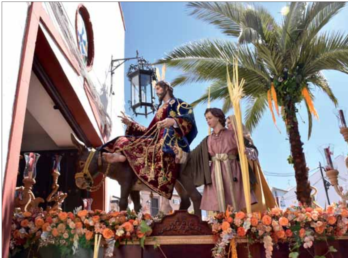
Una difícil maniobra de los costaleros dejó a la Borriquita a las puertas de la ermita de San Pedro

Tras la bendición de las palmas, a las once y media de la mañana asomaba por la puerta lateral de Santa Catalina el trono con la Borriquita. Como ocurre desde hace un par de años, rode-