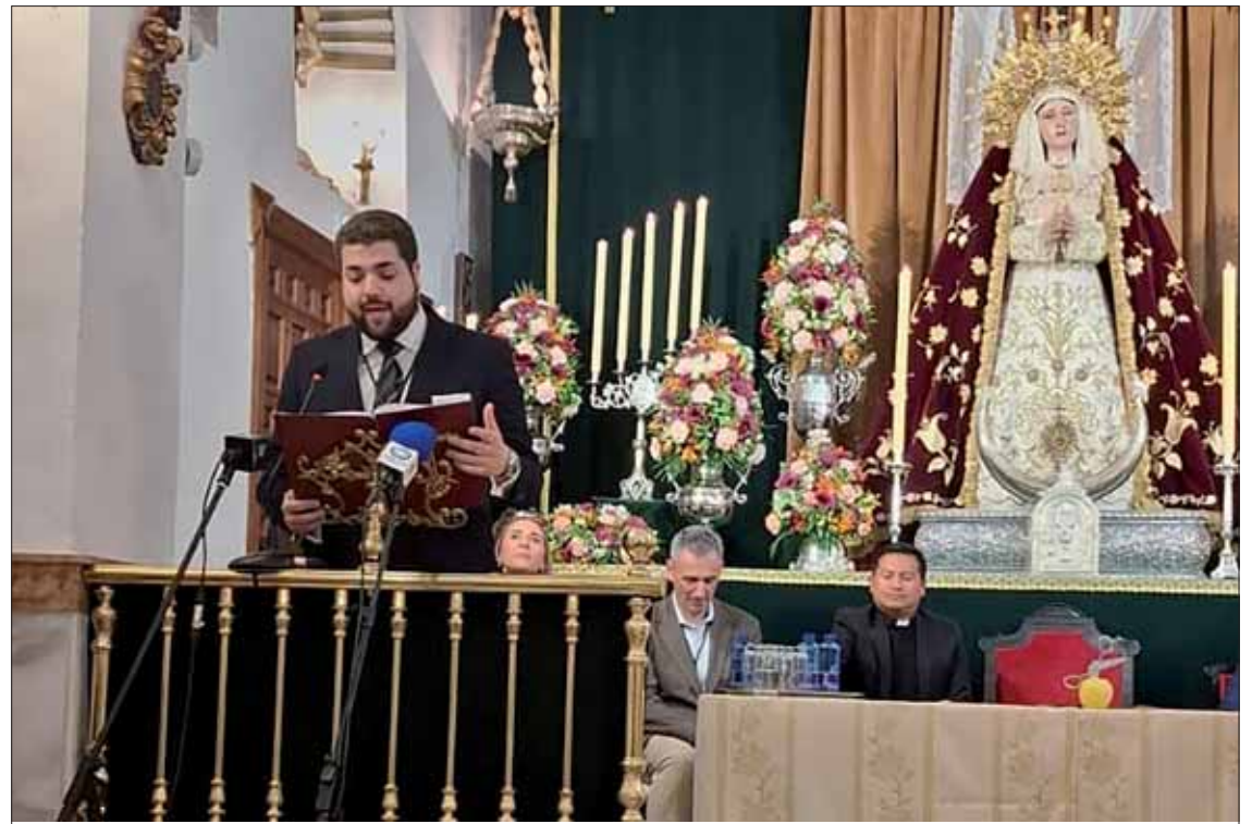
Oscar durante su intervención en la clausura de los Juegos Florales

El mantenedor de los Juegos Florales pregona con el corazón en una noche llena de lirismo, música y de gran sentimiento y devoción hacia la Virgen de la Sangre