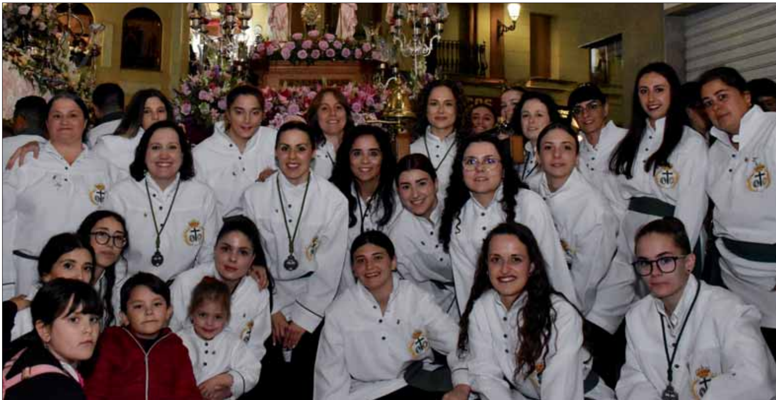
Las costaleras volvieron a llevar el paso de la Santa Cruz

Las Fiestas de Mayo se han proyectado desde el barrio al resto de Rute, con un concurso de cruces muy participativo culminado con la procesión de la Santa Cruz y la Virgen de la Sangre