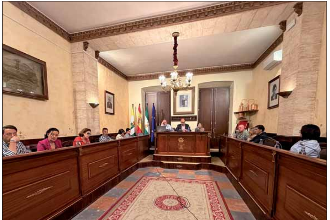
En esta misma sesión también se efectuó el sorteo de las mesas electorales del 17-M/MM