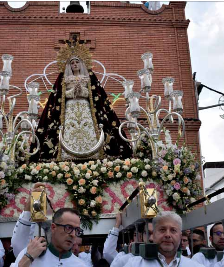
El lugar del luto de Semana Santa/FP