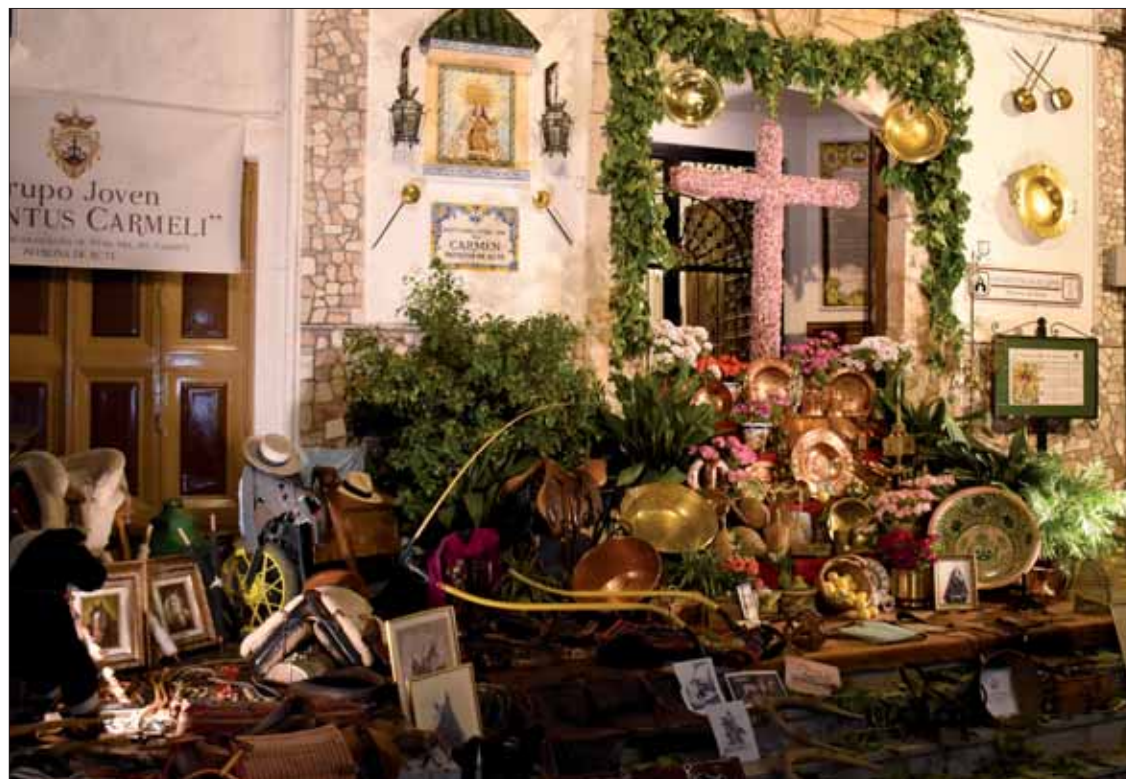
El grupo joven de la Virgen del Carmen ha ganado el concurso de cruces

Tras cultos y actos previos como los Juegos Florales, el triduo o la ofrenda de flores, el programa se concentró en los tres