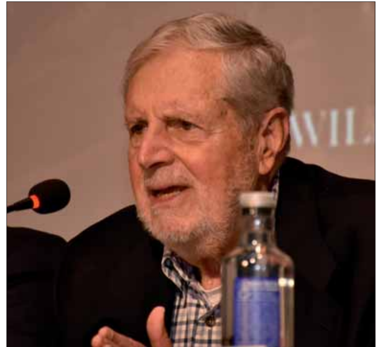
El CEMAC Pintor Pedro Roldán acogió esta presentación/FP

Masterson admite que el libro contiene una fuerte carga de auto-