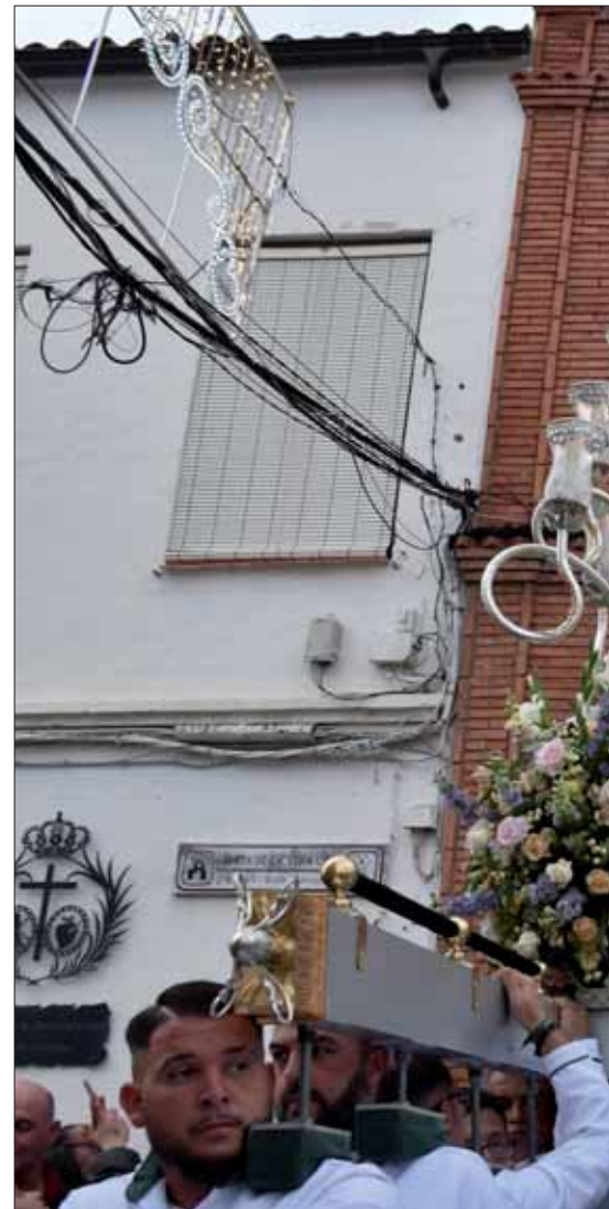
La Virgen de la Sangre lució manto y saya granate en

Más allá de los premios, el ambiente en torno a las cruces confirmó el carácter participativo y de vecindad de estas fiestas. En