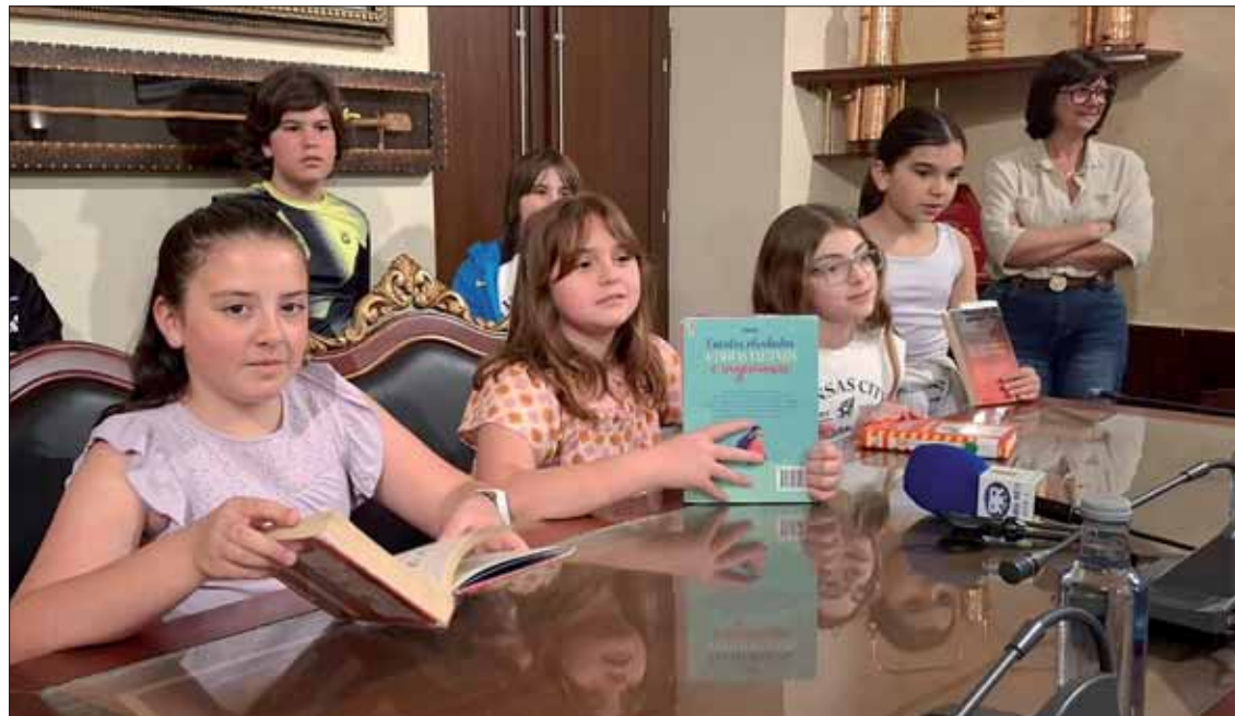
Durante su recorrido pasaron por el salón de plenos del Ayuntamiento/MM