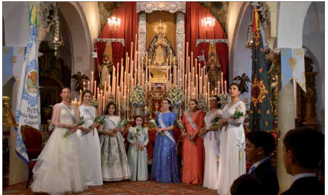
Reinas juvenil e infantil y sus damas de honor en el altar de la parroquia/MM

Uno de los momentos más conmovedores de la jornada fue