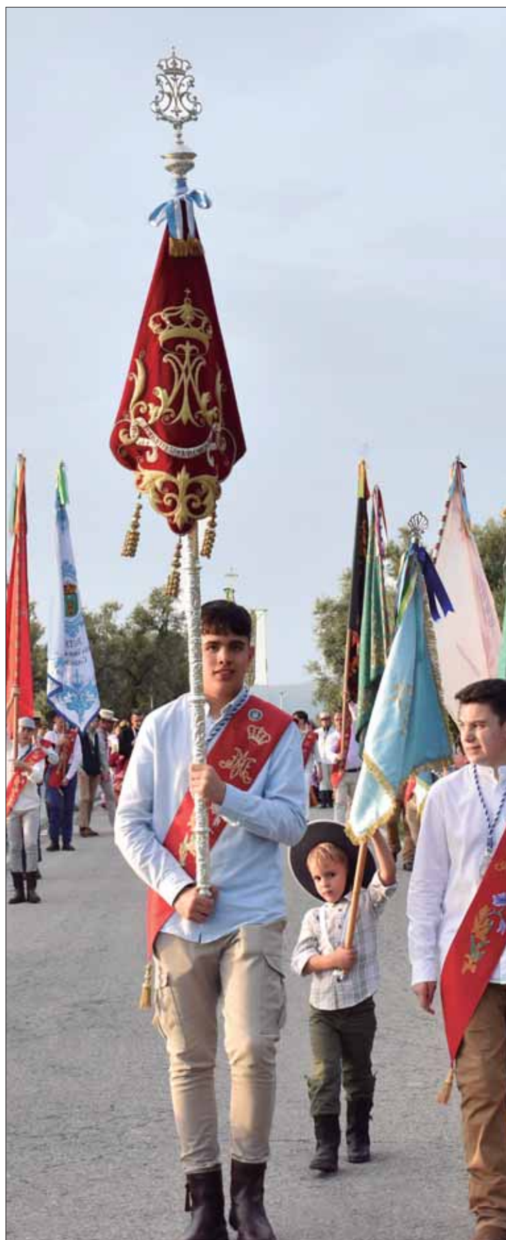
Llegada a Rute de los Hermanos de Andújar por la Molina