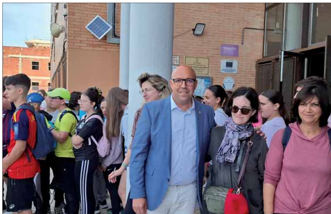
La ruta en dirección al Pamplinar partió del propio centro/MM