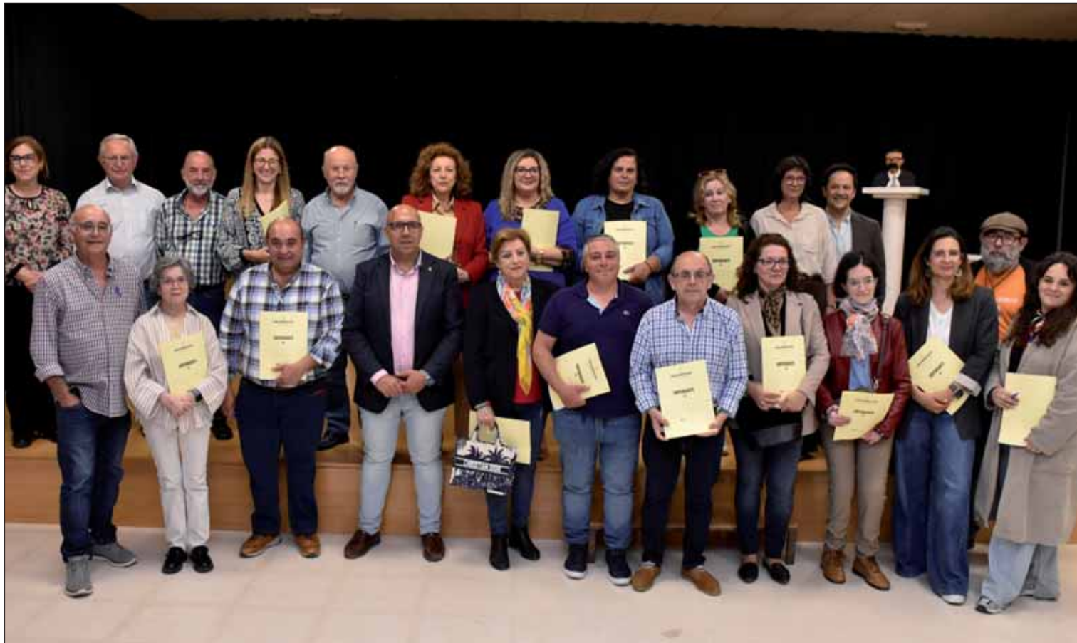
Un total de 23 colectivos se han acogido a esta primera línea de ayudas municipales/FP

Esta fase, de ochenta y seis mil quinientos euros, beneficia a cofradías, peñas y otras asociaciones sin ánimo de lucro