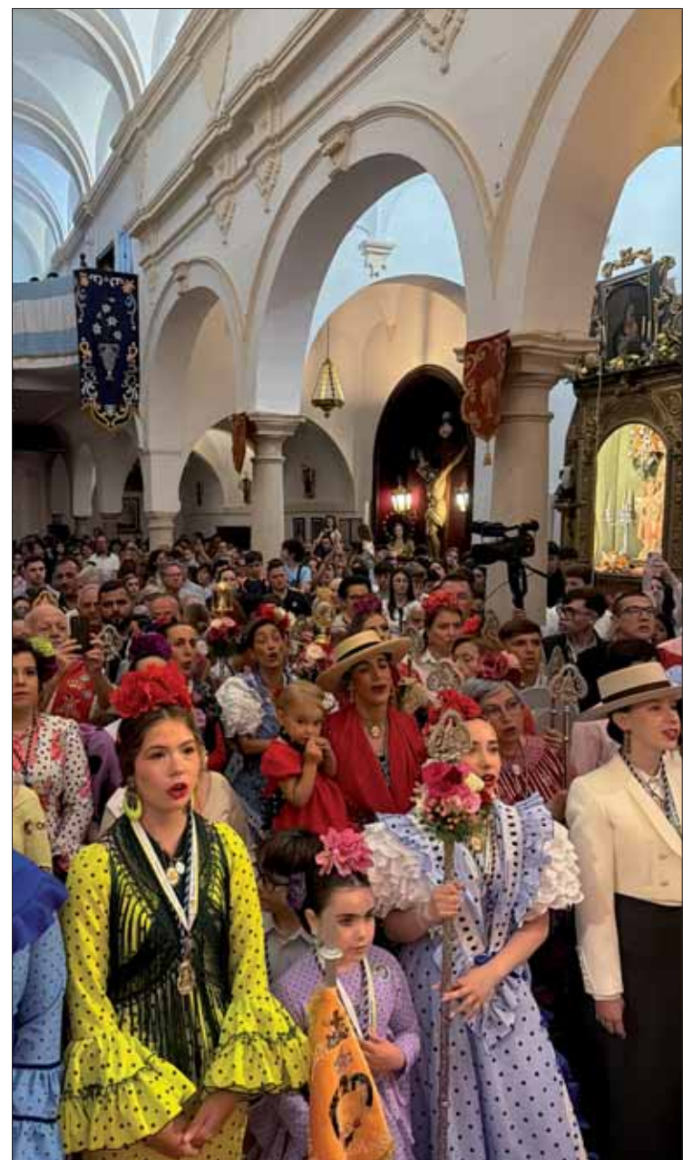
En la parroquia se cantó el fervor que anuncia las Fiestas de Mayo/FP

pero no conocía lo que significa este recibimiento, esta riada que a través del tiempo surca la Molina y llega a San Francisco. Como el resto, es una gota más en ese caudal de fervor que desemboca allí para cantar a la Virgen de la Cabeza y anunciar que, incluso antes de terminar abril, en Rute ya es mayo, el mes con el que sueña un pueblo.