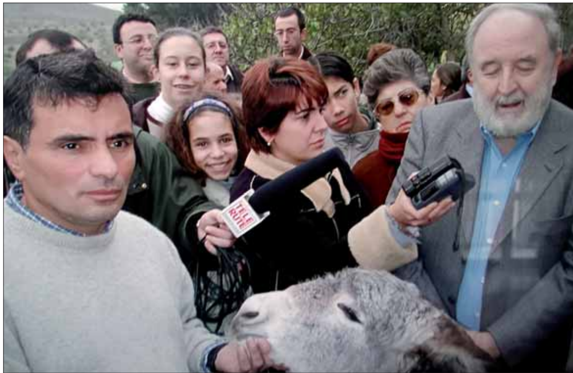
Diego Carcedo, en 2023, cuando bautizó a su burrito "Cadichon" en Rute/EC

muerte de Diego Carcedo supone la pérdida de un pilar fundamental y de un amigo sincero. Carcedo no solo fue el periodista de prestigio que dirigió los servicios informativos de TVE y Radio Nacional de España o corresponsal valiente que entrevistó a más de treinta jefes de Estado, sino el