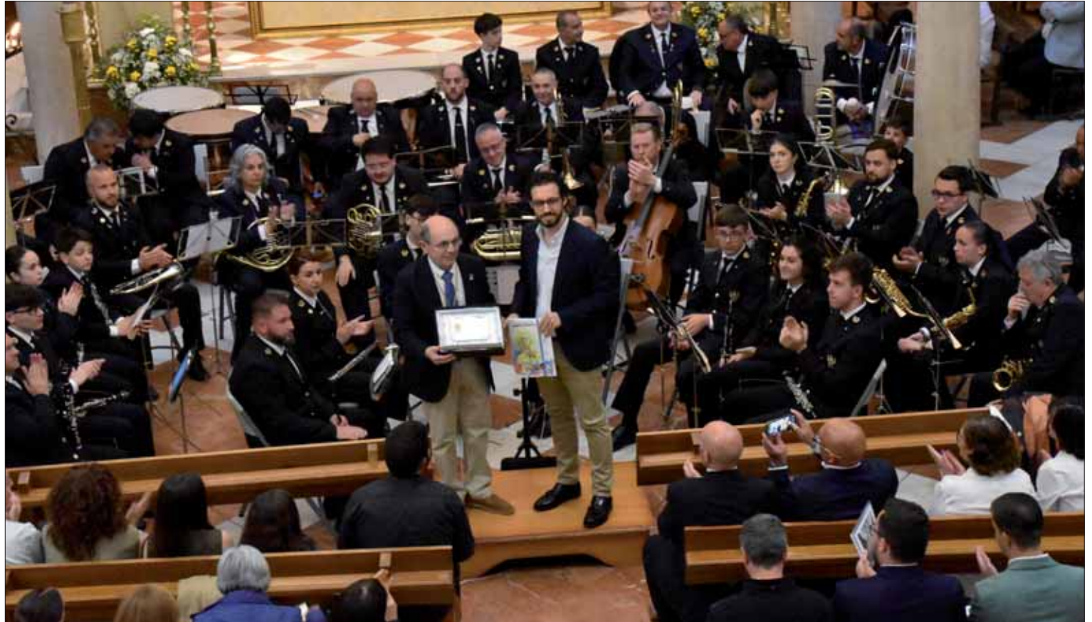
Ambos autores entregaron sus marchas y recibieron el reconocimiento de la cofradía

Ambas marchas fueron estrenadas en Rute en la parroquia de San Francisco de Asís, en un pequeño concierto ofrecido el pasado 18 de abril por la Banda Municipal. Junto a ellas, se interpretaron los dos himnos más representativos: “Morenita y pequeñita” y el llamado “Himno