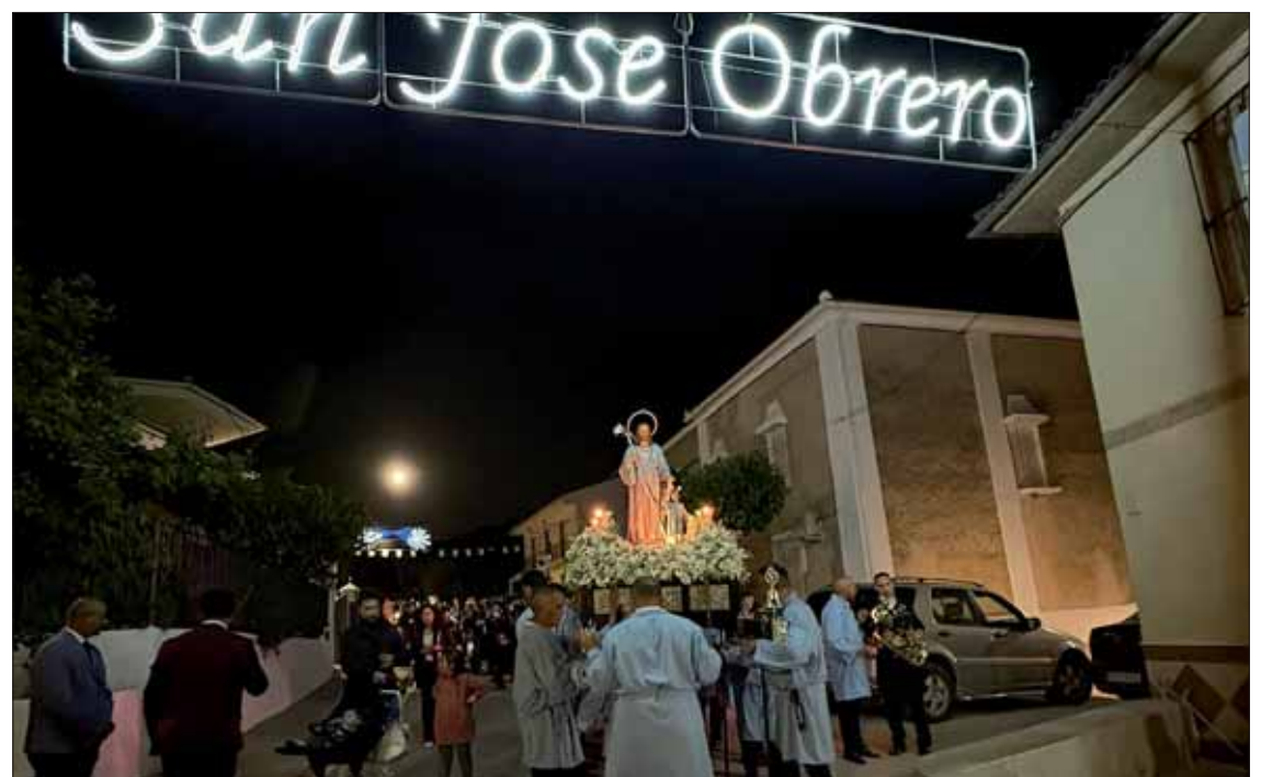
La imagen de San José Obrero recorrió un año más todos los recovecos del Nacimiento/EC

Durante el resto del fin de semana, el ambiente festivo se trasladó a la caseta municipal con diversas actuaciones musicales y una paella popular. Entre esos eventos más festivos, destacó el pintoresco paso de la viga en el río Anzur, una prueba de destreza que ha cumplido cuarenta años. Finalmente, el domingo se puso el broche con un torneo de dominó, la fiesta de la cerveza y un concurso de gazpacho.