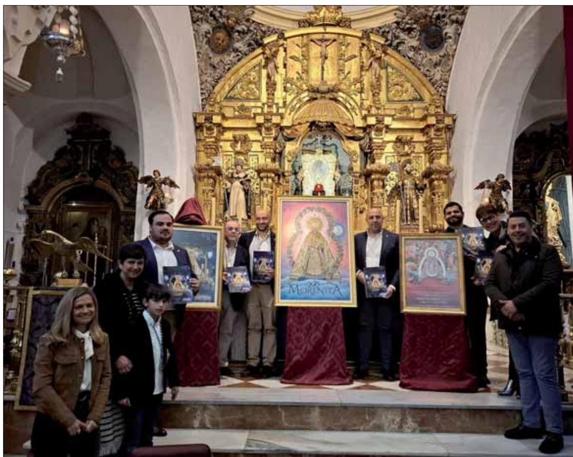
El presidente, alcalde y párroco junto a los autores del cartel y la imagen de portada de la revista/MM

La gran sorpresa de la noche llegó cuando el presidente mos-