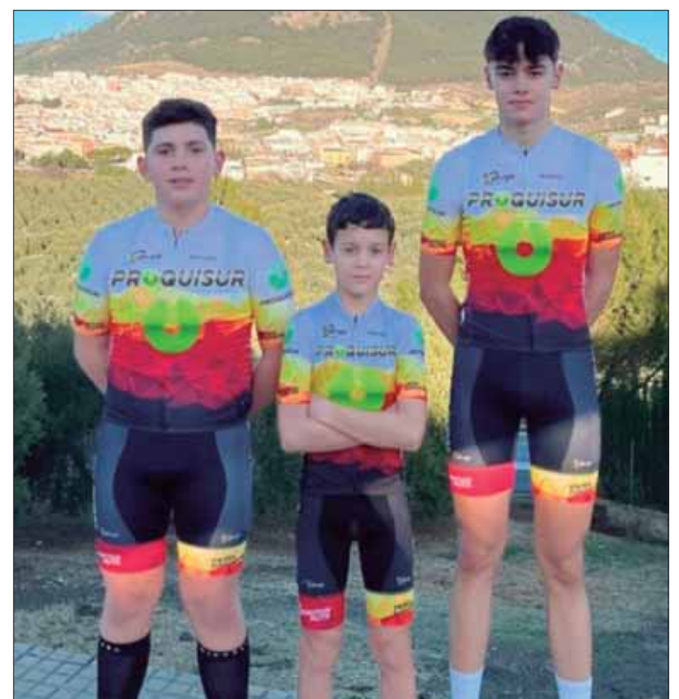
Los tres jóvenes integrantes del nuevo equipo de competición/EC

La única prueba que queda del Circuito XCO de Diputación, que ya disputan como Team Proquisur es el Rally Villa de Rute. Se debería haber disputado el pasado 23 de marzo. Sin embargo, las continuas lluvias de esos días hicieron que se aplazara al 3 de mayo.