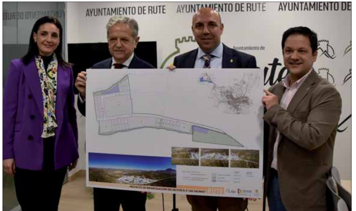
Los representantes de la Diputación y el Ayuntamiento comparecen tras la reunión con los propietarios de te-