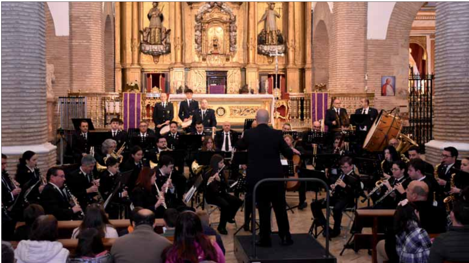
La Banda Municipal dividió su concierto en dos partes, una de ellas exclusiva de estrenos