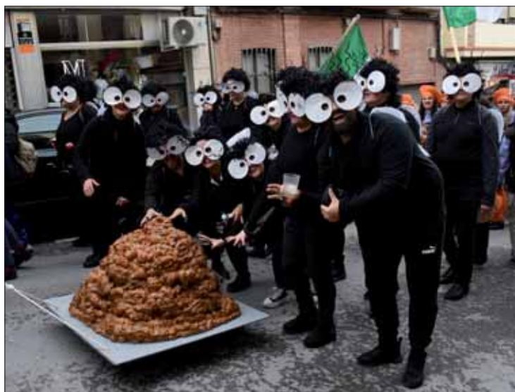
En los pasacalles se han visto disfraces atrevidos y originales/FP