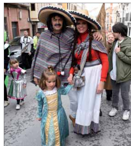
Familia disfrazada en el Domingo de Piñata/FP