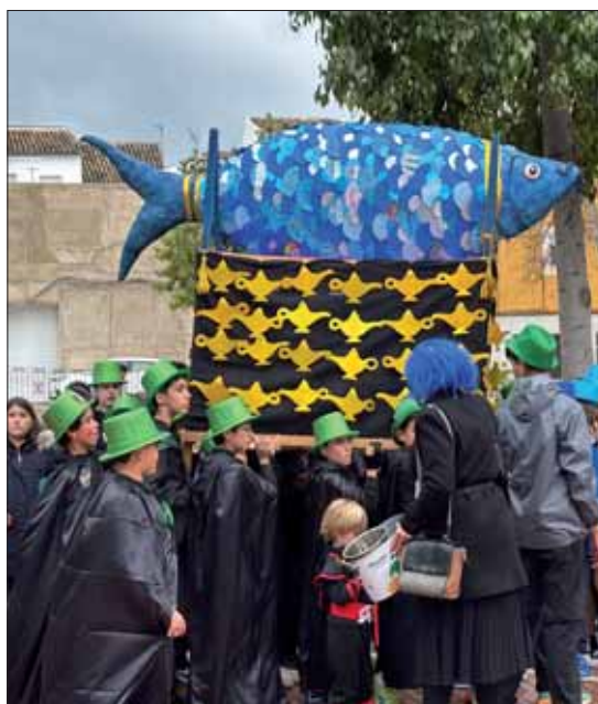
La sardinita infantil se trasladó al Fresno/EC