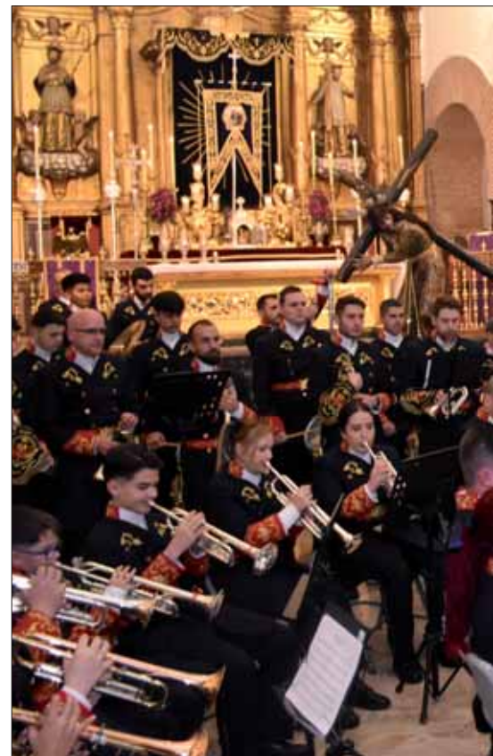
La Agrupación Musical Santo Ángel Custodio est