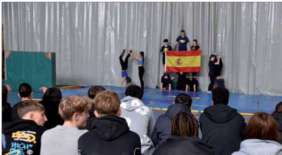
Los estudiantes del instituto ruteño recibieron a sus homólogos con un acrosport

Los veintisiete acudían a clases en el instituto ruteño y recibían en la mañana del martes día 11 de marzo una fabulosa acogida en el pabellón del centro. Bajo la coordinación del profe-