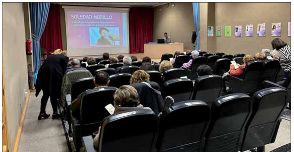
El Centro de Adultos recreó en un bingo la historia de mujeres destacadas

De las iniciativas promovidas por colectivos, Horizonte celebró el día 15 su “Fiesta por la igualdad”, en el Círculo de Rute, y el 18 se emitió en Radio Rute un especial del espacio “En sintonía contigo”. Por su parte, el CEPER celebró el día 14 su acto institucional en el Edificio Alcalde Leoncio Rodríguez. A lo largo de la tarde se proyectó la película “El escándalo” y después se recreó un bingo muy particular. En lugar de los números, aparecían en una pantalla los nombres de mujeres destacadas, con una mención audiovisual de la trayectoria de cada una. En cuanto a los actos de carácter