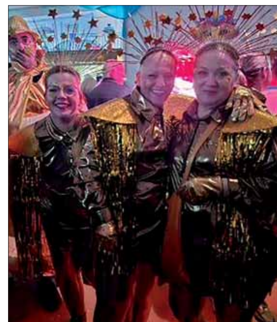
Grupo en el pasacalles temático/MM