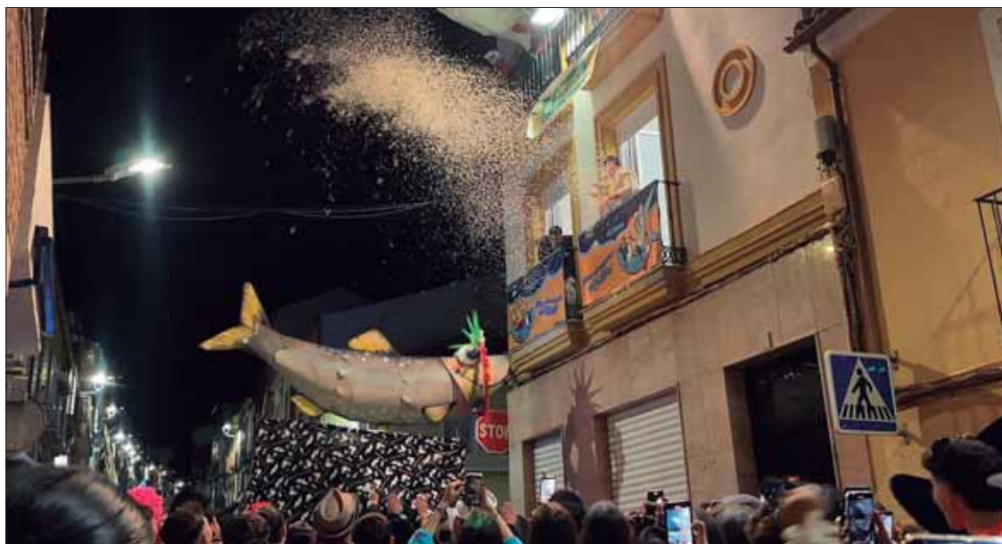
Pese a la amenaza de lluvia, el entierro de la sardina pudo completar su recorrido

Así concluía un Carnaval limitado, que no ha podido lucir todo lo deseable en la calle, donde la afición asegura que se disfruta más. Con todo, no han faltado en Rute los "jartibles", como se conoce en el argot carnalero a quienes ni se cansan ni se rinden, a quienes se visten a diario y salen contra viento y marea. Su persistencia ha "salvado los muebles" y ha vencido a la lluvia, que no ha podido con una de nuestras tradiciones más señeras.