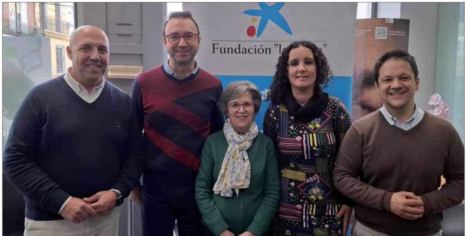
Los representantes de AECC, La Caixa y el Ayuntamiento presentando los talleres para la juventud

Los talleres programados girarán en torno al ocio nocturno y el consumo de sustancias