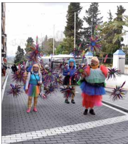
Grupo ganador del concurso de disfraces/FP