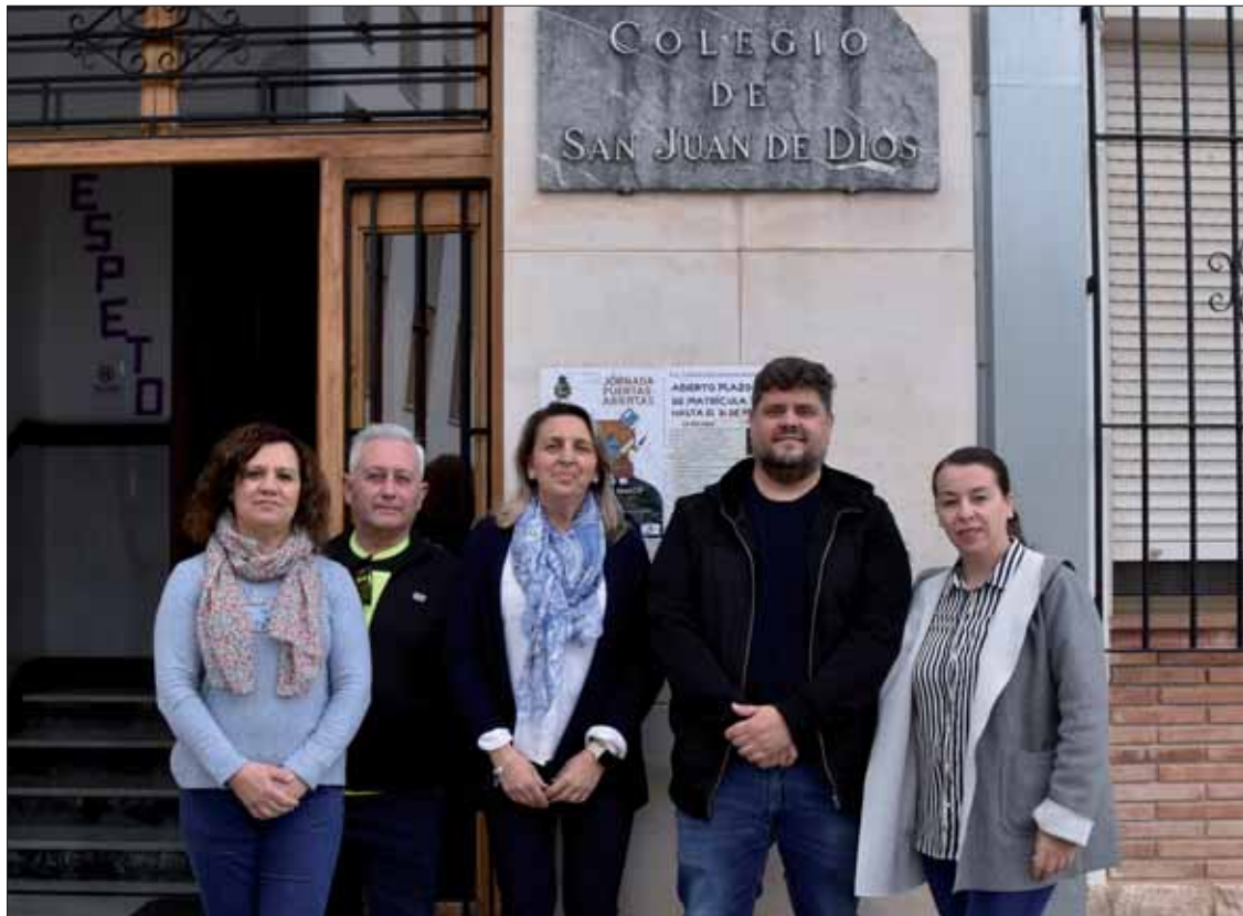
Los responsables de la Escuela Hogar informan de las novedades y de la matriculación/MM

Como novedad, los residentes van a poder beneficiarse de clases de apoyo al estudio y de inglés durante el próximo curso