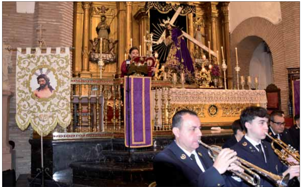
La pregonera durante determinados momentos de su alocución contó con el acompañamiento de la banda/MM

En el ámbito religioso, cuenta con una dilatada y notable implicación en el mundo cofrade. Fue pregonera de la Morenita, en 2009. Volvió a pregonar a la Virgen de la Cabeza, en 2011, durante los actos del vigesimoquinto aniversario de su Coronación Canónica, junto al propio José Julián Tejero y Juan Carlos Molina. La pregonera también ha sabido abrirse y tiene vínculos con otras devociones fuera de Rute, como es el caso de la hermandad de la Macarena y la archicofradía del Carmen del Santo Ángel, en Sevilla; o la cofradía filial de la Virgen de la Ca-