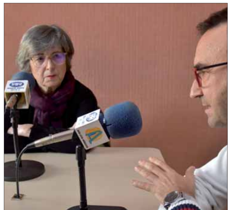
Las responsables de la Asamblea Local/EC

Al margen de estas prestaciones, la AECC en Rute tam-