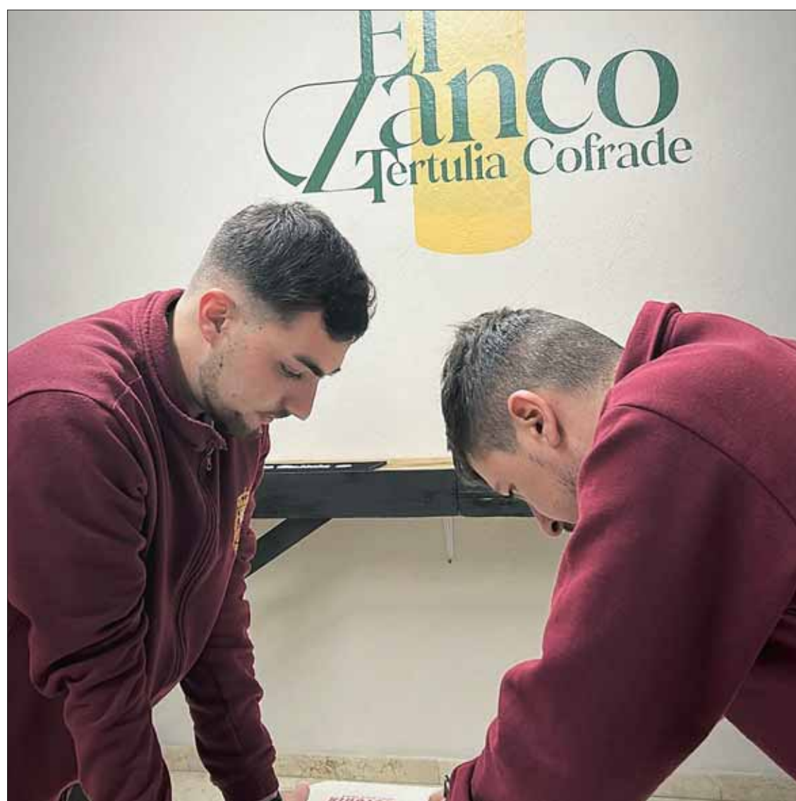
Dos de los miembros de la asociación en su sede en la calle Alfonso de Castro/EC

Este colectivo se crea con la vocación de contribuir al conocimiento y difusión de todo lo que rodea al mundo cofrade