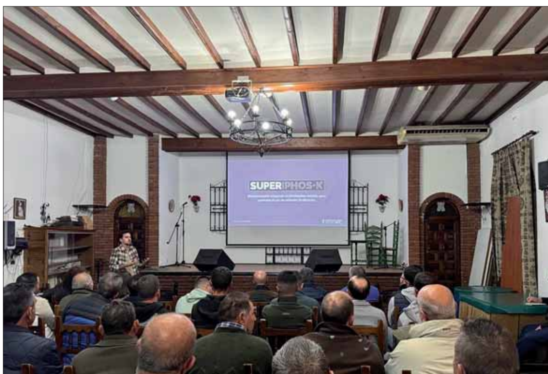
En la charla se informó a los agricultores sobre la normativa de la PAC al respecto

A grandes rasgos, se resumirían en buscar un equilibrio entre la reducción de los fertilizantes sin perder rendimiento. En este sentido, reconoce que hay mucha información al respecto, pero no llega “con la suficiente claridad” que debería a los afectados.