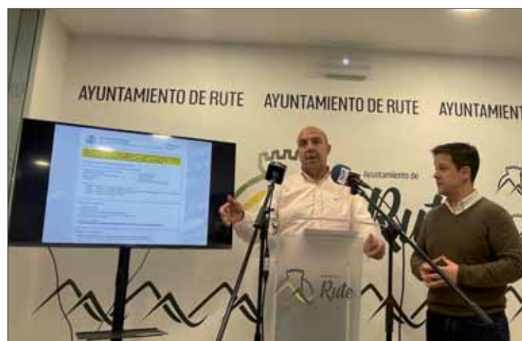
Se informó de que el plazo está vigente hasta el 21 de abril/FP

El presupuesto base se acerca a los tres millones de euros. En concreto, asciende a 2.933.251,44 euros. El edil aclaró que no es el paso final, pero sí “muy importante” de cara a que el polígono sea una realidad y se dé respuesta a estos propietarios. García subrayó “el compromiso” del