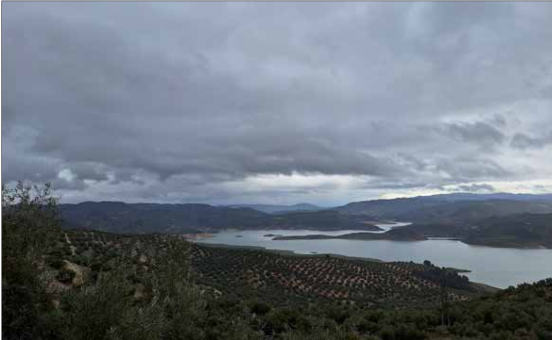
Imagen reciente de los niveles del Pantano de Iznájar

Los niveles siguen siendo pobres, sin olvidar que en los últimos años ha estado varias veces por debajo del 20% de su volumen