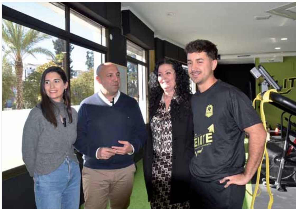
La coordinadora del IAJ acompañada del alcalde, la concejala de Juventud y el responsable del centro

La coordinadora del IAJ informó de que este centro había recibido nueve mil euros para la puesta en marcha de su actividad empresarial. La subvención forma parte del programa Innoactiva, de la Junta de Andalucía. Estas ayudas van destinadas a apoyar y fomentar el emprendi-