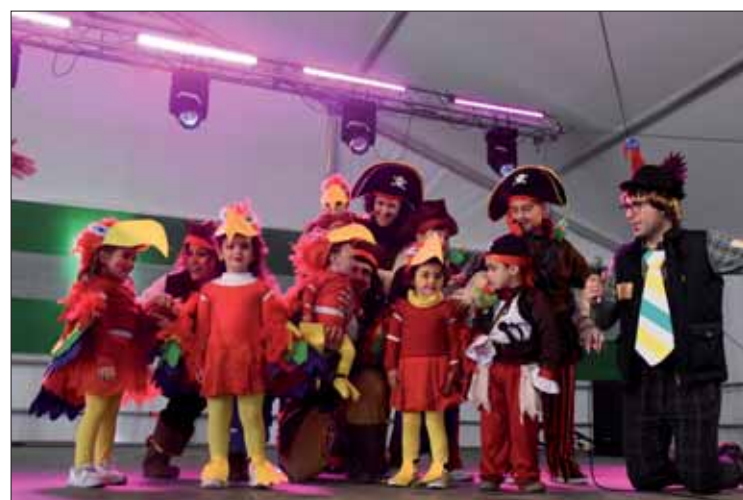
"Los Piraloros" y "Los Superprimos" se llevaron los premios grupales/FP