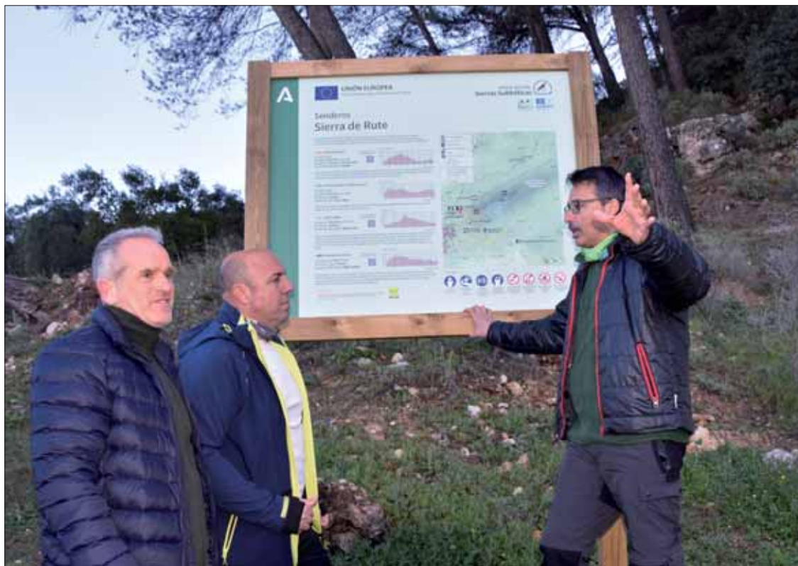
Los paneles y la señalización indican las rutas disponibles, distancia y grado de dificultad/FP

Este doble sendero se suma a los dos existentes en nuestro término. Uno es el circular de Sierra Alta. Tiene una longitud de 10,8 kilómetros, con una dificultad media-alta y una duración de 4 horas, y llega al vértice geodésico. El otro es el de Sierra Horconera, que forma parte del GR-7, de 5,7 kilómetros y difi-