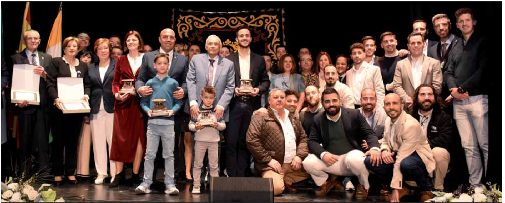
Los galardonados y distinguido con los Premios Villa de Rute con el alcalde