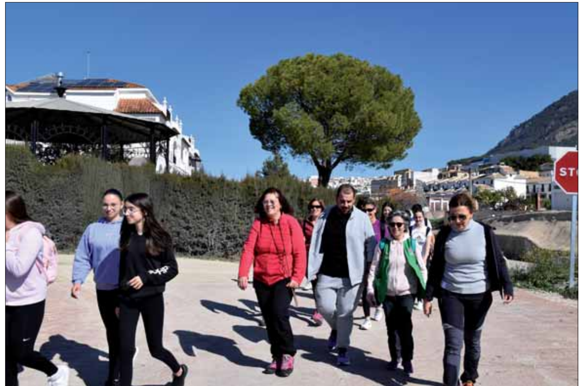
Los premiados posan junto a las autoridades municipales

La más novedosa ha sido una ruta promovida por el IES Nuevo Scala, para divulgar el papel de los colectivos del municipio