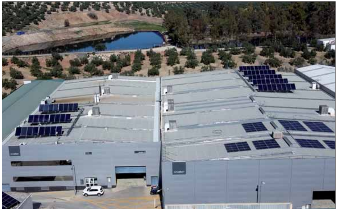
Con el nuevo edificio la sede central de Cruzber ocupa más de 18.000 metros cuadrados

Asimismo, esta industria ha conseguido mejorar su cadena de aprovisionamiento global, con inversiones en innovación, procesos, equipamientos e infraestructuras.