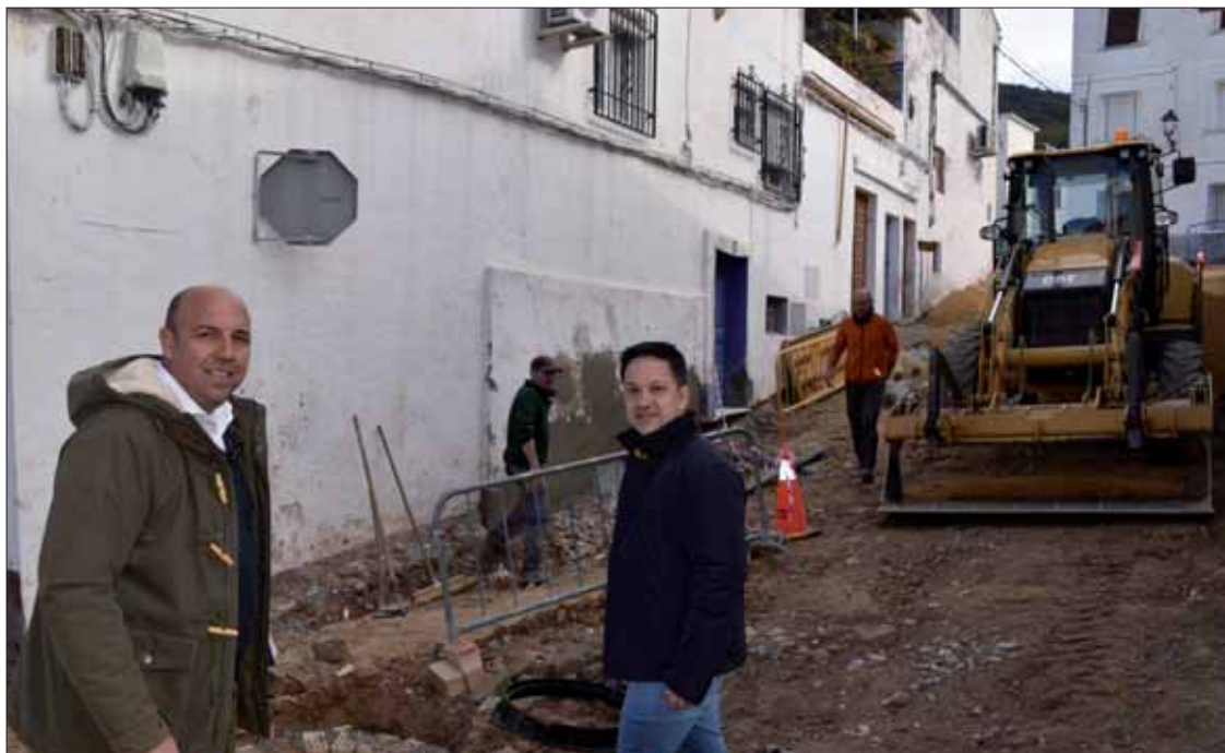
La actuación de ahora en esta zona se suma a otra que se acometió el año pasado

En los días posteriores, se completó el arreglo integral de la calle. La inversión total ronda los quince mil euros, sumando la actuación del año pasado y la de ahora. Ambas se han costado