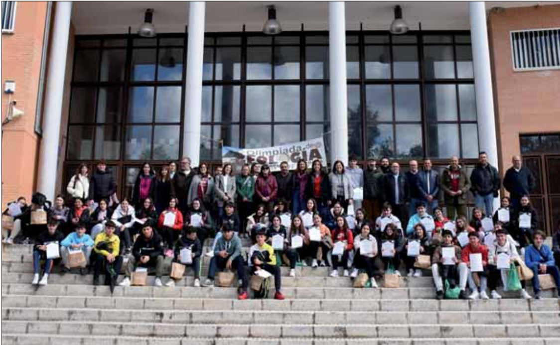
Alumnado del instituto ruteño y Juan de Aréjula de Lucena han conformado el grueso de participantes

Un total de 64 estudiantes han participado en esta edición influida por la lluvia, que impidió hacer la parte práctica en la sierra