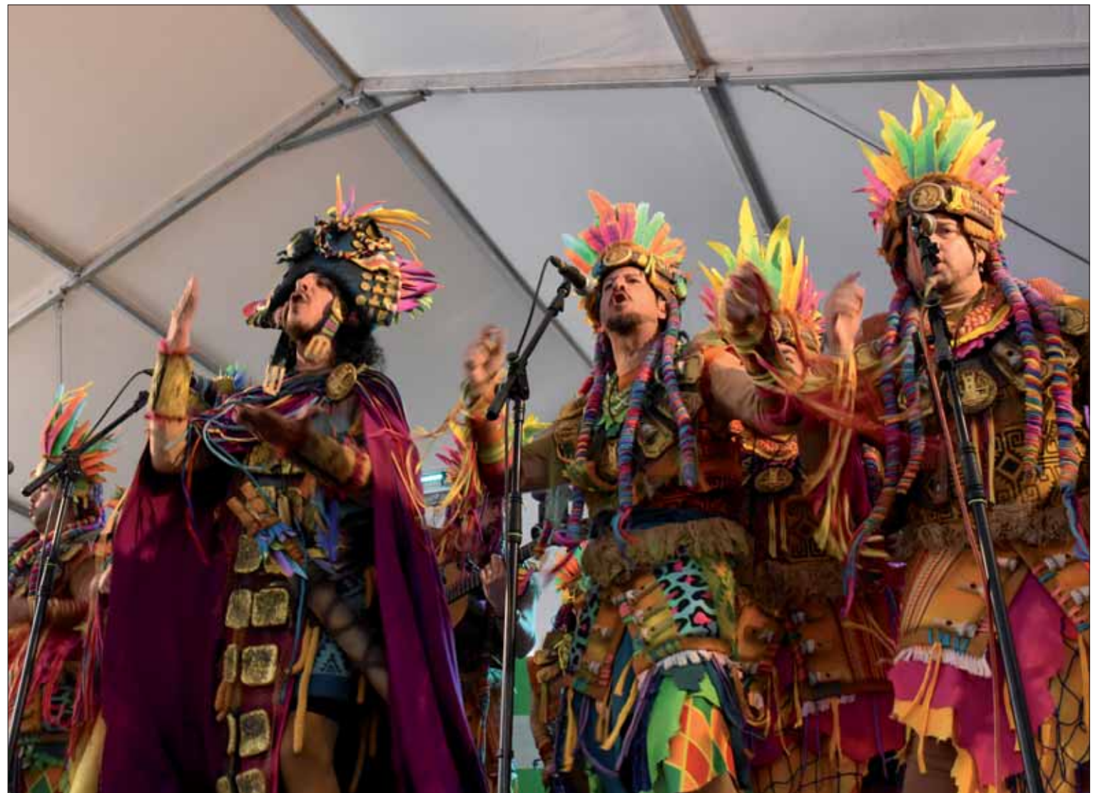
La actuación de "La Tribu" ha sido la gran novedad del primer domingo de Carnaval/FP

Tras su celebración, ha llegado uno de los platos fuertes de este año, la actuación de la comparsa "La Tribu", recién llegada de la final del COAC de Cádiz