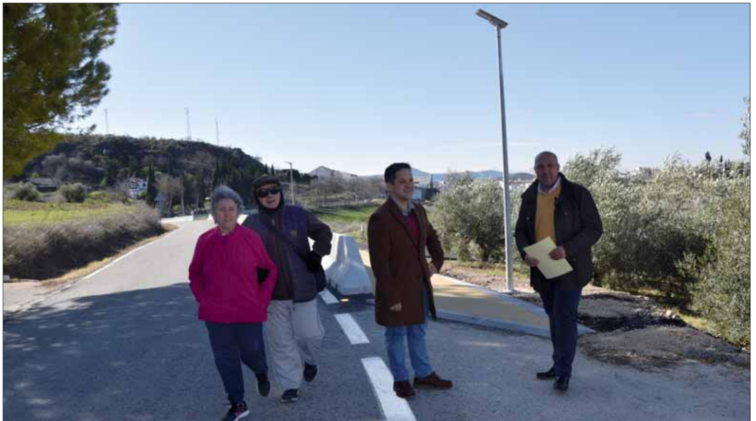
Esta fase comprende en torno a un kilómetro, algo menos de la mitad del proyecto total

García ha remarcado que era “un objetivo” del actual equipo de Gobierno. Cuando accedieron a la Alcaldía la subvención estaba “a punto de perderse” por no haber comenzado a ejecutarse ni haberse obtenido los permisos. Esta primera fase ya es “una realidad” para “goce y disfrute” de los viandantes y de-