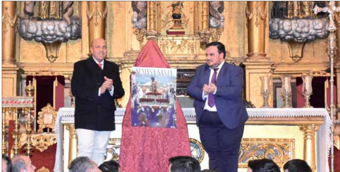
El alcalde acompaña al autor de cartel de Semana Santa durante su presentación

Una imagen del “Abuelito” del Jueves Santo será la protagonista del cartel y de la portada de la guía de mano de la semana de Pasión