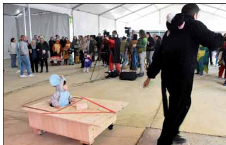
La trampa de esta "ratoncita" le valió el primer premio individual/FP

FRANCISCO PIEDRA Después de arrancar por todo lo alto con el Certamen de Agrupaciones, el listón del Carnaval no bajaría al día siguiente, ya que el primer domingo suele traer el concurso infantil de disfraces. Poco importó que el programa se trasladara por la previsión de lluvia del Paseo Francisco Salto a la