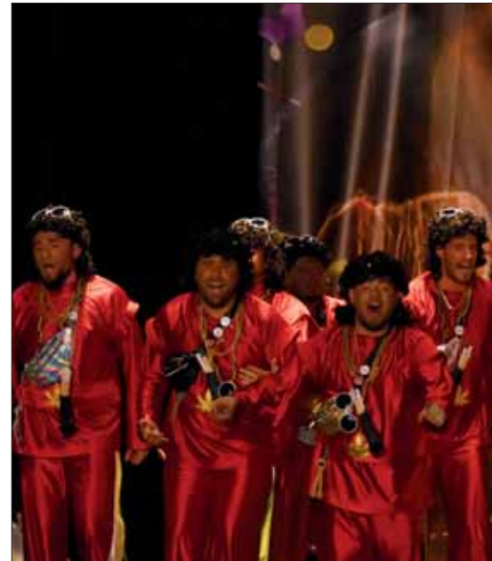
“La fábrica de chocolate” ha vuelto a jugar al des