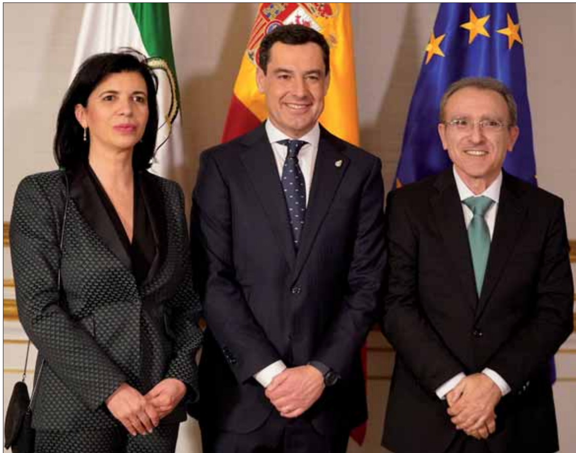
El presidente de la Junta de Andalucía junto a los responsables de Ánfora Nova

Nova atesora un patrimonio cultural que incluye textos inéditos, pinturas o ilustraciones. ¿Cuál va a ser exactamente el contenido de dicho museo?