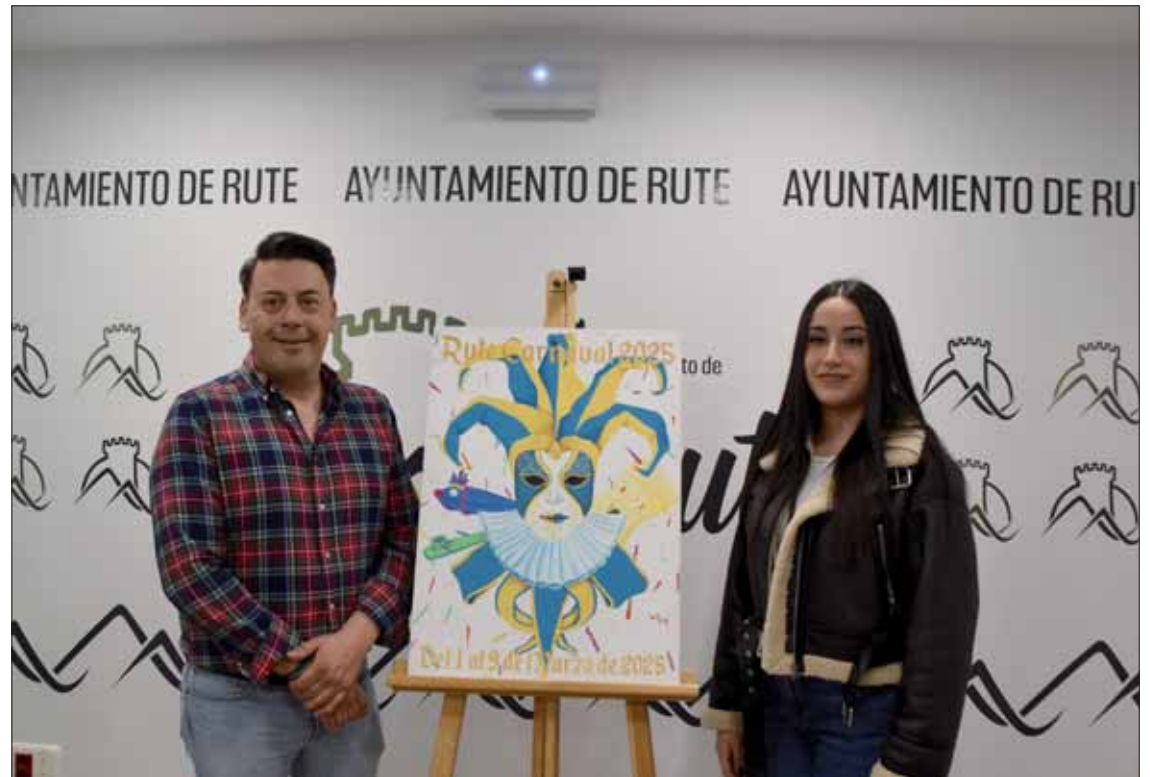
La autora del cartel junto a su obra acompañada del concejal de Festejos

El concejal de Festejos aprovechó para presentar la programación del Carnaval prevista del 1 al 9 de marzo. Durante el primer fin de semana, el sábado 1 de marzo, ha tenido lugar el Certamen de Agrupaciones, con la participación de las murgas locales, "Los tradicionales" y "La fábrica de chocolate", en el CEMAC Pintor Pedro Roldán. Hubo dos