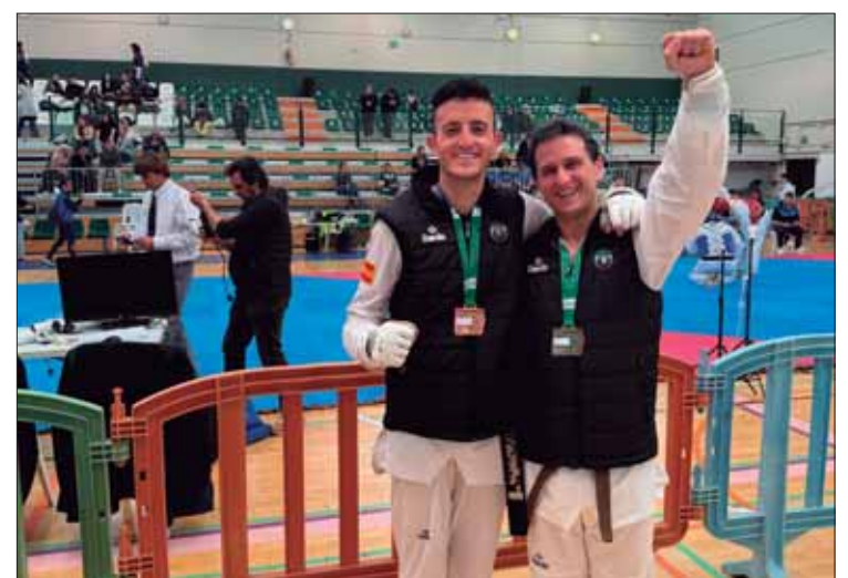
Los ruteños tiraron de oficio para lograr los dos bronce/EC

En su caso, desde hace tiempo está más volcado en la faceta de entrenador. Por eso, destaca la importancia de estar monitorizado por alguien desde fuera del tatami. Matiza que el combate se ve de forma muy distinta. Por eso, es fundamental la retroalimentación que se genera entre competidor y entrenador.