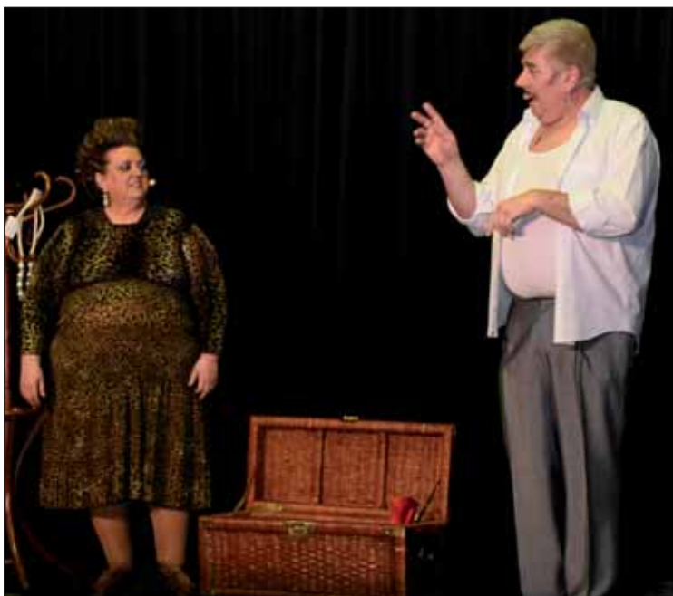
“El Catalán” y “La Turi” fueron los presentadores del certamen/FP