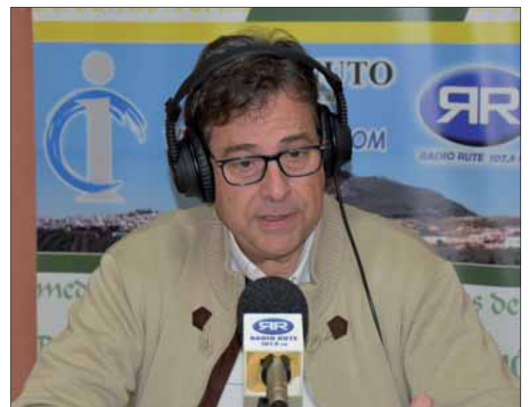
El director del Centro de Salud en los estudios de Radio Rute

hablará, entre otras cosas, del programa de gestión de citas, como el AVISAS, y de otros diseñados para poder dejar de fumar. El programa se emite todos los martes a partir de las doce y media del mediodía.