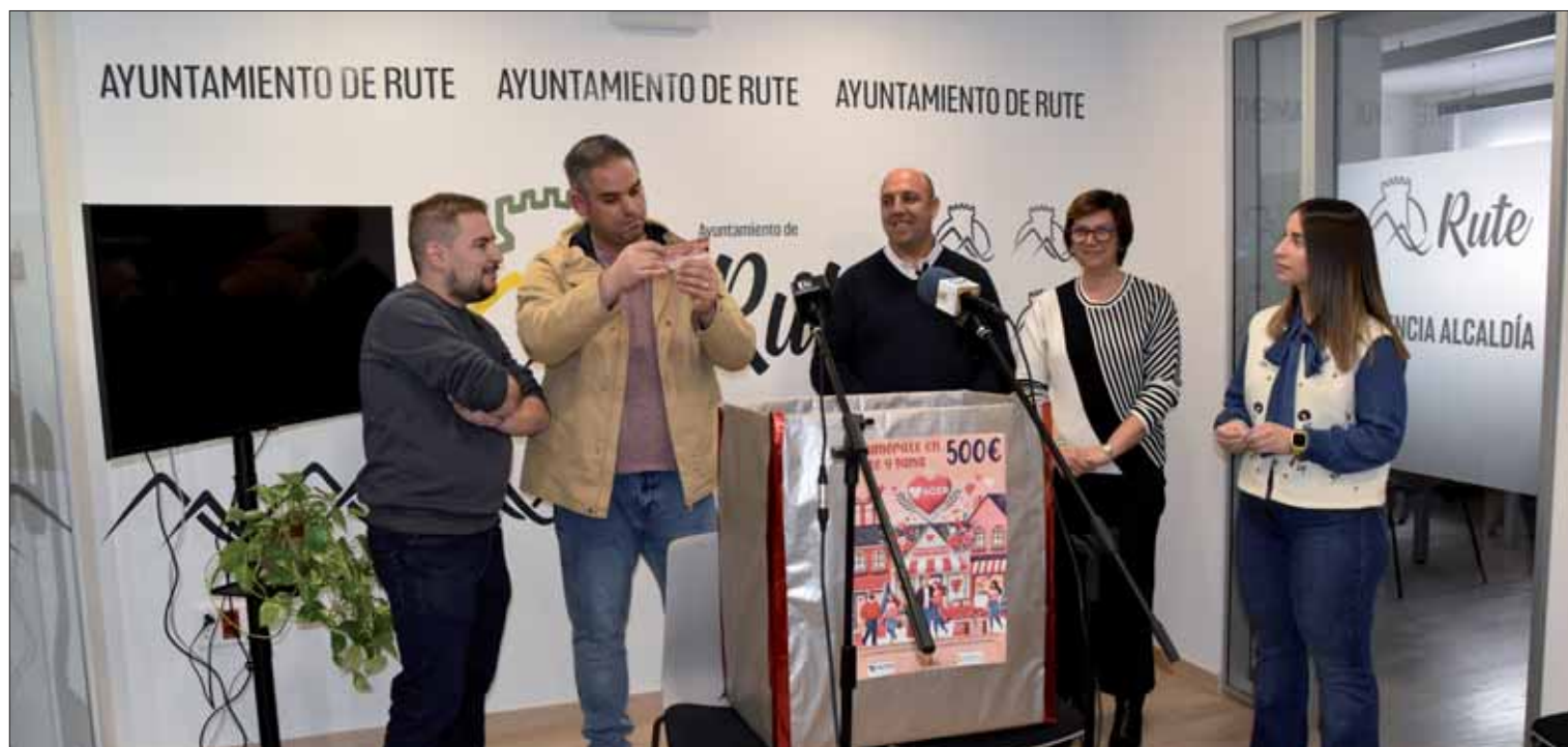
Otra novedad de esta edición de la campaña es que el sorteo se celebró en el Ayuntamiento

La nueva campaña de bienestar y cuidado repartirá tres premios de cien euros cada uno