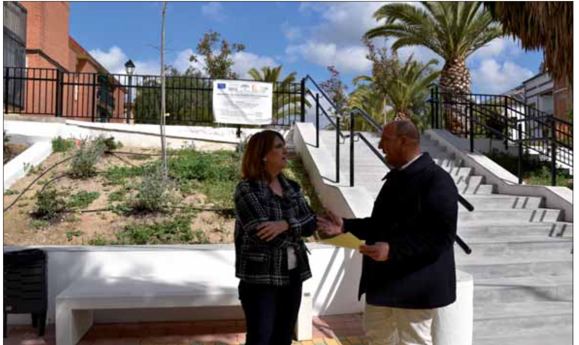
La subdelegada del Gobierno acompañada del alcalde durante su visita en los jardines de calle Libertad

respondientes 2024 van a dar cobertura laboral a 709 personas de la localidad en la adecuación, arreglo y remodelación de seis lugares del municipio. Según la subdelegada son ejemplos del “esfuerzo del Gobierno de España en el mundo rural” y de la apuesta por “fijar la población a los estos núcleos de población”