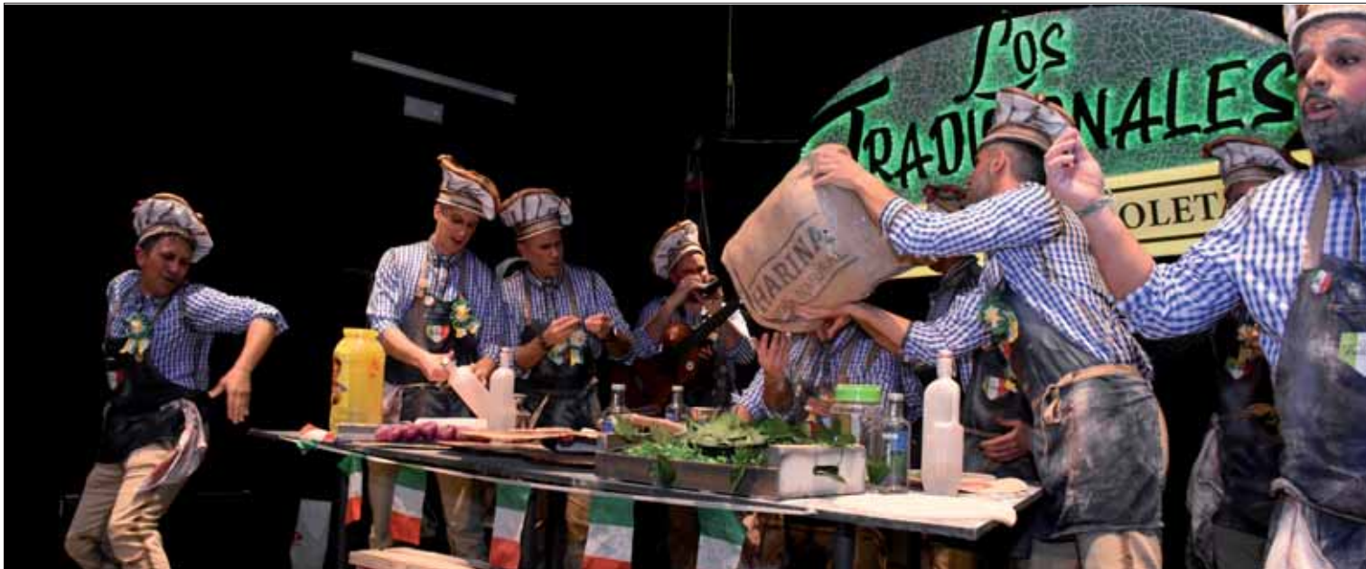
“Los tradicionales” han redondeado un año en que han recibido el Premio Villa de Rute y un cuarto premio en el COAC de Málaga/FP

El Certamen Local de Agrupaciones dio el pistoletazo de salida, y tuvo su continuidad al día siguiente con el concurso infantil de disfraces y la actuación