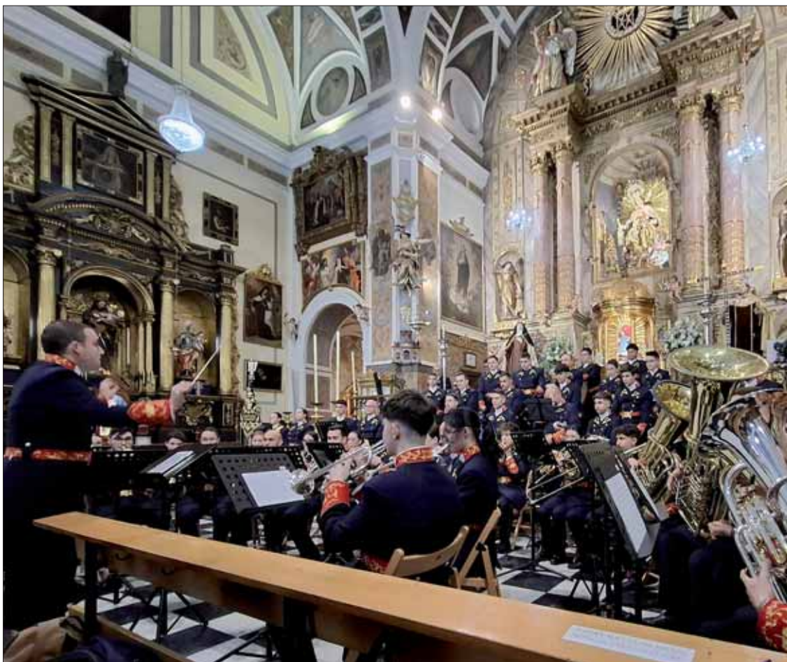
“Los Custodios” ofrecieron una selección de marchas al auditorio que llenó el templo sevillano

El concierto se enmarca en el V Ciclo de Conciertos “Cristo de la Sopa”, en el que son la formación de la provincia de Córdoba