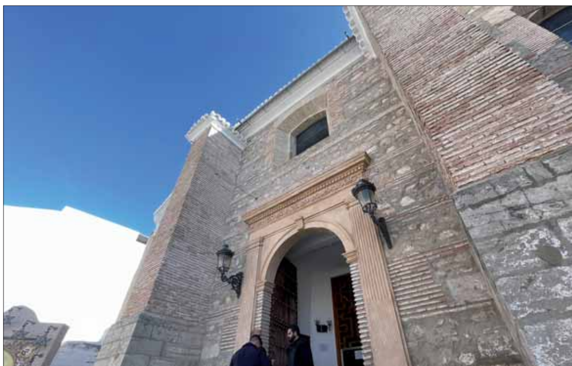
Terminada la reparación, las cubiertas de la parroquia se hayan todas en buen estado

El párroco ha dado las gracias a los responsables de ambas administraciones para costear el arreglo. Como ha subrayado, la antigua cornisa estaba construida con materiales de hace más de un siglo. Así, el derrumbe arrojó a la plaza contigua a la iglesia en torno a una tonelada de escom-