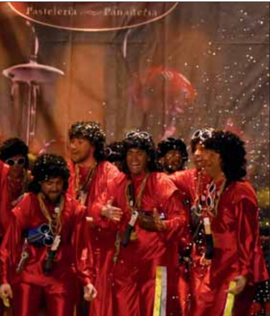
El estelar de la comparsa "La Tribu" con el nombre y el tipo/FP

buena impresión en preliminares, conectando desde primera hora con el auditorio del Teatro Cervantes. En el pase de semifinales se metieron definitivamente en el bolsillo al público y al jurado. Tras su clasificación para la final, se alzaron con un más que meritorio cuarto premio.