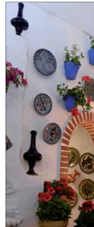
La cofradía de la Misericordia

Como entonces, se había apagado el alumbrado público, pero la iluminación de las tenues antorchas había sido sustituida una vez más por la luminosidad de las bengalas. Faltaba el colofón de esta metamorfosis, los fuegos artificiales, ese espectáculo de luz y sonido que contrarresta el lamento hecho oración de las saetas. Así terminaba el día central de estas fiestas, que tendrían el domingo su epílogo en la subasta de la mesa de regalos. Fue la guinda de una celebración surgida, en efecto, en un barrio, pero que disfruta todo un pueblo.