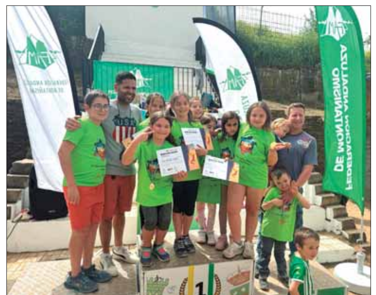
Los chicos y chicas de Rute participantes en el circuito con su monitor/MM

loró muy positivamente que la Diputación apueste por Rute como sede de este circuito. Además, felicitó a la Federación Andaluza y a los monitores de las escuelas municipales por el trabajo que desempeñan.