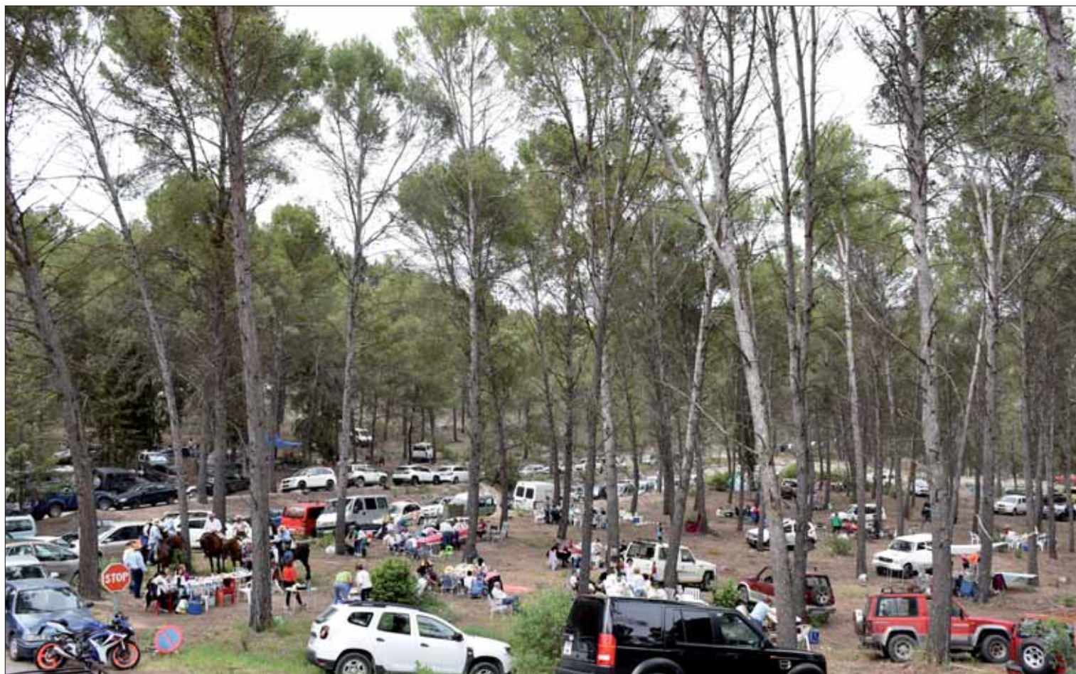
Una vez más, el Poblado del Pantano fue la zona más concurrida de este típico día de campo

Aparte del atractivo que en general supone encontrarse ahí, en algunos casos sumaban otros alicientes como la mejora del ac-