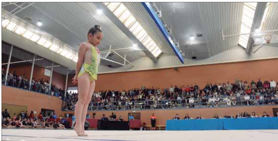
En total, hubo 650 gimnastas de 19 clubes, tanto de la capital como de otros pueblos de la provincia/FP

"muy técnica", necesita varias premisas, empezando por un equipo de monitores "que no es fácil de encontrar". En principio, la semilla existe, dada la aceptación que tiene en Rute todo lo relacionado con el baile. Y es que, si bien hoy es una disciplina olímpica, "Mani" recordó que la gimnasia rítmica "tiene su origen