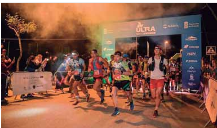
Chico se situó desde primera hora en los puestos de cabeza