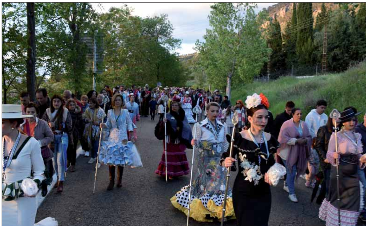
Salir a recibir a los Hermanos de Andújar es la tradición que anuncia las Fiestas de Mayo

Poco importa que los medios de locomoción hayan evolucionado a niveles impensables hace