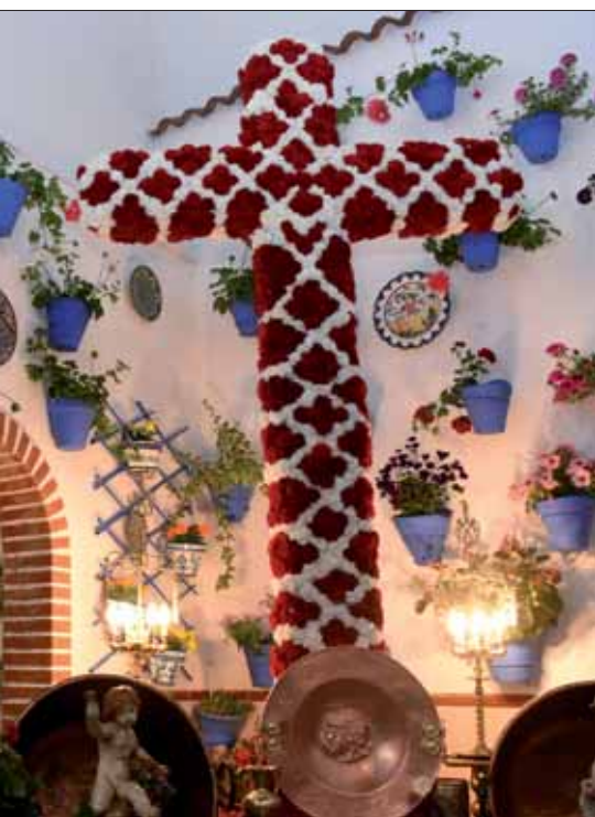
La ganadora ha recibido dos premios con la cruz y el balcón/FP