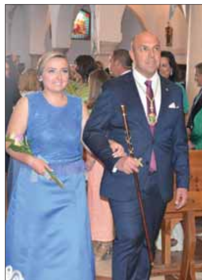
El alcalde acompañó a su hija/MM