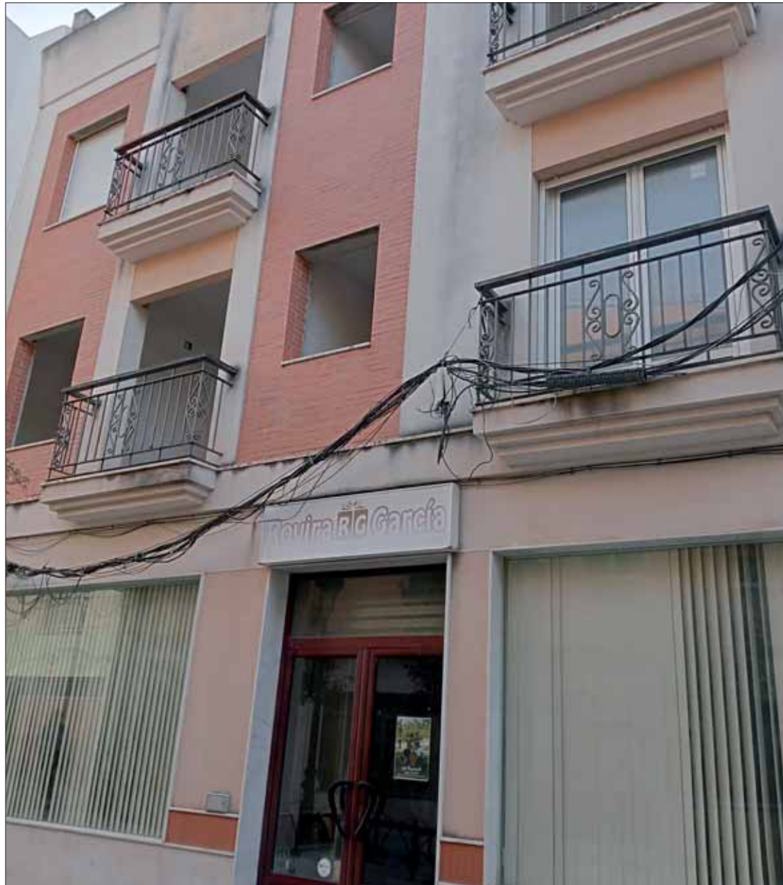
El inmueble afectado es el que se encuentra en la calle Del Pilar/EC

En un primer momento, la promotora compró el inmueble donde vivía el matrimonio. Después, los socios de ésta procedieron a hipotecar lo adquirido, y seguidamente éstos volvieron a firmar una escritura de venta por la que el matrimonio compraba sus futuros inmuebles sin ningún