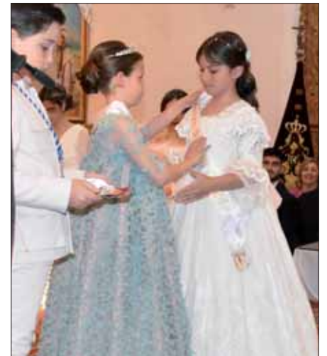
La reina infantil y una de sus damas/MM