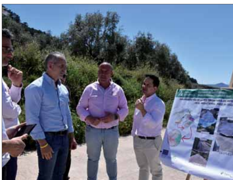
El alcalde y teniente alcalde acompañando al delegado Medio Ambiente/MM

construyó para albergar y proporcionar residencia a los ingenieros, técnicos y trabajadores que construyeron uno de los embalses más modernos y extensos del territorio nacional. El embalse afecta al término municipal de varias poblaciones de diferentes provincias andaluzas. Este embalse se construyó en 1969 y sus obras se prolongaron durante diez años. Se trata del embalse de mayores dimensiones de la Confederación Hidrográfica del Guadalquivir y el décimo de España.