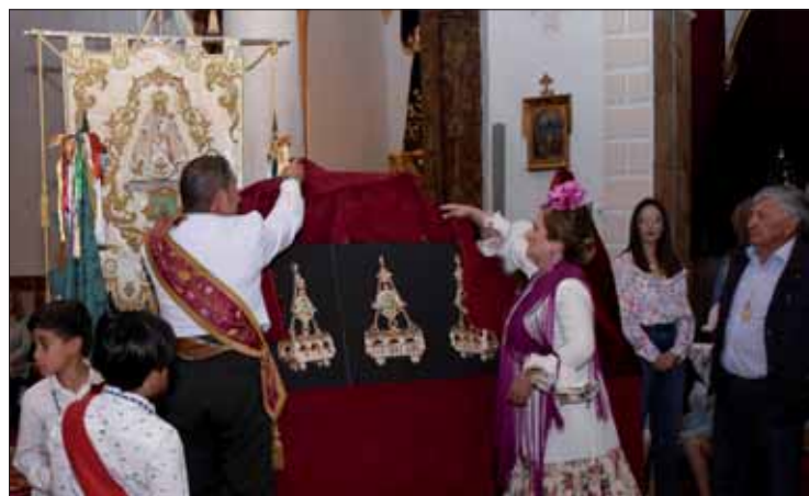
Imagen ampliada de la carreta donada por la asociación/FP

Entre los cultos y actos enmarcados en las Fiestas de Mayo de la Virgen de la Cabeza, la novena de este año viene marcada por sus múltiples predicadores. Comenzó el día 2 y a lo largo de estas noches han pasado por el atril de la parroquia de San Francisco de Asís hasta cuatro sacerdotes, para predicar a la Morenita. Junto a la participación de otros colectivos ligados a la Virgen, cada día se ha vuelto a contar, como de costumbre, con el acompañamiento del Coro de Romeros de la Real Cofradía/FP