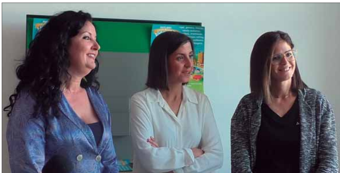
Representantes del área de Juventud y la empresa Alúa, que gestiona los campamentos/MM