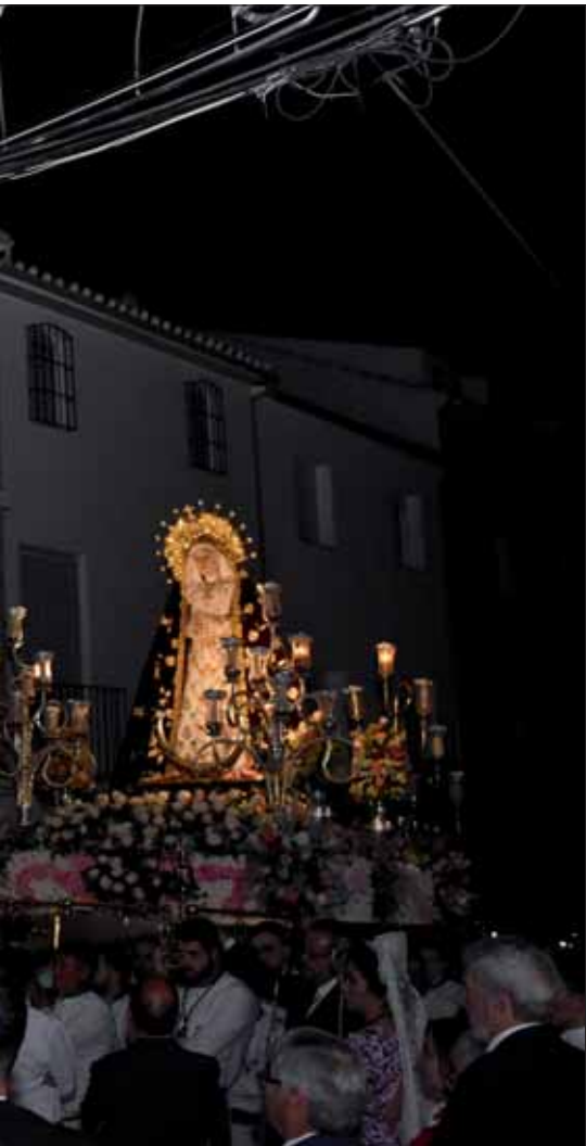
Por la procesión/FP

Natural de Osuna, pertenece a varias hermandades de esta localidad sevillana y ha sido el mantenedor de los XLII Juegos Florales