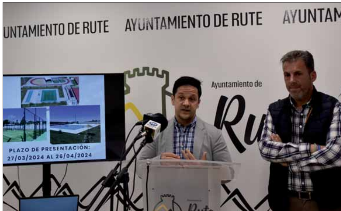
El teniente alcalde y el concejal de Deportes, durante su comparecencia pública

y cuatro mil euros, unos ciento cincuenta y ocho mil euros anuales. No obstante, la empresa o empresas interesadas en la prestación de estos servicios han podido optar a la totalidad objeto del contrato o bien a la contrata-