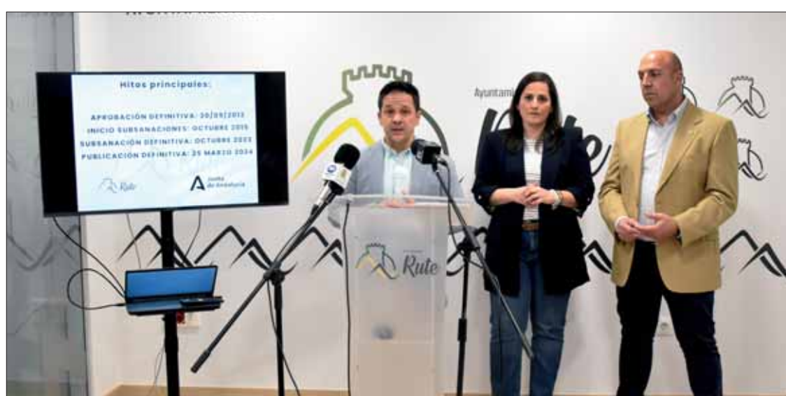
Los responsables políticos han destacado que habrá trescientos mil metros de suelo industrial/FP

Se pone fin, en efecto, a un proceso que ha tardado “catorce años”. Comenzó con la redacción y aprobación inicial de este PGOU, que reemplazaba a las obsoletas Normas Subsidiarias. Al cabo de tres años, la aprobación definitiva llegaría el 30 de septiembre de 2013, dejando en suspensión el suelo no urbanizable. Es decir, entonces quedó aprobado definitivamente todo lo relativo a suelo urbanizable y urbano consolidado. Dos años después,