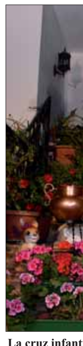
La cruz infantil