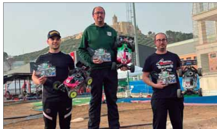
Pese a que el motor no respondía, el ruteño venció en Alcalá/EC