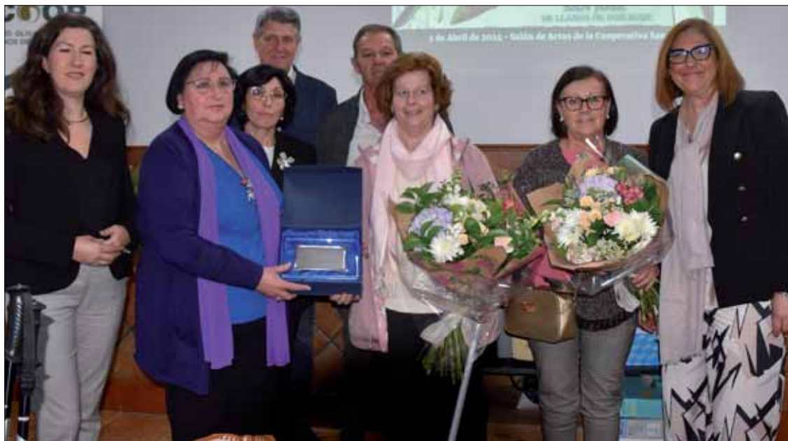
En esta edición, se hizo un reconocimiento público a tres mujeres por el trabajo y esfuerzo

Por segundo año consecutivo, la Cooperativa Agrícola “San José” de Llanos de Don Juan ha apostado por unas jornadas centradas en la mujer. Se trata de las II Jornadas de Mujeres Cooperativistas que tuvieron lugar el pasado día 2 de abril y tras el éxito que tuvieron las primeras. De nuevo se han vuelto a congregarse centenares de mujeres en el salón de actos de dicha cooperativa. Las jornadas perseguían que cada vez sean más las mujeres que están preparadas y dispuestas a dirigir sus explotaciones agrarias o estar al frente y representadas en los órganos de