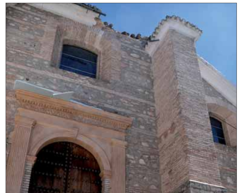
Estado en que quedaron la cornisa y la escalinata principal

Según ha precisado el propio sacerdote, el proceso total de reparación se ha prolongado durante un par de semanas. Las obras comenzaron poco después