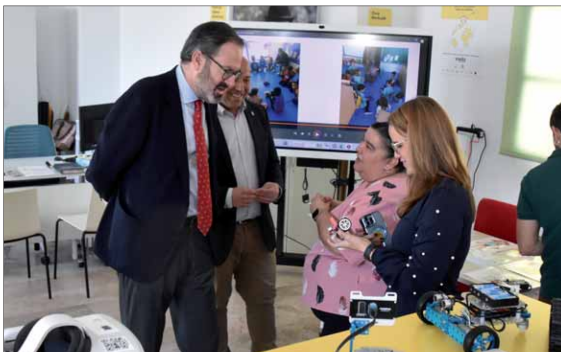
El delegado, la diputada y el alcalde comprobaron las prestaciones del Punto Vuela de Rute/FP

El caso de Rute no es aislado. La Junta tiene en el horizonte una inversión global de mil millones de euros en los próximos años. Según Adolfo Molina, la digitalización va a ser "el tercer pilar económico de Andalucía", junto al campo y el turismo. Para ello, había que afrontar una renovación no sólo de todos los equipa-