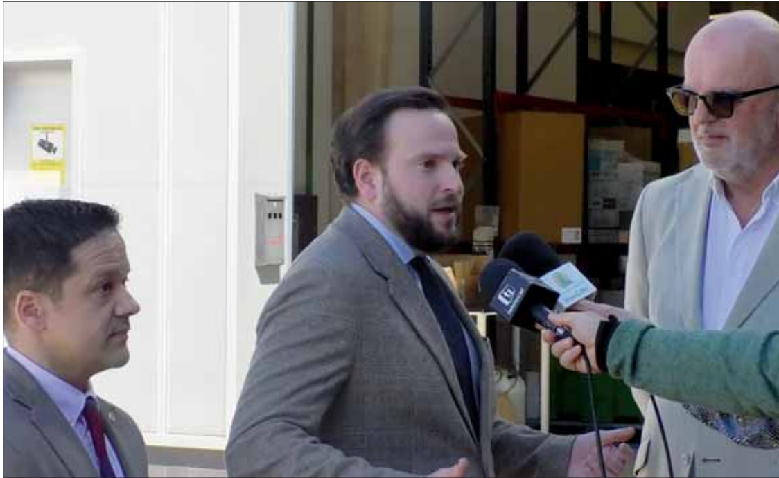
El delegado de Industria acompañado del gerente de Cruzber y el teniente de alcalde/MM

Se trata de un incentivo de la Consejería de Economía, Hacienda e Industria para una inversión total que supera el medio millón de euros