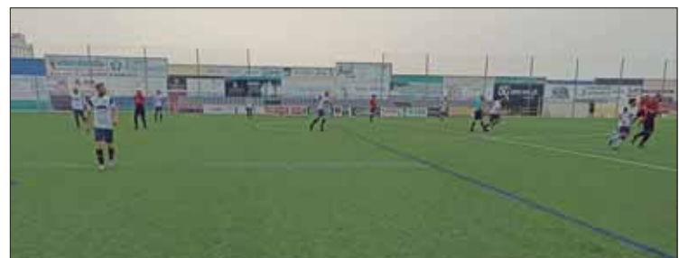
Uno de los últimos encuentros, disputado en Puente Genil

Todo ello da que pensar al técnico, que duda de la continuidad del proyecto deportivo para el año que viene. Sopesa esa posibilidad con tristeza. No sólo pondría fin a casi medio siglo de vida del club. Además, en los últimos años ha dejado de ser únicamente un equipo de Llanos de Don Juan. Las plantillas recientes congregan a jugadores de otras aldeas como Zambra, alguno de Lucena y bastantes del casco urbano, a falta de una sección senior del Rute Calidad.