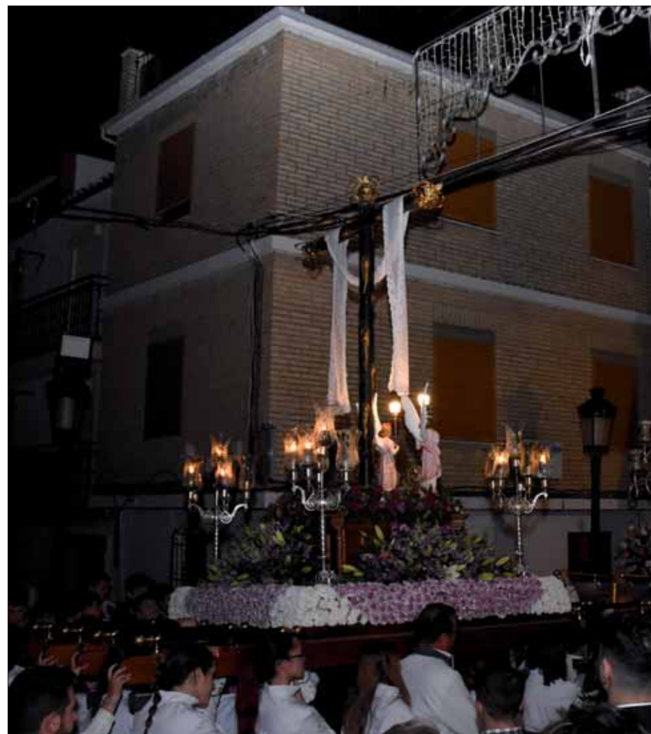
Tras subir en paralelo a su ermita, los dos pasos terminaron frente a frente antes de finalizar

Poco a poco iba quedando atrás una intensa semana de cultos y actos, para dar paso al momento cumbre de estos días, la procesión de la Virgen de la