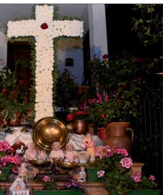
La ganadora tenía como temática las muñecas