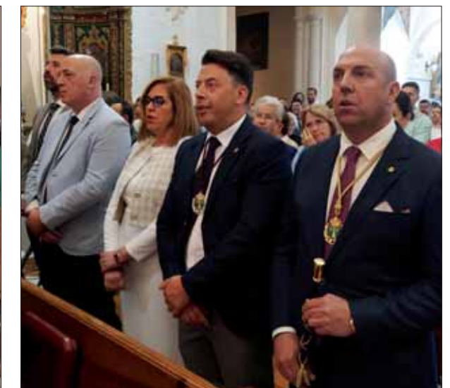
Miembros de la corporación presentes en el acto