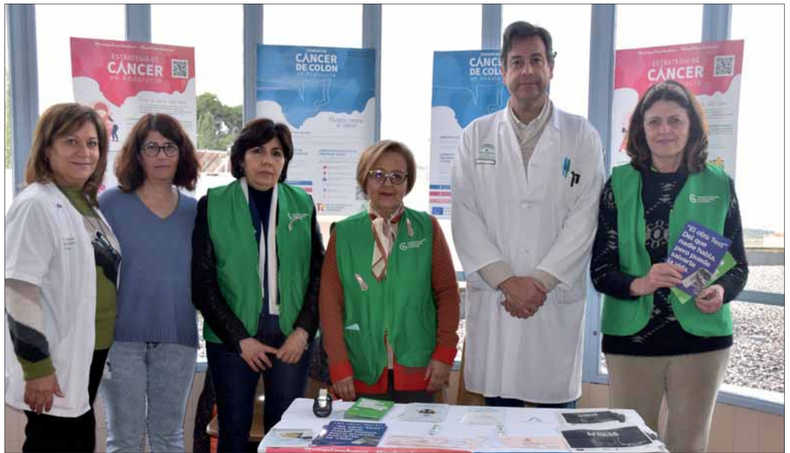
El personal sanitario y de la AECC habilitó una mesa informativa en el Centro de Salud/MM

sisten en la importancia de la prevención. Según datos del Ministerio de la Salud, en España más de siete mil personas fallecen cada año por esta enfermedad. El cáncer colorrectal es uno de los pocos tumores que, detectados en forma temprana, tiene un alto nivel de curación. Lamentablemente, muchas personas llegan a la consulta con un diagnóstico ya avanzado, sin ha-