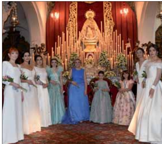
Las reinas de las fiestas y damas juveniles/MM