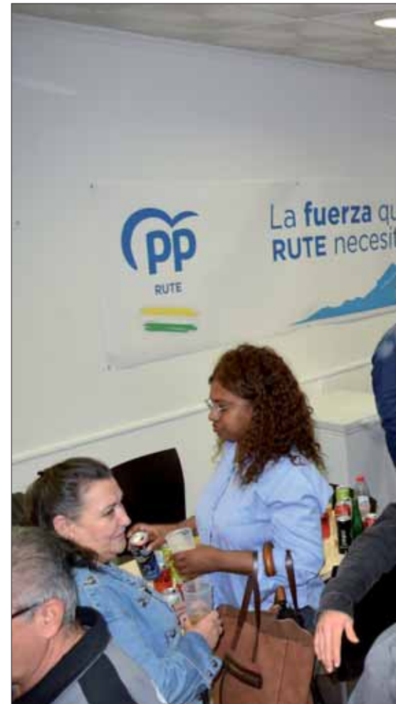
Decenas de militantes y simpatizantes se acercaron a