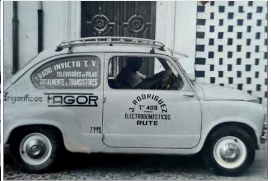
Una imagen del "seiscientos" con el que Rodríguez realizaba su trabajo