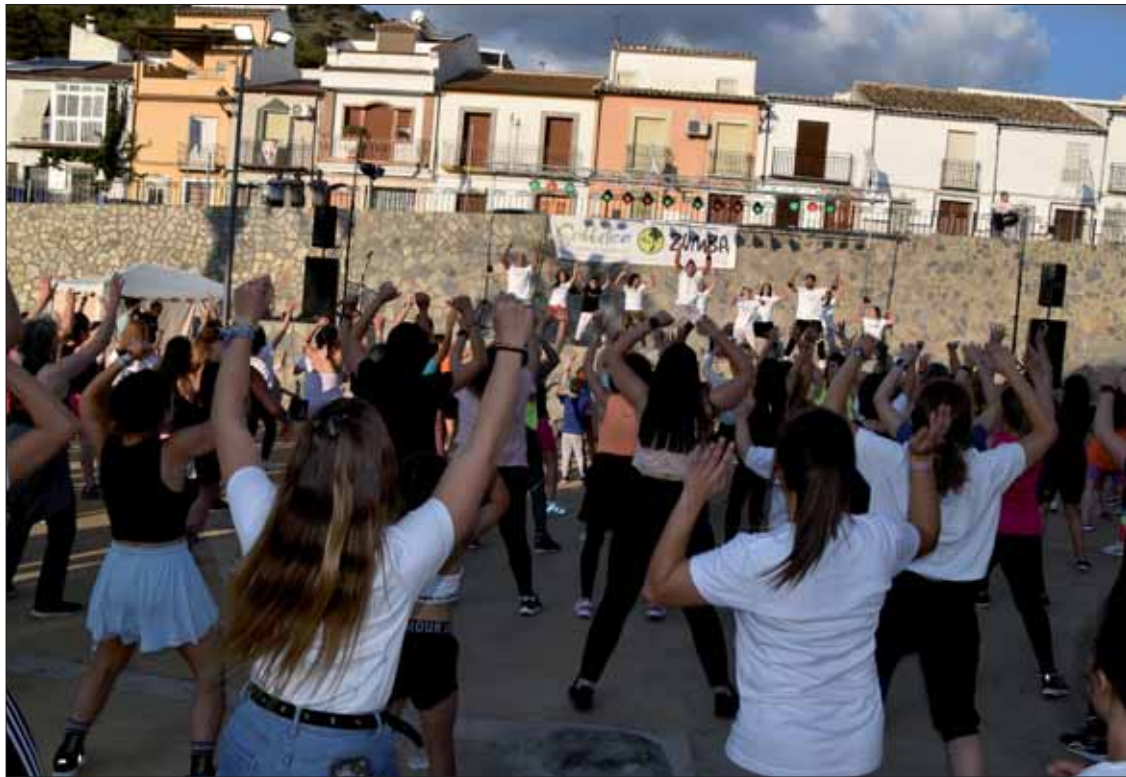
El Paseo del Fresno ha sido el escenario escogido para la clase magistral de zumba/MM

Además, Molina afirma que este tipo de actividades no sería