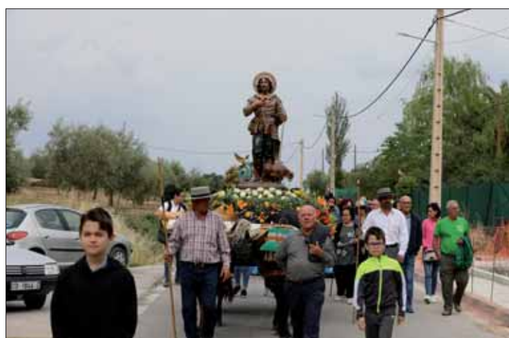
El recorrido matinal de San Isidro quedó marcado por la lluvia

De esta forma se puso fin a unas fiestas siempre entrañables,