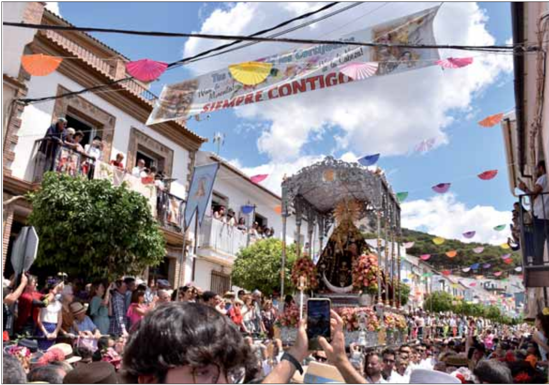
Los Cortijuelos sigue siendo el lugar donde el fervor por la Morenita alcanza su máxima expresión

Rute ha vivido un fin de semana plétórico de devoción por la Morenita con la ofrenda de flores y la doble procesión de la Virgen de la Cabeza en los días grandes de sus Fiestas de Mayo