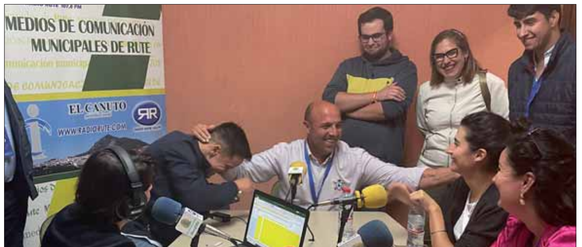
Los populares conocieron el sumatorio de todas las mesas en Radio Rute/FP