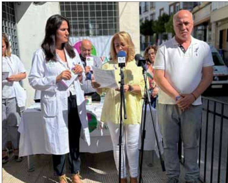
Caballero acompañada de representantes sanitarios y las autoridades/MM