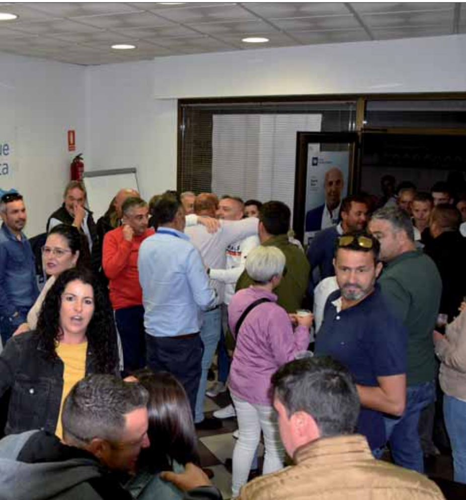
la sede popular tras conocerse los resultados para felicitar al alcalde electo