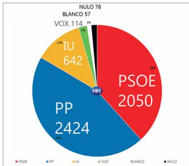
Resultados de las elecciones en Rute

dos últimas horas dejó en segundo plano la máxima de que “cada voto cuenta”, más aún en unas municipales. Sin que los resultados supongan un solo “pero” a la victoria del PP, los mismos datos del Ministerio del Interior confirman que el PSOE se quedó a tan sólo 39 votos de sumar otro edil, que habrían perdido los populares. De hecho, de haber restado directamente 21 papeletas al PP, las dos formaciones habrían vuelto a empatar a seis concejales.