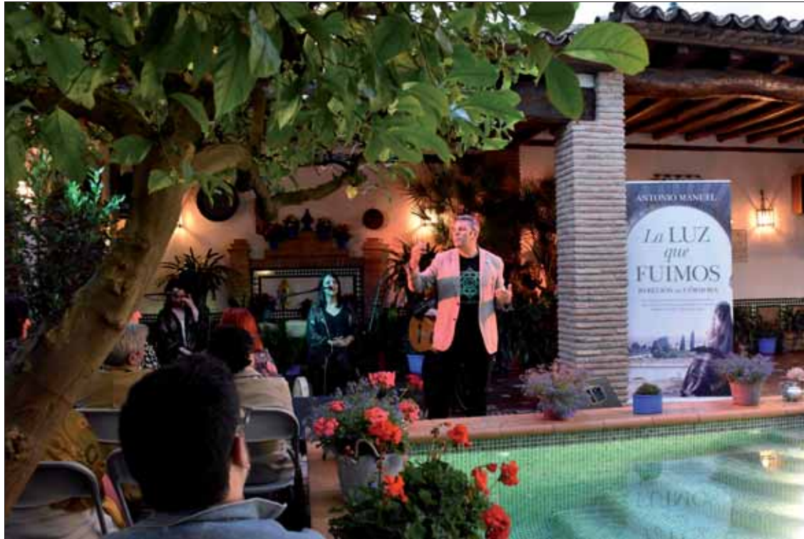
El autor se hace acompañar en sus presentaciones del grupo musical “Mujeres mediterráneas”

El escritor e intelectual presenta en Rute su novela histórica sobre un episodio apenas conocido del Califato cordobés