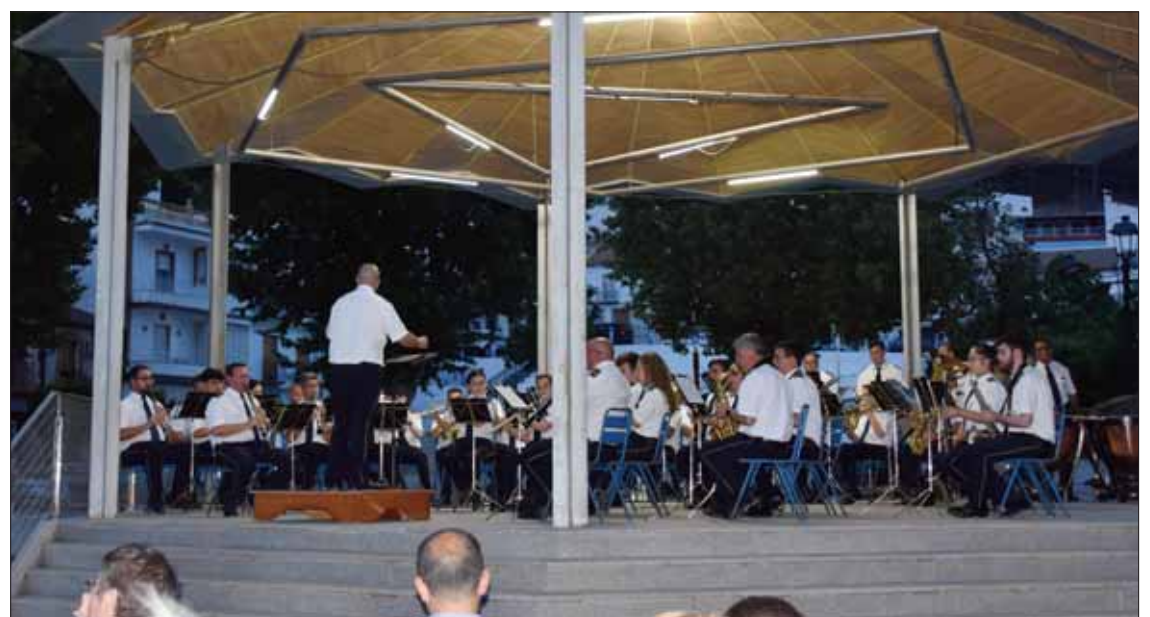
La banda actuará los domingos a las nueve, alternando el Paseo del Fresno y el Francisco Salto/MM

Sobre todo, considera que estos conciertos ofrecen la