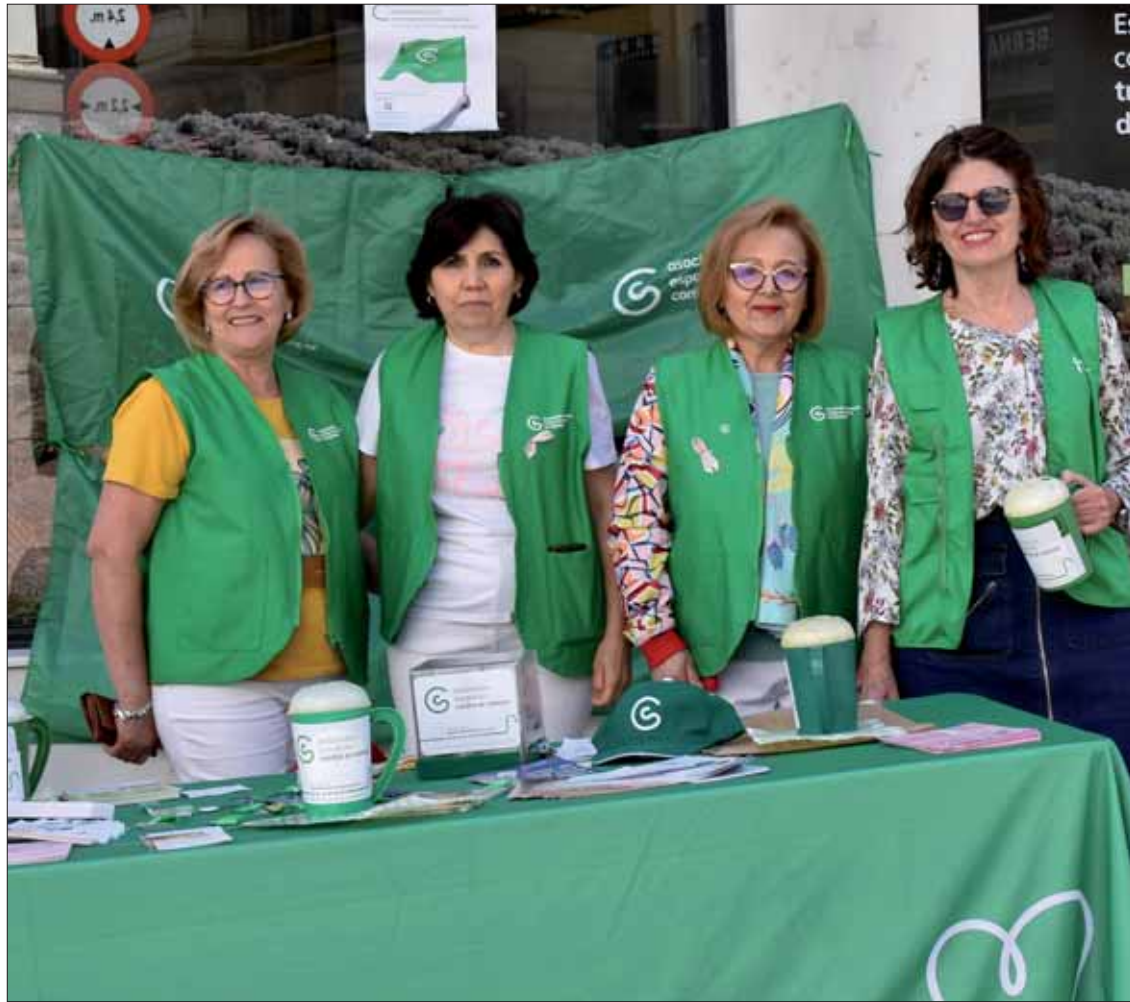
El voluntariado de la asociación se repartió en distintos puntos del casco urbano para la cuestación

Ésta es la única campaña de cuestación que llevan a cabo. El dinero que se recauda en esta jor-