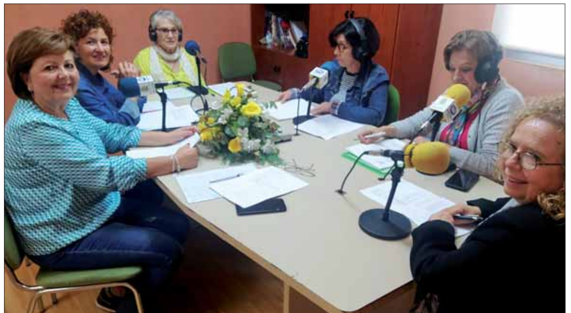
El programa se emite todos los martes a las ocho de la tarde

En la sección “Saber cuidarte”, Natividad Leiva entrevistó a la fisioterapeuta Rocío Padilla sobre las bondades del ejercicio físico y cuáles son los más adecuados, según la edad o las características de cada mujer