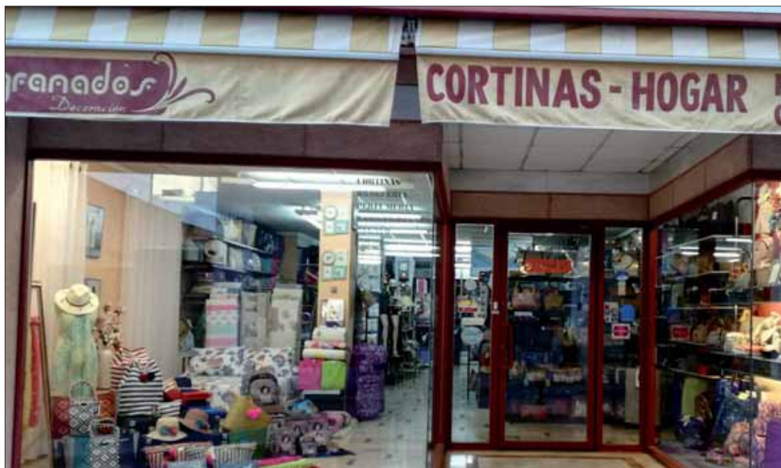
Una imagen actual de la fachada de Granados Decoración

Sin embargo, en 1987, uno de los hermanos, Francisco Granados, decide emprender su anda-