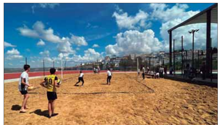
El torneo contó con la participación de quince parejas/A. López