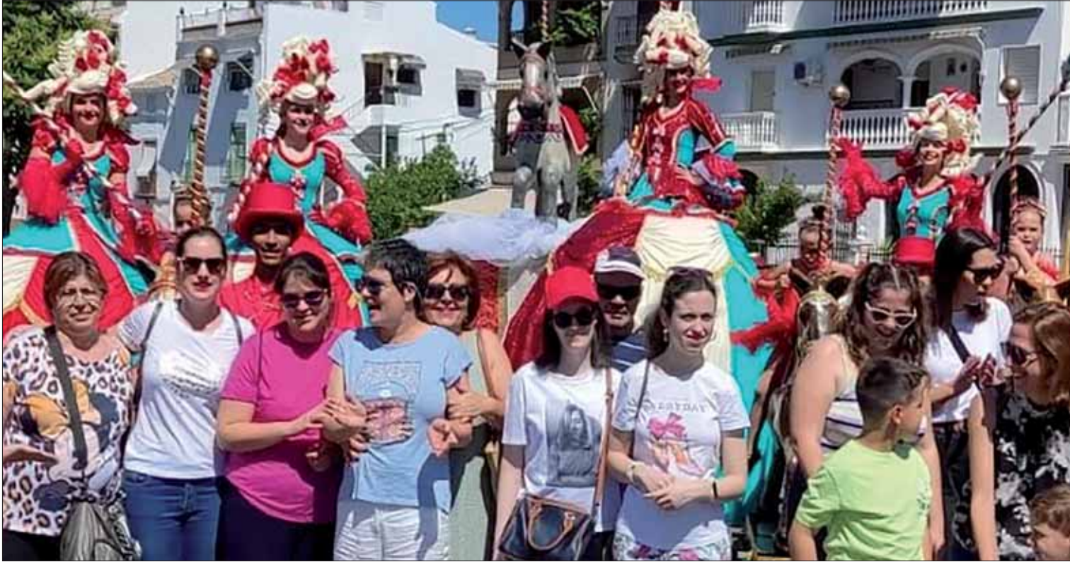
Una de las salidas programadas en el taller ocio y tiempo libre/EC

La asociación también ha renovado un convenio con la Diputación para el taller de especialización que llevan a cabo