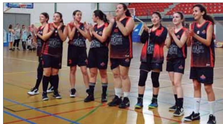
El equipo cadete femenino sólo ha dispuesto de ocho jugadoras

Idéntica posición ha repetido el cadete masculino, una de las novedades de este año. En su caso, también había doce equipos, pero han estado aún más mermados. Sólo tenían siete jugadores y uno se lesionó de gra-