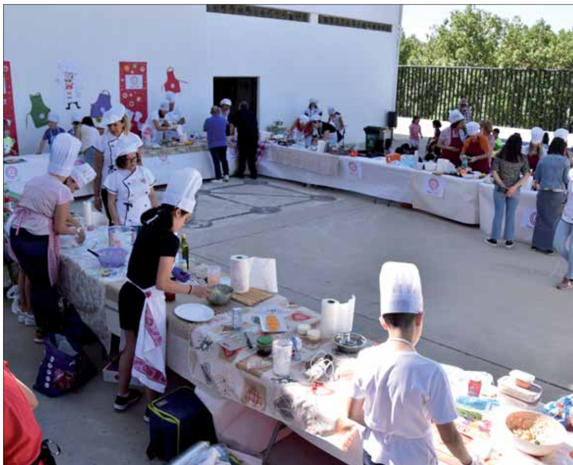
Junto a la alimentación sana, otra apuesta del concurso es el trabajo integrador y en equipo/FP

Con esa premisa, los criterios de evaluación siempre eran los mismos, aunque con clasificaciones distintas para escolares, fa-