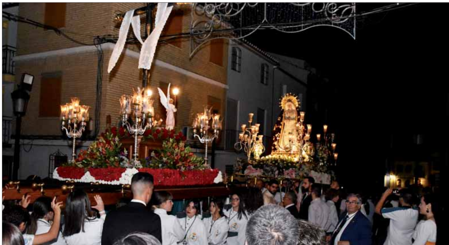
Los tronos de la Santa Cruz y la Virgen de la Sangre frente a frente, poco antes de terminar la procesión

No es un mensaje exclusivo del ámbito religioso. A nivel social, también son días de celebración y convivencia. El concurso de cruces reúne a vecinos y amigos, ya sea para elaborarlas o