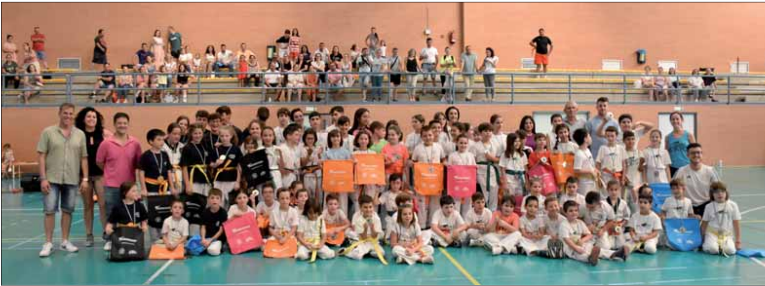
En esta edición del circuito se ha contado también con integrantes de otros clubes vecinos como son Gimmar y Koryo/FP