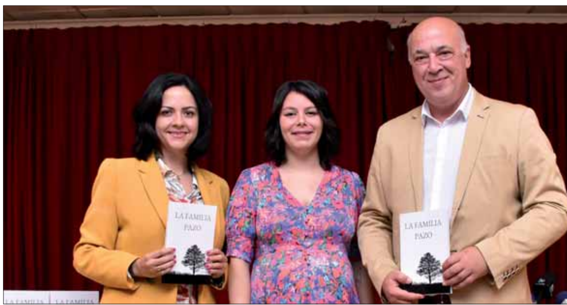
En la presentación, la autora definió su novela como “una carta de amor a la familia”/FP

La propia autora la define como “una novela costumbrista”. Eso sí, matiza que en este caso la trama gira en torno a “costumbres de Rute”. De sus muchas visitas y periodos de estancia en el pueblo, ha ido hilvanando “historias reales tomadas de la calle”. Según confesó, el