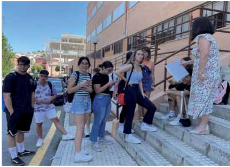
Parte de los jóvenes que tuvieron que repetir la prueba

La peor de las pesadillas para un estudiante que se enfrenta a pruebas tan decisivas como las de acceso a la Universidad se ha hecho realidad este año en Rute. Un total de 38 exámenes de la PEvAU celebrada en el IES Nuevo Scala se perdieron en la capital. Habían sido trasladados allí para que la Universidad de Córdoba (UCO) procediera a su evaluación. Eran los ejercicios correspondientes a las materias de Griego y Matemá-