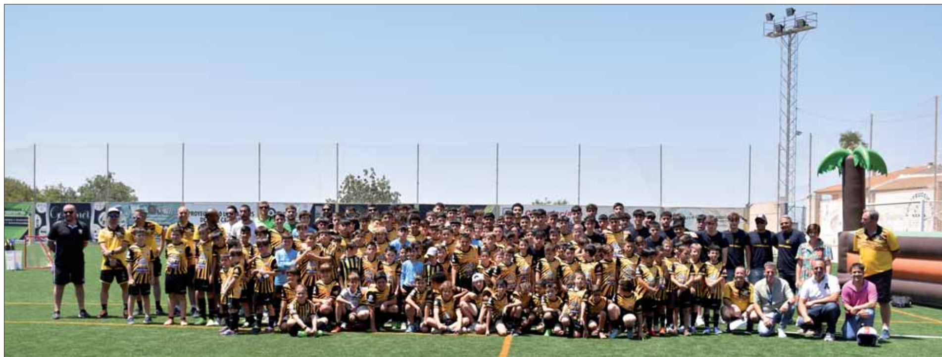
En torno a ciento ochenta jugadores han conformado las nueve secciones con que ha contado el club en esta campaña/FP