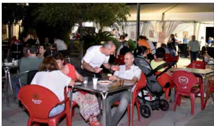
A estas citas veraniegas se ha sumado la Cata de cerveza del Carmen/FP