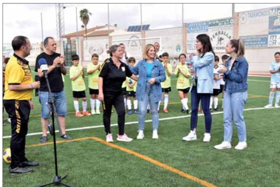
La directiva entregó un ramo de flores a las hijas del añorado presidente/FP

En esta edición, aparte de los anfitriones, han participado el C.D. San Marcos, de la vecina localidad