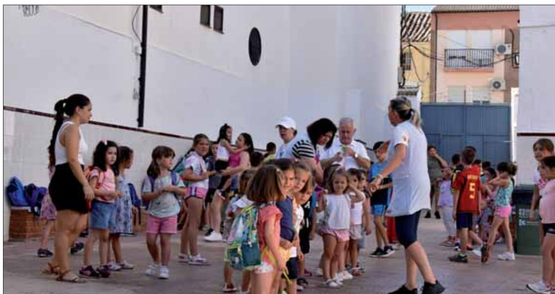
Las escuelas combinan un repaso distendido a las materias escolares con talleres didácticos/EC