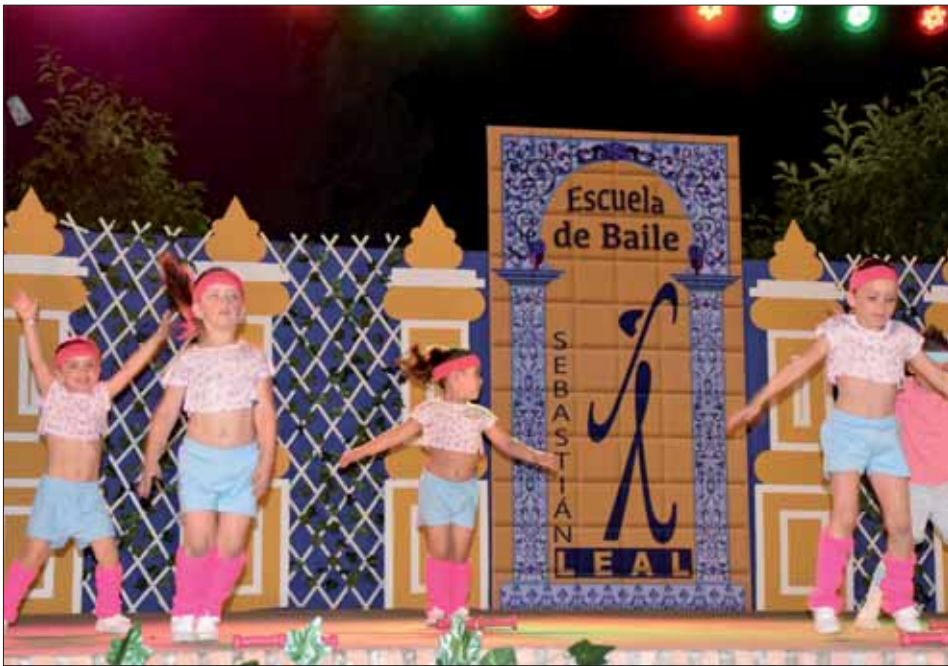
Los más pequeños con su número de gimnasia/MM

La presente edición incluyó 24 coreografías que fueron alternando bailes de flamenco, sevillanas o salón con disciplinas como el fitness, el pilates o la zumba