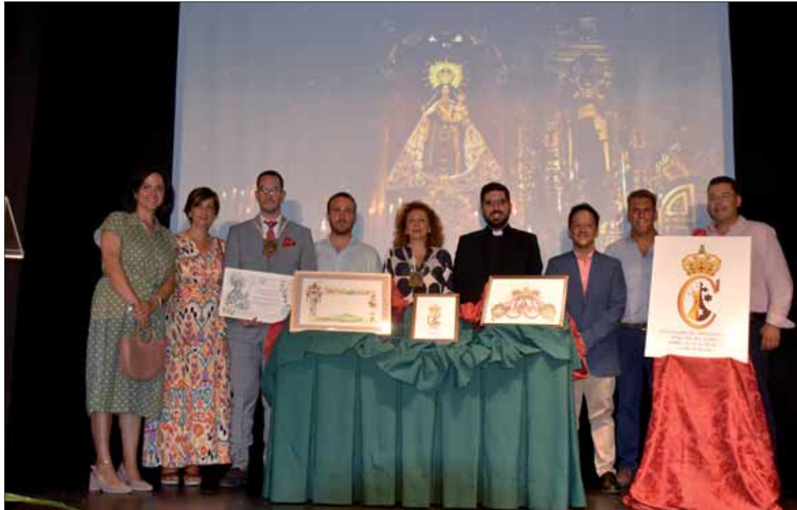
Los intervinientes del acto de presentación de los cultos del Año Jubilar y los representantes municipales/MM

Las actividades arrancarán en octubre y durante todo un año habrá seis salidas extraordinarias de la Virgen del Carmen, misas, encuentros de jóvenes y de auroras, mesas redondas temáticas y diversos actos de evangelización