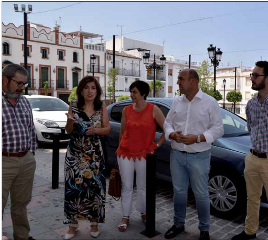
La delegada de Salud junto al desfibrilador, acompañada del alcalde y el presidente de la fundación/MM

Para la delegada, es importante que la Escuela Hogar sea un centro cardio-protégido