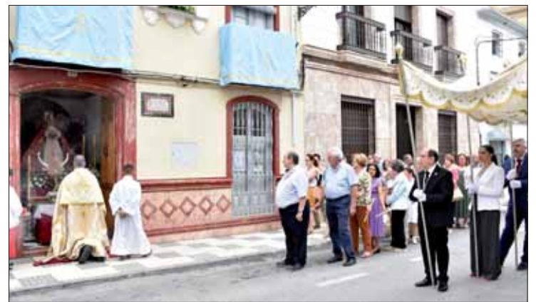
El cortejo junto al altar de la casa de hermandad de la Morenita

De esta forma, se cumplió el objetivo original con que se instauró esta celebración en España, que era pasar por lugares a los que la procesión ordinaria del Corpus no llegaba. La festividad dejó de celebrarse a finales de la