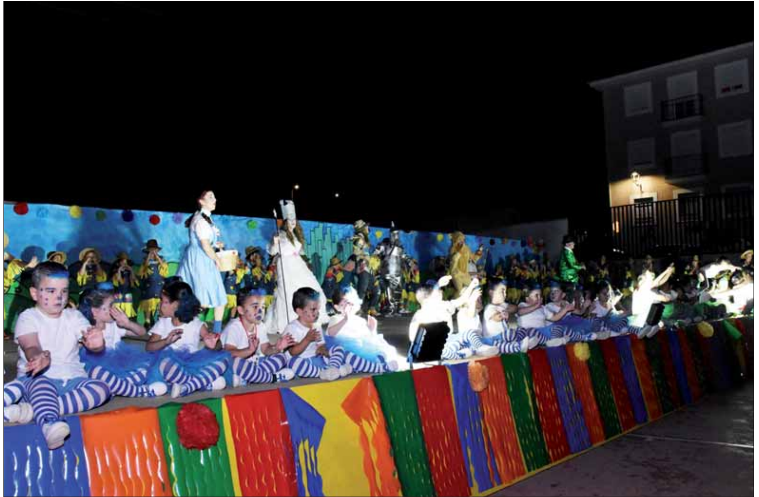
En la puesta en escena de “El mago de Oz” ha participado toda la comunidad educativa de Ruperto Fernández Tenllado

La primera jornada se hizo una yincana por equipos con doce pruebas. El segundo día fue una