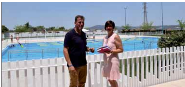
El edil de Deportes y la segunda teniente de alcalde junto a la piscina/MM

No obstante, Fernández se ha referido a unas manchas que han aparecido en el fondo de la piscina derivadas del mantenimiento aplicado para no tener que desperdiciar el agua durante el resto del año. Dichas manchas han alertado a los bañistas en los primeros días. En este sentido, el concejal ha aclarado que los usuarios no deben preocuparse por la salubridad de la piscina.