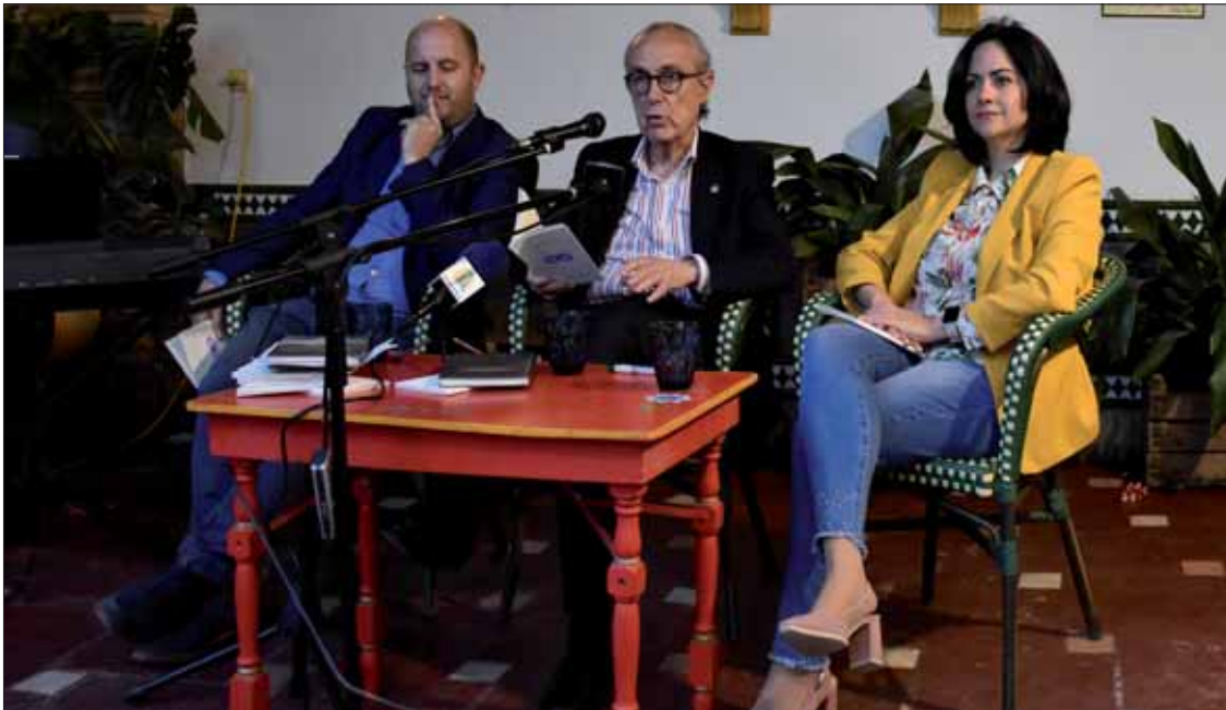
El acto incluyó la lectura a cargo del propio autor de varios poemas incluidos en su antología/FP

“Donde siempre es de día” es el segundo volumen de esta serie del Ayuntamiento que toma su nombre de un libro de este autor