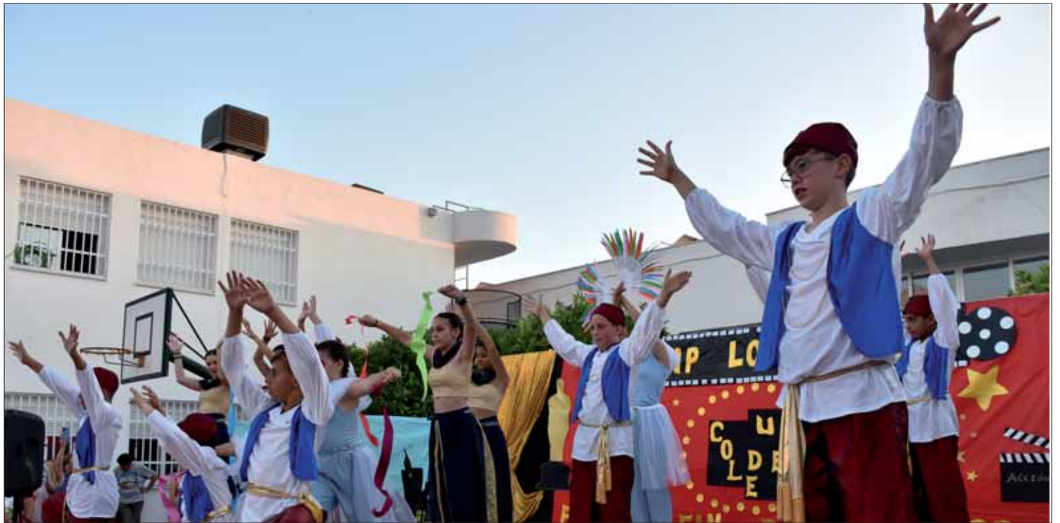
En Los Pinos se escenificaron coreografías basadas en películas como “Aladdín”