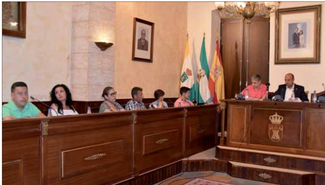
Tras la constitución de la nueva Corporación, éste ha sido el primer pleno de carácter extraordinario/MM

De igual modo, en el pleno quedaron fijadas la periodicidad