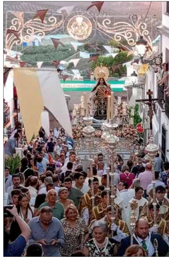
La subida de los Barrancos depara una de las imágenes