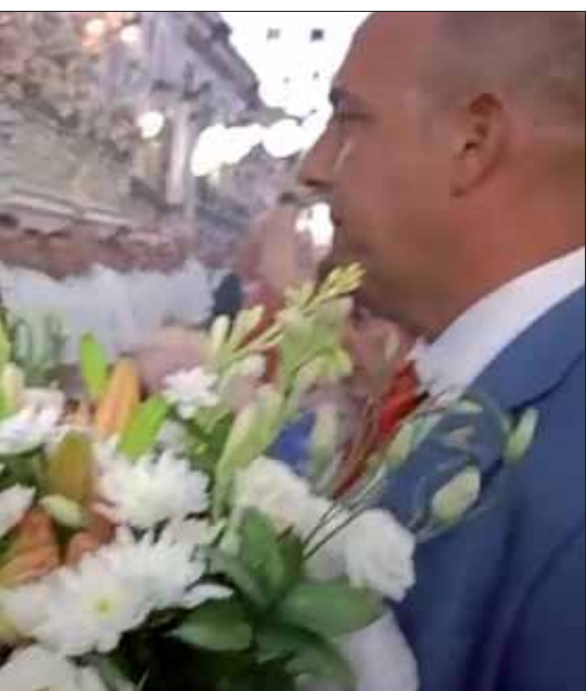
Entrega de un ramo de flores a la Patrona/MM