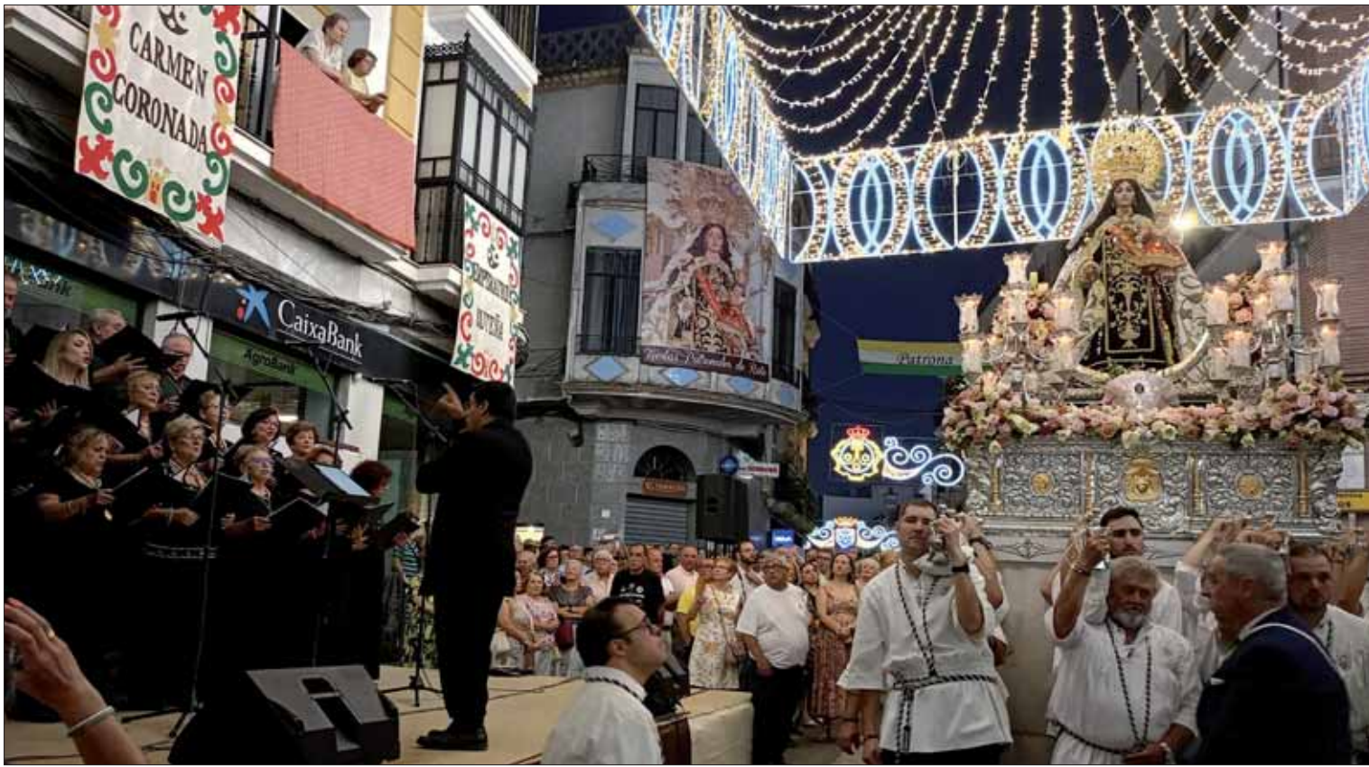
La interpretación de la Coral Polifónica fue uno de los momentos más destacados del Traslado/MM