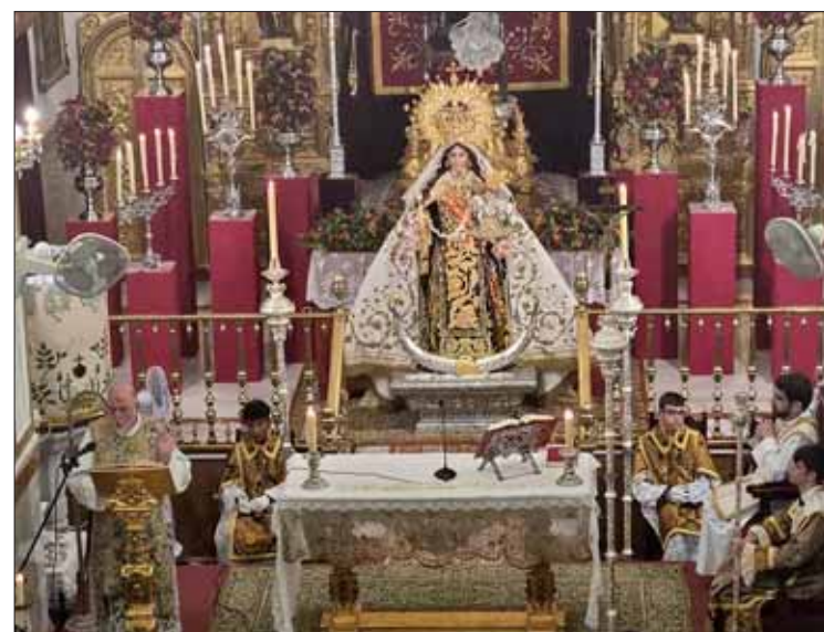
Un momento del triduo celebrado a mediados de julio