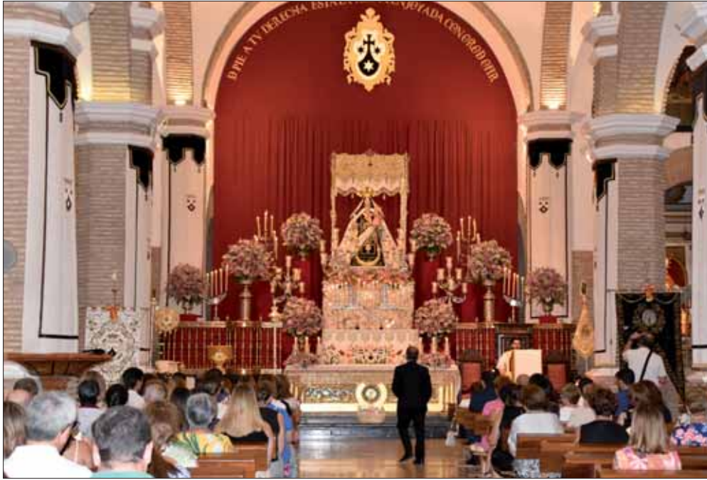
Desde el Traslado la Virgen del Carmen preside el altar de Santa Catalina