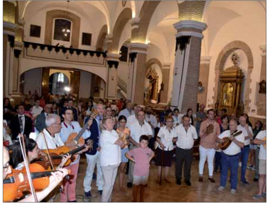
Cada noche de novena ha concluido con los cantos de los Hermanos de la Aurora/MM