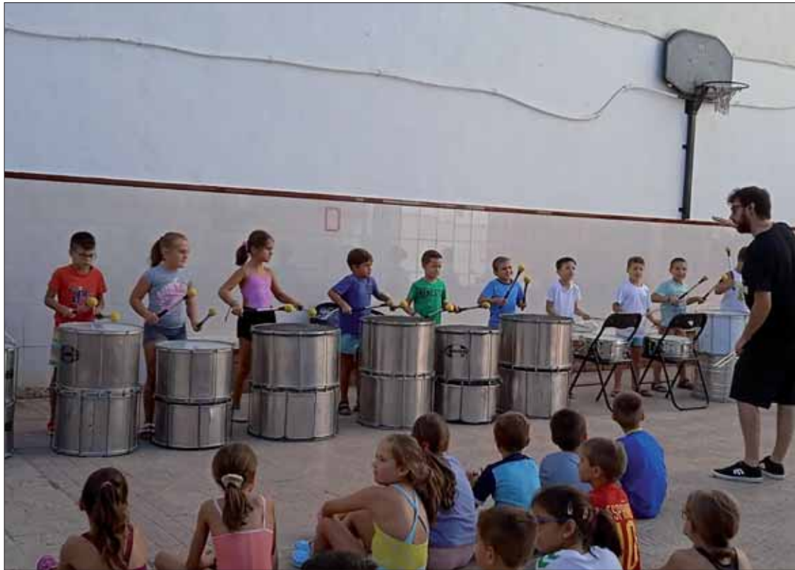
Los miembros de Arte Samba durante la jornada de clausura de las escuelas de verano

les tuvieron la oportunidad de conocer los talleres de verano y las necesidades de este centro. Las escuelas han sido monitorizadas por el personal de la Escuela Hogar, aunque este año también se ha contado con algún monitor extra. En este sentido, Pino ha