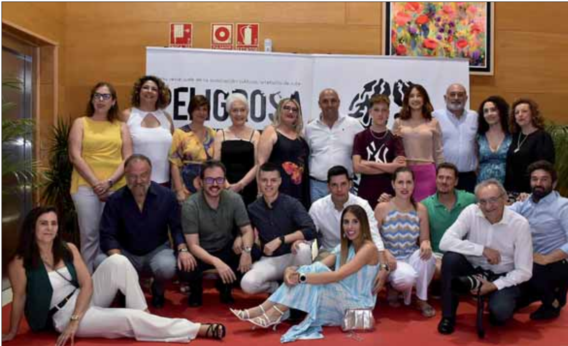
Parte del amplio elenco de la serie tras el estreno en el CEMAC Pintor Pedro Roldán/FP

“El mecanismo de los relojes” es el título de la nueva entrega de la webserie producida por la asociación Artefacto