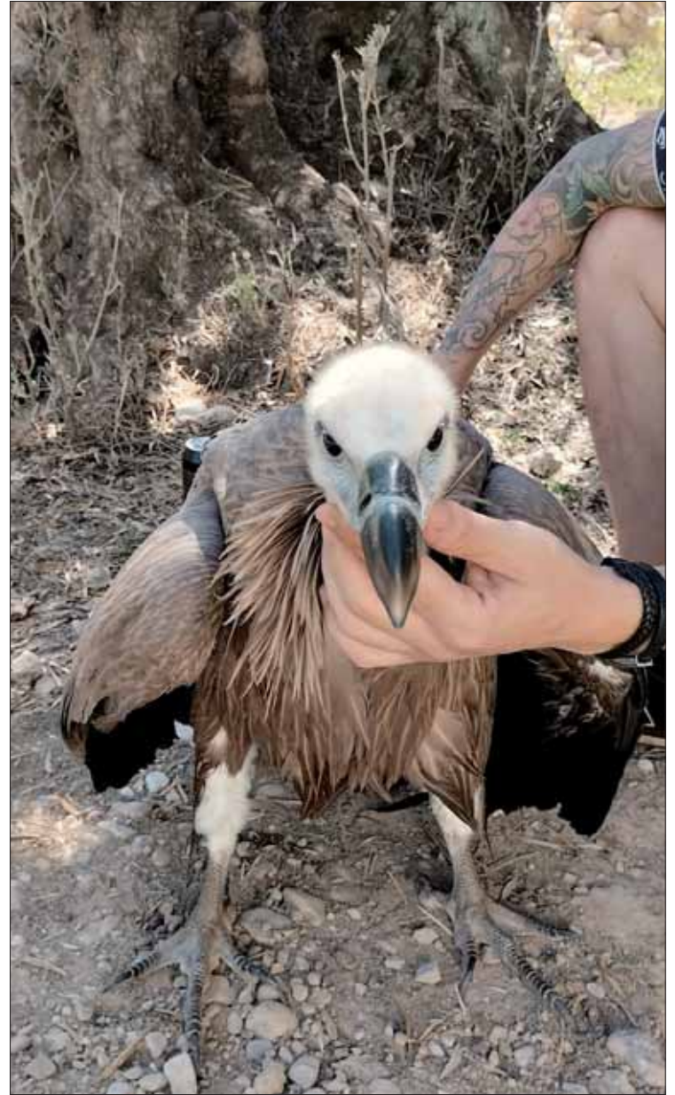
El buitre rescatado por los agentes tras el aviso de unos jóvenes

En el caso del buitre leonado, estamos ante una especie protegida. Aunque no está amenazada y hay ejemplares en el norte de África, Europa y Asia central, se calcula que en nuestro país se concentra el 75% por ciento de la población mundial y el 90% de la europea. En el entorno de Rute es habitual verlos sobrevolando parajes como El Lanchar o en el interior de la sierra.