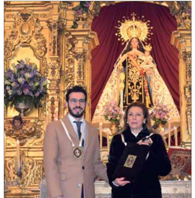
El pregonero y la presidenta en el triduo del patronazgo/MM