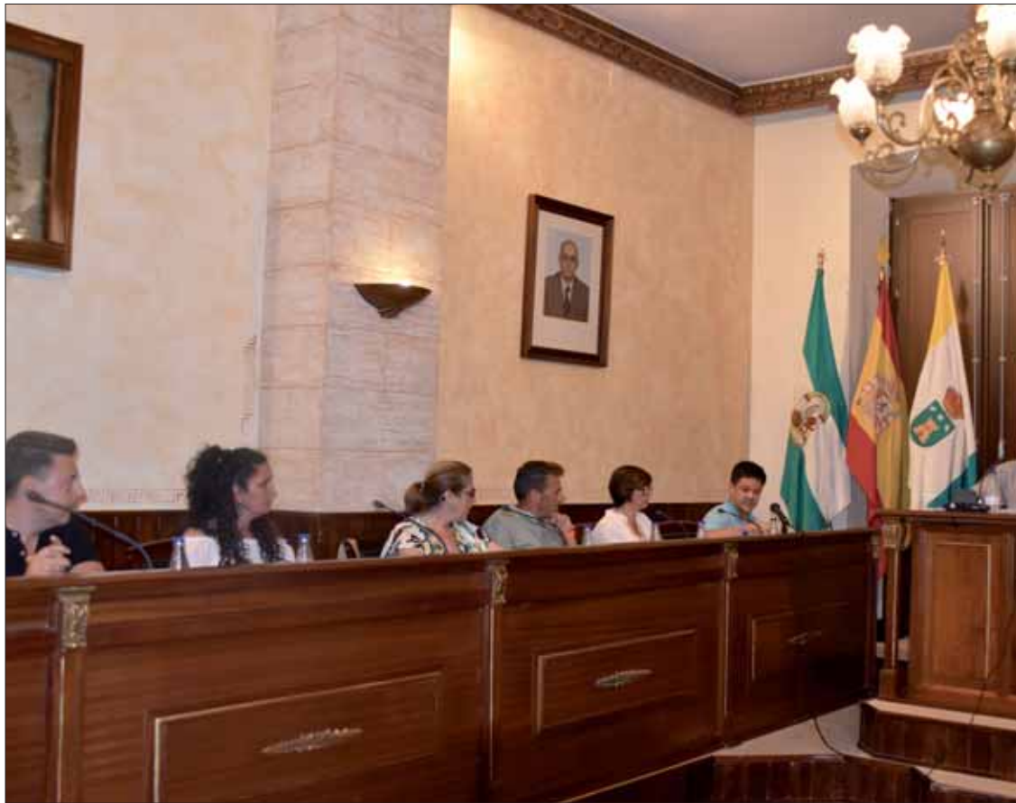
Los concejales del nuevo equipo de gobierno municipal/MM

Sin embargo, desde un primer momento, PSOE e IU siempre han defendido una iniciativa que consideraban de gran envergadura y que suponía apostar por un pueblo más transitado y peatonal. Por eso, se reunieron en esas semanas con los vecinos y los representantes del PP para buscar alternativas, con objeto de que el proyecto continuase.