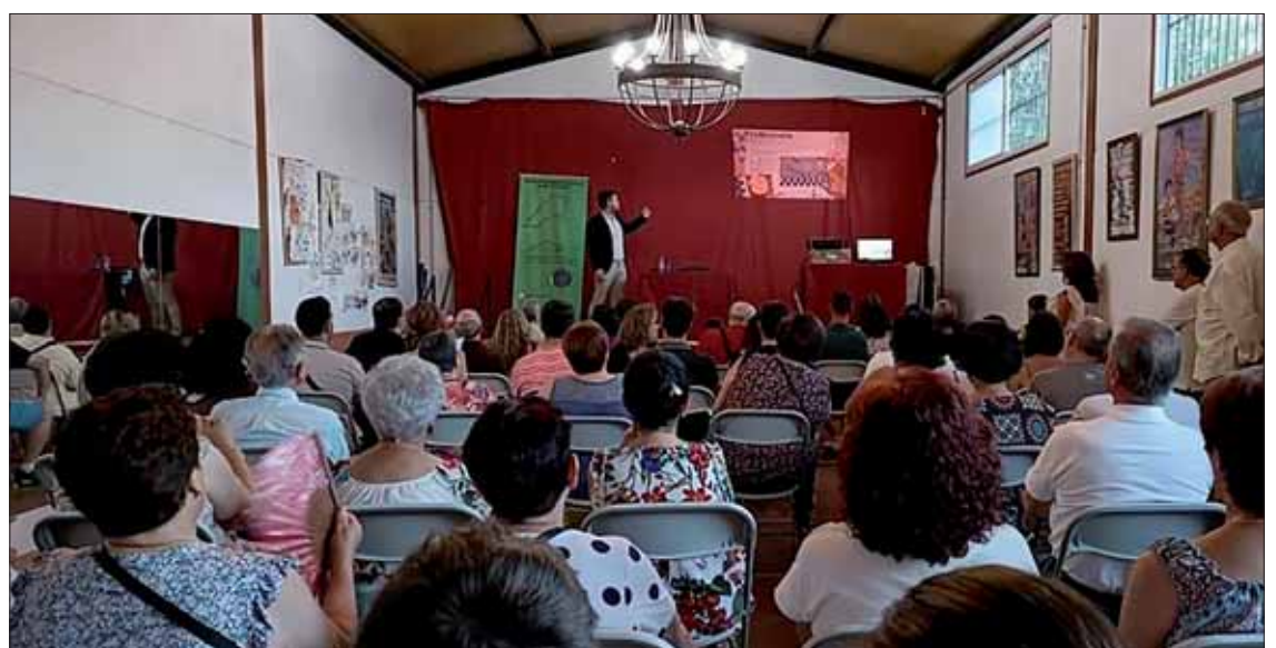
La ponencia del arqueólogo ruteño tuvo lugar en el Centro Cívico de Zambra/EC

Se trata de vestigios que se encuentran en superficie y que evidencian la existencia de villas