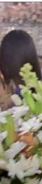
El alcalde hace