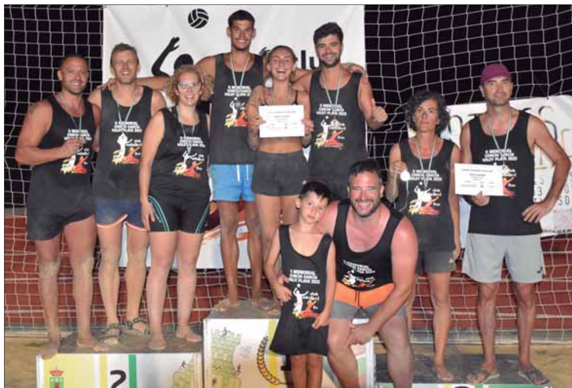
Los tres equipos premiados en la modalidad de mixtos en esta edición del torneo/EC

Rute, jugadores y jugadoras de la década de los años 90, que militaron en Primera y Segunda División Nacional, respectivamente. A estos veteranos se sumaron algunos de los jugadores destacados de las últimas generaciones,