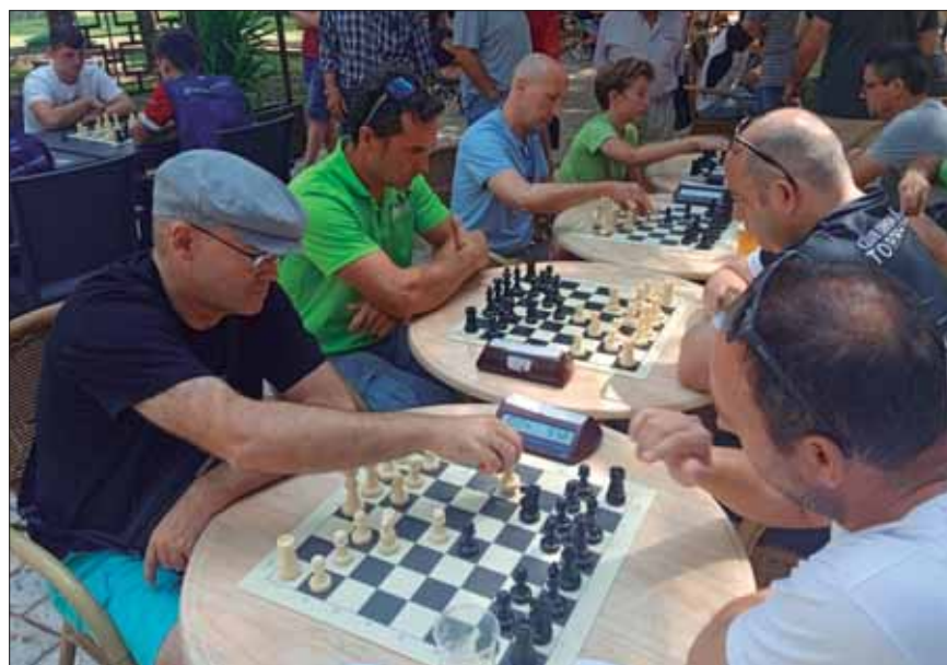
Los ruteños (a la izquierda) se impusieron en los cuatro tableros de la final

A priori, dada la entidad de los rivales, se antojaba inalcanzable adjudicarse el torneo. Sin em-