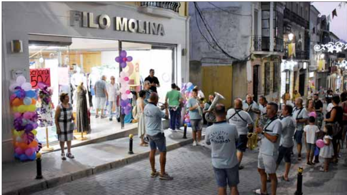
Junto a la animación en las calles, los escaparates se han decorado de forma especial para estas noches

La idea es poner en valor el comercio local e incentivar las compras en familia