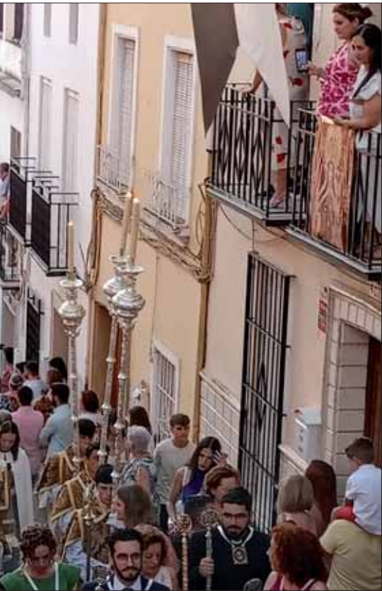
Escenas más icónicas de la jornada