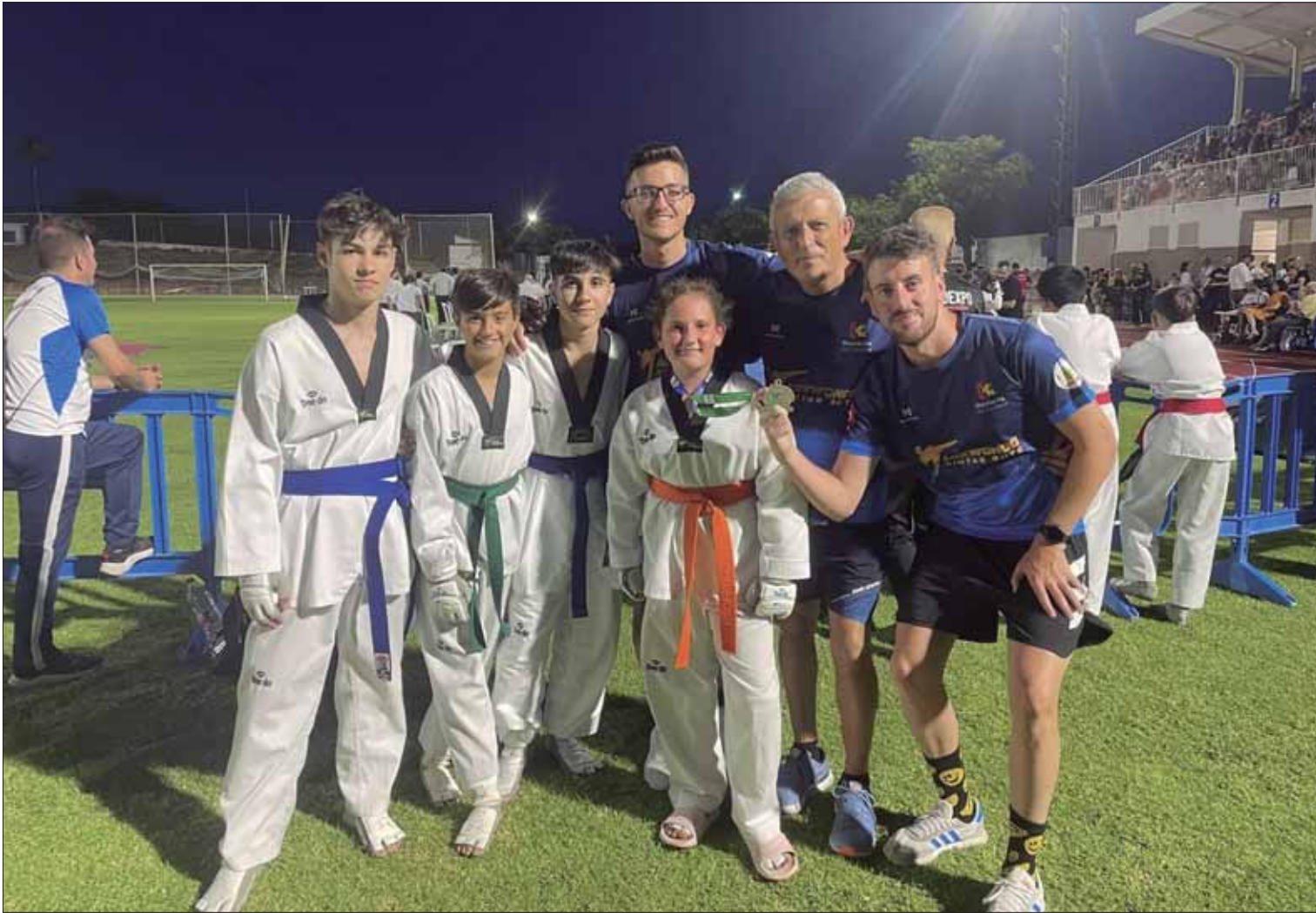
El club ruteño ha tenido una actuación brillante en esta cita que congregaba a las mejores promesas del taekwondo andaluz

consiguió meterse en la final y llevarse la plata en menos de 41 kilos. Ya en la final, cayó ante un adversario bastante complicado, de mayor edad y cinturón.