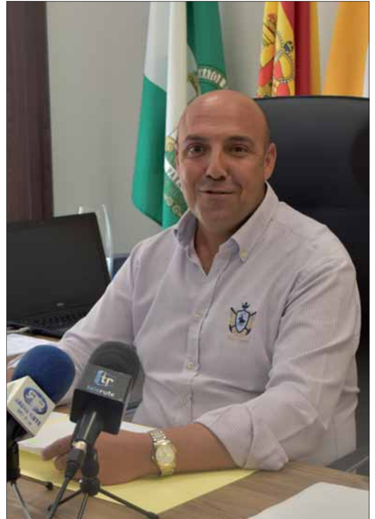
El alcalde espera tener corregida la situación en año y medio/MM

Asimismo, va a haber recortes con los gastos generados con las verbenas. Se va a intentar llegar a un acuerdo para celebrar sólo una o dos al año. De esta forma, no se perjudica al sector de la hostelería y se disminuye el gasto municipal que generan estas verbenas. Como contraprestación, prevén incrementar las subvenciones a las cofradías o hermandades.