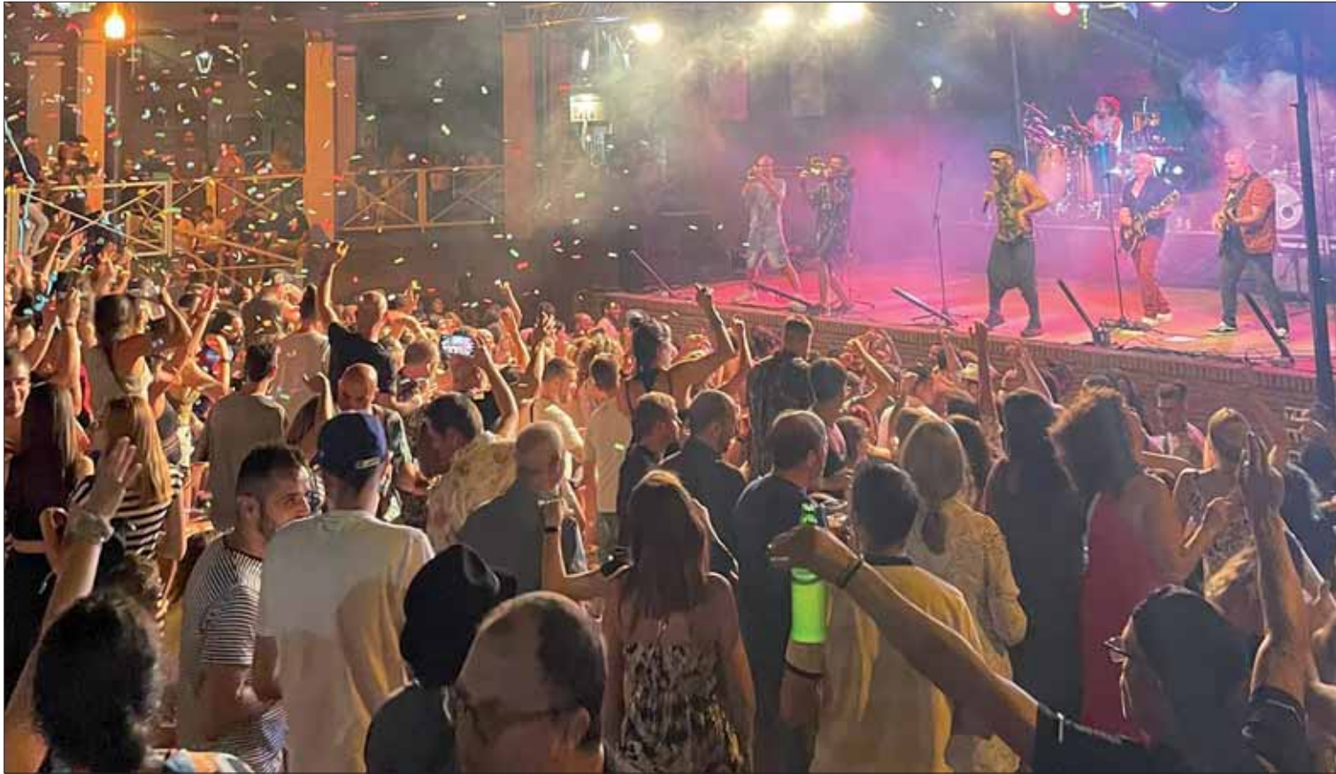
El grueso del Festival se ha desarrollado en el Parque Nuestra Señora del Carmen, con actuaciones como la de “Eskorzo”

El festival ha alternado actuaciones destacadas, como la de “El Jose” y “Eskorzo”, con talleres de música afro, exhibiciones de batucadas y un mercadillo artesano