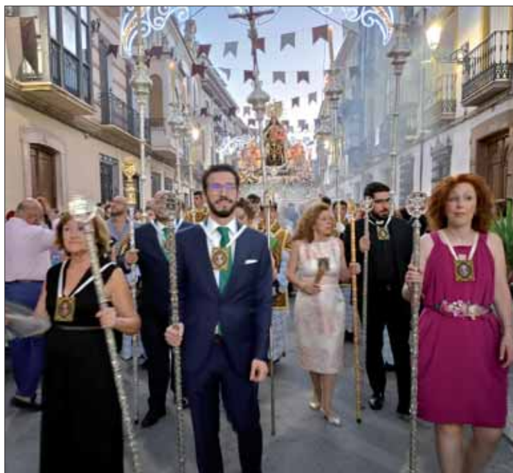
El pregonero y miembros de la real archicofradía/MM