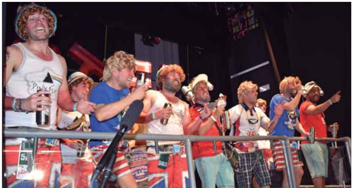
“No me pises, que llevo chanclas” han vuelto a llevar el nombre de Rute a plazas como Málaga/MM

Con las dos chirigotas ruteñas disfrutó el público que llenó el CEMAC Pintor Pedro Roldán en la tarde del sábado 18. Con la presentación “personal” del colectivo “El Pisiasso”, el certamen de agrupaciones permitió que ambas formaciones abordaran un repertorio de temática más local. En los cuplés, dieron algún “tirón de orejas verbal” a alguna personalidad del pueblo. Y en los pasodobles mostraron el lado más crítico, para que no se pierda la esencia del Carnaval, pero también el más emotivo, bien a través del repaso de los guiris a las murgas históricas de Rute o ese homenaje de los loteros al Barribalto.