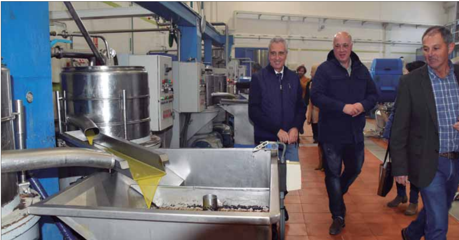
El presidente del GDR y el alcalde ruteño junto al presidente de la cooperativa durante su visita/MM

Cerca de veintitrés mil proceden de fondos europeos y han sido gestionados a través del Grupo de Desarrollo Rural de la Subbética