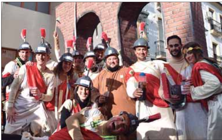
Hasta un acueducto romano se pudo ver en las calles de Rute