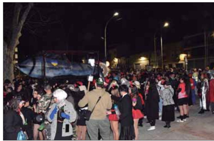
Decenas de personas despidieron a la sardina

la sardinita infantil aún no sean conscientes de estos preceptos. Pero, como toda religión, el Carnaval es también una cuestión de creer sin ver. Si antes tuvo un carácter politeísta, con cada colegio organizando su propio sepelio pesquero, desde hace unos años “la sardinita” abrazó el monoteísmo de la adoración y último adiós a un mismo pez fiambre. La peregrinación ha discurrido en esta edición entre el templo de Fuente del Moral y el ágora del Paseo del Fresno, para que la plaza pública acogiera la purificación a través del fuego.