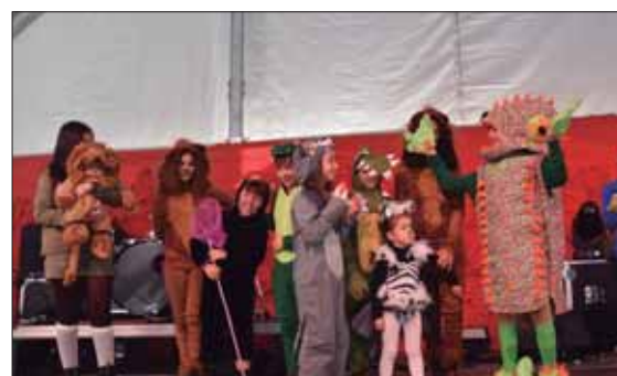
Menores con todo tipo de disfraces en el concurso/MM