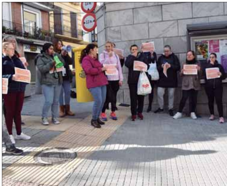
El personal de la ayuda a domicilio ya han hecho varias concentracion/FP

De forma paralela, confían en que otros sindicatos como UGT o Comisiones Obreras no firmen nada por debajo del IPC, “como