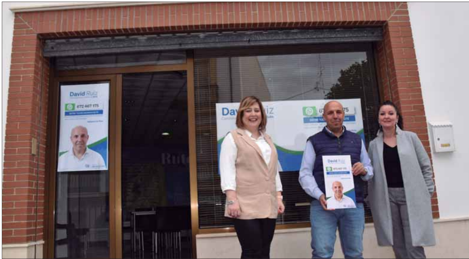
Los populares presentaron la iniciativa ante su nueva sede

La presentación coincidió con el estreno de la sede, que se abrirá en horario de tarde para atender de forma presencial