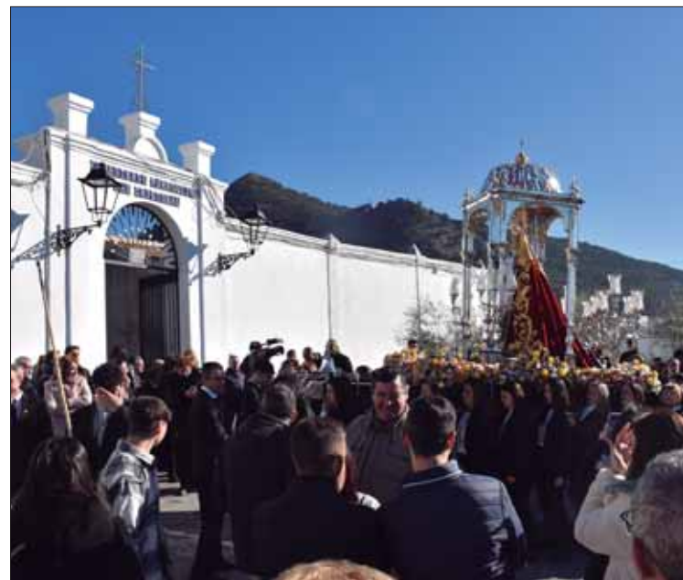
En el rosario matinal de febrero la Morenita sí subirá al cementerio

Ello dio pie a una serie de salidas extraordinarias de las imágenes de la parroquia. Para ello se buscaron fechas señaladas, no laborables, como la festividad de la Candelaria en el caso del rosario de la Virgen de la Cabeza o el Día de Andalucía para el Vía Crucis de Jesús de la Rosa. Lejos de quedarse en algo extraordinario o puntual, en el caso de la Morenita se acabó incorporando el programa oficial de cultos y actos para el domingo más cercano al 2 de fe-