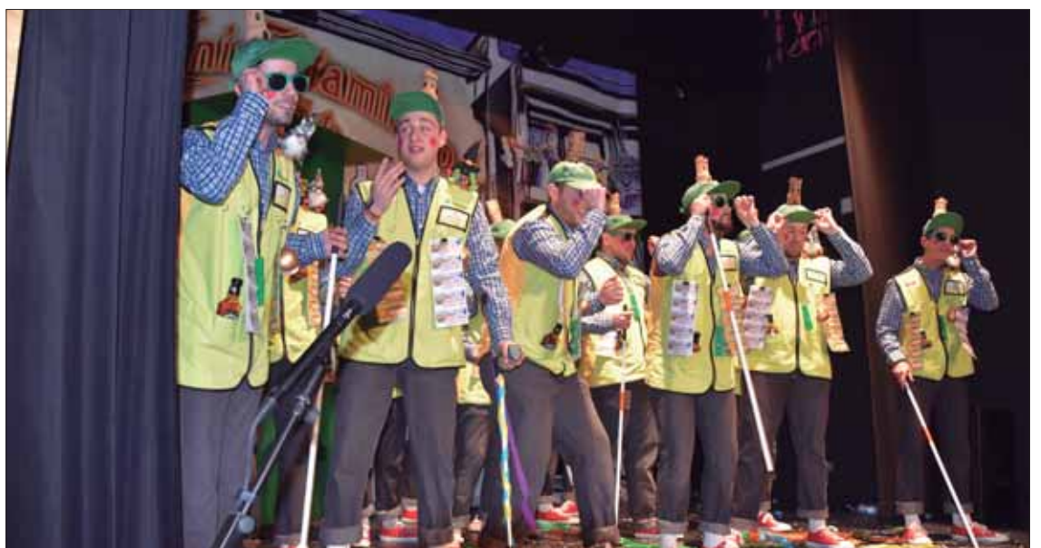
“Suerte vendo que pa’ mí no tengo” es la evolución como chirigota de la joven comparsa/MM