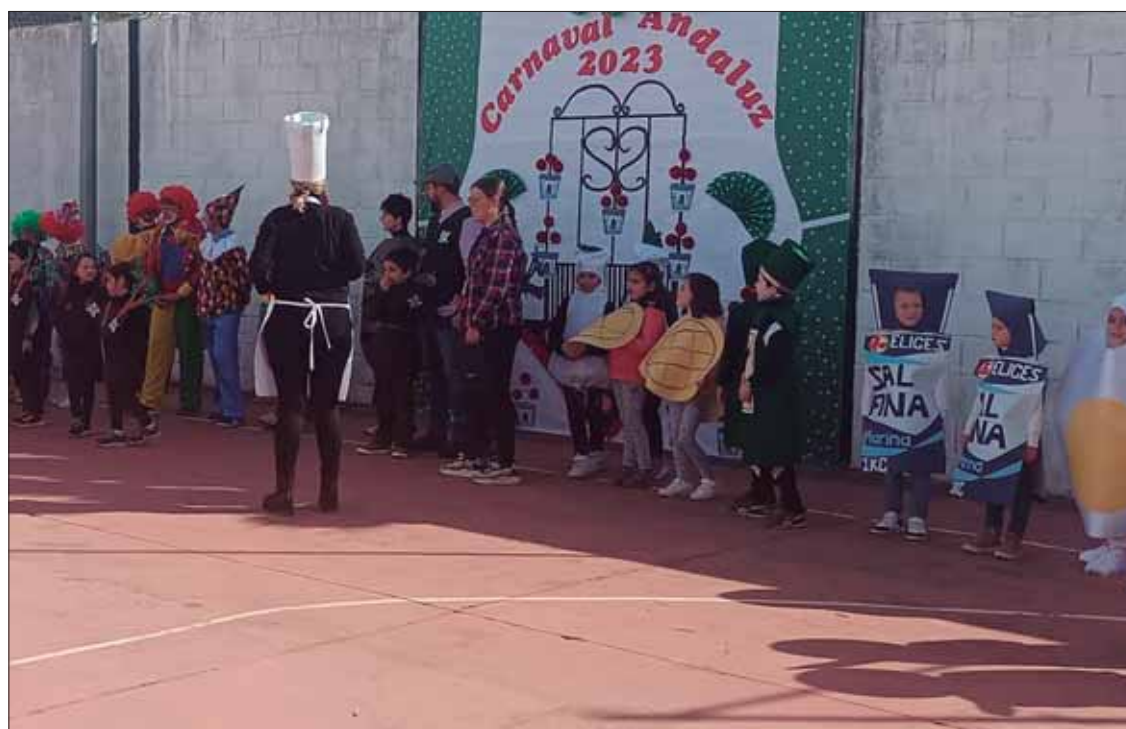
Los escolares han celebrado el Carnaval con canciones alusivas a los disfraces que llevaban/EC

Tras una primera hora de organización y trabajo en clase por tutorías, a las diez pequeños y mayores pudieron disfrutar del desayuno molinero preparado por las integrantes de la Junta Local. A su término, se procedió al izado de la bandera andaluza y los asistentes cantaron el himno