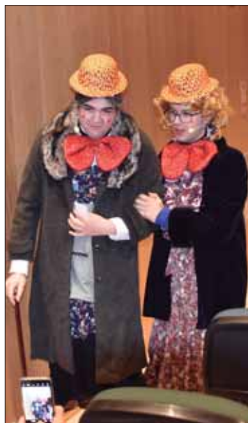
Los miembros de “El Pisiasso”

La nueva chirigota en liza en esta edición, “Suerte vendo que pa’ mí no tengo”, se había estrenado en Cabra y en Loja. Hasta allí han llevado su tipo de “loteros” que cantan a través de sus fortunas e infortunios la crónica de un pueblo y una sociedad. La formación es la evolución de la comparsa de jóvenes de la localidad que debutó en 2020 como “Maravillosa locura”. Después, la pandemia y las circunstancias personales de algunos de ellos, en plena etapa universitaria, frenaron el proyecto. Ahora los “supervivientes” y los nuevos