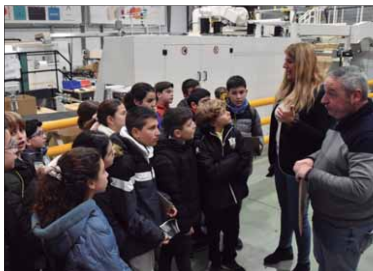
En Innovaciones Subbética el alumnado vio la dinámica de producción/FP

Así, de forma consecutiva el pasado 15 de febrero visitaron las instalaciones de Samafrava, Innovaciones Subbética e Indulabel. Aroca destaca la sorpresa de los menores al ver lo que han estudiado en clase “en el mundo