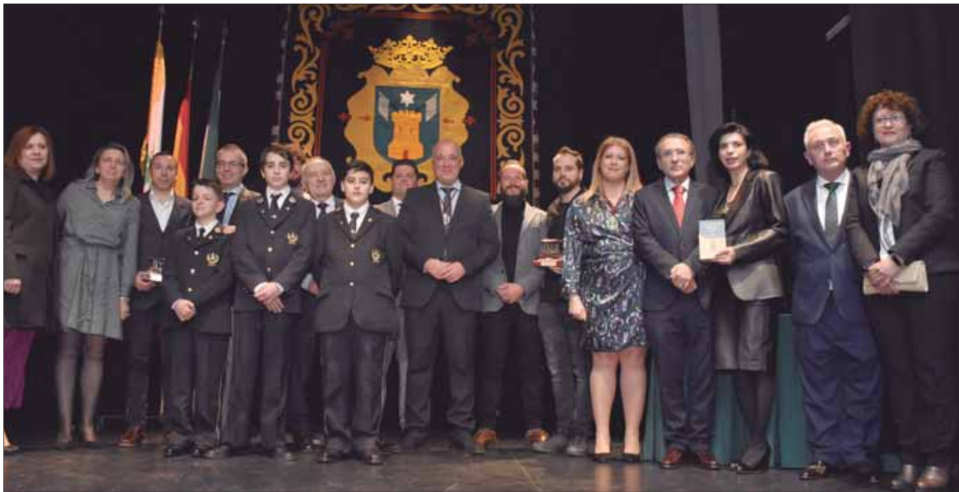
Los galardonados y los nuevos miembros de la banda junto al alcalde y la concejala de Educación/FP