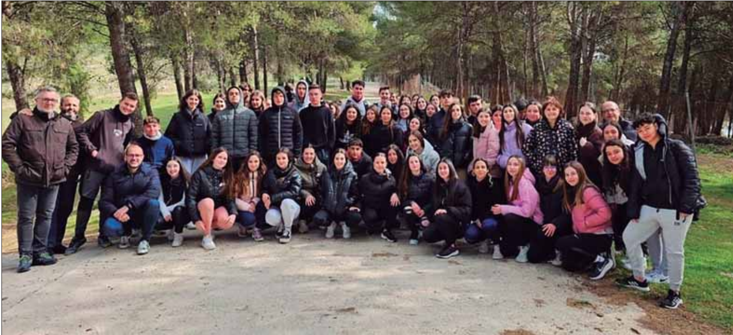
Un total de 69 estudiantes de Rute y otros municipios cordobeses han participado en esta edición/FP

La fase provincial, celebrada de nuevo en Rute, subraya la importancia de esta materia, que cuenta con muy pocas horas lectivas