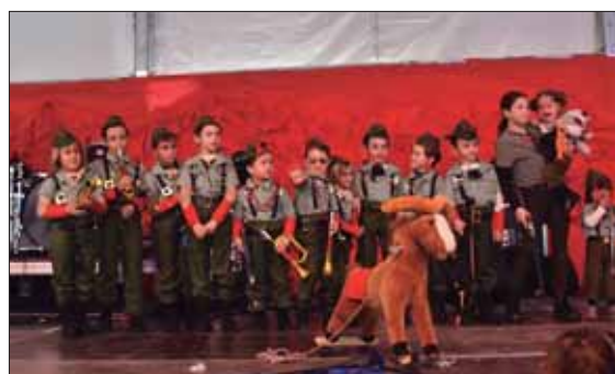
El ejército fue recreado en los disfraces infantiles/MM