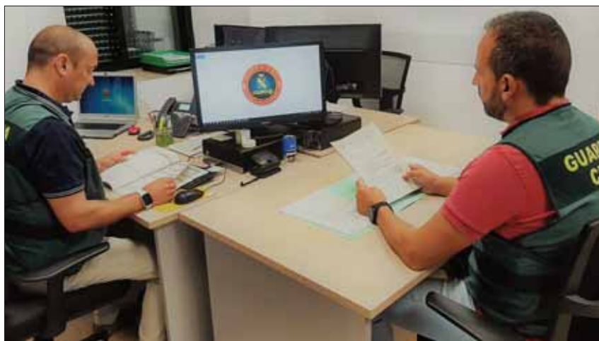
Una exhaustiva investigación tecnológica ha permitido identificar a los autores/EC