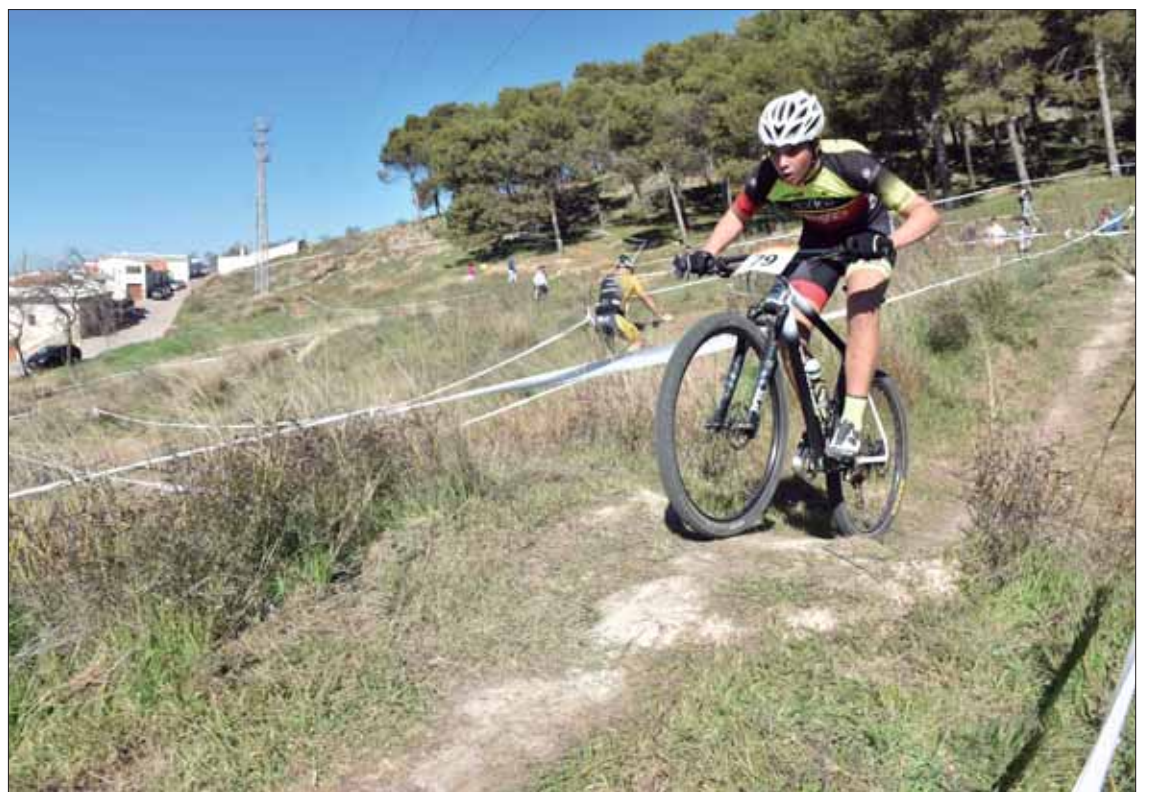
Los tres circuitos de la prueba aumentaron tanto la distancia como la dificultad técnica/FP

García también resaltó que buena parte de los corredores locales eran menores, lo que garantiza la continuidad de la afición que siempre ha habido por el ciclismo en el pueblo. De hecho, es una apuesta del club, que ya ha trasladado al Ayuntamiento la posibi-