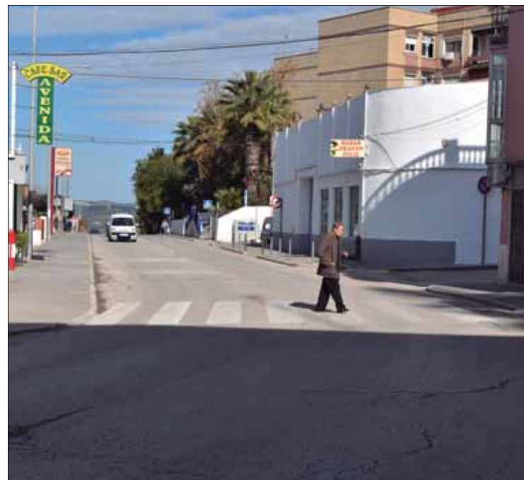
La travesía es uno de los tramos incluidos en esta actuación

También ha destacado que estas políticas de conservación de carreteras del Gobierno andaluz cumplen otros fines. Según ha dicho, “vertebran el territorio, ayudan a luchar contra la despoblación, fomentan la igualdad de oportunidades y contribuyen al mantenimiento de empleos y empresas locales del sector de la construcción”.