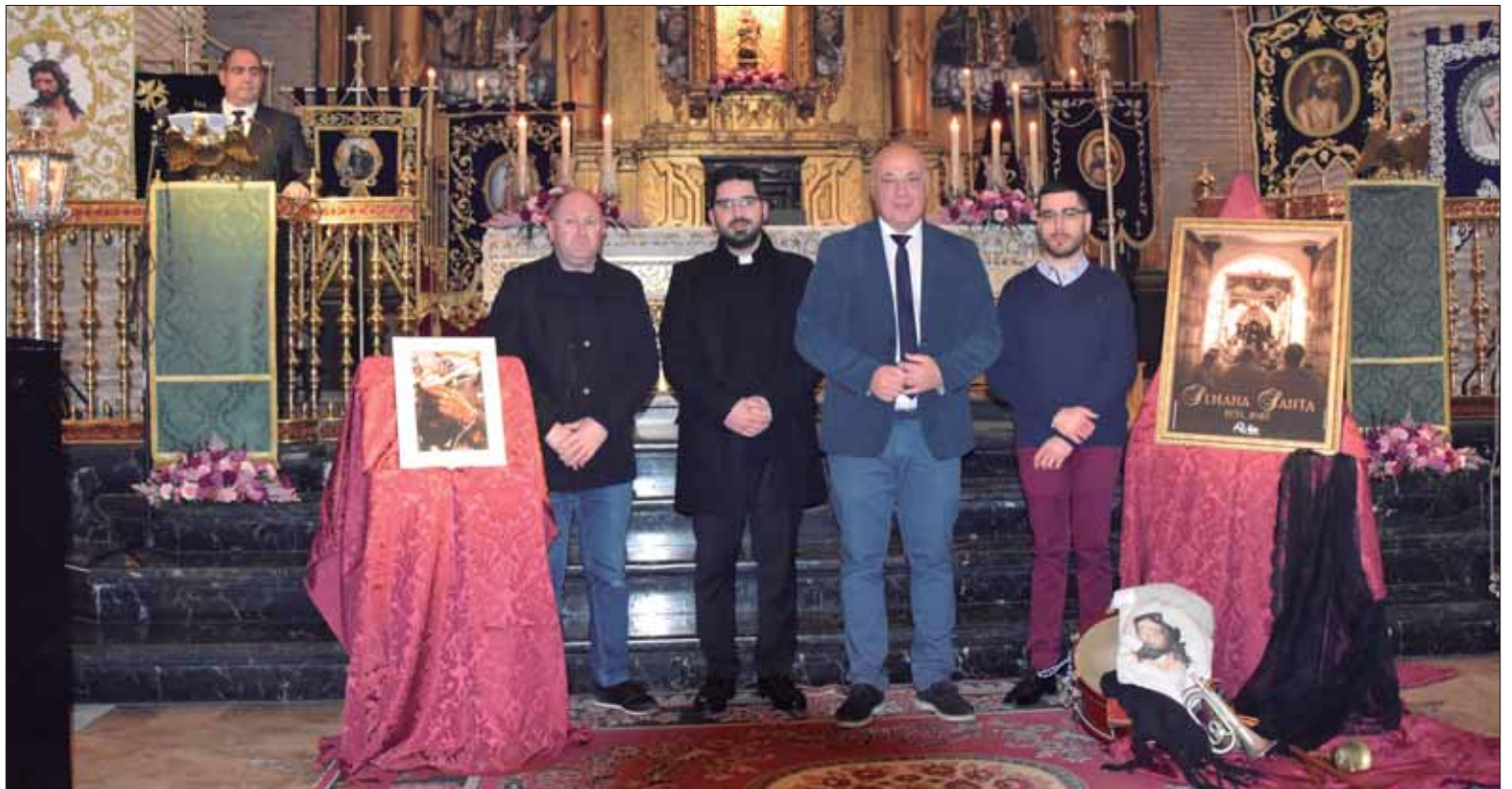
Roldán en el atril y los autores de la fotografía de la portada de la revista y el cartel con el párroco y el alcalde, en el centro

El párroco recordó que es una manifestación pública de la pasión y muerte de Jesucristo