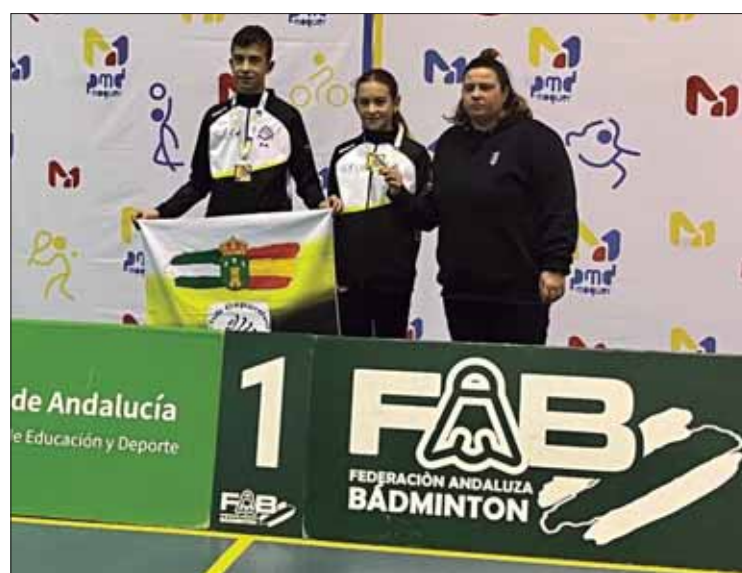
La pareja ruteña venció en dobles mixtos a todos sus rivales

Como pareja de dobles mixtos, los hermanos lograron imponerse a todos sus oponentes en una competición disputada en formato de liguilla. Para Diego Arenas, se conocen bien como hermanos y en la pista funcionan