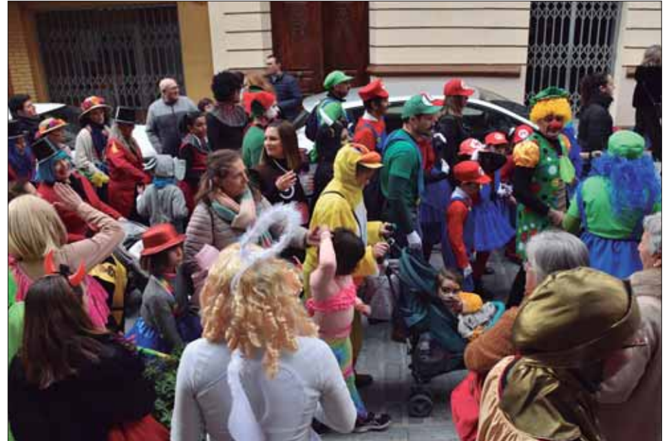
Familias y grupos de amigos se disfrazaron de forma conjunta el Domingo de Piñata/FP