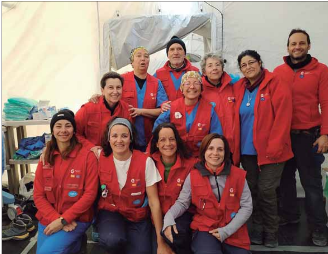
La anesthesióloga ruteña con el grupo con el que ha montado el hospital de campaña

Esta especialista en Anestesia y Reanimación, junto al resto del grupo Start, acudió a Turquía con la misión de montar un hospital de campaña. Entre otras prestaciones, la unidad cuenta con un quirófano. El hospital se ha instalado en un lugar seleccionado y dispuesto por la Unidad Militar de Emergencias (UME), que también está presente en la zona afectada por el seísmo. Esta primera mi-