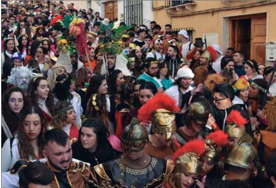
El pasacalle temático reprodujo figuras del imperio romano

Los pasacalles del segundo fin de semana invaden el casco urbano de Rute con un ejército de ingenio y color en el que los romanos dan paso a las tribus carnavaleras