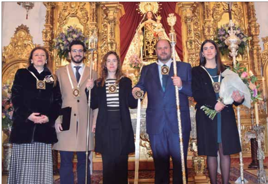
La presidenta de la real archicofradía, los hermanos mayores, la reina y el pregonero de las fiestas de 2023/FP

Dicho Año Santo arrancará el 14 de octubre del presente año y se prolongará hasta octubre de 2024. Durante ese tiempo se sucederán actos de evangelización, peregrinaciones de grupos de jóvenes, diversos cultos y actos religiosos. Paralelamente, la archicofradía también llevará una obra social destacada. Ha sido la Santa Sede, mediante Decreto de la Penitenciaria Apostólica, la que autorizó a la