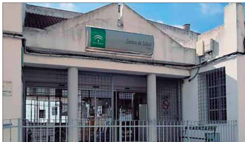
El Centro de Salud está experimentando una renovación de sus profesionales/EC

Ante la situación a nivel provincial, la Delegación Territorial de Salud ha emitido un comunicado. El texto destaca que desde 2019 se han mejorado las condiciones laborales y retributivas del personal del SAS. Además, las ofertas de empleo y concursos de traslado les