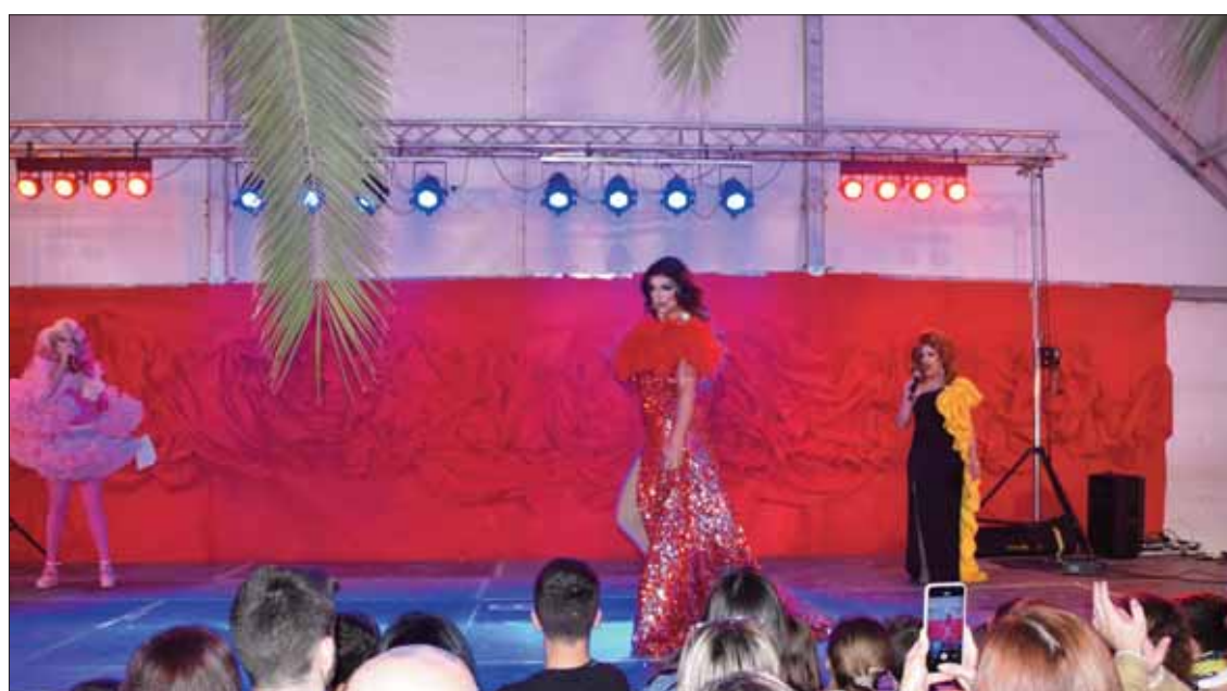
Antes del certamen se celebró el segundo concurso de Drag Queen/MM