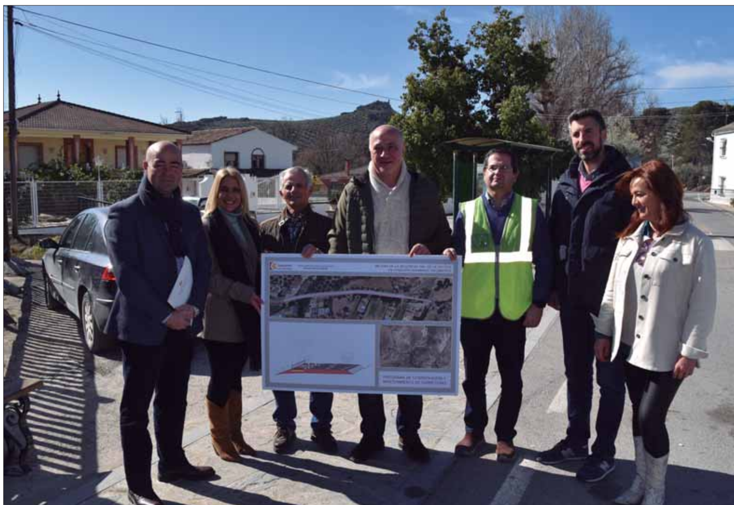
El alcalde presentó la actuación acompañado de los técnicos y dos concejales ruteños/MM

La zona peatonal, colindante con la carretera, se va a diferenciar de la calzada con una barandilla. La pavimentación llevará un relleno granular y una loza de hormigón, similar a la carretera, pero diferenciada por