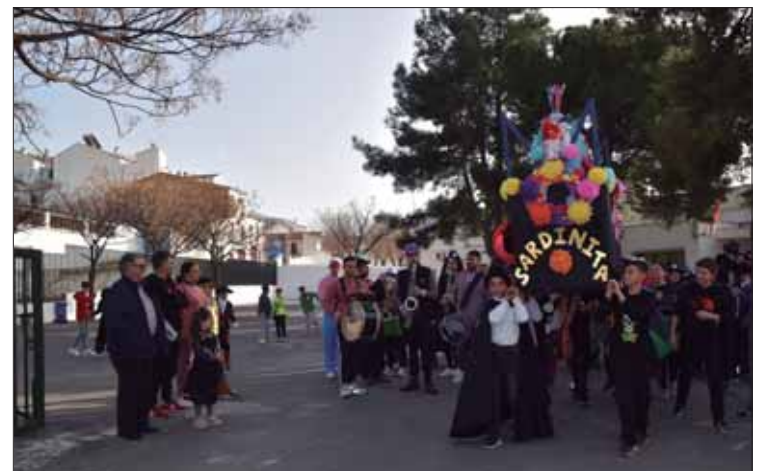
“La sardinita” partió del Fuente del Moral y fue quemada en el Fresno/MM

Tras el bautismo y la primera comunión con la hermana pequeña del arenque, la calle vuelve a ser lugar de peregrinaje. Como quien va a Santiago de Compostela, a Rute se viene en busca de la redención a través del Carnaval. Aquí se purgan los pecados étlicos en las estaciones de penitencia de los bares, acompañando el féretro al compás de la caja y el bombo de las charangas (“Silosé Novengo” por la tarde y “Los Piononos” de noche). El cortejo de felices dolientes celebra la procesión con coronas de flores y petaladas de confeti