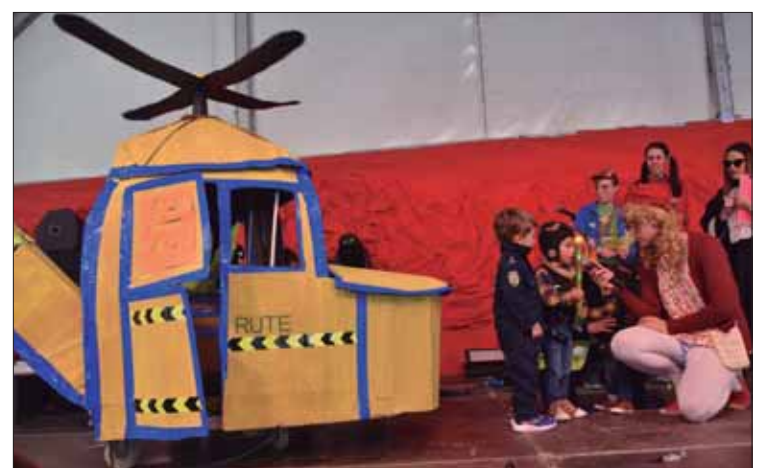
El concurso infantil de disfraces contó con una alta participación/MM