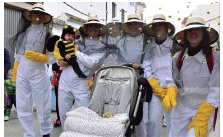
En el pasacalle familiar también fue habitual ver grupos temáticos/FP

Si el imperio romano real vivió su decadencia hacia el siglo V, el