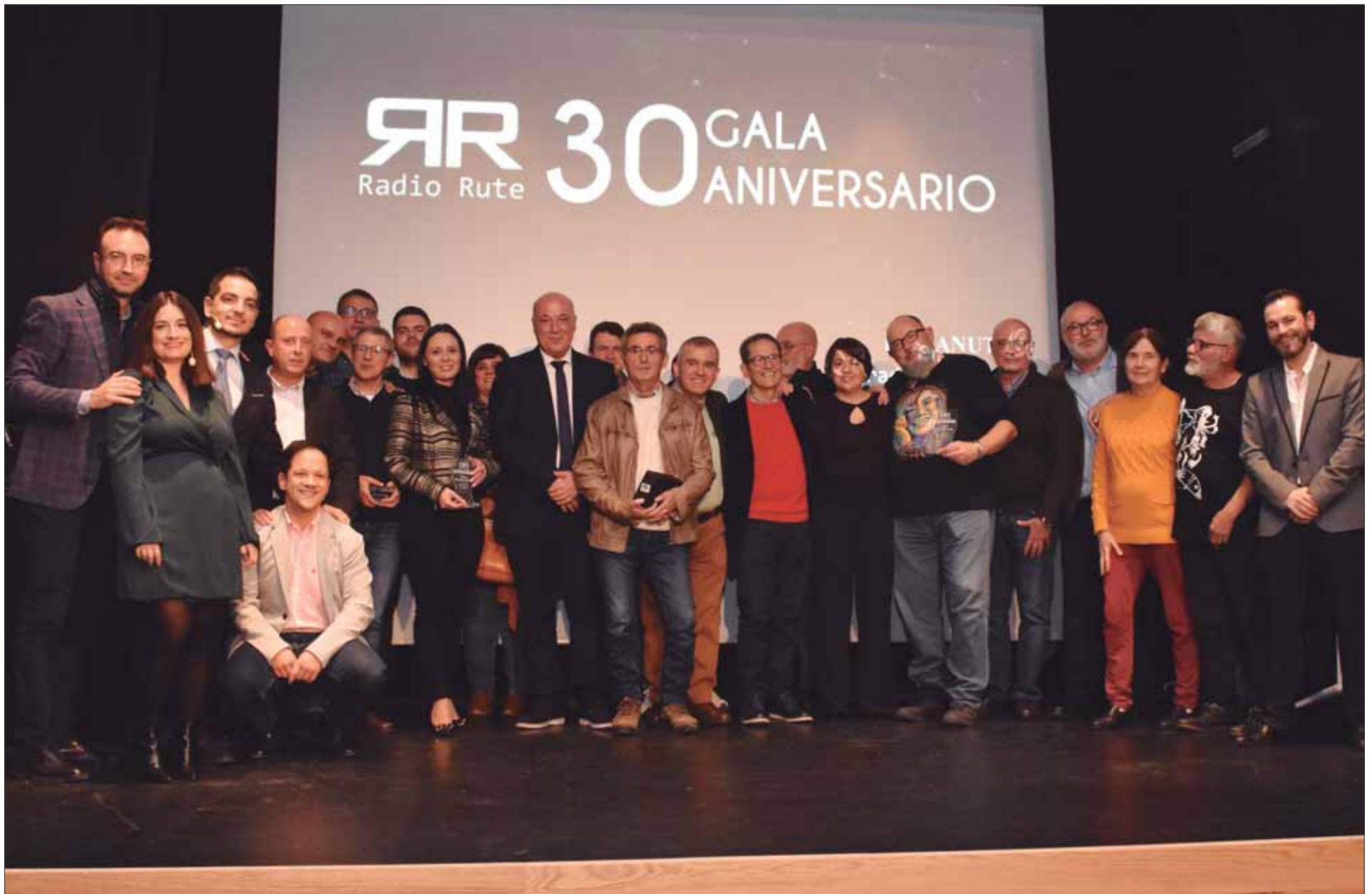
Si el libro es un repaso a la historia de Radio Rute, la gala fue un homenaje a los colaboradores de la emisora

Coincidiendo con el trigésimo aniversario de la emisora municipal, los 25 años del periódico El Canuto y los 20 de la página web, un libro repasa estas tres décadas de comunicación local