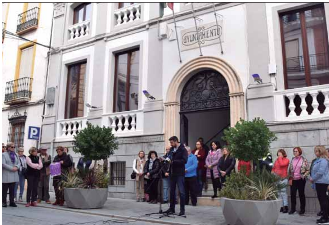
El acto principal para concienciar en el 25N tuvo lugar ante las puertas del Ayuntamiento/FP