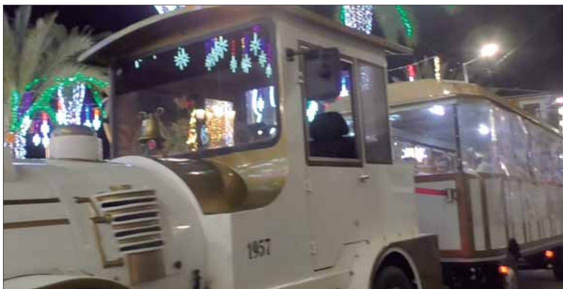
El tren turístico recorre las calles de Rute desde primeros de diciembre