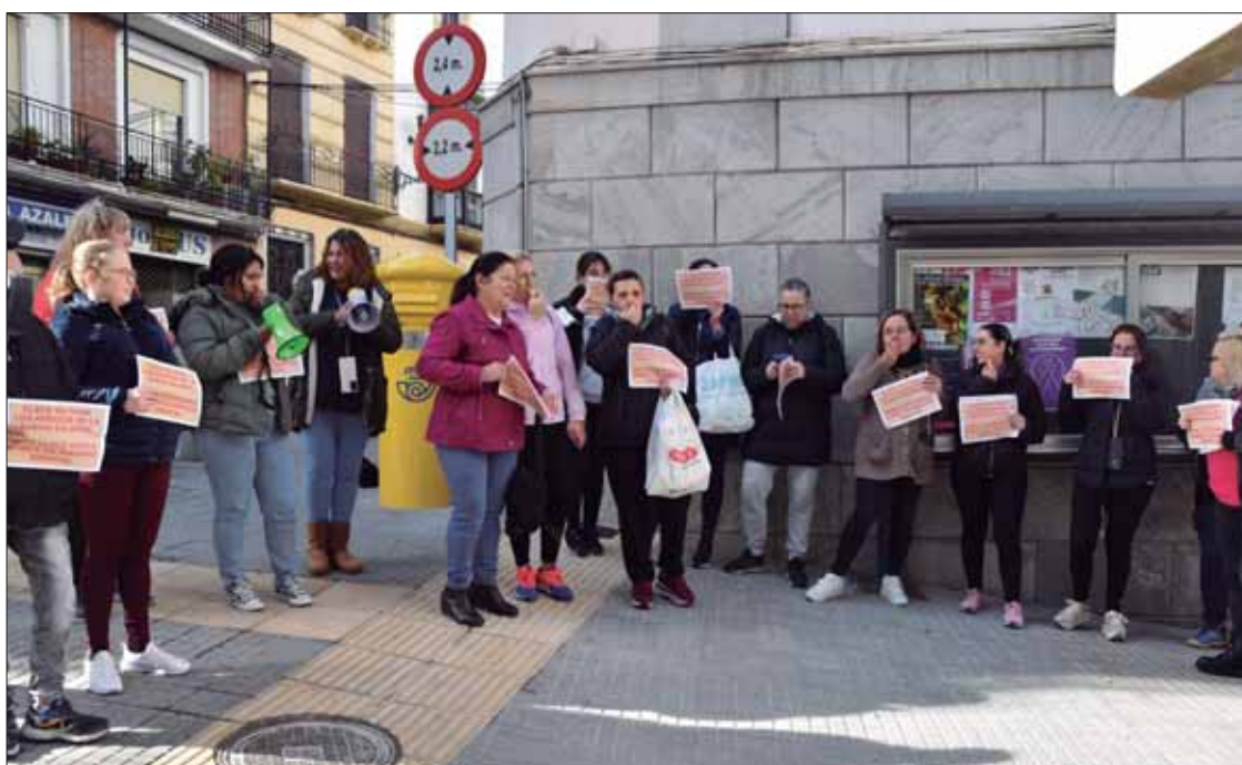
Para no perjudicar a los usuarios durante la huelga, las empleadas se turnaron en paros de dos horas

La marcha partió del Centro Cultural Rafael Martínez-Simancas y concluyó en el Ayuntamiento. Durante el recorrido les acompañaron empleadas de otras localidades como Montilla o Doña Mencía, representantes po-