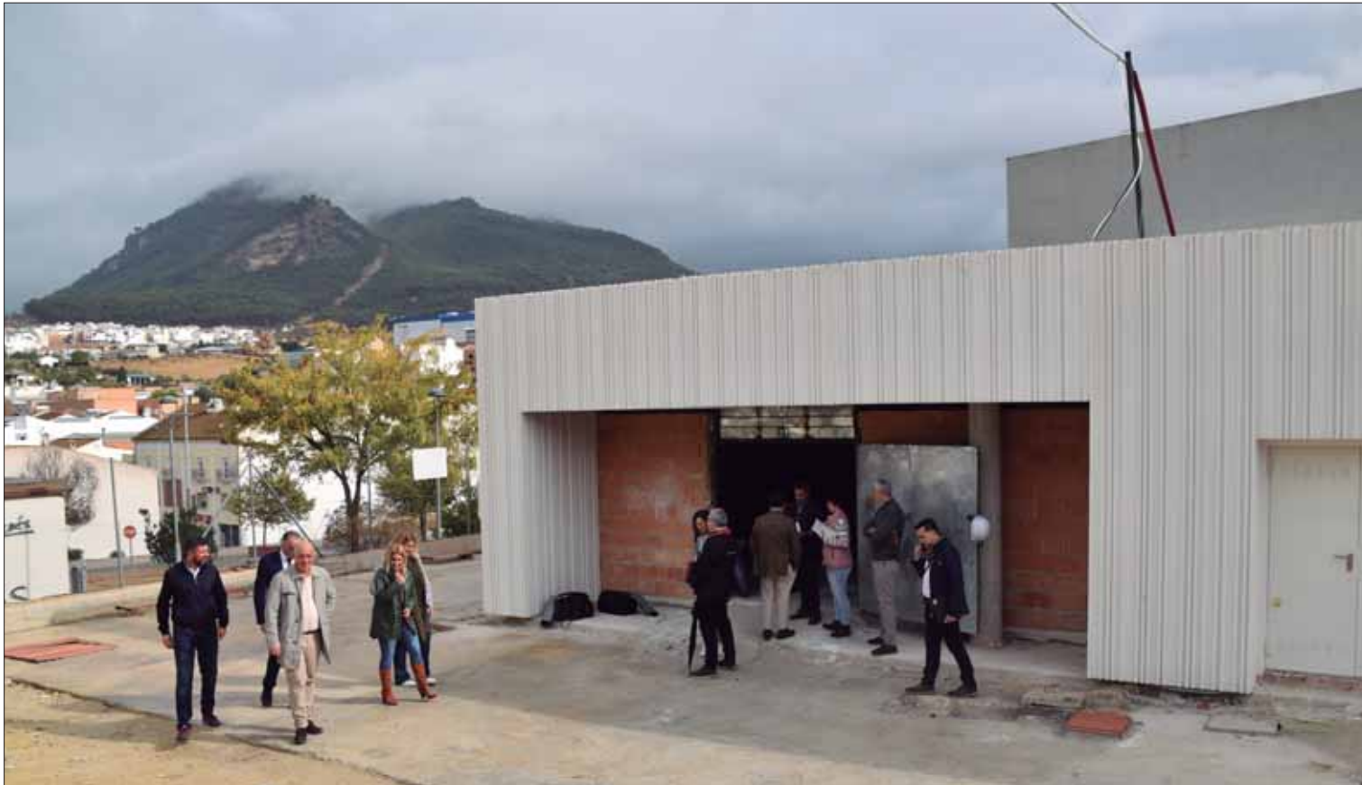
A las prestaciones de un aforo de 310 butacas se suma el atractivo de las vistas del pueblo y la sierra

El Ayuntamiento ha recepcionado las obras, cuyo coste supera los quinientos mil euros, financiados por la Diputación