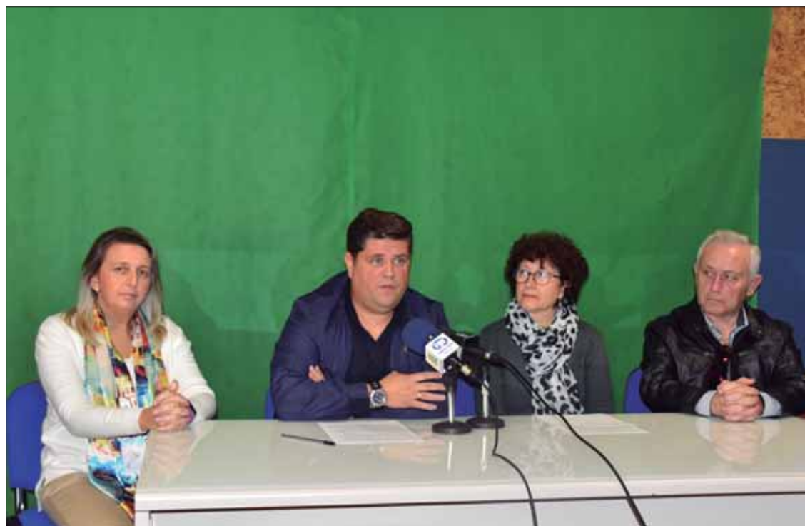
Los miembros de la fundación durante su comparecencia ante los medios locales

Ayudas a familias desfavorecidas, un nuevo vehículo de transporte o la reforma de los baños están entre sus objetivos