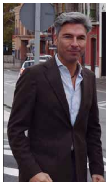
Lorite analiza la nueva PAC/MM

A su juicio, el ministro ha llevado a cabo "una negociación nefasta", basada en "el oscurantismo y el engaño a los agricultores y ganaderos". Según Lorite, "no es ni la PAC que reclamaban las comunidades autónomas ni la que demandaba el sector". La nueva PAC supone una pérdida de cinco mil millones de euros y mayores trabas administrativas y exigencias medioambientales. Además, resulta paradójico, señala, que cuando más dinero llega de Europa España sea el