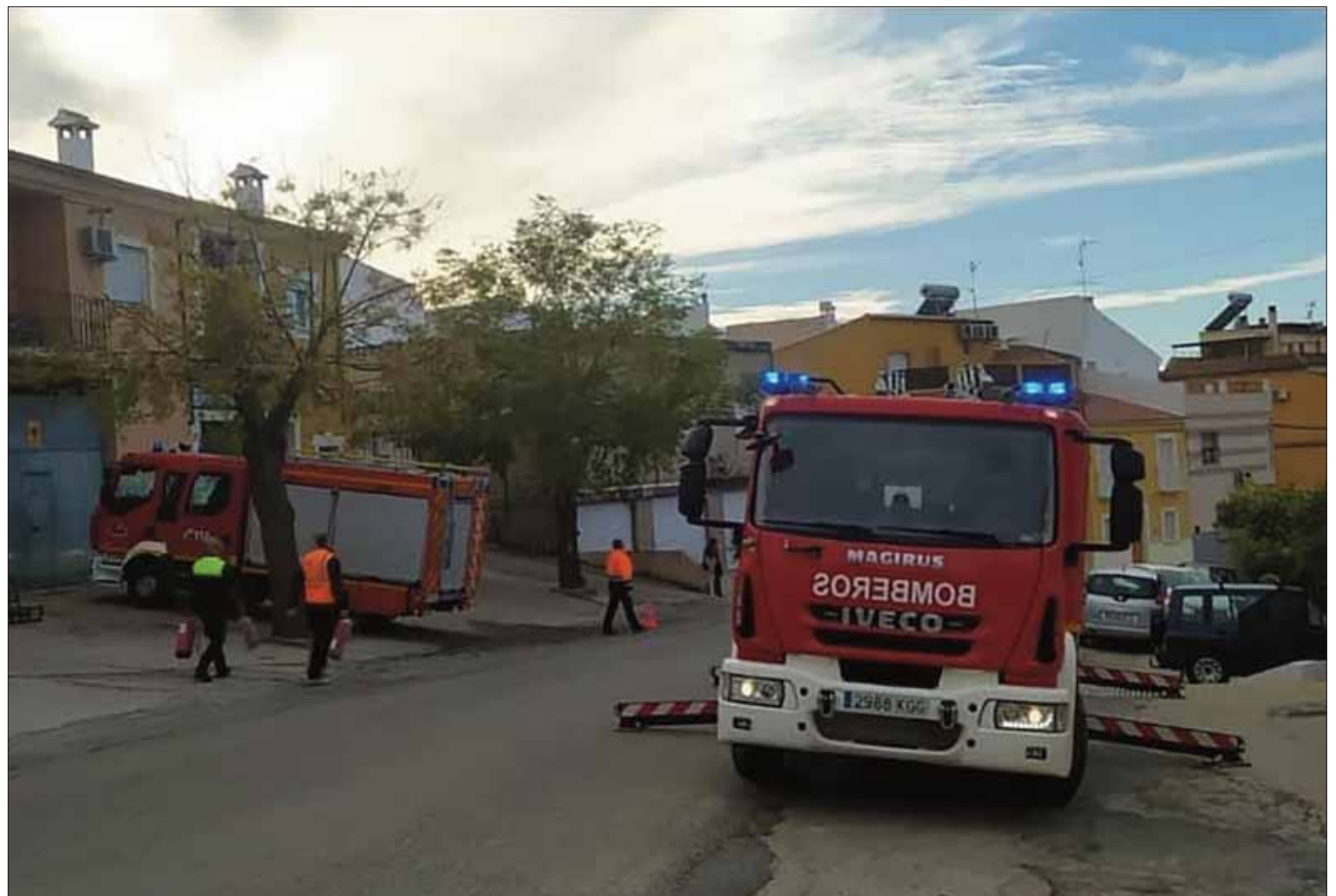
El segundo incendio en estas semanas se produjo en una vivienda de Fuente del Moral/EC

La primera reacción de los agentes les llevó a confirmar, una vez hechas las pertinentes averiguaciones, que en Rute no hay ninguna calle con dicho nombre. Sin embargo, poco después se pudo comprobar que, en realidad, el fuego se localizaba en la calle Cabra. Las llamas se habían originado en la cocina de una vivienda situada al principio