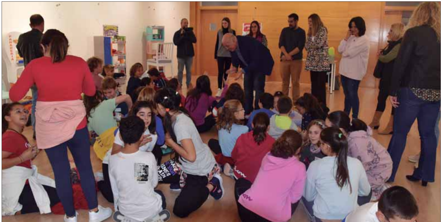
En el CEMAC Pintor Pedro Roldán se recreó un pequeño barrio con tiendas de todo tipo

Consiste en enseñar a los menores a comprar en las tiendas de su barrio. Hay una parte “didáctica”, con la lectura de tres cuentos adaptados a los respectivos ciclos de Primaria.