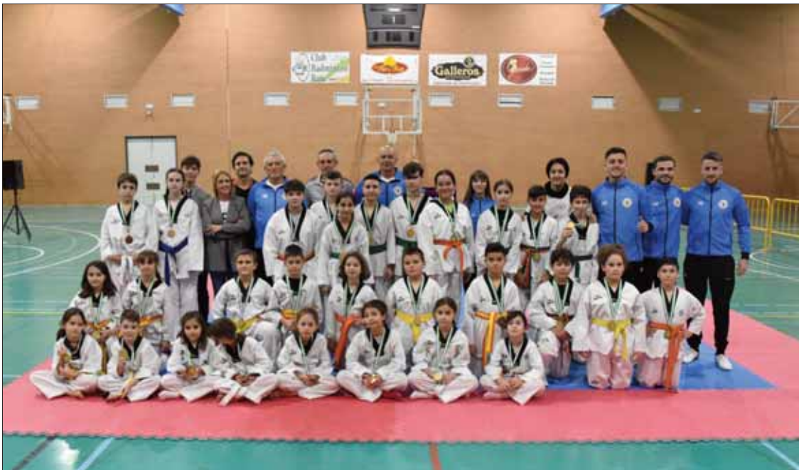
Cuarenta integrantes del club disputaron un total de 32 combates en el Campeonato Local/FP

La primera cita está pensada para iniciarse en la competición y la segunda representa una jornada de convivencia del club