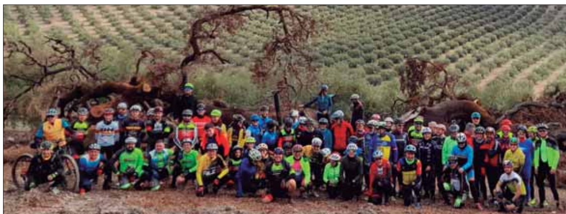
Los participantes de la ruta alternativa se reagruparon junto a la Encina Milenaria