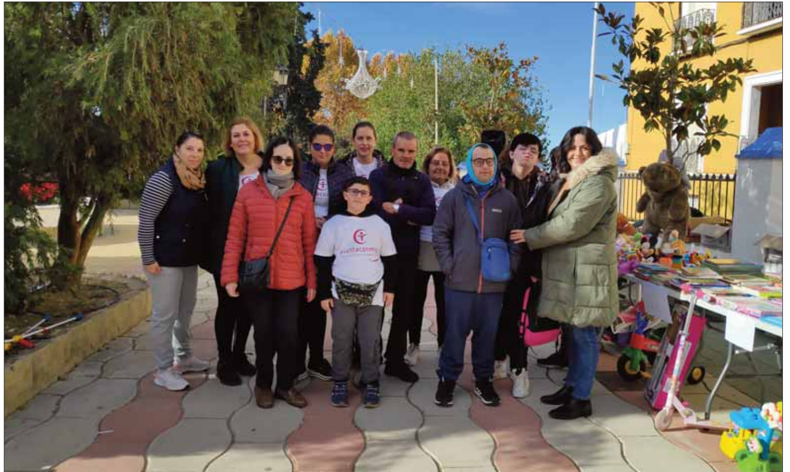
El mercadillo solidario se instaló en el Paseo Francisco Salto/MM

La presidenta de Cuenta Conmigo recordó que existen diferentes tipos de discapacidad (física, orgánica, sensorial, intelectual, visual o auditiva). Las personas que nacen o adquieren una discapacidad se comunican, leen o caminan de diferente forma. Por eso, durante la etapa escolar no