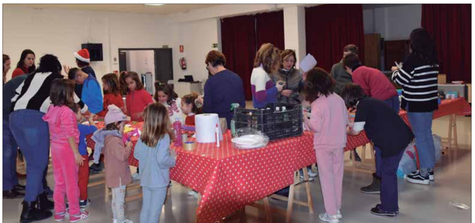
Los talleres se han llevado a cabo en el Centro Cultural Rafael Martínez-Simancas

Los participantes han elaborado juguetes navideños con materiales reciclables, como tapones, cartuchos de papel higiénico, palos de madera, envases de yogur o cartones. Estos juguetes van destinados a los niños y niñas de las familias más desfavorecidas. Con esta iniciativa también se ha fomentado el trabajo en familia, así como valores artísticos, dando rienda