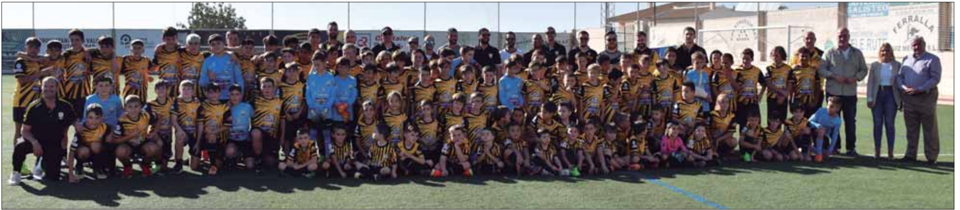
Cerca de doscientas personas, entre jugadores, cuerpo técnico y directiva conforman una temporada más el organigrama completo del club/FP

Hay nueve equipos en competición entre fútbol siete y fútbol once, que suman en torno a ciento cincuenta jugadores