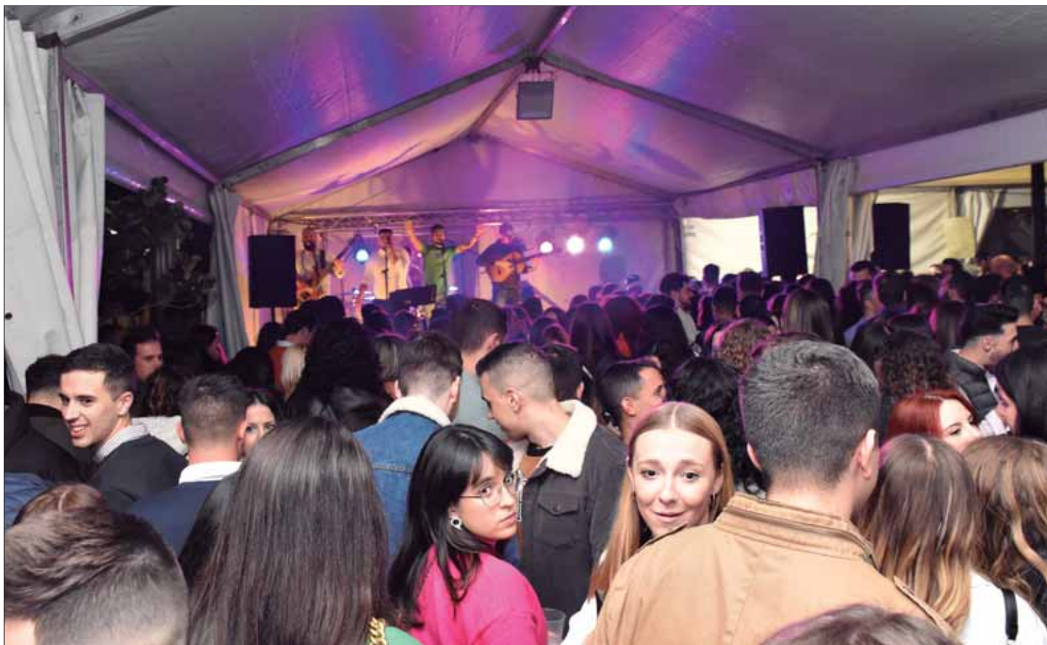
Centenares de jóvenes se acercaron a la carpa del Paseo Francisco Salto para las actuaciones

en el Paseo del Fresno para amenizar las barras instaladas por las cofradías ruteñas. Después,