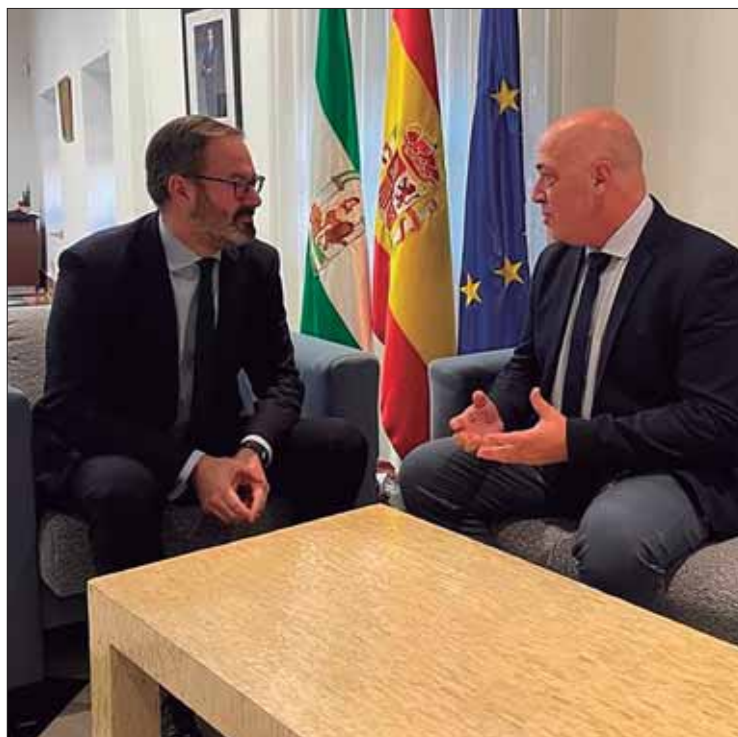
Para Ruiz ha llegado el momento de que la Junta invierta en el teatro/EC

Las dos anteriores, también se han llevado a cabo con fondos del propio Ayuntamiento y la institución provincial. Así pues, hasta el momento en esta infraestructura cultural se han invertido unos ochocientos mil euros, sobre un total de 1,3 mi-