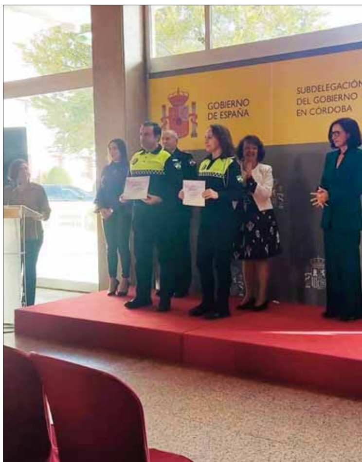
Reconocimiento a los agentes del programa Viogén/EC

FRANCISCO PIEDRA El 25 de noviembre se conmemora el Día Internacional para la erradicación de la Violencia contra la Mujer. Entre los actos de sensibilización programados en Rute, el fin de semana anterior la asociación de mujeres Horizonte había habilitado varias mesas informativas en nuestro pueblo y organizó una ponencia temática. Por su parte, en el Centro de Salud también llevaron a cabo un paro de repulsa contra esta lacra. A ello se sumó el autobús fletado para la marcha en Córdoba de por la tarde.