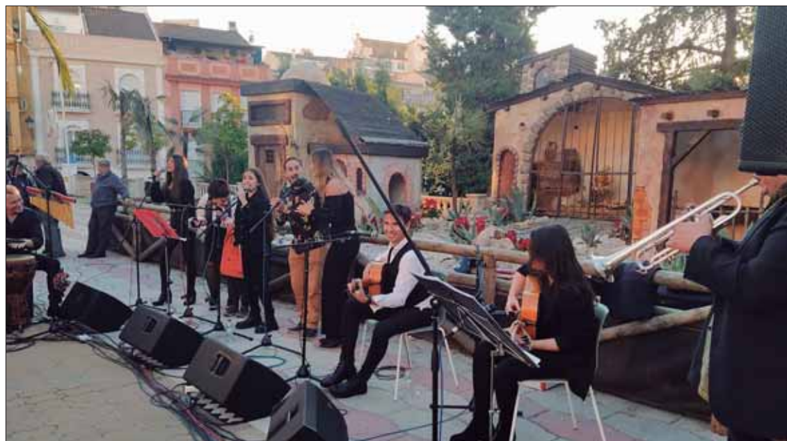
“Zambomba flamenca” Junto al Belén del Paseo Francisco Salto/MM

el día de la Constitución, se encendería el alumbrado extraordinario, que daría paso a otras actividades de animación. Es el caso del castillo hinchable que ocupa buena parte del Paseo Francisco Salto, o el tren turístico promovido por la asociación ACER, con el patrocinio de la Diputación y el Ayuntamiento.