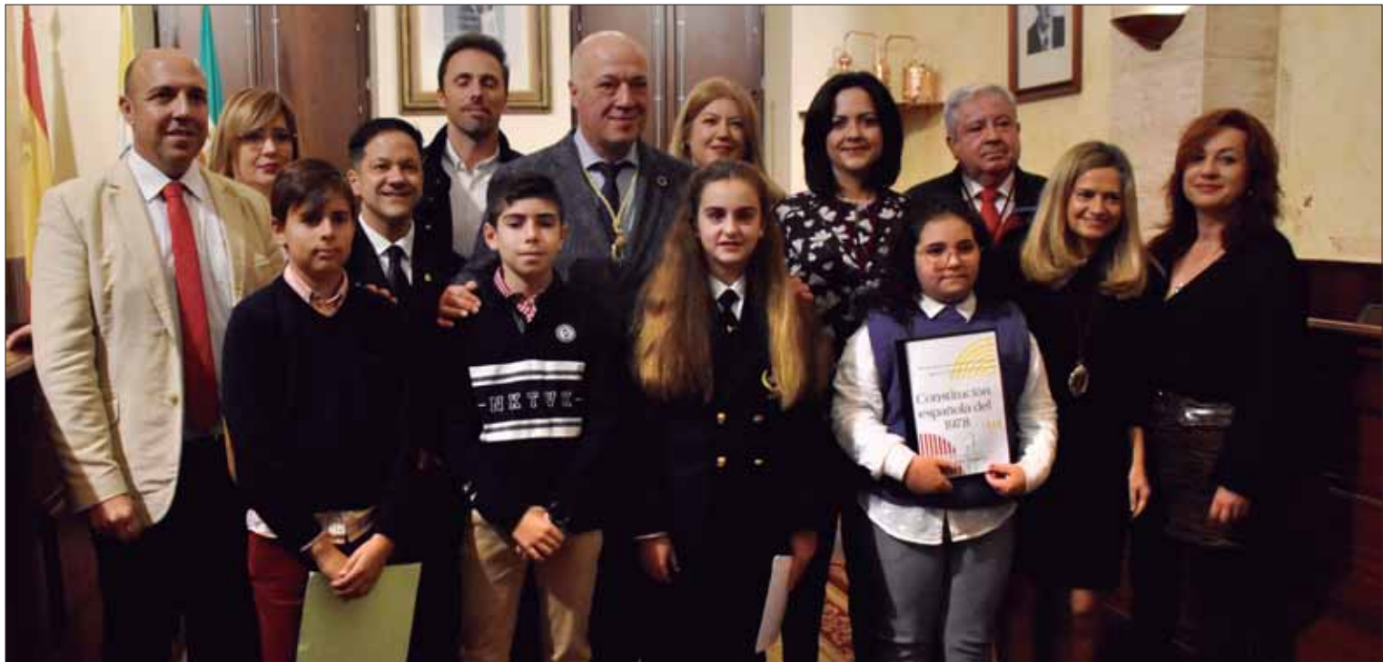
Los políticos elogiaron la labor de los docentes para inculcar a los menores los valores de la Constitución/FP

A los 44 años de su aprobación, pasado lo peor de la pande-