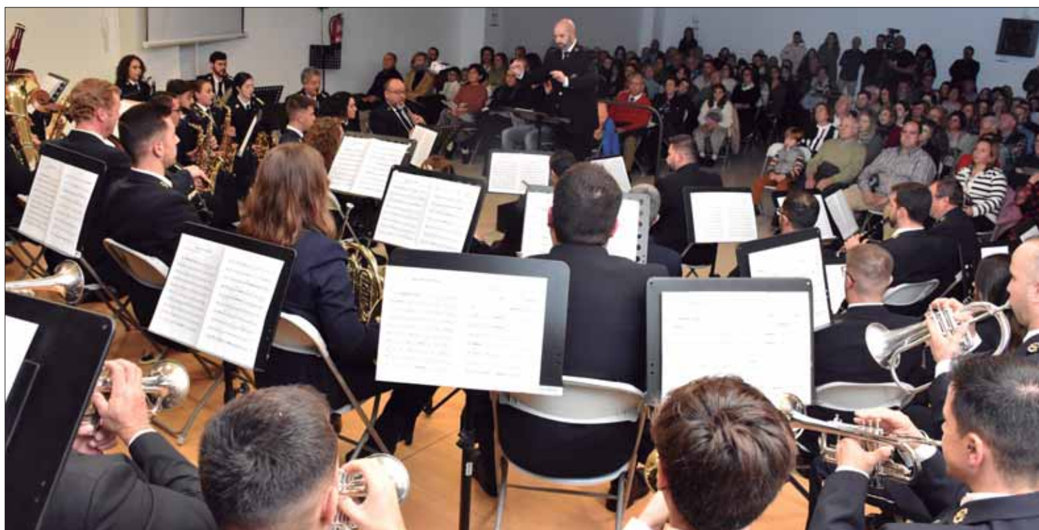
La banda había preparado durante tres meses este ambicioso proyecto

Antes, se tributó un emotivo homenaje con vídeo incluido a