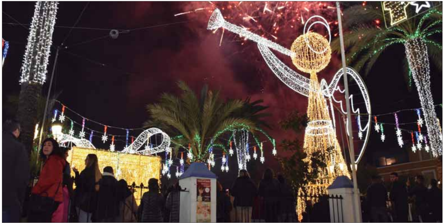
Los motivos y figuras principales del alumbrado están en las inmediaciones del Paseo Francisco Salto/FP

Desde hace unos años, otra efeméride, la del día de la Constitución, se ha asentado como la fecha oficiosa de la inauguración del alumbrado extraordinario. Desde ese día en Rute se festeja la vida por adelantado. Si a primeros de octubre, Rute