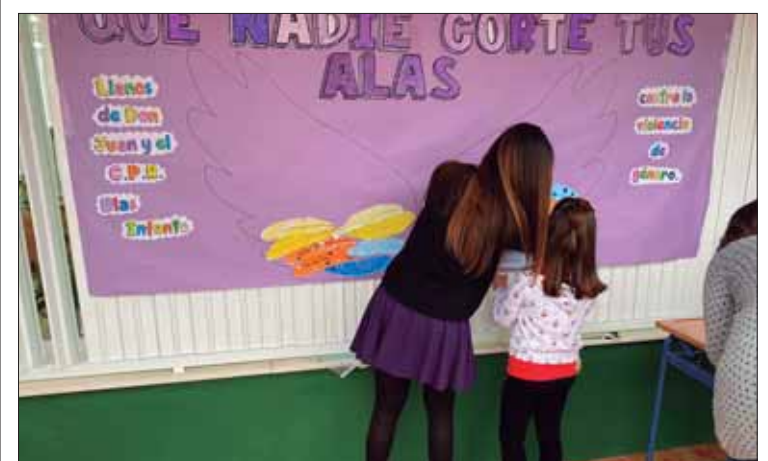
El alumnado y sus familias se han implicado en las /EC