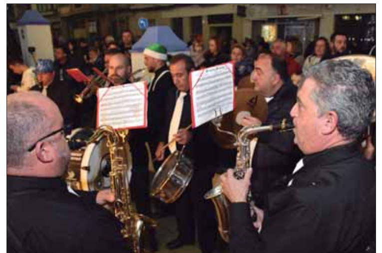
“Los Piononos” y “Silosé Novengo” animaron la tarde