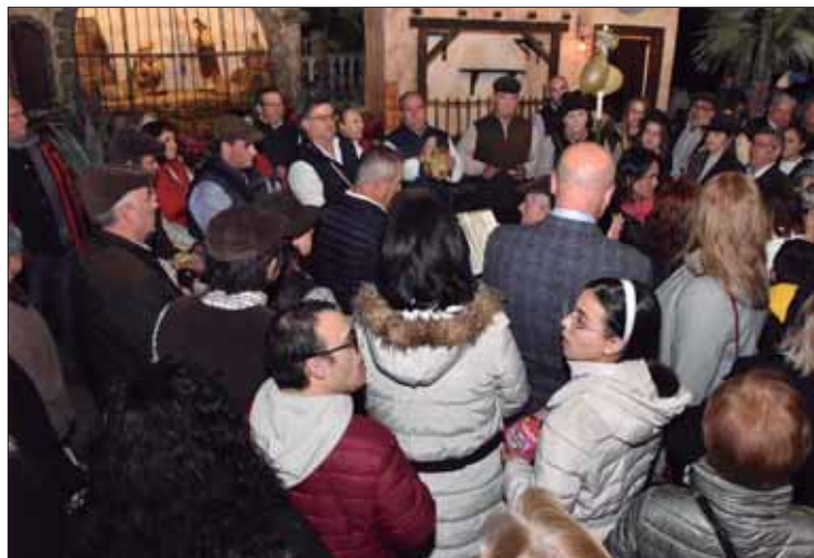
Los Mochileros y los Aguilanderos actuaron juntos/FP