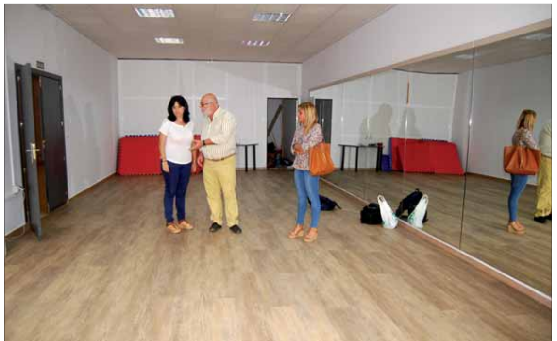
En el aula de yoga se ha colocado parqué en el suelo y se han quitado las humedades/MM

Con la reforma total de la sala de yoga se han corregido las humedades, se ha cambiado todo el suelo que era de tarima flotante por otro de parquet. También se han cambiado y afianzado los espejos que había en esta sala y, al igual que las salas de la ludoteca, se ha pintado.