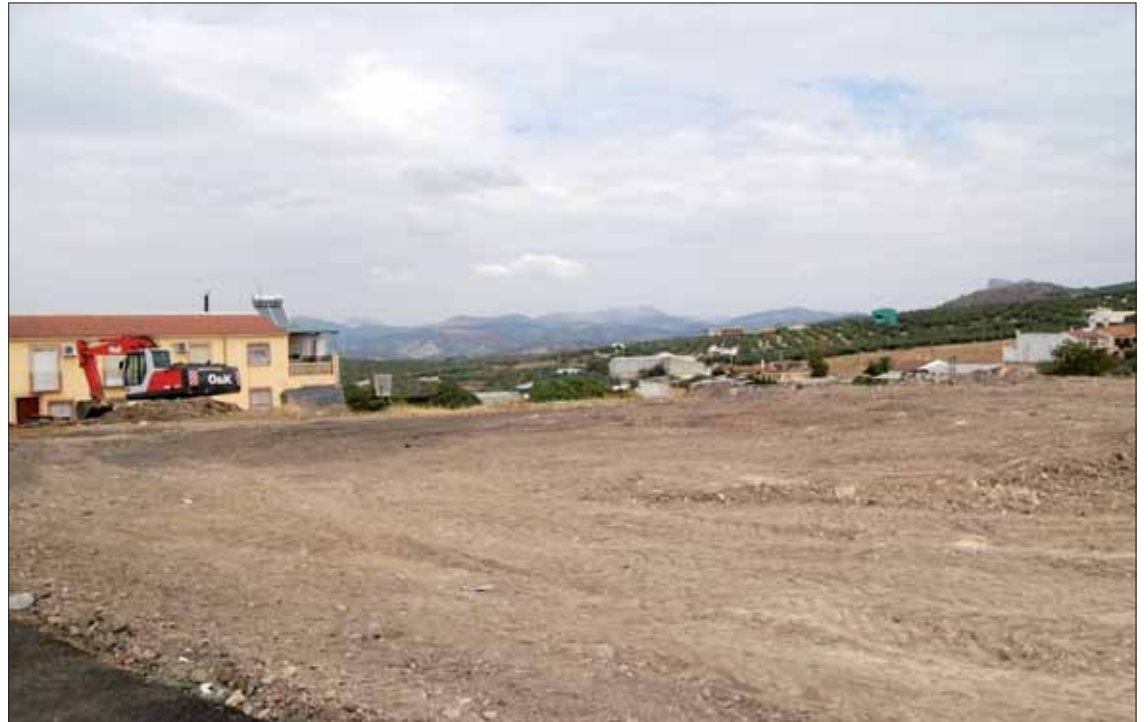
Las excavadoras ya están asentando el terreno en la explanada situada frente al pabellón

Las obras de adecentamiento y creación de esa zona de aparcamiento para autobuses han comenzado a finales de septiembre y en breve, estarán concluidas. Se trata de una parcela situada en la explanada frente al Pabellón Gre-