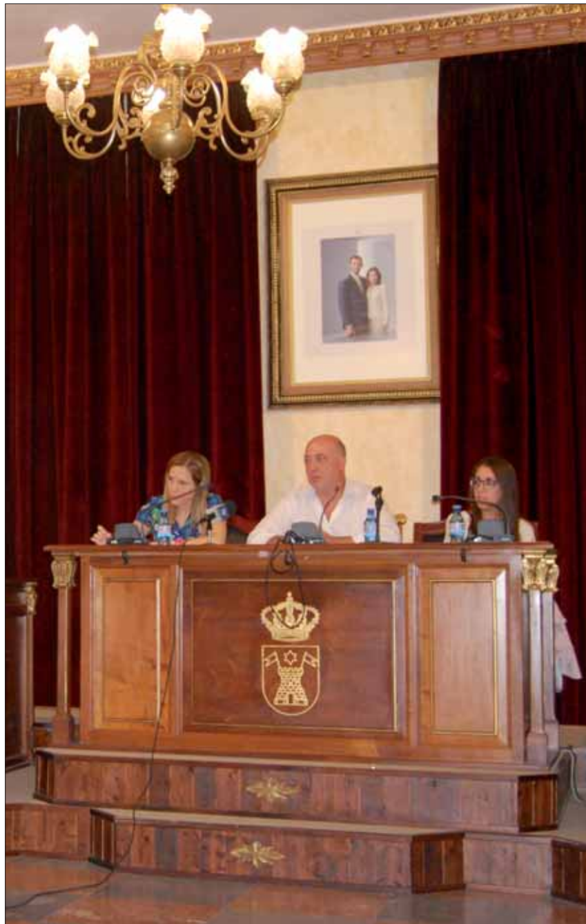
Un momento del pleno ordinario correspondiente al mes de septiembre/MM

Al margen de los puntos del pleno, en la comparecencia posterior ante los medios de comuni-