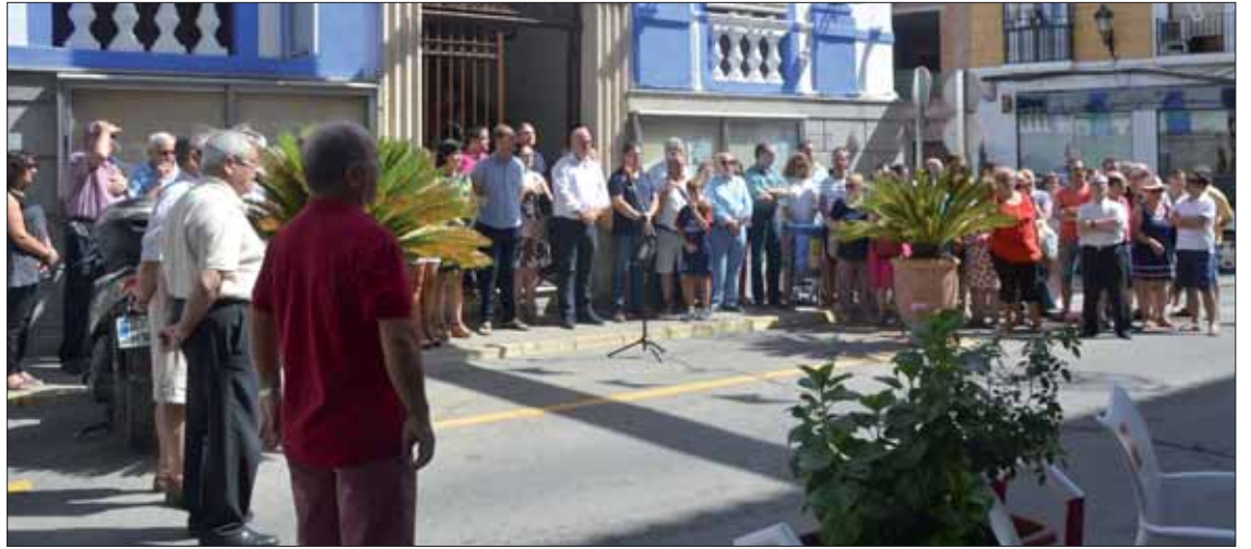
Vecinos y vecinas se congregaron ante el Consistorio para expresar su pesar por los atentados

tentes para concluir la concentración. Ruiz reconoció que era un día “triste, para Rute, para España, para la democracia y la libertad”. Tras décadas sufriendo el terrorismo de ETA ahora nos azota otro “más global, pero igualmente bárbaro”. Es “el mismo” que atacó en Madrid los trenes de Atocha, o el mismo que ha matado en Niza, París, Berlín o Estocolmo. La barbarie causa un gran dolor, pero hay que mostrar solidaridad con las víctimas y “unidad férrea y firme, y convicción absoluta de que nunca podrán vencer a la libertad”.