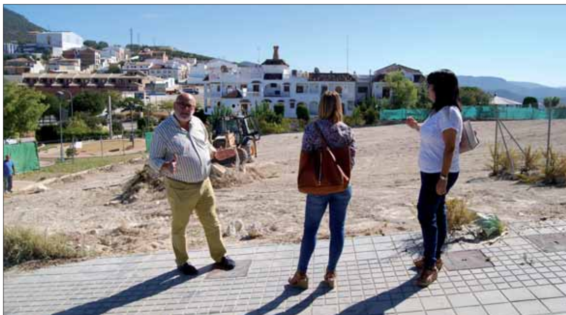
El Ayuntamiento dispone de una parcela de 2678 metros para la construcción de este espacio escénico/FP

Aún está por ver si en esa última etapa se incluiría el equipamiento o se haría aparte. En cualquier caso, esa dotación sí se hará “con recursos propios”, es decir, con aportación municipal. Las otras se acometen con dinero procedente de otras administraciones, como Diputación y la Junta, hasta completar los ocho-