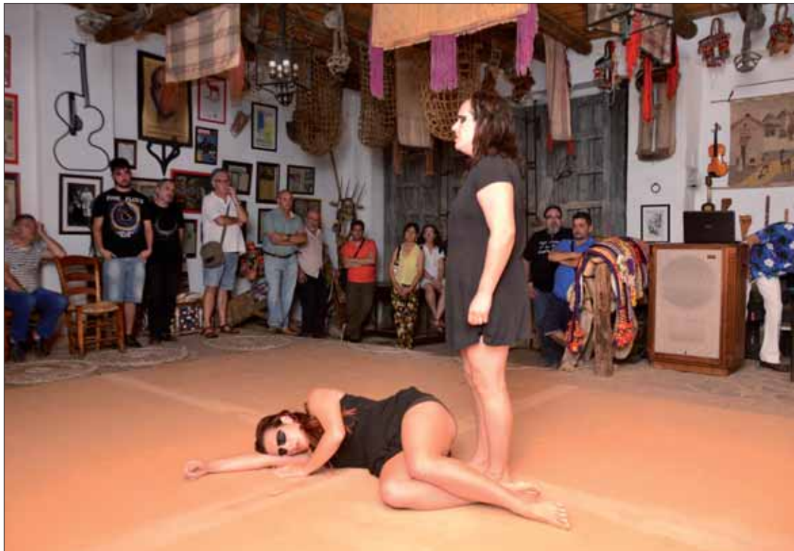
El centro de La Cuadra se reconvirtió en escenario para esta original propuesta escénica

Ya dentro de La Cuadra, todo queda en penumbra para la representación propiamente dicha. Las protagonistas, un solo per-