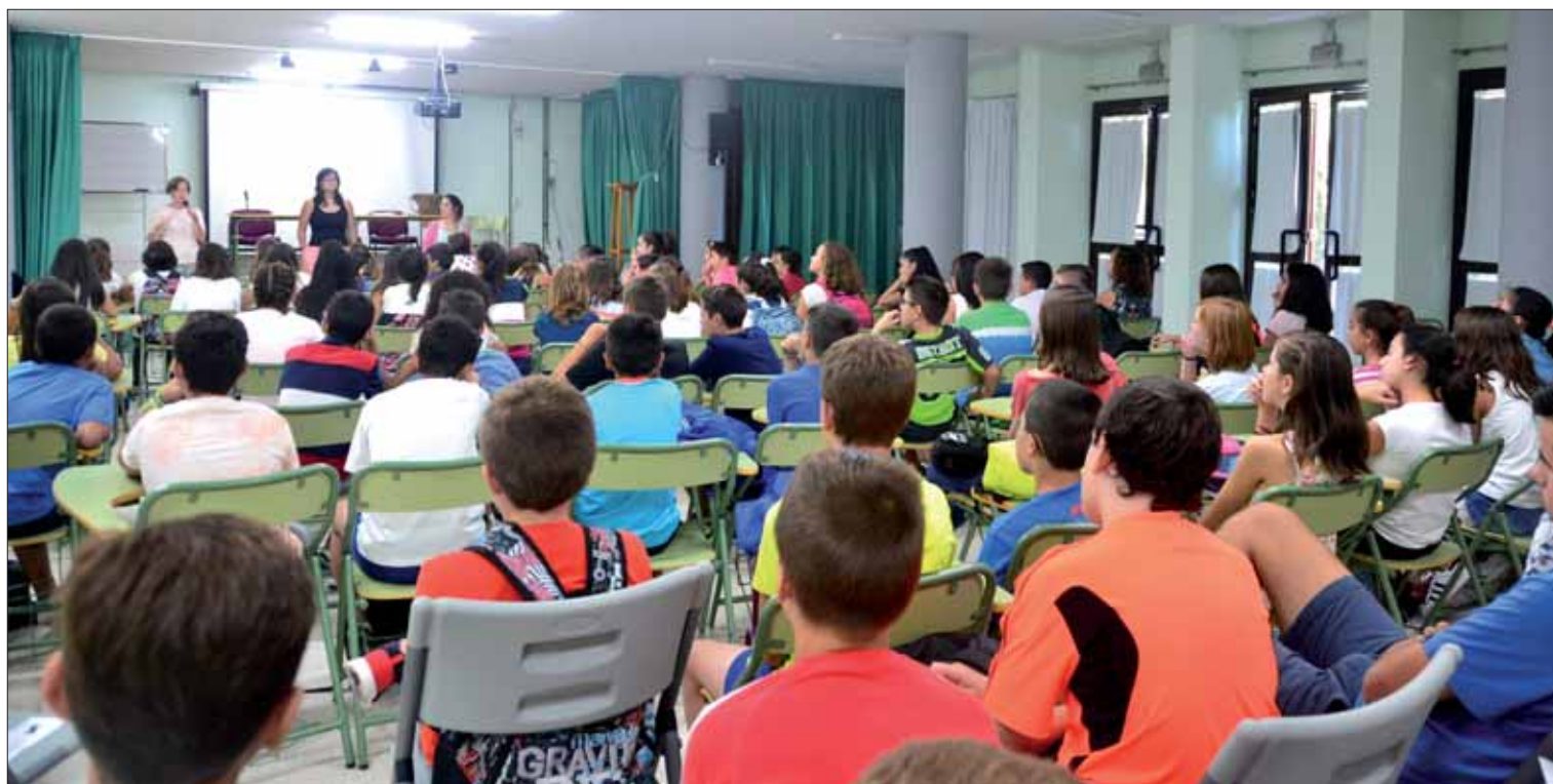
Los alumnos de 1º de ESO entraron antes en clase dentro de la incorporación paulatina a las aulas que se hizo en todos los niveles del instituto/FP

Pese a esa disminución, el instituto continúa masificado por la ratio marcada de antemano