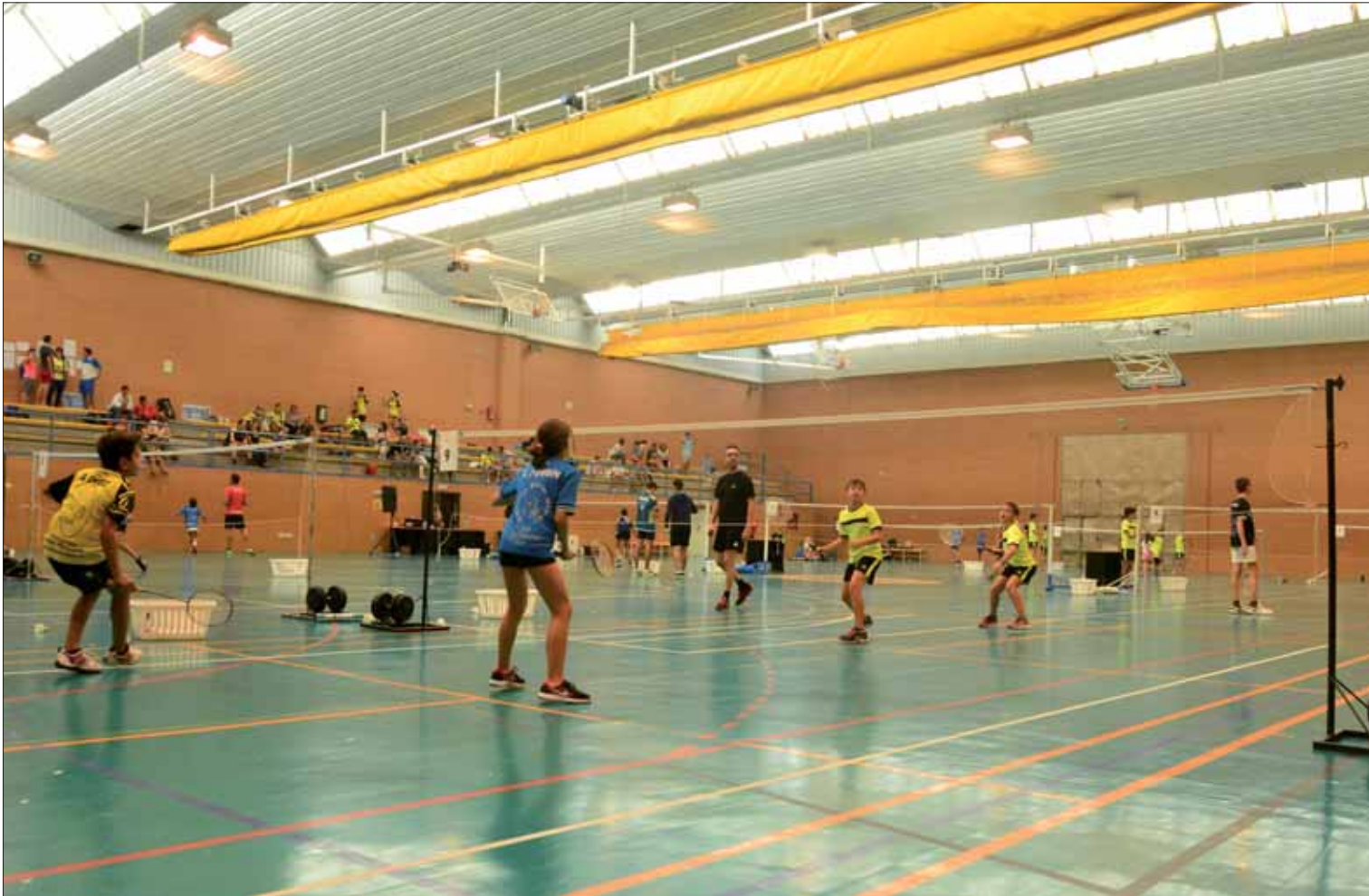
A lo largo de la maratónica jornada en el Pabellón Gregorio Piedra se disputaron un total de 142 encuentros/FP