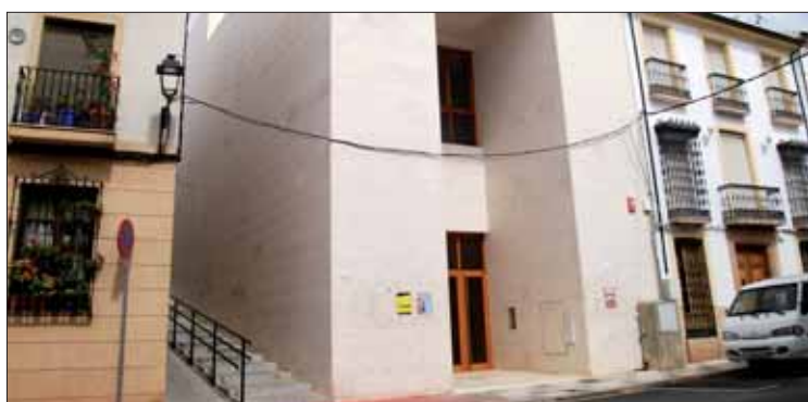
Estado actual del edificio cultural de la calle Fresno/F. Aroca