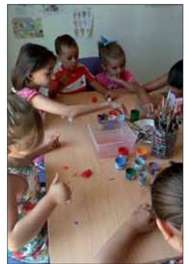
Algunos de los talleres de pintura y manualidades que se han llevado a cabo en la aldea ruteña/EC