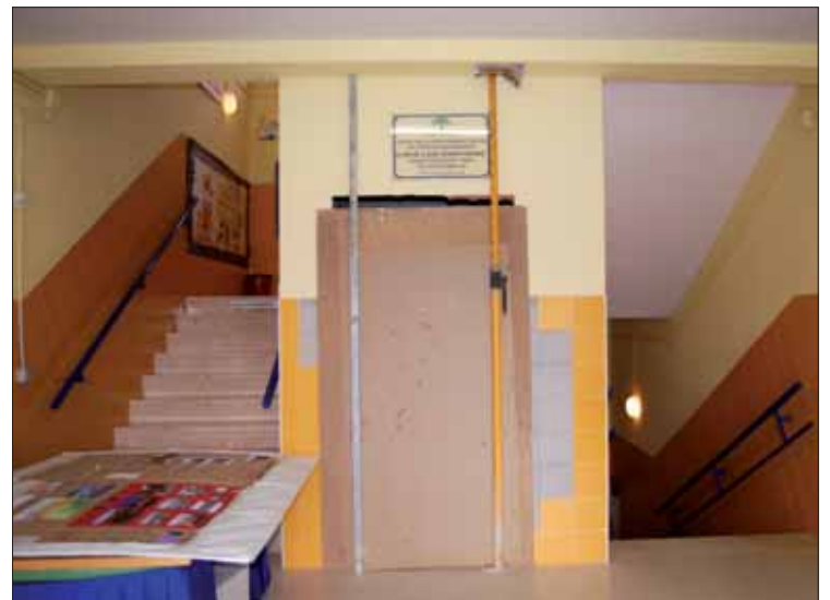
Obras de preinstalación del ascensor en Ruperto/F. Aroca