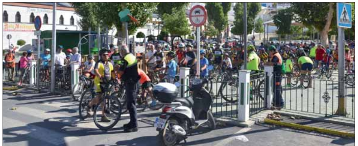
El recorrido partió del Paseo del Fresno y, dentro lo posible, se intentó ir siempre cuesta abajo

Antes de la marcha en sí, hubo una ruta de unos veinte kilómetros por los alrededores, que contó con la presencia de unos cuarenta ciclistas. A su término, se ofreció un desayuno molinero en el Fresno. De allí partió el re-