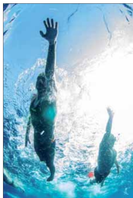
Una de las etapas por el parque natural

Además, al finalizar cada una de las rutas marítimas, un nutrido