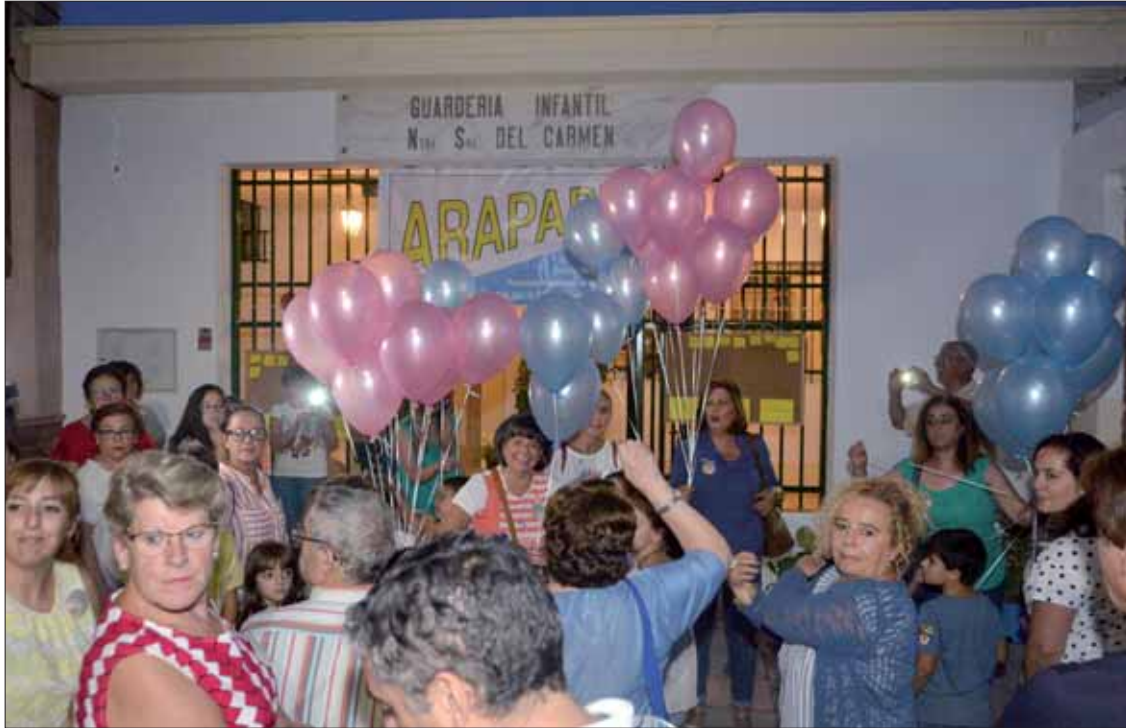
La marcha partió del Ayuntamiento y concluyó en la sede de Arapades con un manifiesto y una suelta de globos

Por la mañana, la asociación Arapades repartió pegatinas y folletos informativos, y por la tarde hubo una marcha solidaria