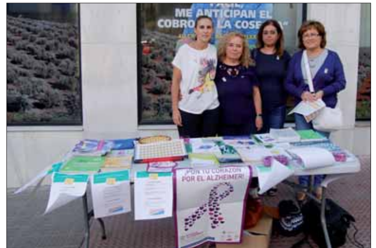
Una de las mesas informativas habilitada frente al Ayuntamiento

Tras los actos organizados para este día, el 28 de septiembre por la tarde se ofreció en la sede una charla a cargo de la enfermera y terapeuta ocupacional de la unidad. La temática giró en torno a una serie de pautas importantes a tener en cuenta por el cuidador.