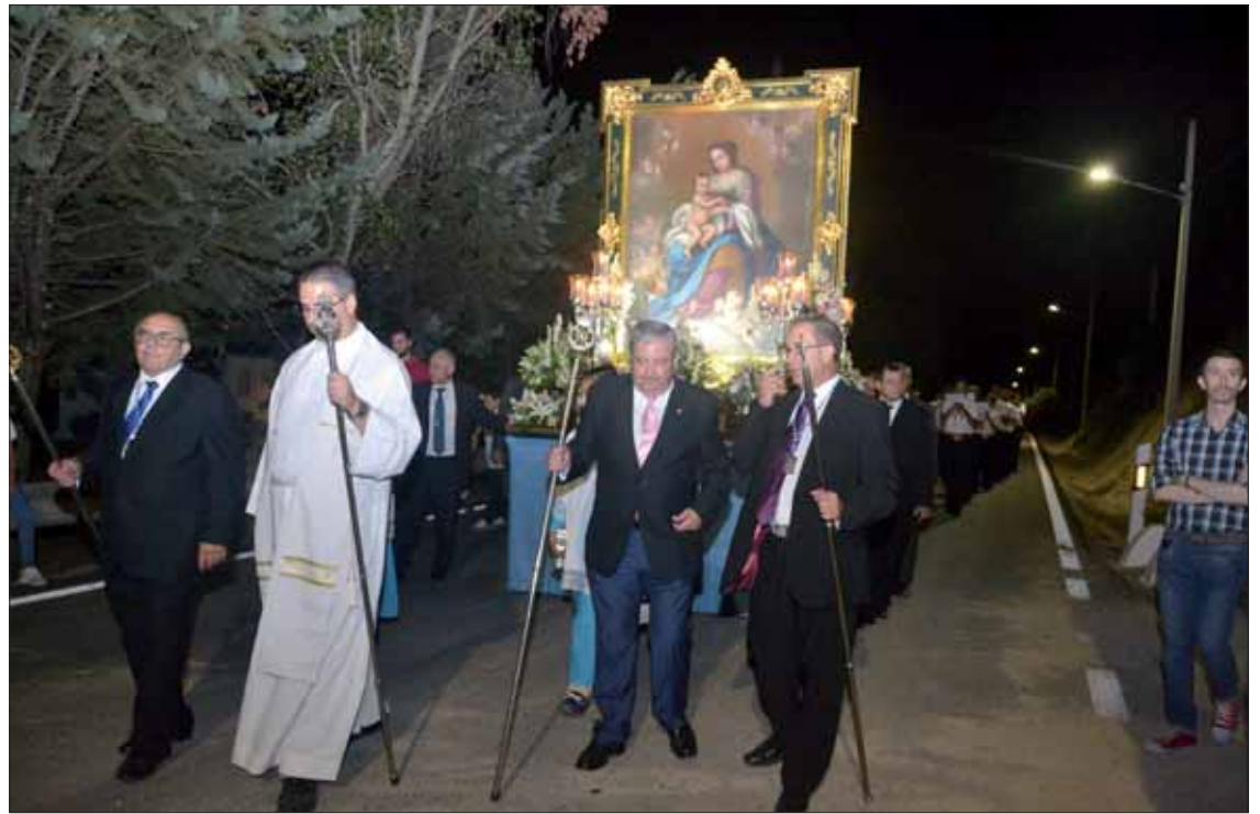
La Virgen del Consuelo recorre todos los recovecos de la aldea durante su salida procesional

septiembre fue el punto culminante. Desde primera hora de la mañana hubo actividades, con la apertura de la mesa de regalos primero y las carreras de cintas por la tarde. El momento central del sábado llegó a las nueve y media de la noche, cuando la