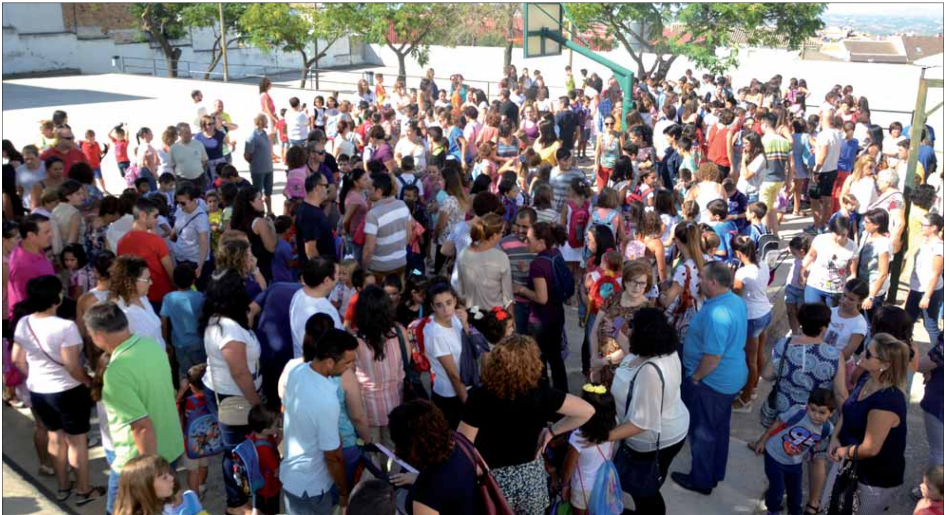
Un año más, el colegio con más estudiantes es Fuente del Moral, que acoge este curso escolar a un total de cuatrocientos treinta y seis alumnos/MM