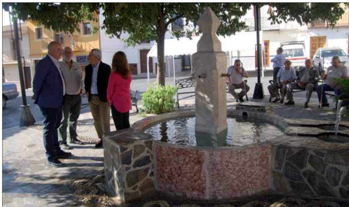
En Zambra se ha recuperado una fuente de dos caños que estaba en la plaza del centro

Con cargo a dicho plan se ha arreglado una plaza y en Zambra, además de la construcción de un acerado en Llanos de Don Juan