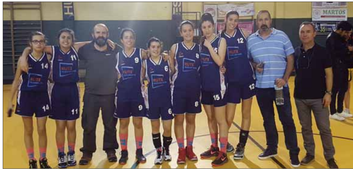
El combinado ruteño que concurrió a la capital cordobesa para disputar esta “final a cuatro”

Junto a las ruteñas, por orden en la liga regular, se habían clasifi-