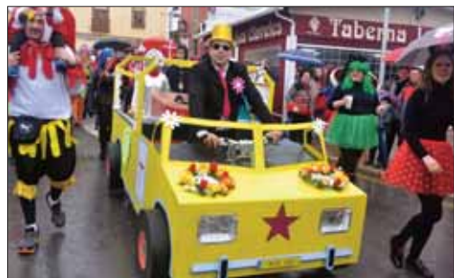
Se vieron disfraces de lo más sofisticado