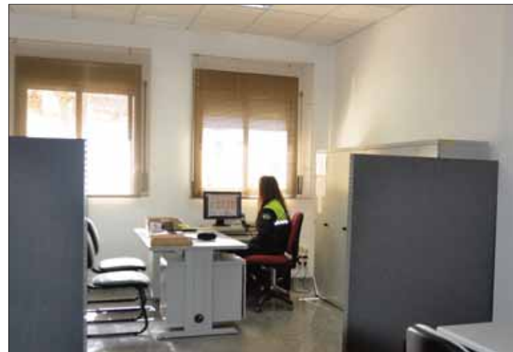
Las nuevas instalaciones mejorarán la calidad del servicio/VM