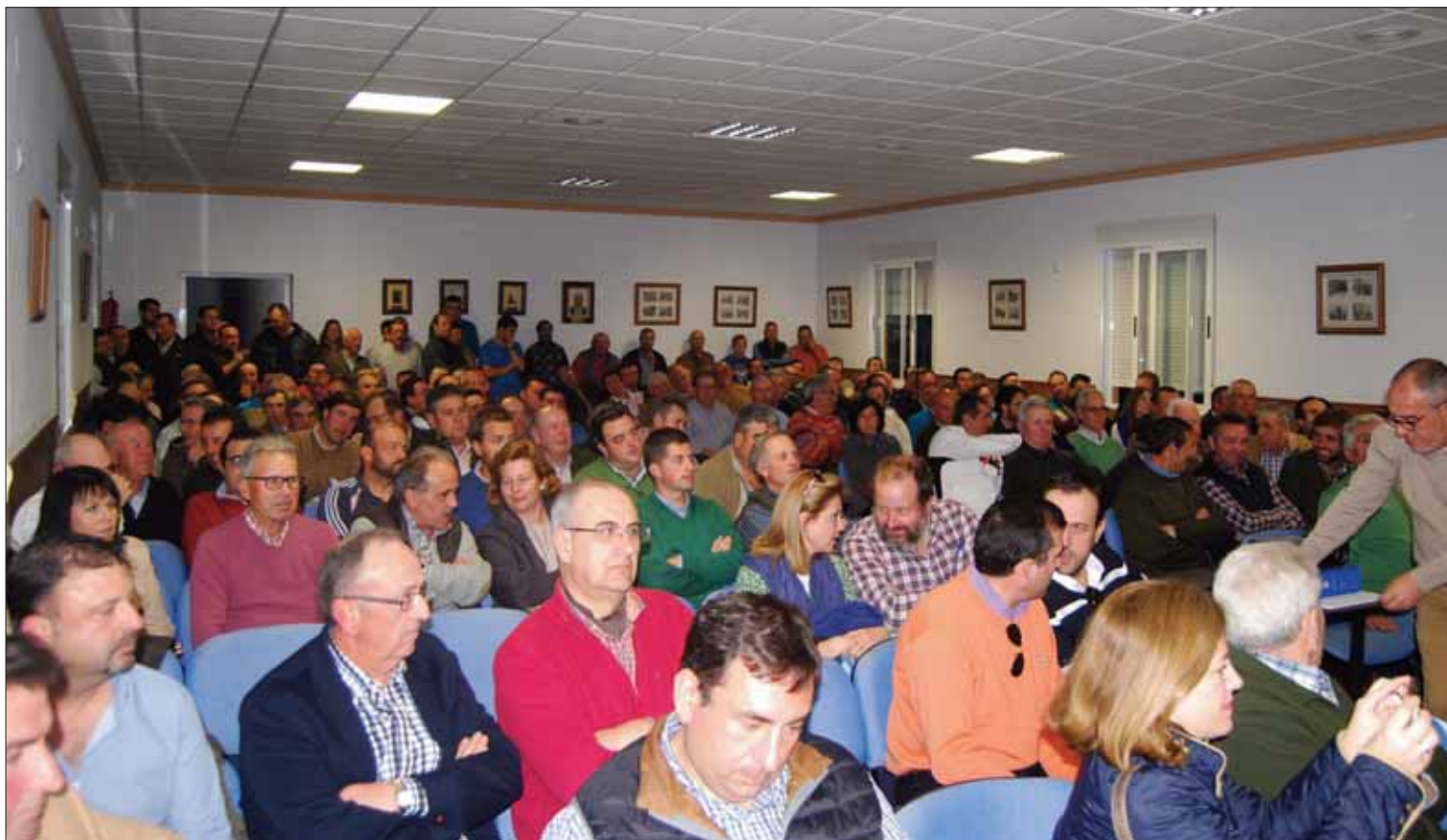
Los socios de la cooperativa agrícola de Llanos de Don Juan se reunieron para buscar soluciones y combatir la plaga que afecta al olivar

El total de la pérdidas de la cosecha, de los más de ochocientos socios de la cooperativa