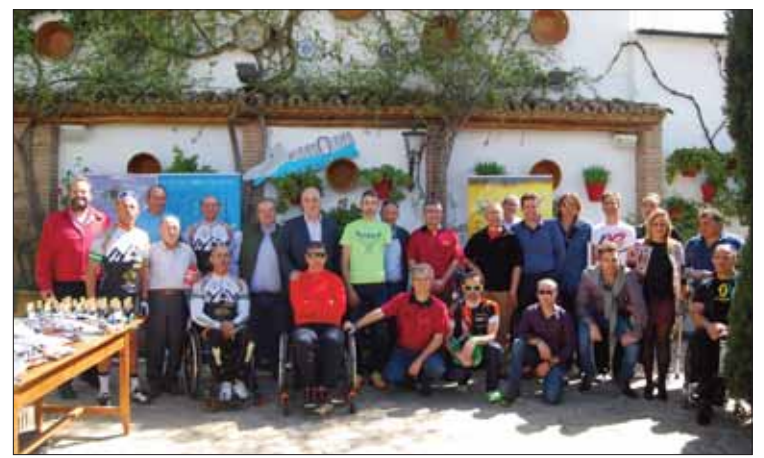
En el club hay deportistas de élite y otros con oros paralímpicos/FP