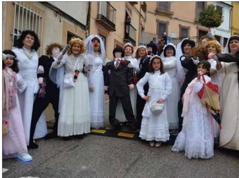
En el Carnaval hay momentos para todo, hasta para una boda múltiple