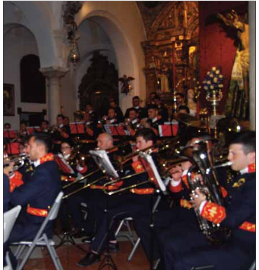
La Agrupación Musical Santo Ángel Custodio ofreció su repertorio en San Francisco/VM