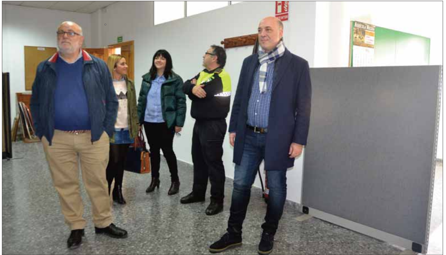
Representantes de la Corporación municipal supervisando las dependencias de la Jefatura de Policía

El alcalde explicó que la remodelación de estas nuevas instalaciones de la Policía Local se ha podido acometer íntegramente con presupuesto de la Diputación de Córdoba, dentro de su programa de Acción Concertada de 2017. Con muy poca inversión se ha conseguido “mejorar sensiblemente” dos servicios importantes para nuestro pueblo. Importante también es el anuncio de que el juzgado de Paz se trasladará al lado de las nuevas oficinas de la Policía. Según Ruiz, se trata de