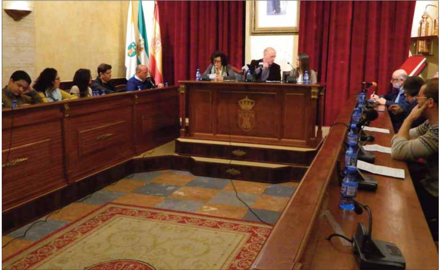
Un momento de la sesión plenaria del mes de marzo en el Ayuntamiento de Rute

No obstante, el hecho de que exista remanente positivo no significa que el Consistorio no tenga deuda. Ésta continúa pagándose a razón de unos novecientos mil euros anuales. Sin embargo, la deuda también se ha reducido "de