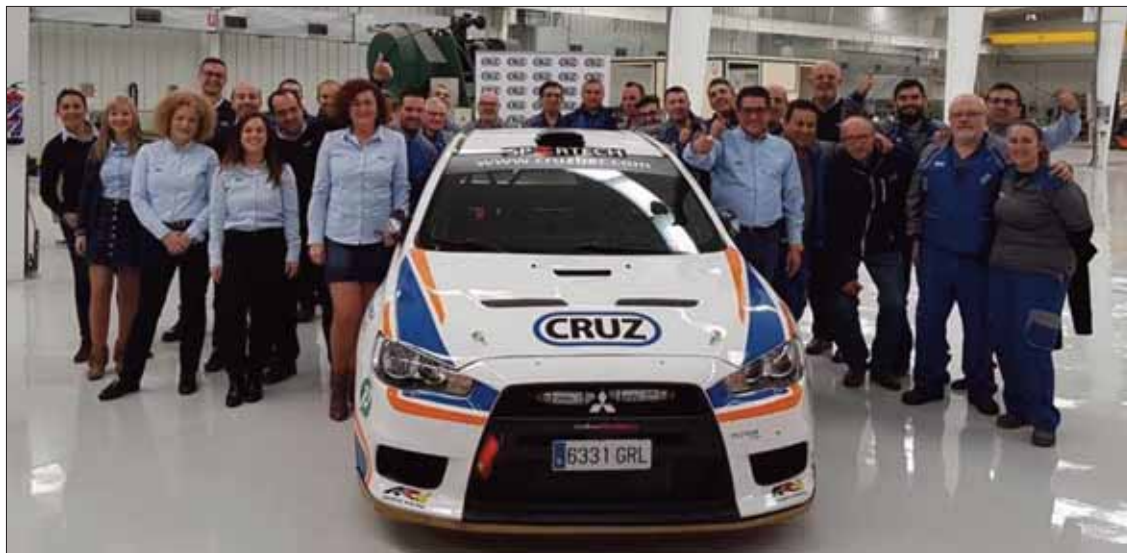
Las instalaciones de Cruzber acogieron la presentación oficial del nuevo coche/EC