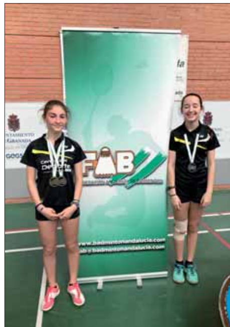
La O Pérez con su compañera de dobles/EC

No se atreve a decir que sea el triunfo que mejor sabor de boca le deja hasta el momento. Sin embargo, admite que, después de quedarse a las puertas del primer puesto el año pasado, con estos