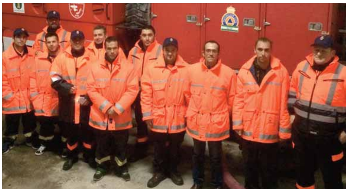
El grupo de voluntarios de Protección Civil ha crecido de forma notable en los últimos años

Lo importante es que conforman "una gran infraestructura" humana que suma más de cin-