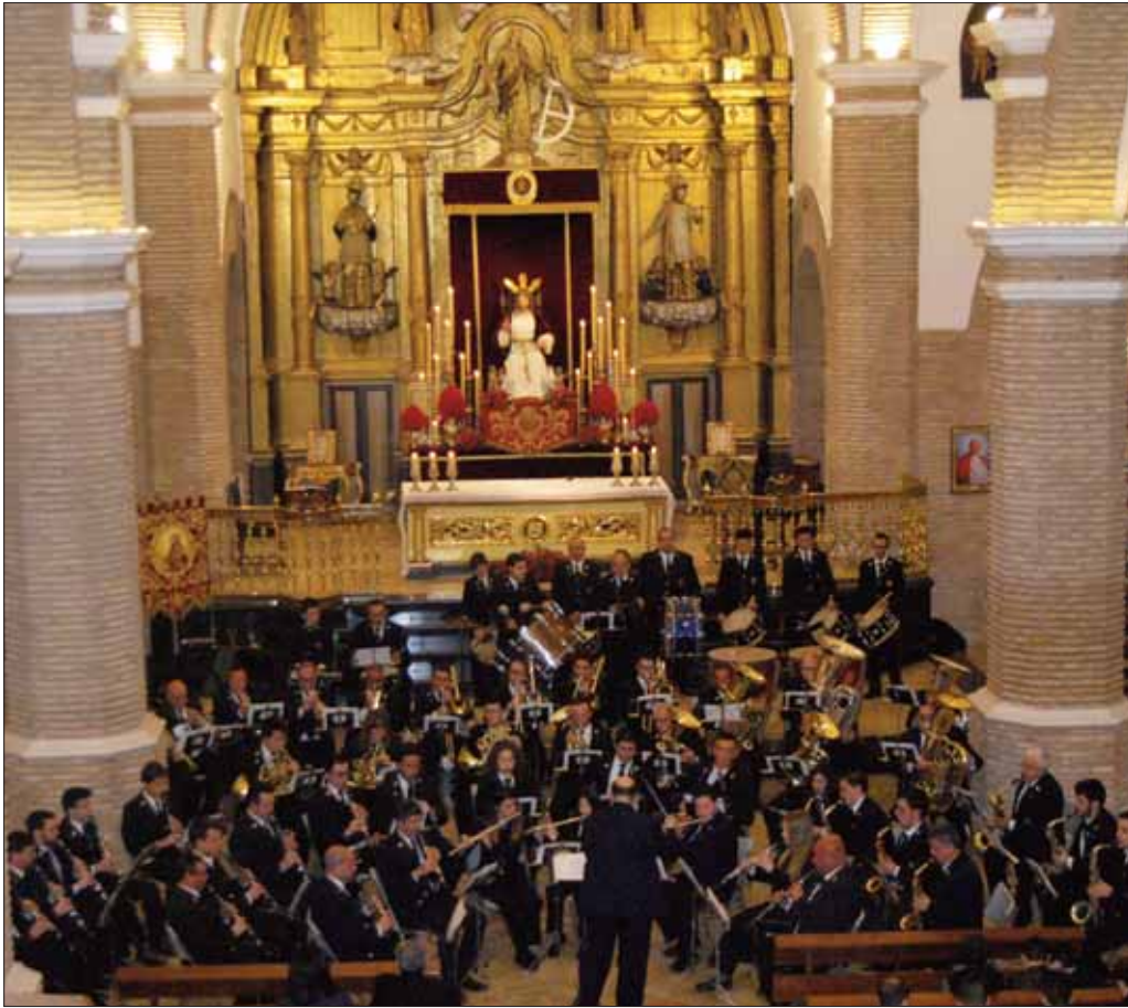
El concierto de la Banda Municipal se llevó a cabo en la parroquia de Santa Catalina Mártir/VM