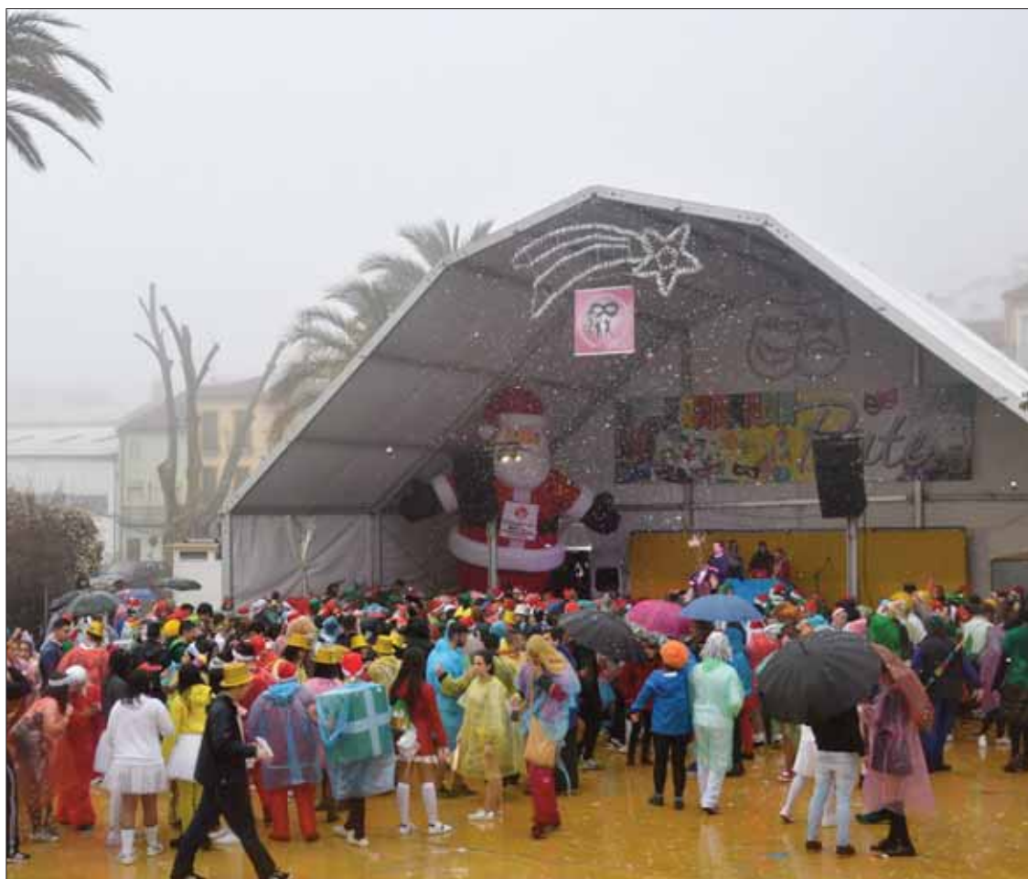
La carpa del Fresno simulaba el portal de Belén al que los fieles acudieron para adorar al Carnaval

Hace falta una interpretación así, frente a la realista de los demás días, para tomar conciencia de lo que de verdad importa. El Carnaval es, entre otras muchas cosas, salud y un ejercicio de higiene mental. Y como dijo el alcalde, una seña de identidad de nuestro pueblo. Por tanto, salud y larga vida al Carnaval de Rute.