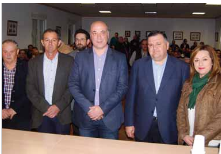
Reunión celebrada en la aldea de Los Llanos

Si bien el daño para la actual cosecha ya se ha producido, el alcalde consideraba que era “imprescindible” encontrar una solución inmediata para evitar que la plaga afectara en el futuro. Ya en la reunión de principios de marzo, Ruiz apuntaba que la solución pasaba por la aplicación