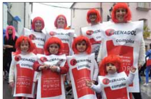
Familias prevenidas ante un constipado/FP