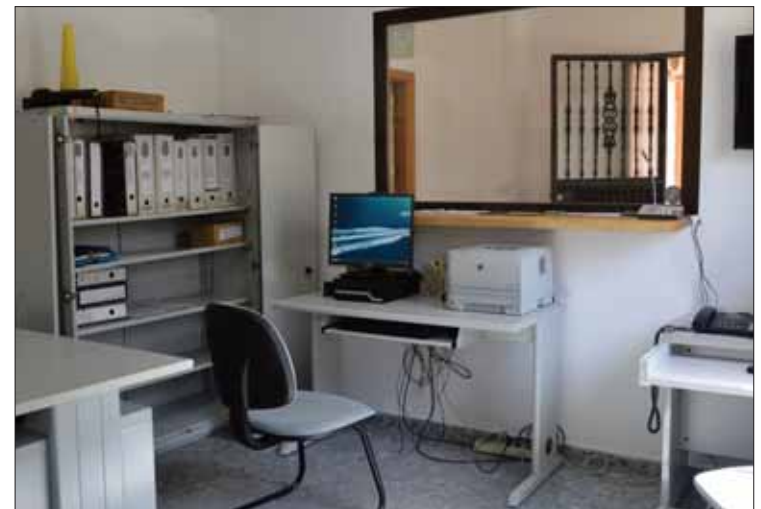
En estas instalaciones se podrá renovar el DNI/VM