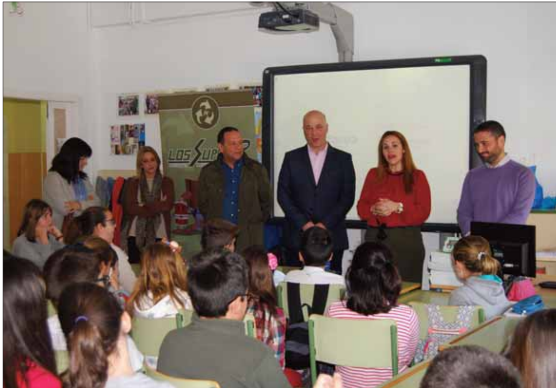
En los talleres sobre consumo responsable han participado alumnos de 6 a 11 años de edad

MARIANA MORENO El pasado 30 de marzo, durante toda la mañana, los alumnos y alumnas del Colegio Público Ruperto Fernández Tenllado tuvieron la oportunidad de ir pasando por unos talleres impartidos por la organización FACUA. Dichos talleres se llevan a cabo gracias a un convenio de colaboración entre esta entidad y la Diputación de Córdoba. La institución provincial ha posibilitado la elaboración de material y la impresión de una publicación relacionada con el reciclaje y el consumo responsable. Se trata de una iniciativa que busca informar y concienciar a los escolares sobre qué es el consumo responsable, y sobre cuáles son las prácticas individuales, o cuestiones que cada uno puede realizar para contribuir con la protección del medioambiente.