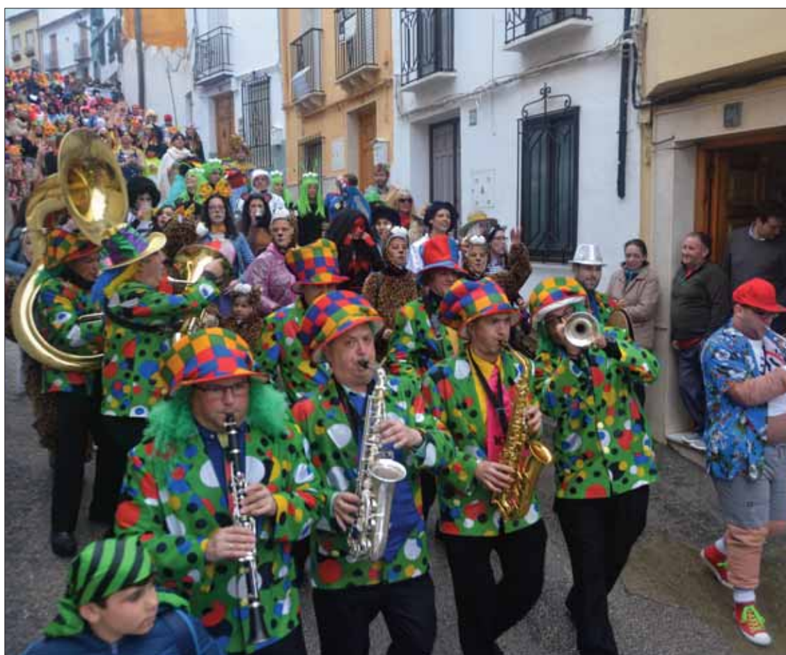
La lluvia también restó público al pasacalles municipal del Domingo de Piñata