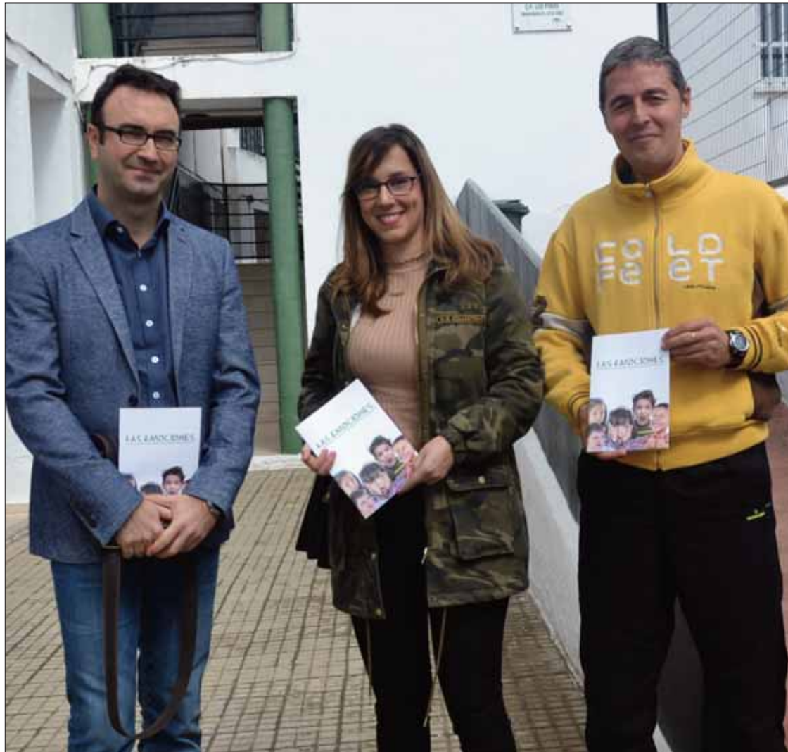
La jornada se aplicó a los cursos superiores de cada ciclo de Los Pinos/VM

refuerza las jornadas de desayunos saludables y los valores que se inculcan a este respecto en el centro. No en vano, en Los Pinos cuentan con el programa “Creciendo en salud”, que aborda tanto la alimentación sana como el de la inteligencia emocional.