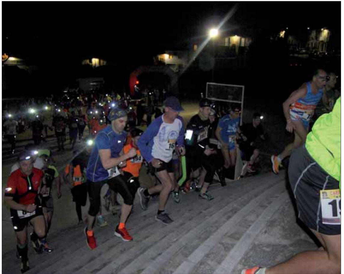
Nada más salir, los corredores tuvieron que subir por las escaleras del Paseo del Fresno/VM

En su opinión, no es una carrera para hacer grandes tiempos, cree que por la humedad y la presencia continua del viento en todo el paseo marítimo. Aun así, su trazado llano y la proximidad geográfica la han convertido en un clásico de estas fechas.