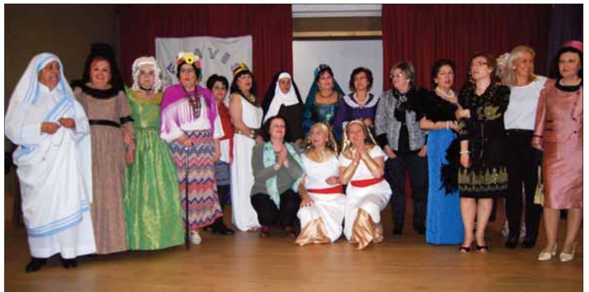
Las actrices de la Asociación de mujeres Buenavista/VM

asistente, y pidió disculpas por los posibles fallos que pudieran haberse efectuado. Estas mujeres que ponían vida a estos personajes no son profesionales, sino que han salido de la escuela de adultos de Doña Mencía. La idea de llevar a cabo esta obra fue como consecuencia de las clases de Historia a las que asistían estas mujeres. El logro de todas ellas es que el guión lo habían preparado ellas, junto a su profesora de Historia.