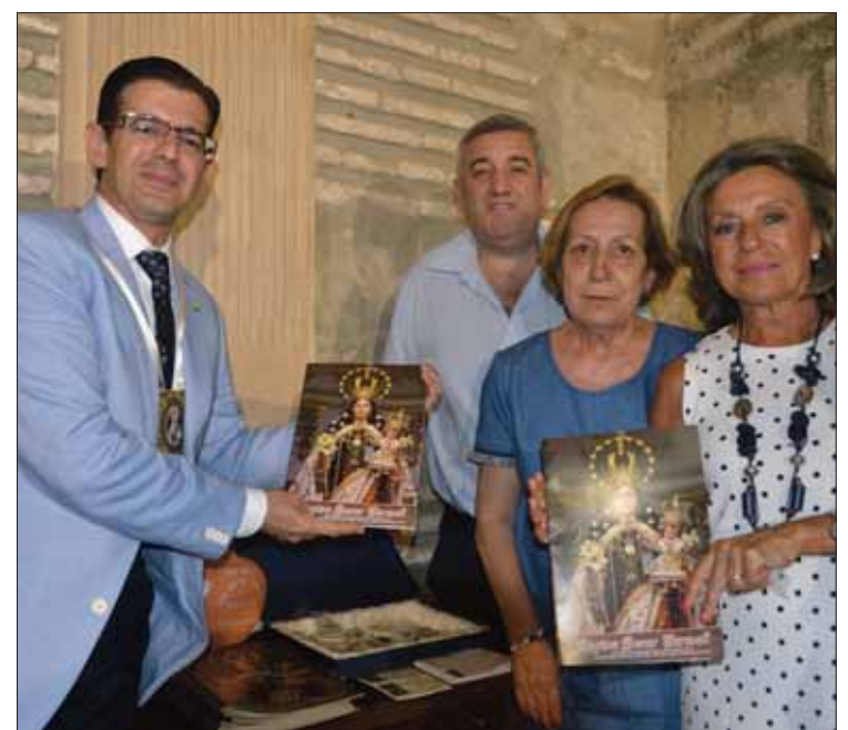
Miembros del grupo de coronación de la Virgen /MM

Finalmente, el 15 de agosto es el día grande de la Virgen. La jornada comenzará a la ocho de