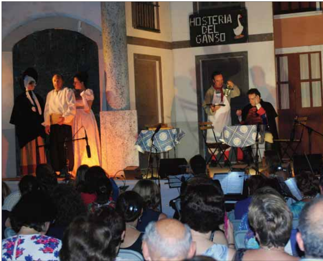
El patio del colegio Ruperto Fernández Tenllado se llenó para esta representación en vivo

la calurosa noche del 14 de julio en el patio del colegio Ruperto Fernández Tenllado. Para ello se ha apostado por la obra “La canción del olvido”, que el año pasado cumplía el primer siglo