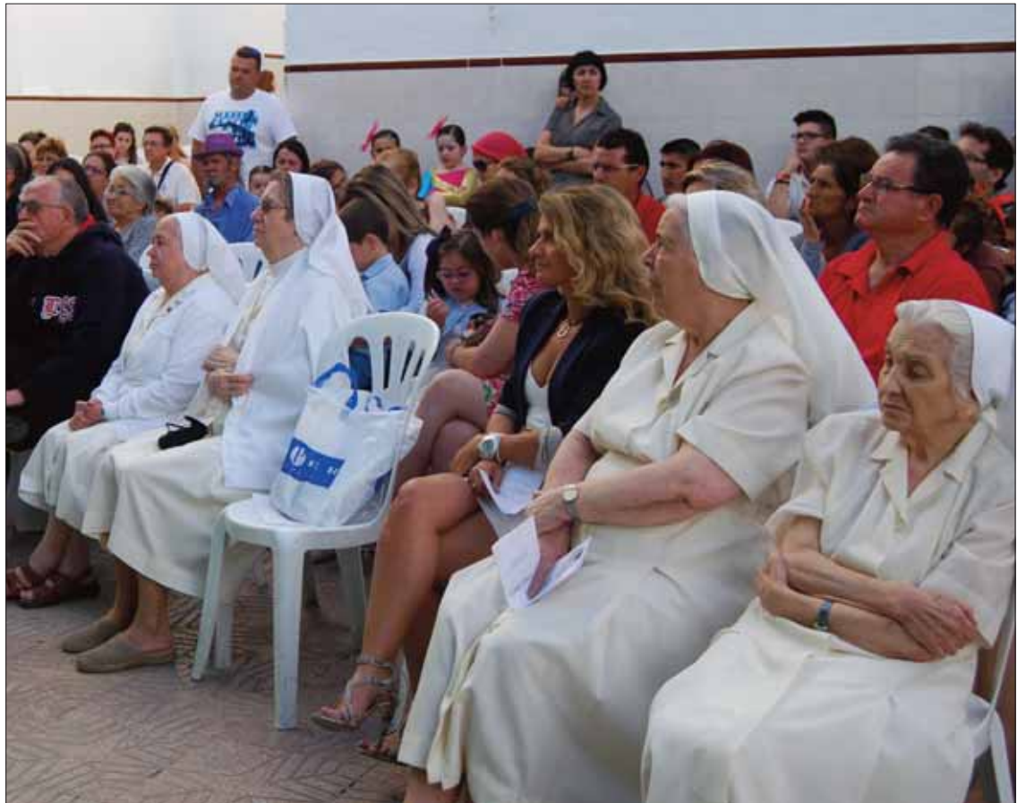
Las Mercedarias durante la celebración del 50 aniversario de la Escuela

Jiménez ha indicado que en la fundación han hecho "todo lo posible" para que siguieran. Sin embargo, como ocurrió en los tres citados casos, desde la Casa Provincial de las Hermanas Mercedarias de la Caridad, con sede en Cájar (Granada), tuvieron que asumir que la