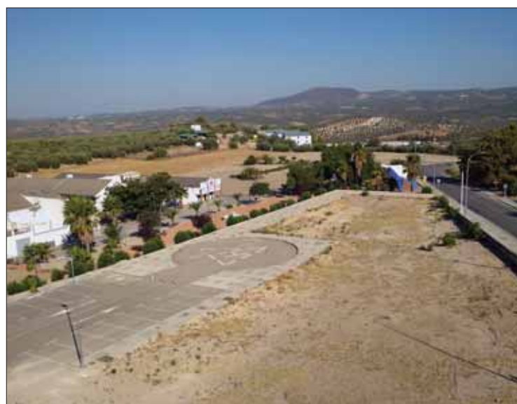
Los terrenos ofertados por la Junta se encuentran en el PPR1/F. Aroca

También ofrece siete parcelas de suelo industrial que se ubican en Adamuz, Cabra, El Carpio y la capital. A éstas se suman también nueve locales y 19 garajes en