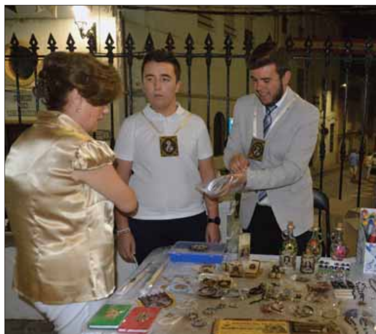
El Grupo Joven ante el merchandising de la Virgen

Por otra parte, el día 12 se ofreció una serenata en honor a la “carmelitana mayor” y su corte de damas. También los más pequeños han podido disfrutar de los pasacalles con animación infantil denominado “Toros para todos”. Esta actividad se ha podido llevar a cabo con la colaboración del Ayuntamiento de Rute y la Diputación de Córdoba. Igual ha ocurrido con la anima-