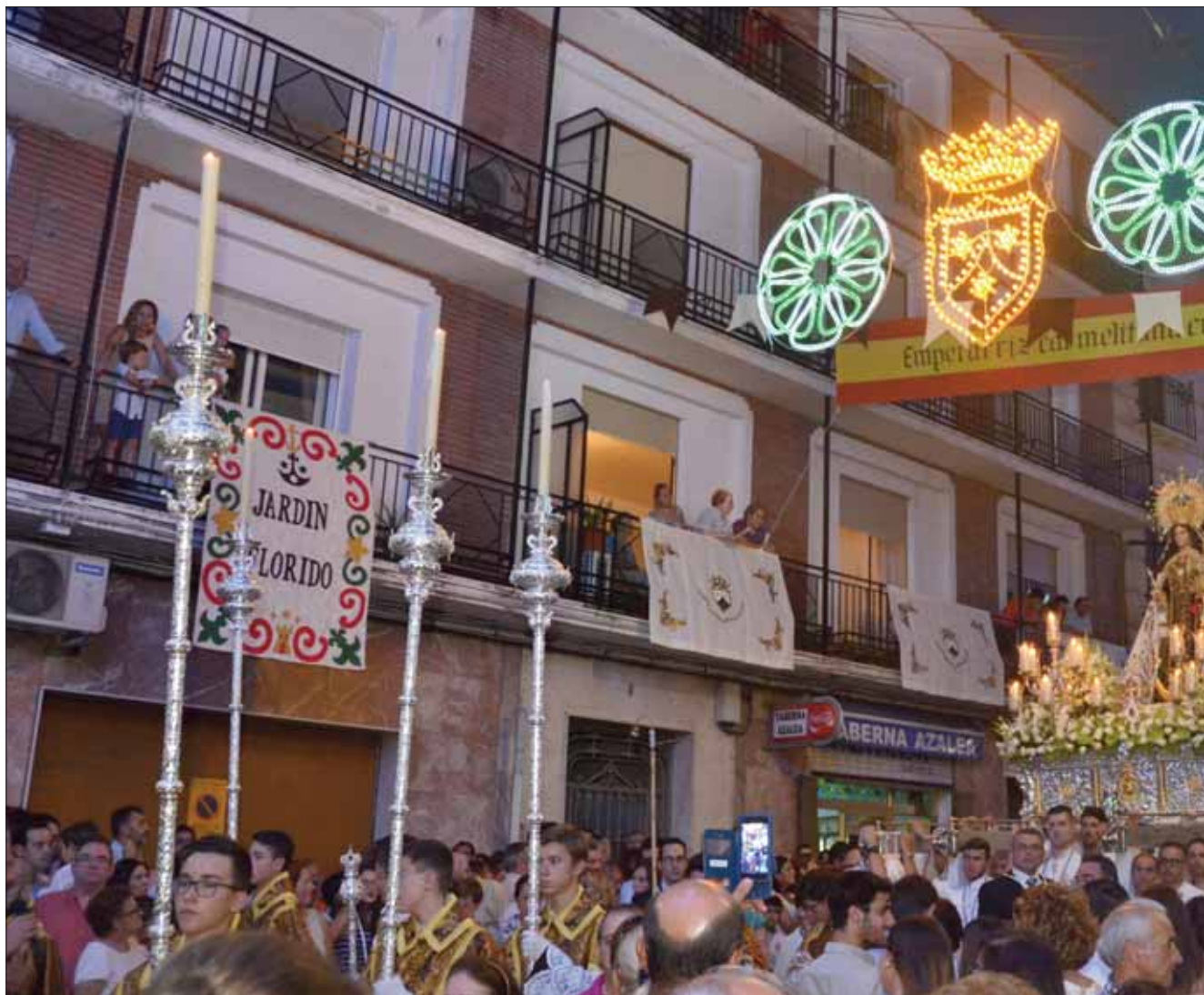
Uno de los momentos del Traslado que congregó más público fue el paso de la Virgen a la altura del Ayuntamiento/FP