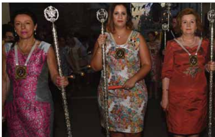
La junta de Gobierno cuenta con varias mujeres/FP