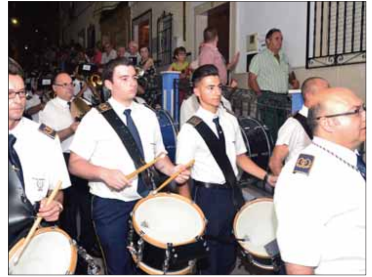
La Banda Municipal a la altura de la calle Roldán/FP