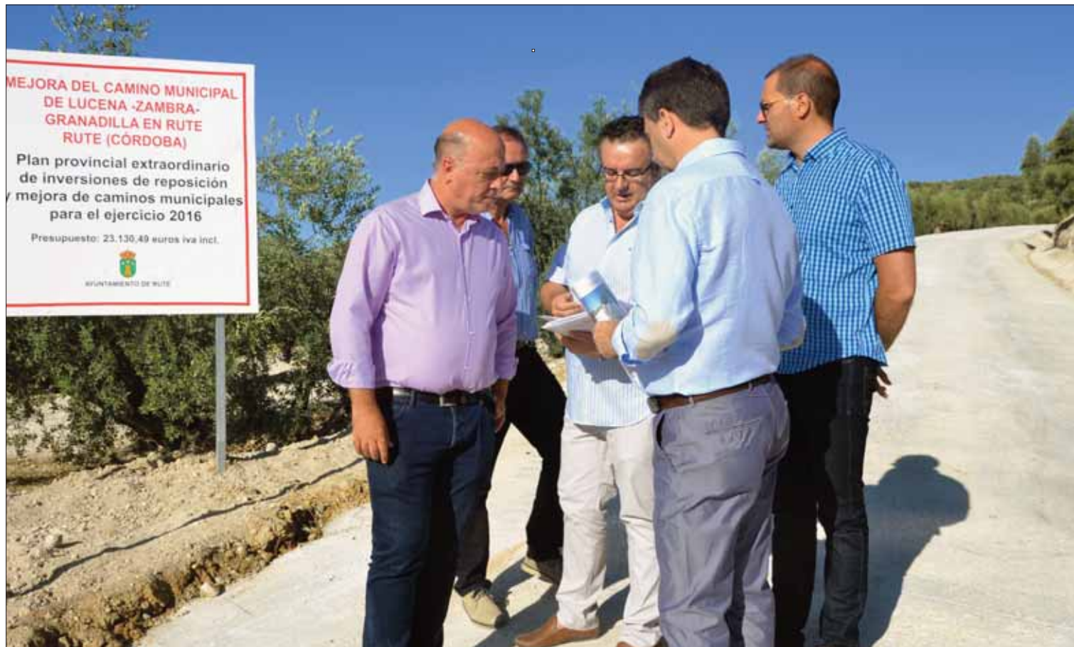
Los ediles ruteños y los responsables de Diputación supervisan las actuaciones llevadas a cabo en este camino/FP

Han adecentado todas las cunetas y han reforzado con hormigón unos ciento treinta metros, con pendientes del 10%