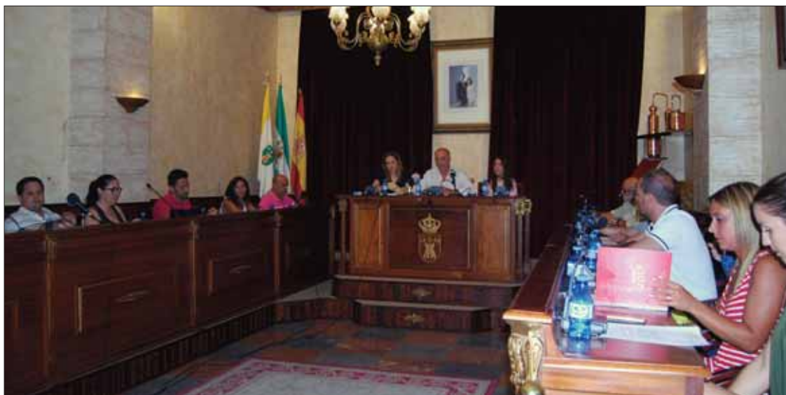
Un momento la sesión ordinaria celebrada en el salón de plenos a mediados de julio/MM

El alcalde explicó que, pese a contar con los recursos económicos necesarios, la partida no se