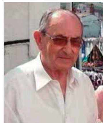
Ángel López del Rincón/EC