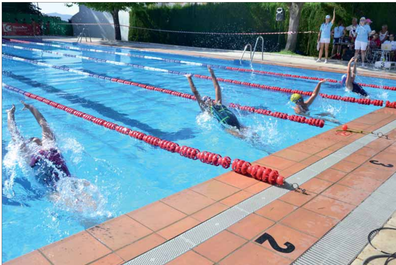
En la fase comarcal que se disputó el último día de julio en la piscina municipal de Rute participaron clubes de siete pueblos cordobeses

La Federación ha apostado por recuperar los Campeonatos Provinciales