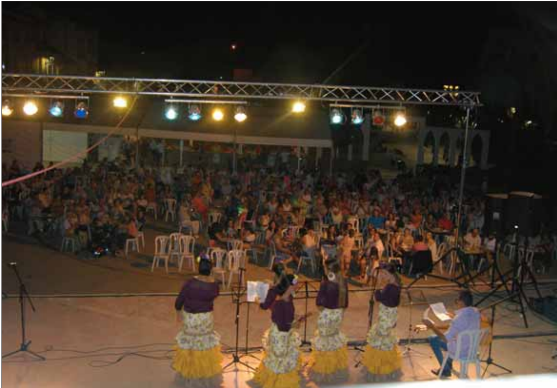
El coro "Entre amigos" de Cuevas de San Marcos, amenizó la velada en la noche del sábado/VM

Durante todo el fin de semana el Fresno fue un hervidero de ruteños