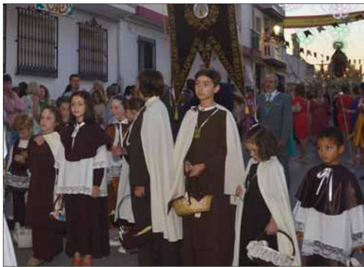
Miembros del grupo joven de la archicofradía/FP