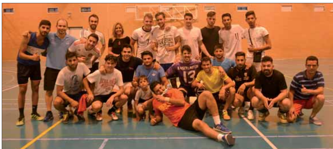
Pese a lo reñido de la final, los dos equipos compartieron celebración al término del encuentro

La concejala de Deportes, Mónica Caracuel, matizó que