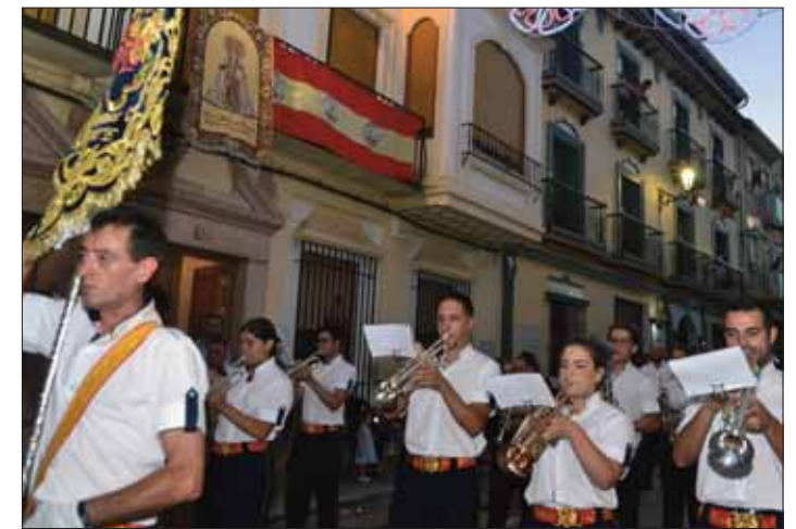
La Agrupación Santo Ángel Custodio por la calle Toledo