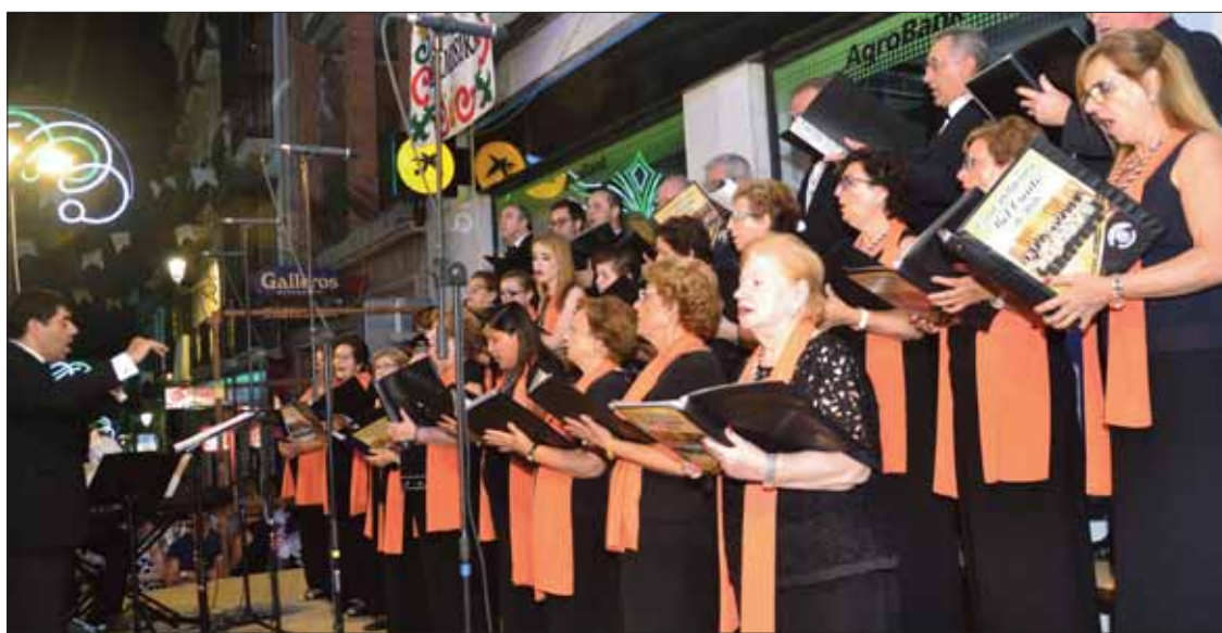
La actuación de la coral Bel Canto ya se ha convertido en un momento imprescindible del Traslado/FP

Y como viene siendo ya costumbre, la archicofradía celebró entre el triduo y el Traslado su verbena popular. A todos estos actos se han sumado las salidas de los Hermanos de la Aurora en las noches de los sábados, que arrancaron justo el día 1. Precisamente, como antesala de la procesión, los Hermanos de