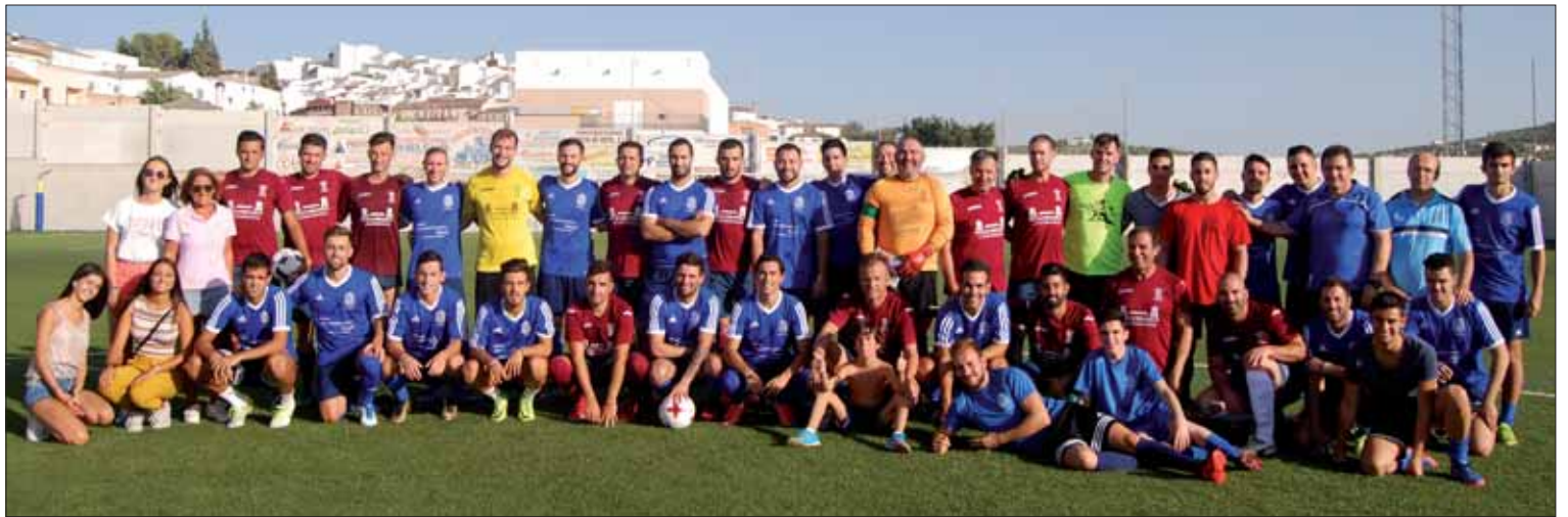
Los dos conjuntos que se disputaron este tradicional trofeo minutos antes de comenzar el choque en la Ciudad Deportiva Juan Félix Montes

Según el presidente, ha sido una suerte contar con el equipo visitante en estas fechas