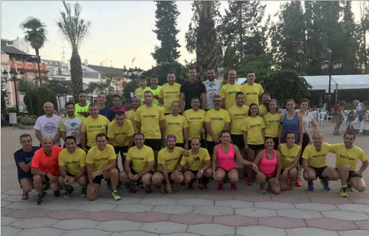
Como de costumbre, la quedada partió del Paseo Francisco Salto/EC