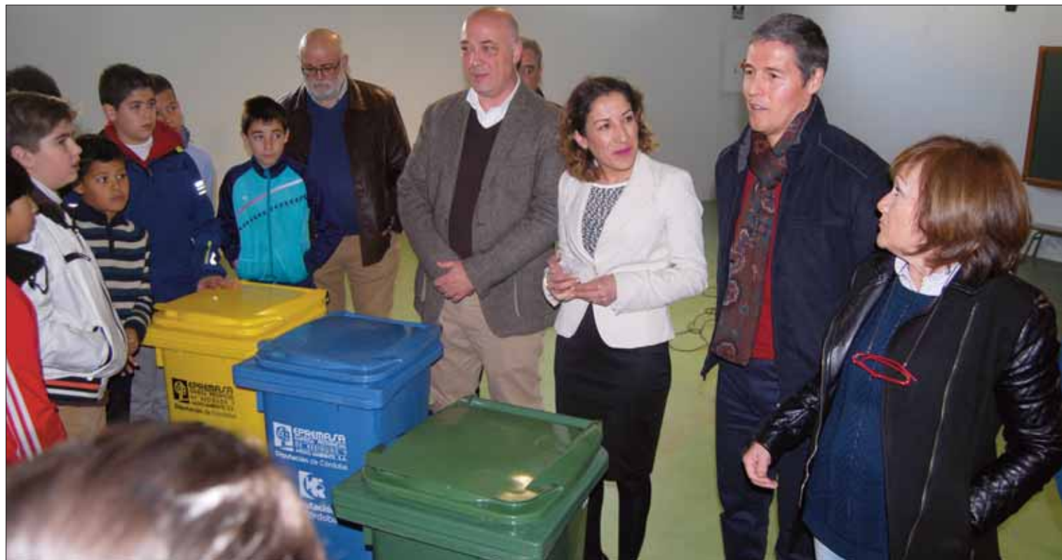
El director del colegio, el alcalde de Rute y la diputada de Medioambiente presentando la campaña en Los Pinos/MM

Se dotará a los colegios de la provincia con contenedores para el depósito diferenciado de los residuos