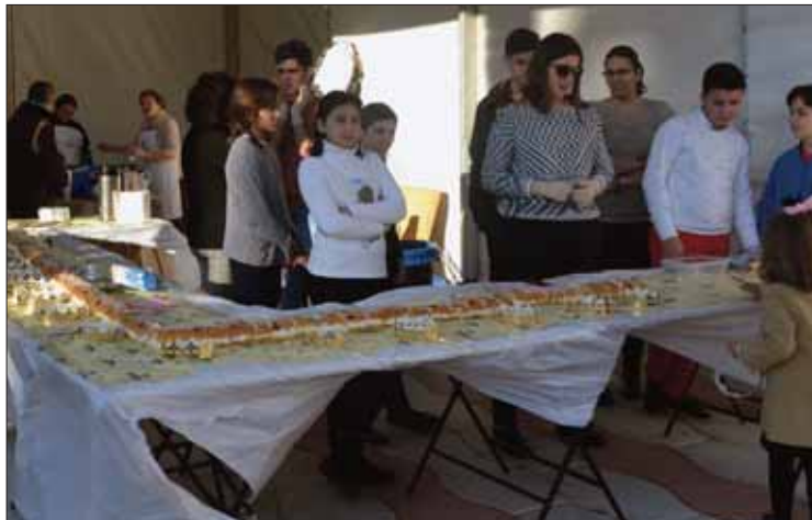
El grupo joven del Carmen organizó el roscón de Reyes/FP

estimular la compra en estas fechas y que ha correspondido a