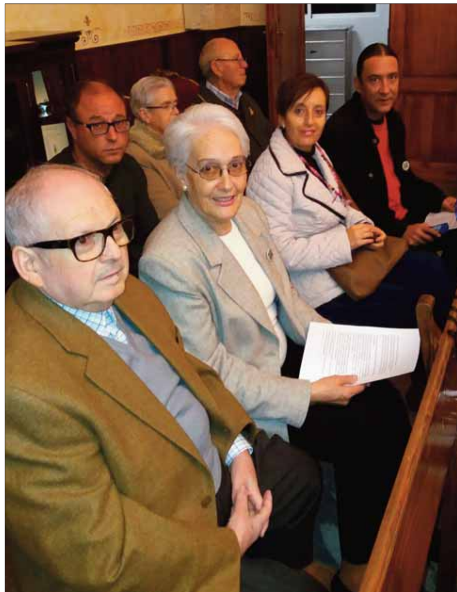
Algunos de los miembros y socios que componen ARAEM en Rute/EC

nexo y de tipo asistencial entre pacientes, familiares y con los servicios públicos de salud. Cada año cuando llega el 10 de octubre se conmemora el Día Mundial de la Salud Mental y se elige a través de internet un lema que represente a este tipo de enfermos. Para 2016 resultó elegido “Soy como tú, aunque no lo creas”.