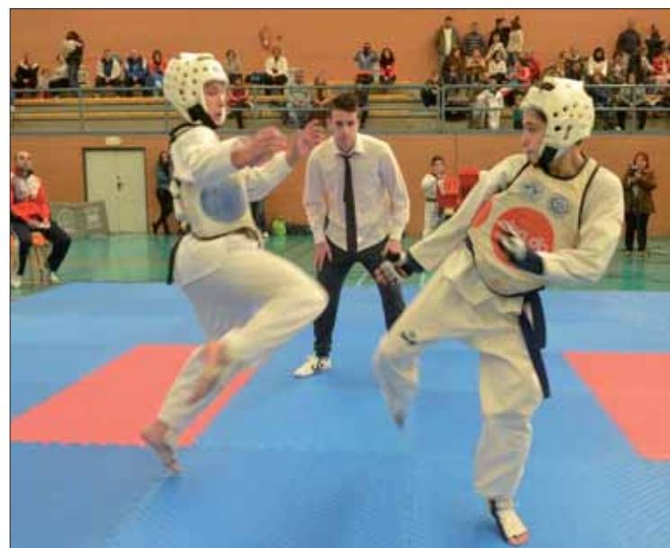
Puerto (a la derecha) en una edición pasada del Torneo de Navidad/FP

No es la única razón para haber vuelto de Bormujos con ese sabor agri dulce. Aunque está cuajando una temporada impecable, acudía a esta cita después de llevar semanas arrastrando una lesión. Ello le ha privado de ren-