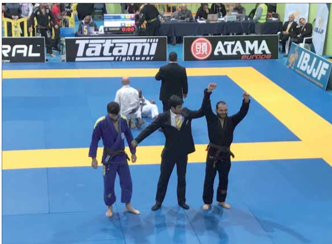
Povedano en el momento en que se daba por finalizado el combate que lo consagraba como campeón europeo/EC

A esa dificultad había que añadir que los dos se conocen muy bien. Según ha explicado, si él quiere llevar la iniciativa le interesa alguien con quien no se haya medido nunca, para que el rival no adivine sus intenciones. No fue éste el caso. El objetivo era, pues, superar esa fase, no sólo por planificar "a corto plazo", sino porque suponía dejar