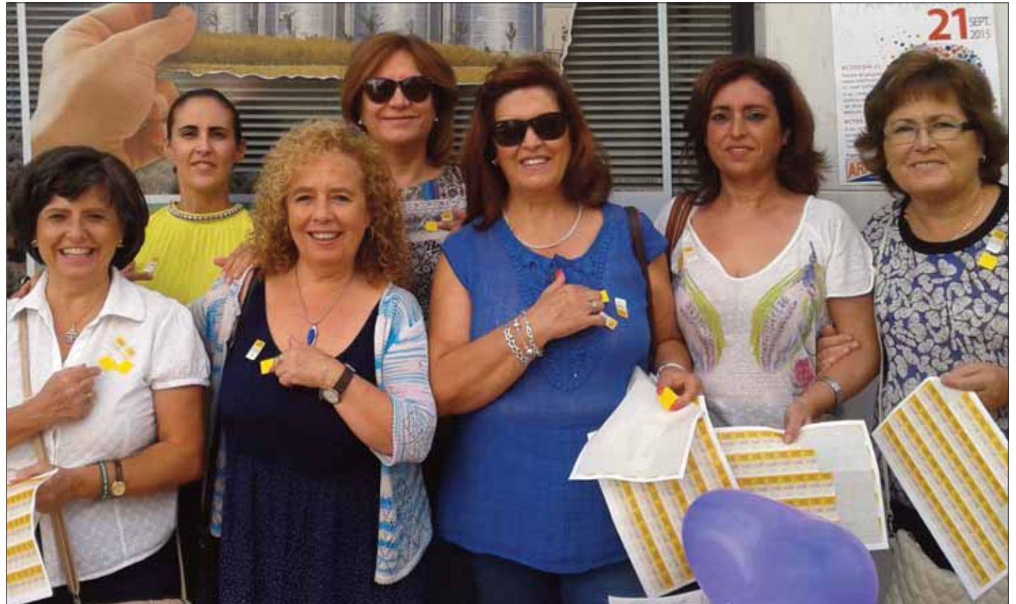
Miembros de la actual junta directiva en un acto informativo y de sensibilización

La Asociación Ruteña para la Atención a Personas Afectadas por Demencia Senil, Arapades, nació de la necesidad de comprender qué les está pasando a nuestros seres queridos, y del deseo de poder ayudarles y acompañarlos en este trance. Esta asociación se fundó en 1999. Dos años después cuajaría uno de sus logros más perseguidos: contar con un espacio en el que prestar apoyo a las personas con algún tipo de demencia y a sus familiares. Se crea así la Unidad de Estancia Diurna para atender a un total de cuatro