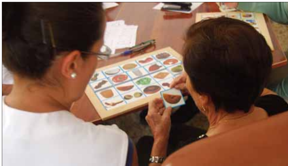
Una de las usuarias durante los talleres de estimulación cognitiva/EC