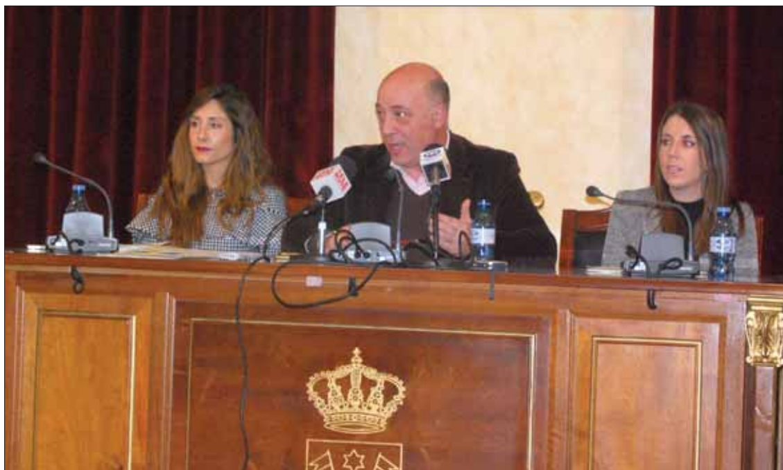
Un momento de la primera sesión plenaria de carácter ordinario celebrada en 2017/MM

Respecto a este último, la concejala apuntó que quizás haya llegado algo tarde, y es porque ella misma, que ha formado parte de la Corporación municipal durante diez años, “no era consciente de que no lo tenía”. Por tanto, es un premio más que merecido por la labor que viene haciendo desde hace dos décadas en nuestra localidad. También se han concedido tres distinciones