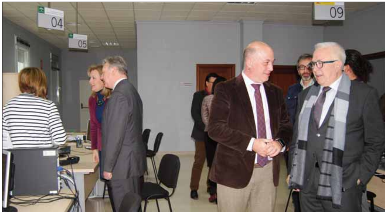
El alcalde junto al consejero de empleo a su izquierda, y el subdelegado del Gobierno conversando con unas empleadas

En la actualidad, en Rute hay 537 parados, cincuenta y cuatro menos que en noviembre, un 8,31% de paro registrado frente al 12,29 % de la comarca. En Iznájar, los datos son aún más positivos, con 174 parados en diciembre, treinta menos que en el mes anterior. Su tasa es del 6,22%, la más baja de toda la comarca.