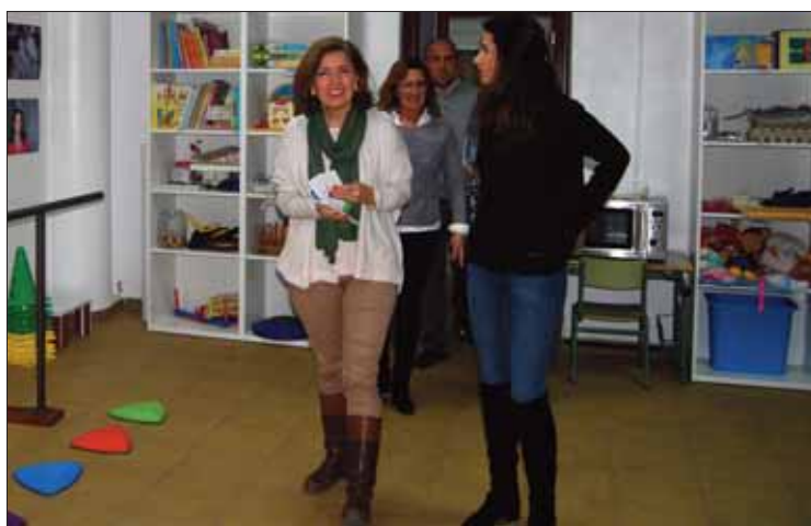
La diputada provincial durante su visita a la sede de Cuenta Conmigo

Según Botella, para el Partido Popular, las personas con necesidades especiales “no deben ser una cuestión que se quede sólo en el ámbito familiar”. Considera que toda la sociedad debe implicarse para que estos niños estén bien atendidos “en todos los territorios de la provincia”. De ahí que, como diputada provincial, manifestase que uno de los retos de la entidad debe ser ayudar a los municipios pequeños y lograr que exista “una igualdad real de oportu-