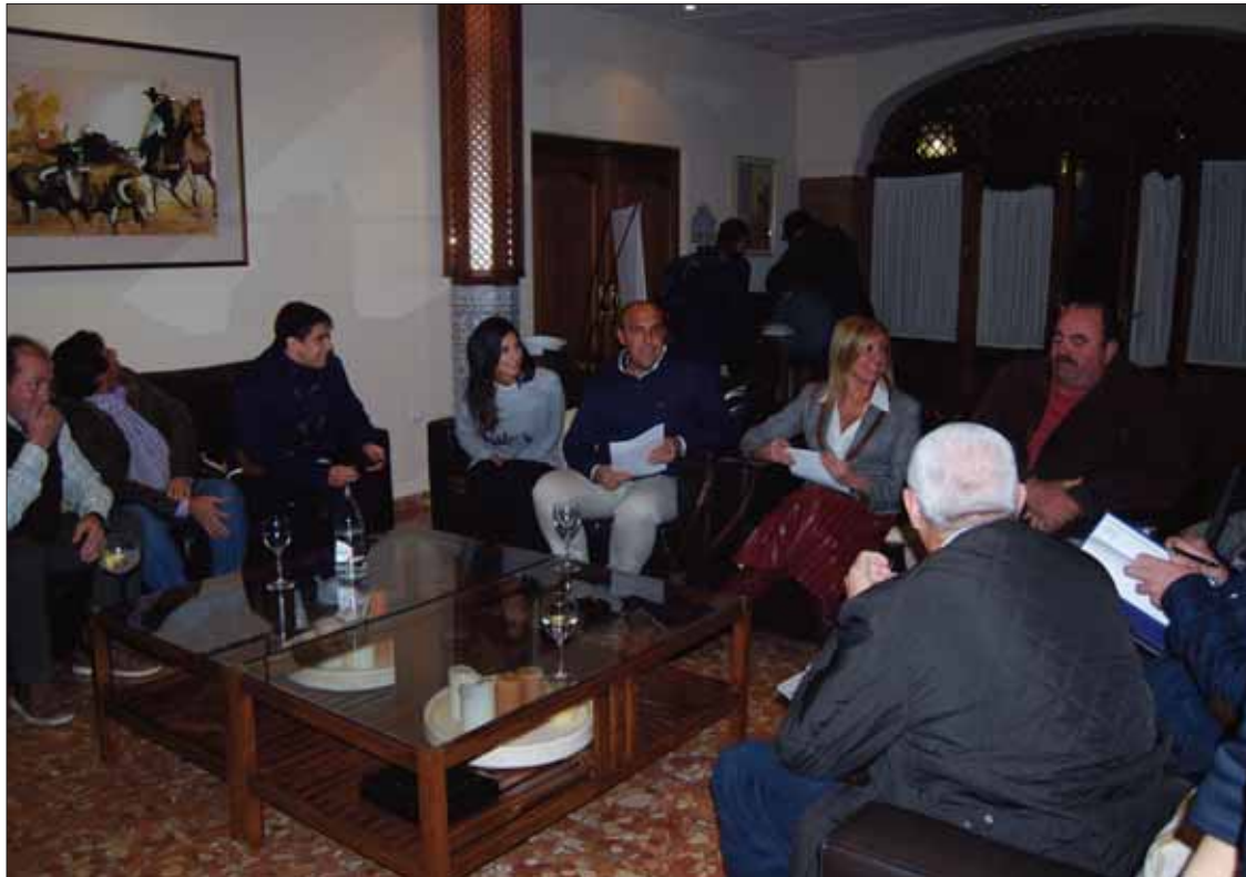
La parlamentaria andaluza del PP durante la reunión con cazadores, pescadores y agricultores de Rute/MM

las enmiendas que el grupo popular ha presentado a la Ley de Senderos que en breve se va a debatir en el Parlamento Andaluz. Las propuestas populares, ha dicho, van encaminadas a garantizar los