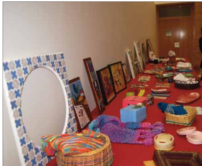
Lecturas del Día Mundial de la Salud Mental/EC