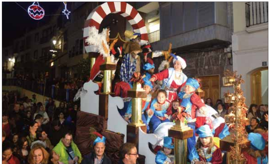
Además de las tres de los Reyes, la comitiva contó con otras tres carrozas de colectivos ruteños/FP

Este año, la comitiva ha contado con seis carrozas, las tres de los Reyes, de las que es respon-