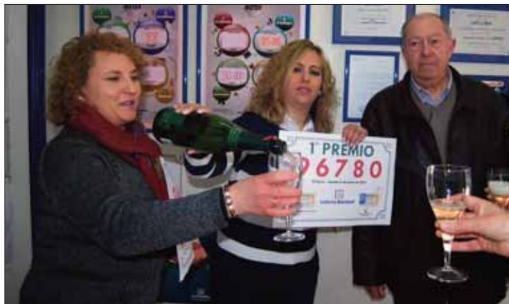
Las responsables de la administración brindan con algunos clientes/MM