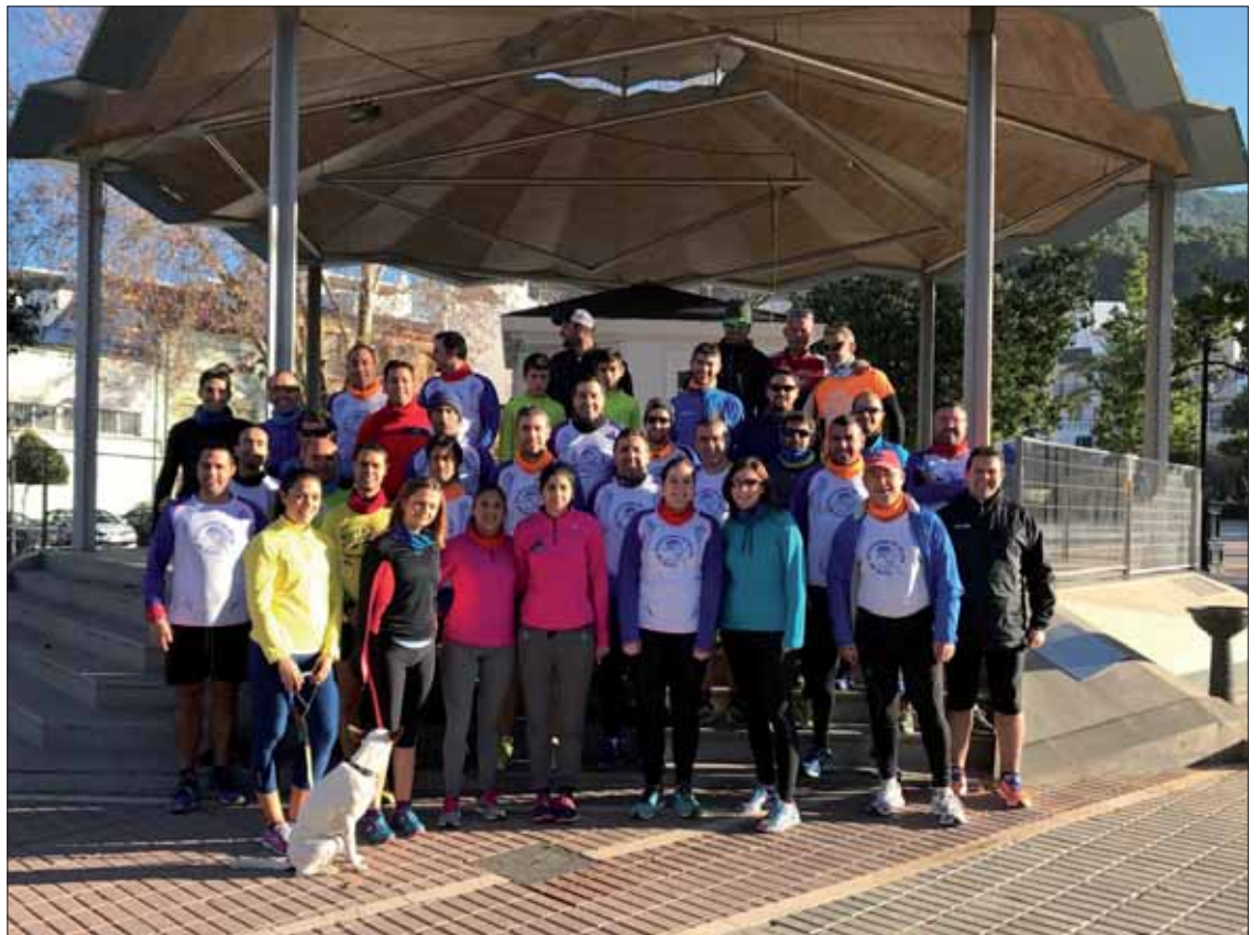
El grueso de los participantes en la quedada justo antes de partir del Paseo del Fresno

La jornada concluyó con un desayuno de convivencia y la posterior entrega de los premios correspondientes al ranking local. Puesto que se trata de algo simbólico y el año pasado no se hizo, recibieron sus trofeos los corredores más constantes del club en las dos últimas temporadas.