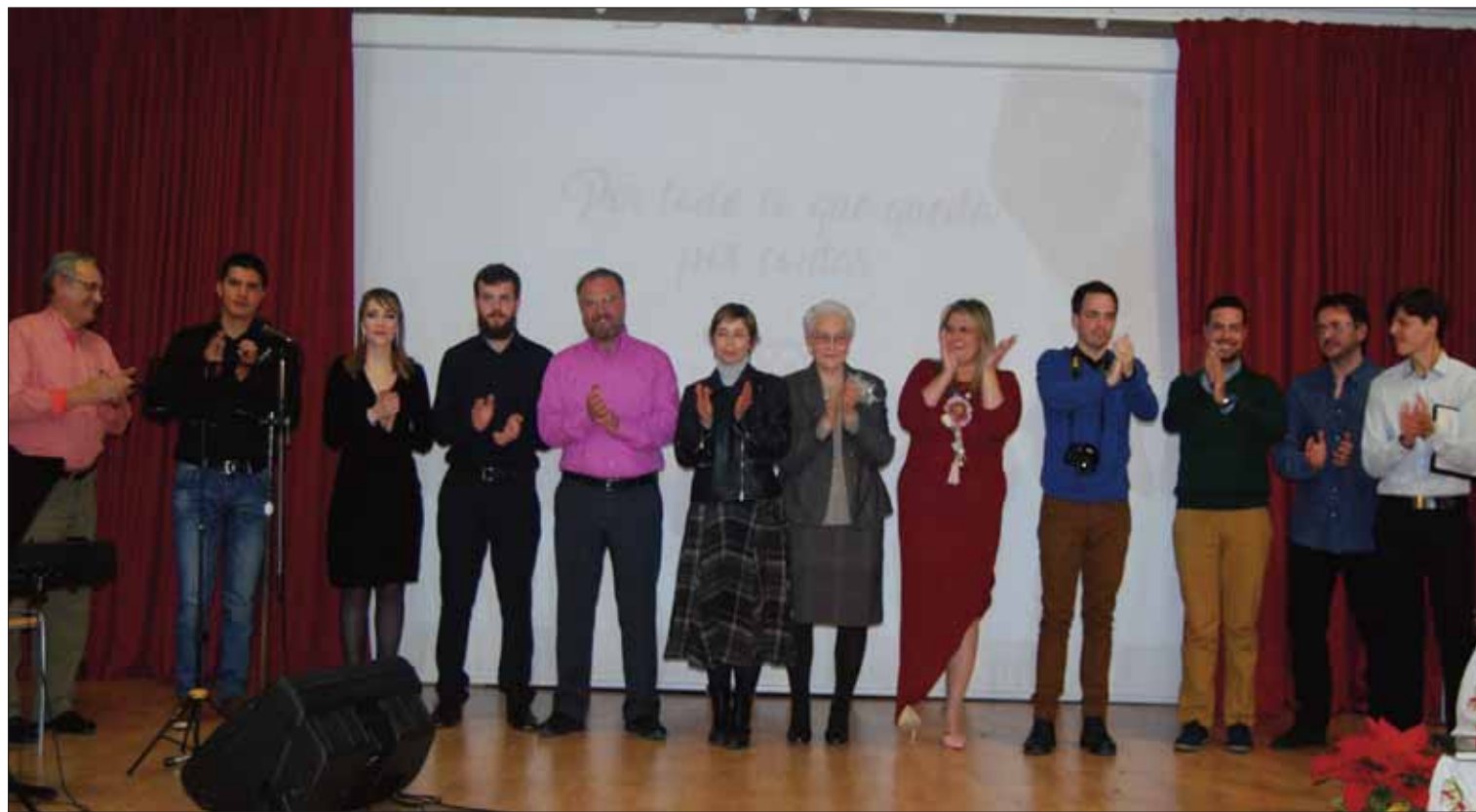
Los miembros de la Asociación Cultural Artefacto de Rute posan al finalizar el acto

Durante la noche hubo interpretaciones musicales, lectura de poemas y la proyección de un cortometraje