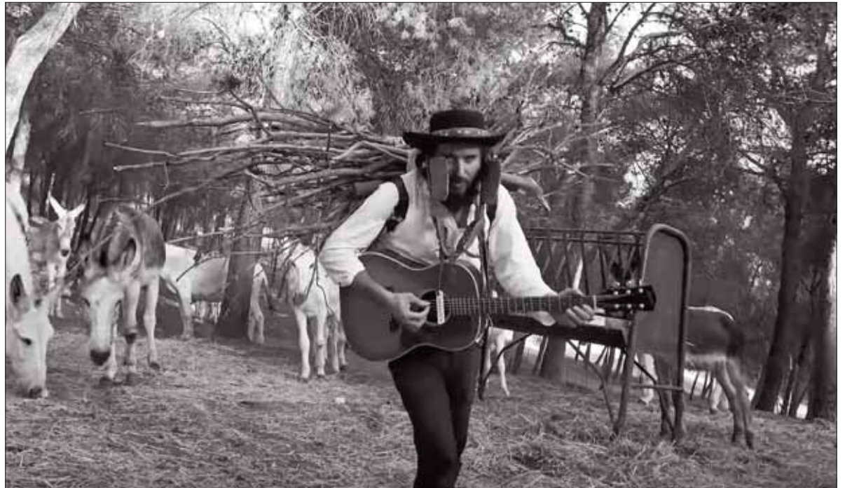
El videoclip se ha filmado íntegramente en blanco y negro con localizaciones en el entorno natural del municipio/EC

Después, han tenido varios meses de postproducción y montaje, hasta hacer coincidir el estreno del videoclip con la onomástica de San Antón, patrón de los animales. Ese trabajo de tanto tiempo queda condensado en poco más de cuatro minutos y medio. En lo que dura la canción, exhibe un manejo apabullante del gran angular y unos sugerentes juegos de luces y sombras. Más allá de un mero alarde técnico, las imágenes se acompañan con la poética de la canción.