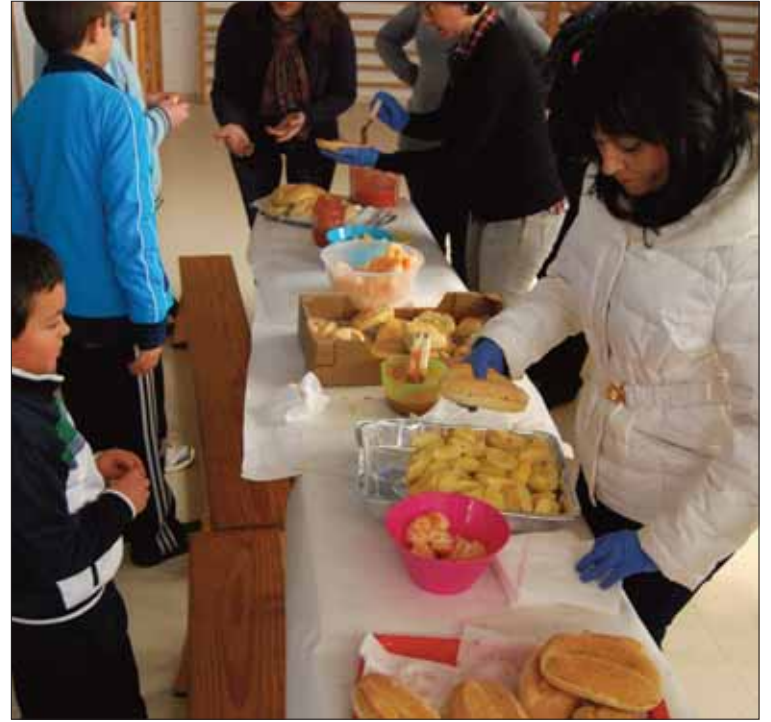
La Junta Local en los desayunos sanos de los colegios/FP