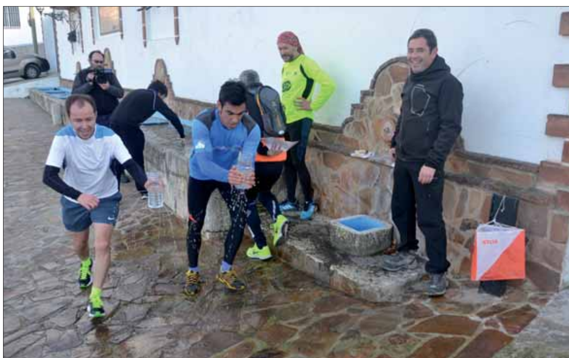
Una de las pruebas más curiosas tuvo lugar en el pílón de La Molina, llevando agua en una botella rota