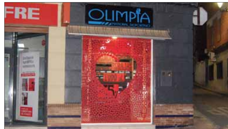
Los típicos corazones de San Valentín copan muchos escaparates

Se sortearán diez boletos por valor de 25 euros cada uno, canjeables en los comercios asociados. En concreto, se sortearán dos boletos por cada gremio de los que