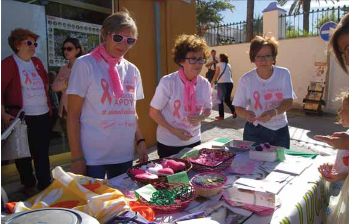
Participando en actos de concienciación e información/FP

La Junta Local de la Asociación Española Contra el Cáncer lleva más de dos décadas volcada en la prevención y la información