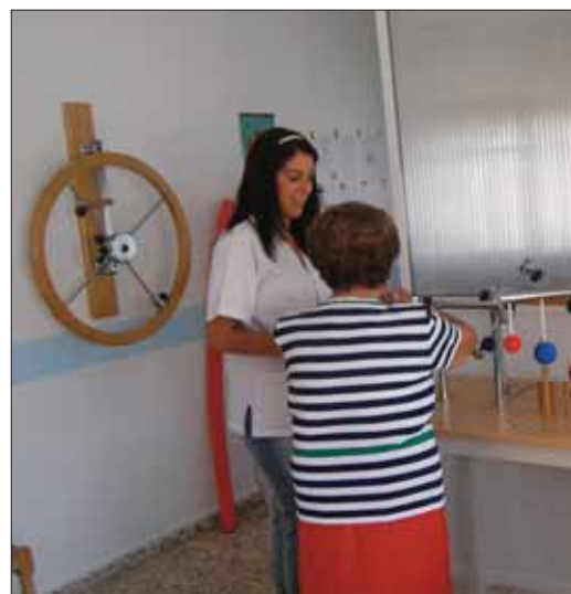
En la sala de fisioterapia del centro/EC

usuarios. Este proyecto se hizo realidad gracias a la cesión de un inmueble en la calle Canalejas por parte de la Fundación Nuestra Señora del Carmen, y a la ayuda económica de la Fundación Social La Caixa.