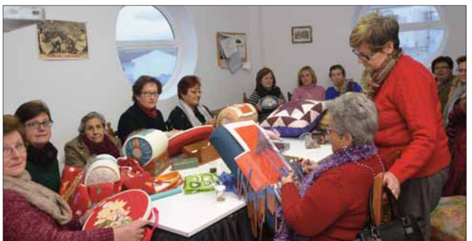
La sede de las encajeras de bolillos se encuentra junto al Mercado de Abastos

Hace cuatro años animó a este grupo de mujeres a meterse en este mundillo. A raíz de ello, constituyeron una asociación. En la actualidad, todas las semanas se reúnen en su sede, un local cedido por el Ayuntamiento. Son una veintena de mujeres las que se juntan para hacer auténticas mara-