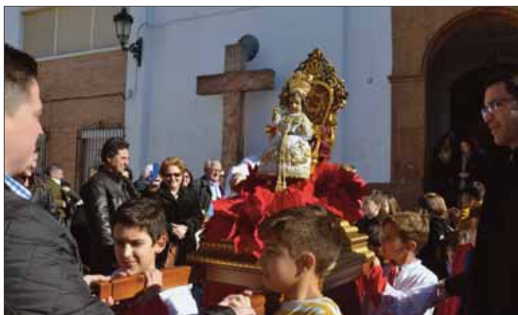
Salida del Niño de la Virgen de la Cabeza en la Epifanía/FP