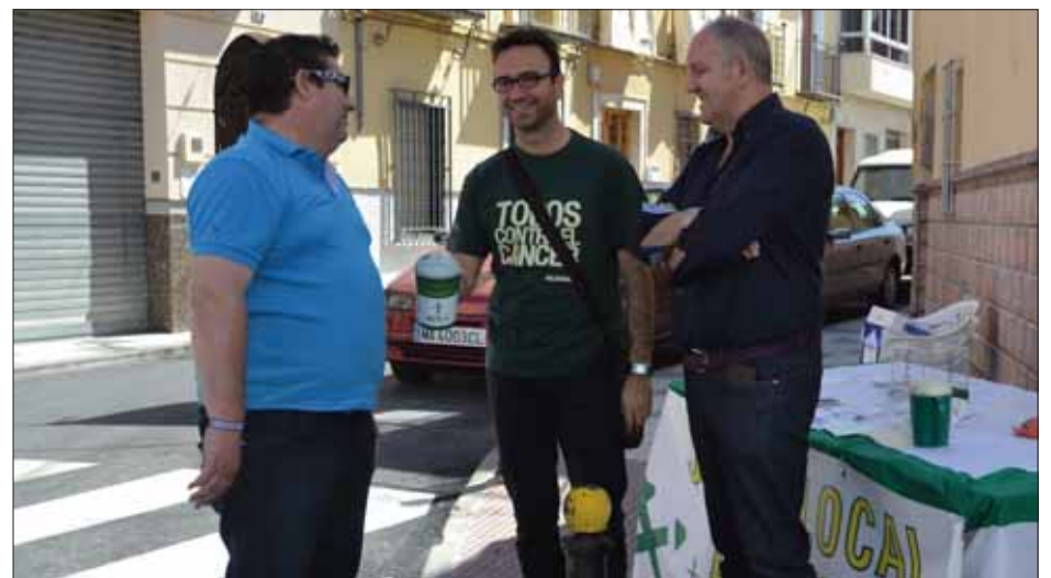
Miembros de la directiva en una de las cuestaciones/FP

A lo largo de estos años han ofrecido en su sede charlas sobre los distintos tipos de cánceres y cómo combatirlos. Han corrido a cargo de distintos profesionales como médicos, dermatólogos, psicólogos o docentes. Cada mes de febrero, coincidiendo