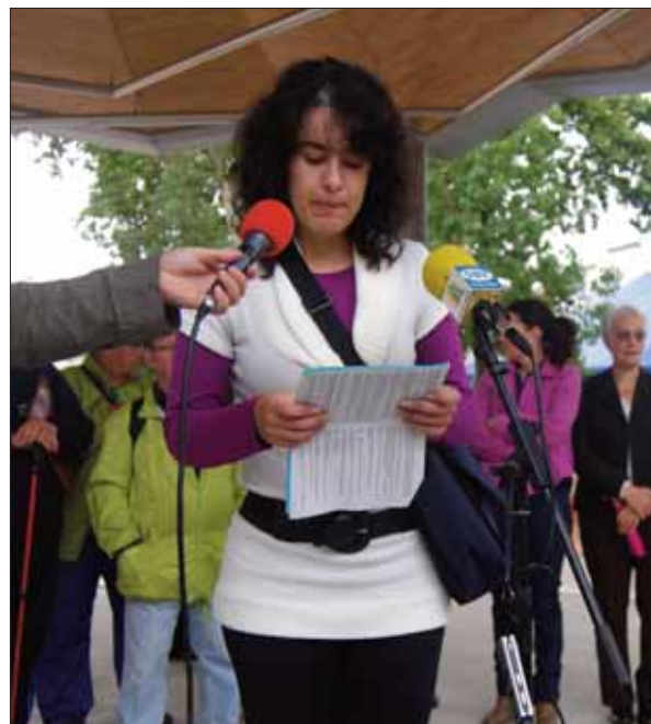
Trabajos hechos en los talleres