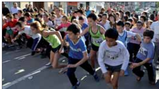
Una de las grandes apuestas ha sido la edición infantil de la carrera/FP

a que siga la colaboración, "porque si el Ayuntamiento tuviese que organizar estas cosas por sí solo no saldría igual". El alcalde se mostró además partidario de