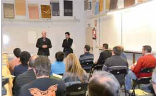
El alcalde citó a Aldecort como ejemplo de innovación/MM

Las instalaciones de la Escuela de Alta Decoración de Rute, Aldecort, acogieron en la tarde del 24 de noviembre unas jornadas técnicas englobadas bajo el nombre de "Construinnova 2011". La cita estaba organizada por el Centro de Apoyo al Desarrollo Empresarial de Rute (CADE),