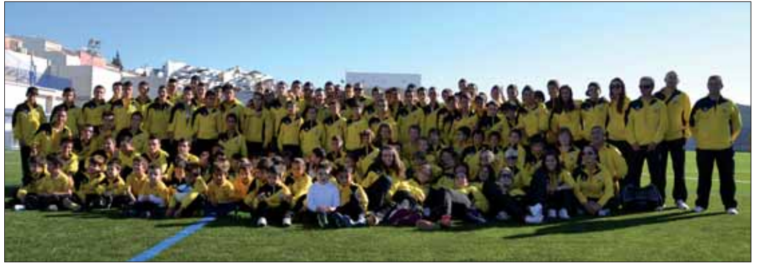
Los casi doscientos integrantes de todas las categorías del club estrenaron las nuevas equipaciones para esta temporada

De nuevo, el senior se lleva la mayor parte; algo lógico, puesto que la mutualidad "se paga bastante más cara" y los arbitrajes