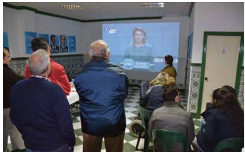
Los populares siguieron en su sede el recuento local y la valoración de sus líderes nacionales/FP

Si los resultados en Rute constituyen una fotocopia a pequeña escala de lo ocurrido en el país, otro tanto se podría decir de la participación, aunque con matices en este caso. Como en el resto de España, ha bajado lige-