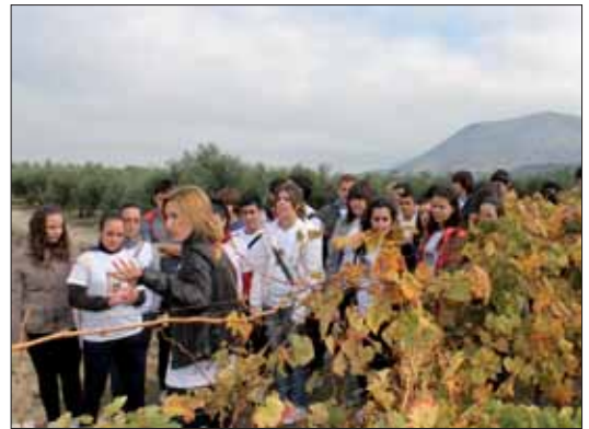
Los alumnos de Rute visitaron los viñedos junto a la especialista/EC

Con esta jornada se ha buscado que los estudiantes conozcan el trabajo de estos centros, que en muchos casos resulta incluso inédito para el público en general. Han tenido ocasión de ver en persona cómo se desarrollan determinadas actividades científicas y de qué forma éstas contribuyen al progreso de nuestra sociedad.