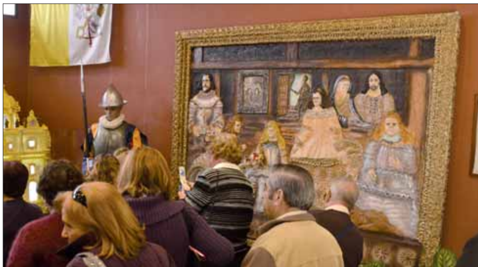
Los visitantes contemplan asombrados la magnitud de Las Meninas en azúcar