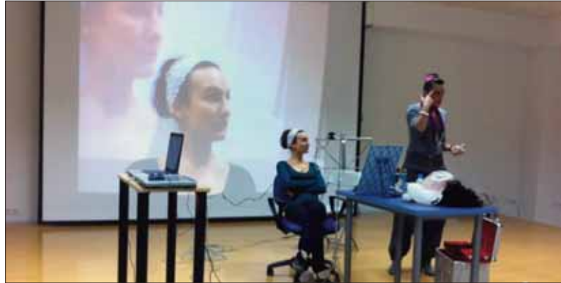
El taller de maquillaje ha tenido gran aceptación/EC

En ninguno de los casos las actividades se programaron con una duración de más de tres días. Según explicó Manuel