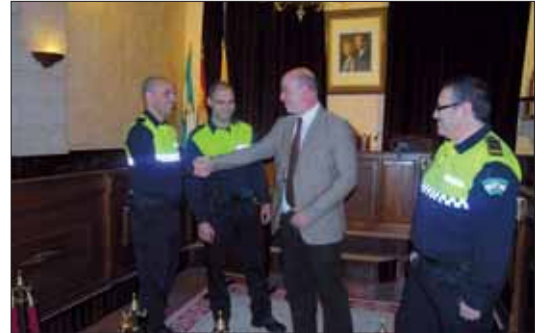
El alcalde y el jefe de la Policía Local felicitaron a los nuevos agentes/MM