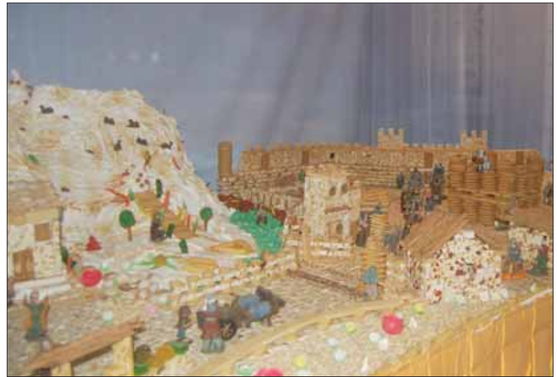
En Productos Garrido se ha añadido un belén de turrón

mentos completan la galería: el Santuario de Andújar, con la Virgen de la Cabeza en chocolate, y la ermita del Rocío. Por último, al margen del belén habitual, esta vez hay otro en las instalaciones de Productos Garrido, adquirida por Galleros en 2010. En este caso, se ha confeccionado con 350 kilos de turrón.