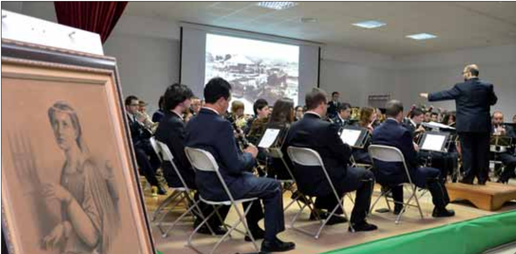
Junto a la imagen de Santa Cecilia, el repertorio contó con la proyección de fotografías históricas de Rute