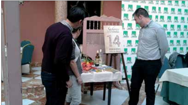
Los dulces y licores de Rute tuvieron especial protagonismo

cuatro páginas que componen la guía se recogen cerca de treinta platos propios de la gastronomía de los catorce municipios que conforman la comarca de la Subbética. Además, en dicha guía se encuentra un listado de los establecimientos y lugares de referencia donde poder degustar dichos platos.