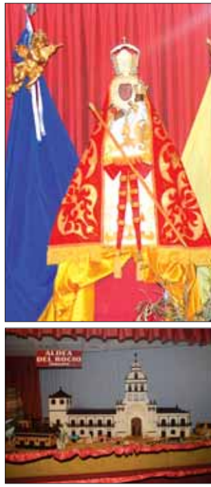
Don Juan Carlos, el Santuario de Andújar y la ermita del Rocío en chocolate/FP