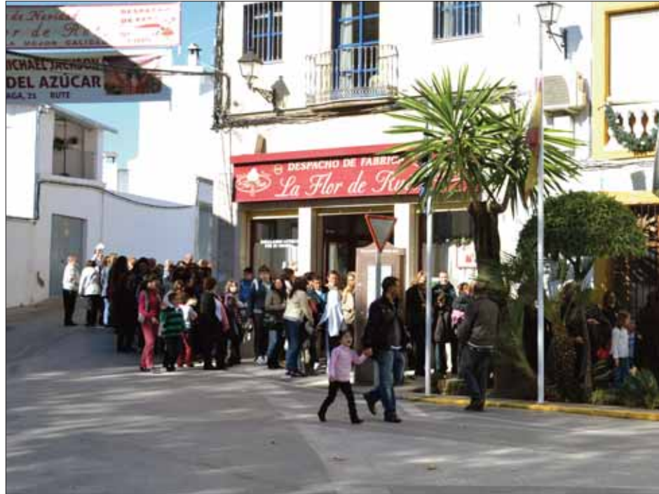
El Paseo del Fresno vuelve a ser un hervidero de gente en busca de anís y mantecados