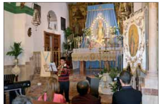
Un grupo de jóvenes músicos ruteños inauguró los actos