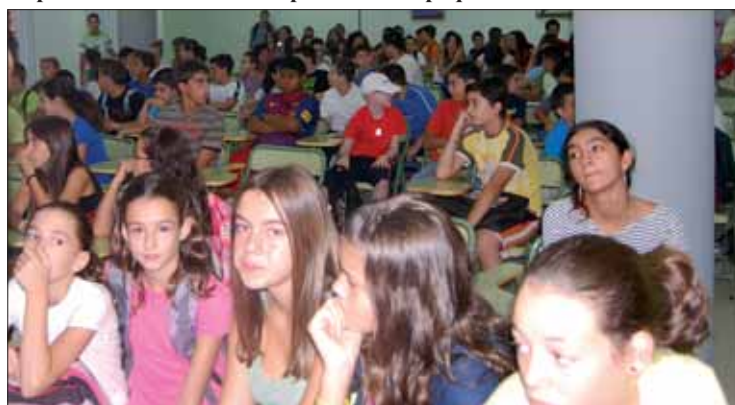
Alumnos de 1º de ESO acuden a una reunión informativa