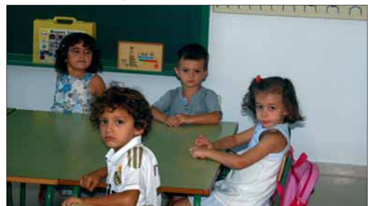
En Ruperto los de tres años comenzaron media hora más tarde/MM