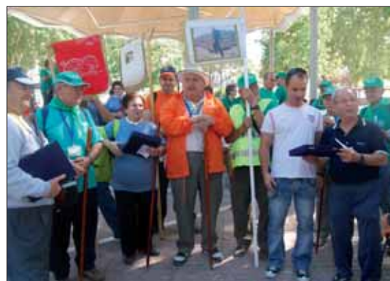
Los senderistas intercambiaron placas de recuerdo/MM

“el presente y el futuro”. Además, tienen un papel destacado en la sociedad actual, ya que con