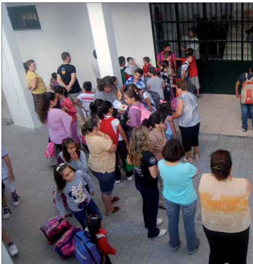
En Los Pinos se han iniciado las clases sin ningún contratiempo/FP