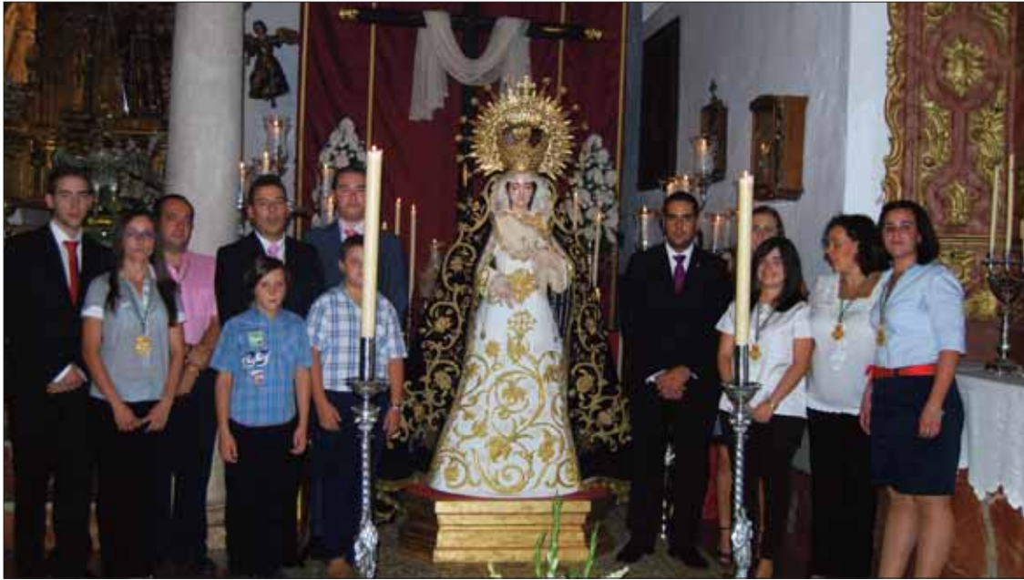
Los miembros de la actual cofradía posan junto a la imagen tras su restauración/MM

La policromía de la Virgen estaba muy deteriorada y presentaba importantes deficiencias en su estado general