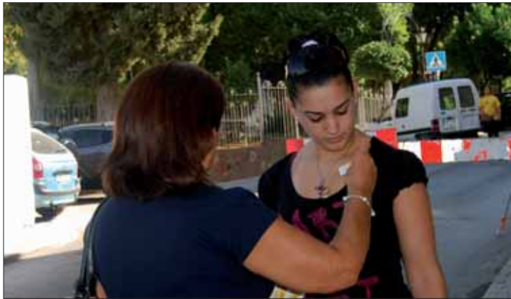
Los integrantes de Arapades repartieron pegatinas

Sin las plazas concertadas por la Junta, no se podría costear la estancia de los enfermos