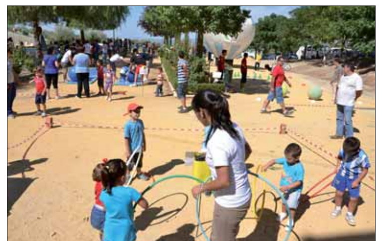
La mañana deparó sorpresas de todo tipo para los más pequeños

El taller de entrenamiento tiene un carácter más metódico, mientras que el segundo es más bien lúdico y de relajación. De