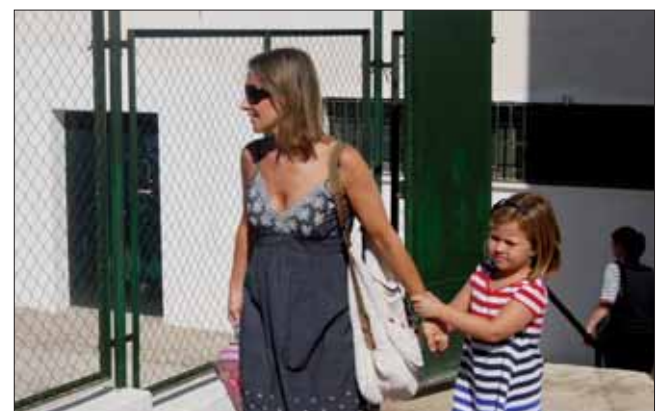
Una madre acompañando a su hija al colegio. /MM