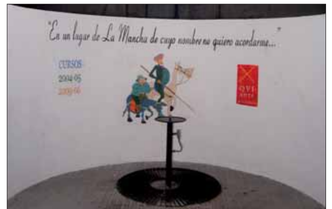
La fuente del patio de Los Pinos ha sido restaurada