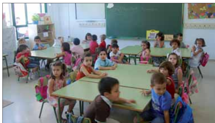
El primer día es más difícil para los más pequeños/MM