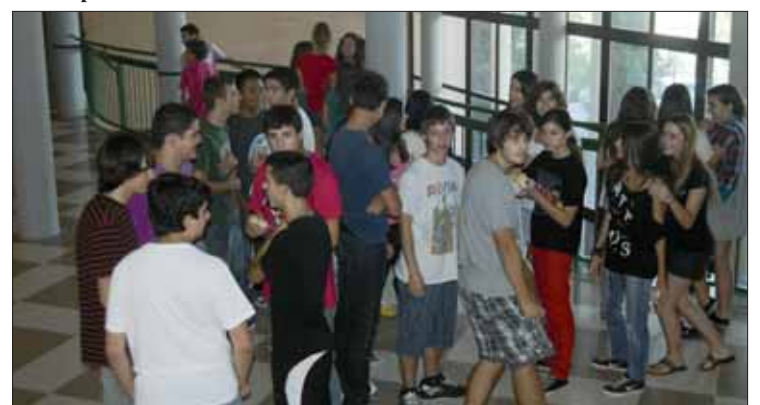
La ratio en Bachiller es de 35 alumnos y de 28 en Secundaria/MM