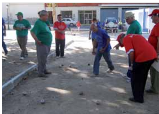
Torneo de petanca en el Fresno/MM

“el presente y el futuro”. Además, tienen un papel destacado en la sociedad actual, ya que con