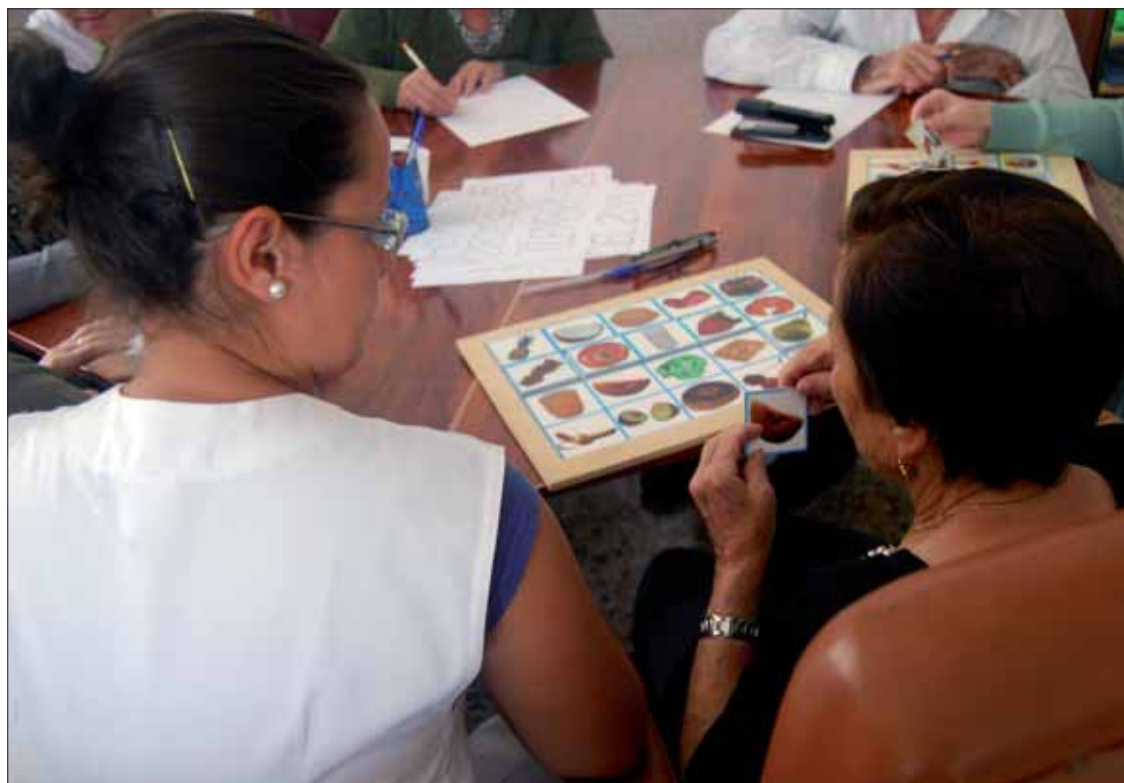
El centro de estancia diurna programa actividades para estimular la memoria de los enfermos servicios "de calidad".

Su gestión fue posible gracias a la colaboración del Ayuntamiento y la Fundación Virgen del Carmen. Los fines de ésta eran el trabajo con niños. Sin embargo,