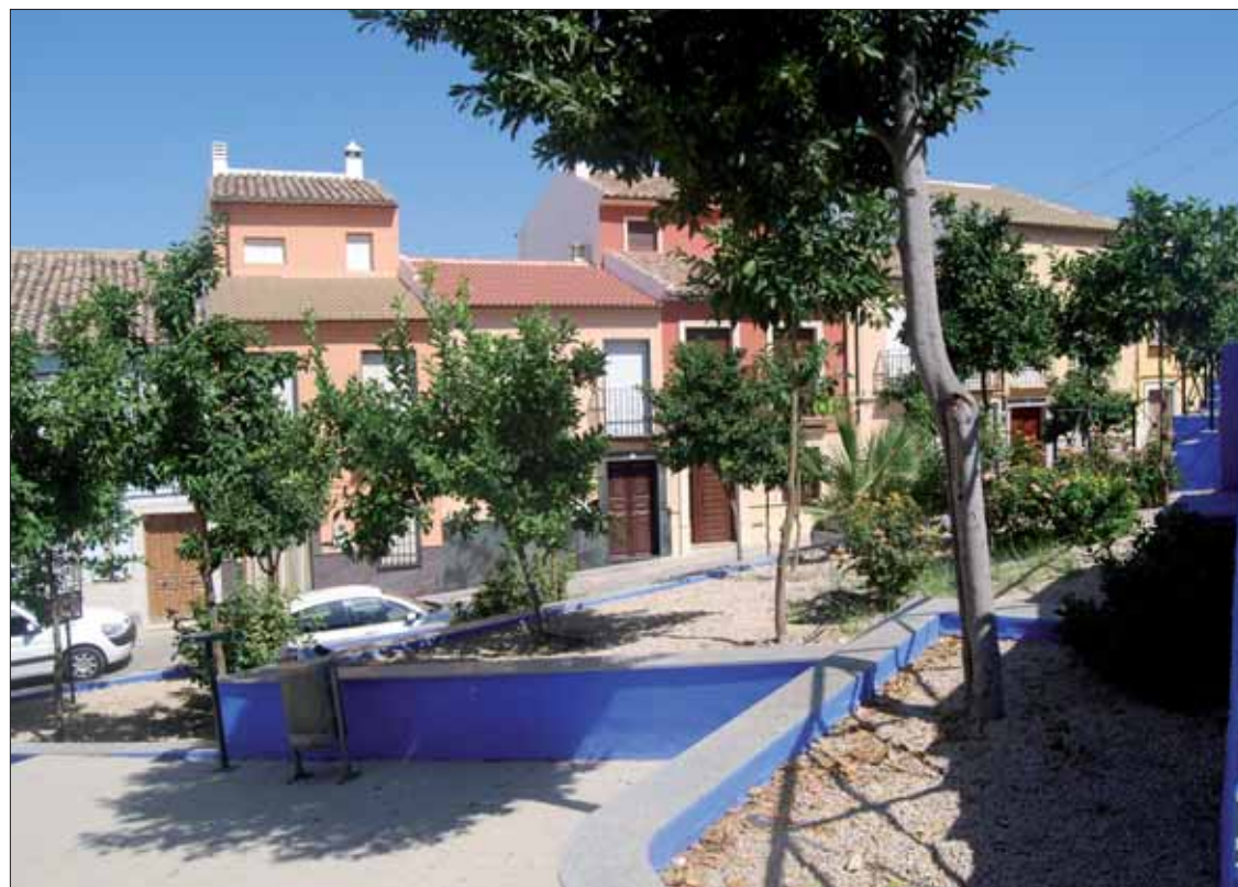
Los animales permanecieron encerrados tres semanas en un domicilio de la calle Roldán/F. Aroca

Uno de los animales murió, los demás se hallaban desnutridos y fueron sus aullidos los que alertaron a los vecinos