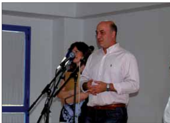
El alcalde resaltó el ejemplo que dan los mayores/MM

La concejala aseguró que todos tenemos mucho que aprender de los mayores, personas “dinámicas y participativas”. Trujillo aseguró que representan