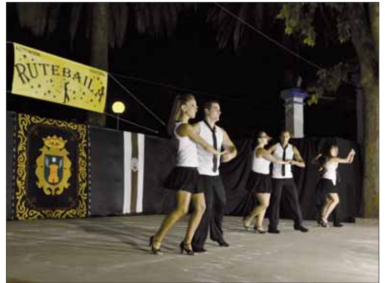
Entre los colectivos participantes hubo una nutrida presencia ruteña/FP