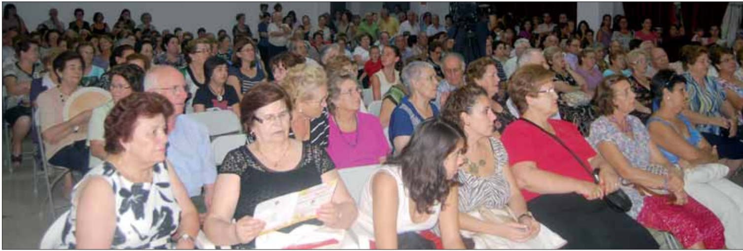
El público abarrotó el salón de actos del Edificio de Usos Múltiples en la jornada inaugural