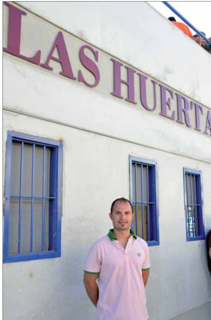
Sánchez espera que pronto se arreglen los problemas del nuevo estadio

P: Coincidiendo con el comienzo del mandato, se va a poder disfrutar de una nueva infraestructura, el Estadio Municipi-