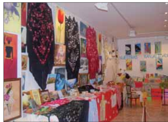
Exposición de manualidades/MM