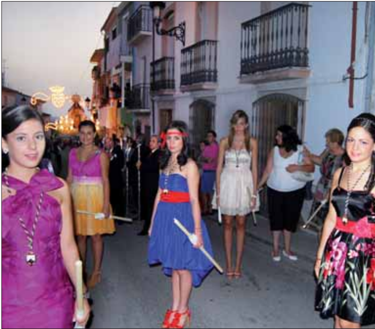
La reina de las fiestas y sus damas de honor/MM