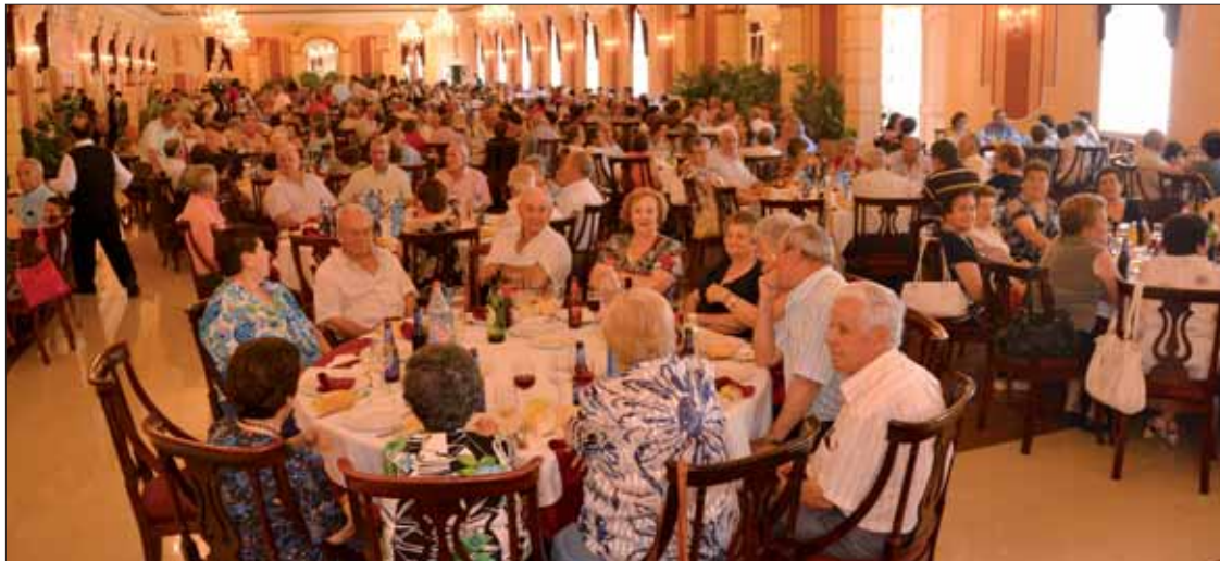
Nuestro pueblo no sólo fue pionero en estos encuentros sino que sigue participando activamente

De los seiscientos asistentes, más de doscientos eran de nuestro pueblo