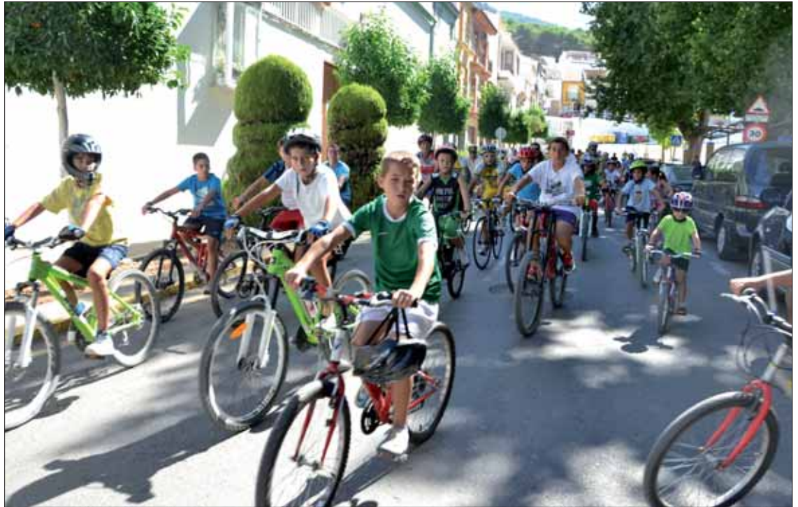
Tanto la salida como la llegada del recorrido urbano tuvieron lugar en el Paseo del Fresno/FP

López recordó que el objetivo esencial de este día es aficionar al público más joven. Ni siquiera de las cuestas de Rute suponen un