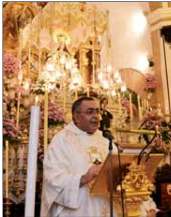
Primer párroco de la novena/FP

Sin duda, son algunos de los nombres más destacados entre otros muchos que componen la aurora.