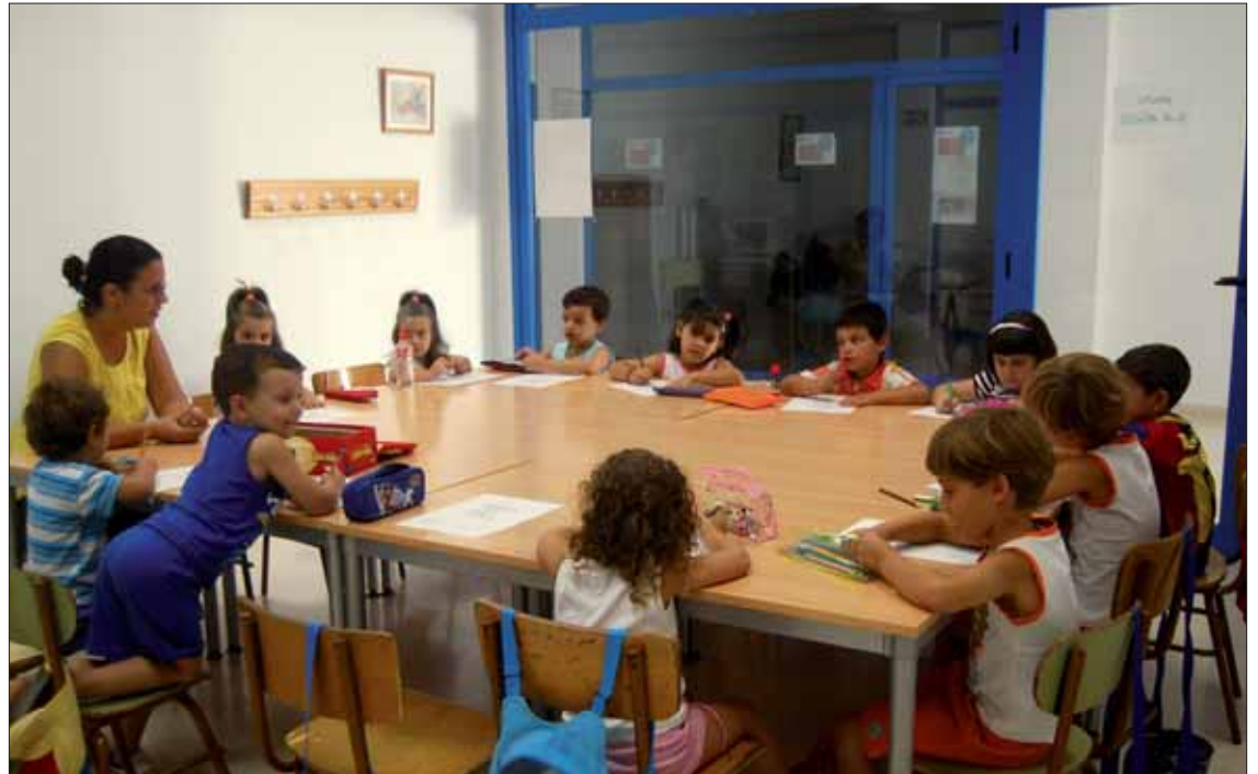
Las escuelas de verano cubren la jornada matinal de los niños y niñas de Primaria

En conjunto, con estas actividades se cubre una horquilla de población joven desde los 3 hasta los 18 años, al menos en horario matinal. Las escuelas de verano estarían destinadas a los niños y niñas de Primaria, y los talleres de cocina a los jóvenes del instituto