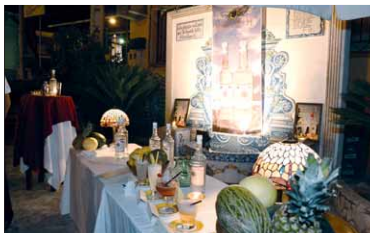
La idea es que los clientes sugieran nuevos cócteles