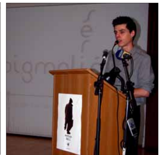
Presidente de Artefacto/MM