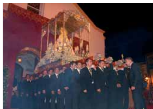
La Morenita en su recorrido extraordinario

Antes del proclamar el evangelio, el obispo se quitó la mitra y recibió el báculo. Seguidamente, en la homilía se rezó el Credo. Durante la liturgia eucarística algunos fieles presentaron las ofrendas destinadas al altar y a la caridad de los pobres. Se concluyó con el rito de la comunión y la actuación de la coral granadina, que cantó la Salve Regina Gregoriana e interpretó el himno a la Virgen de la Cabeza.