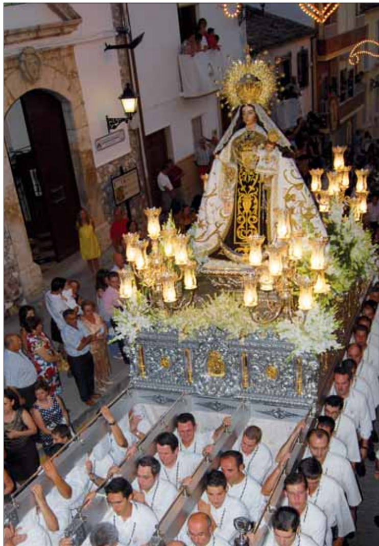
La patrona durante el traslado/MM