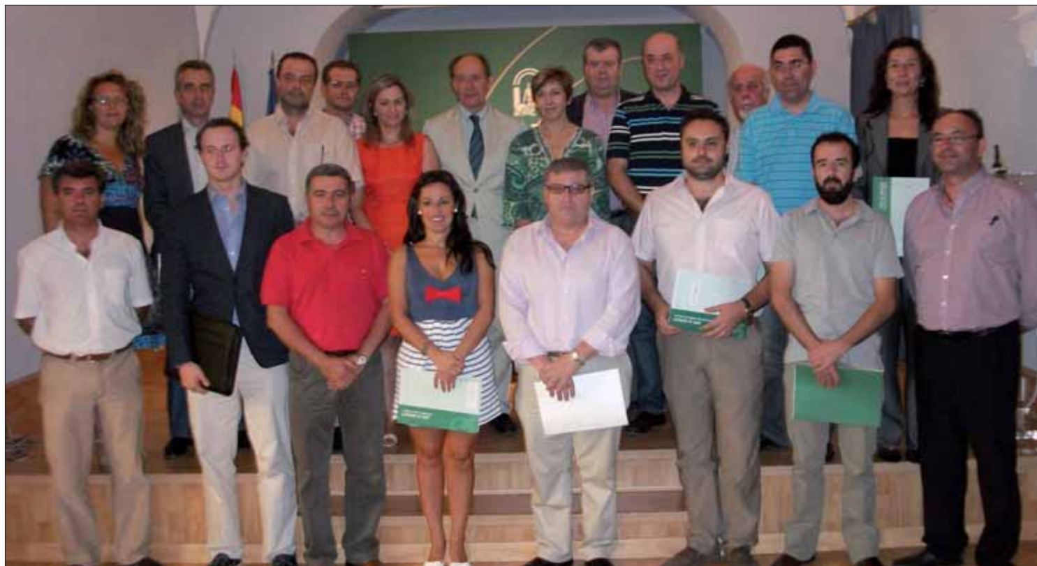
Reunión mantenida en Córdoba para las líneas de ayuda a la mejora del alumbrado público/EC

La propuesta se fija de modo especial en la deuda vencida, con el fin de saldarla en los próximos meses