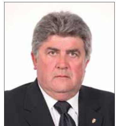
El pregonero de la Virgen

El pregón lo ha estructurado en tres partes. Hará mención a algunos datos históricos, dará lectura a dos poemas de dos autores a los