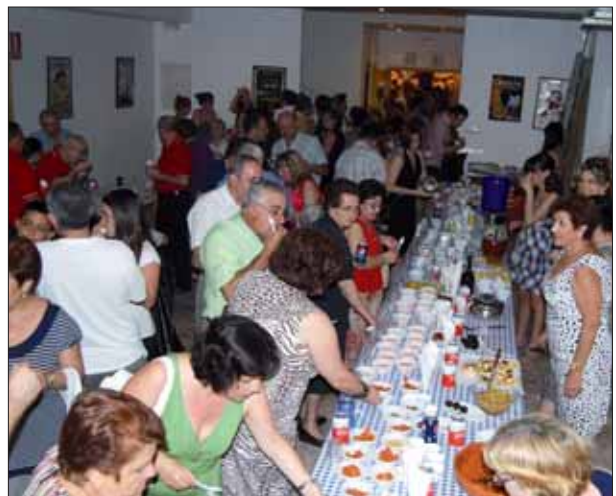
Degustación de época/MM