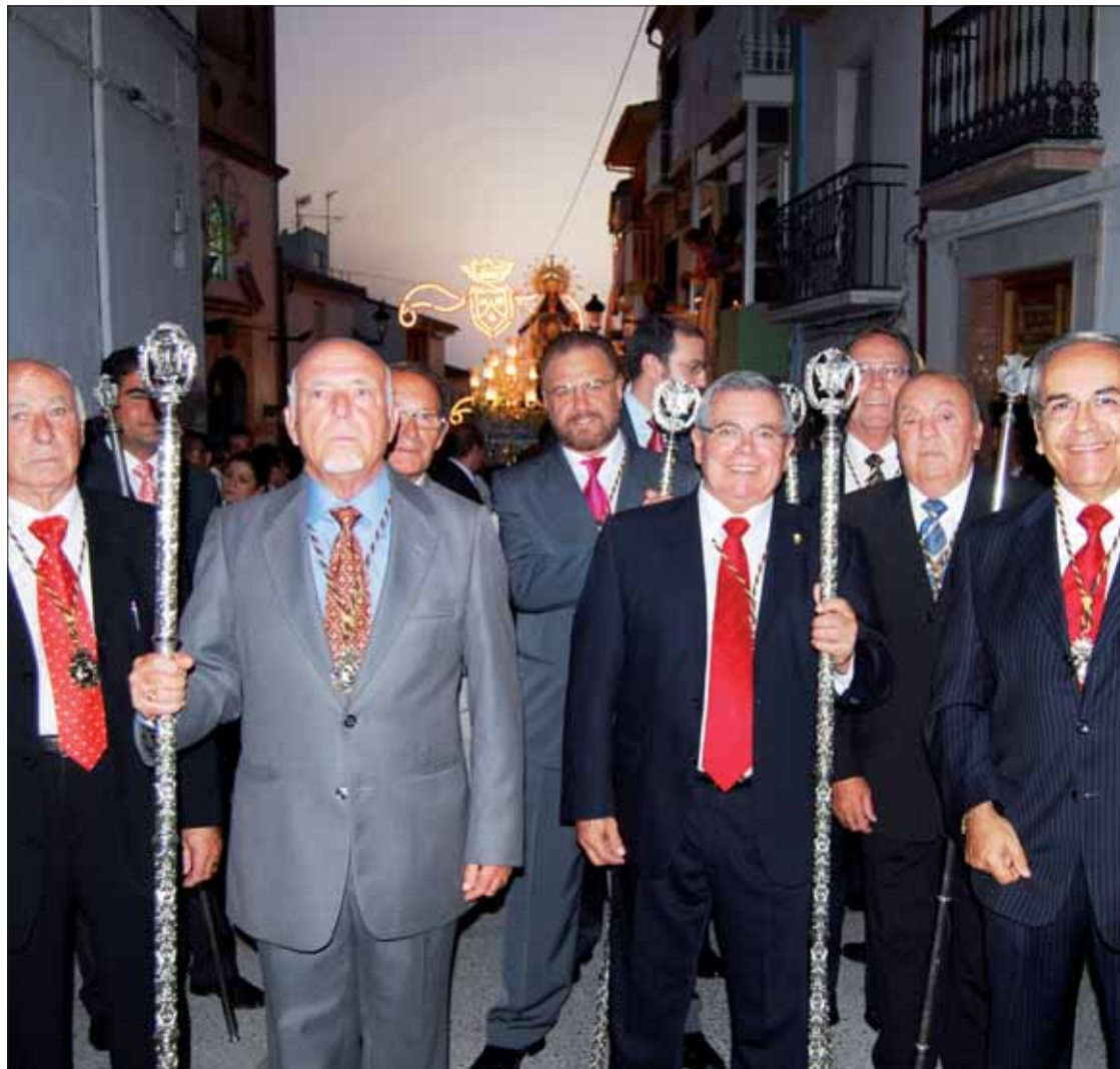
Los miembros de la Aurora que acompañarán en calidad de Hermanos Mayores/MM