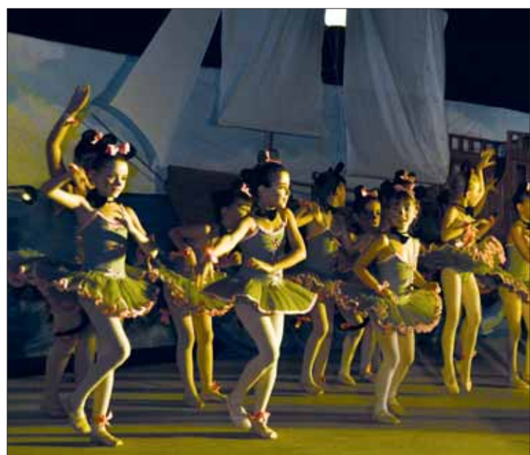
Cada año se miman más aspectos como el vestuario o el maquillaje/FP