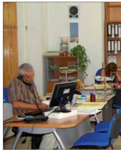
Urbanismo y Desarrollo Local están e

con el objetivo de hacer frente a la situación hasta final de año. Lo que sí anticipa es que los próximos presupuestos serán “muy