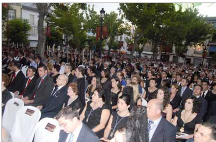
Multitudinaria asistencia a la misa pontifical

Frente al altar mayor se encontraban los mil doscientos