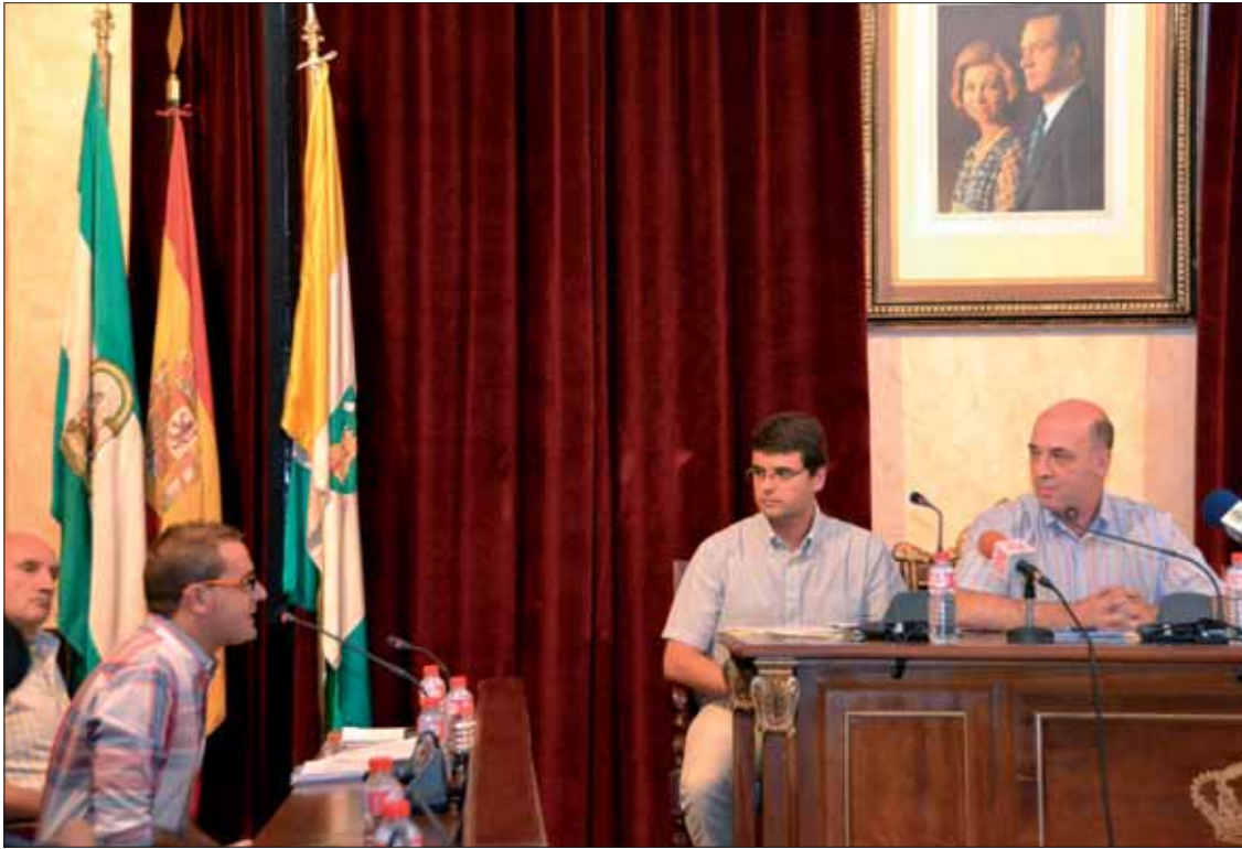
Pese a la interpretación distinta de Macías y Ruiz, se posibilitó que los sueldos políticos salieran adelante/FP

El principal cambio con el pleno orgánico de junio fue una enmienda de los socialistas consensuada con los demás grupos