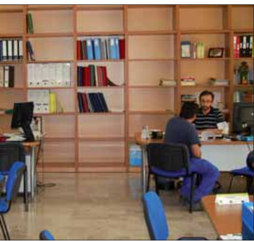
en la misma planta/MM

que se haga en este sentido. Según sus palabras, se trata de “un acto de solidaridad y respeto con los que sí cumplen”. Además, el concejal ha dicho que se busca unificar este servicio y no de pagar por un mismo concepto, por un lado a la Seguridad Social y por otro a la mutua.