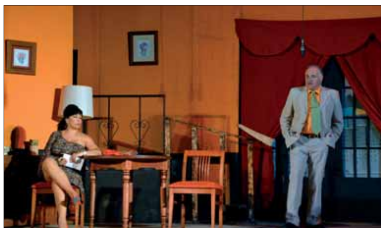
Representación de la obra “Casado de día, soltero de noche”/FP

inauguró una exposición de enseñes de la primera mitad del siglo XX, abierta hasta el día de agosto. También hubo una degustación gastronómica. Todos los asistentes pudieron recordar sabores y olores propios de las cocinas de hace décadas.