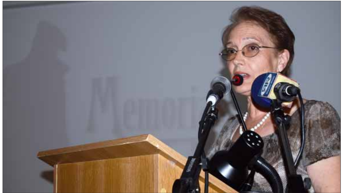
La autora durante la presentación de la novela

Esta novela costumbrista va a suponer el punto de arranque de un proyecto editorial ideado por Artefacto para apoyar a escritores noveles. Lo va a hacer a través de la serie “Pigmalión”. De esta