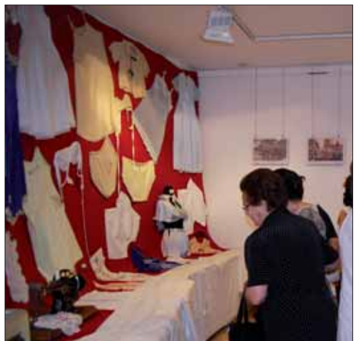
Exposición de enseñes

forma, la asociación pretende servir de puente entre quienes escriben y otras editoriales. Según Gómez, a cualquier escritor no conocido le resulta muy difícil acceder al mundo editorial. Los costes iniciales, el no contar con canales de distribución o la rentabilidad