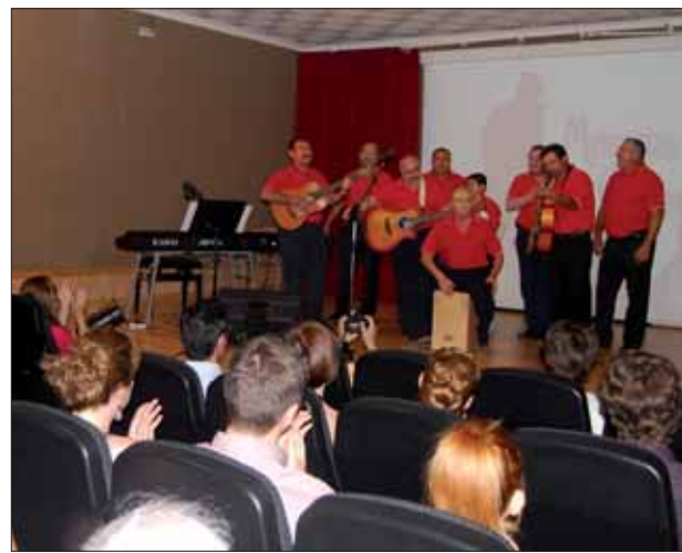
Música de los años 70/MM