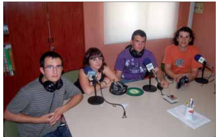
La emisión en FM se prolongará al menos durante todo el verano