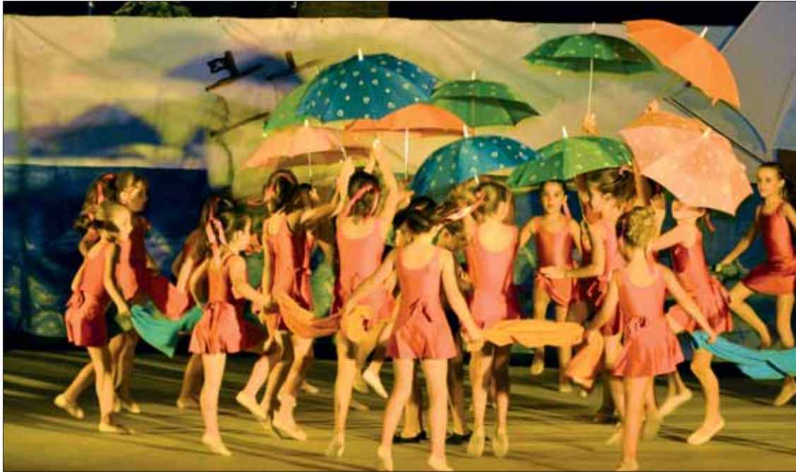
El festival incluyó una pieza de inspiración típicamente veraniega/FP

El espectáculo clausuró un curso donde más de doscientos jóvenes han pasado por la Escuela Municipal de Música y Danza