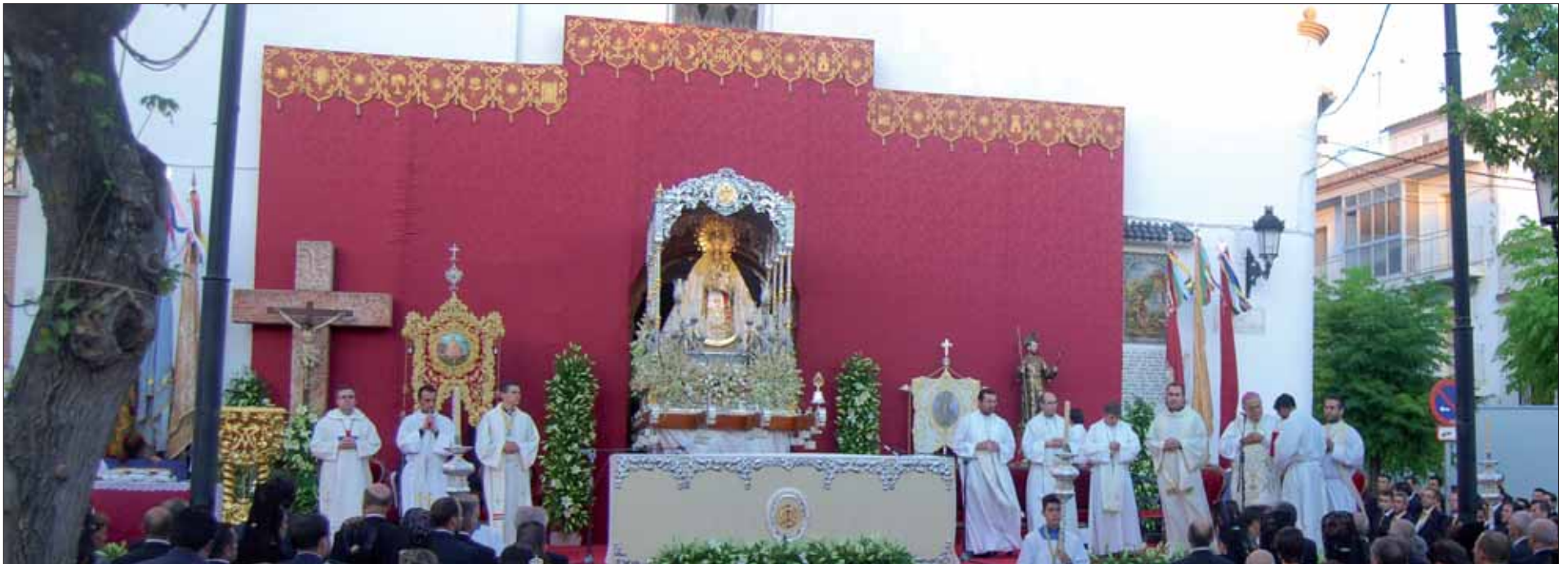
El altar mayor se instaló al aire libre en la plaza Nuestra Señora de la Cabeza