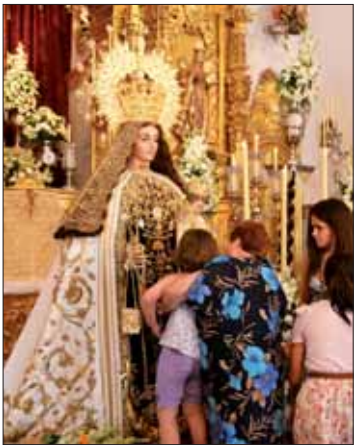
Un momento del besamanos