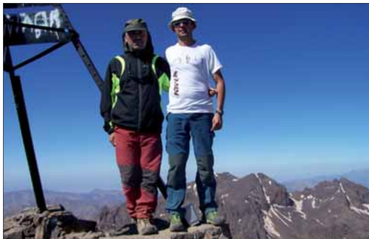
Los dos ruteños tras alcanzar la cima del Toubkal

Reina ha recordado que a partir de los tres mil metros se acusa la falta de oxígeno. Además, la