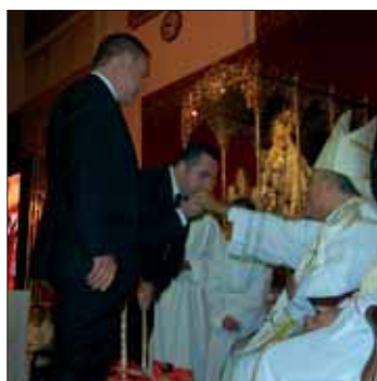
Momento de las ofrendas/MM