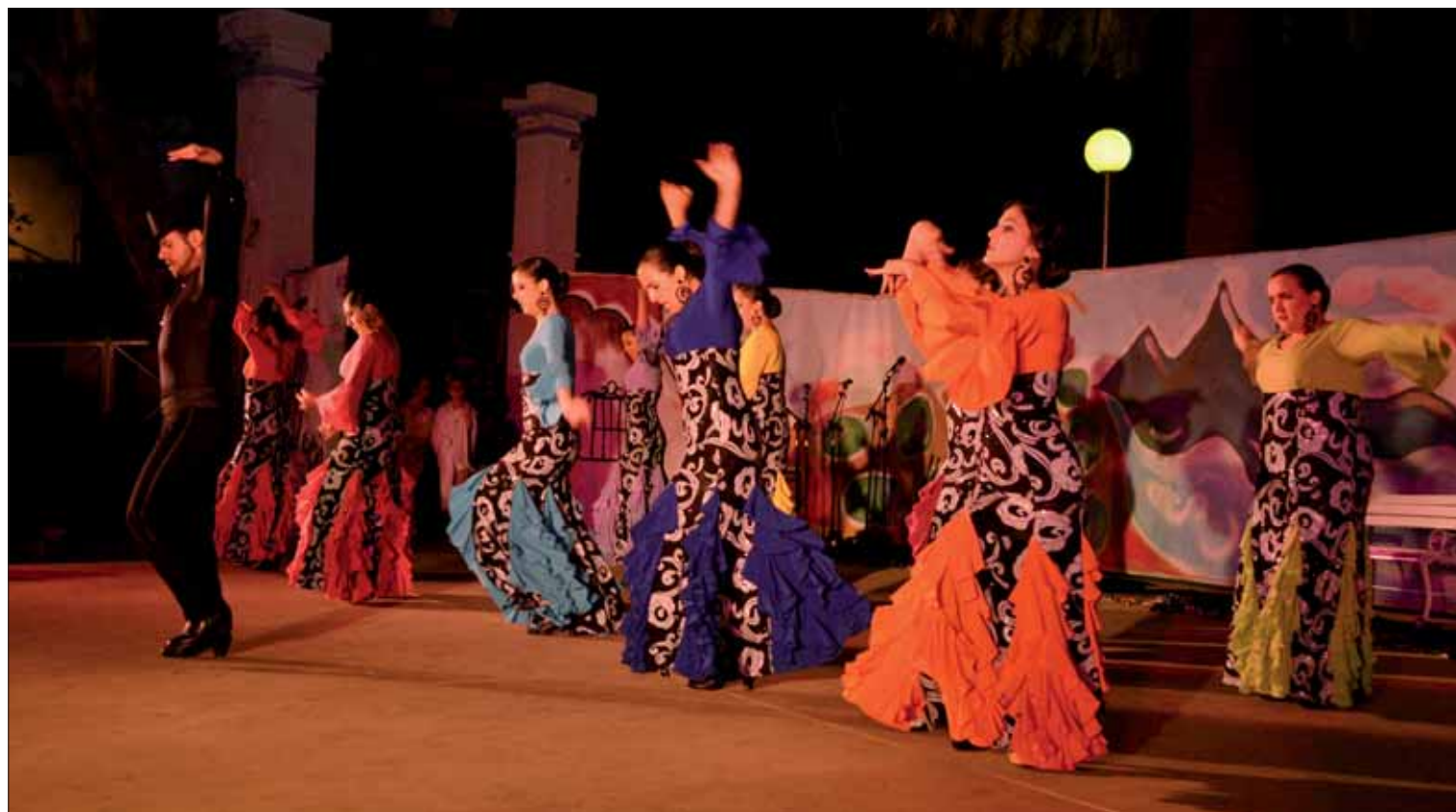
Los diferentes estilos flamencos siguen siendo la seña de identidad de la escuela/FP

Este festival también suponía el cierre al curso académico de la escuela. Según su responsable, el balance ha sido más que positivo. Su filosofía es que cada año se avance un paso más en el aprendizaje. Los resultados se pueden comprobar sobre las tablas y en la grada. El hecho de que este año se celebrara en domingo (y al día siguiente fuera, por tanto,