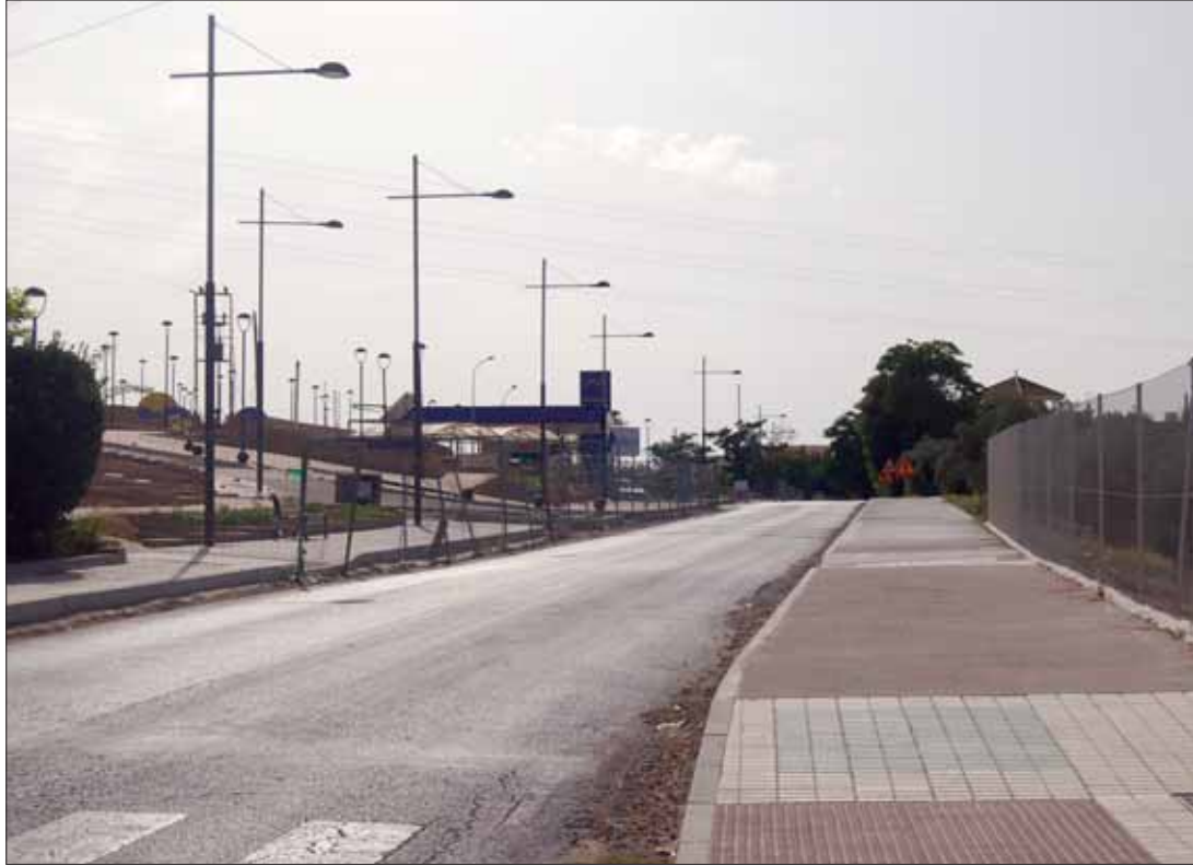
Estado actual carretera A-344 de Rute a Encinas Reales/A.López

Los reajustes se hacen a favor de sacar adelante las obras que estén más avanzadas como de la de Rute a Encinas Reales