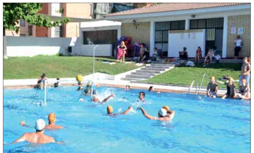
Un total de doce equipos participaron en esta edición del torneo de waterpolo/FP

Tanto para el club como para los propios participantes, este torneo representa la parte más festiva de la competición estival. En este sentido, el torneo llegaba dos días después de la segunda fase comarcal, cele-