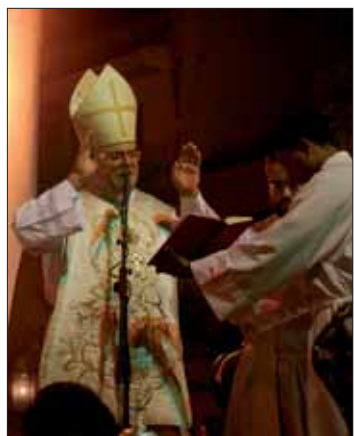
El obispo durante la homilía/MM

La misa pontifical se desarrolló en un ambiente de solemnidad y respeto. La música y los cánticos entonados por la coral polifónica de la Basílica de San Juan de Dios, de Granada, ofrecieron un toque celestial. La eucaristía se inició tras la salida de la sagrada