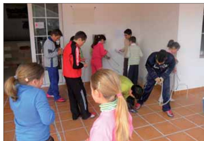
La última actividad organizada ha sido una gymkhana/EC

Todas estas actividades se ofertan para el fin de semana, dado que de lunes a viernes se ofrecen otros dos talleres, uno de mecanografía y otro de informática. De esta forma, los usuarios no sólo utilizan la biblioteca para sacar un libro, buscar información o leer, sino que además es su punto de refe-