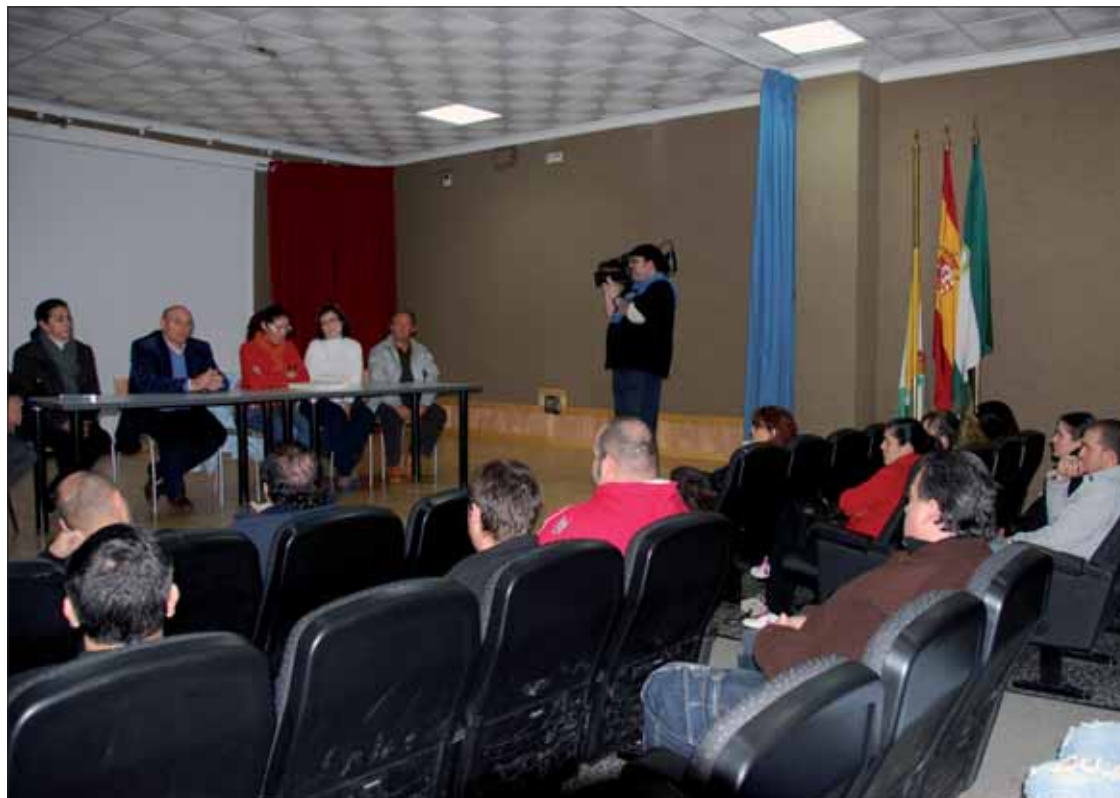
El alcalde destacó el esfuerzo que hace la administración por este tipo de iniciativas

La novedad del nuevo taller es que incluye un módulo de elaboración de pasteles y licores tradicionales. Es la primera vez que se opta por formar a los alumnos en esta área, pero desde el Ayuntamiento se entiende que se trata de aportar por un sector productivo en Rute. Por tanto, es una manera de for-