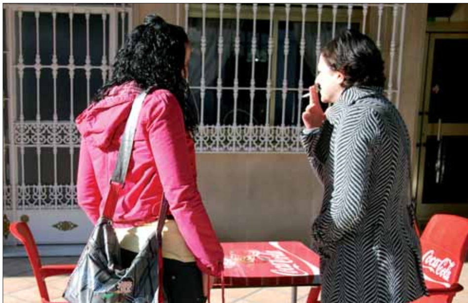
Para los no fumadores la ley supone un cambio radical de hábitos

En definitiva, está convencido de que se han creado unas nuevas circunstancias que serán positivas si sabemos administrarlas, por el camino de la integración y convivencia. Al igual que Pedro Navajas, en relación a la repercusión económica, dice que el primer mes del año siempre tiene unas connotaciones concretas, cuesta de enero, periodo de rebajas. Por tanto, tendremos que esperar un poco para valorar con mayor precisión.