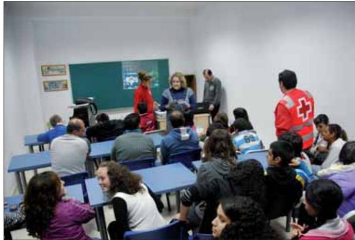
El taller se llevó a cabo en el Edificio Juvenil Ludoteca de Rute/MM

También a finales de mes, el viernes 28, se organizó una merienda intercultural. Numerosos niños y niñas acompañados de sus padres participaron de una tarde de juegos y degustaron una merienda con comidas de distintos países.