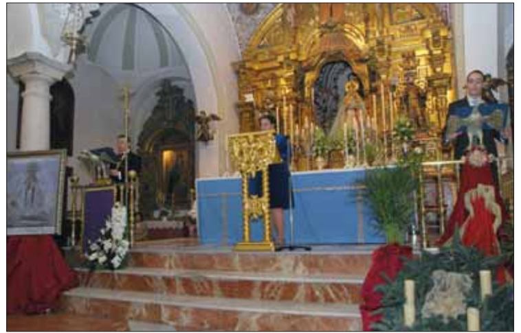
El pregón resultó original y distinto de los de mayo/FP

El último acto de 2010 llegó el 18 de diciembre, con una conferencia en San Francisco de