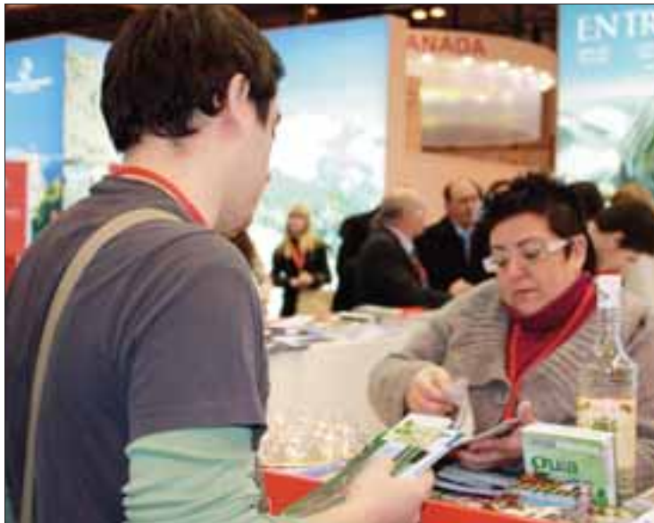
La técnica municipal de Turismo en Fitur

todo el año. De hecho, la primera cita de este tipo ha sido del 19 al 23 de enero, en la 31 edición de la Feria Internacional de Turismo (Fitur), celebrada en Madrid. Durante esos días esta ciudad se ha convertido en la capital mundial del turismo, con la presencia de diez mil quinientas empresas de 166 países y un espacio expositivo de 75000 metros cuadrados.