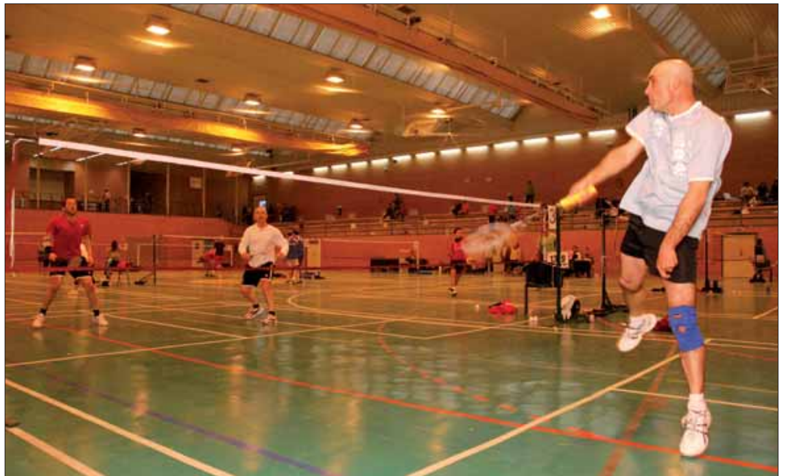
El nivel de juego durante el torneo ha sido excelente a juicio de los propios participantes

El monitor viene defendiendo el auge del bádminton cordobés en el panorama autonómico. En este sentido, asegura que en Rute se ha visto muy buen nivel de