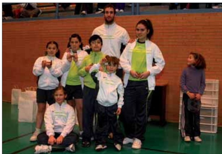
Los ruteños que han quedado primeros en las categorías infantiles/FP

juego. Otro aspecto que no ha querido pasar por alto es "la paridad" entre ambos sexos, con un número muy similar de participantes masculinos y femeninos. Pero por encima de todo cree que se ha cumplido el objetivo principal de afianzar este deporte en nuestra localidad. Espera que la