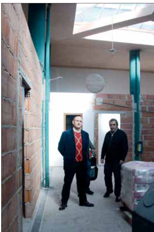
El Hotel de Asociaciones se ha ubicado ocupando parte del mercado de abastos/MM

El alcalde asegura que las obras del nuevo estadio de fútbol estarán acabadas en marzo