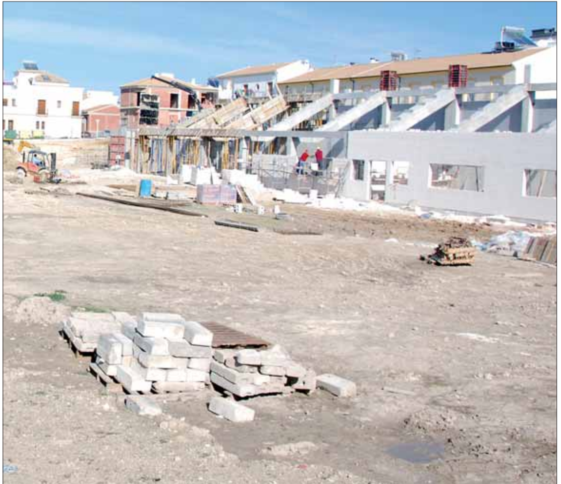
El nuevo estadio dará cabida a las secciones del