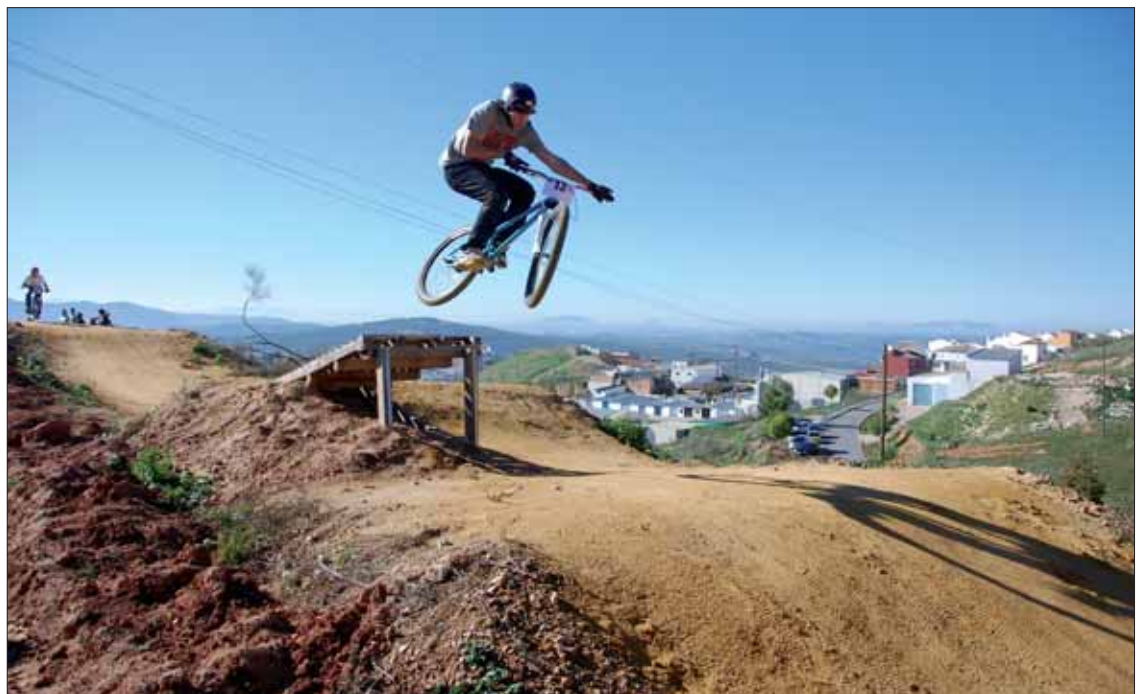
Para la inauguración se contó con una prueba de 4-cross y un concurso de saltos/MM

colocado numerosos resaltes, para aumentar su grado de complejidad. Dentro del recinto se