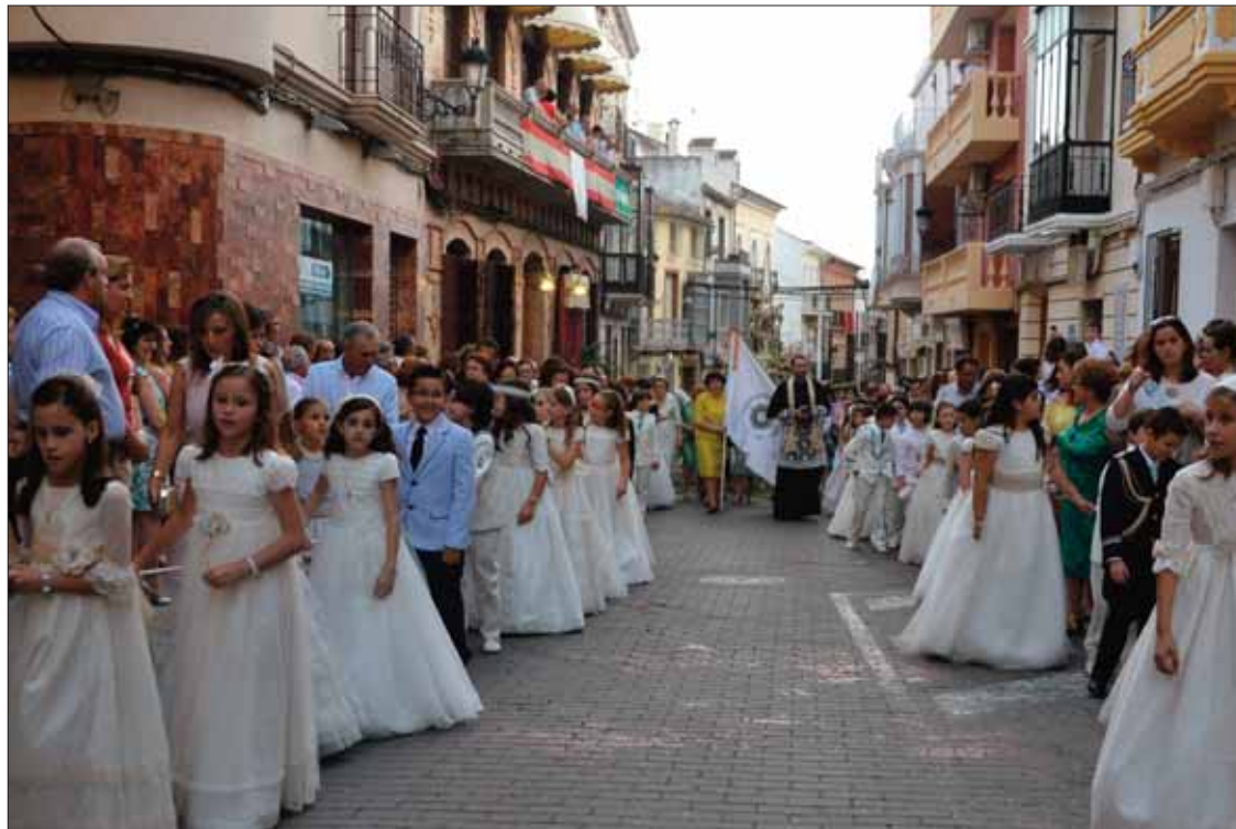
Los niños y niñas de primera comunión formaron parte del cortejo que acompañó a la Custodia

El conjunto desfiló durante dos horas por las calles céntricas que, un año más, se llenaron de colorido. Ese colorido viene dado por