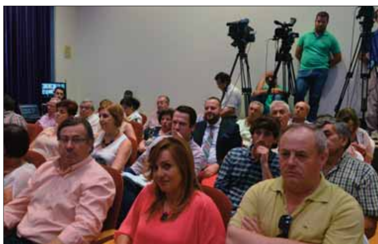
Muchos ruteños asistieron al acto de investidura

sión y responsabilidad, aunque asegura que no tuvo dudas