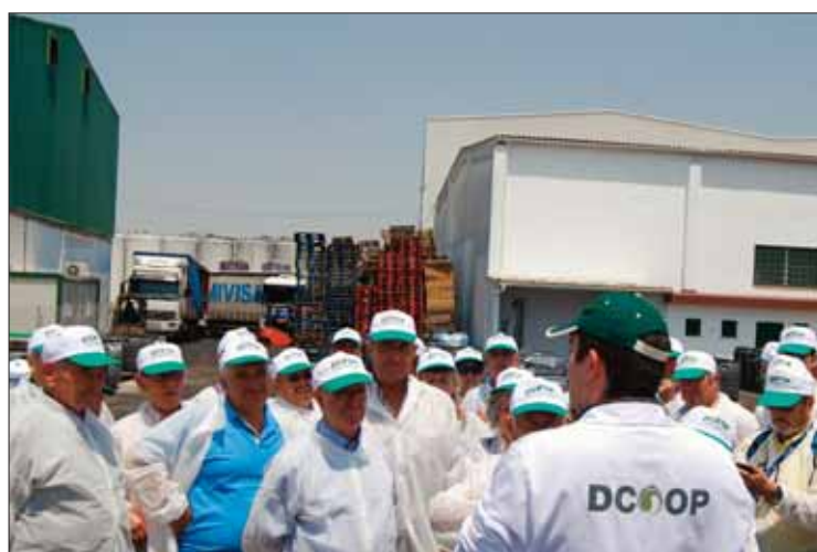
Los agricultores también conocen la planta de Acorsa de Monturque/MM

DCOOP es el mayor productor oleícola mundial y la mayor cooperativa de Europa