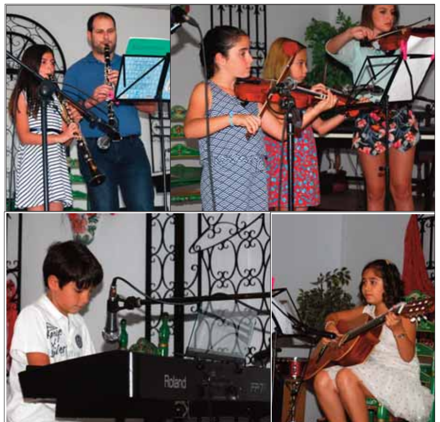
Los alumnos tocaron flauta, violín, piano y guitarra, entre otros

El repertorio englobó desde música clásica a la más popular: piezas conocidas, para que los padres y madres asistentes disfrutasen; así como distintos estilos de guitarra: flamenco, fandangos, sevillanas o rumbas. Por último, los alumnos adolescentes deleitaron al público asistente con canciones de Pablo Alborán e interpretaciones de Sting, y un repertorio especialmente pensado para que pudieran exhibirse los distintos niveles (inicial, medio y avanzado) de la escuela.