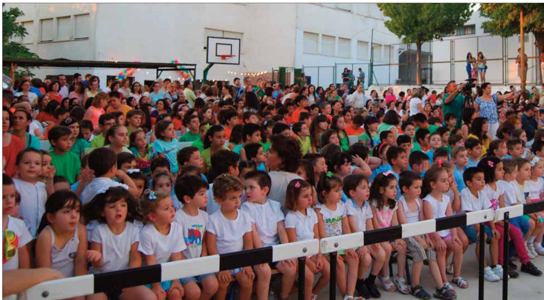
Como de costumbre, dado el mayor volumen de alumnado del centro, la fiesta más concurrida fue la del colegio Fuente del Moral/MM