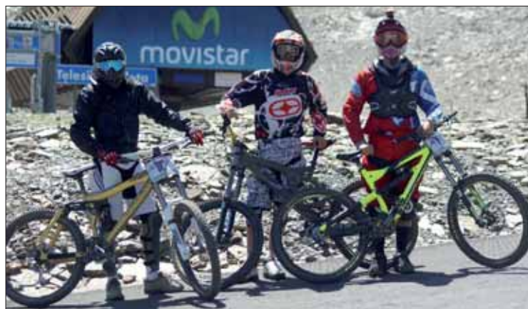
Los tres corredores participantes de la Copa Bull Bikes/EC

En todas las categorías, el circuito era el mismo, aunque, según la edad, la exigencia era mayor. Granada viene siendo una excepción en Andalucía. Los circuitos de la comunidad son sensiblemente más cortos que los del resto del país y en los últimos años se han ido adaptando. El de Sierra Nevada sí ha sido siempre de largo recorrido, pese a las modificaciones puntuales. De hecho, los ruteños creen que ahora es