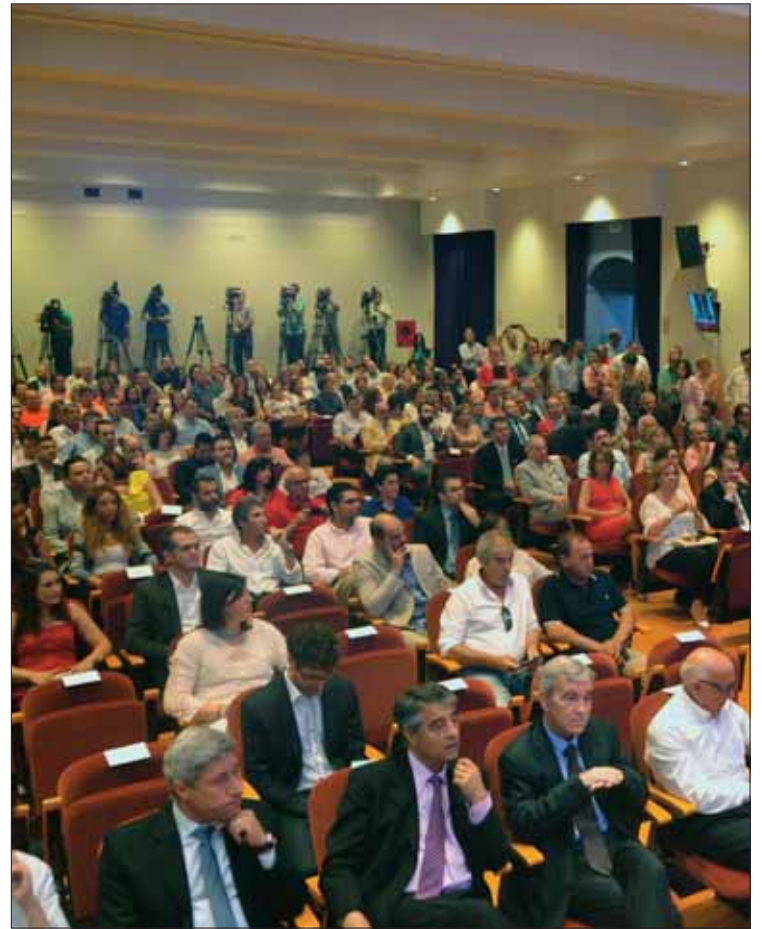
Al acto asistió numeroso público y diferentes medios comunicación

pequeños de la provincia". El presidente se compromete a garantizar unos servicios públicos de calidad y a recuperar esos servicios que han perdido los pueblos de menos de veinte mil habitantes por la Ley de Racionalización y Sostenibilidad de la Administración Local, la conocida como "reforma de la Administración local". Asimismo, dijo que va a llevar a cabo esta tarea escuchando y reuniéndose con todos los alcaldes de la provincia, "independientemente del color político de su ayuntamiento". De hecho, anunció la creación de un Consejo de Alcaldes.