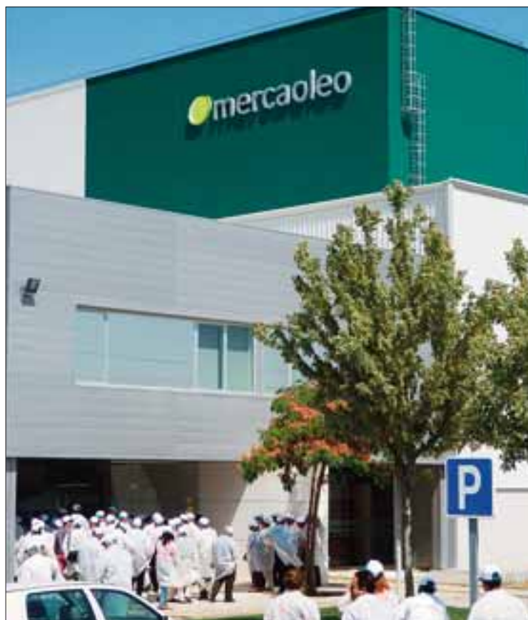
Los cooperativista ruteños visitan la planta envasadora de Mercaóleo

es que en cada junta de sección se deciden los repartos y los precios. Todos los socios participan en cada sección o actividad. A su vez, cada actividad tiene su régimen económico propio y soporta sus