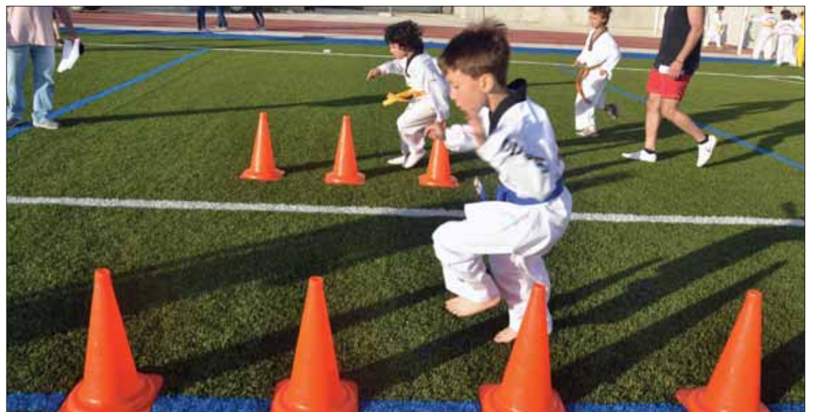
Las pruebas combinaban fuerza, habilidad, destreza y coordinación/FP

Aparte de esta jornada, el club venía de hacer un buen papel en Mairena del Alcor, con el decimonoveno Trofeo Villa de Mairena. Congregó a cuatrocientos competidores, cinco de ellos de