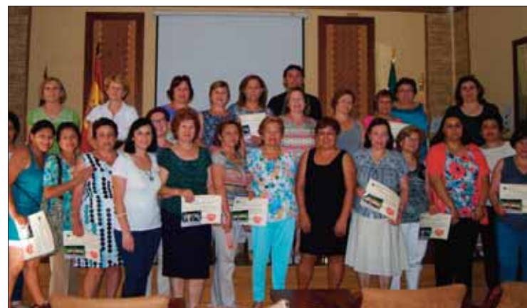
Este año han participado más de treinta mujeres /MM

Respecto al hecho de perder peso, quiso dejar claro que deben combinarse dos ingredientes: una dieta hipocalórica y un programa de entrenamiento aeróbico, larga duración y baja intensidad. Al fi-