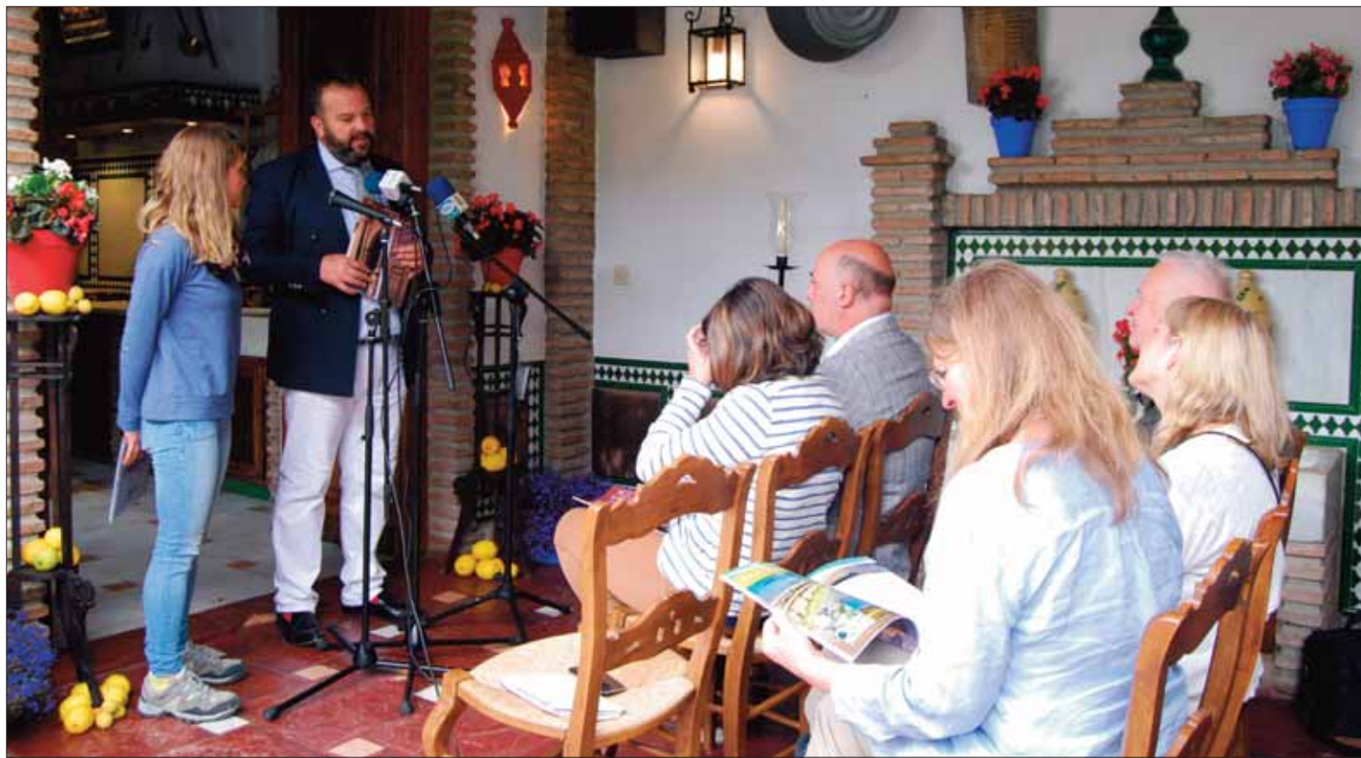
La guía se va a distribuir en los alojamientos de la comarca, oficinas de turismo y puntos de información de los pueblos de la Subbética/FP

Se pretende que la periodicidad sea semestral y que la siguiente salga para Fitur