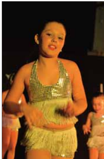
Una joven alumna de la escuela/FP

Fruto y consecuencia de esa labor de equipo, sobre las tablas del teatro al aire libre se sucedieron un total de dieciséis coreografías. Catorce habían sido preparadas por la profesora, pero las otras dos habían corrido a cargo de las propias alumnas. Como siempre, en estos bailes alternó el ballet clásico con números de corte contemporáneo,