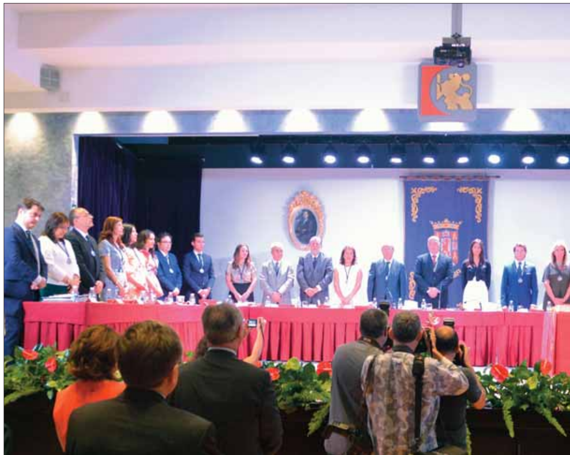
La nueva Corporación de la Diputación provincial durante la interpretación del himno de Andalucía