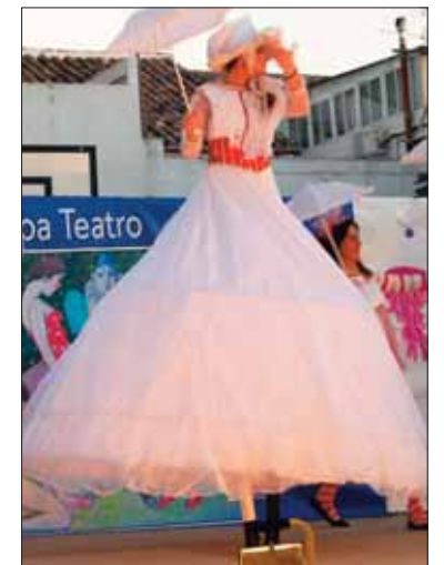
El grupo Carpe Teatro se encargó de dar animación a la fiesta del colegio Fuente del Moral/MM