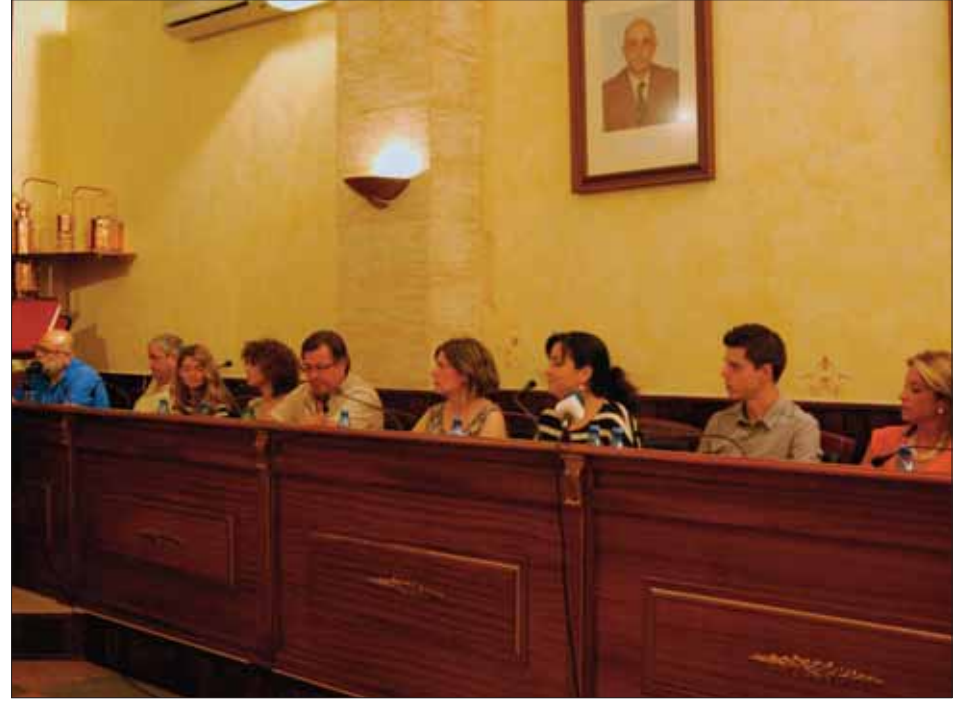
Tras esta sesión extraordinaria, ha quedado perfilada la configuración del Ayuntamiento de Rute para los próximos cuatro años/MM