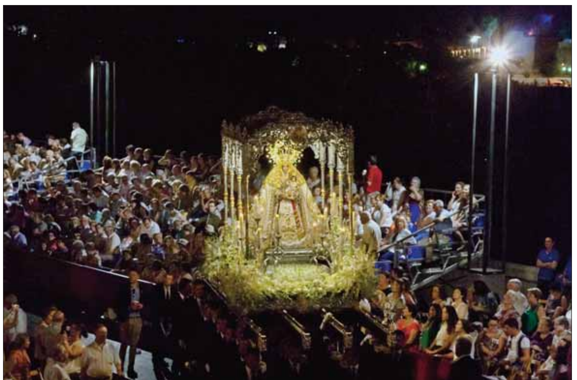
El cortejo de la Virgen de la Cabeza durante su recorrido por la carrera oficial

Justo antes de la salida procesional, confesaba que se