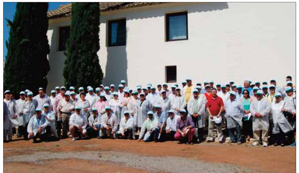
Los socios de la cooperativa de Rute visitaron las instalaciones de DCOOP/MM

Según el responsable de relaciones corporativas, se actúa bajo la premisa de "bodega común".