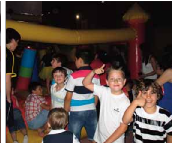
Tras los bailes y las obras de teatro, en Los Pinos se terminó en un castillo hinchable