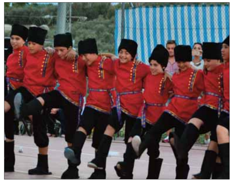
Las coreografías sobre diversas culturas del mundo protagonizaron la fiesta del Ruperto Fernández Tenllado/FP