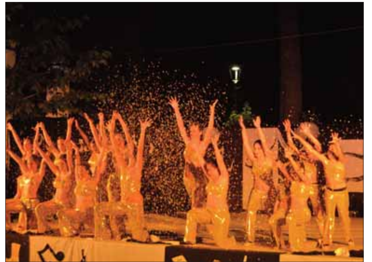
Como siempre, la coreografía final fue la más colorida

Para contrarrestarla, antes de la entrega de diplomas, quedaba la alegría final. Somé guarda un tema que esté sonando en el mo-