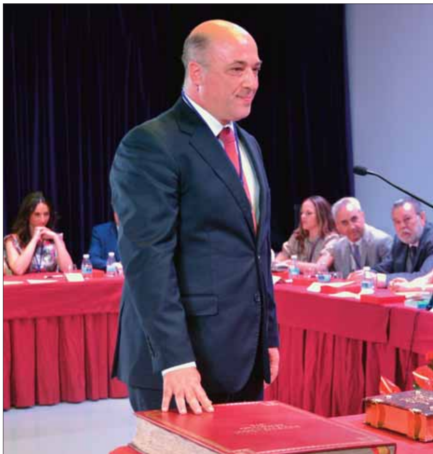
Ruiz en el momento de prometer su cargo como presidente de la Diputación/FP