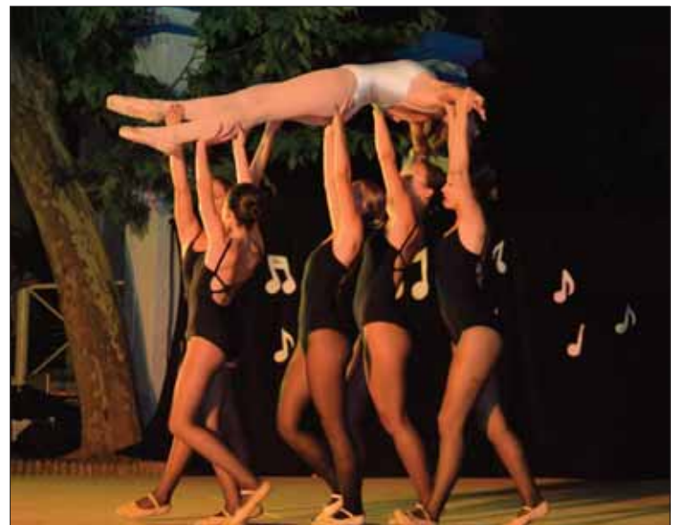
Se alternaron los números de ballet clásico con los de contemporáneo/FP

mento del festival, pero cuesta trabajo pensar que su elección sea casual o sólo una cuestión de modas. Alumnado y público se pusieron en pie para bailar al son del "Madre Tierra" de Cha-