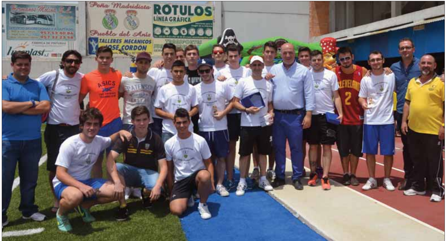
Junto a la fiesta para los más pequeños y la paella conjunta, se reconoció a todos los entrenadores y de modo especial al equipo juvenil/FP