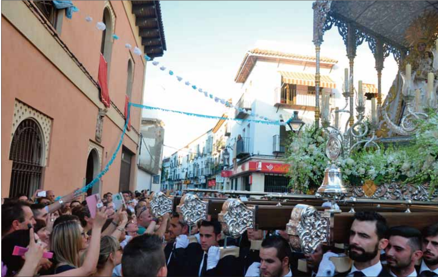
El público ruteño desplazado a la capital se apresuró para captar instantáneas de una jornada que calificaron de histórica

De las 25 procesiones de imágenes coronadas en la Magna Mariana, la de la Virgen de la Cabeza fue de las más concurridas