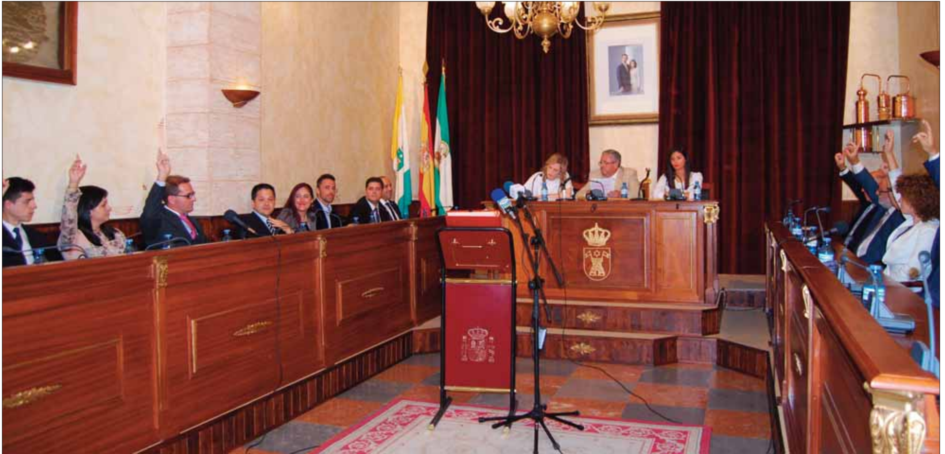
La votación del alcalde se llevó a cabo a mano alzada en el salón de plenos/MM