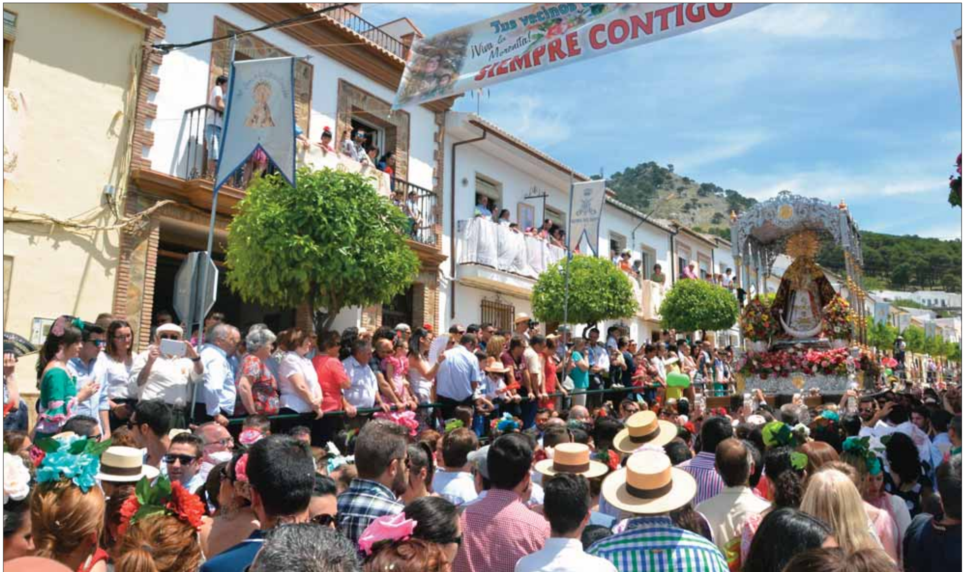
El paso de la Morenita por los Cortijuelos mantiene ese aire especial de ser el lugar donde se gestó la cofradía/FP