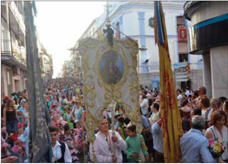
La ofrenda de flores representa una riada humana