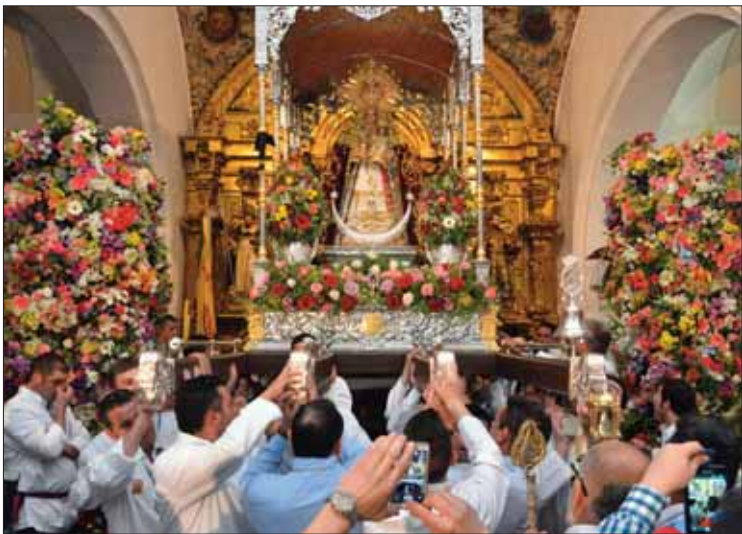
La bajada del altar es otro de los instantes más intensos