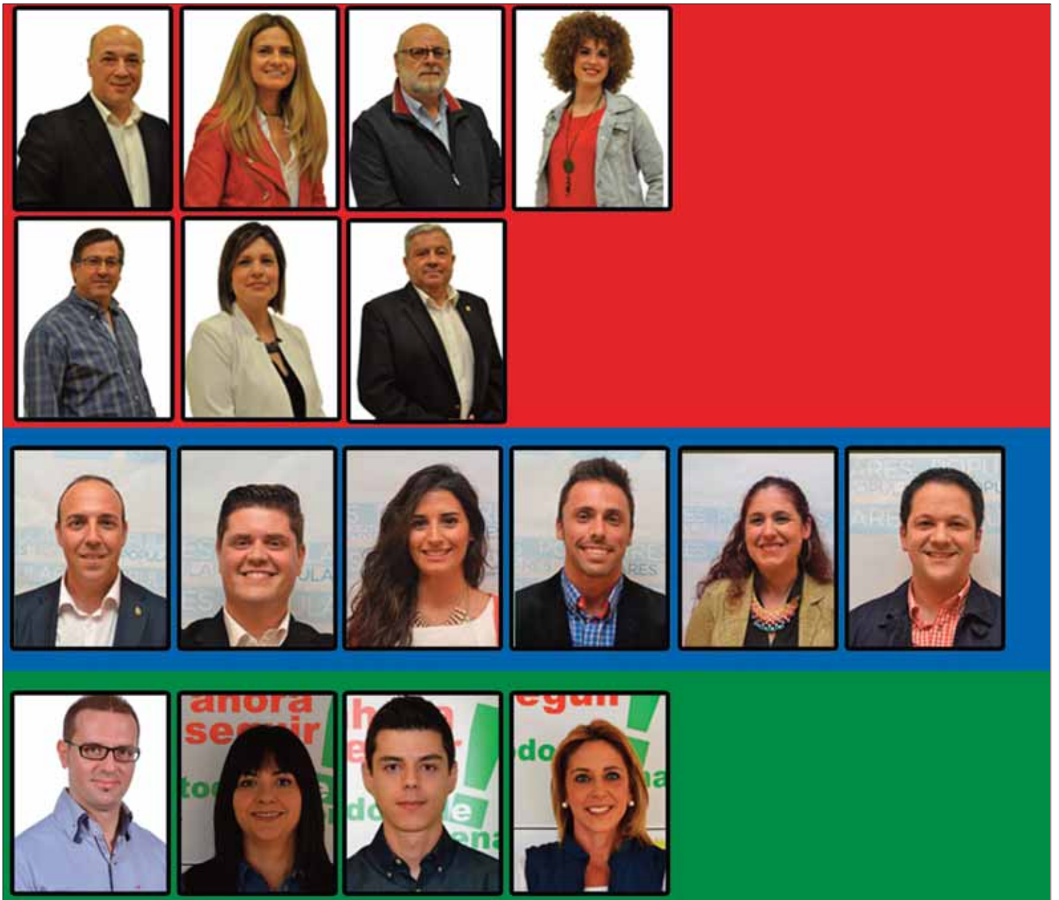
Composición de la Corporación municipal que tomará posesión de sus cargos en el pleno de investidura del 13 de junio

Tras los resultados y el reparto final, el especial de Radio Rute concluyó con el análisis y las valoraciones últimas de los candidatos. Otro aspecto en el que la emisora municipal ha seguido profundizando ha sido la interacción a través de las redes sociales Facebook y Twitter, e incluso del Whatsapp en los dispositivos móviles, para comentar las novedades que se iban produciendo.