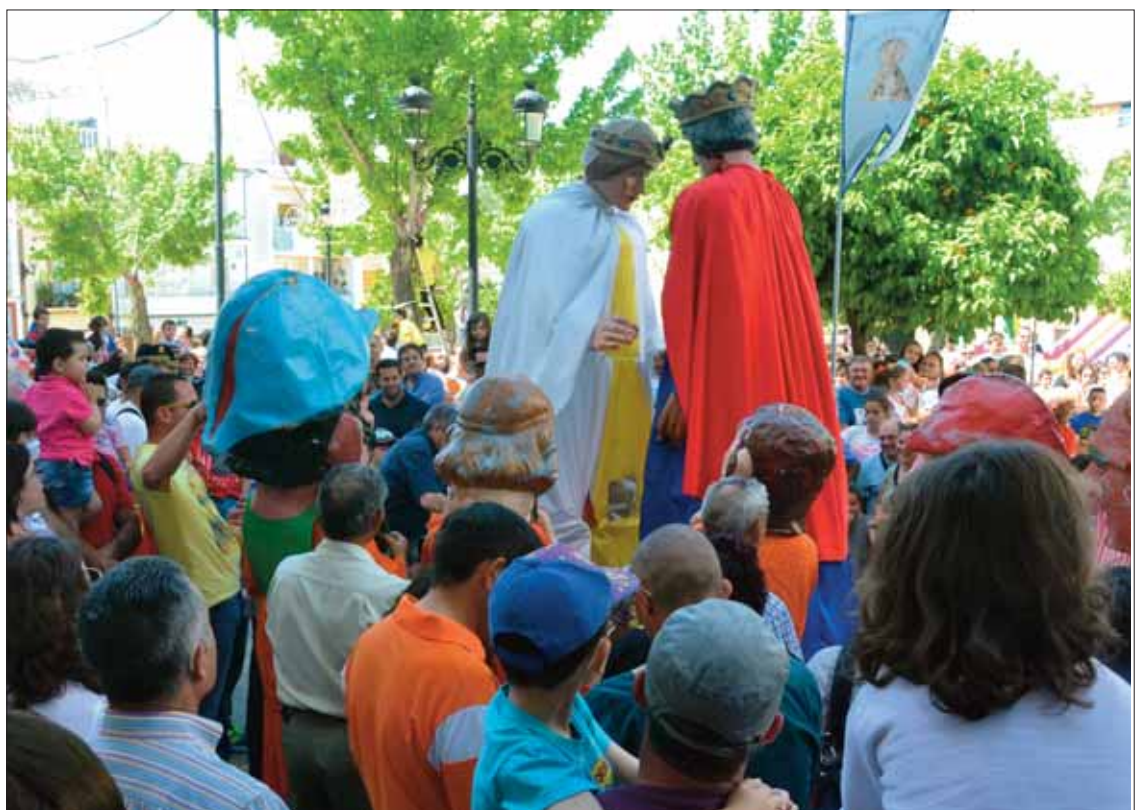
La asociación Morenita, Reina de Rute ha recuperado la salida de los gigantes y cabezudos

Cabeza, y mientras escuchan ven cómo se colman las cuatro columnas con las flores. Faltan columnas, el resto se depositan en el suelo.