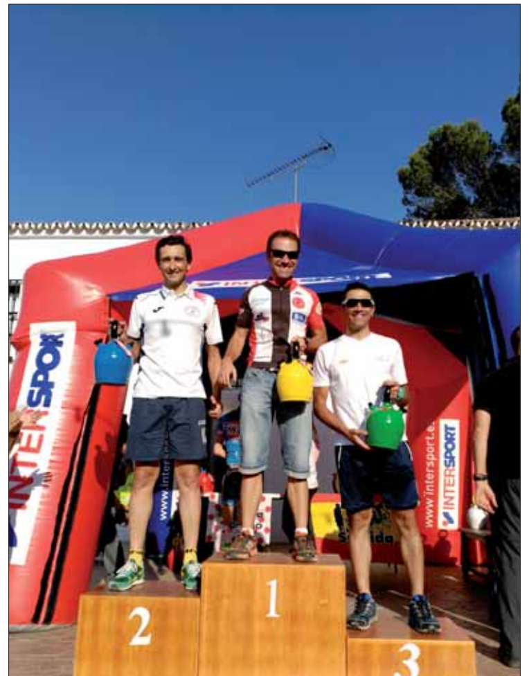
El ciclista ruteño subió al podio tras completar los 200 kilómetros/FP

A esa mentalización hay que sumar la de correr solo. Al ser tan dura, la carrera se rompió muy pronto. Se escapó con dos compañeros, pero luego quedó descolgado entre éstos y el resto durante más de cien kilómetros. Confiesa que ahí no queda otra que pensar en la familia y recordar que ha estado mucho tiempo preparándose para no abandonar.