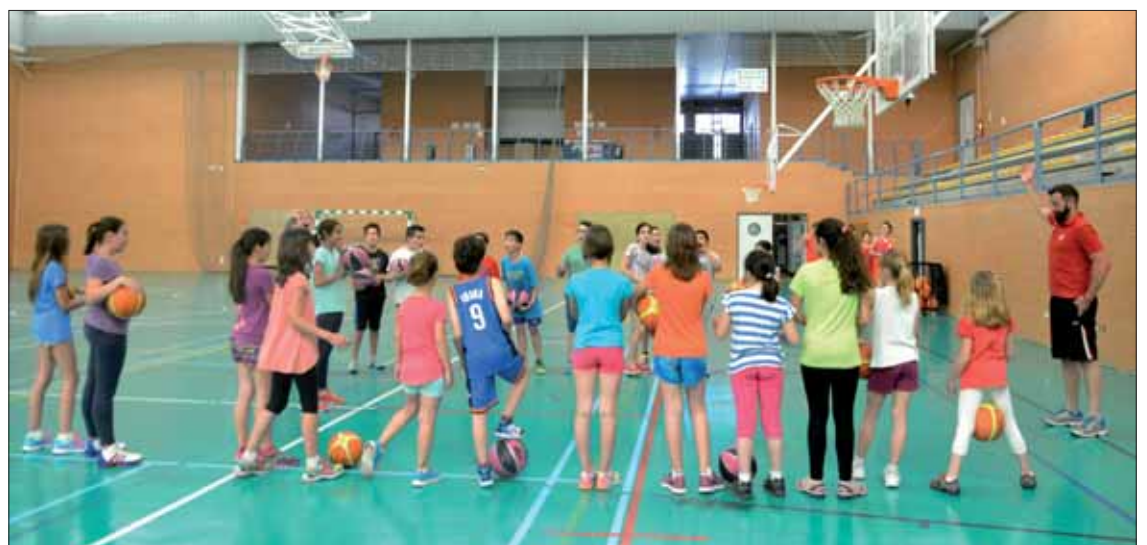
El monitor buscó sesiones amenas para iniciar a los más jóvenes en la práctica del baloncesto

El monitor tiene claro que cuanto mayor sea la base de la pi-