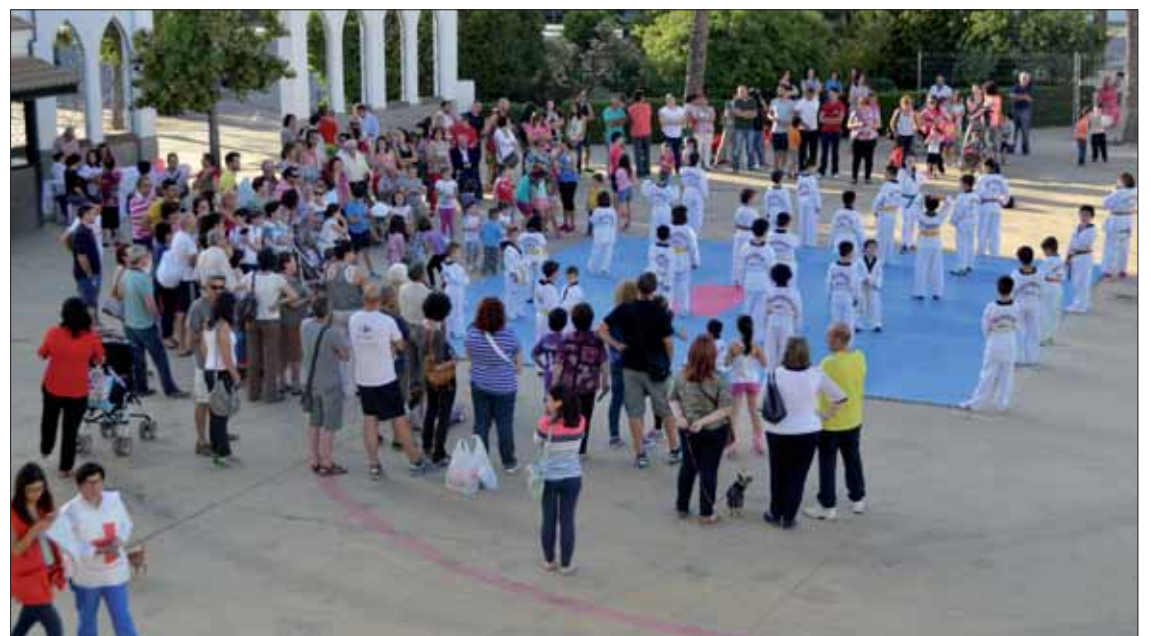
Cruz Roja ha conseguido con esta exhibición más de cien kilos de alimentos y productos de higiene/FP

A nivel exclusivamente deportivo, Gimtar sigue cosechando éxitos. En mayo tenía lugar en