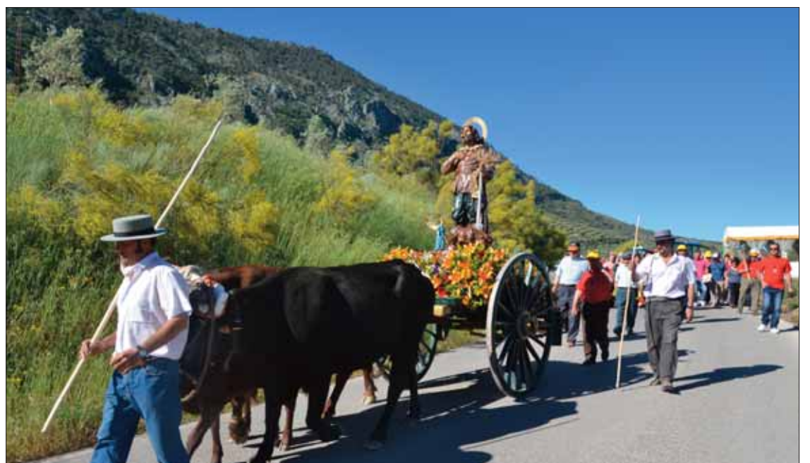
Por la mañana San Isidro se adentró en diseminados como Los Villares o Los Pérez

A última hora de la mañana, regresaron a la ermita para la misa flamenca. En el almuerzo se degustó la paella que cada año prepara la cofradía, en colaboración con el Ayuntamiento. Y en la sobremesa, el público se divirtió con una nueva edición del concurso de bebedores de gazpacho y una exhibición del Gimnasio GYM J-