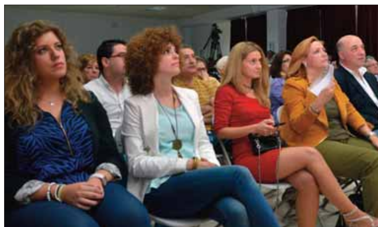
Nuevas caras se incorporan al equipo socialista/FP

se ha llevado a cabo "sin despreocupar otras cosas". Destacó el trabajo en multitud de calles y rincones, la apuesta por un pueblo más limpio, la inversión en caminos rurales, en los colegios e incluso en fiestas, "que con la mitad de presupuesto han tenido más éxito que las anteriores".