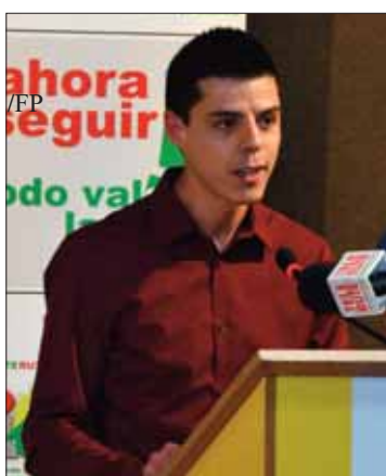
Antonio J. Gómez/FP