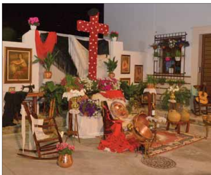
La cruz ganadora de adultos/FP