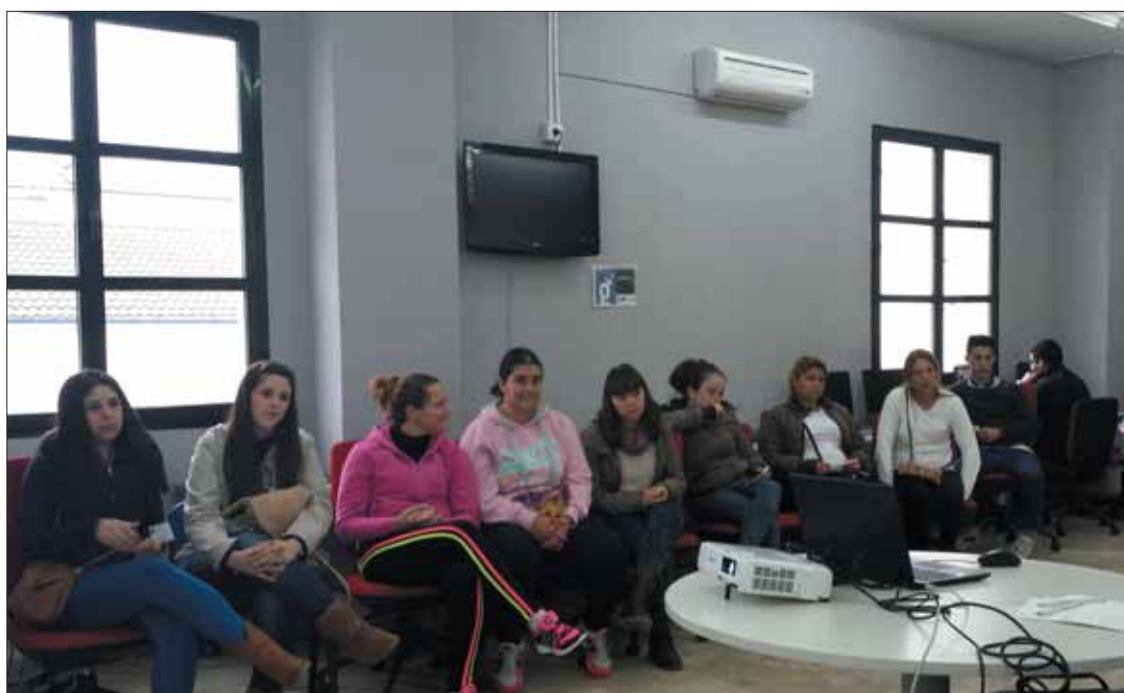
Alumnos que participan en este curso impartido en el Centro Guadalinfo de Rute/FP

La formación en nuevas tecnologías sigue siendo para muchos pequeños empresarios la