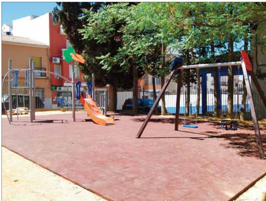
Las mejoras del parque infantil de Nuestra Señora del Carmen finalizarán en breve

Por tanto, la actuación ha consistido en corregir estos desperfectos y en la instalación de nuevos elementos infantiles. En concreto, dicho parque se ha dotado con un conjunto modular de dos torres, postes, escaleras, plataformas y tobogán. Se trata de un mobiliario recomendado para uso de chicos y chicas con edades comprendidas entre los 4 y 14 años. El importe total de las mejoras de este parque infantil, costeadas íntegramente por el Consistorio, ha supuesto