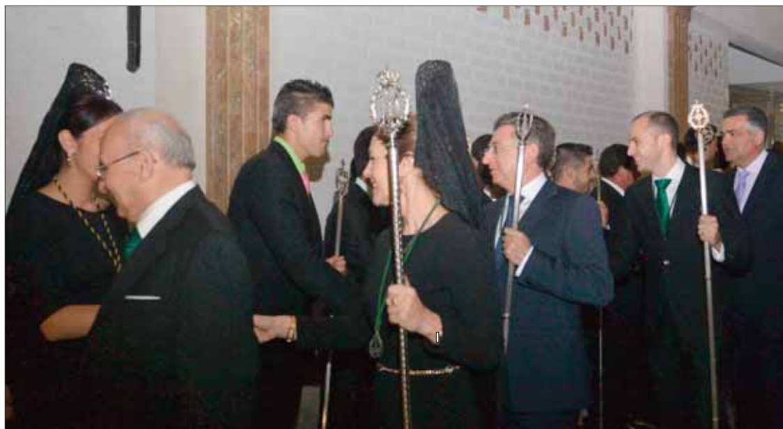
Los hermanos mayores y la junta de Gobierno saludan a otras cofradías