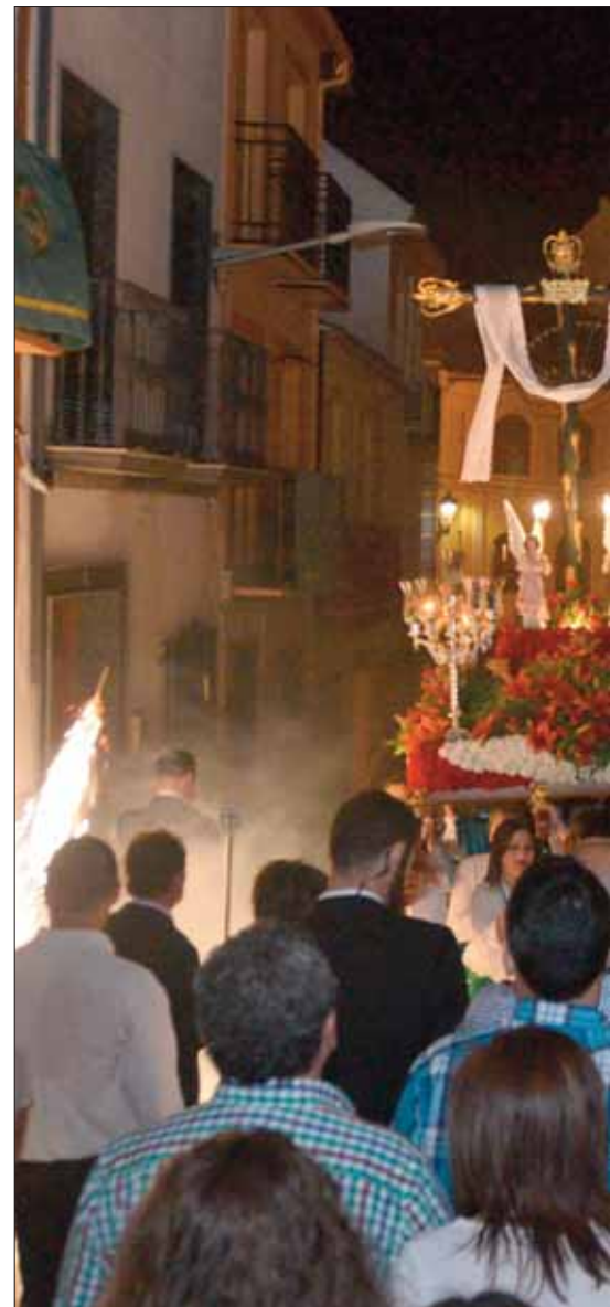
A diferencia de Semana Santa, las imágenes subieron