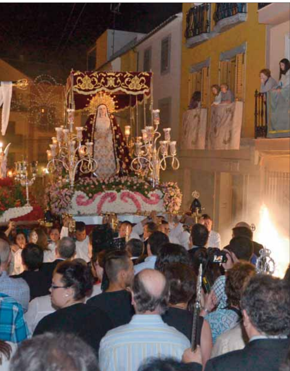
en paralelo con la iluminación de bengalas/FP

pades. Siempre despierta expectación saber con qué materiales van a preparar la cruz en los trabajos manuales las personas que hay en el centro de día. Esta vez se ha elegido trabajar con pan de molde, secado, prensado para, una vez sacado el modelo de las flores, pintarlas con témperas.