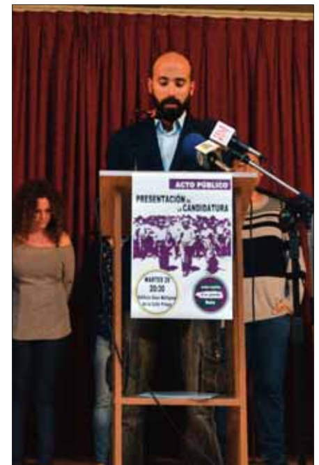
Burgos aboga por el cambio/FP

En teoría, según Ronda, esto de por sí debería ser positivo, “pues supondría mayores servicios públicos e infraestructuras para Rute”. Sin embargo, se cuestiona si Rute tiene “la mejor piscina de la comarca, el mejor teatro o los mejores cines”, o si contamos con un comedor social. Otro asunto al que se refirió fue la presión fiscal. Dijo que en Rute es de 403 euros, “similar” a los 420 de Lucena. Sin embargo, el nivel de endeudamiento público por cada rueteño “es de 716 euros, frente a los 632 euros de Lucena”. Además, según las fuentes consultadas, afirma que los ruteños pagamos más por mantener el gobierno municipal. Cada habitante paga 8,82 euros, frente a los 5,70 que pagan los de Lucena o 5,45 que pagan los de Priego de Córdoba.