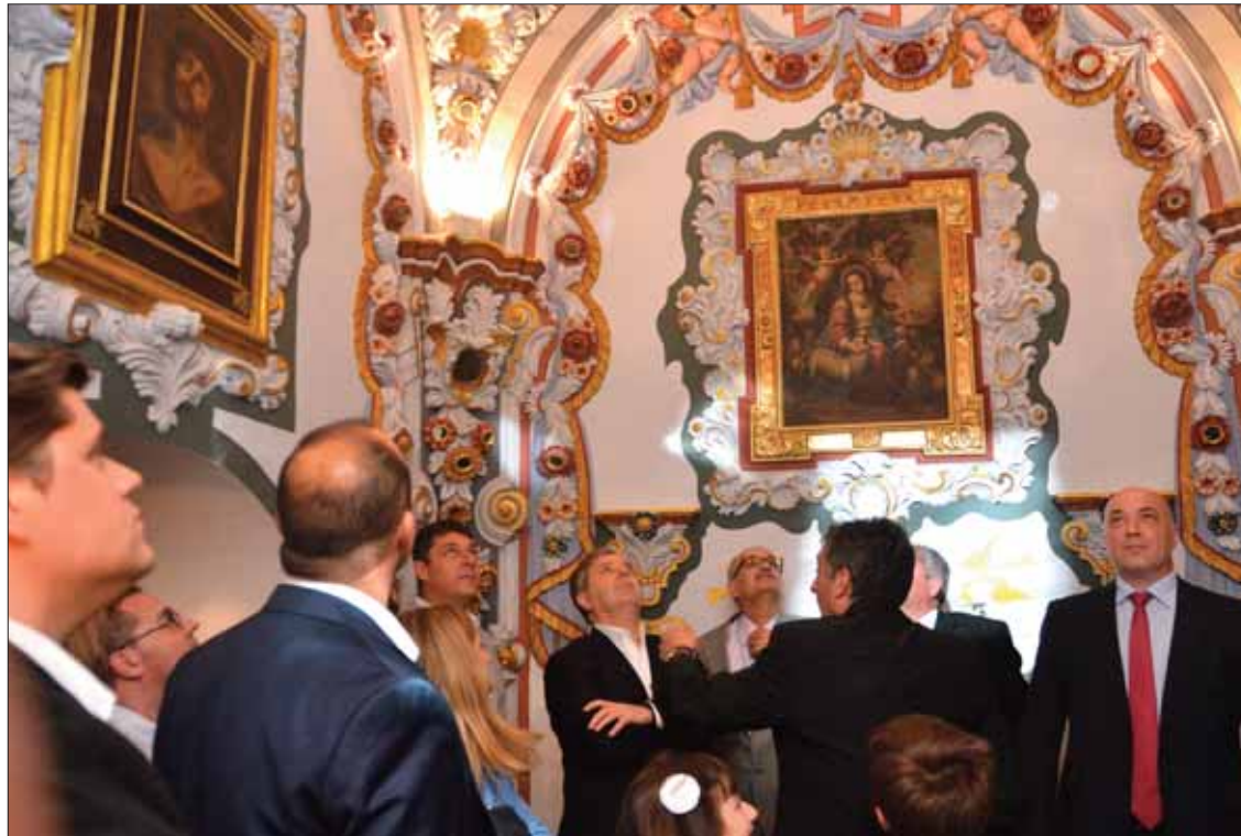
Las autoridades y el público pudieron contemplar el estado del camarín tras la restauración

La Escuela de Alta Decoración se ha ocupado de la restauración, que ha supuesto una inversión de 28.860 euros, divididos en dos fases. En cada una, Diputación ha aportado diez mil euros. Además del esfuerzo de la