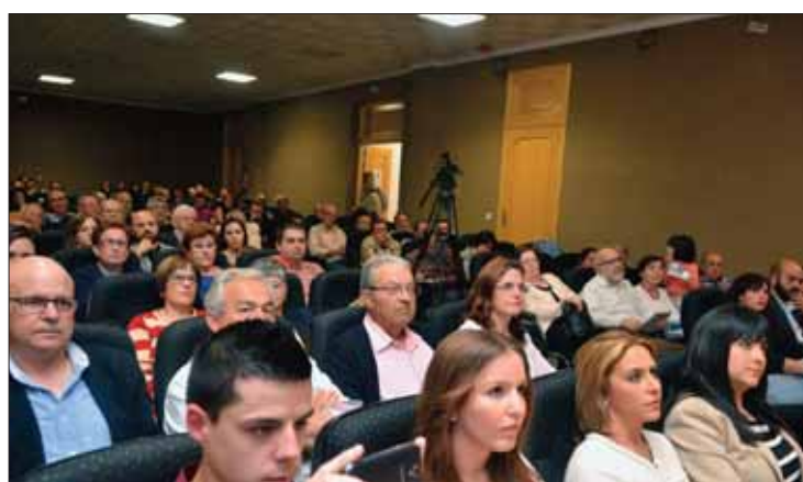
Contaron con el apoyo y asistencia de numerosos simpatizantes/FP