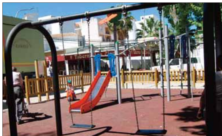
La remodelación del parque del Paseo del Fresno está acabada