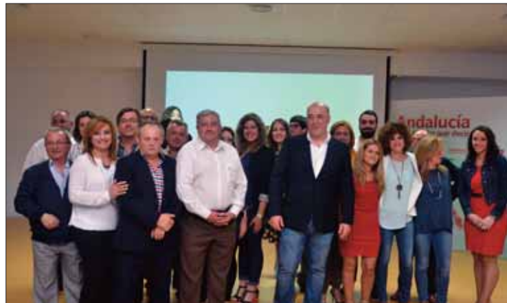
Miembros de la candidatura del PSOE/FP