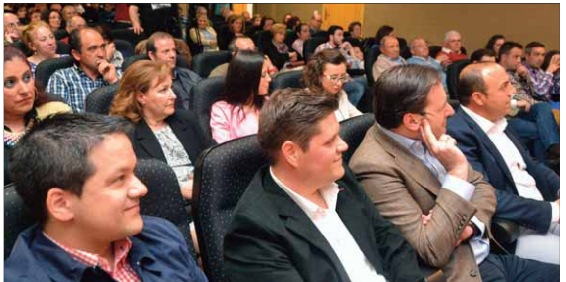
Numeroso público les acompañó durante el acto