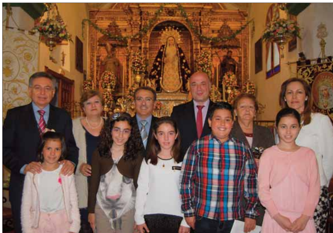
Las autoridades y el público pudieron contemplar el estado del camarín tras la restauración

Molina ofreció un pregón lleno de lirismo y de gran maestría en la prosa