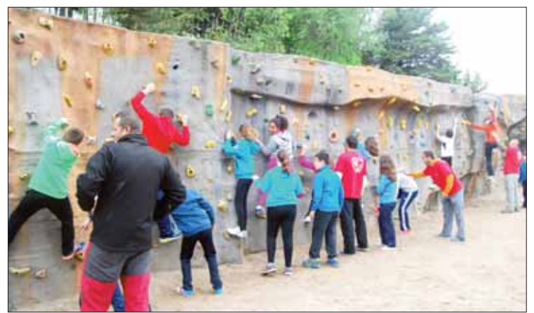
Los talleres incluyeron una sesión de escalada en el rocódromo