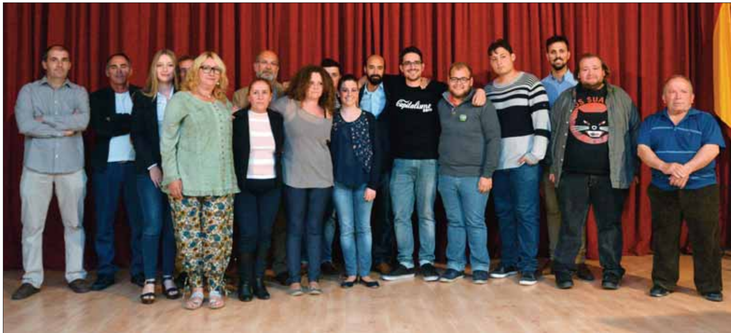
La candidatura la componen personas del Círculo de Podemos Rute e independientes/FP