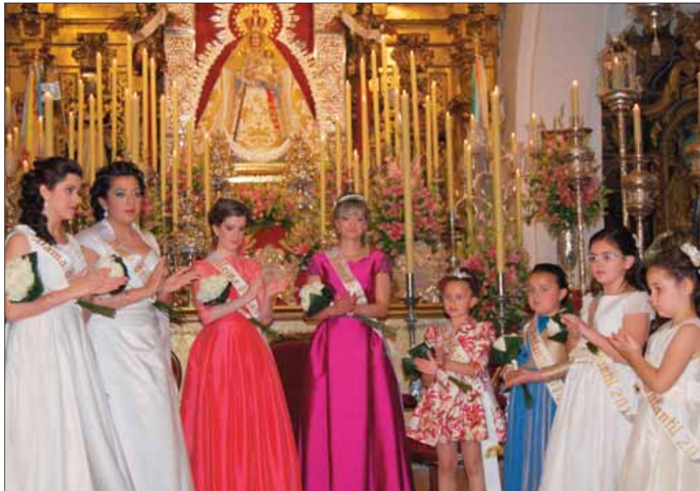
Reinas y damas juveniles e infantiles de las fiestas de la Morenita de 2015/MM

La pregonera confesó que no hay mayor honor para una “cabezona” que poder halagar y cantar a su Morenita