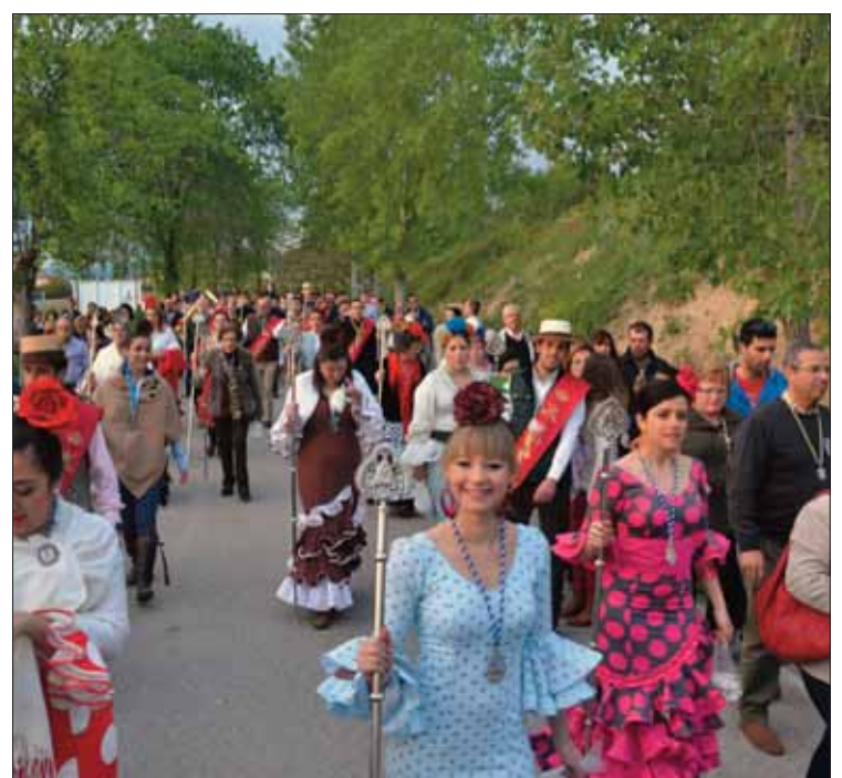
La multitud se agolpó en La Molina para recibir a los hermanos

Se repiten los himnos. Entre el gentío brota el grito de “¡Morenita!”, con la “i” suspendida en el tiempo, coreado por otro clamor: “¡Guapa!”. En esa “i”, en su ausencia de significado, está implícito lo que no se puede explicar con palabras: una devoción irracional e incondicional de más de seis siglos.