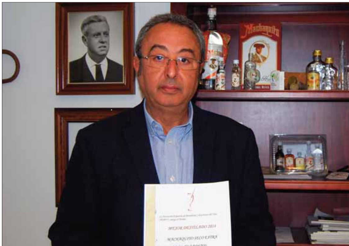
El gerente posa con el diploma del premio junto a una vitrina de su despacho

Respecto al resto de bebidas premiadas, el vino más votado, con 134 puntos, ha sido Habla del Silencio 2013, Vino de la Tierra de Extremadura, de Bodegas Habla, ubicada en Trujillo (Cáceres). Competía en el capítulo de vinos tintos jóvenes (2012 y 2013) y recibió el Premio de la Federación Internacional de Periodistas y Escritores del Vino (FIJEV). Estuvo seguido de Pago del Vicario Petit Verdot Rosado 2014, Vino de la Tierra de Castilla, de Bodegas Pago del Vicario de Ciudad Real, con 101 puntos; y Palo Cortado Tradición VORS,