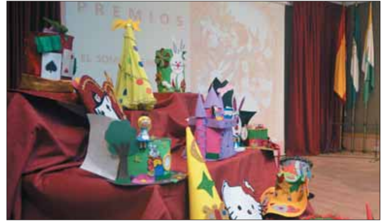
Una de las actividades fué “El sombrero loco”