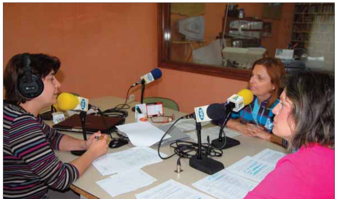
La directora y la concejala destacaron la importancia de la prevención

Siendones ha agradecido la predisposición de todas las personas implicadas para que los