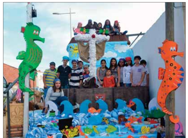
El grupo de Fuente del Moral recreaba escenas de Piratas del Caribe