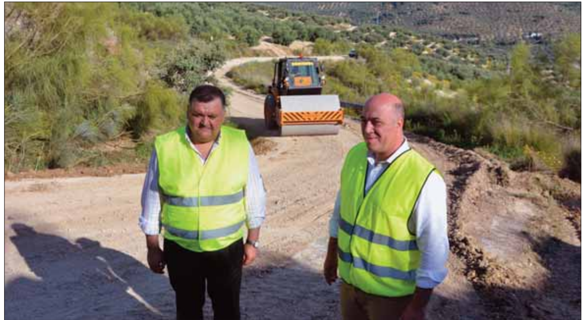
Se está actuando en las pendientes del Camino de La Hoz, reforzando el firme y adecentando las cunetas/FP

Por otra parte, el alcalde se refirió a la depuradora de aguas residuales. El proyecto, "que ya está terminado", se acerca a los cien mil euros, con una inversión prevista "de 8,8 millones". Se ubicaría más arriba de Las Salinas, ya que esta zona "técnicamente no permitía la construcción". Por eso, se va a hacer "un bombeo" para el polígono.