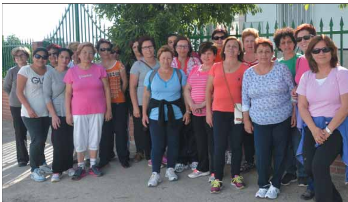
La primera salida del grupo se hizo por la carretera de La Molina/FP

La idea es que haya al menos una salida de todo el grupo a la semana, y luego cada persona complete sus pasos cuando pueda. Esa salida conjunta responde a que, además de la prác-