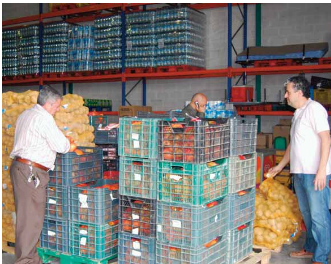
Los lotes de alimentos se han repartido en el Supermercado Zaleas de Rute/MM

En esta ocasión, del programa de la Junta también se benefician los usuarios habituales de la Asamblea Local de Cruz Roja. A Rute han correspondido un total de 11.666,91 euros para este programa. Se han distribuido mediante lotes de de comida de