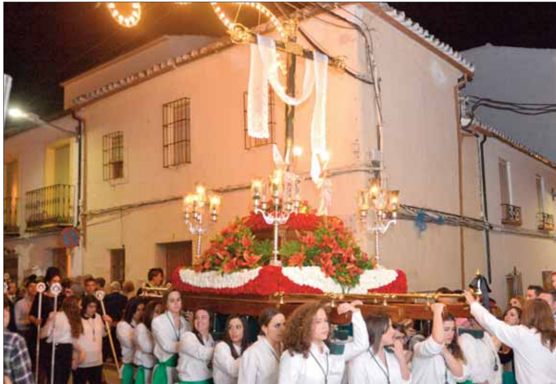
Las costaleras portando el trono con la Santa Cruz

Esa luz y ese colorido se hacen patentes en el concurso de cruces. Es la traslación al ámbito religioso del reverdecir de los campos andaluces. Sería difícil entender fuera de nuestra cultura y el contexto de nuestra tierra una fiesta tan participativa. Aparte de la celebración religiosa, elaborar una cruz es un acto de creatividad, de vecindad, de convivencia, de vestir y poner de escaparate las calles de