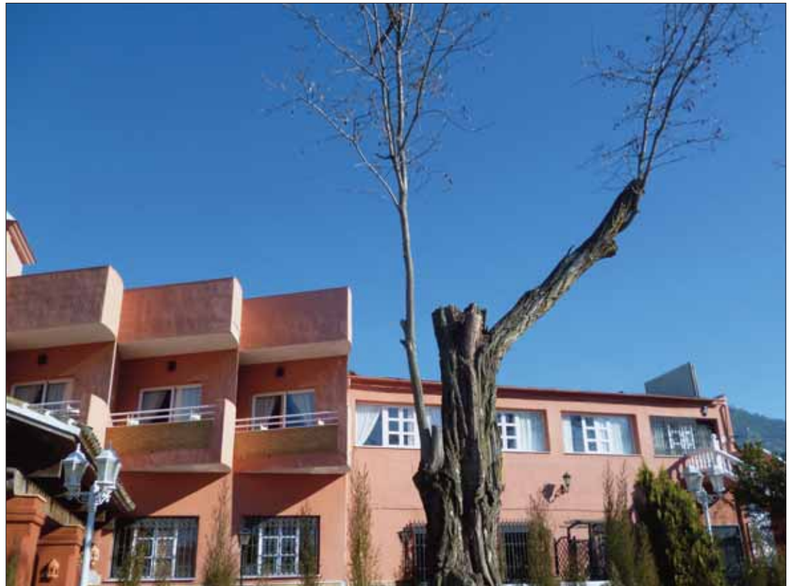
Uno de los aspectos que más les preocupa es que algunos árboles quedan desprovistos de sus ramas guía

Lamentan que son árboles “jóvenes y casi recién formados, desfigurados para siempre”. Por eso, califican como “la mayor aberración” lo del parque Nuestra Señora del Carmen. Junto a la calle Del Mercado se han podado “ramas jóvenes y sanas, pues en años anteriores estos ár-