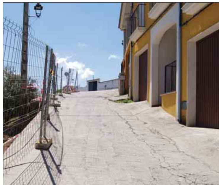
Las reformas de la cuesta de Yesar una de las demandas de los vecinos/MM

En este caso, el coste previsto es de 140.242,03 euros. Según el alcalde, es una inversión importante