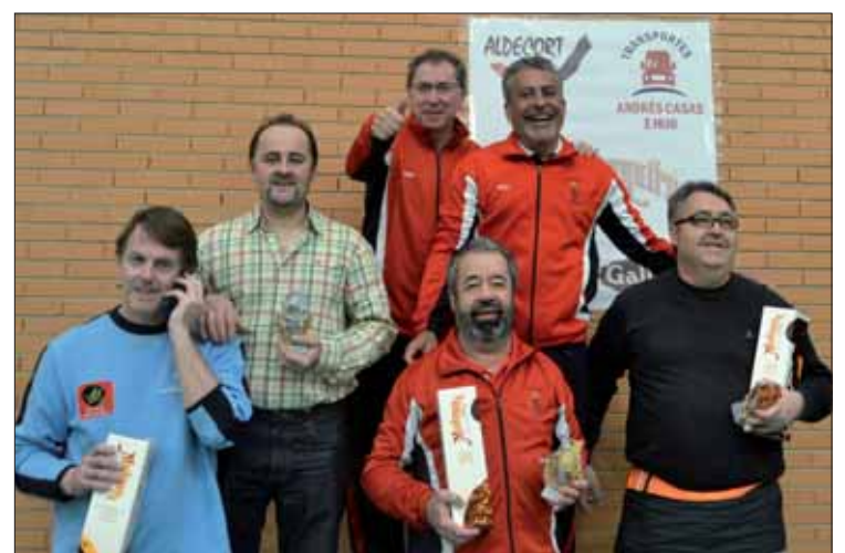
Podio final de la lucha por el título con los tres primeros clasificados

riores. No pudo ser, pero los dos conjuntos tienen claro que el triunfo ya había sido colarse entre los ocho primeros.