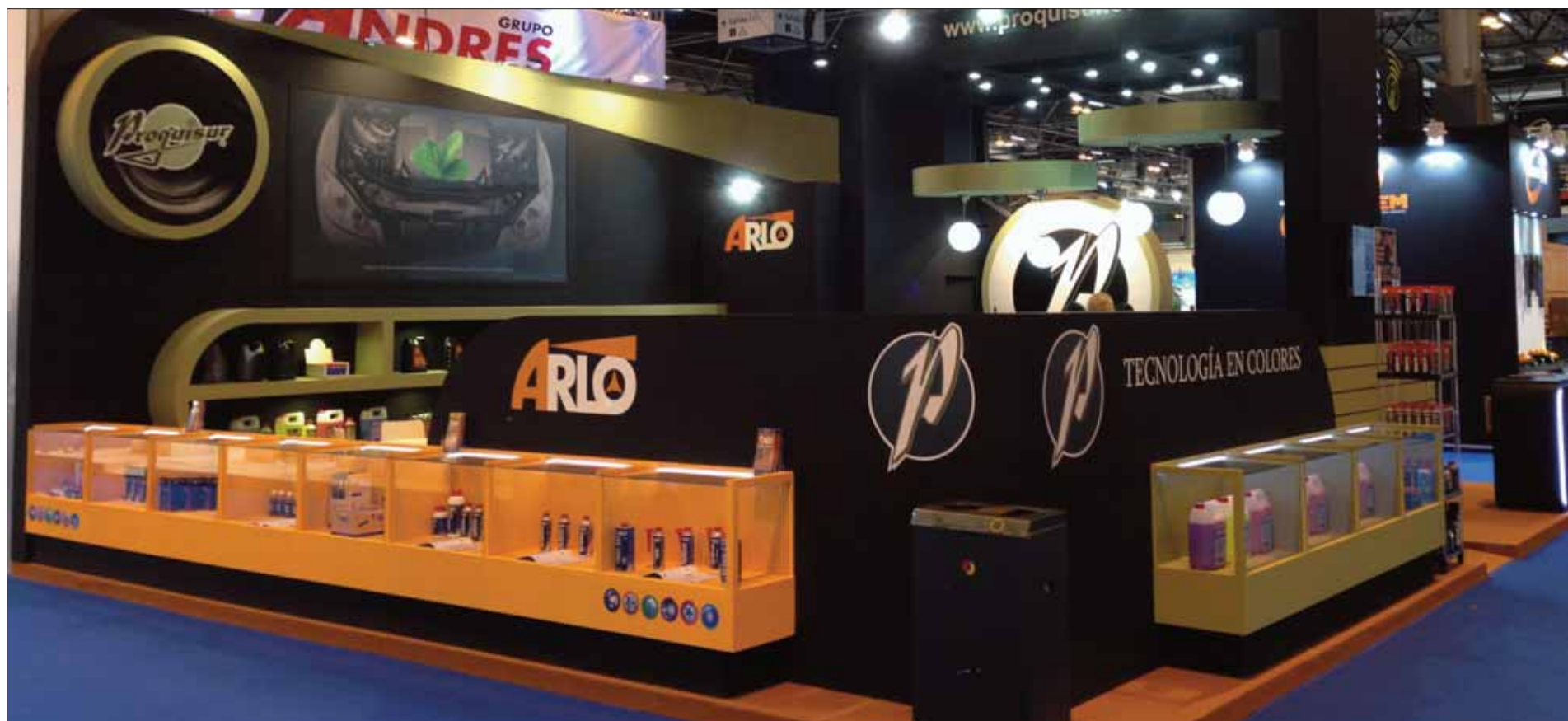
Proquisur contó con stand propio en la Feria Internacional, Mortortec, celebrada en el recinto de Ifema en Madrid/EC

Esta empresa ruteña se dedica a la fabricación y producción de todo tipo de artículos relacionados con la automoción