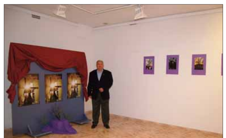
El concejal con cartel anunciador y las imágenes de la exposición

Además, como ha recordado, el año pasado, a diferencia de otros, el tiempo permitió que salieran casi todas las imágenes. La única que se quedó sin ver la calle fue la de Jesús Resucitado. Por eso, no dudó en animar a la gente a que saliera en esta ocasión cámara en mano para captar muchos momentos que deparan las estaciones de penitencia ruteñas.