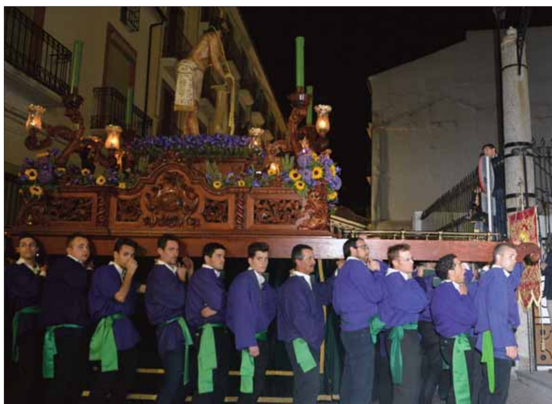
Las cofradías de Pasión de Santa Catalina acogen la llegada de Jesús Amarrado a la Columna

partida a los recorridos procesionales. Si bien las estaciones "oficiales" comienzan el Domingo de Ramos, el Viernes de Dolores tiene lugar el Vía Crucis del Cristo de la Expiración,