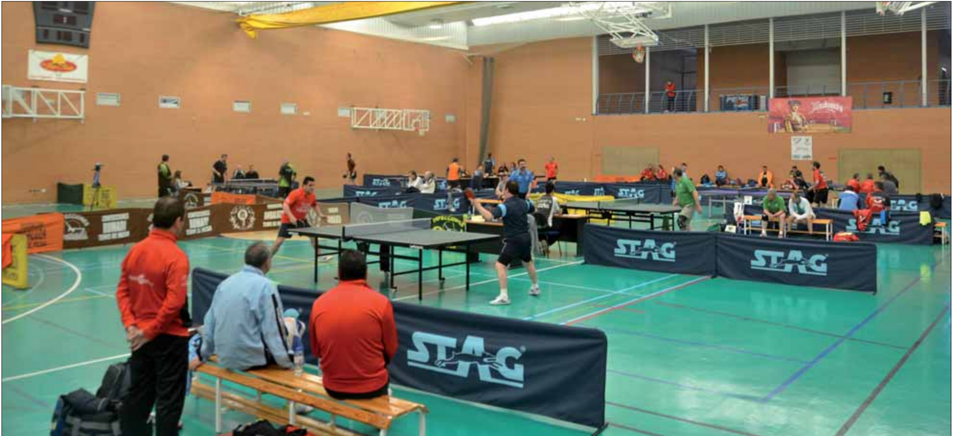
Durante toda la jornada del sábado y la mañana del Domingo de Ramos el Pabellón Gregorio Piedra albergó dos liguillas con objetivos muy distintos, el título y evitar el descenso/FP