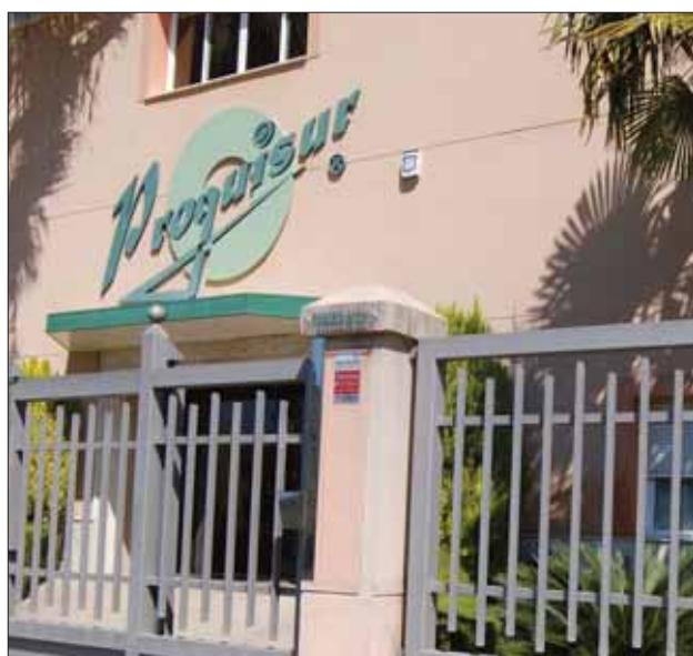
La empresa cuenta con unos tres mil metros cuadrados/MM

Arcos asegura que son "una de las tres empresas de mayor solvencia que operan a nivel nacional". Afirma que con la crisis "han proliferado muchas firmas que no cumplen con los estándares de calidad". La simpleza aparente de la fabricación de este tipo de productos hace que otros competidores se aventuren en el mercado.