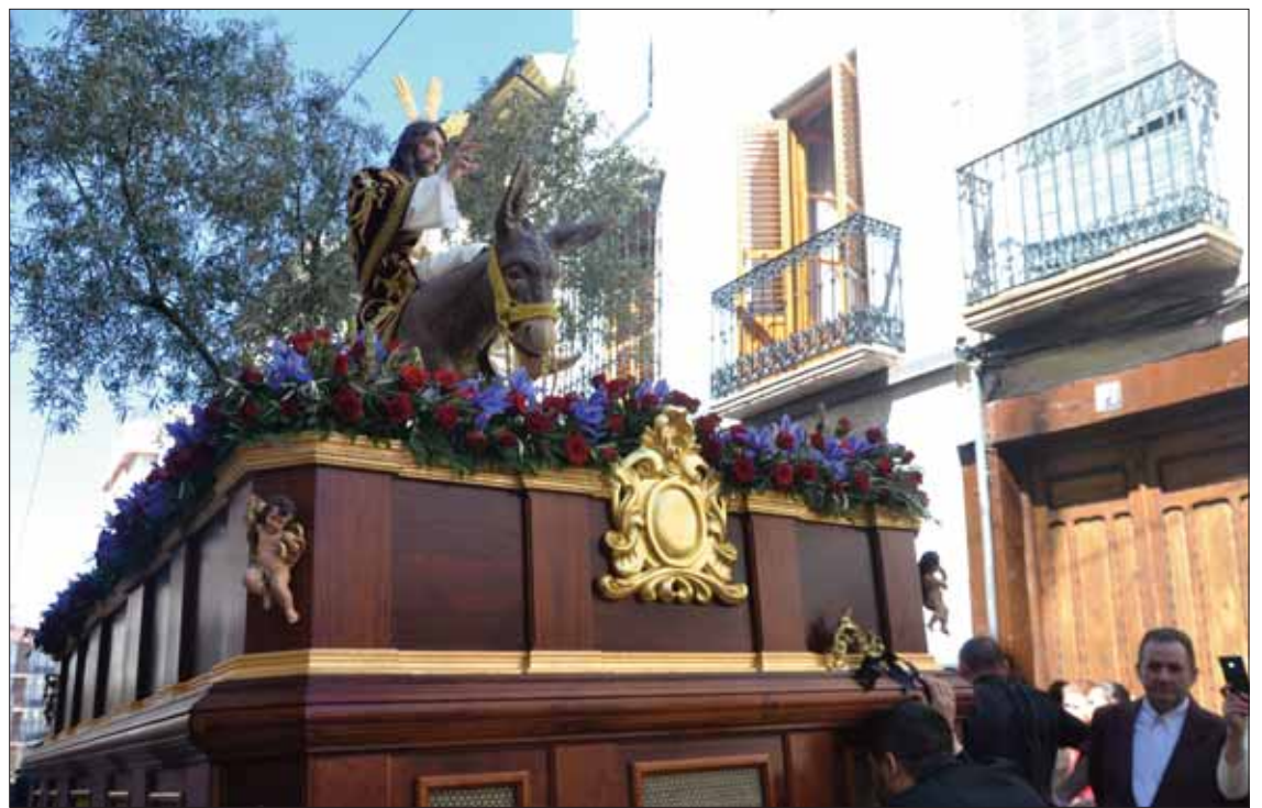
El capataz de trono da instrucciones a los costaleros de La Borriquita