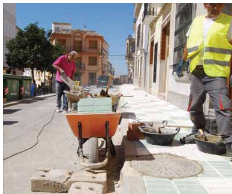
Tras el acerado ahora se prevé comenzar las obras de la Guitarrilla

cuesta del Yesar. Según el alcalde, era una demanda histórica de los vecinos de esta aldea. Dicha cuesta