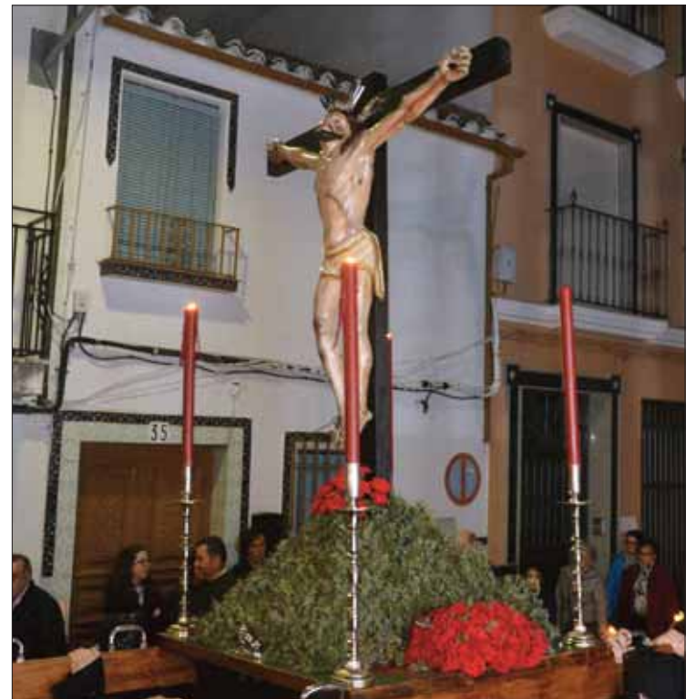
El Cristo de la Expiración portado sobre parihuelas/FP

Por lo demás, esta procesión ha permitido ver por primera vez en las calles de Rute los nuevos uniformes de la Agrupación Musical Santo Ángel Custodio. Otra imagen de la mañana llegó de manos de los más pequeños. No acaba de cuajar el hecho de que vistan de hebreos. En cambio, sí han sido bastantes los que han ido ataviados con las túnicas y los capirotos de na-