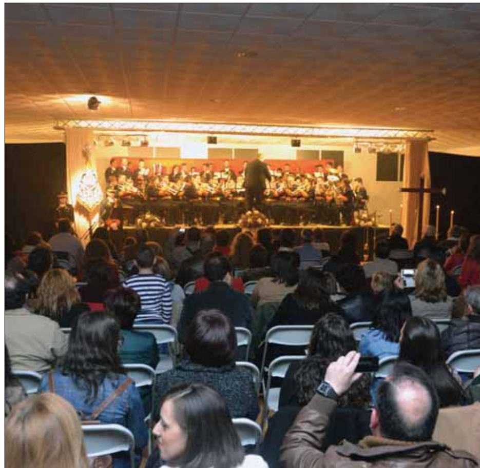
El concierto de "los Custodios" tuvo un componente benéfico/FP