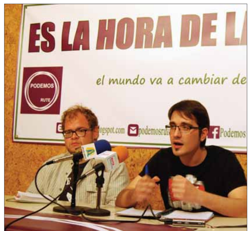
Podemos defiende una auditoría de la deuda y recuperar servicios públicos/FP

Respecto a la vivienda, aplican la máxima de la plataforma Stop Desahucios: “No puede haber gente sin casa y casas sin