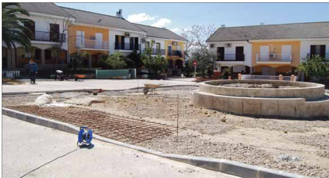
La remodelación prevista en la plaza de Los Manzanos se ha consensuado con los vecinos/MM