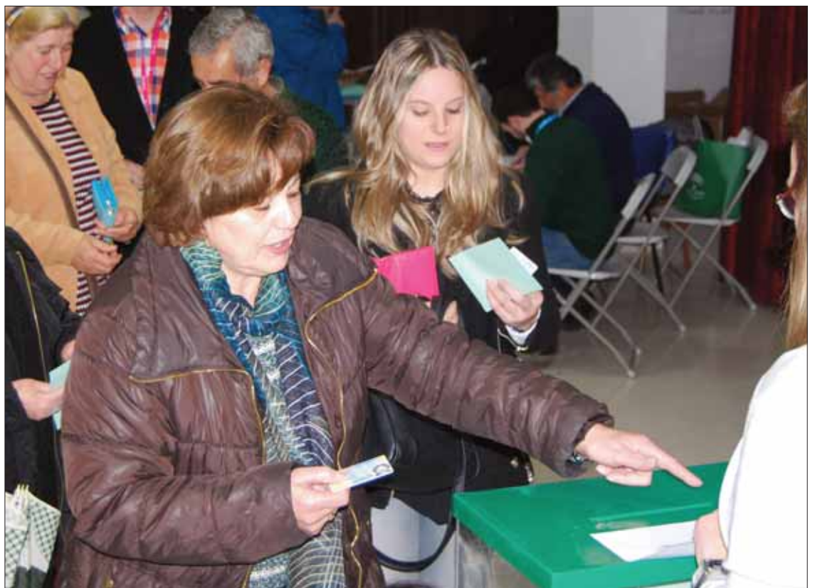
El Centro Cultural Rafael Martínez-Simancas uno de los colegios de mayor número de electores/MM

Por lo tanto, el reparto de las mesas electorales en nuestro municipio queda desde hace tres años de la siguiente forma: tres en la Ludoteca, una en Servicios Sociales, una en el Edificio Al-