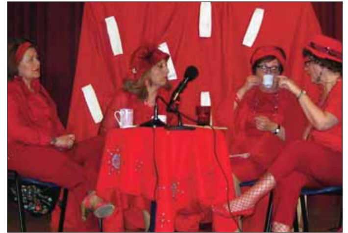
Teatro promovido por la O.F. de la Subbética/EC

Del resto de actos programados, el día 17 se impartió en el edificio de la calle Priego la charla