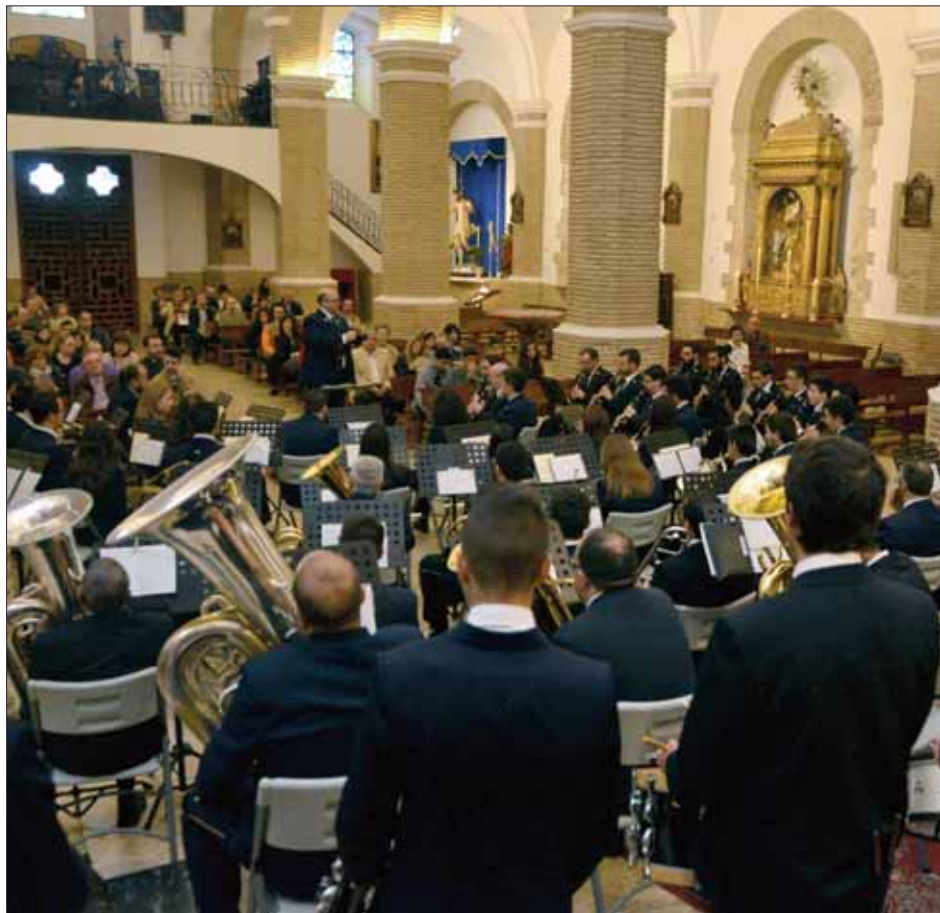
La banda ofreció en Santa Catalina parte del nuevo repertorio