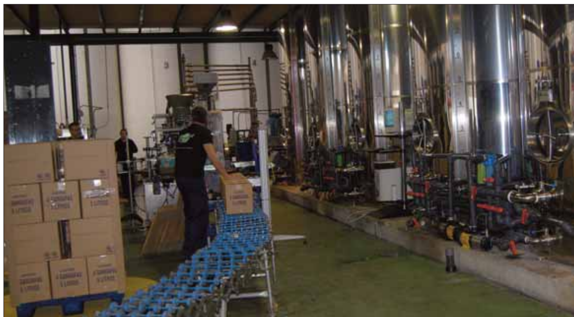
Han adquirido la maquinaria completa para la fabricación de lubricante/MM

El director comercial insiste en la importancia de apostar por productos elaborados con materias de calidad y acordes con las normativas medioambientales vigentes. De