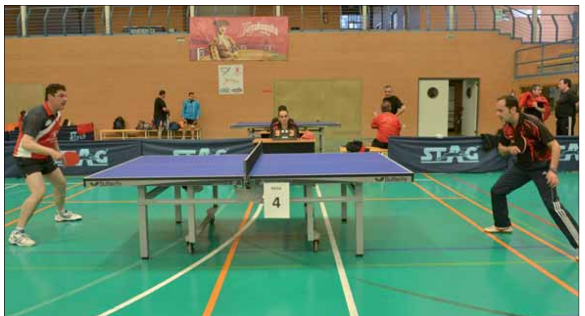
Para el anecdotario y la rivalidad local quedará el triunfo de Aldecort sobre Adebo/FP

A Espejo y sus compañeros les ha tocado el doble papel de