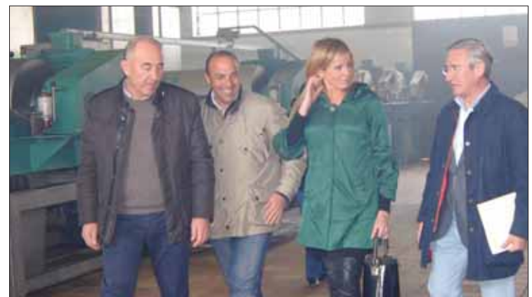
Los representantes del PP visitaron las instalaciones de la Cooperativa /MM

El portavoz de agricultura del PP se trasladó a Rute para transmitir a los trabajadores agrícolas del campo “certidumbre y tranquilidad”. Por una parte, hizo mención al compromiso de la Ministra de Agricultura, Fátima Báñez, de bajar las