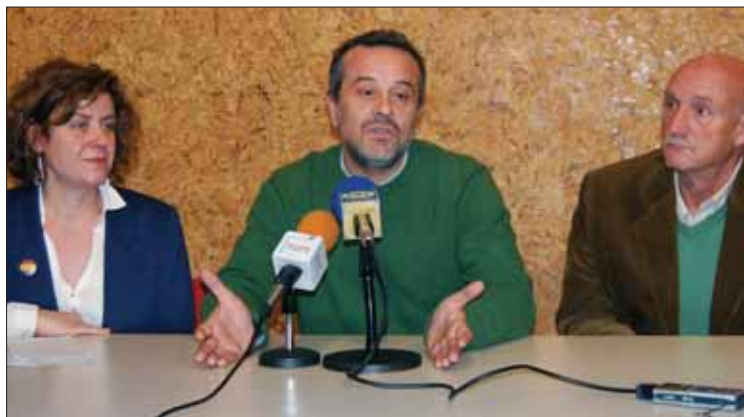
Los dirigentes de IU hablaron del programa andaluz de IU/MM