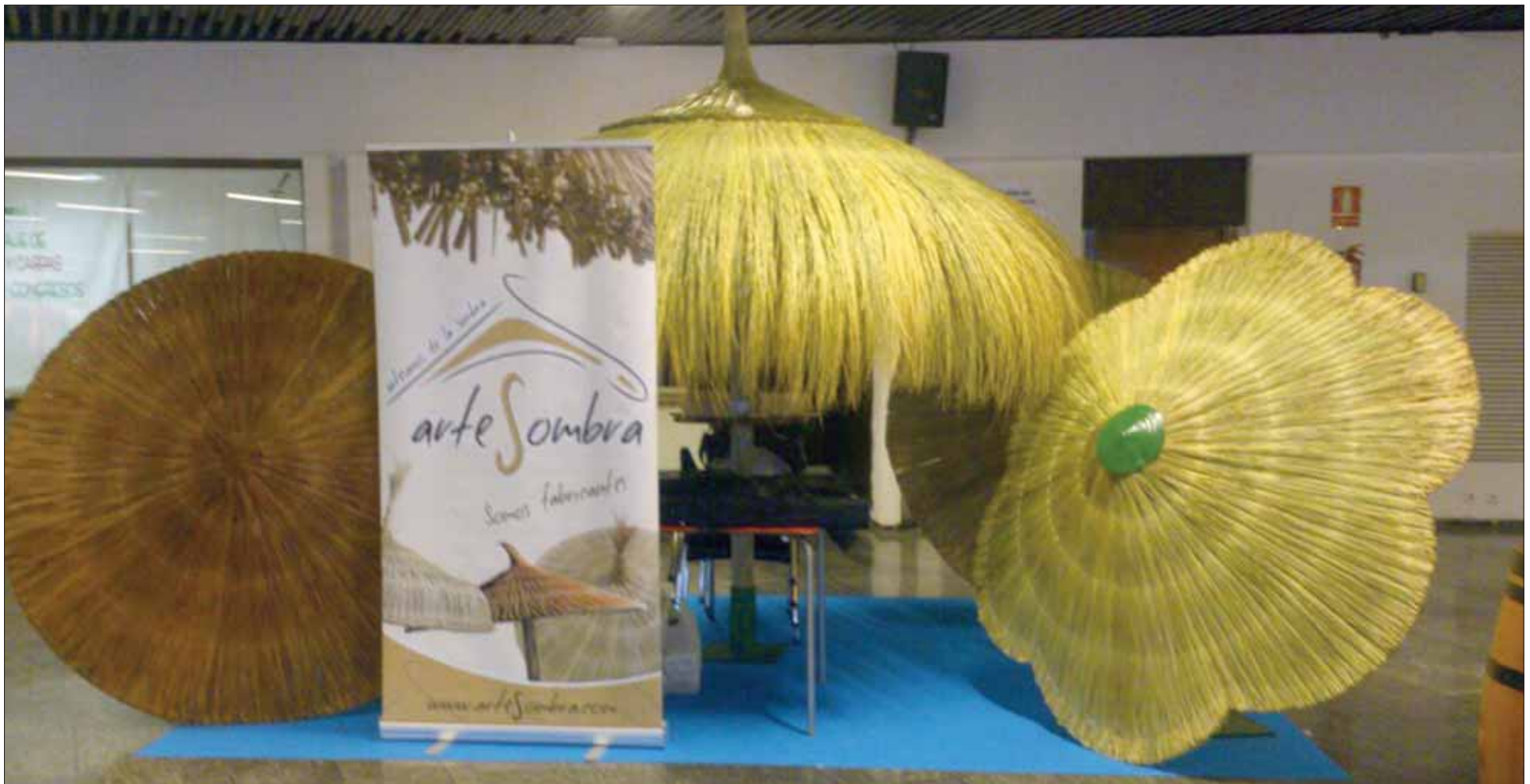
ArteSombra ha estado presente en la feria Expoplaya 2015, que ha tenido lugar en Torremolinos /EC