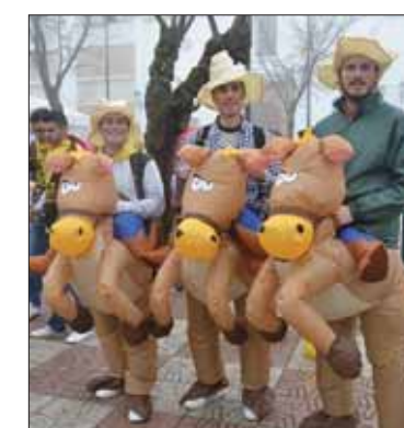
Cabalgando por el Oeste/FP