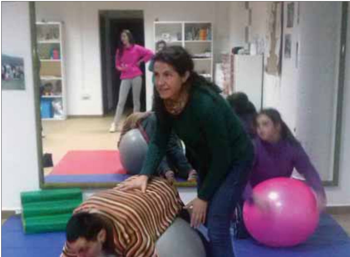
El programa de entretenimiento funcional se imparte en la sede de la asociación/EC

Junto a los proyectos que se mantienen, se va a impulsar un servicio de información y un banco de tiempo