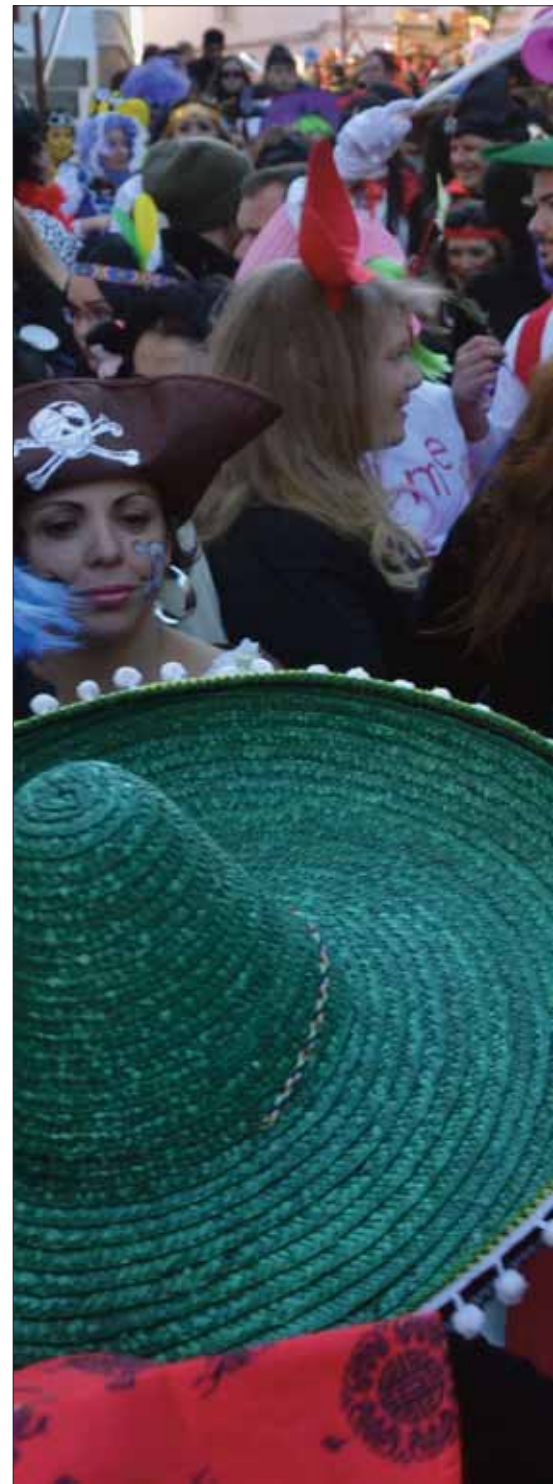
El pasacalles municipal del Domingo de Piñata llenó