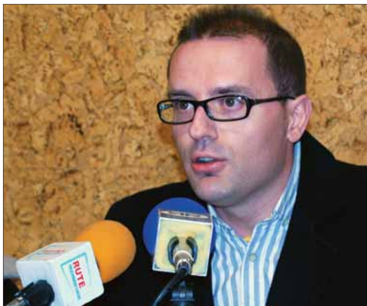
Macías asegura que el PP no puede seguir sacando rédito del asunto

A Macías no le extraña, ha dicho, que quieran seguir "sacando tajada de un asunto que ya ha quedado aclarado judicialmente". Asegura que no han dejado de crear "dudas en todo este asunto, desatendiendo los infor-