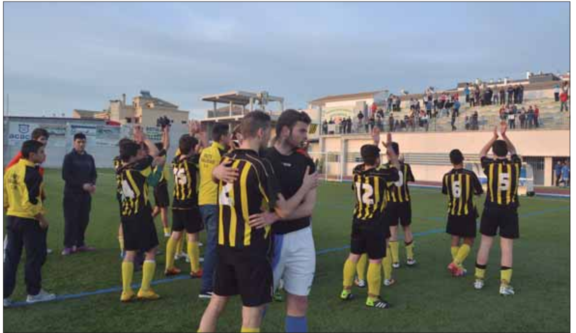
Los ruteños celebran el triunfo ante Villa de Espejo que les asegura el ascenso y les acerca al título

A falta de tres jornadas para el final del campeonato, el Rute Calidad lo tiene todo de cara para ser como mínimo uno de los dos