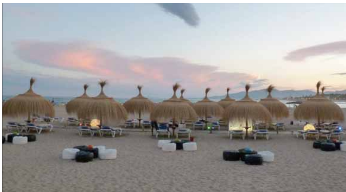
Aspecto de una playa con sombrillas elaboradas con carritx/EC

La decisión que tomaron fue acertada, y se han encontrado con un mercado potencial "increíble". De hecho, no han parado de trabajar desde que empezaron y cada vez cuentan con mayor demanda. Atienden pedidos de Cádiz, Huelva, Málaga, Almería, Granada, Barcelona o Alicante. Entre los trabajos de los que están más satisfechos se incluyen las sombrillas del chiringuito Copacabana Playa, de Torremolinos, o los de la Malagüeta, de Málaga.