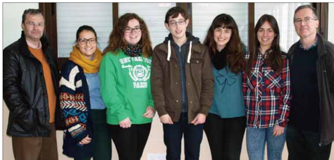
Los profesores junto a los alumnos que van a participar en la fase autonómica/EC

que han realizado los alumnos ruteños son "de gran calidad". Gámez destaca "su alto nivel en la expresión y rigor conceptual". También considera que los trabajos reflejan "un notable grado de madurez y sensibilidad hacia los problemas del ser humano". En definitiva, éstos "son también los problemas tratados por la Filosofía", apunta Gámez.