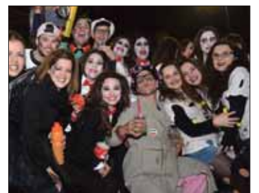
Los adultos también "sufren"/FP