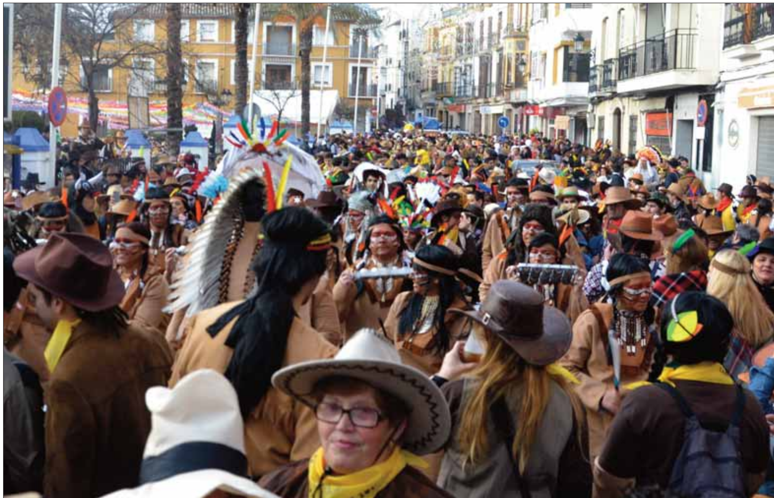
Después de que se aclarara el cielo, la gente del pasacalles del Oeste se pudo reagrupar en el Paseo Francisco Salto/FP