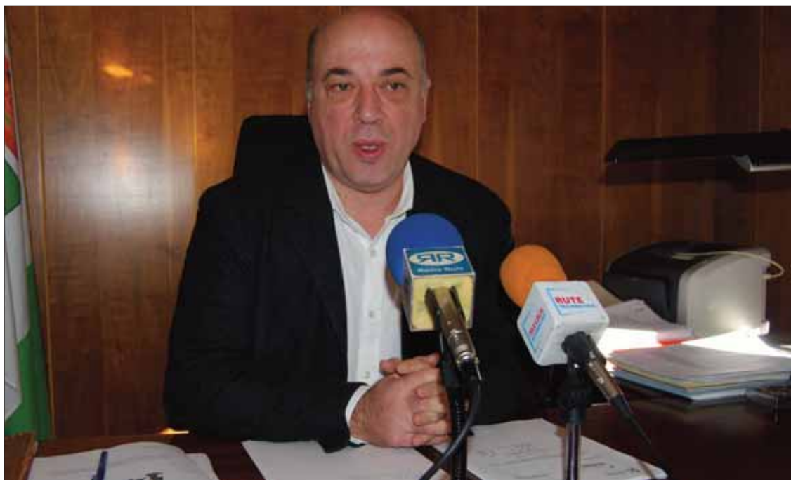
El alcalde ha mostrado su satisfacción y ha dicho que se va a emplear en inversiones para el municipio/MM

En los dos casos el Ministerio de Hacienda exigía la devolución íntegra de las subvenciones: 596.778,44 euros por las obras del