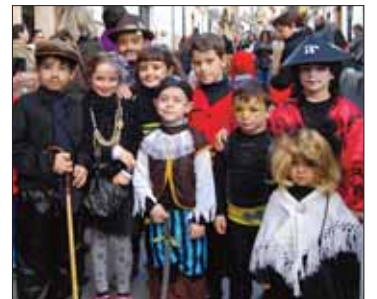
Dolientes de los colegios/MM