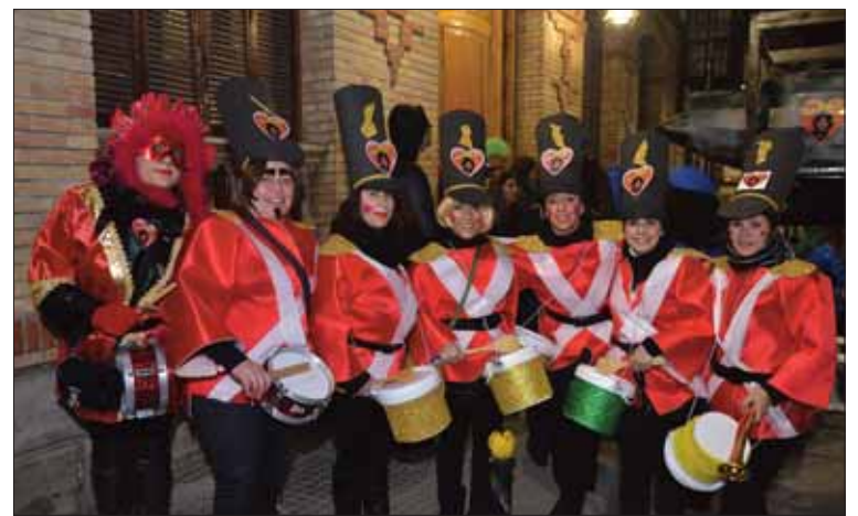
El entierro de la sardina contó con el acompañamiento de una banda