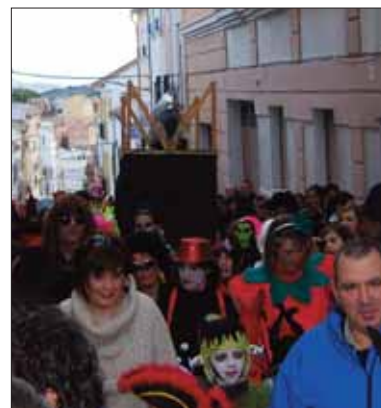
Funeral de la sardinita/MM