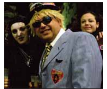
Pegatinas para "La Ponto"/MM