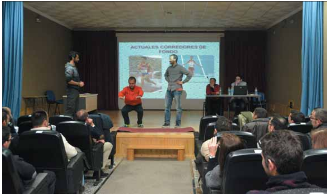
Las ponencias resultaron complementarias y tuvieron una parte práctica e interactiva con el público/FP

entrega se han abordado cuestiones que se influyen entre sí. Miguel Ríos García dejó una frase que resumía la filosofía de estas jornadas: con una preparación