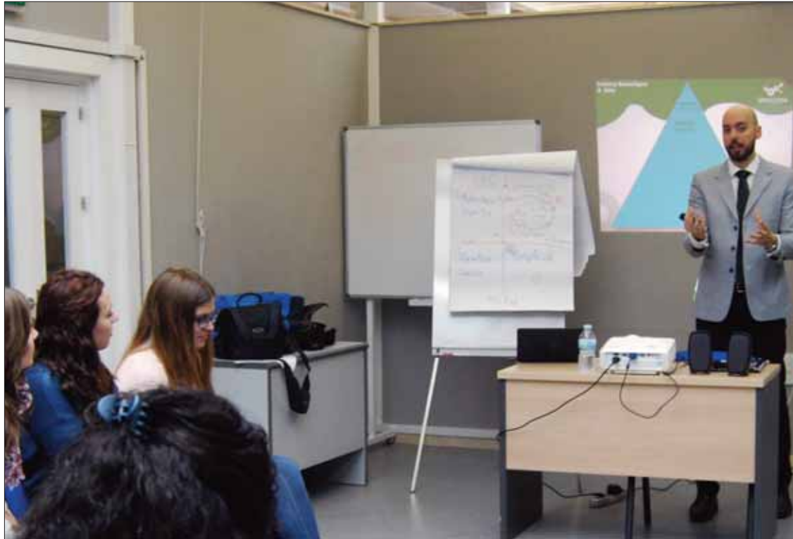
Castillo cree que en la sociedad actual no basta con la formación racional/FP

La idea es enfocarlo a la búsqueda de empleo "en una situa-