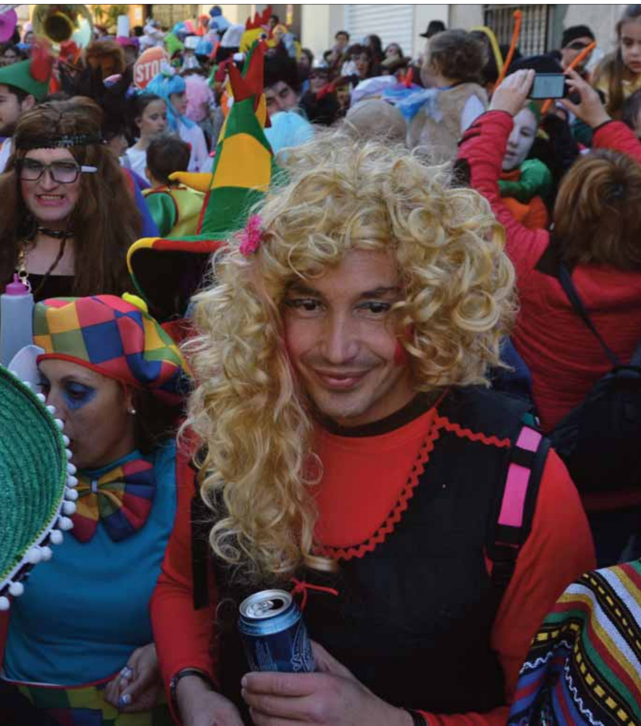
de nuevo las calles de Rute de color e imaginación en los disfraces

tiempo un relevo generacional. Ahora otro grupo de gente ha cogido las riendas para garantizar su continuidad. Hasta hubo en la salida una entrega simbólica de llaves.