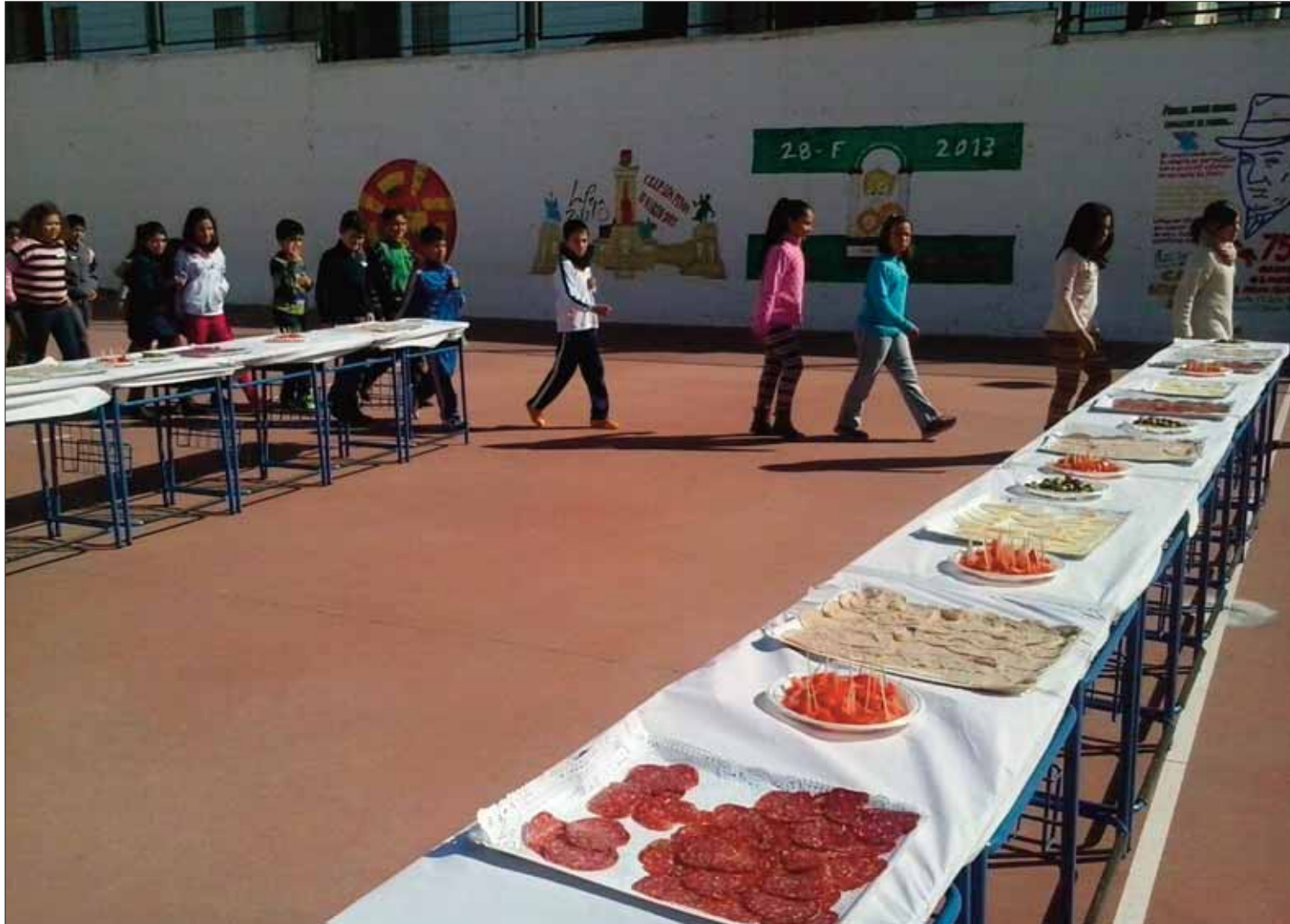
Los escolares volvieron a disfrutar de un desayuno molinero, con pan, aceite, tomate y embutidos

En febrero la actividad de la asociación se centra en sensibilizar y fomentar buenos hábitos alimenticios