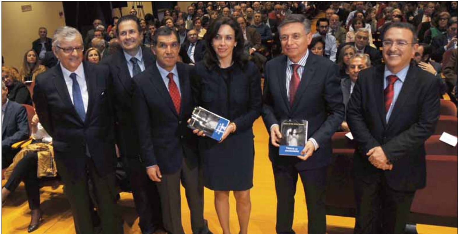
La presentación de “Trece de diciembre” tuvo lugar en el Palacio de la Merced, sede de la Diputación

Es el resultado de la labor de investigación del presidente de la Sección Tercera de la Audiencia Provincial de Córdoba. La obra recoge, a modo de compendio, centenares de voces y usos lingüísticos típicos de la comarca. Se