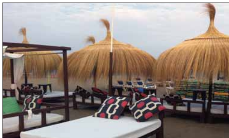
Sombrillas realizadas con carritx una fibra autóctona de Mallorca/EC

En el caso de carritx, estamos ante una fibra vegetal autóctona de Mallorca. Se trata de un material que desde tiempos inmemoriales