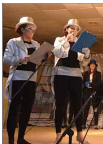
Presentadoras del certamen

Así pues, la siguiente cita llegó el miércoles de ceniza. Primero fue la sardinita de los colegios, por la tarde, y por la noche el turno fue para los adultos.