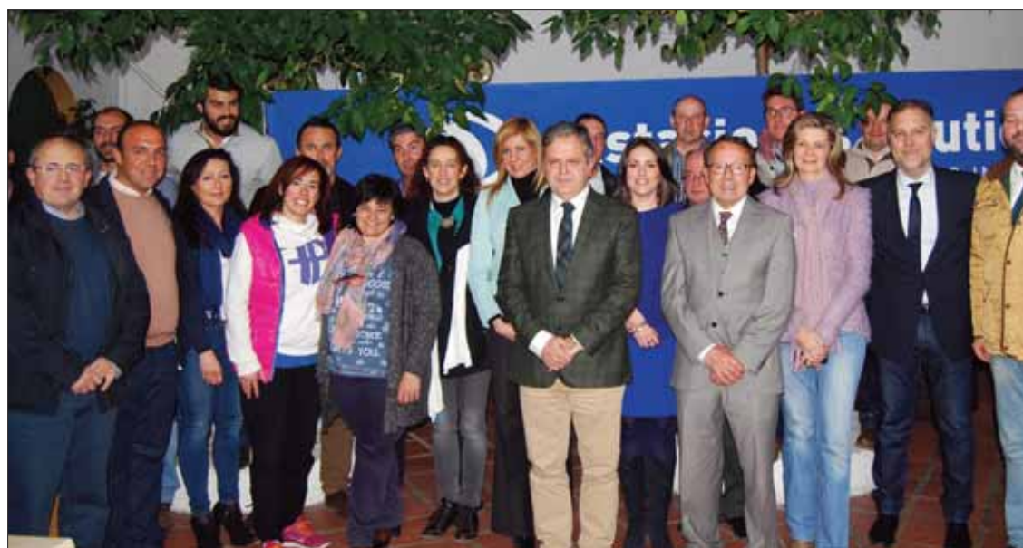
Un nutrido grupo de empresarios de Rute participaron en el encuentro de la Estación Náutica/MM