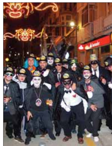
Los nuevos "sepultureros"

Su recuerdo estuvo presente en todo el Carnaval, en los cientos de pegatinas repartidas con su cara y la entrañable frase. Se vieron por primera vez en el certamen. La chirigota "La del 1º B" le dedicó un pasodoble con letra de José Julián Tejero. El momento en que su hija subió al escenario fue, con diferencia, el más emotivo de la velada. Después, "La Ponto" volvió con su