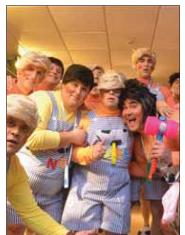
Los niños del Llano/FP