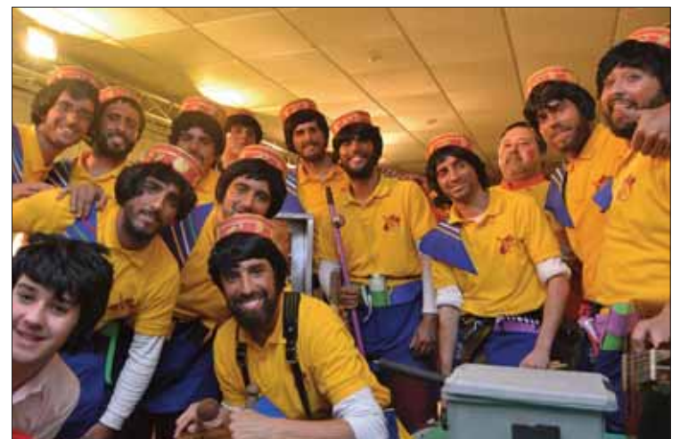
La chirigota “Kebab Almorzar” alcanzó la final en Málaga/FP