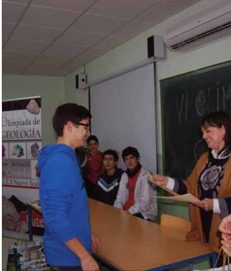
En la fase provincial han participado diecinueve alumnos/MM

Tres alumnos han salido seleccionados para la fase nacional que se celebrará en Alicante, el 21 de marzo. Los tres pertenecen al IES Nuevo Scala. Como primer clasificado ha quedado Anto-