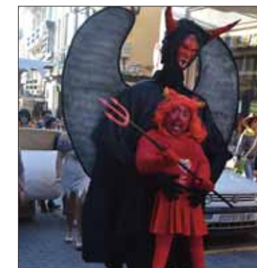
Los demonios en el pasacalles/FP