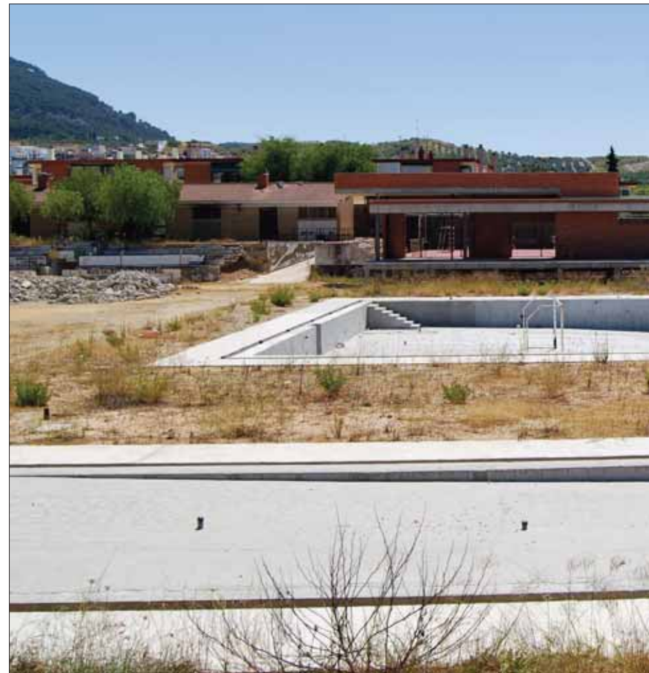
Estado de las obras de la piscina y el Polideportivo municipal tras la fase inicial concluida

En todo este proceso los populares acusan al alcalde de ser el responsable de las dudas y modificaciones que se han planteado en cada momento. Como muestra del “desinterés” del propio alcalde han puesto de manifiesto la no contestación del Ayuntamiento al escrito recibido