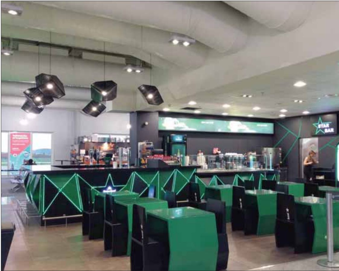
Recientemente han fabricado y montado el mobiliario del aeropuerto de Atenas