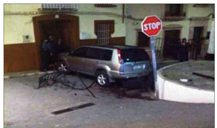
Imagen publicada en las cuentas de la Policía en las redes sociales

De inmediato se personó en la zona la propia Policía Local y la Guardia Civil. Según se apuntó desde las cuentas oficiales de la Policía en las redes sociales Facebook y Twitter, tras la investigación, las primeras conjeturas señalaban como motivo principal el fallo humano, por ingesta de alcohol del conductor. Con todo, y