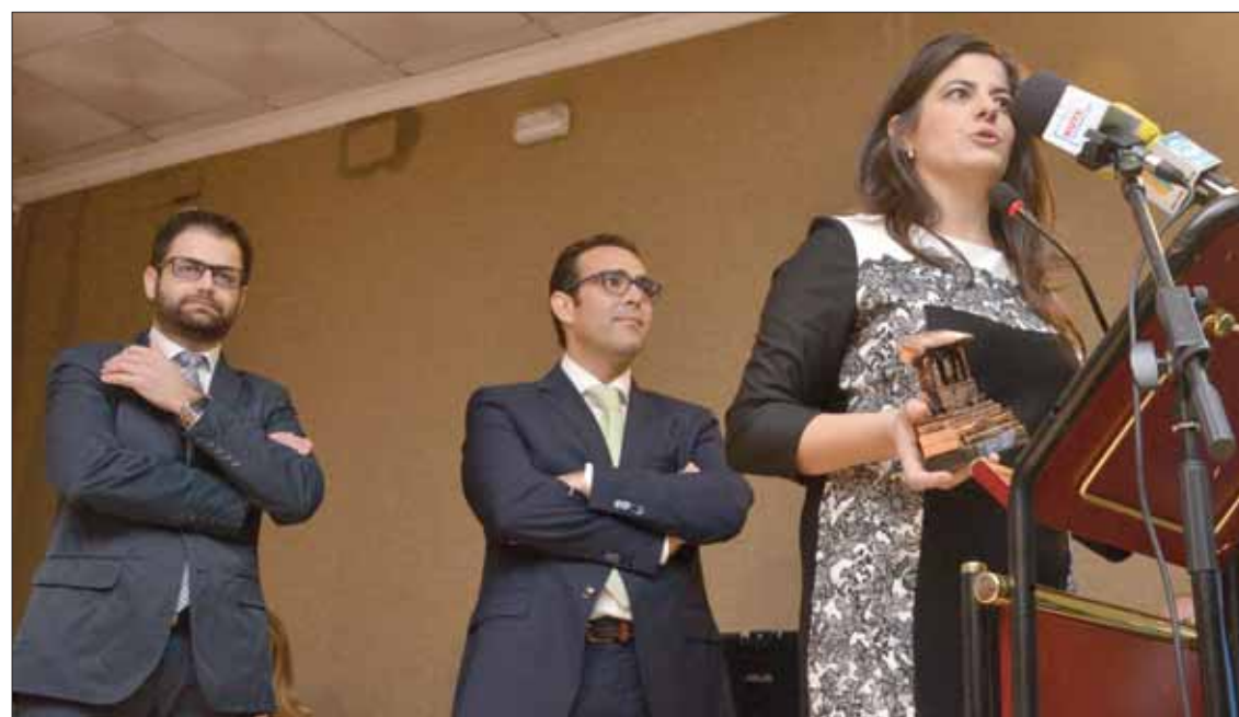
El año pasado fueron reconocidos con el Premio Villa de Rute al Fomento y Desarrollo Empresarial

Han firmado un contrato con una multinacional, filial de Heineken para introducir sus productos