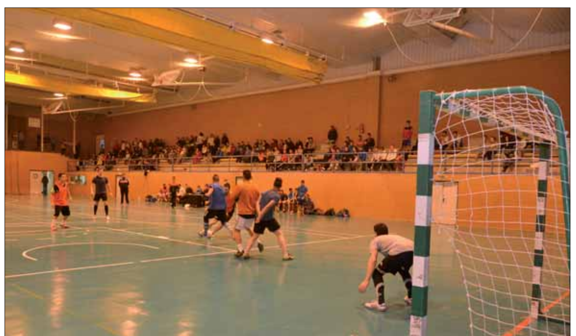
El equipo llamado "Si lo sé no vengo" se alzó con la final absoluta de este maratón/FP

organizadores no pierden de vista que incluso podría haber sido mayor. Pero también hay quienes "desconectan" durante las vacaciones navideñas. En conjunto, el presidente daría una valoración "de 6, de 1 a 10". Ha habido mu-