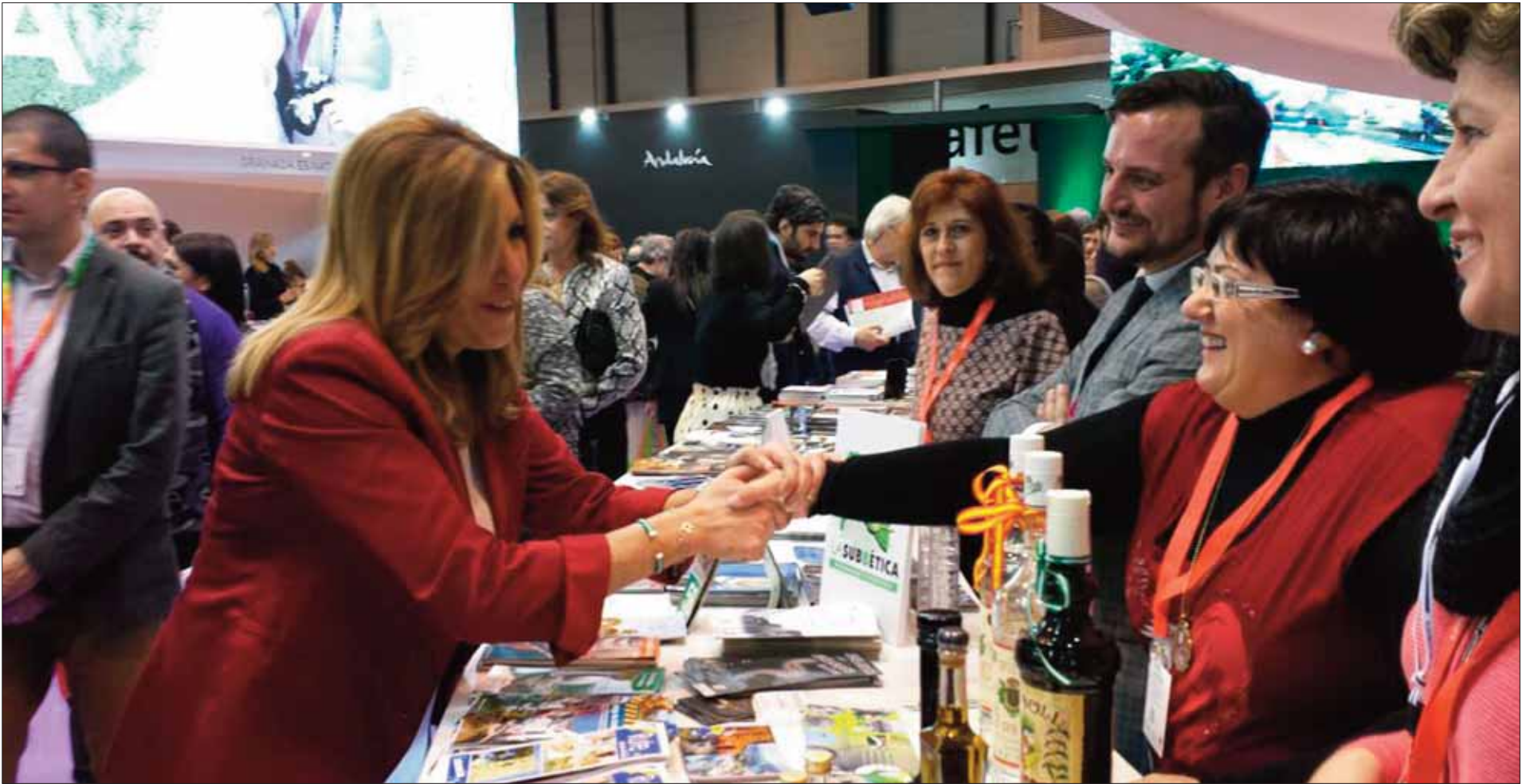
La presidenta de la Junta de Andalucía, Susana Díaz, visitó el stand ruteño en la jornada inaugural de Fitur/EC