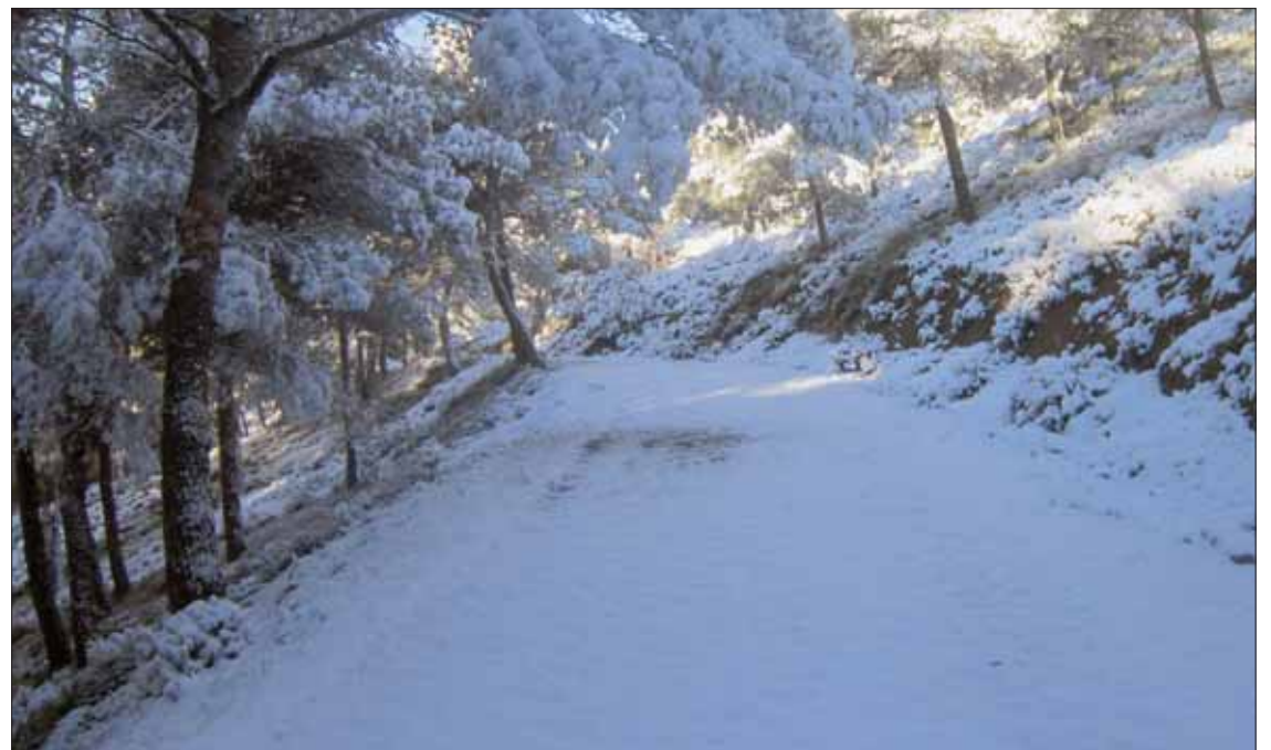
El camino que va desde El Lanchar hacia El Canuto amaneció todo blanco

En Rute no cuajó en el casco urbano. De ahí que muchos no llegaran a verlo, aunque lo sospecharan. Pero sí cuajó, y de qué manera, en la sierra. Cayó en su