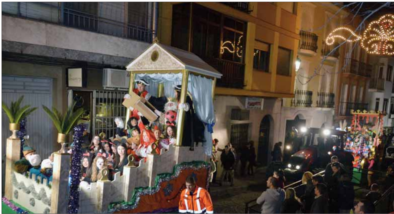
La comitiva desfiló por las calles céntricas de Rute en una cabalgata que se desarrolló sin incidencias

La visita de los Reyes Magos a la residencia y su paseo a pie por las calles fueron los momentos más emotivos