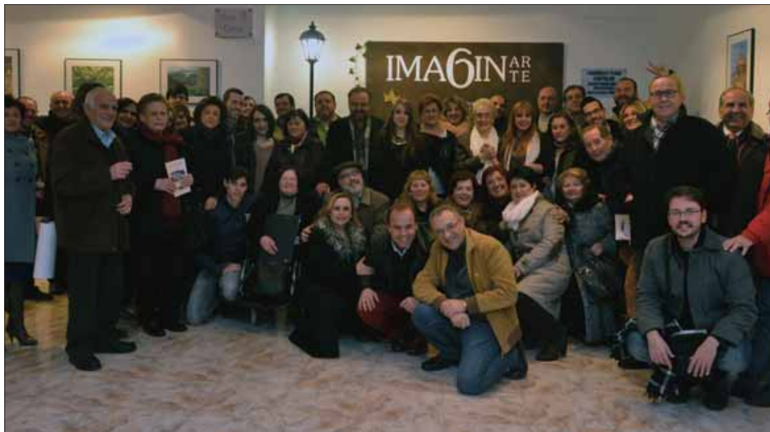
Al término del acto, se procedió a la clausura de Imaginate en la sala de exposiciones/FP

Terminado el acto, los asistentes bajaron a la sala de exposiciones. Allí clausuraron de forma oficial esta edición de Imaginate y compartieron un aperitivo.