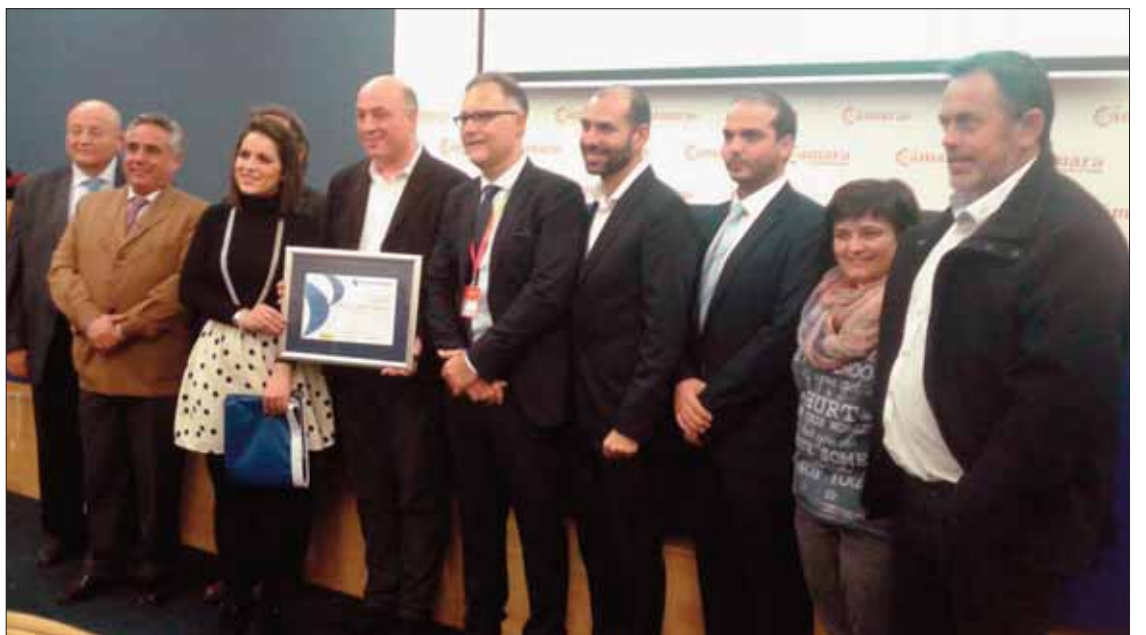
Una de las novedades de esta edición ha sido la presentación de la Estación Náutica de la Subbética/EC

Asimismo, a lo largo de esa mañana se llevaron a cabo degustaciones de todo tipo, productos típicos, como pestiños o anís. Algunas de estas degustaciones corrieron a cargo de Galleros Artesanos, según Rodríguez. Otro aspecto a destacar de la feria son las mesas de trabajo que se establecen entre los diferentes técnicos y empresarios, y los responsables de agencias de trabajo, turoperadores y representantes de empresas de turismo activo y en la natura-