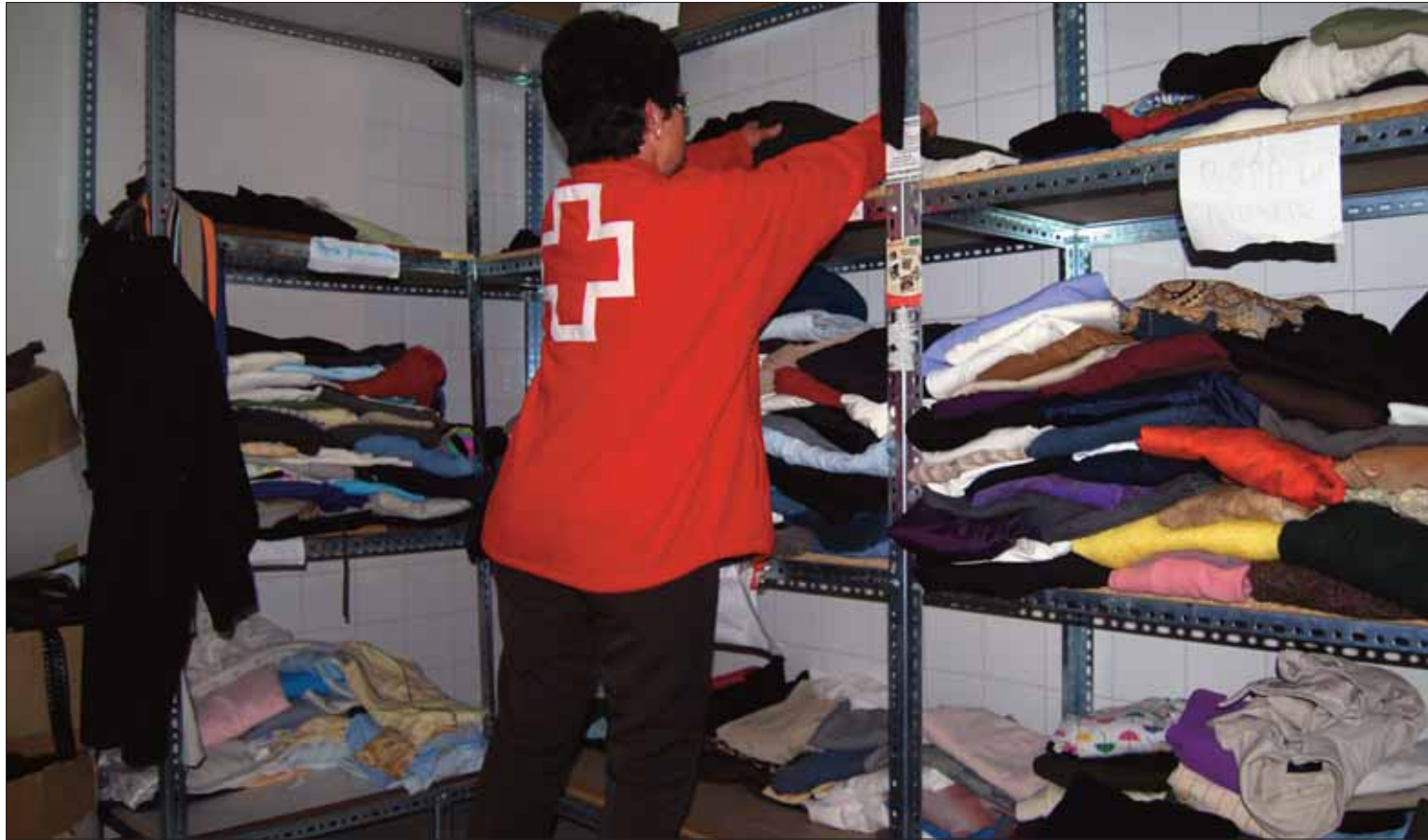
Aunque guardan existencias, el ropero ha mermado y precisa de mantas, chaquetones, jerséis y ropa de niño

La delegación intensifica su actividad en los meses del invierno con el ropero y la atención a gente sin hogar