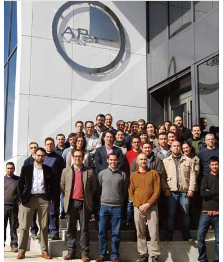
La mayoría de la plantilla atesora un alto grado de cualificación/EC