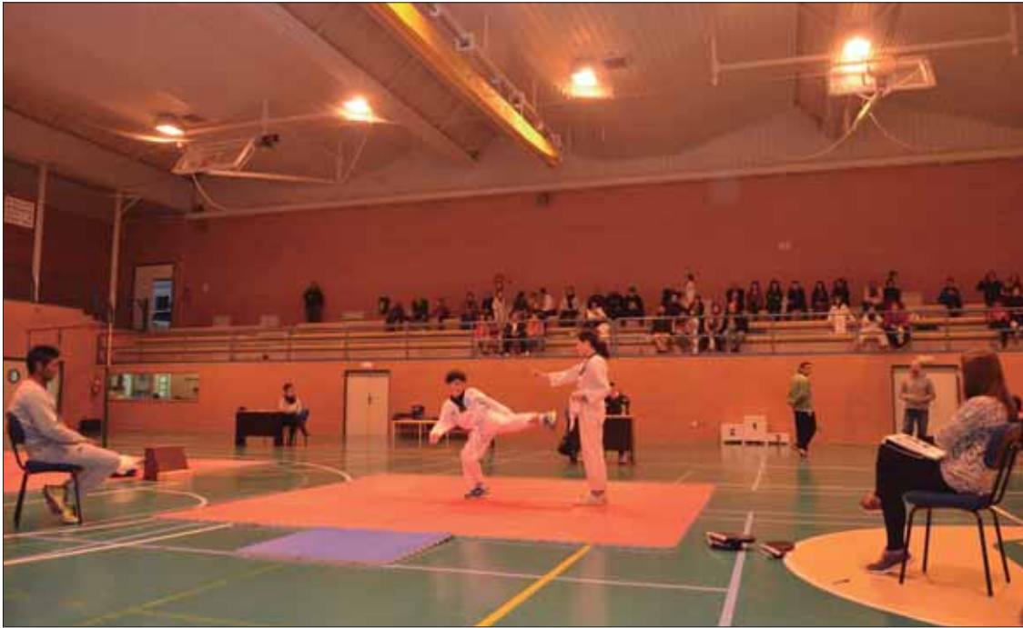
El pentatlón combinó pruebas de fuerza, velocidad, habilidad y destreza adaptadas a las diferentes edades/FP