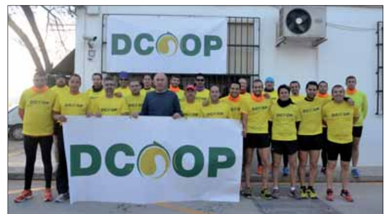
La presentación de las equipaciones tuvo lugar en la Cooperativa/FP