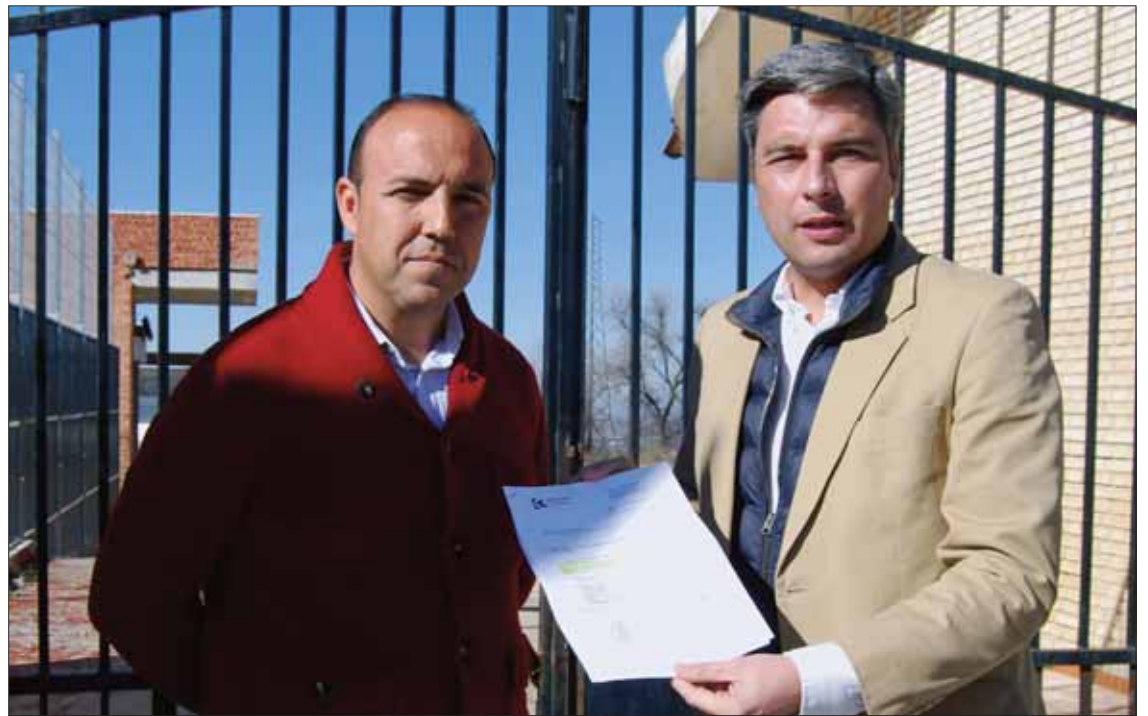
Los populares muestran el último documento remitido al Ayuntamiento respecto a las obras/MM

Aparte de la documentación mostrada, durante la rueda de prensa el alcalde se apoyó en los diferentes artículos publicados en la prensa local. Tirando de hemeroteca, se constata el coste inicial previsto para la segunda fase, de unos seiscientos mil euros. A lo largo de los últimos años, los medios se han hecho eco del reconocimiento de la presidenta de la diputación, María Luisa Ceballos, de cómo la reducción de los fondos de Planes Provinciales afectaban también a las obras de la nueva infraestructura. Igualmente, se ha ido contando el compromiso público de diputados y del propio vicepresidente de la Diputación, Salvador Fuentes, en varios actos y eventos, de aportar fondos extras para culminar las