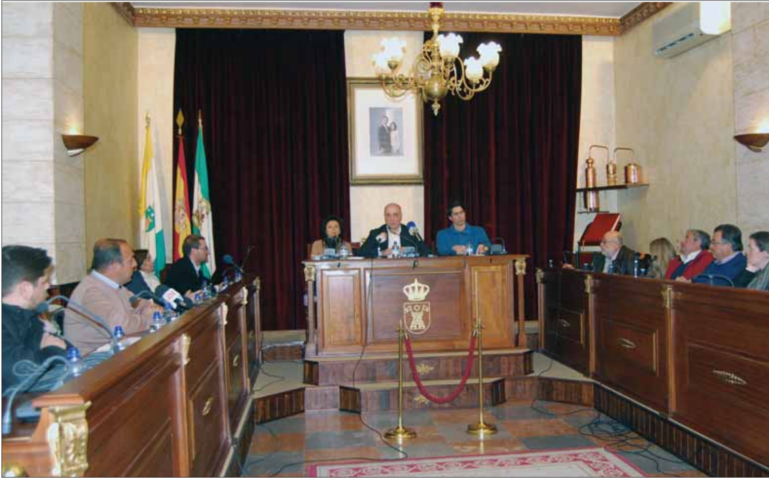
En el primer pleno ordinario del año se respiró el ambiente preelectoral que va a marcar la actividad política en los próximos meses/MM