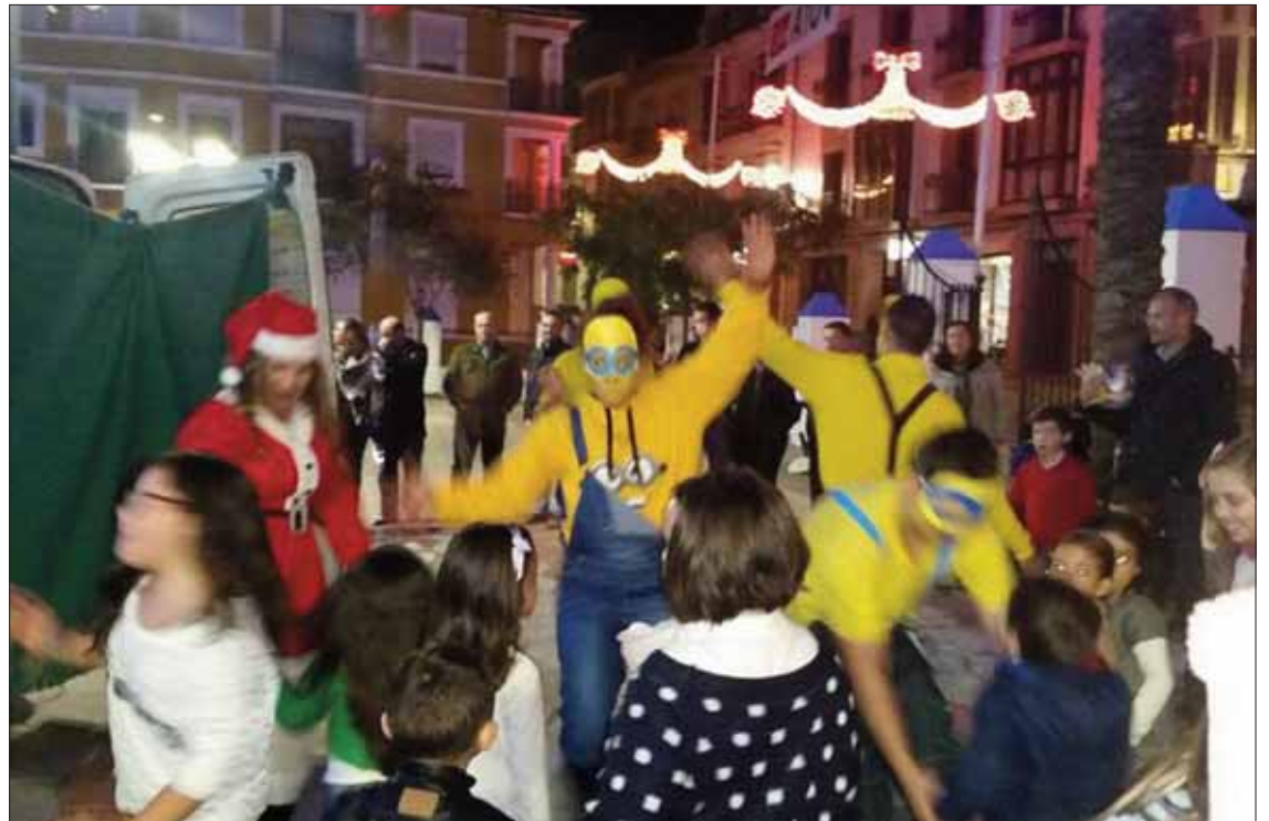
Las actividades de animación se llevan a cabo en el paseo Francisco Salto/EC

cios de Rute están abriendo sus establecimientos en horario de mañana y tarde.