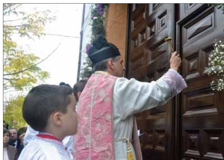
Apertura de la Puerta de la Misericordia

ese mes se acordó nombrar a la parroquia de San Francisco santuario jubilar del Año de la Misericordia”.