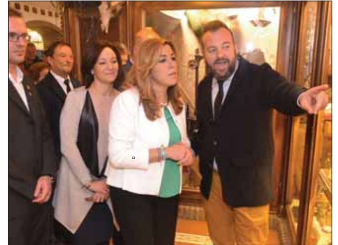
La presidenta dejó su recuerdo en los libros de firmas del Museo del Anís y visitó sus instalaciones