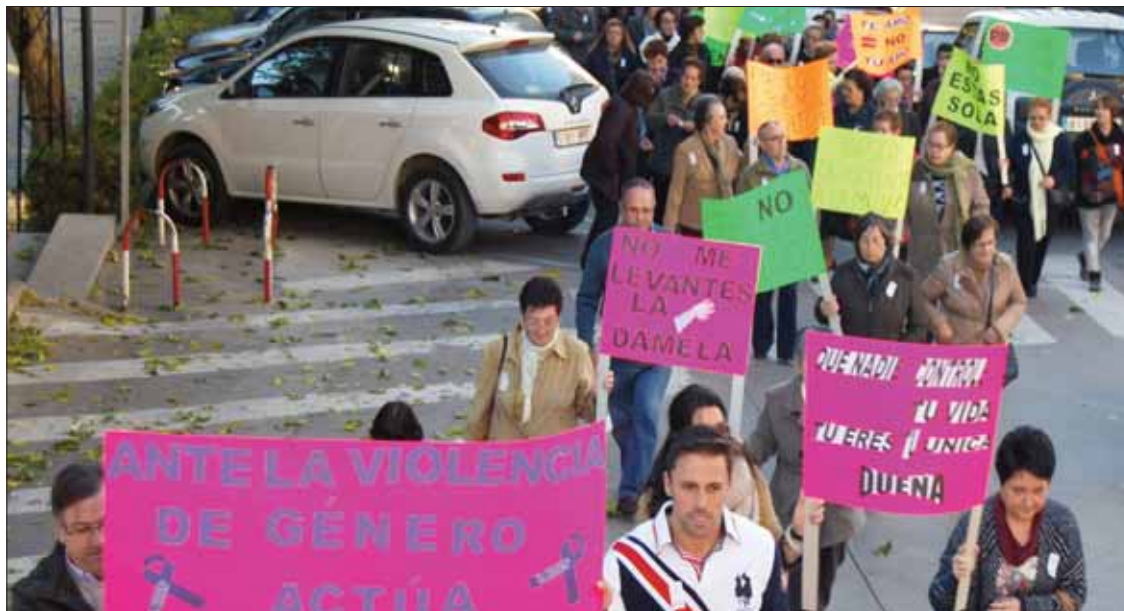
Profesores y alumnos del centro de adultos también recorrieron las calles de Rute/MM

gramado en los días previos, "como se hace todos los años llegada esta fecha". Martínez reconoció que es un tema "doloroso" al abordarlo en clase: hay alumnas que, si no lo han sufrido directamente, sí lo han visto de cerca en familiares.