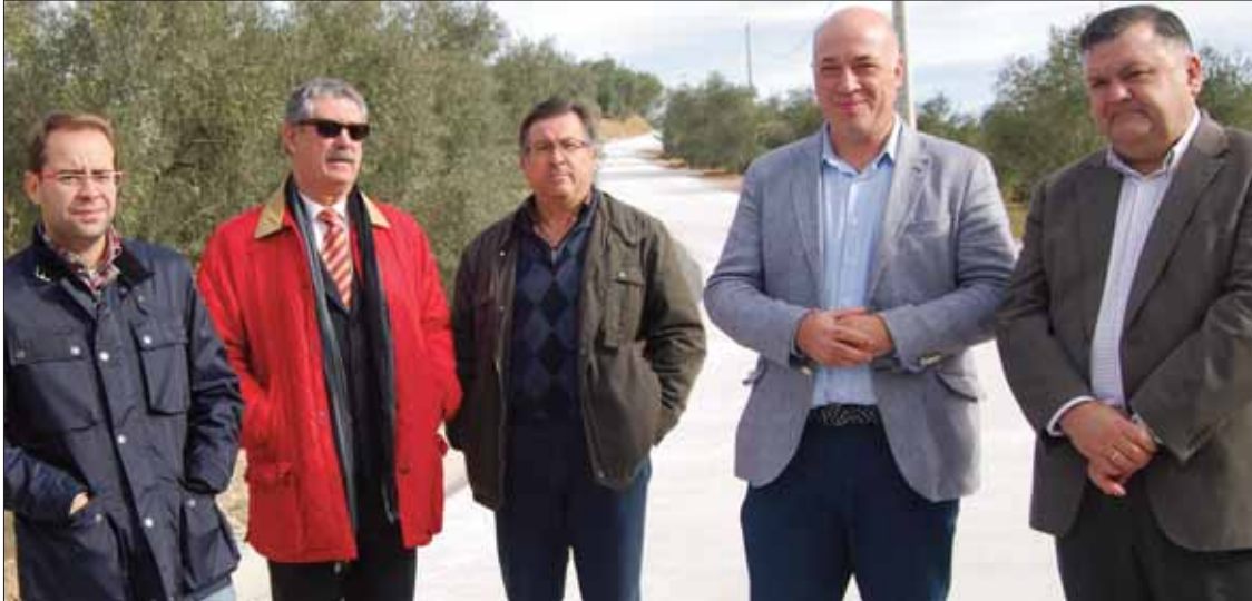
El delegado de agricultura, junto a los técnicos y los representantes municipales/MM

El camino da acceso a unas doscientas parcelas de pequeños propietarios