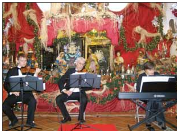
El trío estaba formado por dos violinistas y una pianista/MM