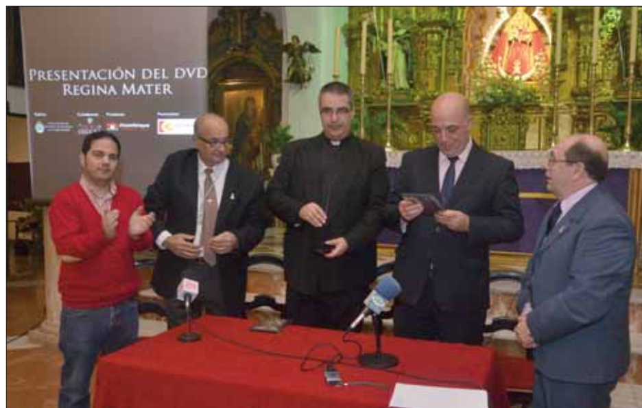
El alcalde y el párroco de San Francisco fueron obsequiados con sendos ejemplares del DVD/FP

El primero resume los cultos y actos celebrados en honor a la Morenita en la parroquia de San Andrés, de la capital. El segundo recopila los momentos más entrañables del recorrido por las calles cordobesas y la Magna celebrada en la Mezquita-Catedral. En el tercero, se muestra la solemne función religiosa oficiada en Santa Catalina al día siguiente. Y el cuarto y último recoge el traslado extraordinario desde Santa