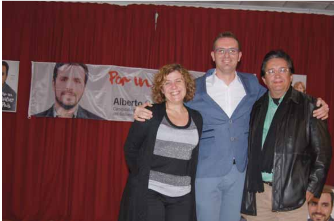
El ginecólogo ilustró a los jóvenes con una serie de diapositivas los tabúes que hay en torno a la sexualidad

Consideran que esta campaña electoral se está banalizando y olvidándose los casos de corrupción