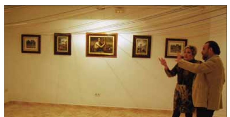
La autora combina diversas temáticas en sus recreaciones

La autora parte de un programa de ordenador, que descompone los cuadros originales. Se inició en esta afición en 1996 y trabaja con infinidad de hilos y miles de puntadas. Cada cuadro requiere su tiempo en función de ello. Algunos, pese a ser en blanco y negro, son "muy complicados", por la gama de grises que encierran.