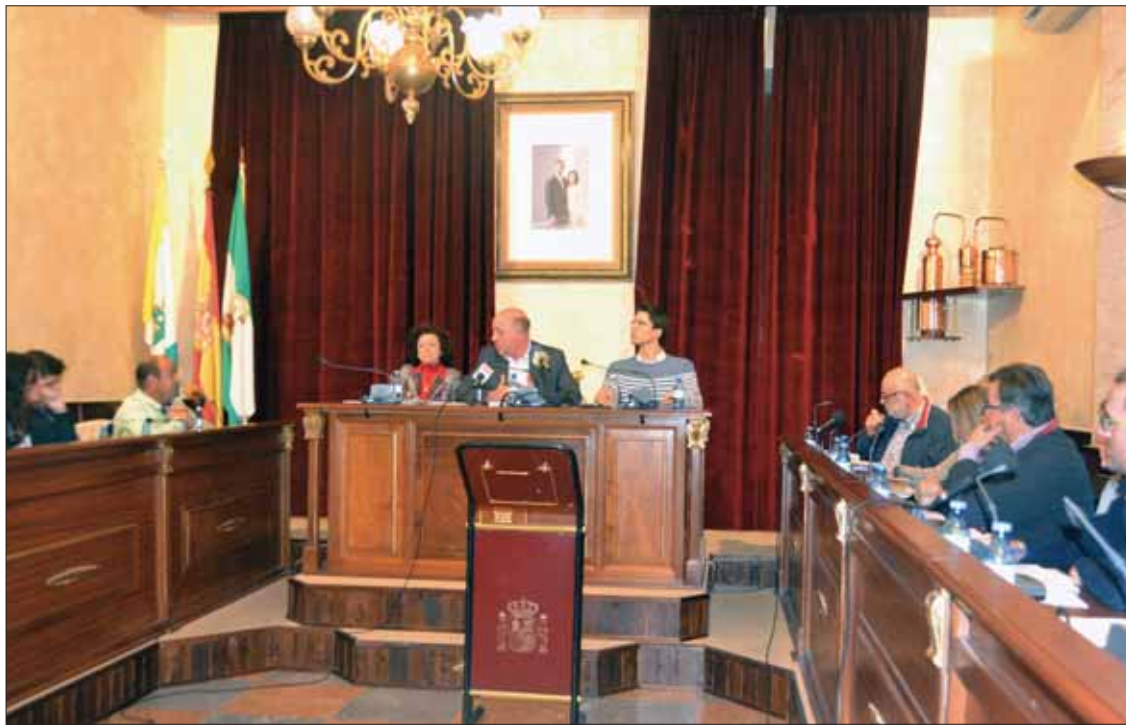
Los presupuestos contaron con el voto favorable de PSOE e IU y en contra del PP/MM

Estos presupuestos son los primeros tras un período, el anterior mandato, marcado por el plan de ajuste municipal, los recortes a los empleados públicos, la contención del gasto y los despidos. Por primera vez en cinco años las cuentas presentan superávit, bajo la gestión del equipo de Gobierno socialista, con Anto-