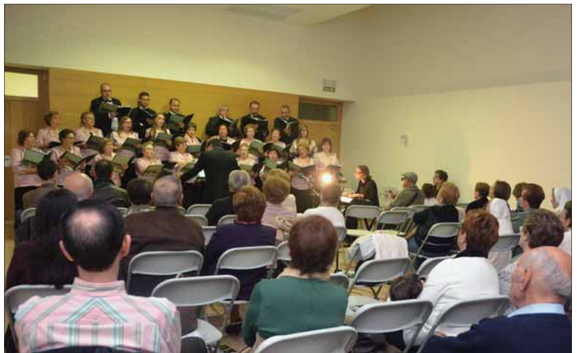
La coral Bel Canto ofreció su concierto en el edificio cultural de la calle Fresno/FP