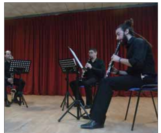
Los jóvenes intérpretes ruteños cerraron el ciclo/FP