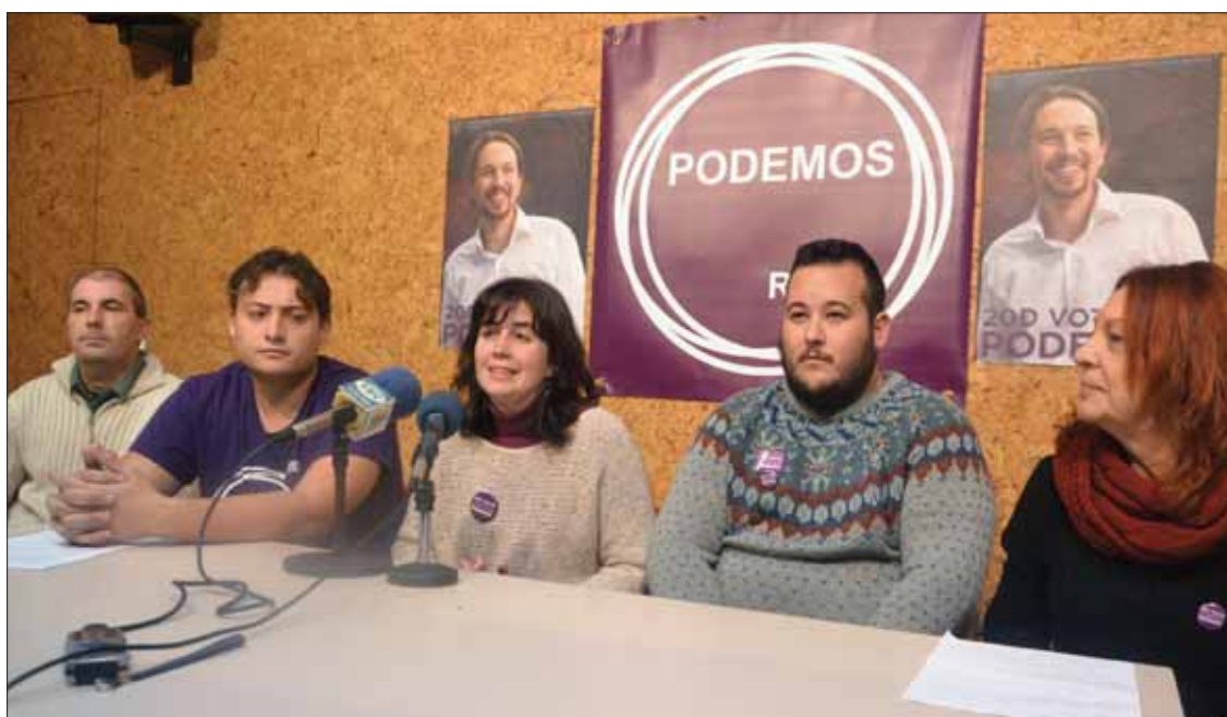
Antes de acudir al Fresno, los representantes locales y provinciales de Podemos atendieron a los medios