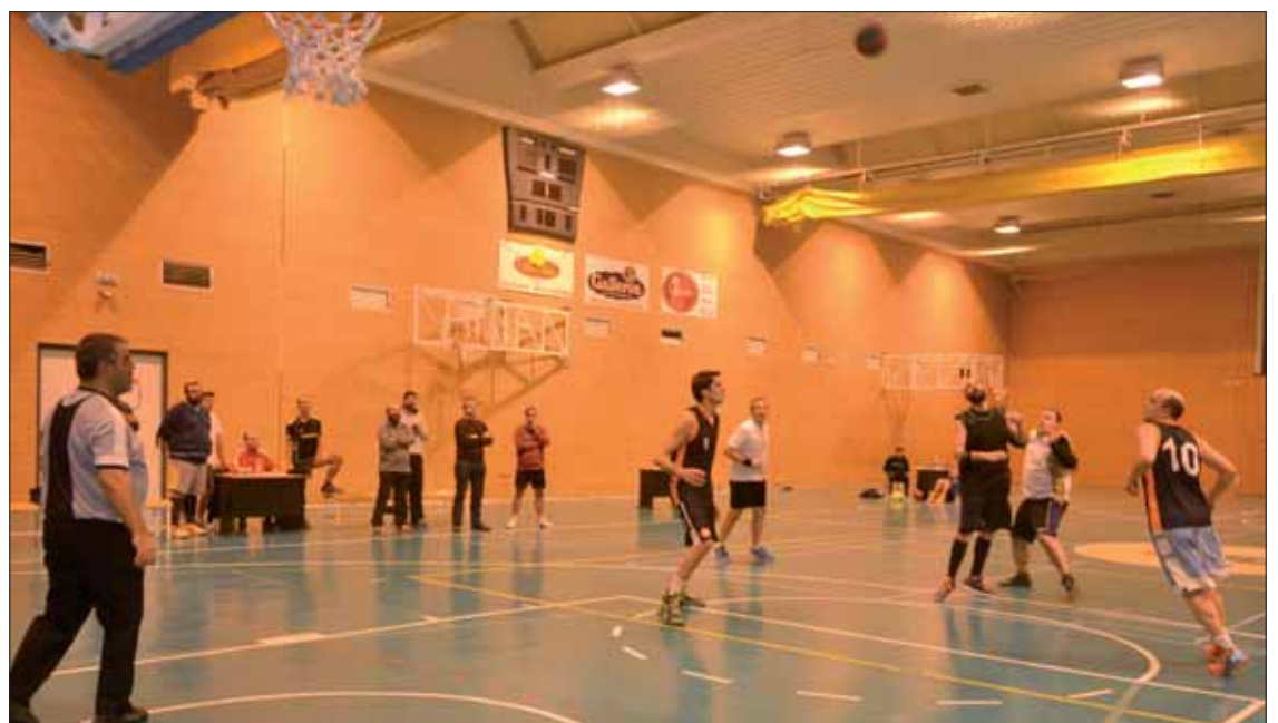
El combinado denominado “Dream Boquerones Team” se impuso en la final al de “Proyectados”