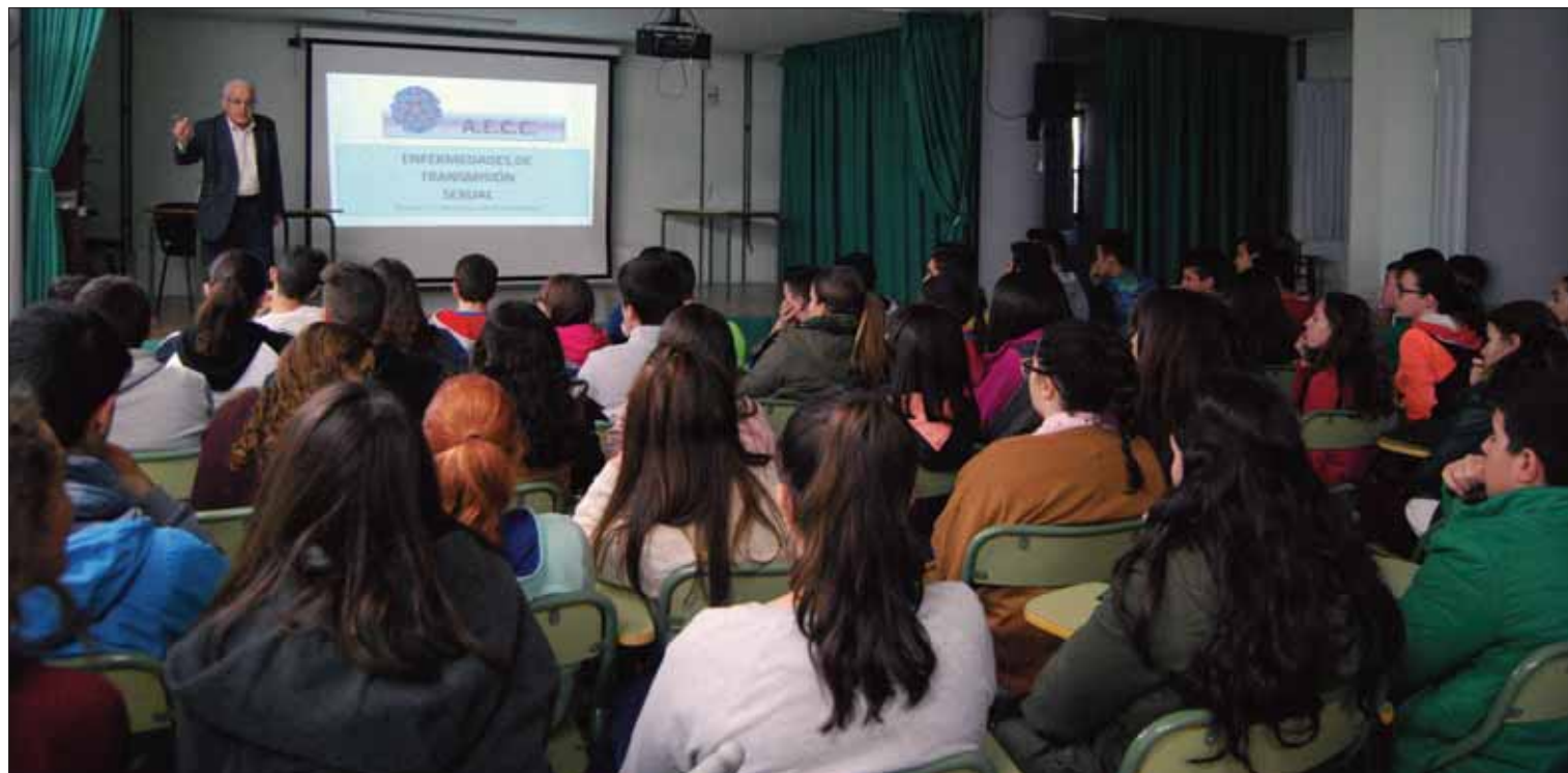
El ginecólogo ilustró a los jóvenes con una serie de diapositivas los tabúes que hay en torno a la sexualidad

La charla estaba promovida por la Junta Local de la AECC tras una propuesta del propio ginecólogo