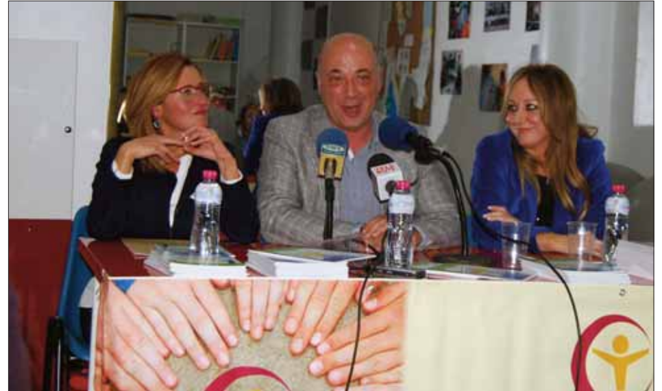
La presidenta, el alcalde y la responsable del prólogo en la presentación del libro/MM