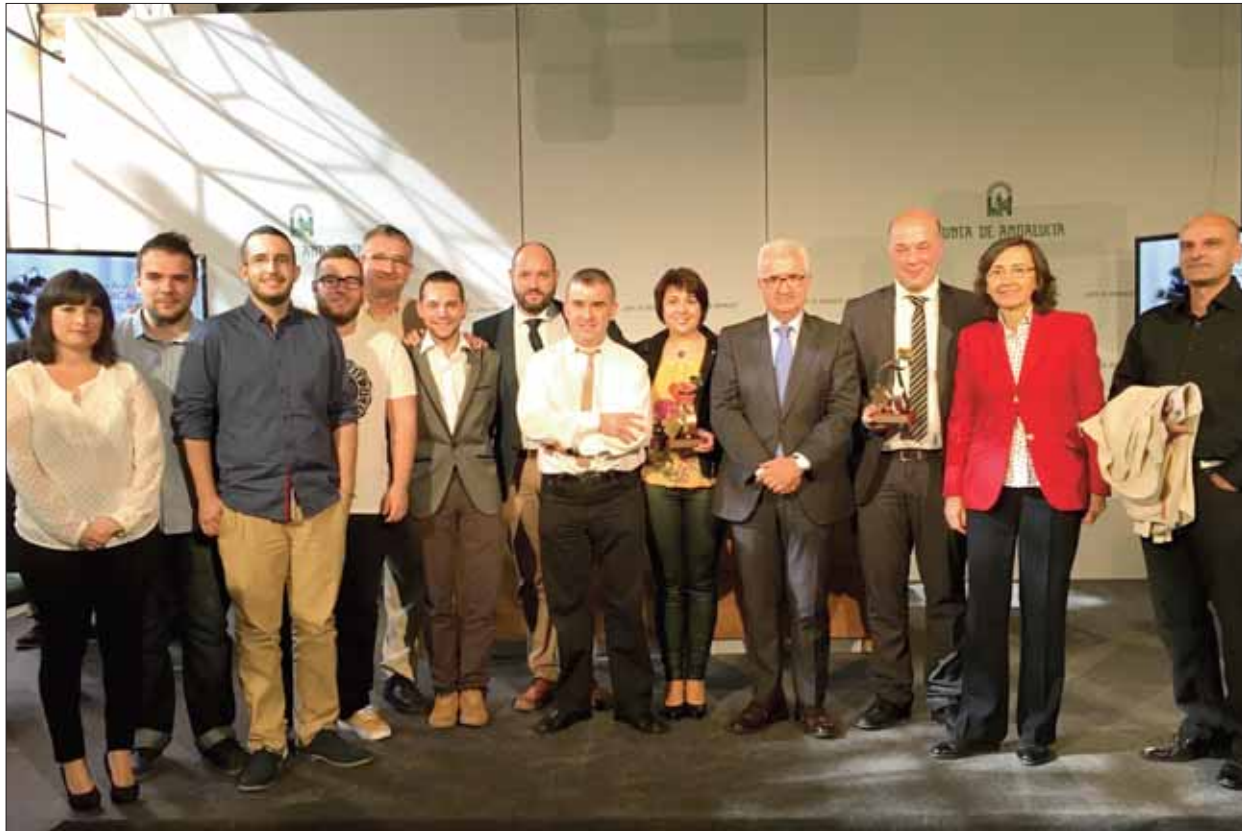
Los colaboradores de la emisora para el especial de las elecciones no faltaron a la entrega de premios/EC

Dos de los siete premios que había para toda Andalucía han correspondido a Radio Rute. En la categoría de Premio al Informativo de Radio Local, Radio Rute ha sido distinguida por su despliegue en el programa "Especial Elecciones Municipales" emitido en vivo con motivo del seguimiento de la jornada electoral en las municipales del 24 de mayo. En cuanto a Premio a la