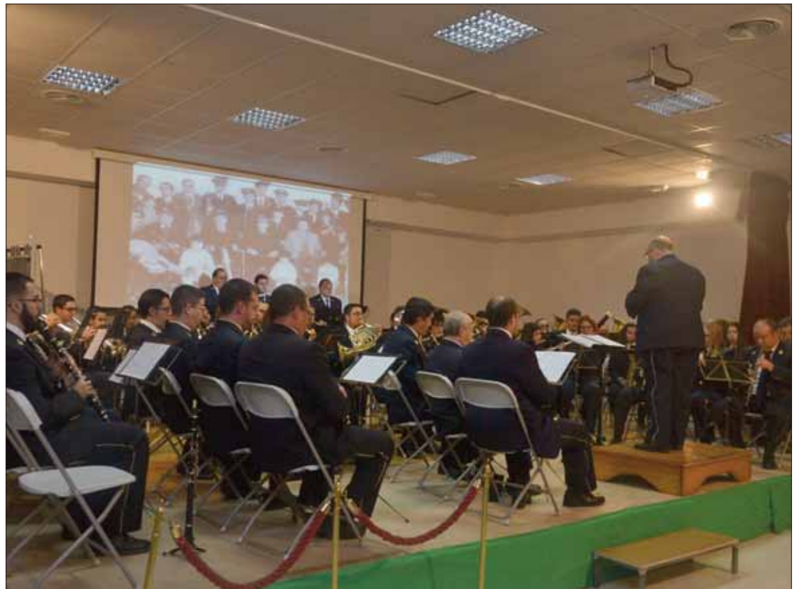
La Banda Municipal dedicó su actuación a Santa Cecilia, patrona de la música

El ciclo arrancó con la actuación de un trío del conjunto Cámara Rusia. La agrupación cuenta con músicos de alto nivel y con una trayectoria profesional reconocida. No en vano, han actuado en los auditorios y teatros más prestigiosos de España y Europa. En concreto, a Rute vino un trío conformado por dos violinistas,