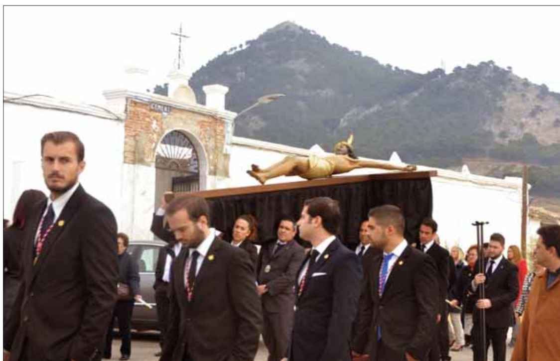
El primer acto fue una procesión extraordinaria del Cristo de la Misericordia hasta el cementerio

Tras una elección inicial de nueve puntos, y en vista de la devoción que hay en Rute por la Virgen de la Cabeza y el Cristo de la Misericordia, el día 20 de