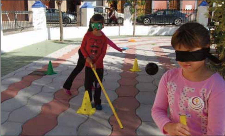
"Ponte en mi piel" incluyó actividades adaptadas a las necesidades motrices de los niños/MM

Destacan la denominada "Ponte en mi Piel" y la publicación del libro "Donde la ilusión nos lleve"