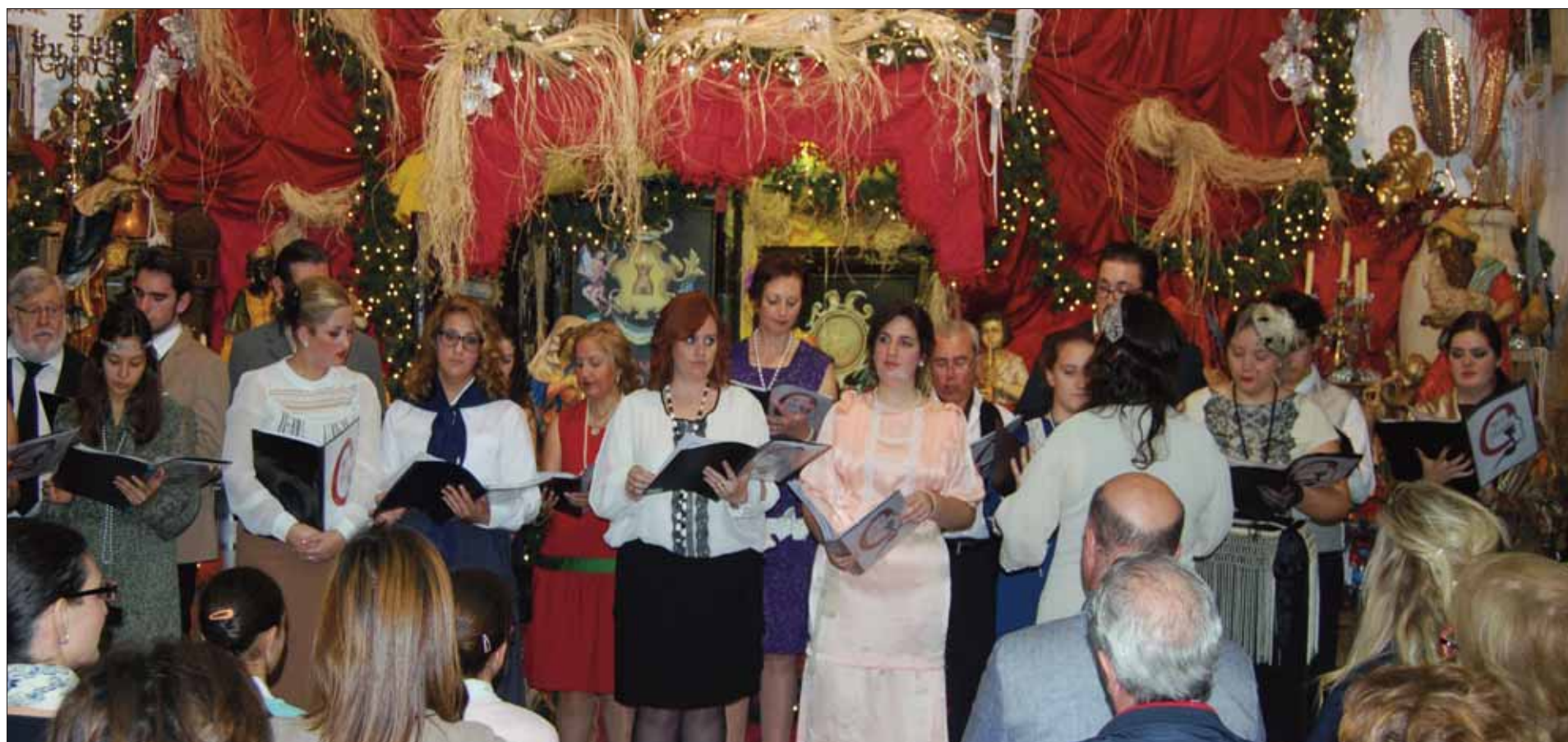
Durante la jornada se contó con la actuación del Coro Art Musicae con las intérpretes ataviadas de época para ilustrar un reencuentro con nuestro pasado/MM