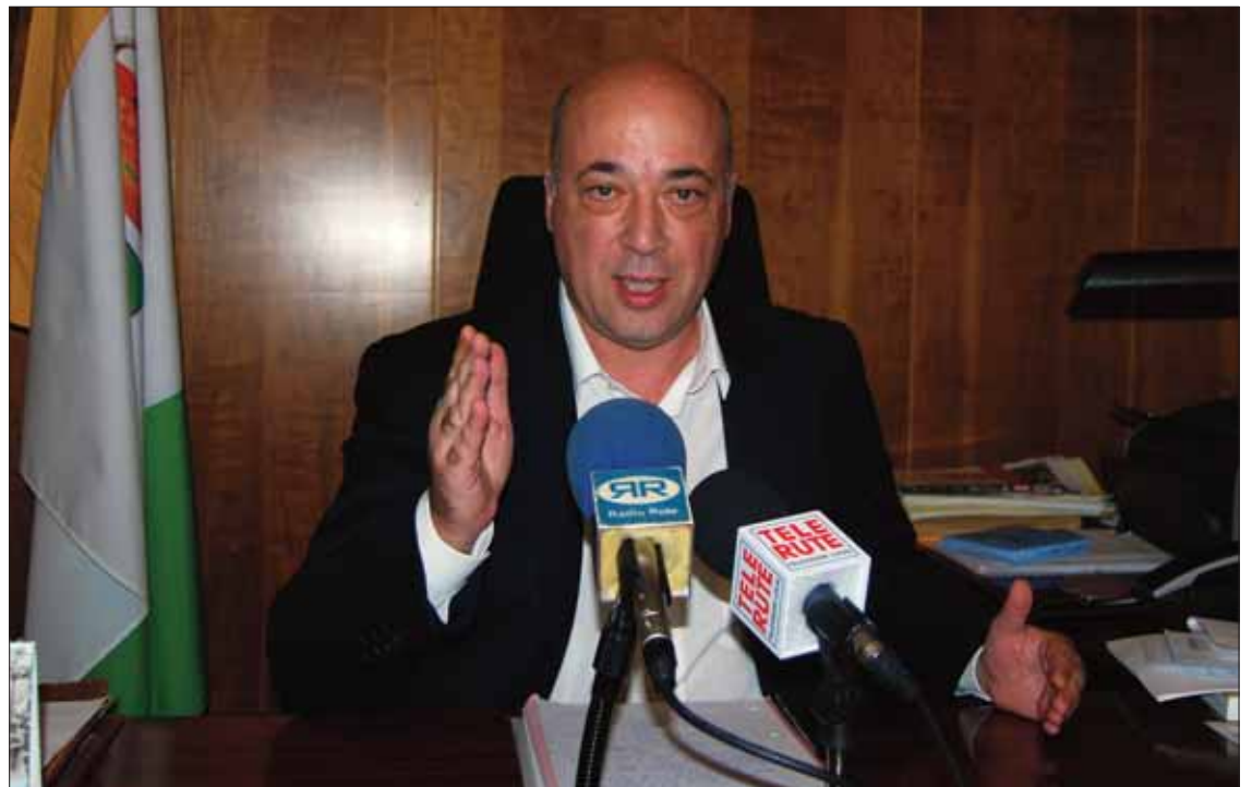
Ruiz ha destacado la diferencia entre sólo poder afrontar pagos imprescindibles e invertir en el pueblo/MM

Independientemente de la situación económica y financiera del Consistorio, otra de las cuestiones que para el alcalde ruteño ha sido una prioridad es que di-