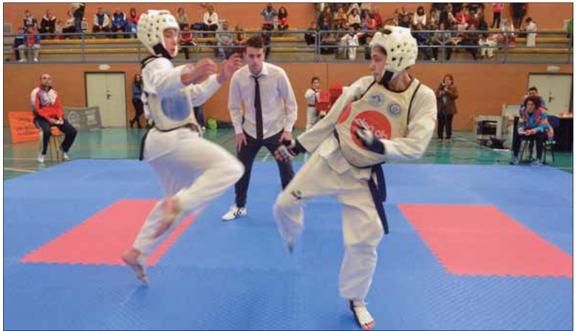
A diferencia del pentatlón local, en este torneo se ha centrado en la vertiente competitiva del taekwondo/FP

El entrenador la estima en torno a los cuarenta y cinco menores, casi la totalidad de los del club. Una tercera parte competían por primera vez, lo cual ratifica la finalidad de organizar este