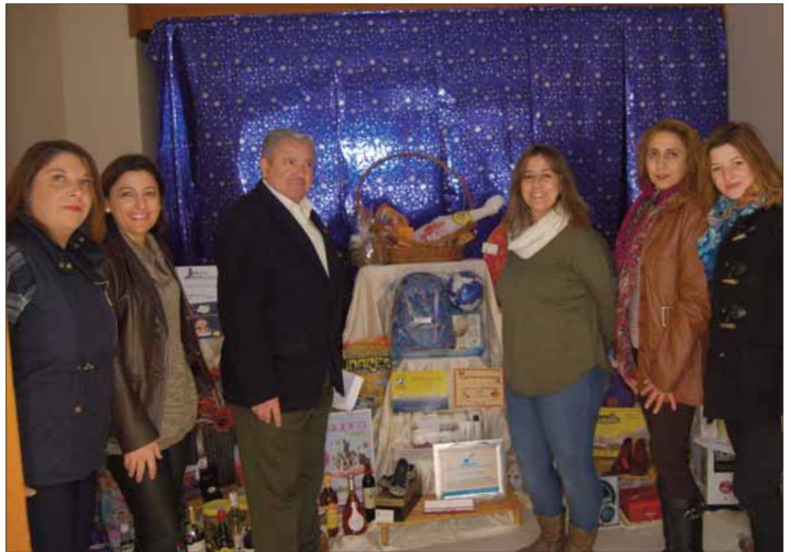
Los comerciantes junto al concejal de Festejos presentan la gran cesta que se sorteará el 5 de enero

Para el 2 de enero se ha programado la visita al Paseo Francisco Salto de Papá Noel y la de los pajes reales. Estos recogerán las cartas que los niños de Rute quieren entregarles para los Reyes Magos. También durante todos los sábados de diciembre los comer-