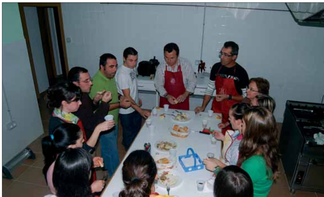
Después de elaborar ellos mismos los platos, los alumnos son los encargados de probarlos/FP

Éste se lleva a cabo en turno de tarde, porque está pensado para gente que está trabajando. Pero la monitora lo ha destacado porque hay muchos hombres apuntados. No se guarda la misma proporción en todos los turnos, pero siempre es reseña-