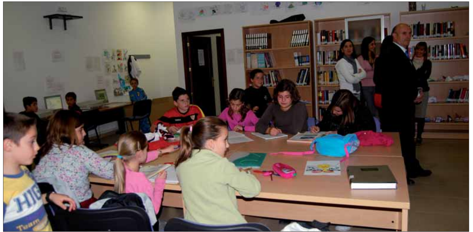
El alcalde y la concejala de Cultura visitan la nueva biblioteca de Zambra