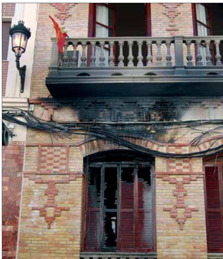
Vista de la fachada principal del Círculo de Rute

Uno de los directivos del Círculo de Rute, Manuel Córdoba, se personó en el lugar tan pronto como tuvo conocimiento de los hechos. Según ha relatado, parece ser que todo se debió a la explosión ocasionada por uno de los cables de la fachada. No obstante, el hecho de que en la misma calle, tan sólo unos metros más arriba, se prendiese fuego a un contenedor, también hace barajar la posibilidad de que hubiese sido intencionado.