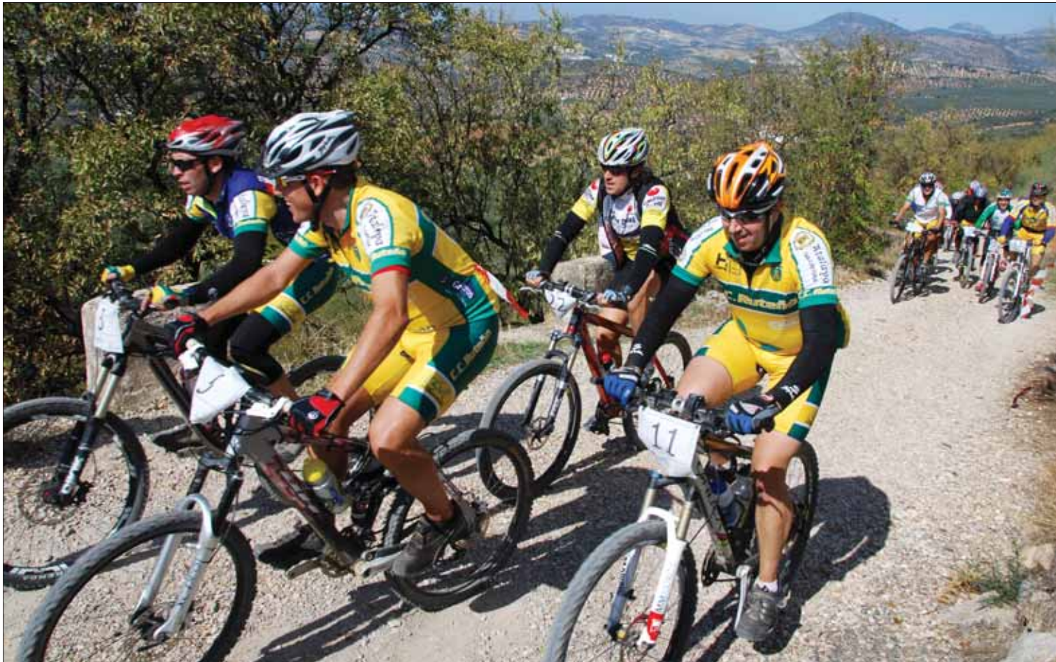
Tras un avituallamiento en Palomares, en la zona de Los Chopos se habilitó el único tramo cronometrado a modo de competición/FP

La ruta combinó tramos de carretera y campo a través, e incluyó la subida al Puerto del Cerezo