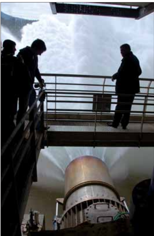
Una de las siete esclusas de la presa

La sentencia obliga a las eléctricas a abonar a los ayuntamientos 200 millones de euros