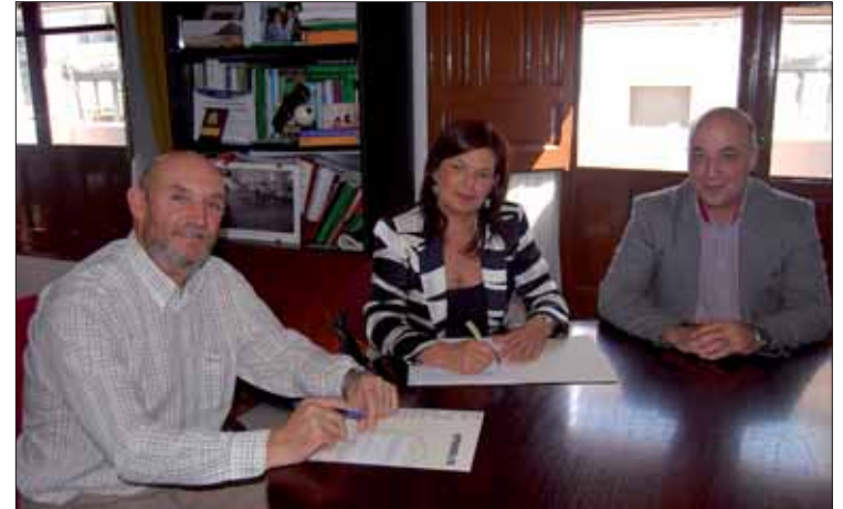
Los ediles municipales y la diputada durante la firma del convenio