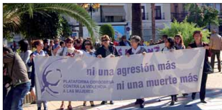
Los vecinos recibieron el proyecto de rehabilitación de sus viviendas

Por la condición de que en Rute existen muchas viviendas