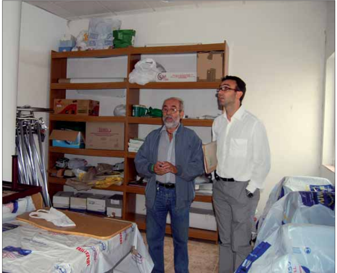
Las reformas en el almacén han permitido la redistribución de todo el material/FP

Como el año pasado, estaba dirigida a hombres de entre 50 y