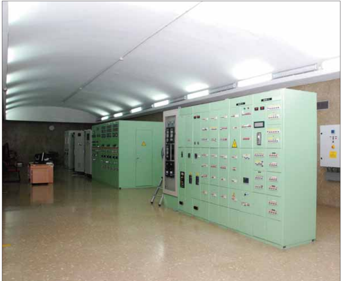
Interior de las instalaciones de la central hidroeléctrica del Pantano de Iznájar

Sin embargo, el Ayuntamiento de Rute mantiene otra pugna con Sevillana Electricidad. En este caso, en sentido contrario. Si la sentencia del Supremo es favorable en el tema del abono del IBI, por encontrarse en nues-