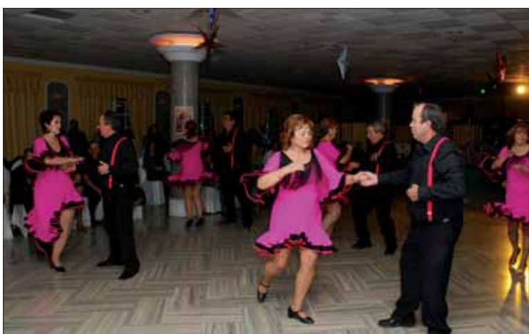
Se ha elegido el baile como tema por el auge que vive en nuestro pueblo/FP