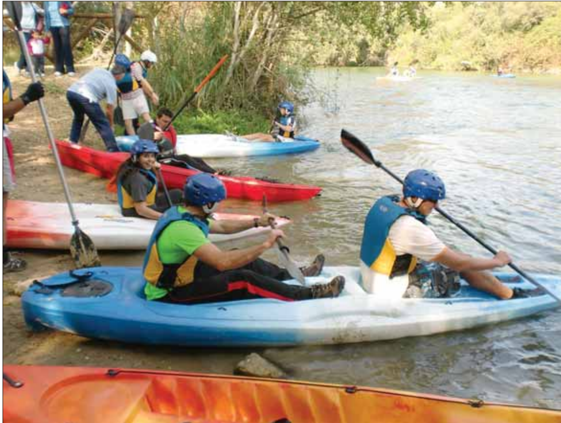
El Club de Piragüismo de Écija fletó cerca de cuarenta embarcaciones en su encuentro con Anya/EC

Sin apenas recuperar fuerzas de la cita jienense, en la mañana