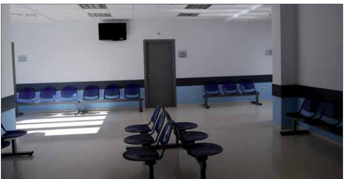
Las vacunaciones se realizan este año en la zona de ampliación del centro

La cita se puede pedir en el mismo Centro de Salud. No obstante, la directora aconseja, con objeto de evitar aglomeraciones, que las citas se soliciten por Internet, a través de página web de la consejería de Salud de la Junta