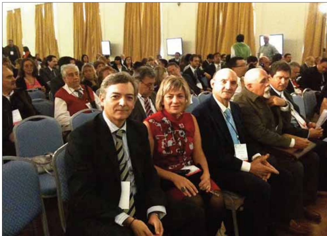
El edil ruteño asiste a un foro en el que también participa como moderador/MM

El foro se inauguró el 15 de octubre. Contó, entre otras, con las intervenciones del Ministro de Relaciones Exteriores, Comercio Internacional de la República Argentina, Héctor Timerman; el presidente de la Federación Argentina de Municipios, Julio Pereyra, y los representantes españoles: el presidente de la Diputación de Barcelona, Anthony Forgué Moya, y el presidente de