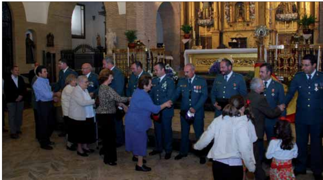
Al término de la función religiosa numerosas personas felicitaron a los agentes por su trabajo

Martos espera que se mantenga la misma colaboración en la inminente campaña de recogida