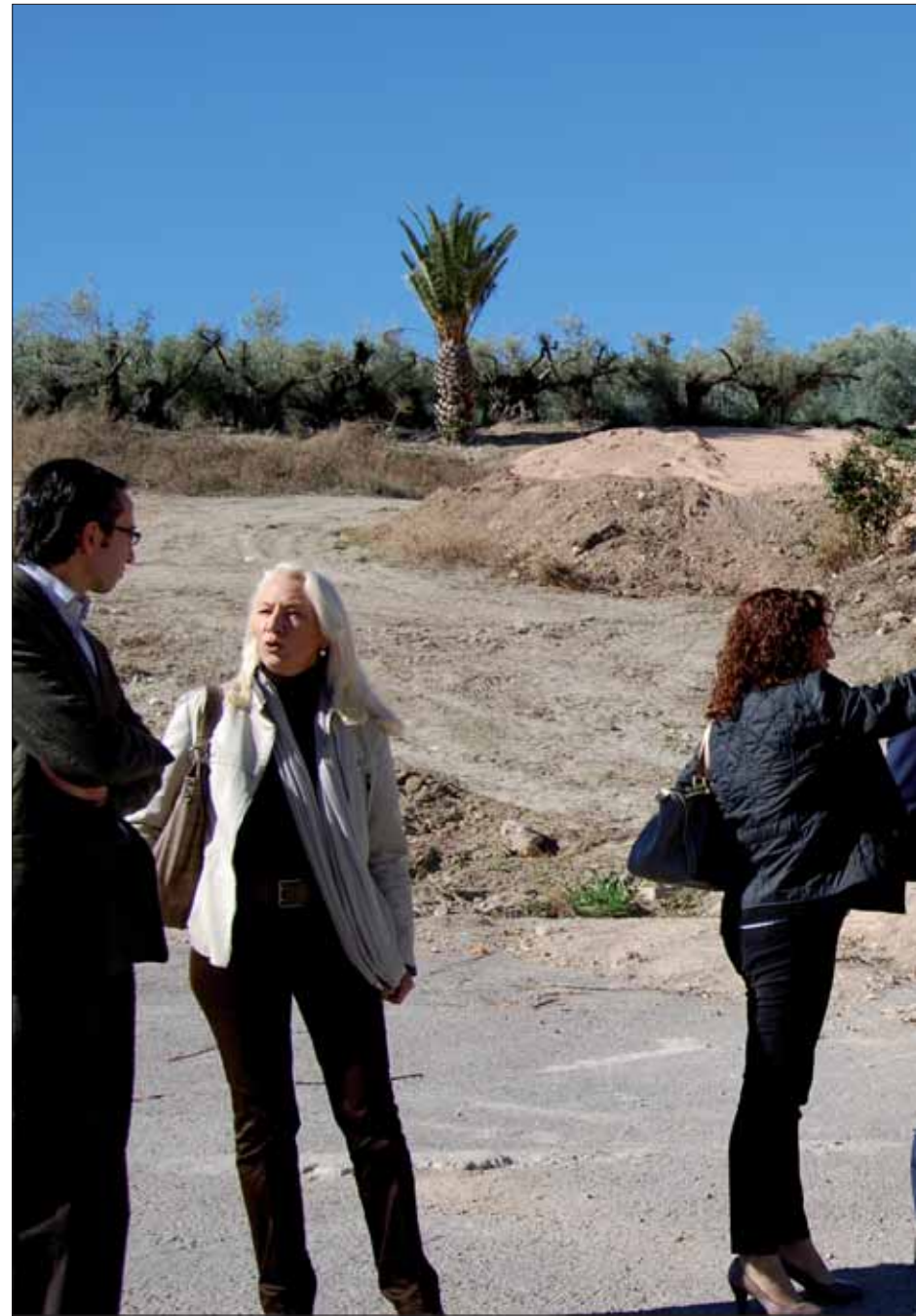
La delegada y el alcalde comprueban algunas de las actuaciones que se están realizando/

Los socialistas, en cambio, se abstuvieron en la del aprovechamiento de edificios públicos. Ruiz dijo que espera que esto "no afecte a colectivos y asociaciones sin ánimo de lucro". En relación a las