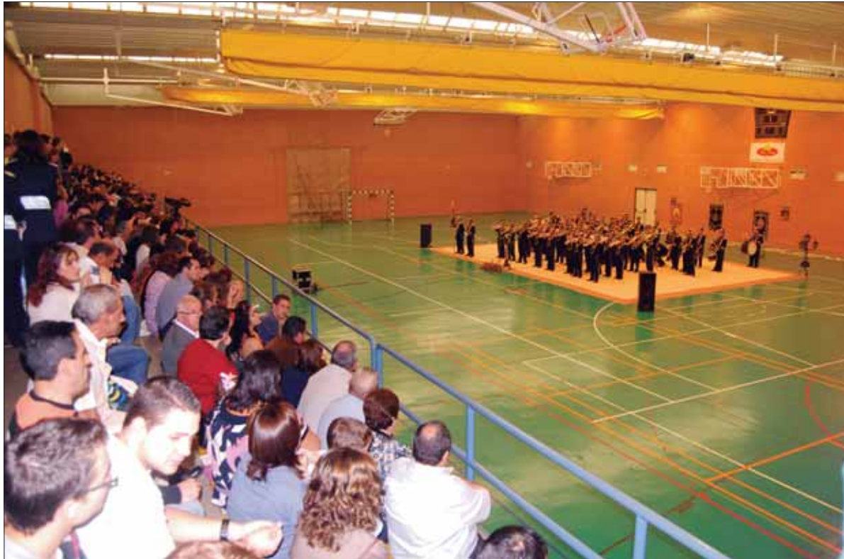
La Banda de Cornetas y Tambores de Torreperogil fue una de las participantes

El evento contó con una extraordinaria acogida. En el pabellón se dieron cita más de cuatrocientas personas. Este certamen lo organizaron tres cofradías ruteñas: la de Jesús de la Rosa, la del Abuelito y la de La