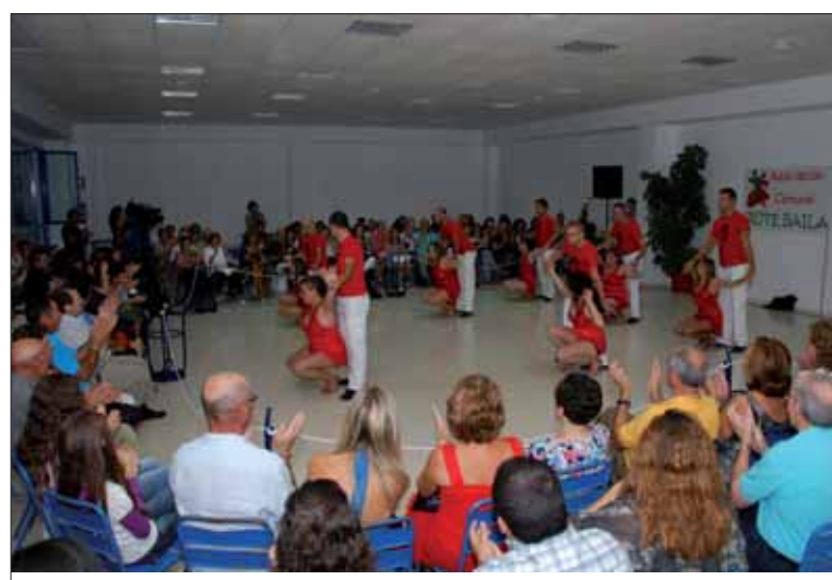
La presentación en sociedad incluyó una exhibición de diversos bailes/FP

Aparte de "esta afición común", el presidente cree que con el baile se fomentan otros aspectos "como el ejercicio físico o las relaciones sociales". Por lo tanto, la meta final es "darle una nueva salida a la diversión, el ocio y el deporte".