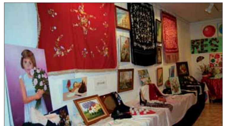
La exposición de manualidades mostró la habilidad de los mayores

local de esta semana, se sigue apostando por actos de convivencia con asociaciones de mayores vecinas para estrechar lazos.