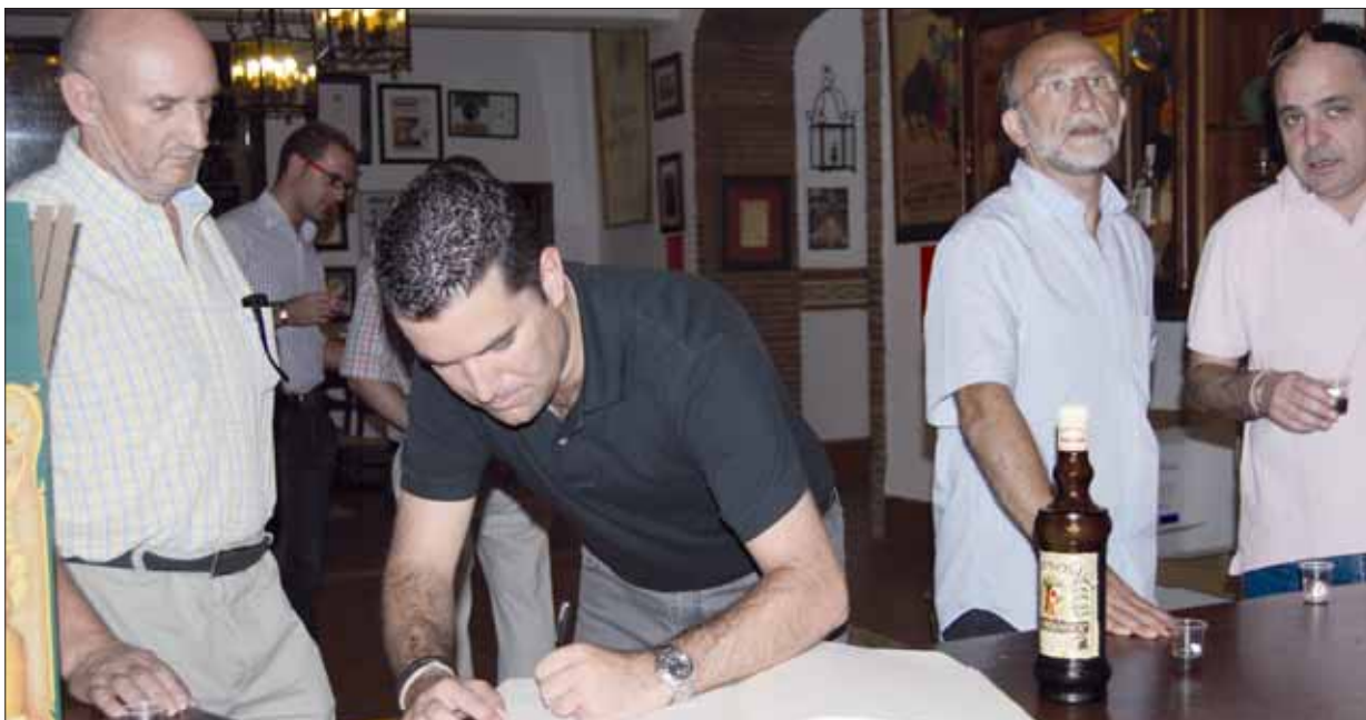
Durante su visita a Rute el alcalde de Pineda firmó en el libro de visitas del Museo del Anís