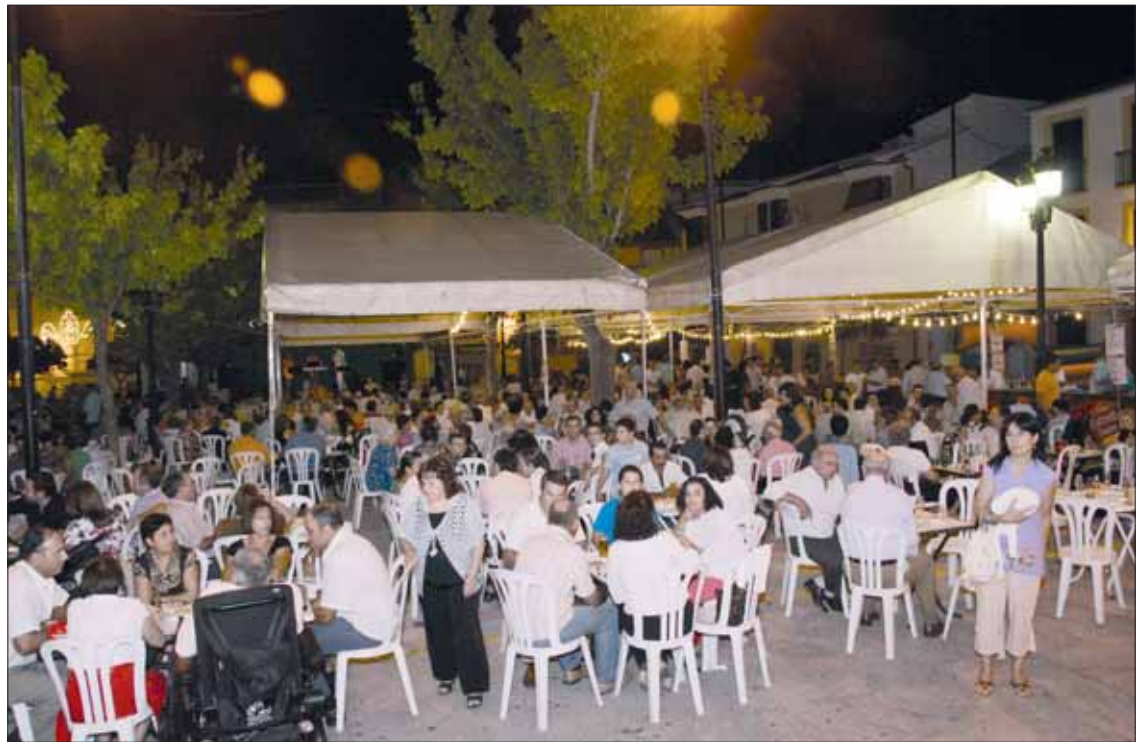
El Paseo del Llano se llenó de público durante las tres jornadas

Más allá de estas actuaciones, la respuesta de la gente ha sido de nuevo ejemplar. Durante las tres jornadas no cesó la afluencia al Paseo del Llano. Ello a pesar del susto que se llevaron en la medianoche del sábado, cuando un leve chubasco amenazó con estropear