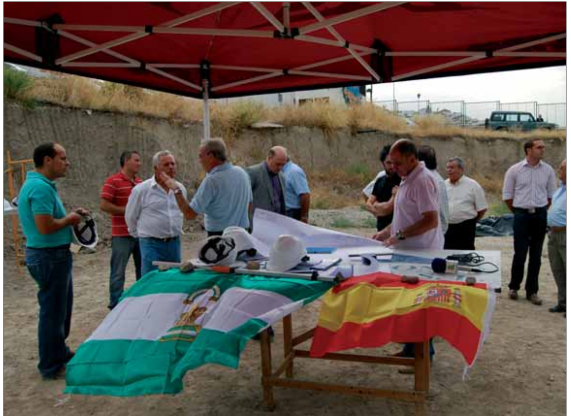
Los representantes técnicos y políticos participan en un acto de colocación de la primera piedra/MM

De esta forma, con los fondos estatales y la ayuda económica de la Junta se podrá contar con un campo de césped artificial homologable para cualquier competición, incluidas las ligas europeas.