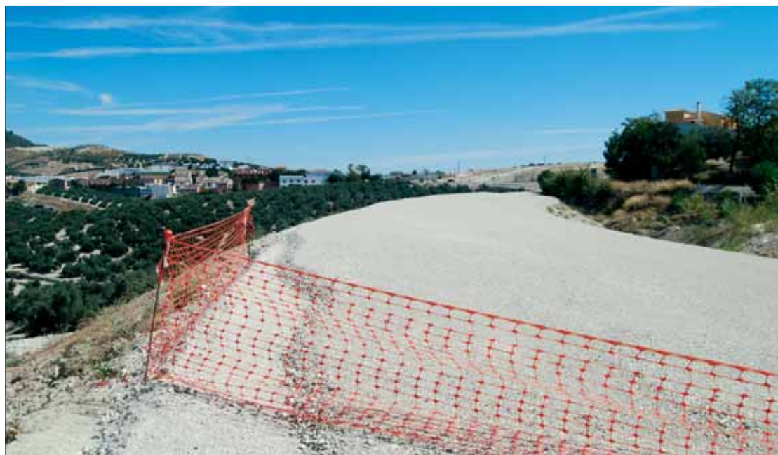
Altamirano confía en que se pueda cumplir el plazo del delegado para la carretera de Encinas Reales/MM

También se están "ralentizando" las obras de la carretera de Rute a Encinas Reales. A mediados de julio, el delegado provincial