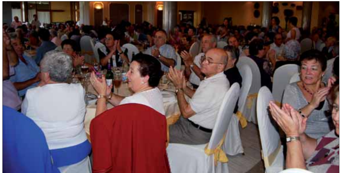
Las quinientas plazas disponibles en el hotel El Mirador se agotaron para la comida de hermandad/MM

Tras la inauguración, en la mañana del martes 28 las actividades fueron de carácter deportivo. Hubo una concentración de petanca en el Paseo del Fresno entre los clubes de la Subbética y una ruta senderista que se llevó a cabo por el paraje de la Rosa Alta. A su término, se entregó a los mayores de los pueblos vecinos unas placas de recuerdo.