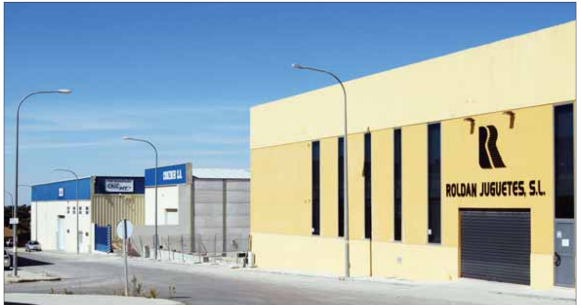
Pese a que funcionaron con normalidad, las empresas del polígono mantuvieron sus puertas cerradas

A nivel de la Administración local, de la plantilla de funcionarios del Ayuntamiento de Rute tan sólo dos se sumaron a la huelga. Quienes sí la apoyaron fueron los representantes de IU en el Consistorio ruteño. Al menos, ni el alcalde Francisco Javier Altamirano ni ninguno de los concejales liberados acudieron al ayuntamiento.