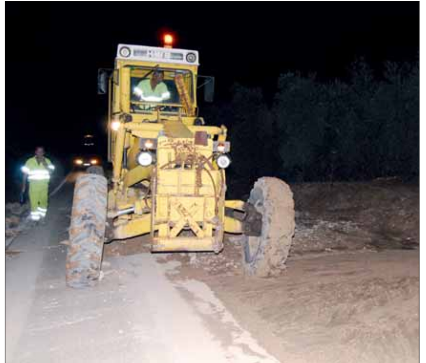
Obras Públicas estuvo limpiando la carretera de Carcabuey/FP

La única consecuencia reseñable de ese primer aguacero, entre las dos y las tres de la tarde, fue el levantamiento de alcantarillas en la salida de Rute hacia Lucena. La riada que venía de la parte alta del término, "donde más descargó la tormenta", hacía imposible que los colectores pudieran con toda el agua. En cual-