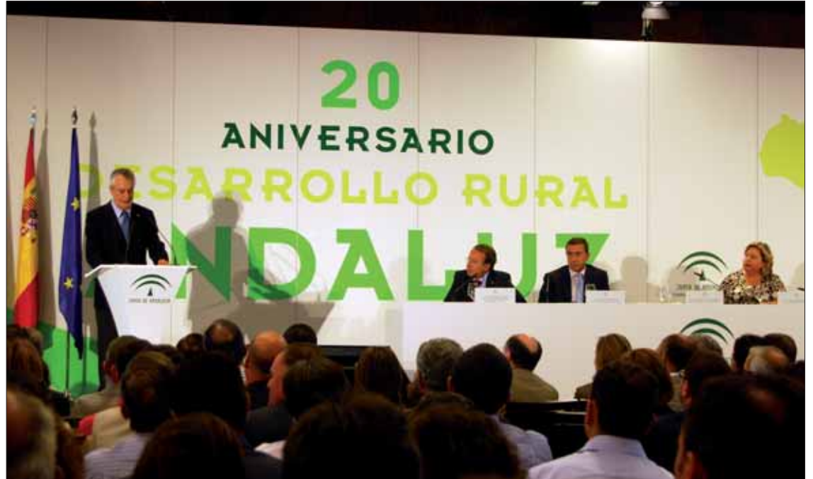
Más de mil persona se dieron cita en el acto de aniversario convocado por los GDR/MM

El presidente andaluz asegura que la creación de los Grupos de Desarrollo Rural ha sido "una de las movilizaciones más importantes que ha habido en Andalucía y pionera a nivel europeo". En el anterior marco comunitario, los GDR gestionaron los programas Proder y Leader Plus Andalucía, dotados con 349 millones de euros. Además, propiciaron una inversión privada de 930 millones, destinados a la ejecución de planes promovidos por los