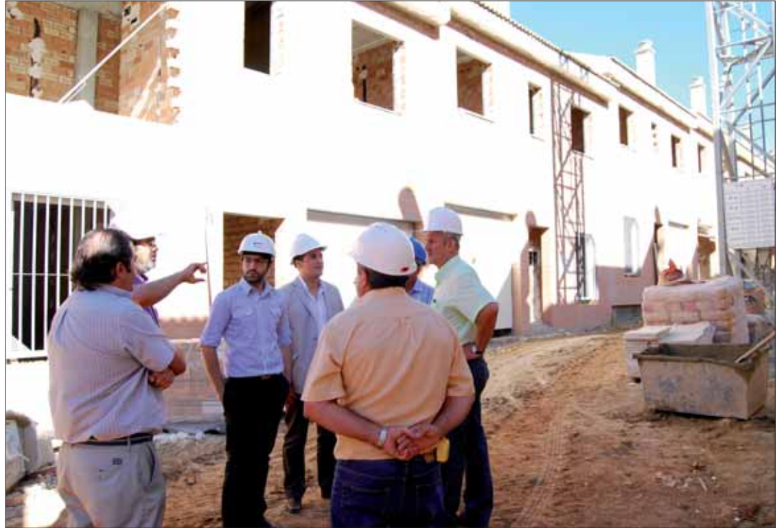
El alcalde y los responsables de Provicosa han elogiado el desarrollo de las obras

el alcalde recordó otras de carácter público que se están desarrollando en el municipio, como la emprendida por la Empresa Pública de Suelo (Epsa) o la que se va a acometer en el PPR-1. Y destacó otras promociones "que nunca hay que olvidar" con financiación y ayudas públicas de la Junta y el Gobierno central.