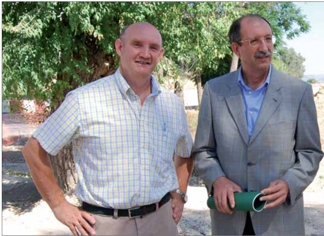
Tanto el alcalde como el delegado aseguran que la situación urbanística de Rute es única/MM

La sentencia de nulidad fue desmedida pero una vez dictada había que acatarla