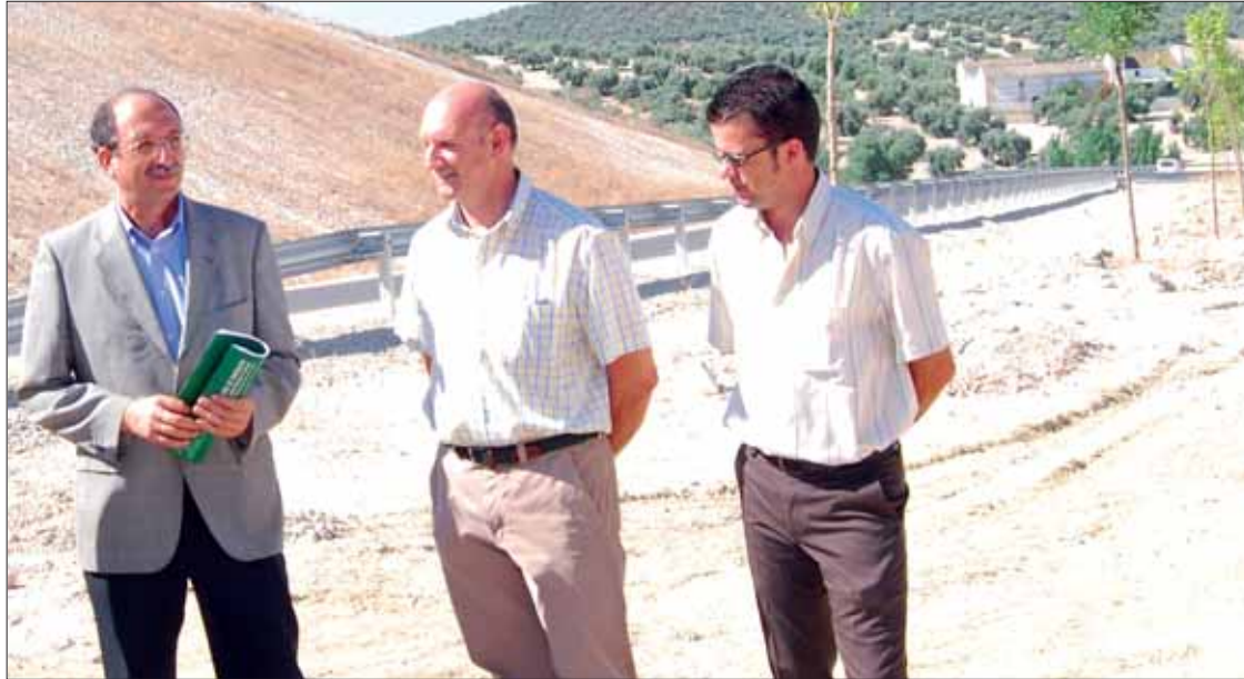
Unos de los tramos de carretera visitados por el delegado junto a los alcaldes de Rute e Encinas Reales

Se trata de unas obras cuyo plazo de ejecución estaba previsto para principios de año y que, en un primer momento, no se pudo cumplir. Para el delegado ha habido dos circunstancias importantes que justifican el retraso. Por una parte, se refirió a los hallazgos de unos restos arqueológicos el verano pasado