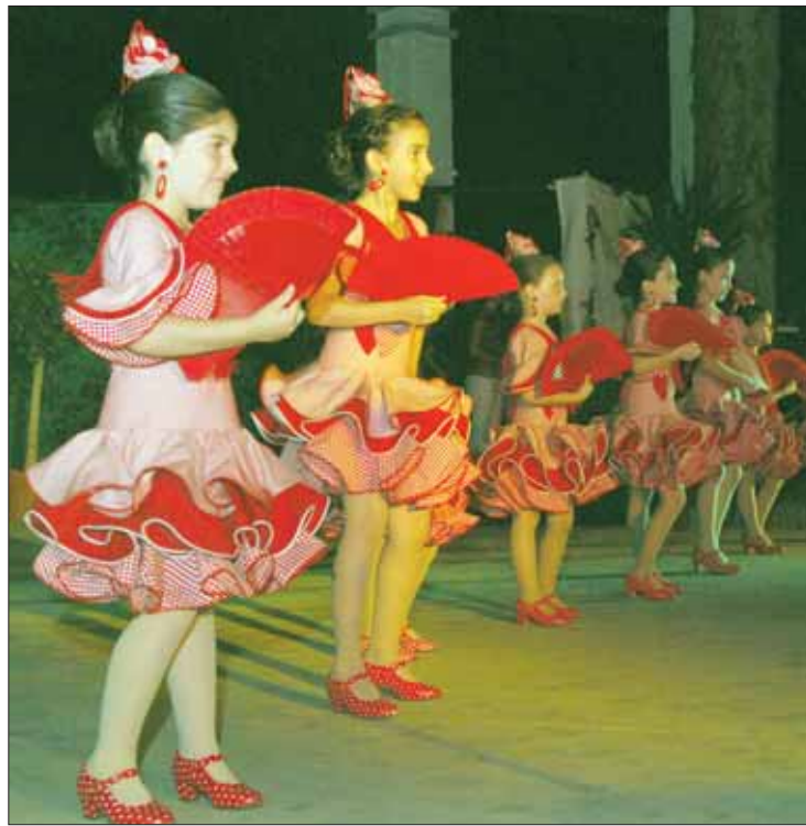
A la escuela sigue incorporándose gente de muy corta edad

Para Leal la mayor satisfacción es transmitir a la gente el amor por el baile