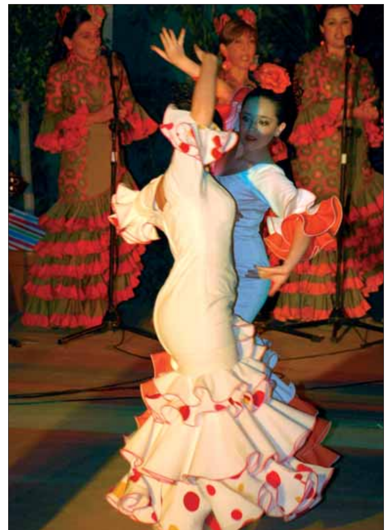
Antes del festival se celebró el concurso de sevillanas/FP

esas ideas para adaptarlas a las clases; algo que, lejos de molestarle, asegura que le "llena de orgullo".