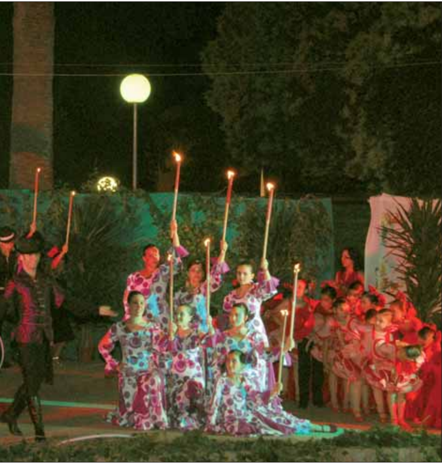
Lares del festival/FP