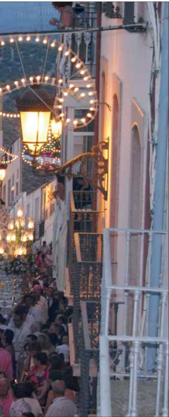
del último domingo de julio/MM

los, que se ha situado en la calle Juan Carlos I, número 5. Allí devotos y ruteños pueden aportar sus regalos. Será el 16 de agosto cuando se proceda a la tradicional subasta de regalos donados.