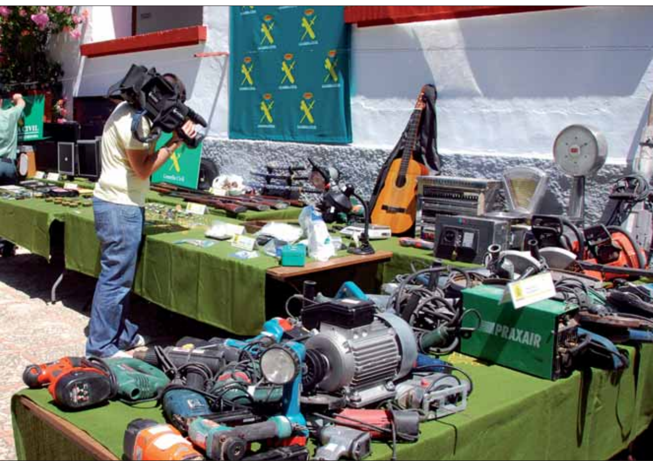
en la operación consta de siete páginas/FP

según varios testimonios, habían llegado a amenazar y agredir a algunos vecinos de Rute, al sospechar que pudieran ser informadores de la Guardia Civil.