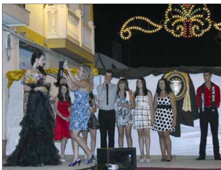
Durante la verbena se celebró un desfile de moda