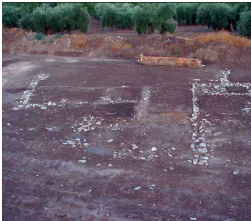
Estructuras domésticas documentadas en el proceso de excavación/EC

La población comenzó a crearse a partir de una zona de alquerías, casas agrícolas. Se estima que se llevó a cabo en tiempos de paz social. Se deduce del hecho de que se trata de un asentamiento que se encuentra en una área abierta y no dispone de elementos defensivos. Un enclave idóneo, de tierras fértiles, que contaba con los recursos hídricos necesarios y