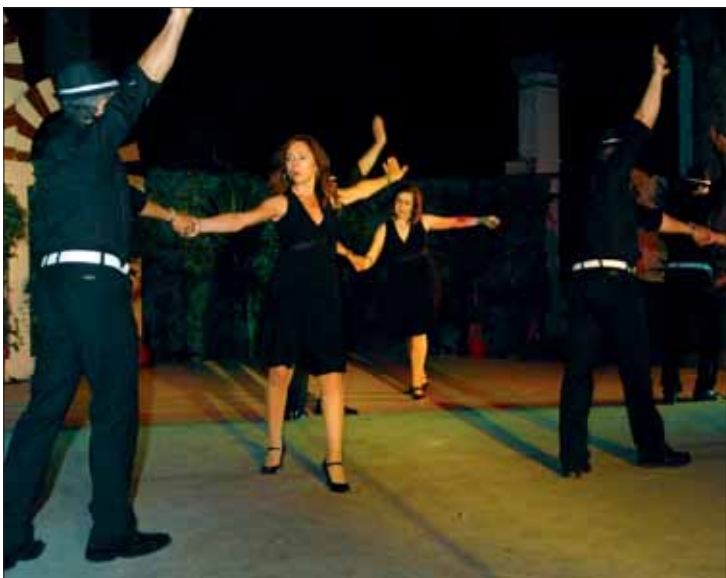
Los bailes de salón cada vez tienen más demanda en la escuela/FP