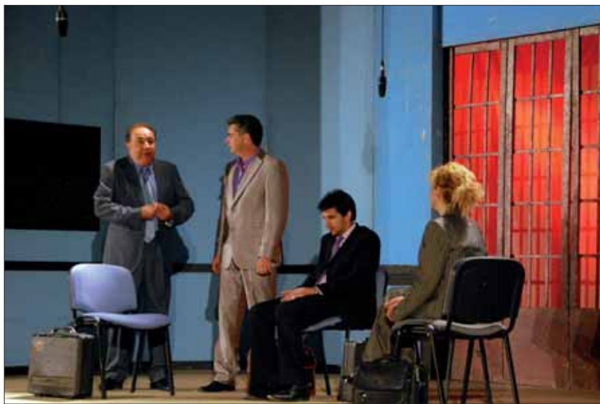
Puesta en escena en Rute de la última obra del ciclo, "El método Gronhölhm"

Al margen de estos cambios mínimos de horarios, la principal novedad del ciclo ha sido el estreno en Rute de la compañía Eslava. Ha tomado el relevo de Bena-