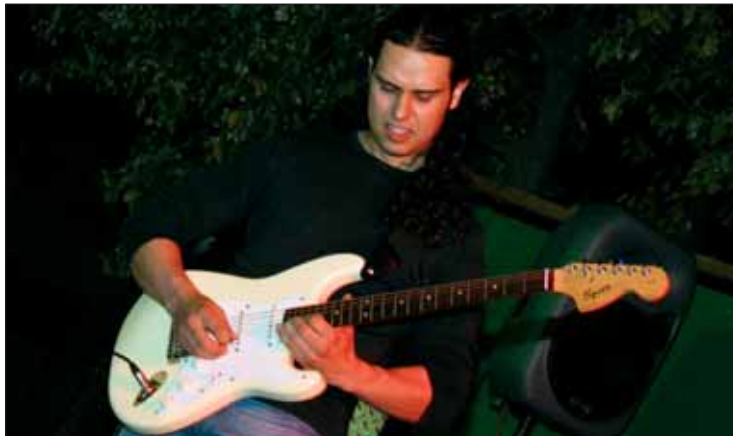
La jornada incluyó un tutorial de guitarra en vivo

El programa de Radio Rute celebra una jornada temática de rock duro con motivo de la publicación