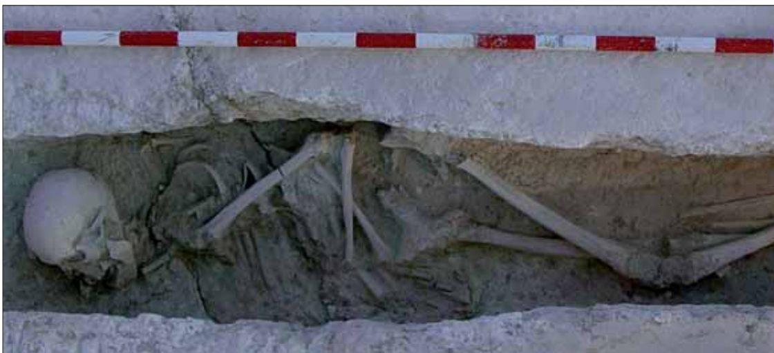
Tumba islámica en fosa simple, con individuo en posición decúbito lateral derecho/EC

con una topografía suave. Por tanto, un paraje que resultaba apropiado para el desarrollo de la agricultura.