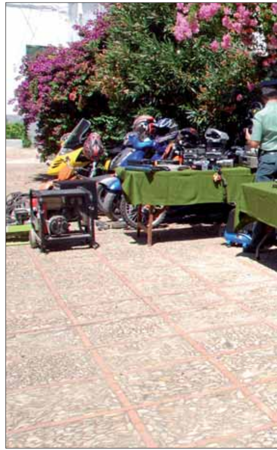
El documento con la relación de objetos intervenidos

Ya entonces los investigadores estaban convencidos de que detrás había una organización que abastecía de droga a los dos detenidos. Con el tiempo se comprobó que los movimientos se ha-