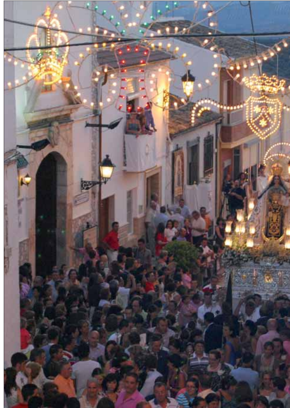
La subida por Los Barrancos fue uno de los momentos destacados del traslado procesional

Paralelamente, se han llevado a cabo diversas actividades lúdi-