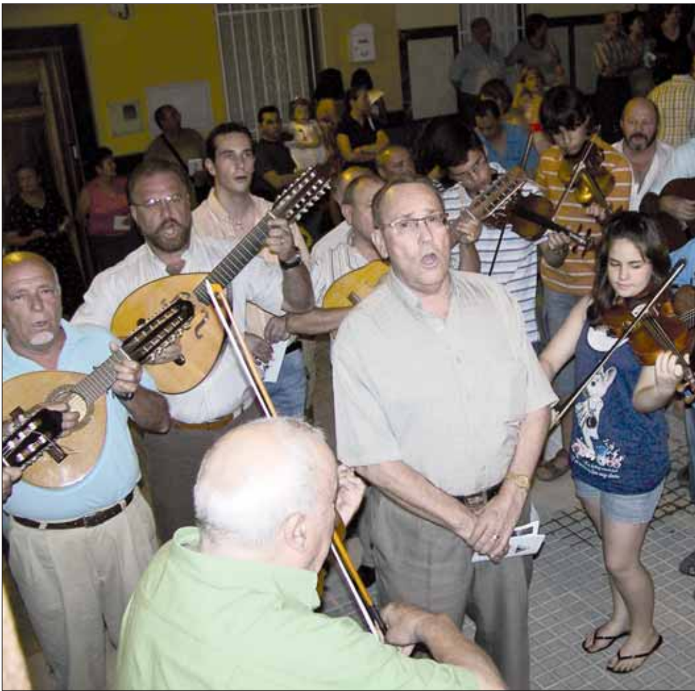
Primera salida de los hermanos de la aurora el pasado 10 de julio