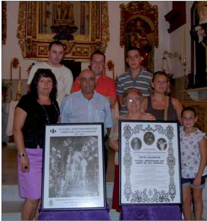
La cofradía presentó los cultos con motivo de esta efeméride/MM

Ya el día 5 de septiembre por la mañana el Abuelito regresará a su templo y realizará un recorrido por las calles Constitución, del Pilar, Pedro Gómez, Cerro bajo, Cabra, Herrero. De esta forma,