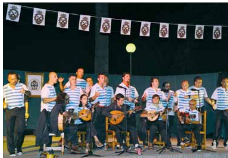
Actuación del coro gaditano "El patio de mi casa"

Finalmente, el 15 de agosto será el día grande de nuestra patrona. Y si el tiempo lo permite saldrá a la calle, sonarán las bandas, las calles se engalantarán para verla pasar, y a eso de la me-