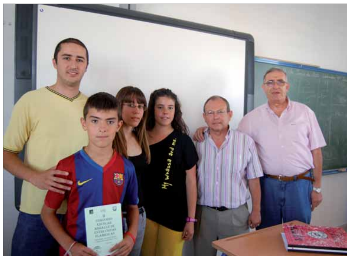
Los alumnos premiados junto a su profesor tutor y el director del centro/MM

Otros dos compañeros han sido galardonados en esta convocatoria donde debían entrevistar a algún artista flamenco