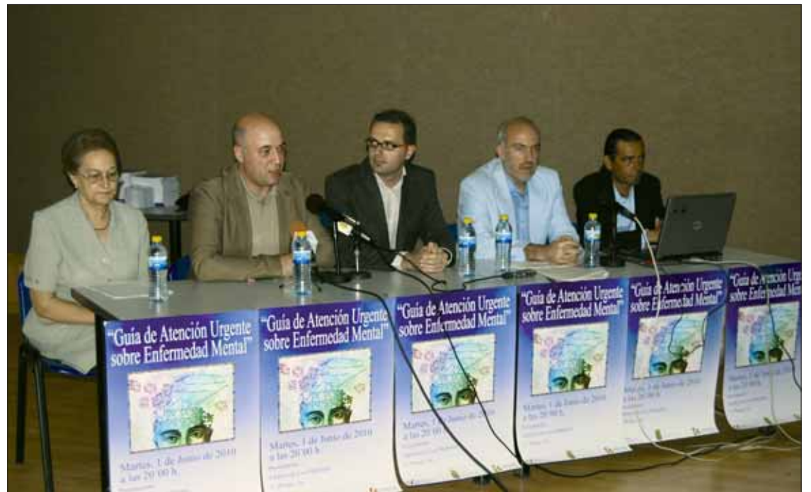
Representantes de las administraciones y colectivos implicados en la elaboración de la guía/MM

prevención y la tipologías de las diferentes enfermedades que se pueden diagnosticar, un tercero sobre derechos y deberes del enfermo mental; y el cuarto y último bloque incluye un directorio amplio de los servicios sanitarios existentes y de contactos de las asociacio-