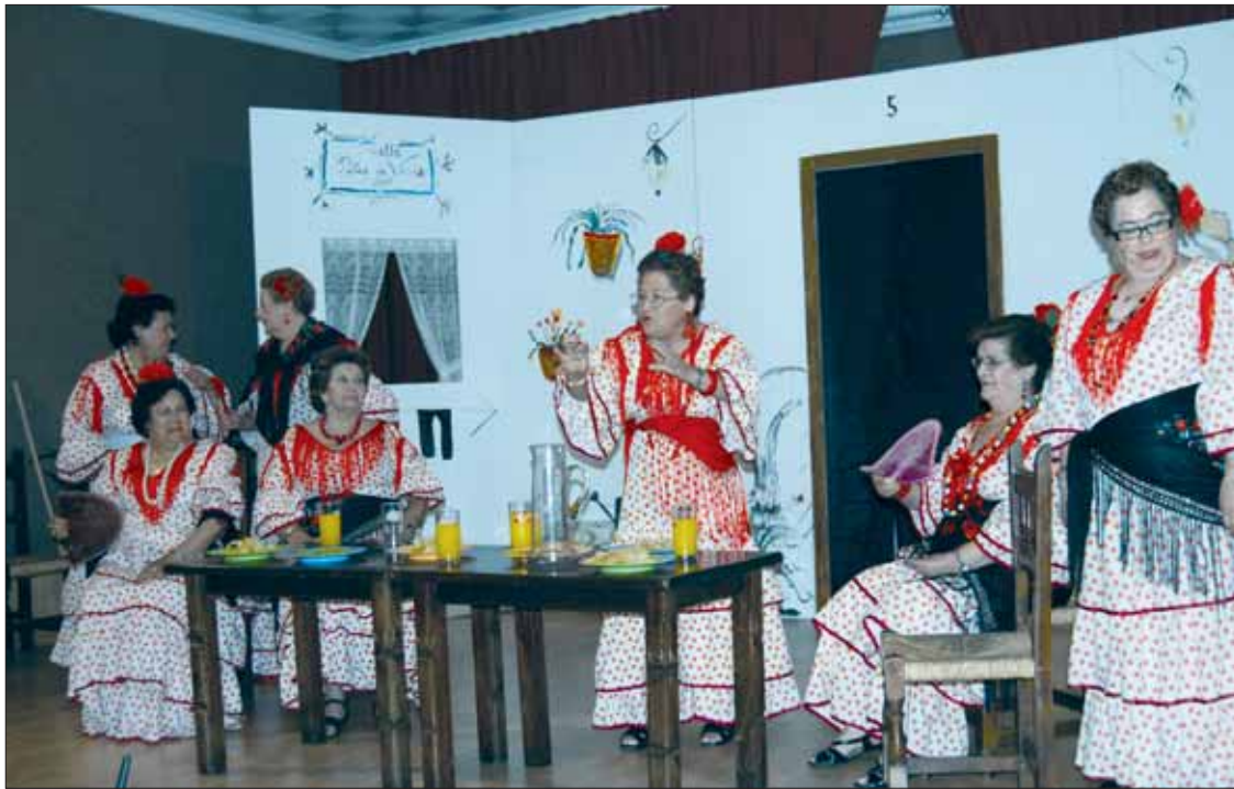
Un momento de puesta en escena de la obra ofrecida a cargo de la empresa Geasur

Un grupo de mujeres del municipio han sido las encargadas de interpretar y realizar una obra que ha versado sobre el día a día de un vecindario