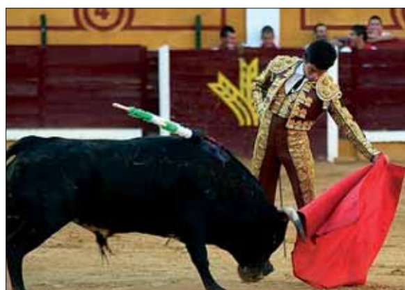
"El Gallero" en una de sus actuaciones

Tras sus primeros éxitos la escuela continúa interesándose por él. Entonces centra su preparación y atención en el acoso y derribo del animal. Esto re-