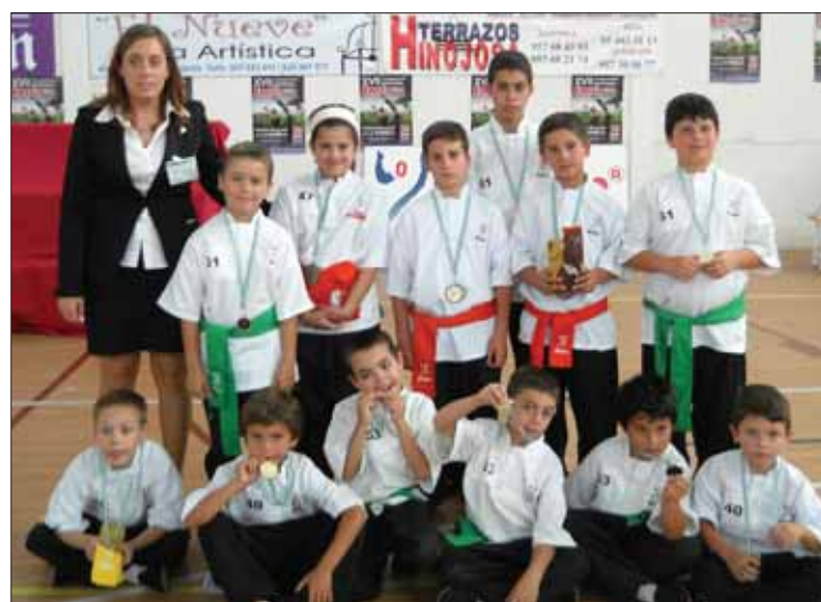
Los participantes ruteños en esta edición del campeonato

En cuanto a los niños, ha habido dos equipos con cinturón verde y otro más en naranja. Estos últimos se han alzado con