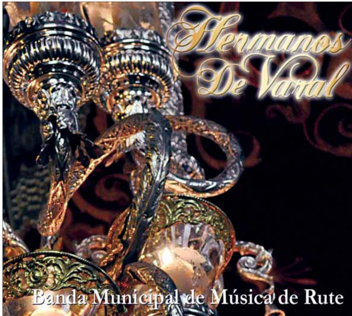
Portada original del nuevo CD de la banda

Tras el estreno, se espera grabar más discos y dar cabida a otros géneros