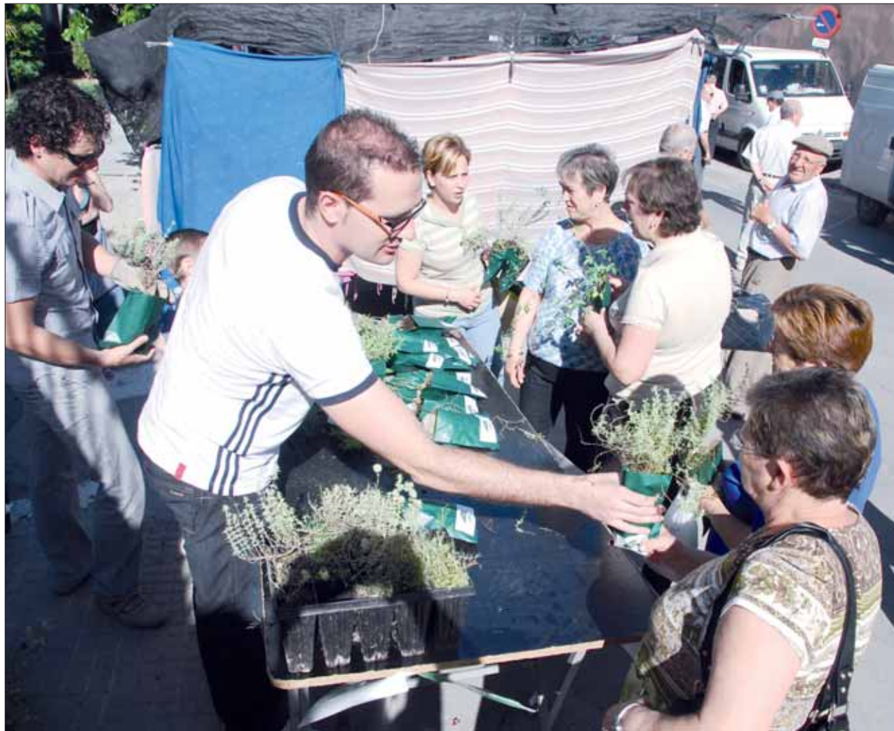
La gente aceptó el regalo y los 900 plantones no tardaron en repartirse

La gente aceptó de buen grado el ofrecimiento, puesto que, al fin y al cabo, salía gratis. Entre las plantas regaladas, la estrella fue el rosal, si bien el concejal mostró su debilidad por la mejorana, “dada su tradición