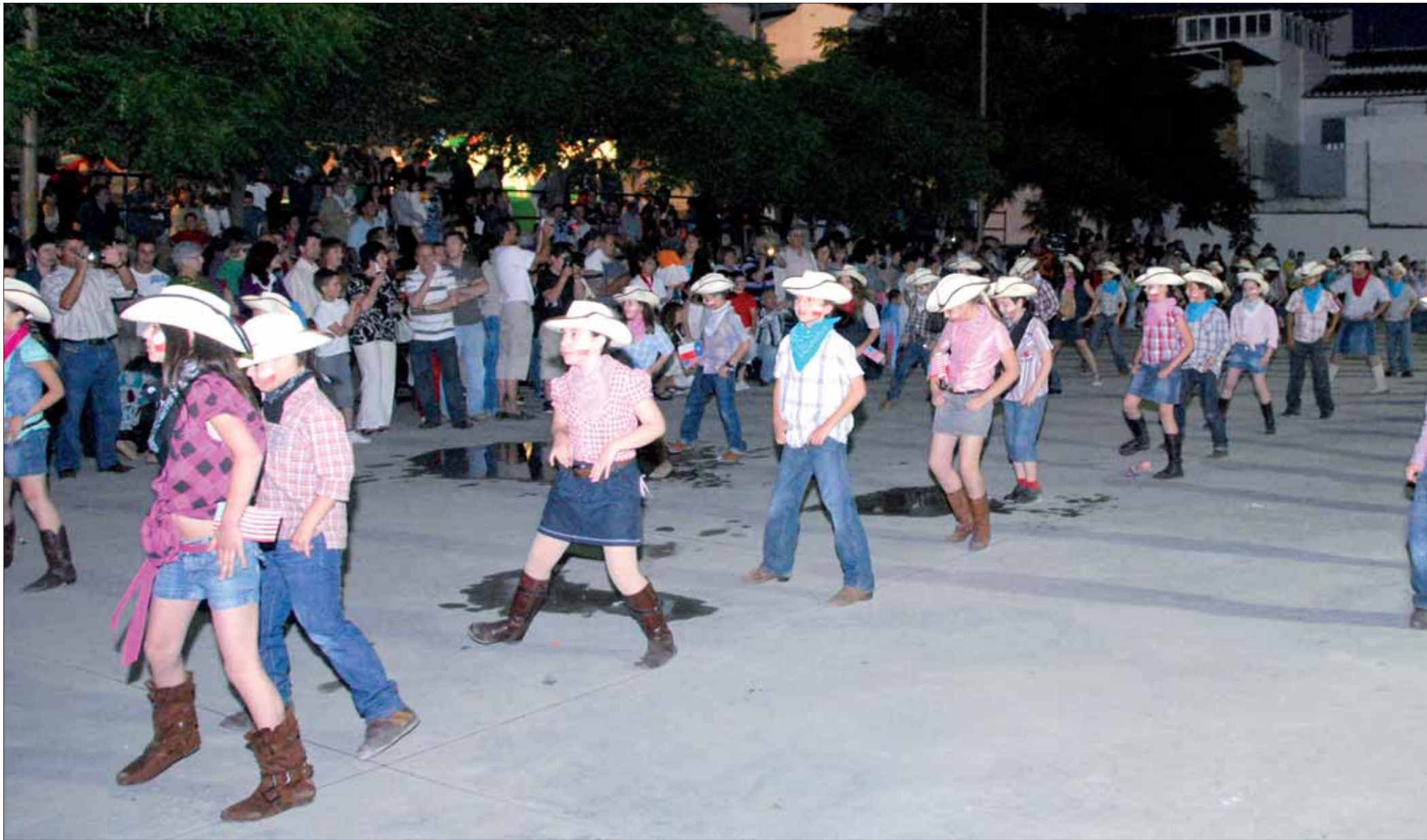
La iniciativa más novedosa fue la recreada por el colegio Fuente del Moral, donde cada curso representaba a un país del mundo/FP