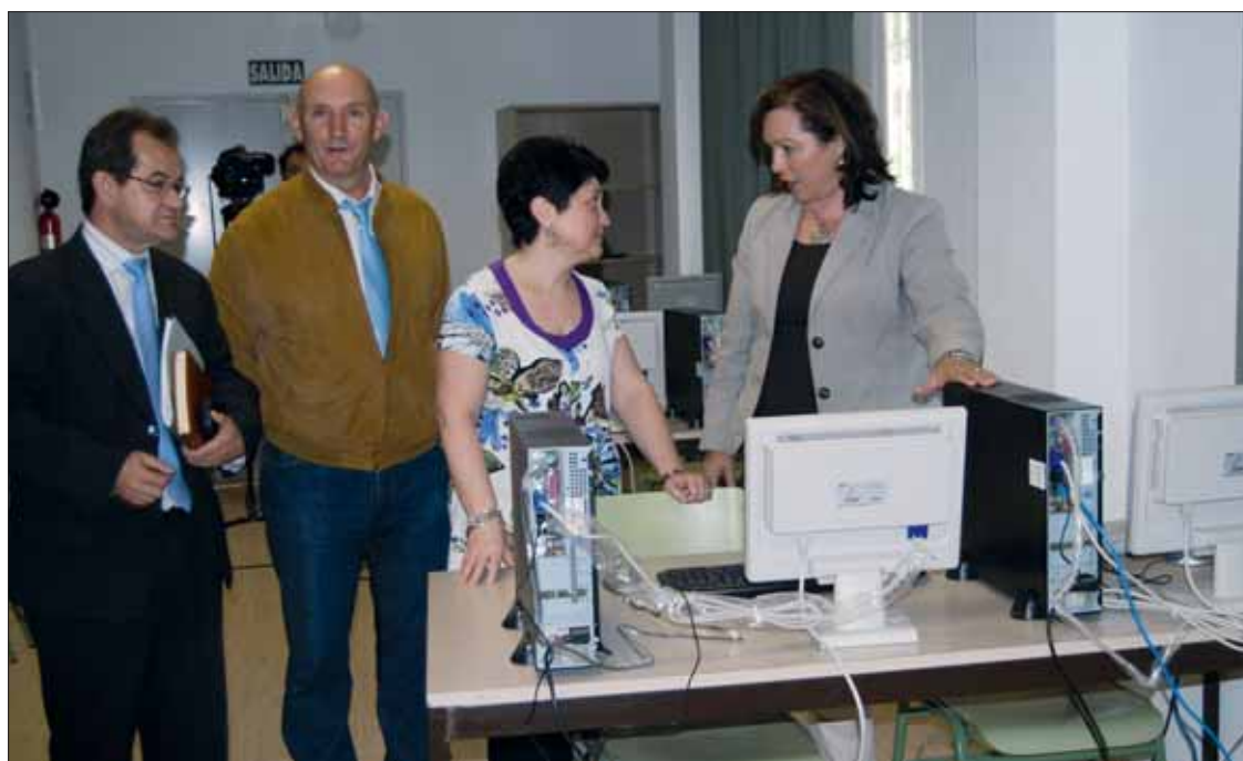
La delegada conversa con la directora del centro junto al alcalde y el inspector de Adultos/MM

Los centros de educación de adultos se crearon hace 26 años.