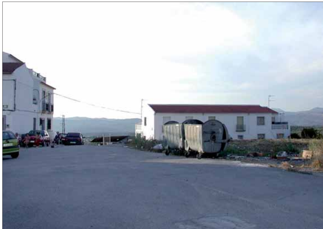
Desde hace una década, estos vecinos se ven asaltados cada cierto tiempo por un nuevo foco

Según sus testimonios, la situación se remontaba en realidad otros cinco años atrás. Pero no fue hasta ese verano cuando decidieron hacerlo público. La aparición de estos ácaros en los genitales de una niña de un año colmó la paciencia. El barrio, de unas sesenta viviendas, ha crecido alrededor del Pabellón Grego-