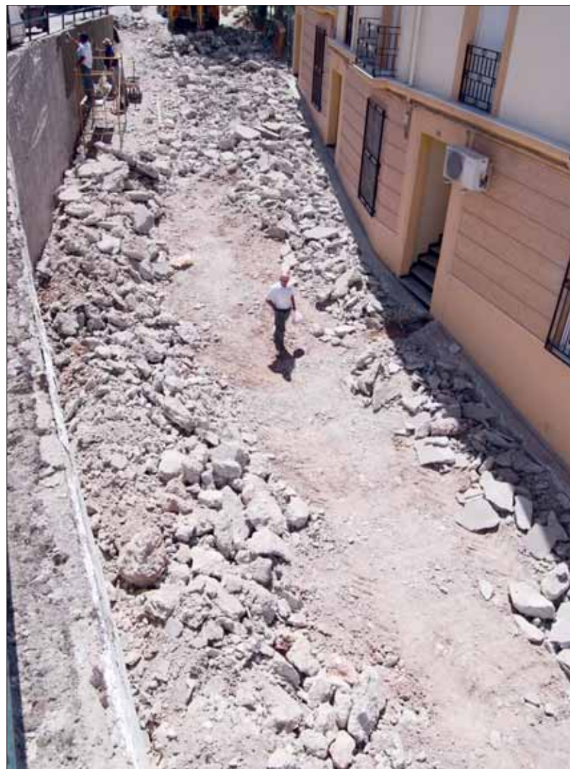
La calle San Bartolomé renovará sus desagües, la luz y el acerado

Muy cerca de la calle San Bartolomé está la Ronda del Fresno. En su inicio, junto al local de La Tequería, se acaba de terminar una de las fases de arreglo. Corre igualmente por cuenta del Profea y, en palabras del al-