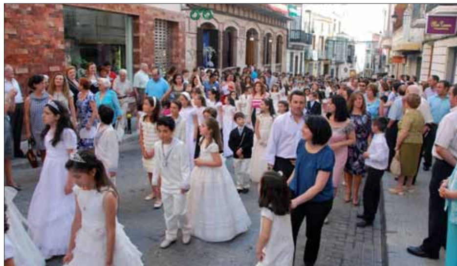
Los niños desfilan junto a altares como el situado en el Círculo de Rute