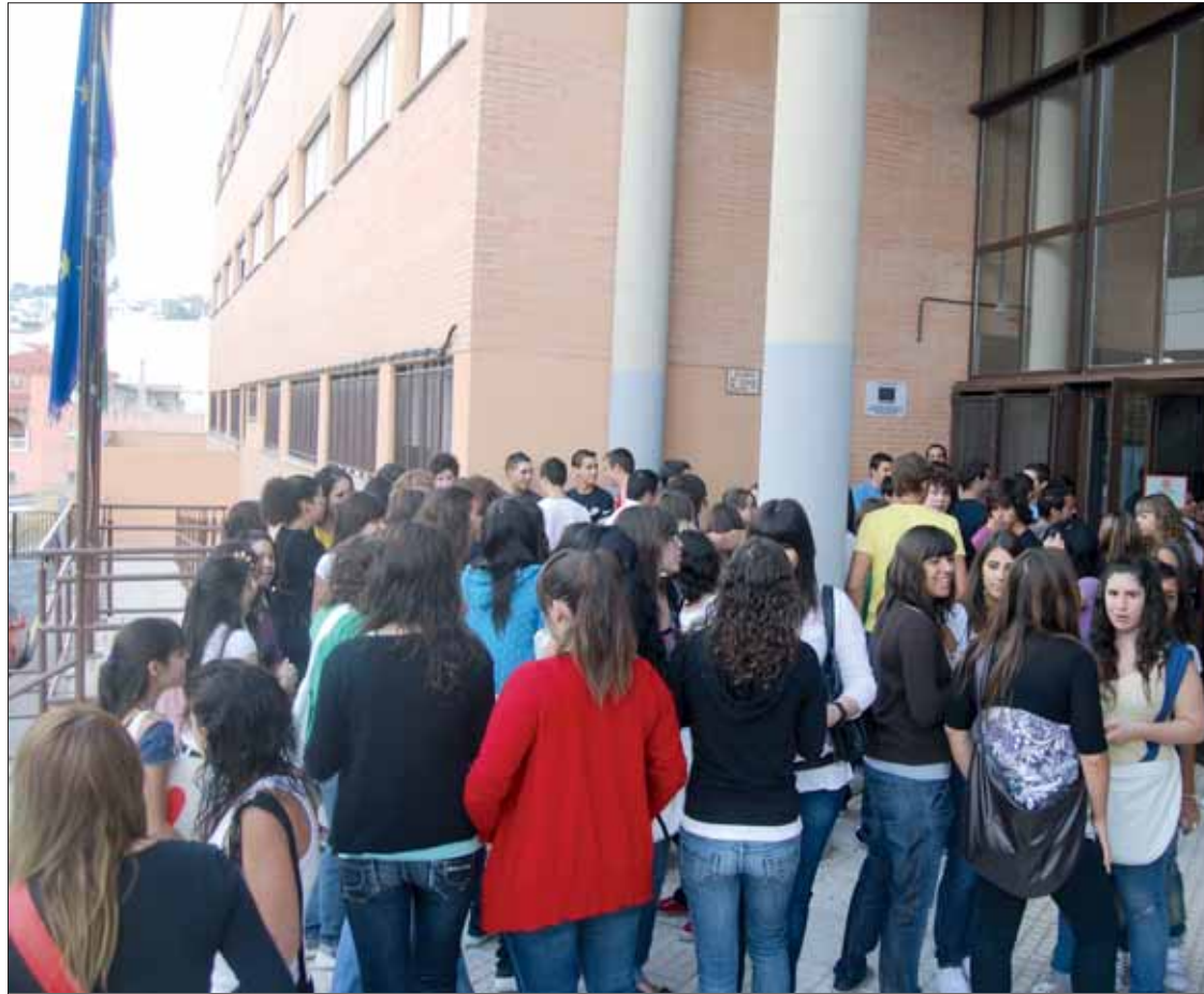
Al igual que los demás centros educativos, la incidencia en el IES Nuevo Scala ha sido escasa

El otro amplio sector afectado por la convocatoria eran los centros educativos. Pero aquí, como en el resto de los casos, la reper-