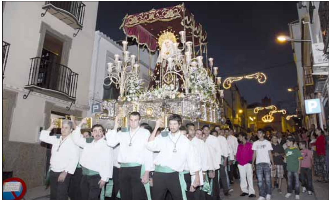
Como de costumbre, el recorrido procesional se centró en las calles del barrio de la Vera Cruz

Al margen de este contratiempo, se revivió la metamorfosis de este barrio en mayo. De la no tan lejana Semana Santa sólo quedan las imágenes que salen en procesión. El resto es un cúmulo de cambios: nazarenos por mantillas, el olor de cera por el de flores, y las antorchas del tramo final por bengalas. Incluso desde los balcones dejan de salir saetas para arrojar pétalos de rosa a los tronos.