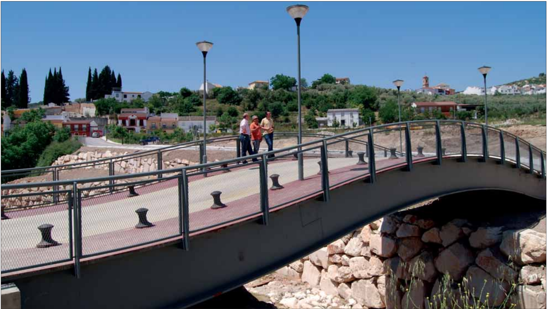
Se trata de un puente de estructura moderna que dará acceso a zonas de recreo y fincas/MM