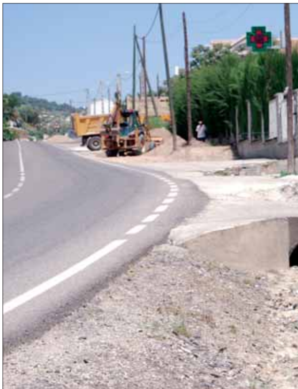
Nueva zona de paso en la travesía de Zambra/MM

Junto a otras mejoras que se han realizado, ha cambiado por completo la imagen que ofrece este lugar.