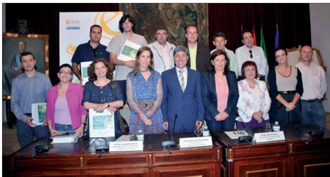
El presidente de la Diputación con los alcaldes de los municipios implicados en el Plan de Movilidad/EC

En el caso de Rute, el alcalde ha adelantado que se pretende adaptar las obras que se vayan haciendo en los distintos viarios municipales para que los peatones tengan mayor seguridad. También se intenta conseguir el mayor ahorro energético posible, así como potenciar esas zonas peatonales y los carriles bici. Además de mejorar esa seguridad,