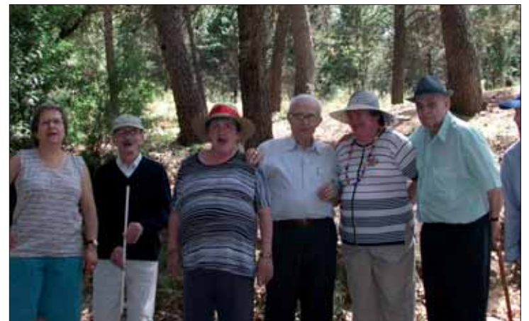
Los mayores de la residencia en las actividades celebradas

como los familiares que vinieron de visita. Asimismo, se llevaron a cabo dos talleres de manualidades y uno de literatura. Finalmente, los residentes despidieron a sus familiares con un obsequio que ellos mismos habían realizado; un día intenso, divertido, esperado y necesario para que los mayores sigan sintiéndose queridos.