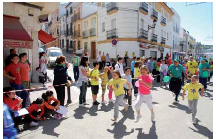
Escolares y adultos corrieron juntos en esta jornada de convivencia

Esa convivencia se da además entre los muchos grupos que colaboran. La carrera contó con la ayuda de entidades como Protección Civil, la Policía Local, el grupo de senderistas de la tercera edad o el Club Atletismo Rute.