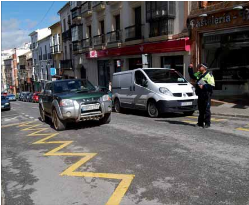
Las medidas también afectan a las actuaciones de la Policía Local

Igualmente, desde la delegación de Tráfico y la Policía Local de Rute, mediante un comunicado de prensa, se ha informado de las novedades principales que más directamente afectan al ámbito local. En concreto, el concejal del