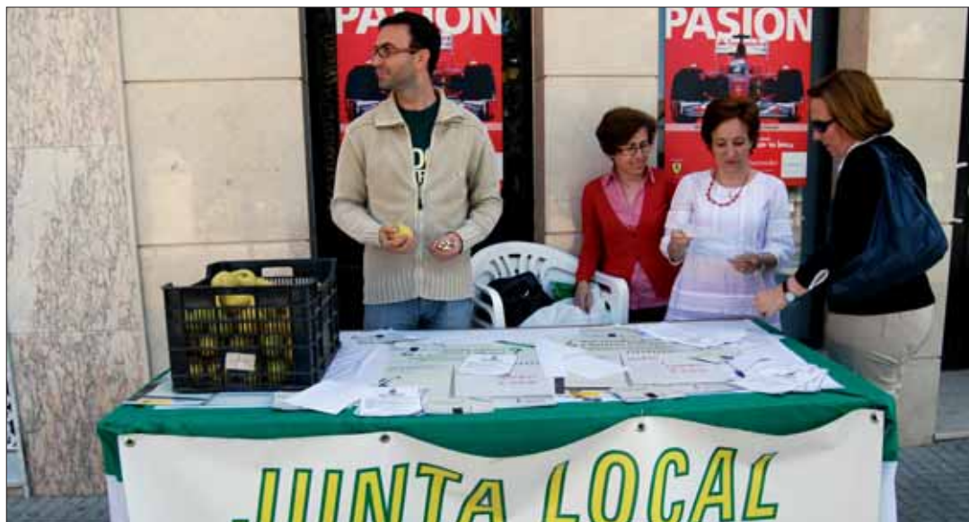
Este año los cigarrillos se han cambiado de forma simbólica por chapas y piezas de fruta/MM

En cuanto a la celebración del día sin tabaco, se adelantó al sábado 29, aprovechando la