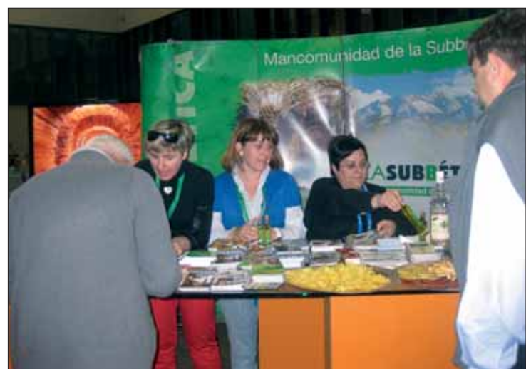
Numerosos visitantes se interesaron por la oferta de Rute/EC