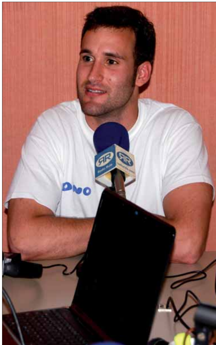
Sánchez asegura que él también ha aprendido de los pequeños

P: ¿Con cuántas pistas se cuenta en el pabellón?