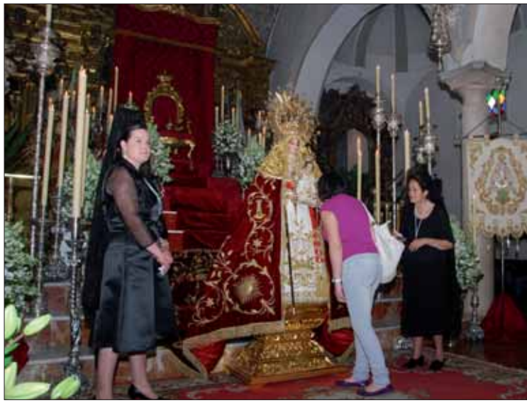
El besamanos echó un año más el telón de estas fiestas

Pero se habían ido al limbo los bailes, los cantos de los coros y todo el aire de romería que tiene la procesión de la mañana. Y por supuesto el paso por los Cortijuelos: por muchos instantes que queden en la retina, continúa siendo el punto más emblemático por ser donde empezó todo hace cinco siglos.