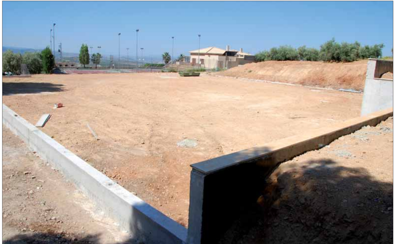
Además del amplio terreno que se ha destinado a la reforma, el club dispone todavía de una parcela que se reserva para zona de paseo/FP

La prueba constaba de natación en el Guadalquivir, carrera en bicicleta y carrera a pie, que terminó en el Parque del Alamillo. En la modalidad "sprint", la