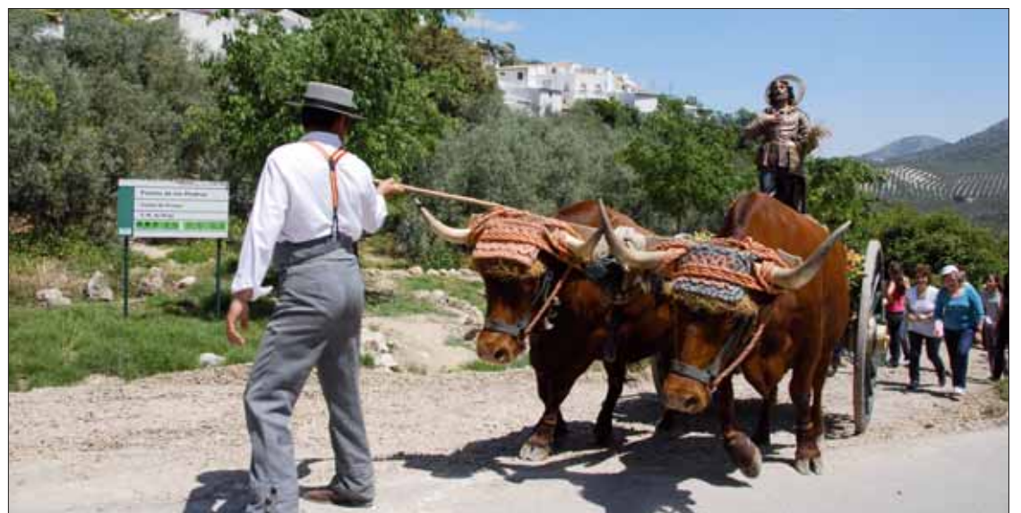
El buen tiempo y la novedad del trayecto atrajeron al público que se desplazó desde Rute/FP

Como de costumbre, en el recorrido matinal el patrón fue en un carro tirado por bueyes, mientras que por la tarde la ima-