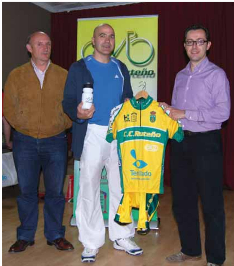
El alcalde y el presidente hacen la entrega de los nuevos uniformes a los socios/FP

El reto de futuro es fomentar la práctica del ciclismo entre las mujeres y los menores