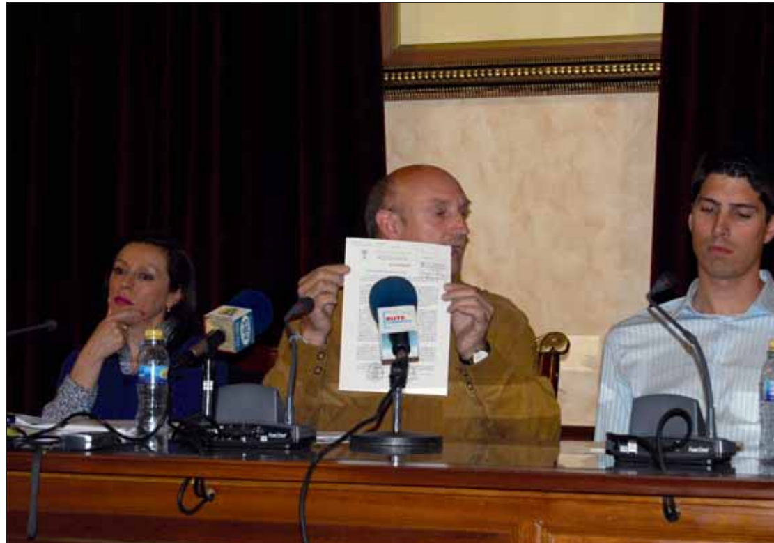
El alcalde muestra una copia del fax enviado el 15 de abril desde la Policía a Diputación

Baena considera "muy graves" las afirmaciones que han