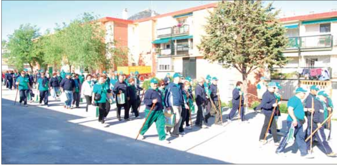
La numerosa marcha partió de las inmediaciones del Polideportivo Municipal/FP

La iniciativa se realizó a la vez en trece municipios del sur de Córdoba, a instancias de la consejería de Salud