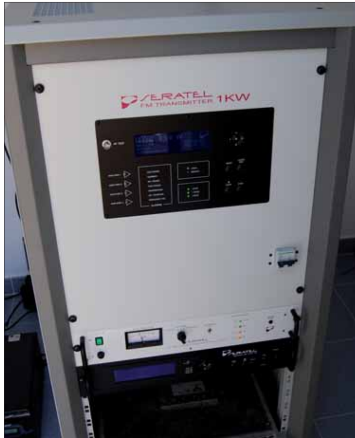
Los nuevos equipos se ubican en el Cerro de San Cristóbal

Asimismo, en caso de cualquier imprevisto, el acceso a las instalaciones también se ha mejorado notablemente. Se ha