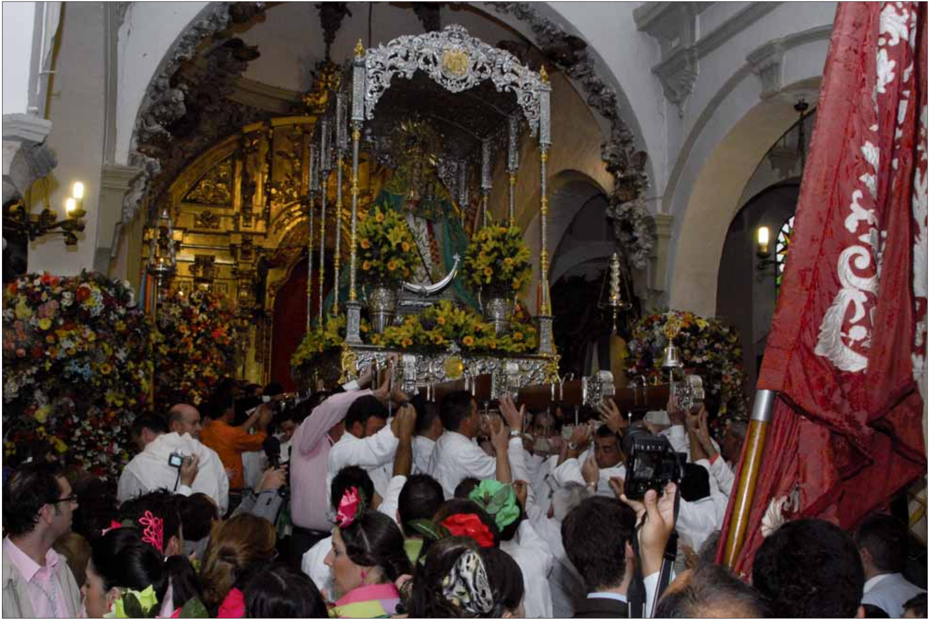
Los asistentes tuvieron que conformarse por la mañana con la bajada del altar y unas marchas dentro de la iglesia