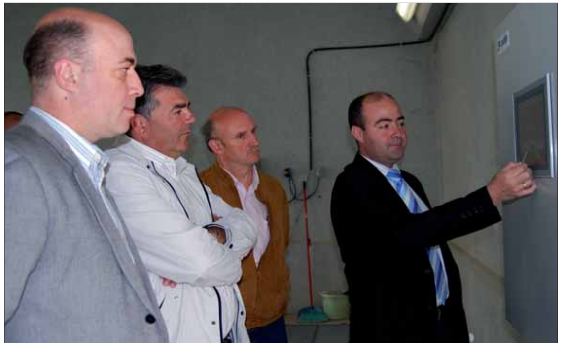
El técnico muestra al alcalde y a los diputados el funcionamiento del sistema del circuito hidráulico

El coste de la segunda fase ha sido de 335.732,48 euros. Por tanto, el montante total de la in-