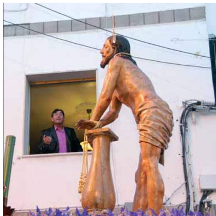
En la procesión de la Vera Cruz no faltaron las típicas saetas

La cofradía de la Vera Cruz sigue estando formada por una junta gestora. Aún no han llegado los estatutos con el visto bueno del obispado para la constitución de una nueva junta de gobierno. En estas fechas se acumula el trabajo; no solamente para la Semana Santa, sino porque a renglón seguido la cofradía se meterá de lleno en la organización de las fiestas de las cruces de mayo.