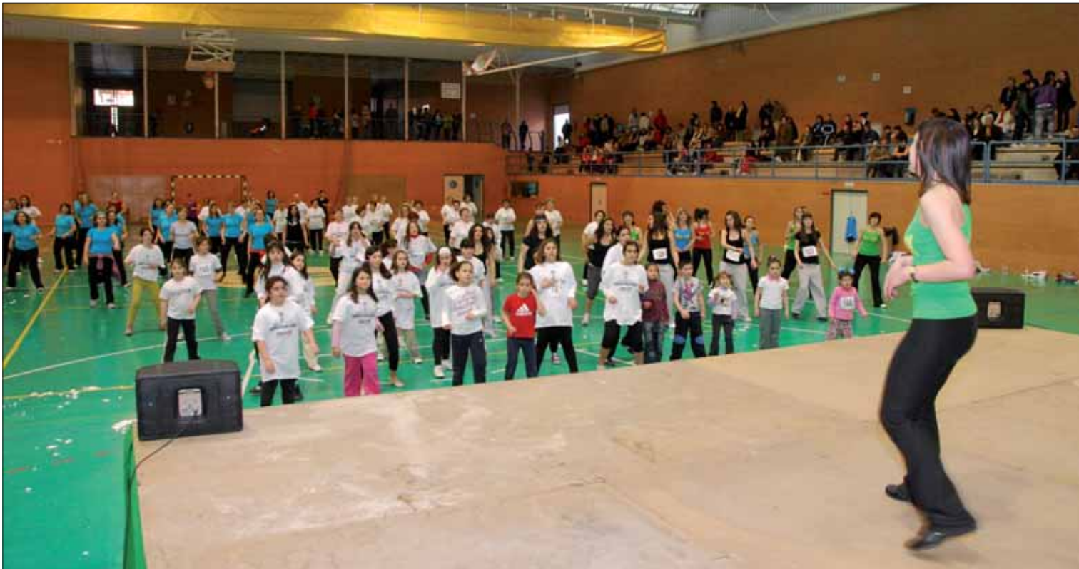
Las asistentes realizaban los ejercicios al compás de la música de megafonía y siguiendo los pasos de la monitora que había en el escenario