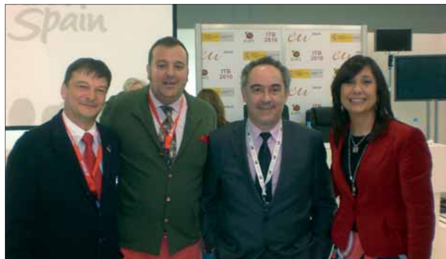
El cocinero Ferrán Adrià fue uno de los ilustres que conoció los productos de Rute

empresarios apuesten por la comercialización de los productos. Por otra parte, cree que una feria de esta relevancia permite observar "las tendencias actuales". En su opinión, va a ser difícil que decaiga el turismo de sol y playa,