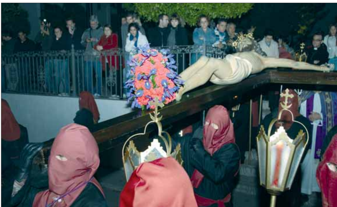
El recogimiento caracteriza la salida del Cristo de la Misericordia

buena sintonía desde hace años. Respecto a la Banda de Rute, ya son dos años consecutivos acompañando a esta cofradía después de un tiempo de ausencia.