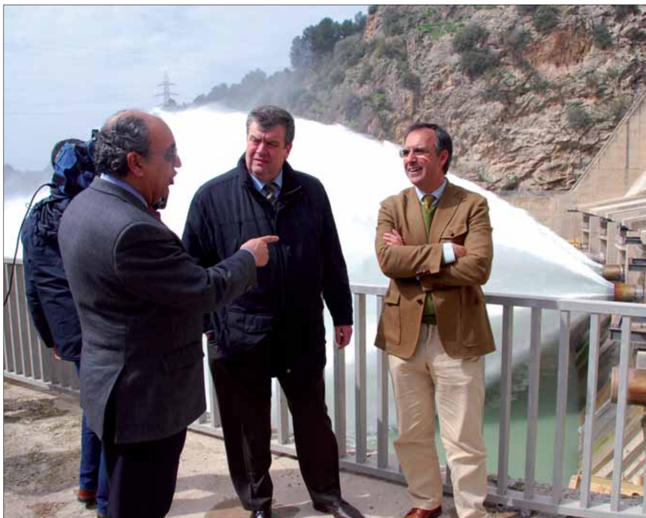
Tras atender a los medios, los responsables públicos visitaron las entrañas de la presa

Por último, mostró su convencimiento de que la cuenca está “suficientemente dimensionada”. Álvarez recordó que una cuenca no se regula pensando en