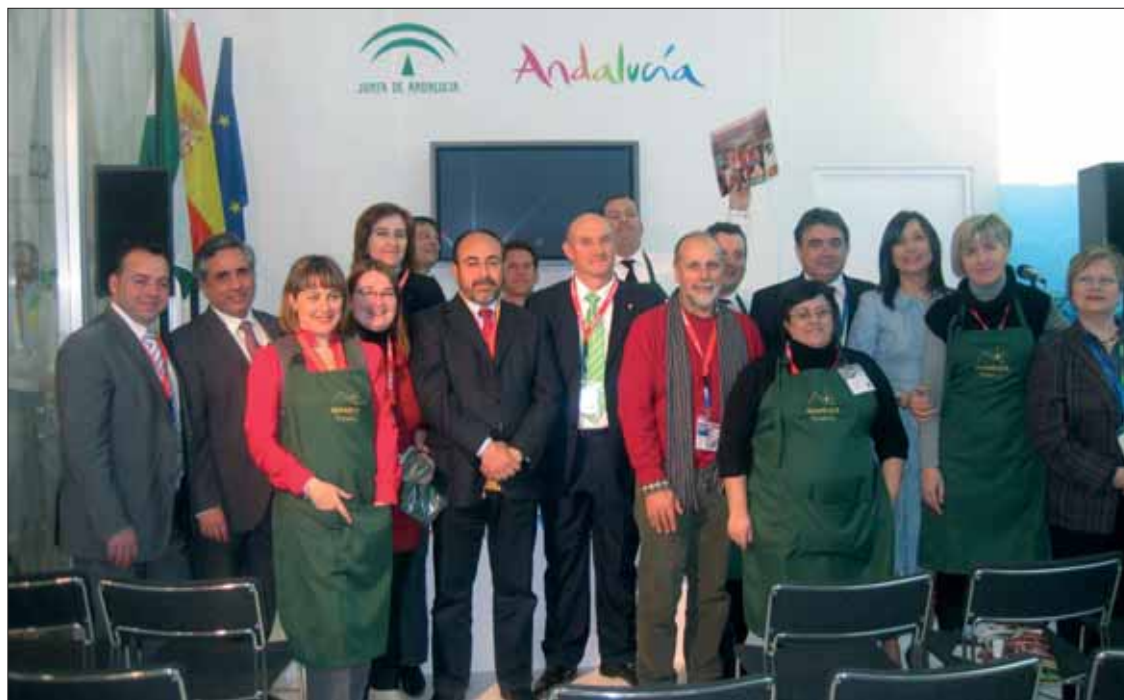
Nuestro pueblo tuvo una amplia presencia en la presentación del stand/EC

Justo por eso, está convencido de que se debe acudir a citas como ésta, para no perder sitio en el sector y buscar nuevos mercados. No hay que olvidar que a Berlín acuden todo tipo de tour operadores y agencias de viajes. De ahí que la cita permita "conectar con un turismo cada día