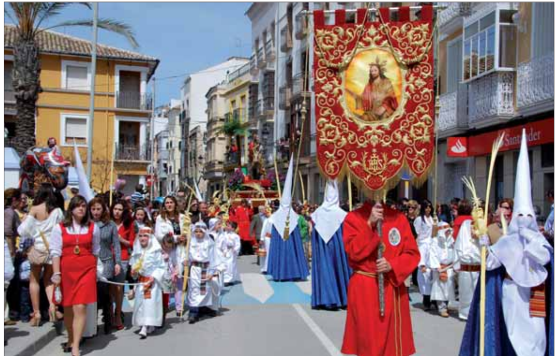
Los trajes de nazarenos de los cofrades y los niños alineados de hebreos han sido la novedad de la Borriquita

El momento más emotivo se vivió de nuevo en el tramo final. En la empinada calle que lleva el nombre de la Virgen de la Sangre, los dos pasos circularon en paralelo, alumbrados únicamente por la luz de las antorchas.