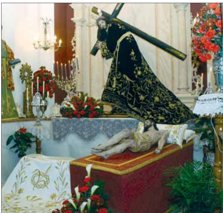
El triduo al Nazareno también ha mostrado la sábana del Cristo yacente