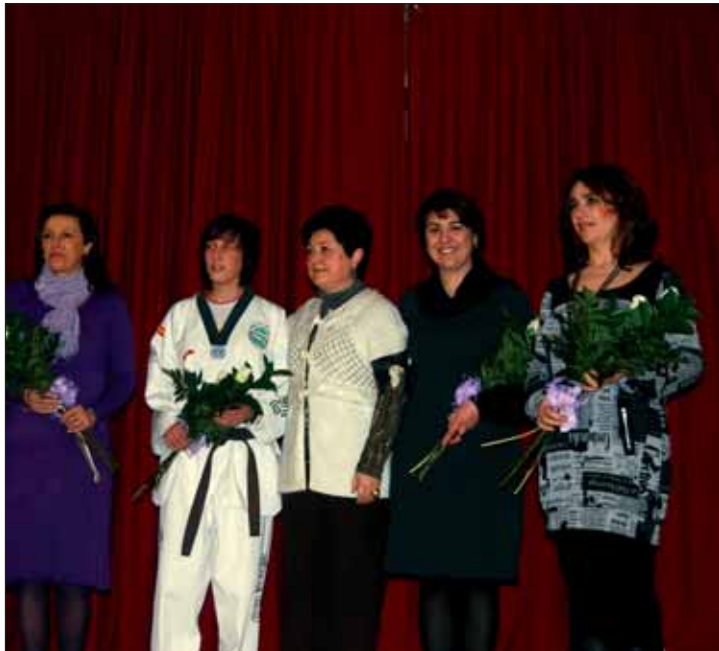
Al final del acto se entregó un ramo a las homenajeadas