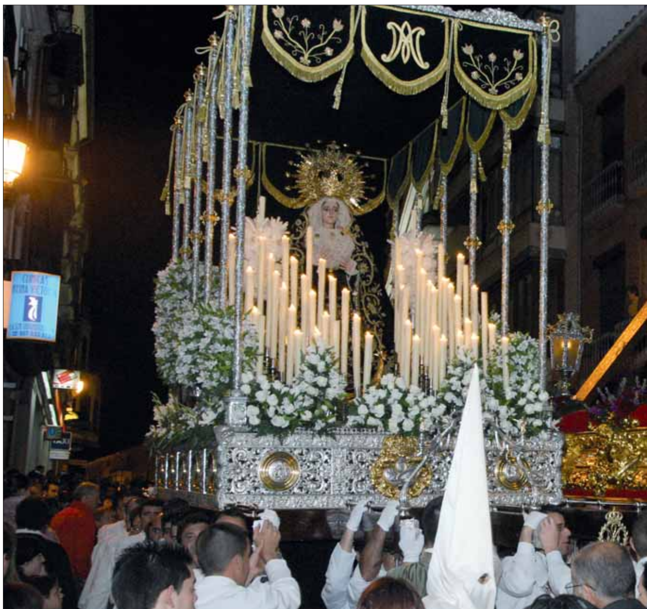
Uno de los momentos más multitudinarios del Miércoles Santo es la bajada en paralelo por la calle Juan Carlos I

Respecto al acompañamiento musical, se repetirá en relación al año pasado con el de la Agrupación Virgen de los Dolores, de la Carlota, y la Banda Municipal de Rute. Con la primera, existe