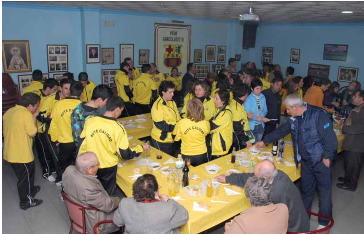
Ante la amenaza de lluvia y dada la cercanía al Polideportivo Municipal, se optó por trasladar a la Peña Barcelonista la paella de fin de fiesta/FP

Se quiere crear un equipo senior, pero la directiva sabe que llevará su tiempo