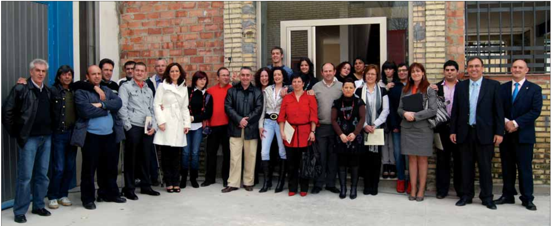
El alcalde y el delegado junto a la directora, monitores y alumnos del taller de empleo/MM

Ha contado con una subvención de la Junta de 496.136 euros y una aportación municipal de 245.000 euros