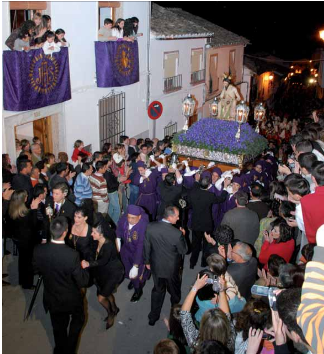
La subida del Abuelito a la carrera por El Cerro requiere un especial cuidado

virgen, a petición de las camareras, lucirá un pecherín de color blanco y una corona distinta.