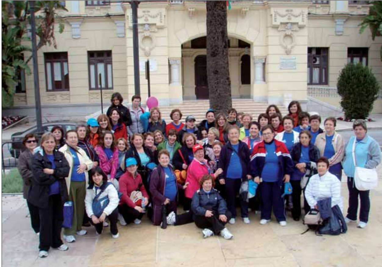
Las mujeres ruteñas han vuelto a dar ejemplo con una presencia nutrida en esta prueba deportiva con matiz solidario

res, quizás el mal tiempo que estamos sufriendo este invierno hizo que la meta tuvieran que ubicarla en otra zona del paseo marítimo, puesto que la playa de La Malagueta, donde se suele situar, no debía estar en buenas condiciones para la instalación