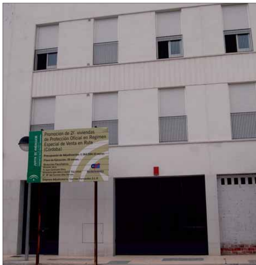
Los pisos que se ofrecen están situados en un bloque del PPR-1/A. López

La tipología de vivienda es de tres dormitorios, con 70 metros cuadrados útiles, garajes vinculados de 23 metros útiles y trasteros vinculados de entre 6,56 y 7,11 metros útiles.