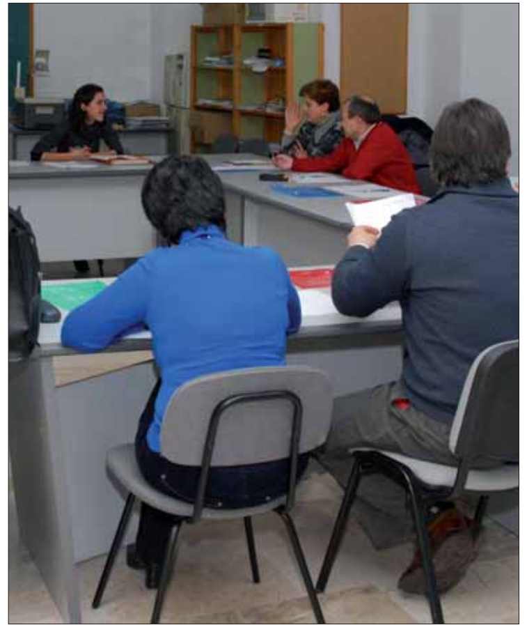
Cerca de veinte personas asistieron al taller de igualdad/FP

lidad de algunas estadísticas que muestran ciertos avances hacia la igualdad de género. En cuanto al manifiesto, Inmaculada Piedra dejó claro que la igualdad "efectiva" no sólo es algo justo "desde la perspectiva de los derechos"; también es "rentable desde el punto de vista democrático, social y econó-