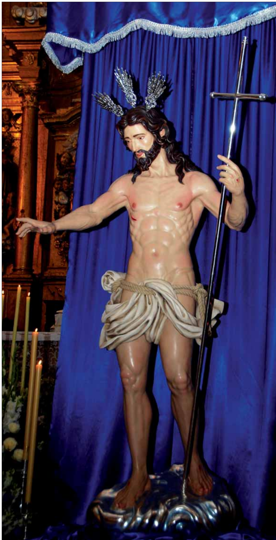
Ya en el día de su presentación pública la imagen de Jesús Resucitado llamó la atención de los asistentes

Según el escultor, el detalle en el que más hincapié le hicieron los miembros fue el de la mirada. Querían una mirada que reflejara "el triunfo de la vida sobre la muerte". Como observó entonces el alcalde Francisco Javier Altamirano, a diferencia de la mayoría de los Resucitados, éste no mira al cielo, "sino abajo, al pueblo".