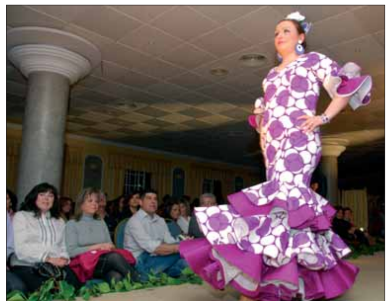
Se exhibieron trajes para la mañana del segundo domingo de mayo

Como curiosidad, entre los invitados, estuvieron Mister Córdoba y Miss Ciudad Real. No lle-