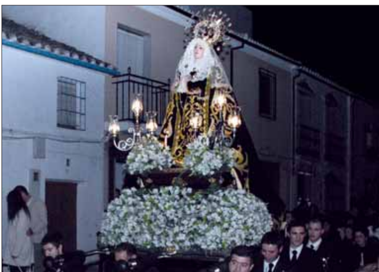
Hasta este año, la Soledad cerraba la Semana Santa ruteña