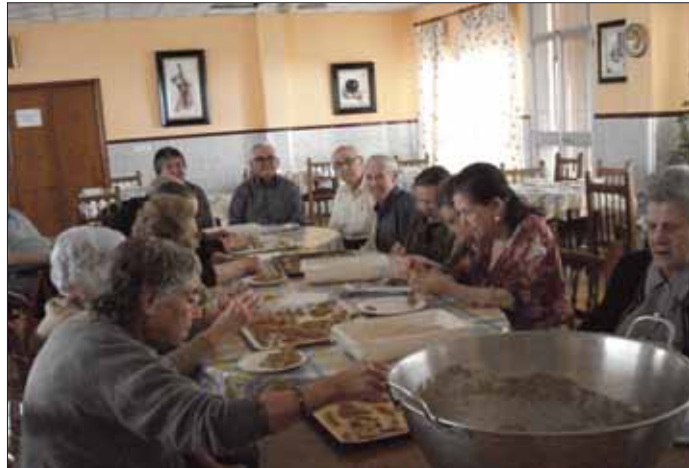
Mayores haciendo pestiños durante el taller de cocina/EC

Los mayores han tenido la oportunidad de contarle a los de menor edad cómo era la educación que ellos recibían