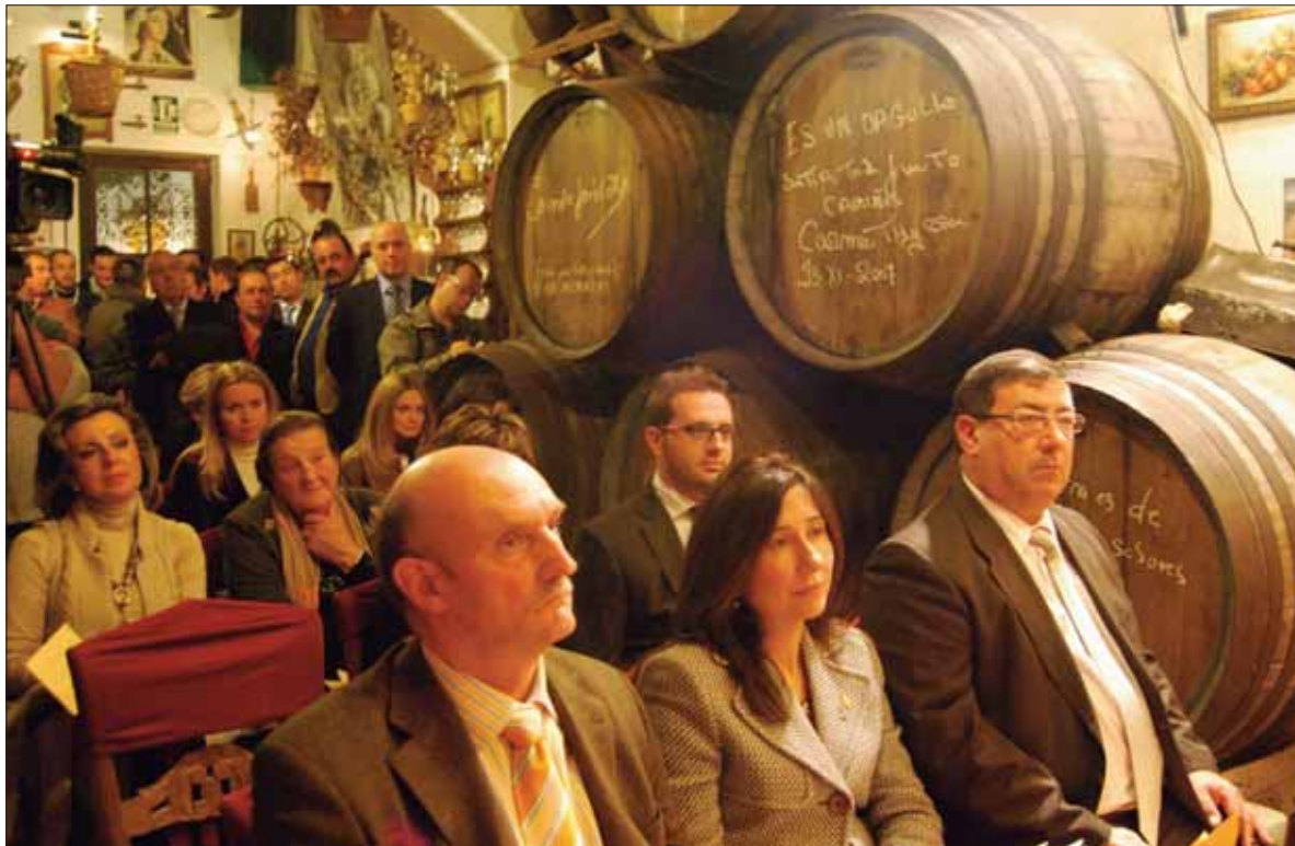
Representantes públicos, empresarios y vecinos de la localidad se sumaron al acto

La clave del éxito ha estado en saber asociar turismo, cultura y gastronomía