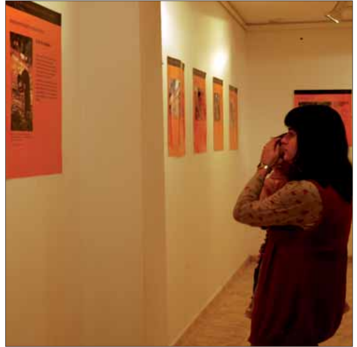
Las fotografías de la muestra estaban ilustradas con mensaje/MM