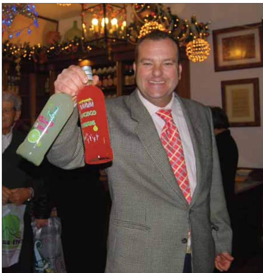
El mojito, de limalimón con hierbabuena, y el San Francisco, una mezcla de naranja, piña y granadina, son las dos nuevas bebidas de esta temporada

Por ejemplo, estuvieron presentes, y él mismo fue el responsable de catering, en un stand de turismo, en una de las ferias más importantes del sector, la celebrada en Berlín en el mes de marzo. Fue entonces cuando Ferrán Adriá se acercó al stand andaluz. El popular cocinero "elogió de forma considerable" los productos representativos de nuestra comarca y "muy especialmente" la trayectoria que ha tenido a lo largo del tiempo el anís de Rute.