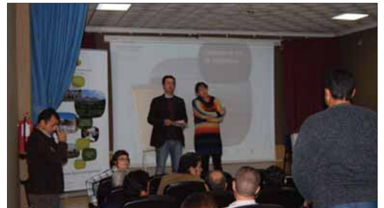
Para Moreno la producción ecológica y extensiva son las claves del futuro/MM