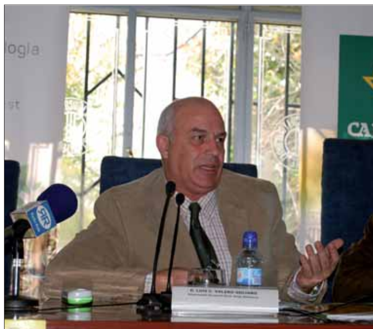
Para Luque el futuro pasa por fusionar unas cooperativas con otras