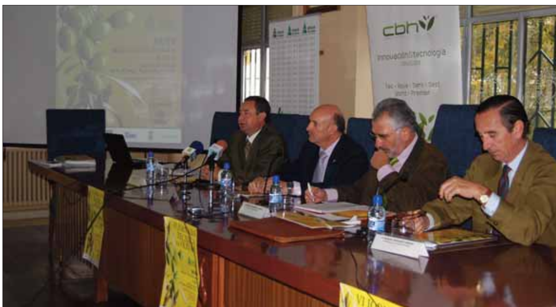
El alcalde estuvo presidiendo el acto inaugural junto a los organizadores

Tras el acto inaugural, se habló sobre las ayudas que va a recibir el olivar después de 2013. La ponencia corrió a cargo de la ingeniera agrónoma Con-