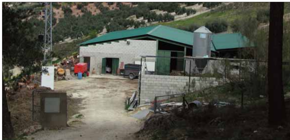
Explotación ganadera donde se produjeron los hechos

Cuando llegaron los servicios sanitarios, nada pudieron hacer por la víctima, mientras la Guardia Civil procedía a detener al ganadero. El detenido pasaba en la mañana del lunes 29 a disposición judicial, acusado de un supuesto delito de homicidio. De momento, y según fuentes oficia-