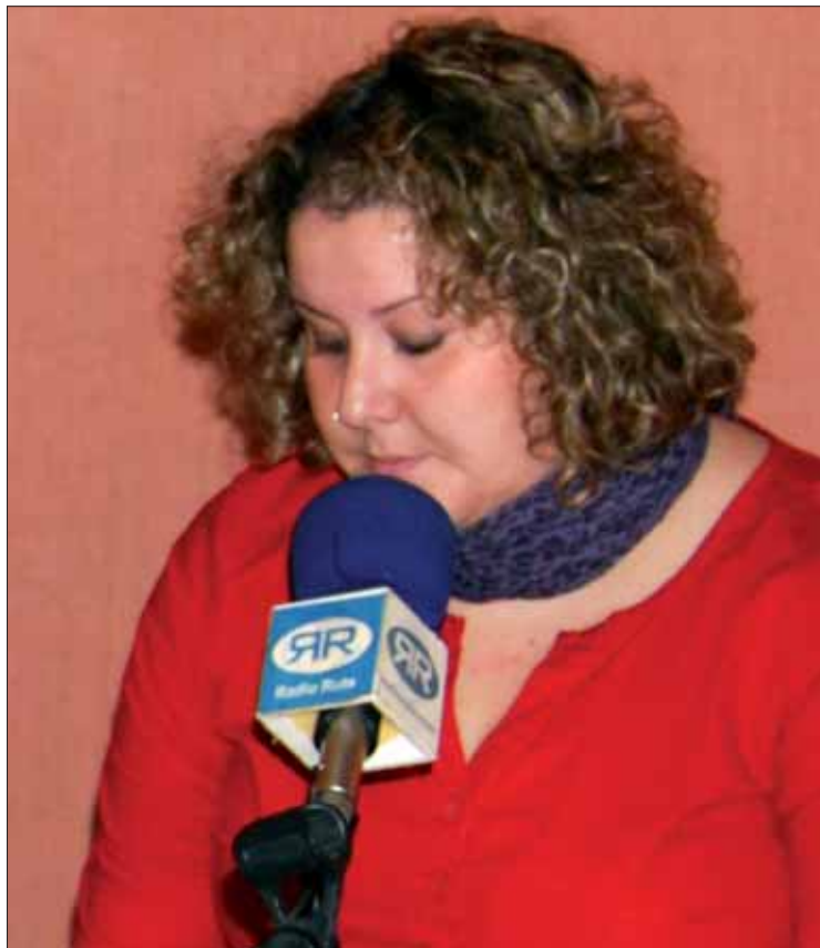
La responsable de Cruz Roja esperan contar con voluntarios a nivel local/MM

cuenta con una oficina de atención integral y un departamento dedicado a socorrer casos de emergencias.