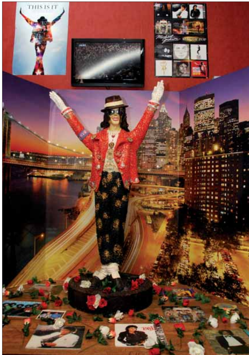
El cantante Michael Jackson, la gran novedad del Museo del Azúcar este año, aparece en un escenario donde se proyectan sus principales vídeos, además de estar rodeado de algunas de sus fotos más recordadas y las ediciones en vinilo de sus discos más célebres

Estos atractivos complementan, en suma, a la referencia, los dulces de navidad de La Flor de Rute. Son los dulces que entroncan con el mimo primigenio por lo bien hecho, que viajan en el tiempo hasta nuestros días, donde a las miles de visitas al museo y los despachos se suma de manera imparable la venta online, reforzada con una nueva web corporativa adaptada a las demandas del cliente moderno.