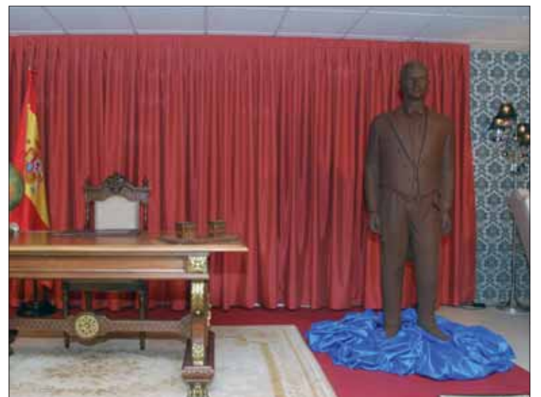
El mediático Juan Y Medio se incorpora a las figuras de chocolate, junto a la novedad del príncipe Don Felipe

que había llegado el momento de ceder el testigo. Por su parte, Galleros precisaba de más suelo industrial. Los lazos familiares (son tío y sobrinos, respectivamente) hicieron el resto. Se adquiría la marca, así como las instalaciones, línea de productos y un número fijo de trabajadores.