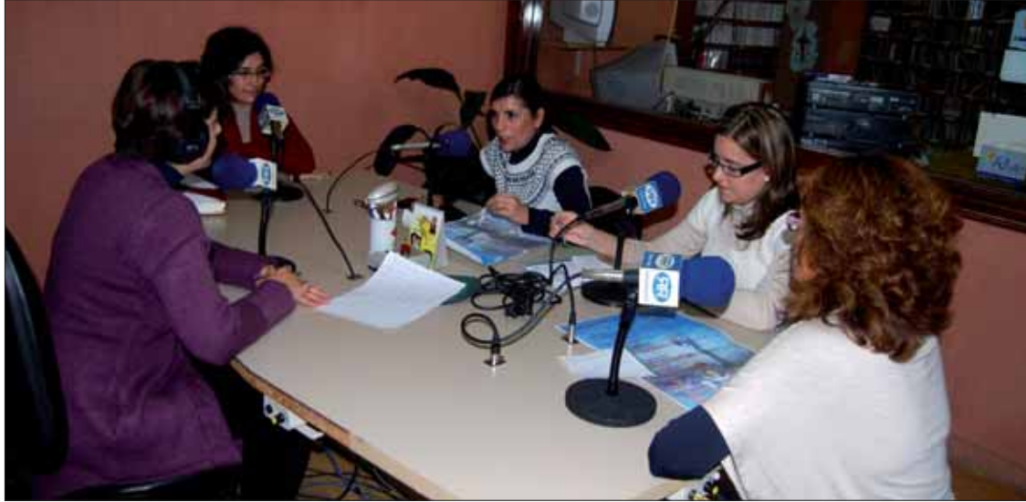
Las integrantes de Cuenta Conmigo insisten en la conveniencia de jornadas como éstas

Varias ponencias y charlas de especialistas en la materia centran la segunda semana de la discapacidad en el municipio