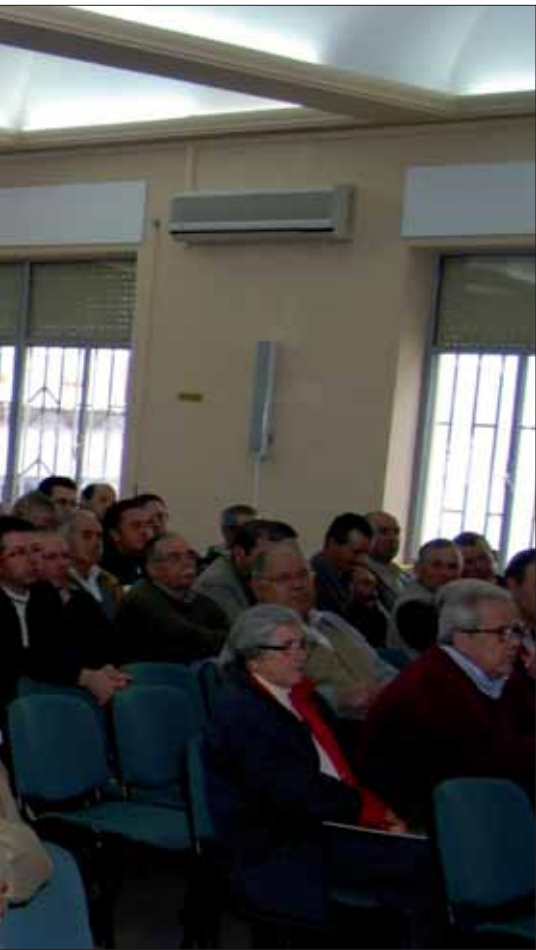
La masiva afluencia de agricultores de toda la provincia puso de manifiesto la preocupación del sector olivarero

suelo Ariza. El escenario que dibujó Ariza no es nada halagüeño para el sector. Se perderán la subvención al olivar tal y como se concibe ahora. Habrá dos tipos de pagos: unos directos y otros que se concederán en función de cuestiones relacionadas con el desarrollo rural, la innovación o la promoción de los productos.