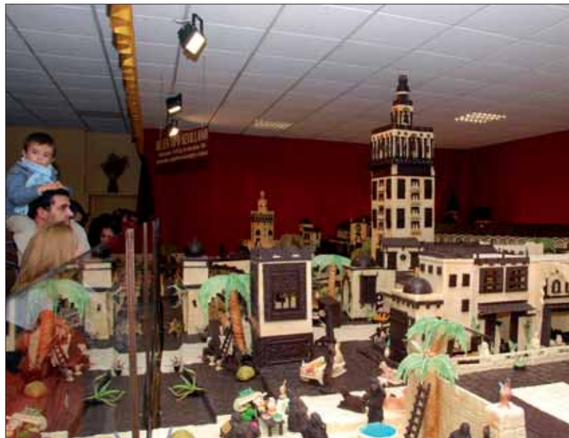
El Belén de Chocolate ha apostado este año por monumentos sevillanos como la Giralda o la Torre del Oro

Esta galería de chocolate no era exclusiva de la Familia Real. También formaba parte de ella la cantante Rocío Jurado. Pero, fruto del ensamblaje con Garrido, la escultura se ha trasladado a las instalaciones recién adquiridas.